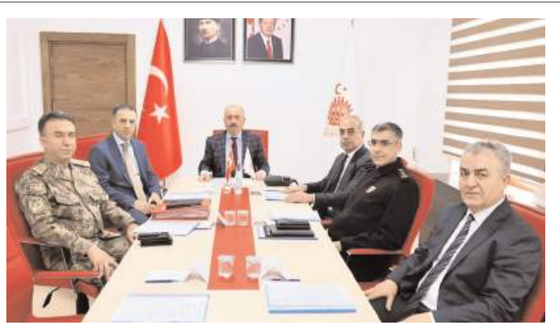
Toplantıda Çorum'un genel asayiş durumu değerlendirildi.

Besi hayvanı ahır kapasitesi 200 baş altında olan yetiştiriciler, işletmenin besi hayvanı ahır kapasitesi 200 başın altında olan gerçek veya tüzel kişilere ait besilik sığır ithalatı başvuruları Türkiye Kırmızı Et Üreticileri Merkez Birliğine yapılacak olup; başvurular Et ve Süt Kurumunca değerlendirilecektir. Başvuru yapmak isteyen Besi ahır kapasitesi 200 baş üzeri kapasiteye sahip işletmelerin dilekçe, Noter onaylı taahhütname ve Kapasite raporu ile birlikte İl/İlçe Tarım ve Orman Müdürlüklerimizde başvuruları önemle duyurulur." denildi