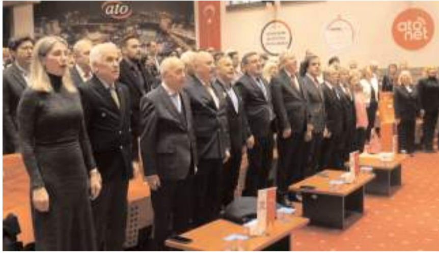
Programı Ankara Sivil Toplum Örgütleri Platformu düzenledi.