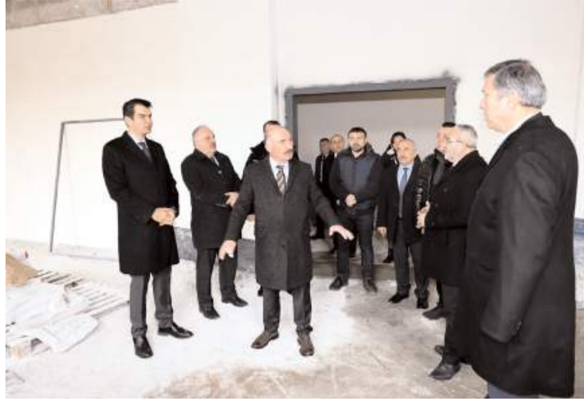
Vali Çalgan, ilçede yürütülen çalışmalar hakkında bilgi aldı.

Vali Çalgan, son olarak Sungurlu OSB'de bulunan kağıt fabrikasını ziyaret etti. Fabrikada incelemelerde bulunan Vali Çalgan, fabrikanın yönetim kurulu başkanı Salih Zeki