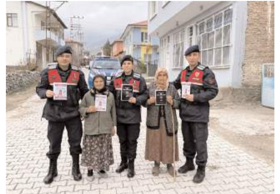
Ekipler, KADES uygulaması hakkında bilgilerin yer aldığı broşürleri vatandaşlara dağıttı.

Etkinlikte, "Kadına el kalkamaz" sloganının sadece bir ifade değil, toplumsal sorumluluk çağrısı olduğu belirtildi. (AA)