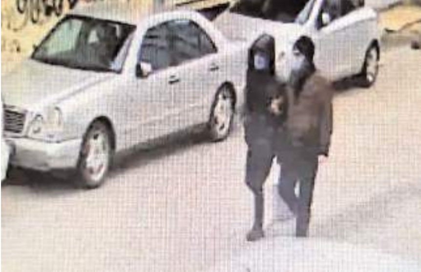
Yaşlı çiftin paralarını aldıkları ve yakalandıkları anlar kameraya yansdı.

Vurgun anı kamerada Gözaltına alınan şüpheliler adliyeye sevk edilirken, yaşlı çiftin paralarını aldıkları ve yakalandıkları anlar kameraya yansdı. Olay günü güvenlik kamerasına yansıyan görüntülerde, dolandırıcıların takip ettikleri çifti, parayı yol kenarına bıraktıkları ve oradan aldıkları görülüyor. Şahısların daha sonra araçla İstanbul'a kaçtıkları kameraya yansıyor. Operasyon anında ise şahıslardan birisi rezidanstaki balkonları kullanarak kaçmaya çalışıyor. Şahıs daha sonra polis ekipleri tarafından saklandığı dairede yakalanıyor. (İHA)