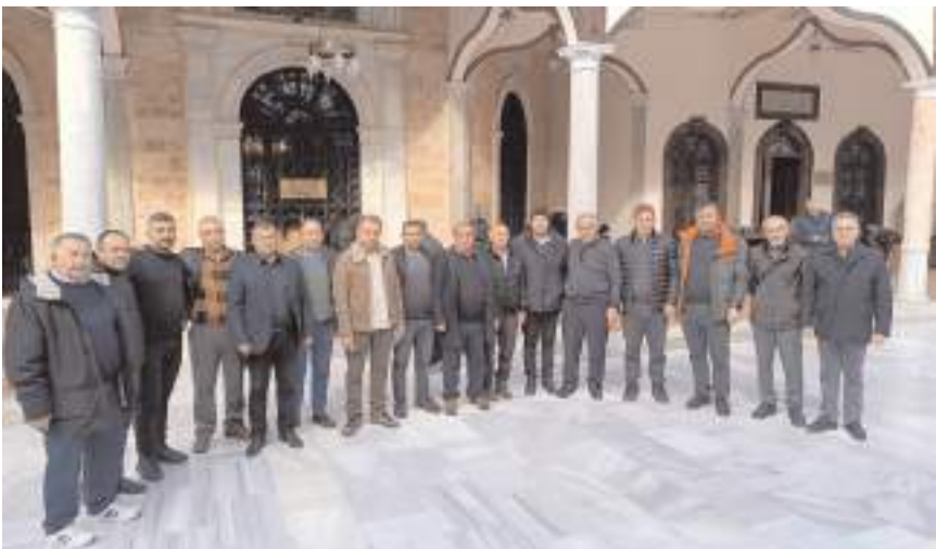
Esnaflar Bursa'nın tarihi ve turistik yerlerini gezdiler.