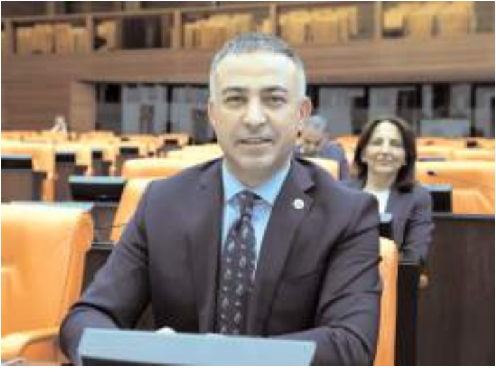
CHP Çorum Milletvekili Mehmet Tahtasız

■ CHP Çorum Milletvekili Mehmet Tahtasız, TBMM'de yaptığı konuşmada araç muayene ücretlerini eleştirerek, "Yağ değişimi yok, araç bakımı yok, yalnızca özel bir şirketin kasasına akan milyarlar var. Bakım ve onarım olmadan yalnızca arıza tespitinden bu kadar ücret almak adil değil. 2025 yılı araç muayene ücretlerine zam yapılmasın" dedi.