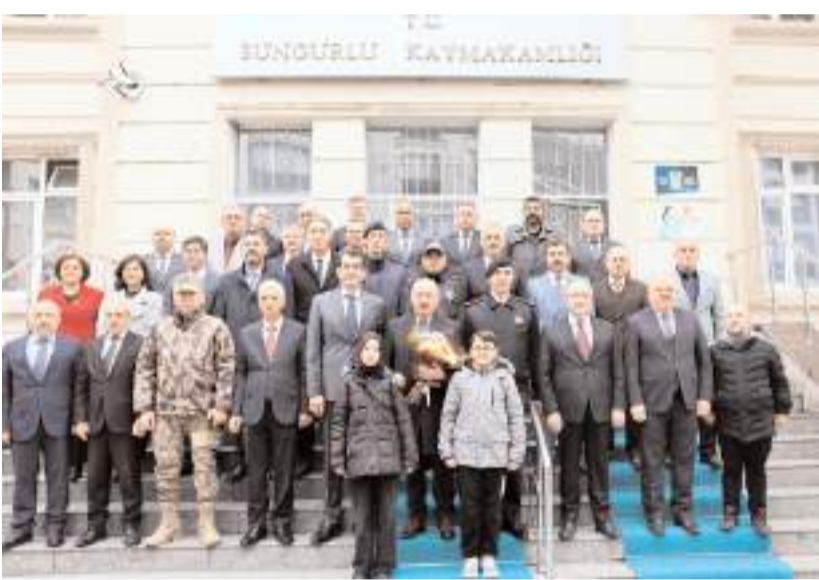
Kaymakamlık ziyaretinin anısına hatıra fotoğrafı çekildi.