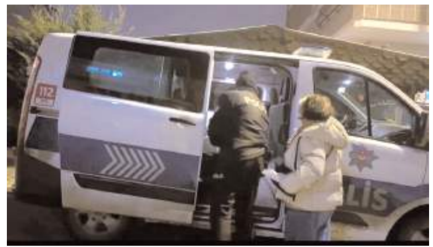
Bahçede yapılan çalışmada polis ekiplerince bulunan cenin, otopsi yapılmak üzere hastane morguna kaldırıldı.