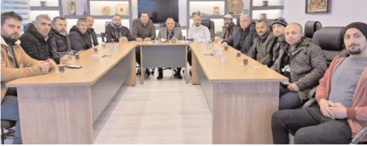
Bina temizlik hizmeti sunan firmalar ÇESOB'ta toplantı yaptı.