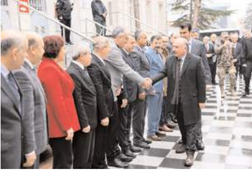
Vali Ali Çalgan'ı ilçe protokolü karşıladı.