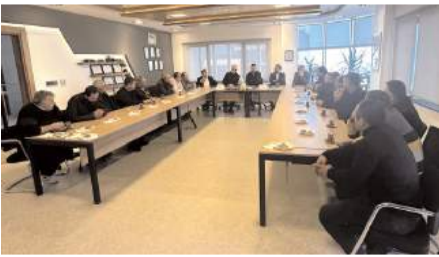
Esnaflar firmanın ürünleri hakkında bilgi aldılar.