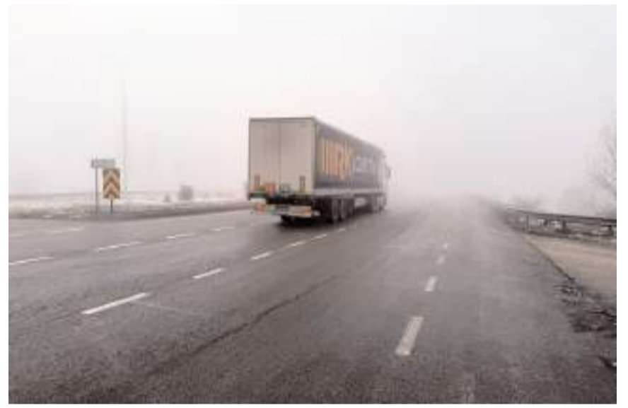
Bölgede gece başlayan sis, sabah saatlerinde etkisini artırdı.

Ekipler, kazaların yaşanmaması için sürat yavaşlatılmasını ve takip mesafesinin korunması konusunda tır ve servis sürücülerine uyarılarda bulundu.(AA)