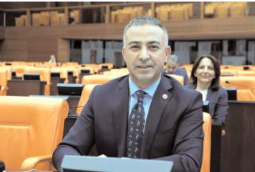
CHP Çorum Milletvekili Mehmet Tahtasız

araç muayene ücretleri de aynı oranda artırılabilecek. Traktör, motosiklet ve motorlu bisiklet muayene ücretleri 920 TL'den 1.335 TL'ye yükselecek. Otomobil, minibüs, kamyonet, arazi taşıtı, özel amaçlı taşıt ve römorklar için ücret 1.821 TL'den 2.621 TL'ye çıkacak. Otobüs, kamyon ve çekicilerin muayene ücreti ise 2.462,40 TL'den 3.544 TL'ye yükselmiş olacak. Yağ değişimi yok, araç bakımı yok, yalnızca özel bir şirketin kasasına akan milyarlar var. Bakım ve onarım olmadan yalnızca arıza tespitinden bu kadar ücret almak adil değil. 2025 yılı araç muayene ücretlerine zam yapılmasın, ticari araçlar için muayene süresi iki yıla çıkarılsın. Vatandaşın cebinden elinizi çekin." (Haber Merkezi)