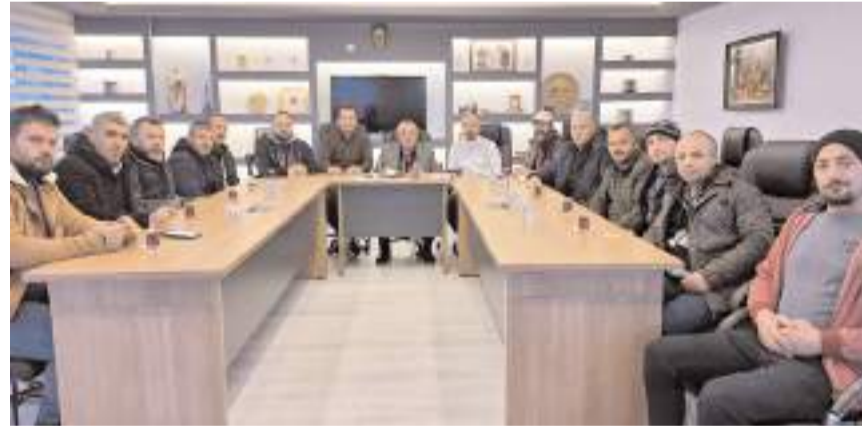
Bina temizlik hizmeti sunan firmalar ÇESOB'ta toplantı yaptı.