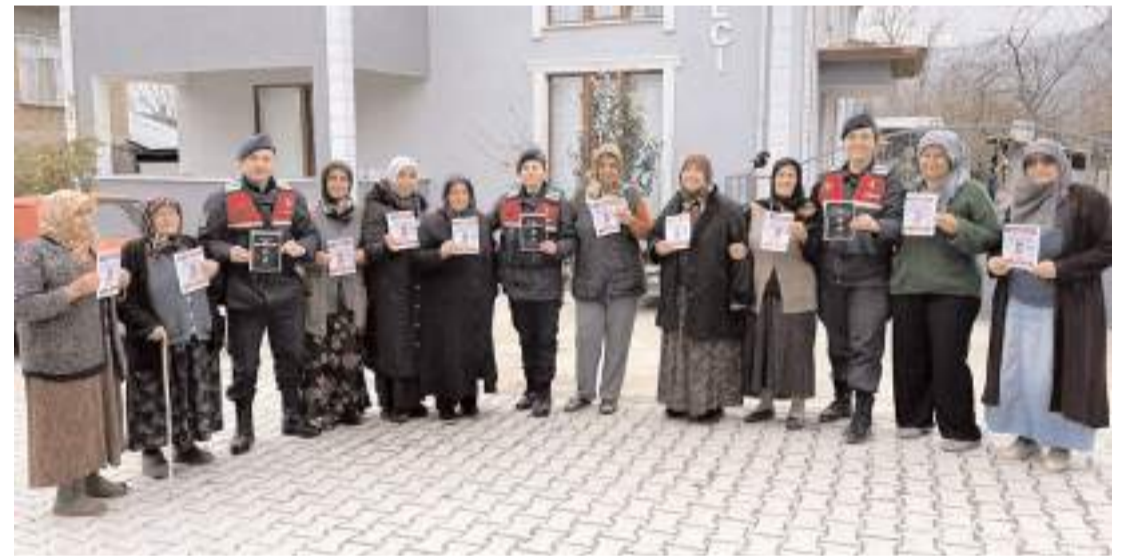
Kargı İlçe Jandarma Komutanlığı ve İlçe Emniyet Amirliği ekipleri kadınlara KADES hakkında bilgiler verdi.