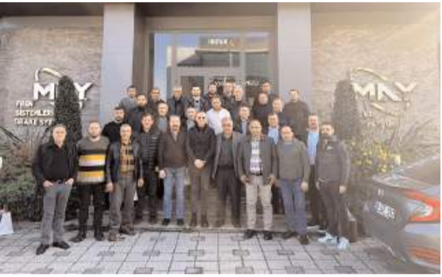
Esnaflar May Fren Sistemleri firmasının konduğu oldu.