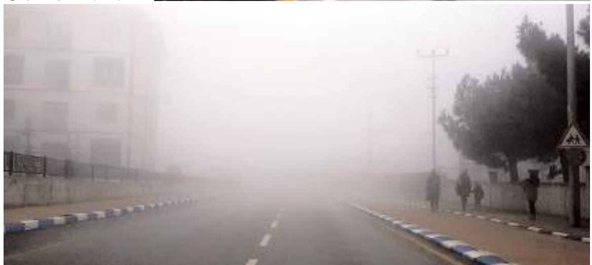
İlçede sis nedeniyle görüş mesafesi 50 metreye kadar düştü.