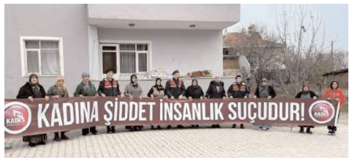
İlçede "Kadına şiddet insanlık suçudur" yazılı pankart açıldı.