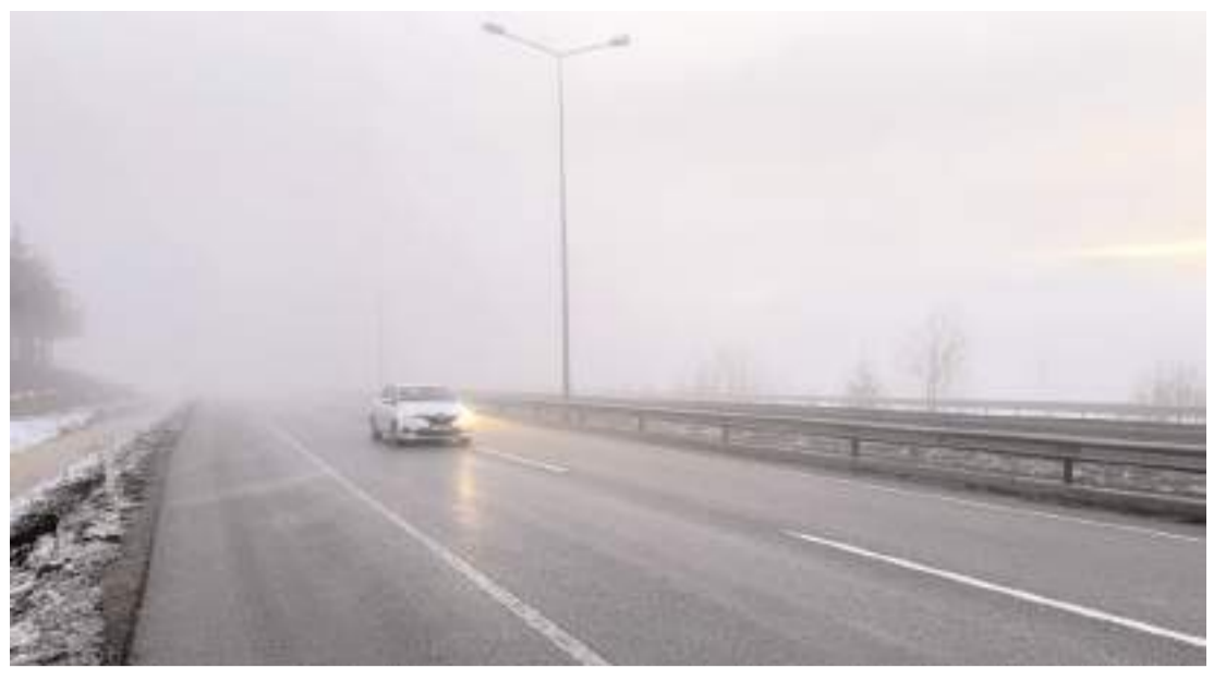
Sis nedeniyle araçlar trafikte yavaş ilerledi.