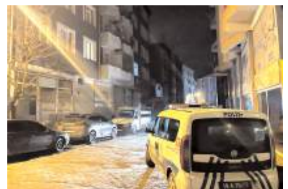
Olay Şekerpınar Mahallesi'nde meydana geldi.