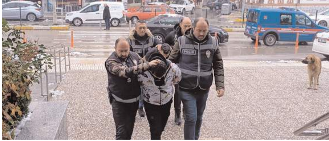
Emniyetteki işlemleri tamamlanan E.K. ve Ö.Ü., Çorum Adliyesi'ne sevk edildi.