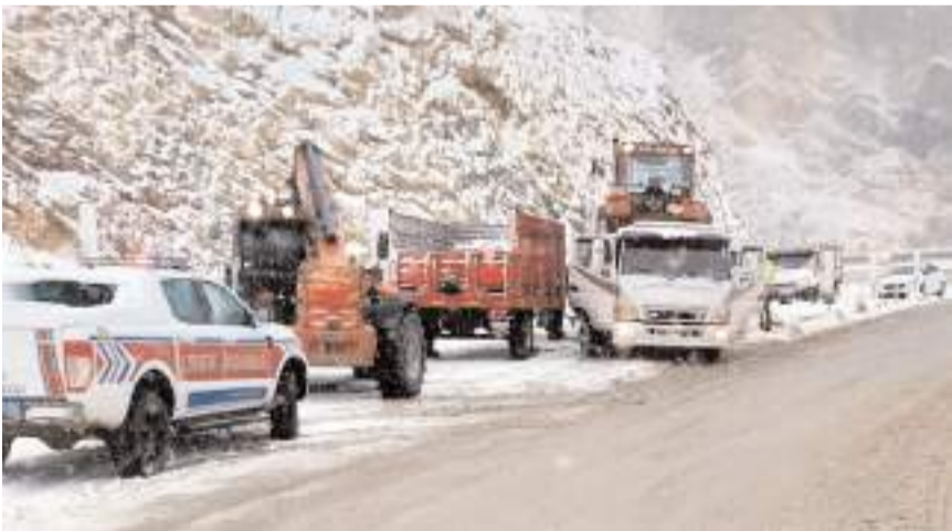
Kaza nedeniyle trafikte aksama meydana geldi.

gereği duyulmuştur. İskilip Açık Ceza İnfaz Kurumunda, 'kullanmak için uyuturucu veya uyarıcı madde satın almak, kabul etmek veya bulundurmak ya da uyuturucu veya uyarıcı madde kullanmak' suçundan hükümlü olarak bulunan M.B.'nin rahatsızlığı üzerine 12 Kasım 2024 tarihinde Hitit Üniversitesi Çorum Erol Olçok Eğitim ve Araştırma Hastanesine sevk edildiği, burada tedavisi devam ederken 4 Aralık 2024 tarihinde hayatını kaybettiği, Cumhuriyet Başsavcılığımızca olayla ilgili olarak hazırlık soruşturması başlatıldığı, M.B.'nin ölüm nedeninin tüm yönleriyle araştırıldığı, herhangi bir kasıt ve ihmalin tespit edilmesi halinde ilgililer hakkında gereğinin en kısa süre içerisinde tevessül ettirileceği, birtakım basın kuruluşlarında M.B.'nin ceza infaz kurumunda enfeksiyona maruz kaldığı iddiasının doğru olmadığı, Cumhuriyet Başsavcılığımıza bağlı ceza infaz kurumlarında gerekli bakım ve denetimlerin en üst seviyede yapıldığı, bugüne kadar herhangi bir olumsuzluğun tespit edilemediği hususu kamuoyunun bilgisine saygıyla duyurulur." (İHA)