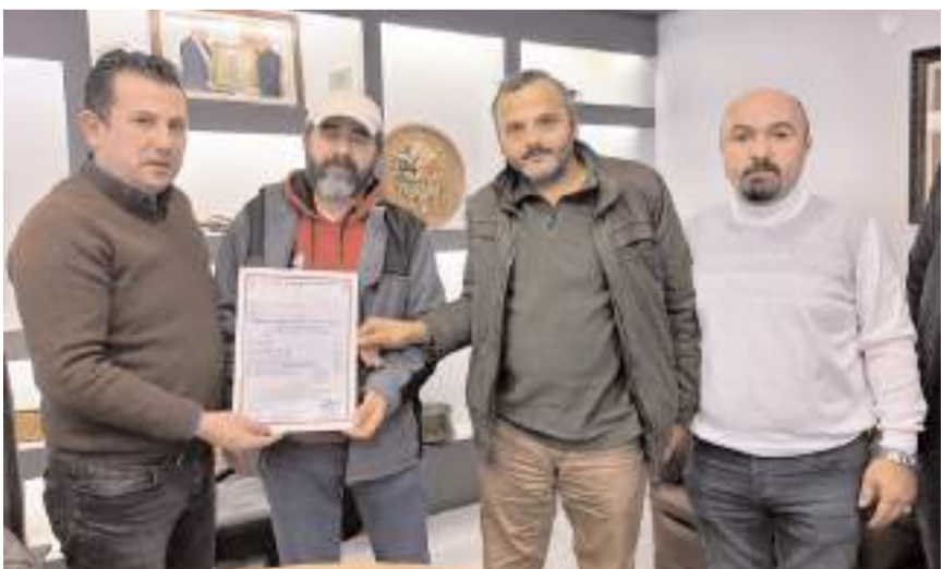
Fiyat tarifesi firmalara teslim edildi.

ne de seslenen Gür, apartman temizlik işlerini işin ehline vermelerini, vergi ve oda kaydı bulunan firmaları tercih etmelerini isteyerek, kayıtlı esnafın binalara giriş ve çıkışlarının daha güvenli olacağını sözlerine ekledi.