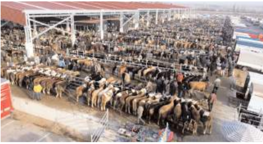
2025 yılında 520 bin baş besilik erkek sığırın ithal edilmesi planlanıyor.

İşletmenin besi hayvanı ahır kapasitesi 200 baş ve üzerinde olan işletmelere kota dağıtımı, işletmelerin besi hayvanı ahır kapasite miktarlarına göre Bakanlıkça belirlenecektir. Hayvancılık Genel Müdürlüğü tarafından yapılan değerlendirme sonucunda besilik sığır ithalatı başvurusu uygun bulunan başvuru sahiplerinin bilgileri, it-