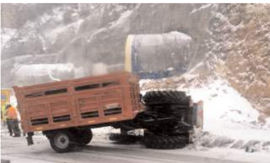
Kaza Kırkdilim'de meydana geldi.