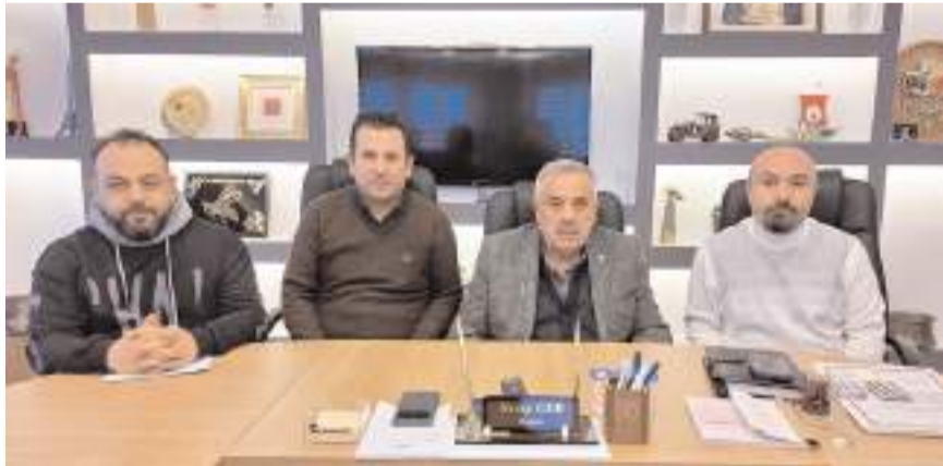
Toplantıda fiyat tarifesi belirlendi.

Firmalardan fiyatta değil de kalitede ve daha güzel hizmette birbirleriyle yarışmalarını isteyeceklerini belirten Gür, merdiven üstü çalışanlarla da hep birlikte mücadele etme tavsiyesinde bulundu. Bina yöneticileri-