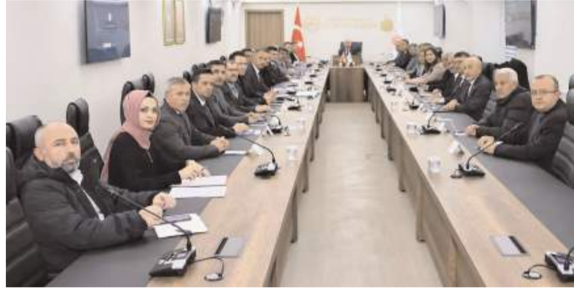
Toplantıda muhtarlar mahalleleri ile ilgili istek, talep, görüş ve önerilerini dile getirdiler.