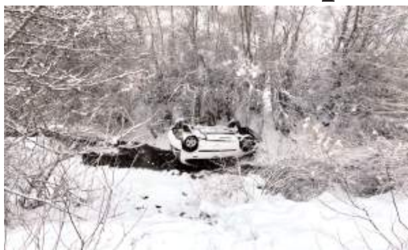
Kaza, Çorum-Alaca karayolu Küre köyü mevkiinde meydana geldi.

Çorum'un Alaca ilçesinde kar sebebiyle kayarak dereye yuvarlanan otomobilin sürücüsü yara almadan kurtuldu.