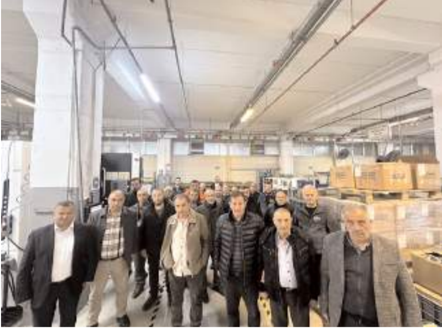
Esnaflar Bursa May Fren Sistemleri firmasını gezdi.