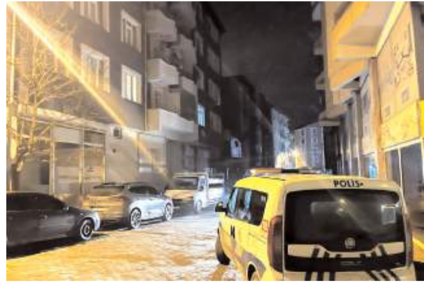
Olay Şekerpınar Mahallesi'nde meydana geldi.

İlk belirlemelere göre vücudunda kesici alet ya da darp izi bulunma-