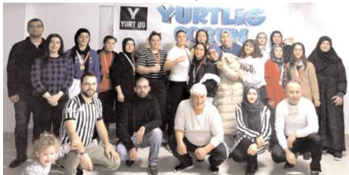
Yurtlig Bilek Güreşi kadınlarda dereceye giren sporcular ve hakemler ödül töreni sonrasında toplu halde