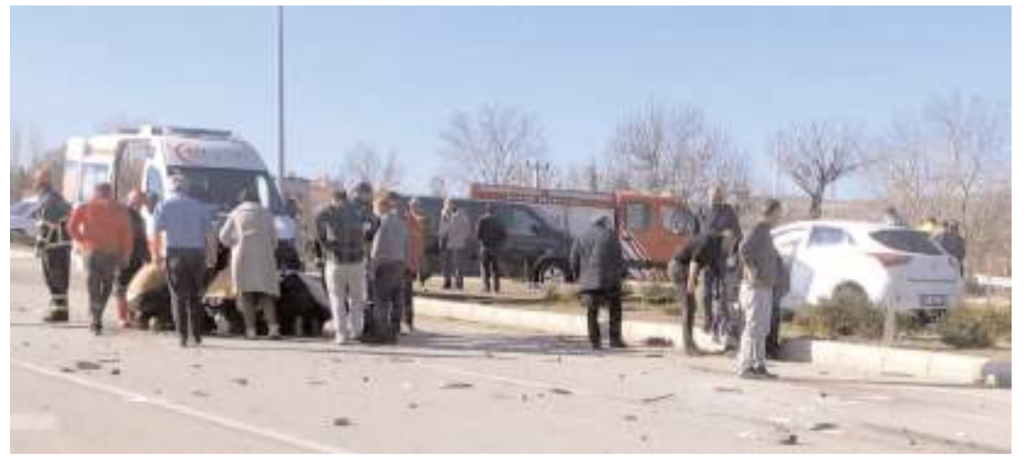
Yaralılara ilk müdahale 112 acil sağlık ekipleri tarafından yapıldı.