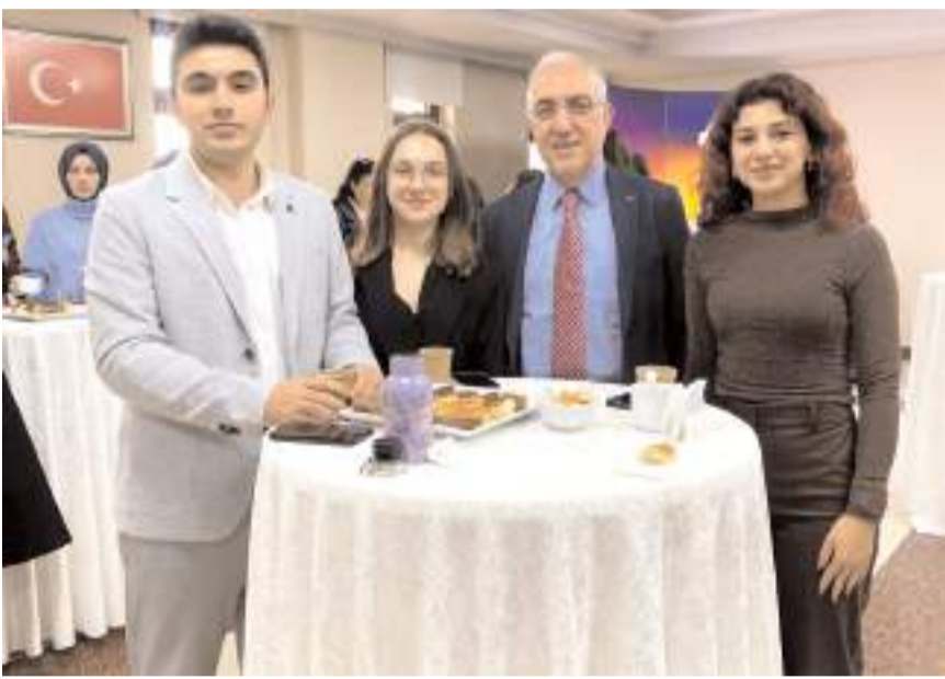
Pediatrist Diyetisyen Buluşmasına Hitit Üniversitesi Beslenme ve Diyetetik Kulübü de katıldı.