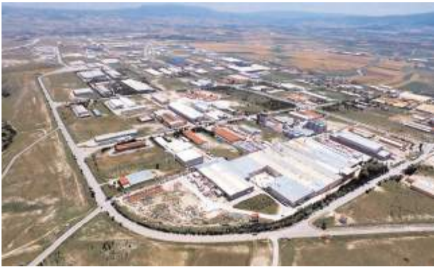
Çorum, 138 milyon dolarlık artışla ilk sırada yer aldı.