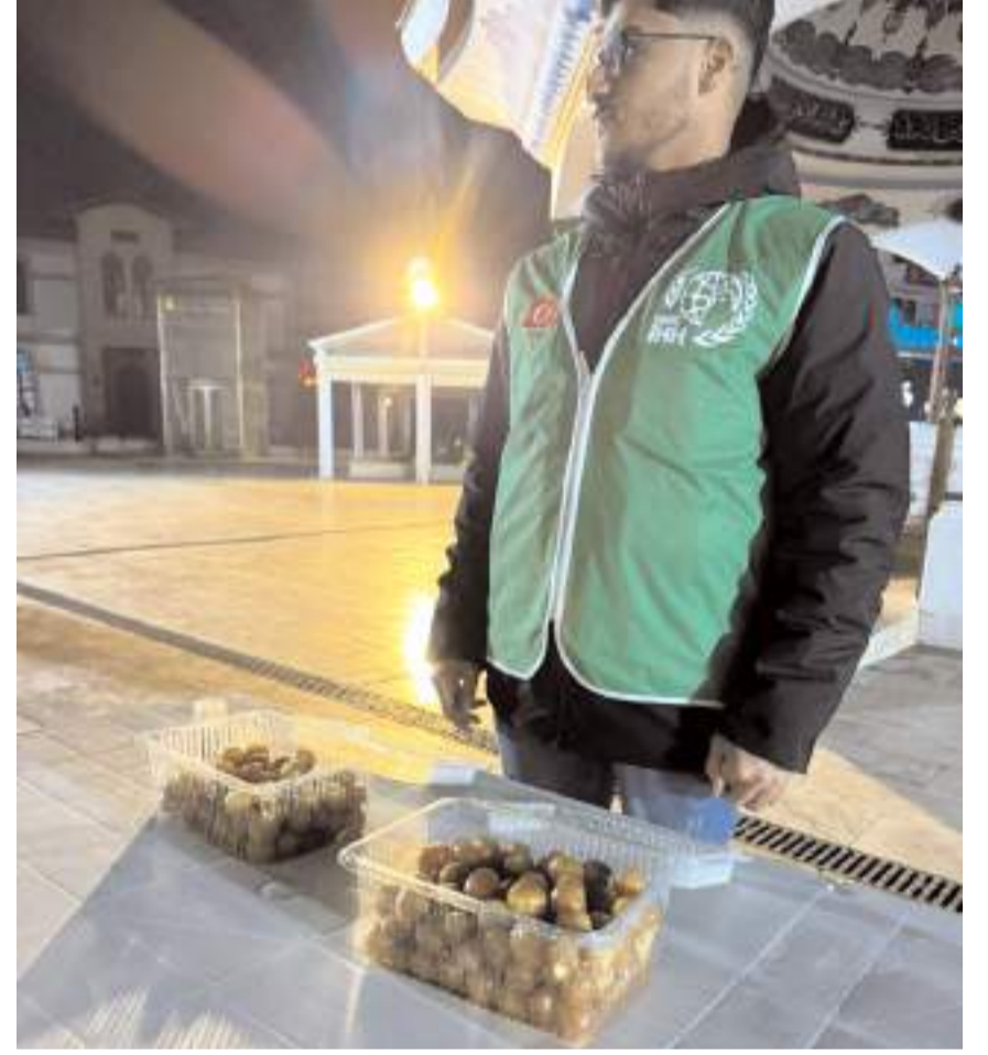
Programda Suriye'nin özgürleştirilmesi nedeniyle lokma dağıtıldı.

Kutlamalar gecenin geç saatlerine kadar sürdü. (Haber Merkezi)