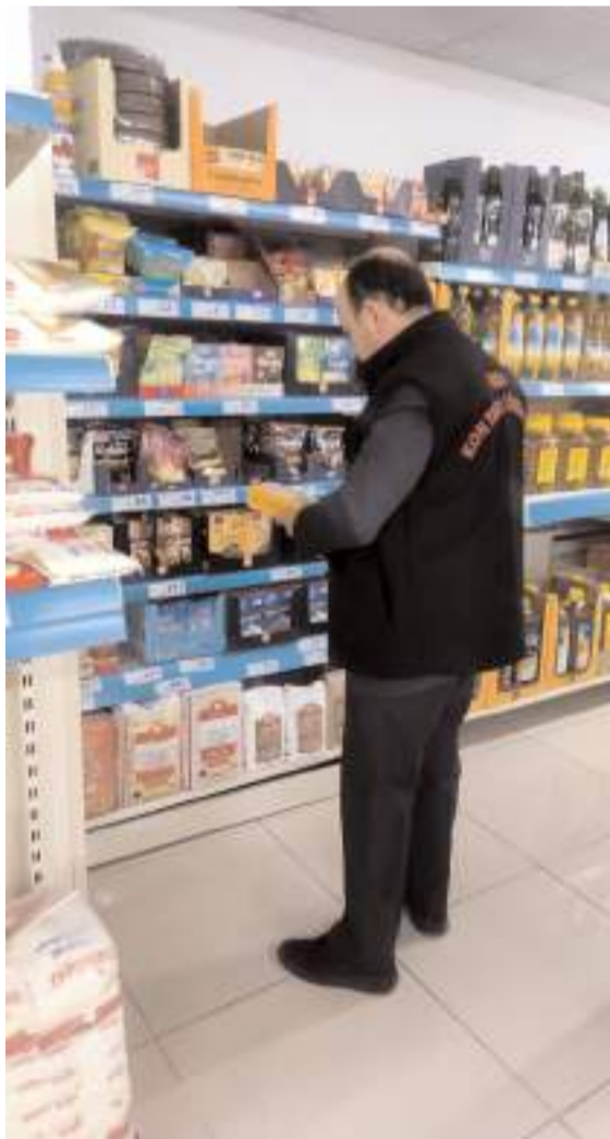
Denetimlerde ürünlerin son kullanma tarihleri ile fiyat etiketleri kontrol edildi.