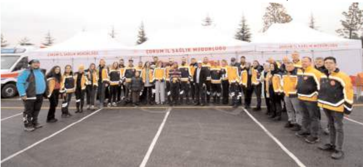
"Acil Sağlık Hizmetleri Haftası" nedeniyle etkinlik düzenlendi.