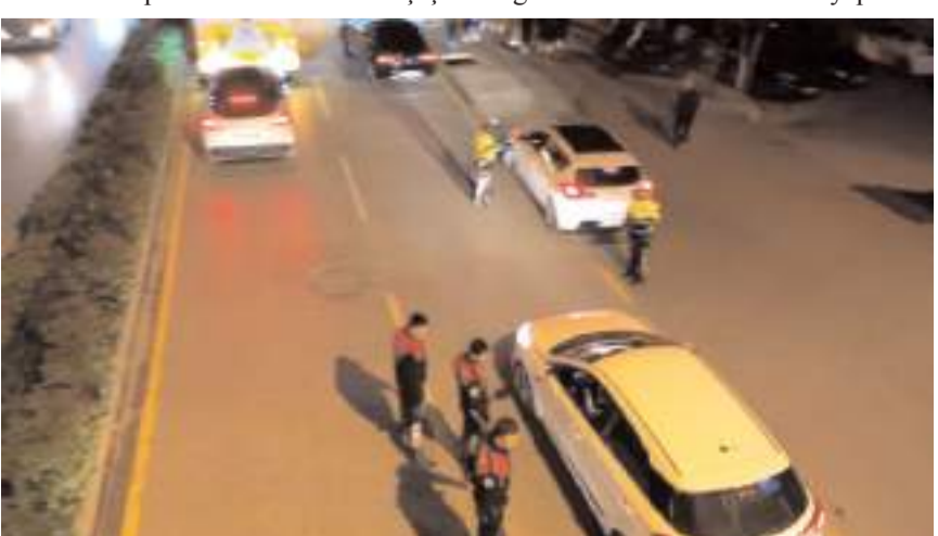
Denetimlerinde, 8 tüfek, 4 tabanca, 6 bıçak, 142 fişek ile 15 sentetik ecza maddesi ele geçirildi.