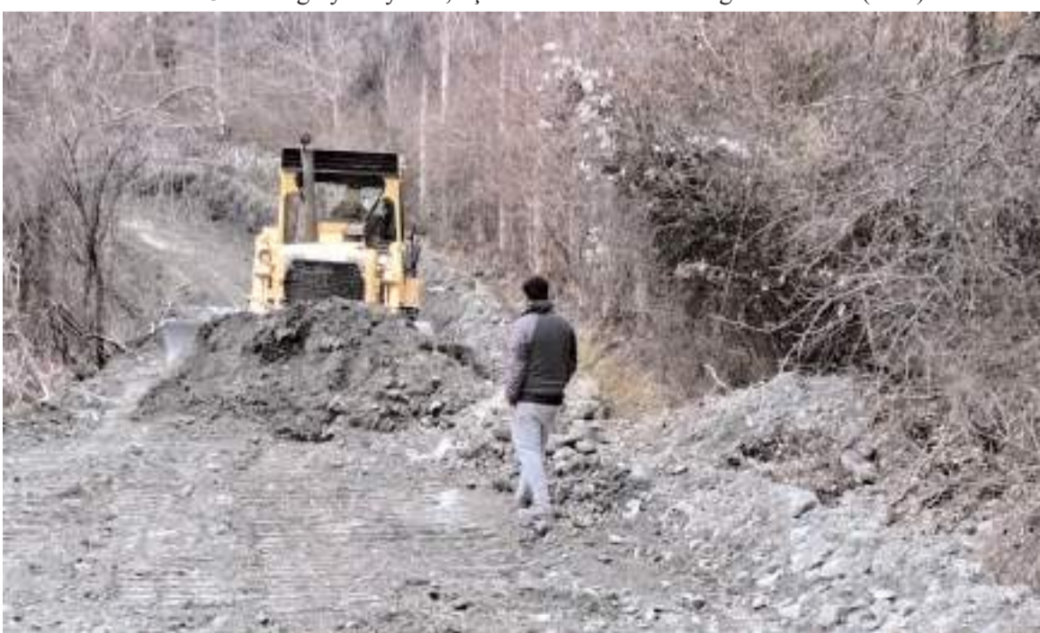
Yol Karalargüney ile Konaca Köyleri arasında bağlantıyı sağlıyor.