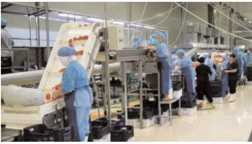
Ocak-Kasım dönemine ait illere göre ihracat istatistikleri açıklandı.

Bakanlık, ihracatın artırılmasına yönelik çalışmalarını sürdürdüğünü belirterek, "Yüksek katma değerli ve rekabetçi ihracat perspektifinde pazar ve ürün çeşitlendirmesi stratejilerimiz ile ihracatımızı artırmayı hedefliyoruz. Ayrıca ihracatın ülke geneline güçlü bir şekilde yayılmasını amaçlıyoruz. Yerel üretim ve istihdam artışı sayesinde daha müreffeh bir Türkiye yaratmayı hedefliyoruz" dedi.