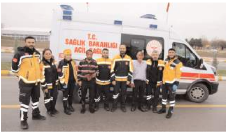
Trafikte ambulansın geçiş önceliğine özen gösterilmesi", "ambulans feruar sistemi" ve "trafik kazası" simülasyonu gerçekleştirildi.