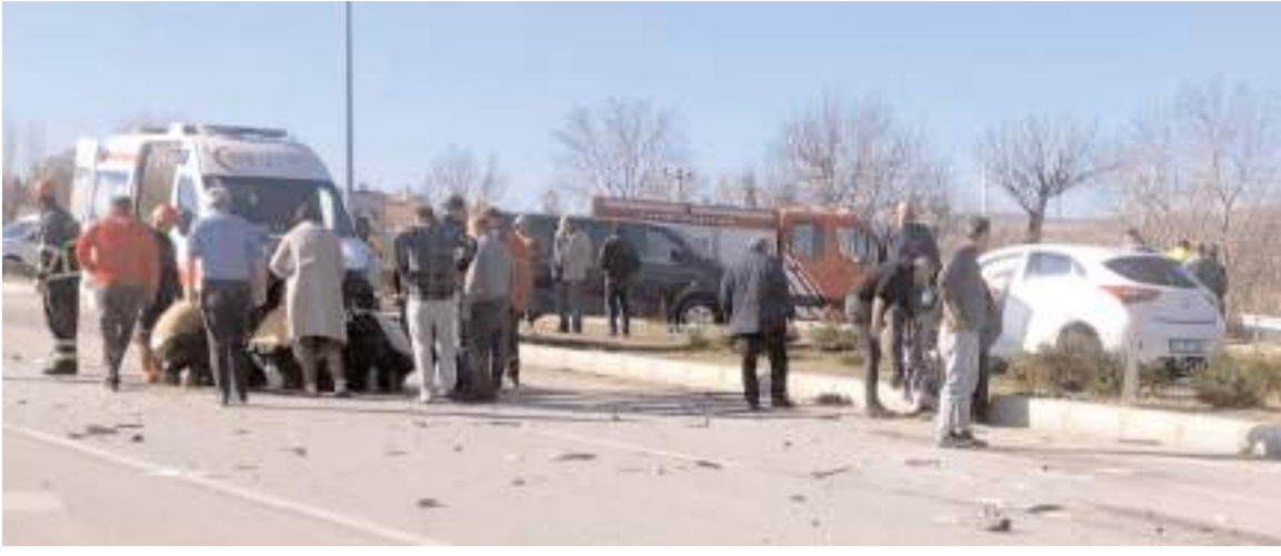
Yaralıları ilk müdahale 112 acil sağlık ekipleri tarafından yapıldı.

Çorum'da otomobil ile hafif ticari araç çarpıştı, 1 kişi öldü, 3 kişi yaralandı. * HABERİ6'DA