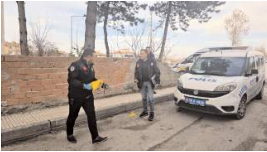
Olay Gülabibey Mahallesi Cumhuriyet 1. Sokak'ta meydana geldi.