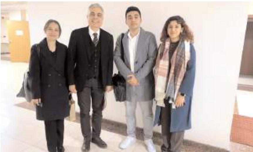
Program KEPAN Derneği tarafından düzenlendi.