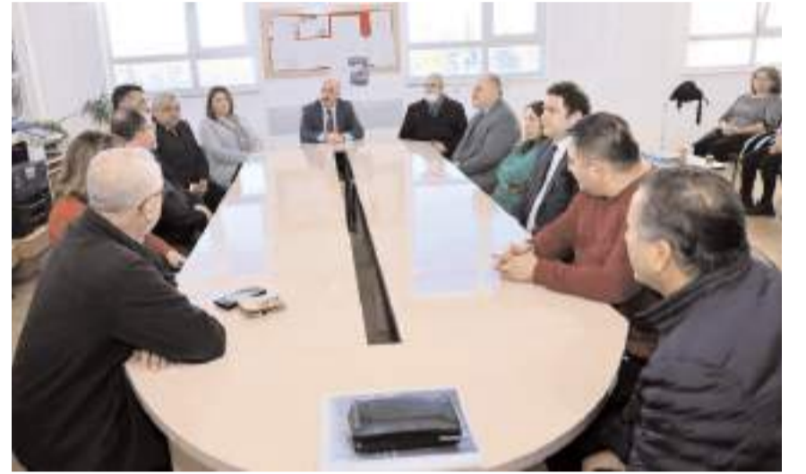
Vali Çalgan, öğretmenlerin okulları ile ilgili istek ve taleplerini dinledi.

Öğretmenler odasıyla öğretmenlerle bir araya gelen Vali Çalgan, öğretmenlerin okulları ile ilgili istek ve taleplerini dinledi.