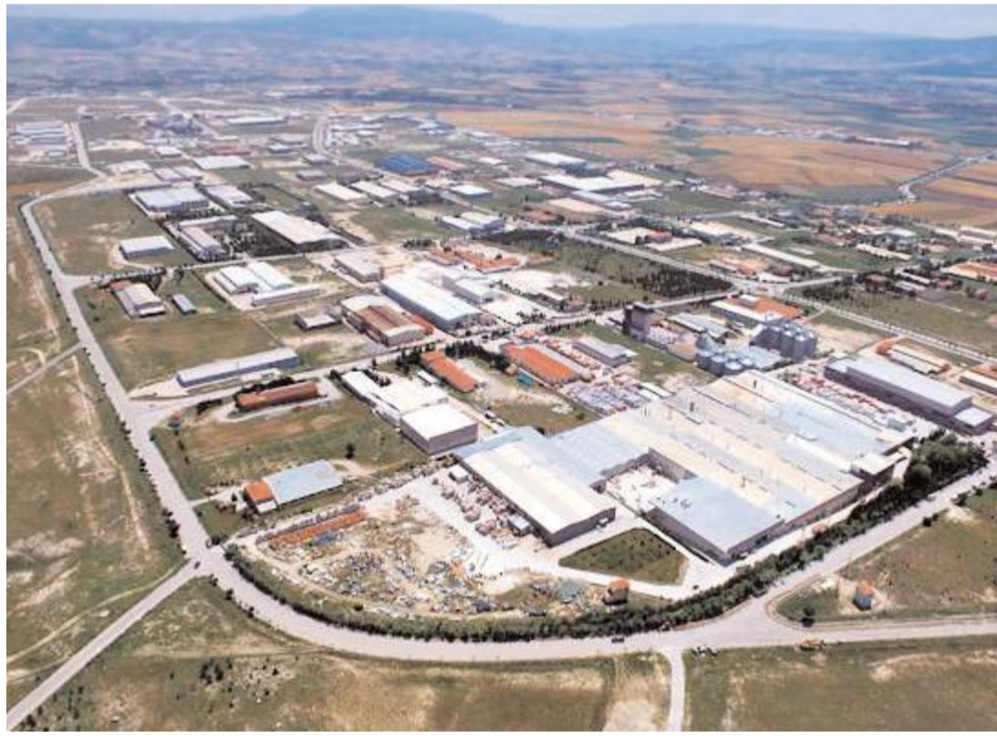
Çorum, 138 milyon dolarlık artışla ilk sırada yer aldı.