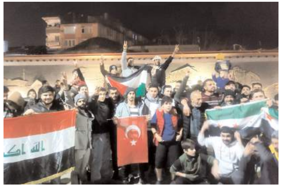
Tarihi Kent Meydanında yapılan programa Çorum halkı ve Suriye vatandaşları yoğun katılım gösterdi.

lüklerinden mahrum bırakıldı. Zalimler yer değişse de kötülükleri değişmiyor. Siyonist İsrail, Filistin halkını katliamlarla, Mescid-i Aksa'yı baskınlarla kuşatmaya çalışıyor. Ancak biz inanıyoruz ki Rabbim, bir gün tıpkı Suriye gibi Filistin halkını da özgürlüğüne kavuşturacak. O gün geldiğinde, tıpkı Halep sokakları gibi Gazze'nin sokaklarında da çocuklar yeniden gültümseyecek, Kudüs'te zafer tekbirleri yükselecek. Mescid-i Aksa, ümmetin secdesiyle şereflenecek. Türkiye, nasıl Suriye halkının mazlumların her zaman yanında olduysa, Filistin halkının da mücadelesinde aynı kararlı duruşu sergilemeye devam edecek. Rabbim, bu kutlu davada bizleri sabit kılsın. Zalimlerin zulmü son bulana, mazlumların gözyaşı dinene kadar mücadelemiz sürecek. Bu dava, bizim tarihimiz, vicdanımız ve insanlık onurumuza emanettir. Sayın Cumhurbaşkanımız Erdoğan: "Türkiye beklenendir, yolu gözlenendir." demişti. Bizde beklenen ve bekleyeni kavuşturana hamdolsun diyoruz" şeklinde belirtti. (Haber Merkezi)