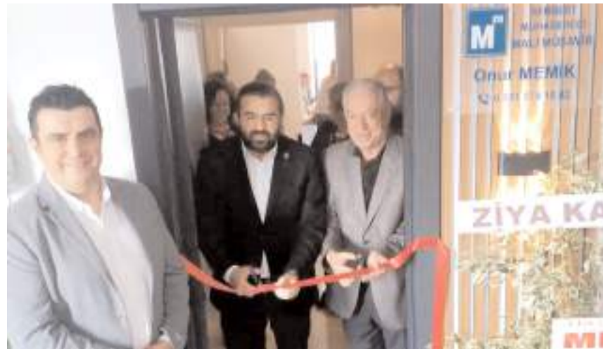
Ofisin açılış kurdelesini kesildi.