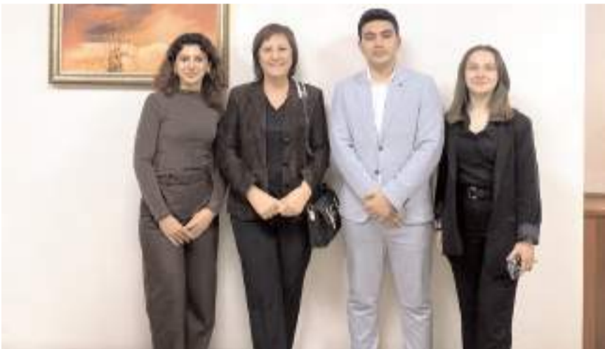
Katılımcılar alanında uzman isimlerle bir araya gelme fırsatı yakaladı.