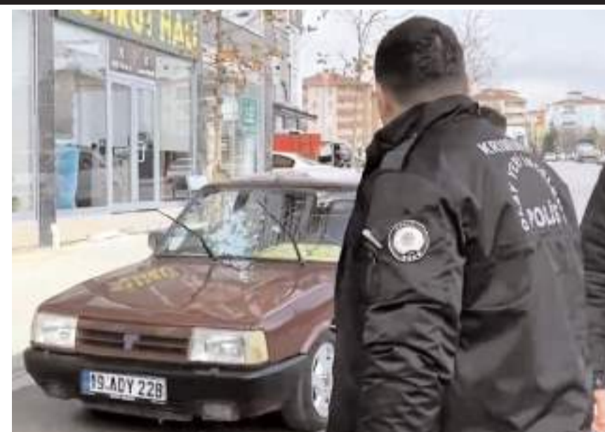
Olay Ulukavak Mahallesi Selçuk Caddesi'nde meydana geldi.

Polis ekipleri olayın şüphelisi 2 kardeşi yakalamak için çalışma başlattı.(AA)