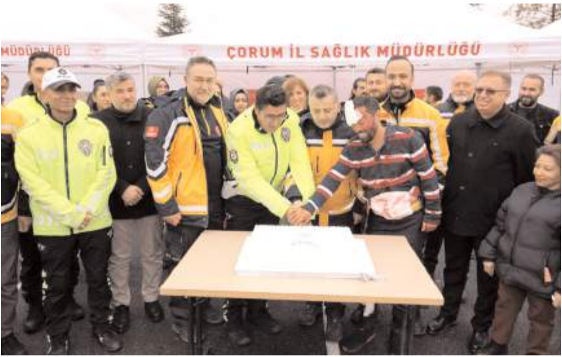
Etkinlikte yaş pasta kesildi.