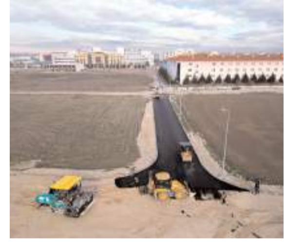
Hastane çevresindeki yollarda asfaltlama çalışmaları başladı.