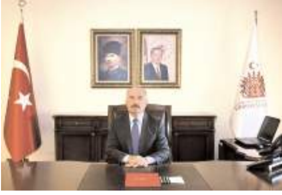
Çorum Valisi Ali Çalgan

Savaşlar, çatışmalar, ayrımcılık, zorla yerinden edilme, işkence, ifade özgürlüğünün kısıtlanması gibi ihlallerin, milyonlarca insanın yaşamını