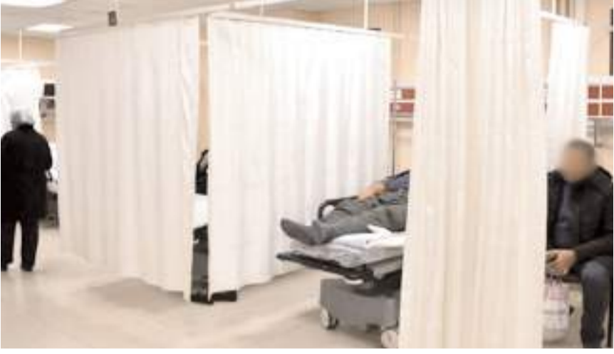
Çorum'da son günlerde hastanelerin acil servislerinde akşam saatlerinde yoğunluk yaşanıyor.

Soğuk havanın gribe neden olacağı düşüncesinin gerçeği yansıtmadığını ifade eden Dr. Kısaç, "Soğuk havalarda insanlar kapalı alanlarda daha fazla vakit geçirdiği için virüslerin yayılması kolaylaşıyor. Havalandırması yetersiz ortamlar, grip ve diğer solunum yolu enfeksiyonlarının bulaşma riskini artırıyor. Soğuk hava grip için doğrudan bir neden olmasa da, virüsün yayılmasına ve hastalığın görülme sıklığının artmasına katkıda bulunabilir" şeklinde konuştu.