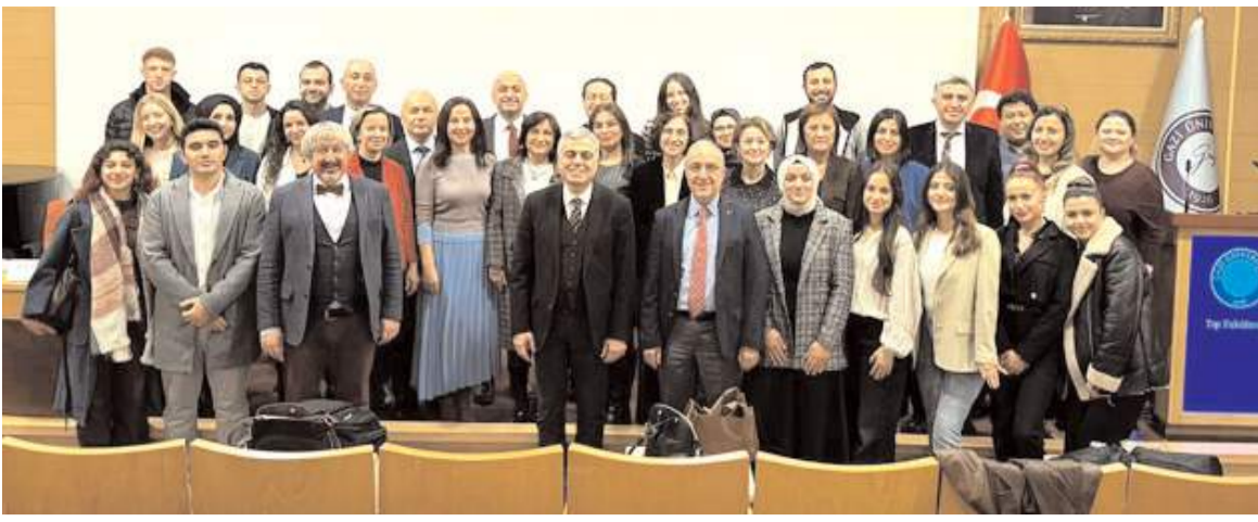
Etkinlik Gazi Üniversitesi Tıp Fakültesi'nde yapıldı.