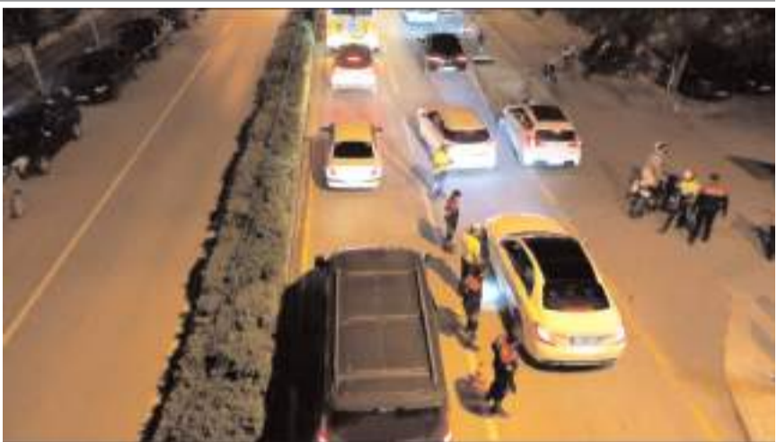
Polis ekipleri hafta sonu kentin çeşitli bölgelerinde huzur denetimleri yaptı.

Kentin iki noktasında yaşanan yaralama ve mala zarar verme olaylarının şüphelilerinin de suç aletleri ile birlikte yakalandığı belirtildi. (İHA)