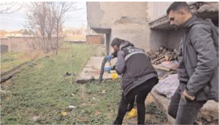
Suç aleti pompalı tüfek, odunların altına gizlenmiş halde bulundu.