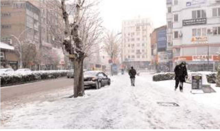
Hafta sonu kar yağışı bekleniyor.

Salı günü ise Çorum'da yine 13 derece bir sıcaklık bekleniyor. Meteoroloji Genel Müdürlüğü verilerine göre Salı günü sisli bir hava beklenirken Çarşamba günü 13 derece ve yağmurlu bir hava bekleniyor.