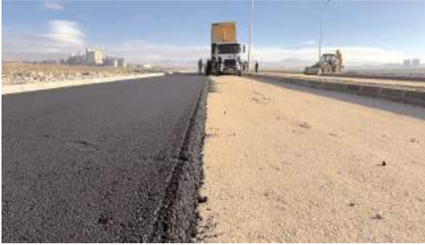
Hastane çevresindeki yollarda asfaltlama çalışmaları başladı.