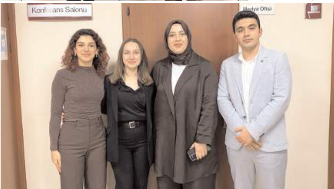
Hitit Üniversitesi temsilcileri, kulüp ve bölüm adına etkinliğe katılarak akademik ve mesleki ağlarını güçlendirdiler.

Hitit Üniversitesi Beslenme ve Diyetetik Kulübü, Gazi Üniversitesi Tıp Fakültesi'nde KEPAN Derneği tarafından düzenlenen Pediatrist Diyetisyen Buluşması etkinliğine katıldı.