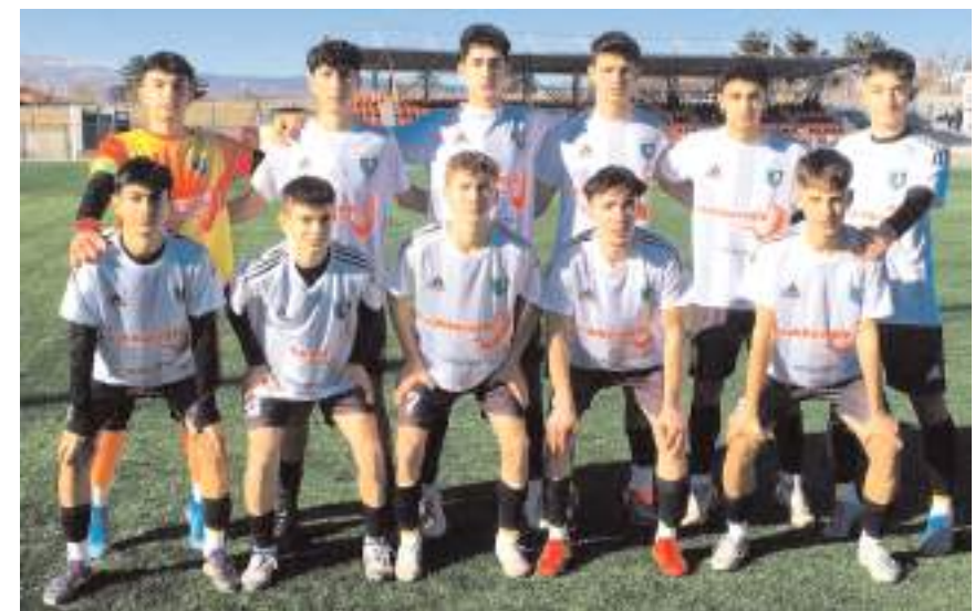
Çorum Anadolu FK dördüncü maçında üçüncü galibiyeti alarak hedefe yaklaştı