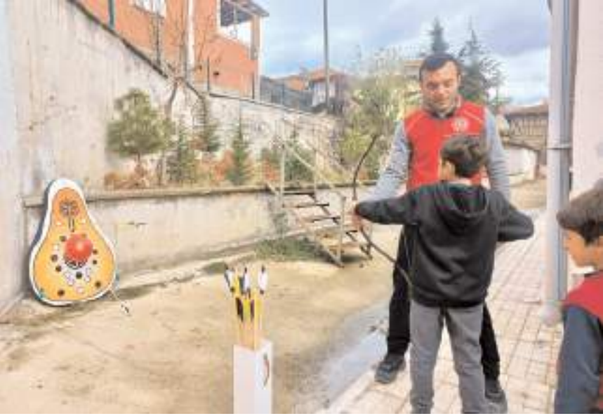
Öğrenciler etkinliklerde ok atıldılar.

mında, geleneksel okçuluk, dart, kort tenisi, geleneksel ço-