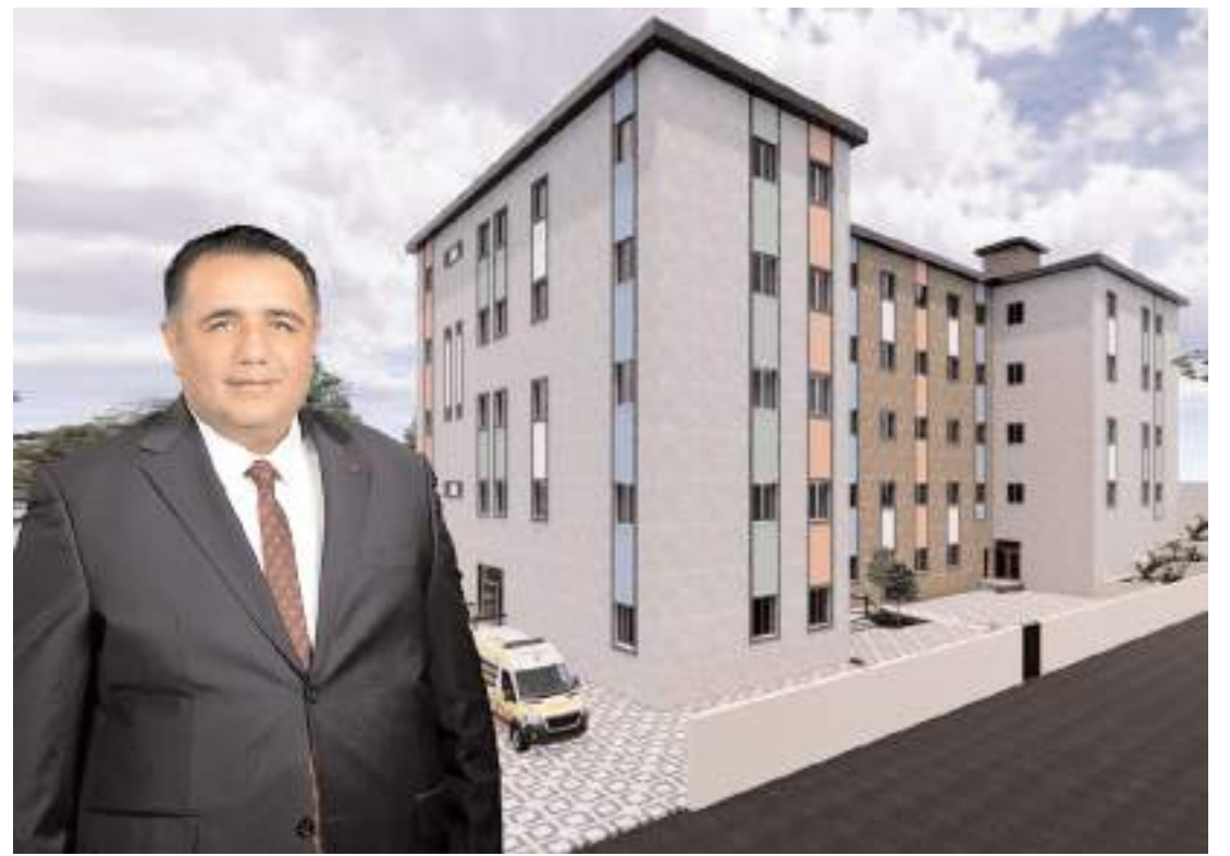
Milletvekili Oğuzhan Kaya, proje hakkında açıklamalarda bulundu.