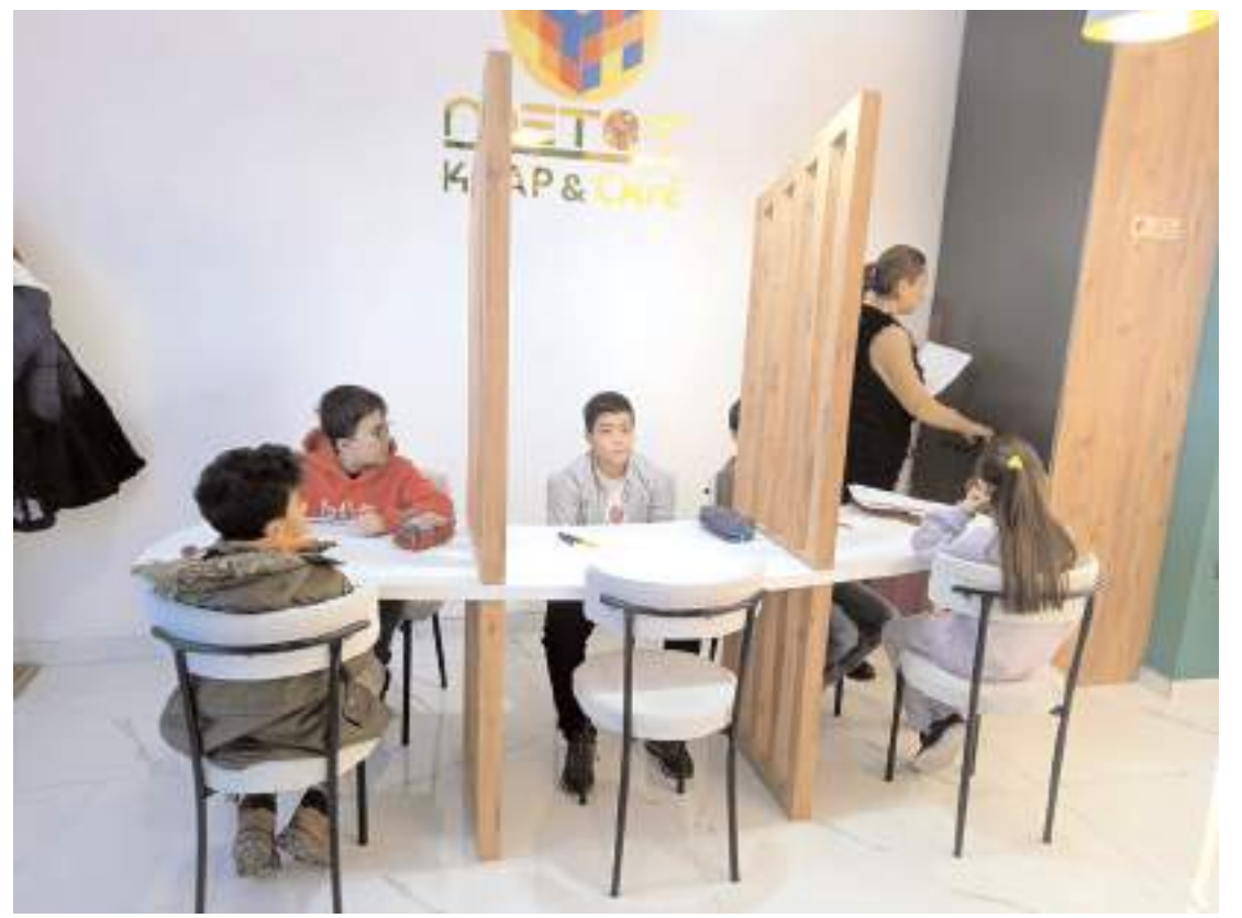
Metot Kitap Kafe, Ulukavak Mahallesi Selçuk Caddesi 57/A adresinde faaliyet gösteriyor.

Psikososyal Destek: Kanserle yaşam ve tedavi sonrası döneme uyum, multidisipliner bir yaklaşımla ele alınmalıdır. Prostat kanseri, erken tanı ve doğru tedaviyle yüksek oranda tedavi edilebilir bir hastalıktır. Bu nedenle, risk altındaki erkeklerin tarama programlarına katılmaları büyük önem taşır. Doktor-hasta işbirliği ve multidisipliner yaklaşımlar, prostat kanseriyle mücadelede başarı şansını artırır." (Haber Merkezi)