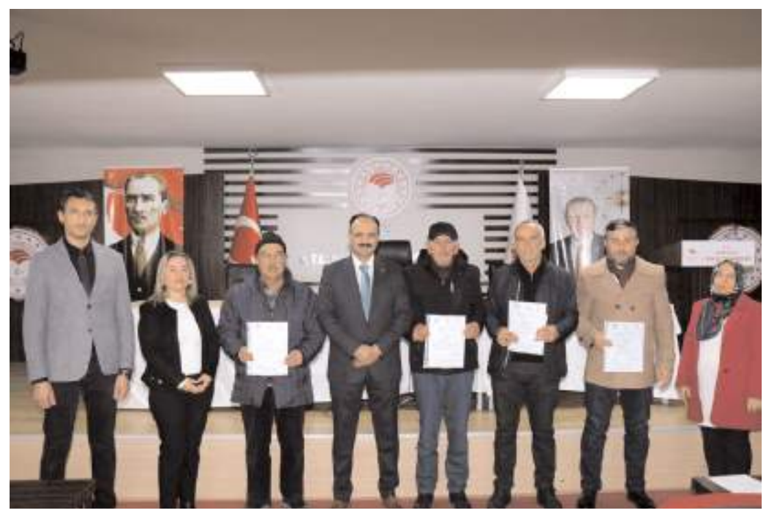
İyi tarım uygulamaları kapsamında sertifika dağıtımını devam ediyor.

Yeni yılda yurt dışı çıkış harcı 500 liradan 720 liraya yükselecek.