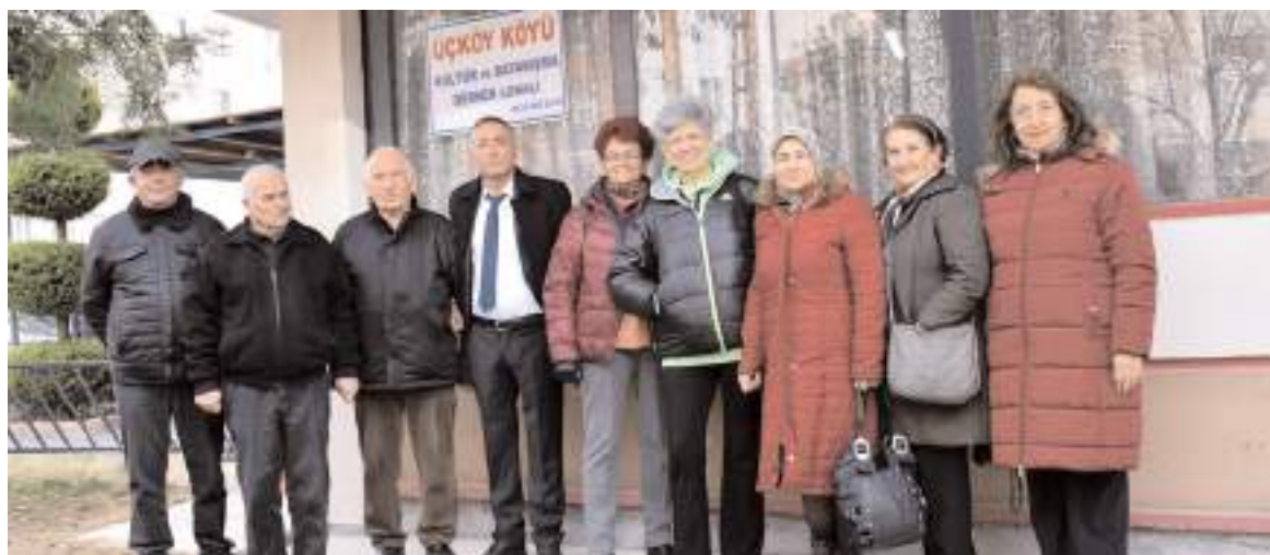
Birleşik Emekliler Sendikası yöneticileri, Üçköy Köyü Kültür ve Dayanışma Derneğini ziyaret etti.