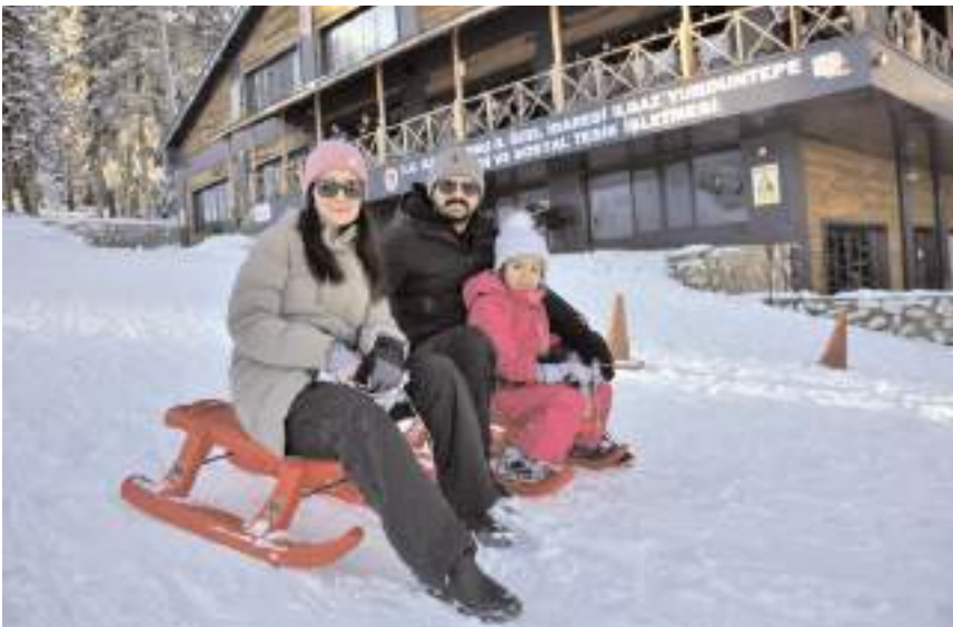
Yurduntepe, ailelerin ilgi odağı oldu.