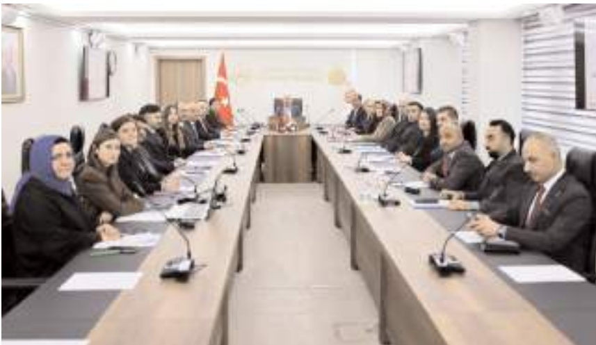
Toplantıda Aile ve Sosyal Hizmetler İl Müdürlüğü'nün çalışmaları istişare edildi.