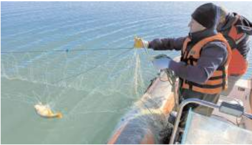
Ekipler Koçhisar Barajında 4 bin metre uzunluğunda hayalet ağ ele geçirdi.

Edinilen bilgiye göre, Alaca İlçe Tarım ve Orman Müdürlüğü ekipleri tarafından ilçede bulunan Koçhisar Barajında yapılan denetimler sırasında kaçak avlanmak için bırakılmış 4 bin metre uzunluğunda ağ olduğu tespit edildi. Ekipler tarafından sudan çıkartılan ağa el konuldu. Ağa takılan balıklar ise ekipler tarafından yeniden baraja salındı. (İHA)