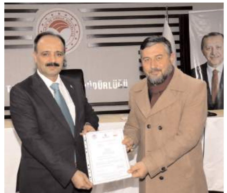
31 üretici sertifika almaya hakkazandı.