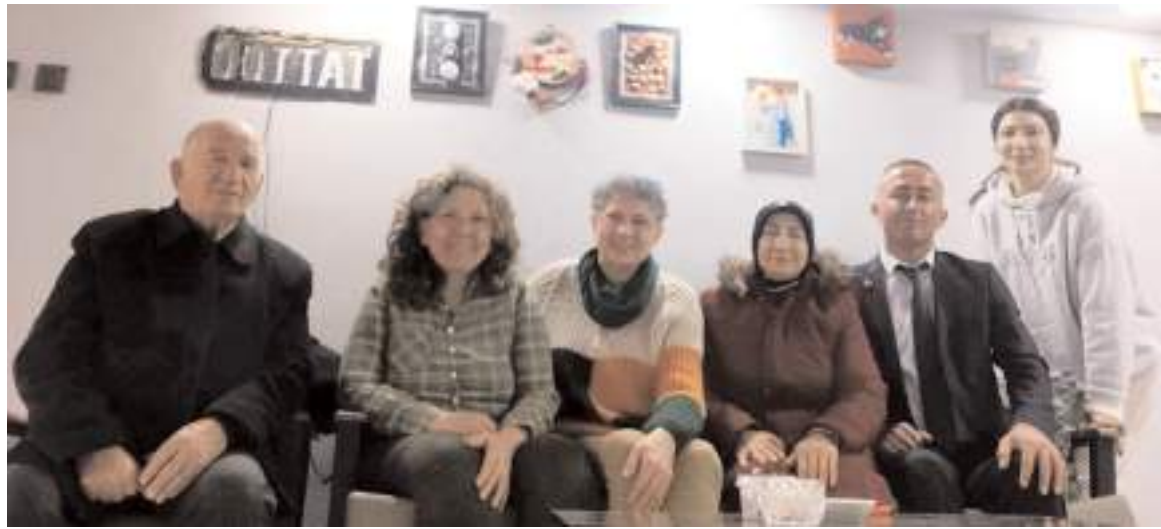
Birleşik Emekliler Sendikası yöneticileri ziyaretlerine devam ediyor.

Merhumun cenazesi yapılan otopsinin ardından Çorum'a getirilerek Alaca'ya bağlı Akpınar köyünde toprağa verildi. (DHA)