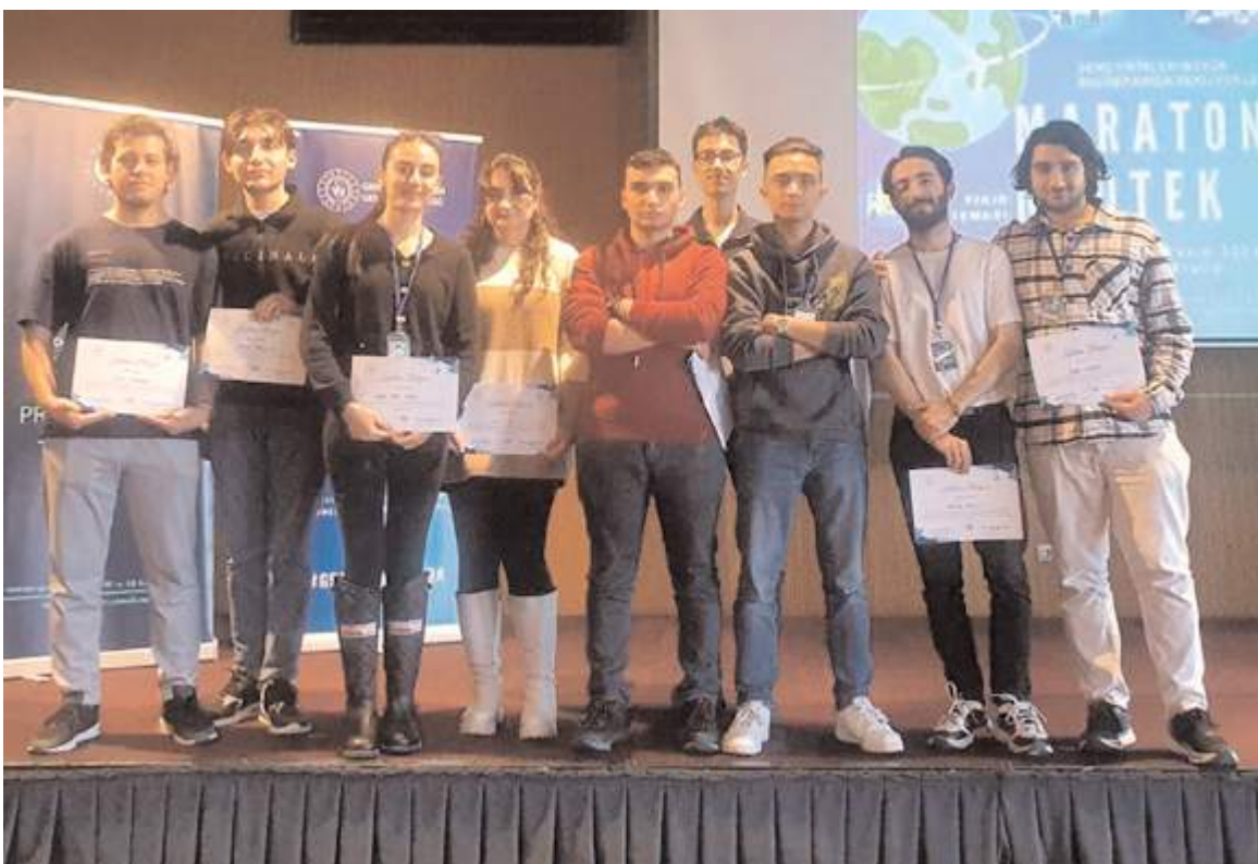
Yarışmaya katılan Hitit Üniversitesi öğrencileri.