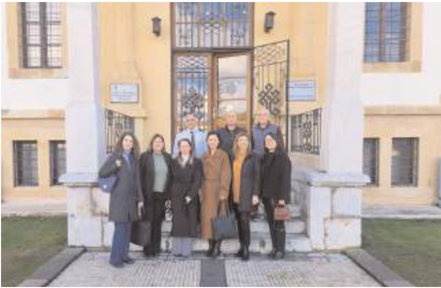
Sağlık Bakanlığı heyeti Çorum Müzesini gezdi.