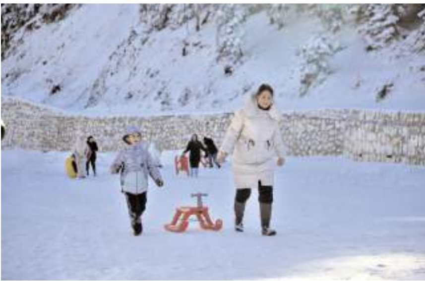
Yurduntepe'de bu sene kar geçen yıllara göre daha erken yağdı.

Çankırı'dan gelen Semih Akuş ise "İlgaz Kayak Merkezi çok harika bir yer. Bu sene kar erken yağdığı için çocuğumla beraber geldim. Çocuğum da çok mutlu oldu. Gelecek arkadaşlar bu fırsatı kaçırmamasın. Kızakla kaydık, bu eşsiz manzara eşliğinde bir teleferik turu yapacağız." ifadelerini kullandı.(AA)