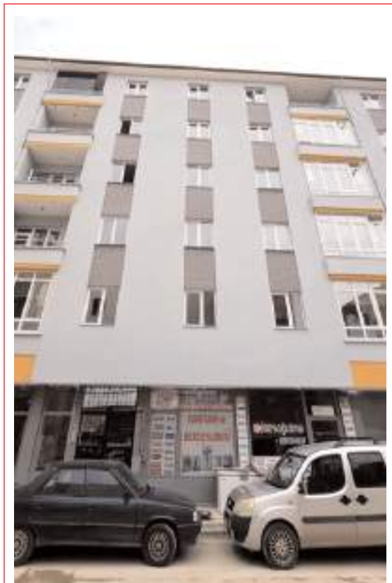
Arıncı Apartmanının patlamada zarar gören cephesi tamir edildi.