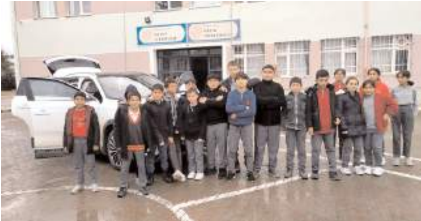
Öğrenciler Togg'u yakından görmek fırsatı buldu.