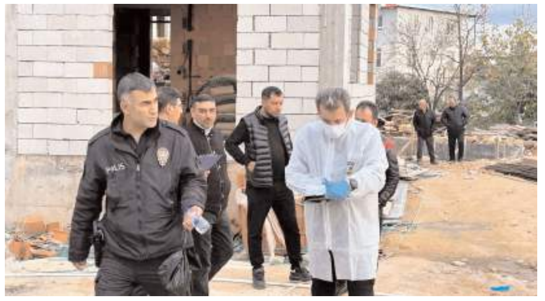
Olay Antalya'nın Aksu ilçesine bağlı Cihadiye Mahallesi'nde meydana geldi.