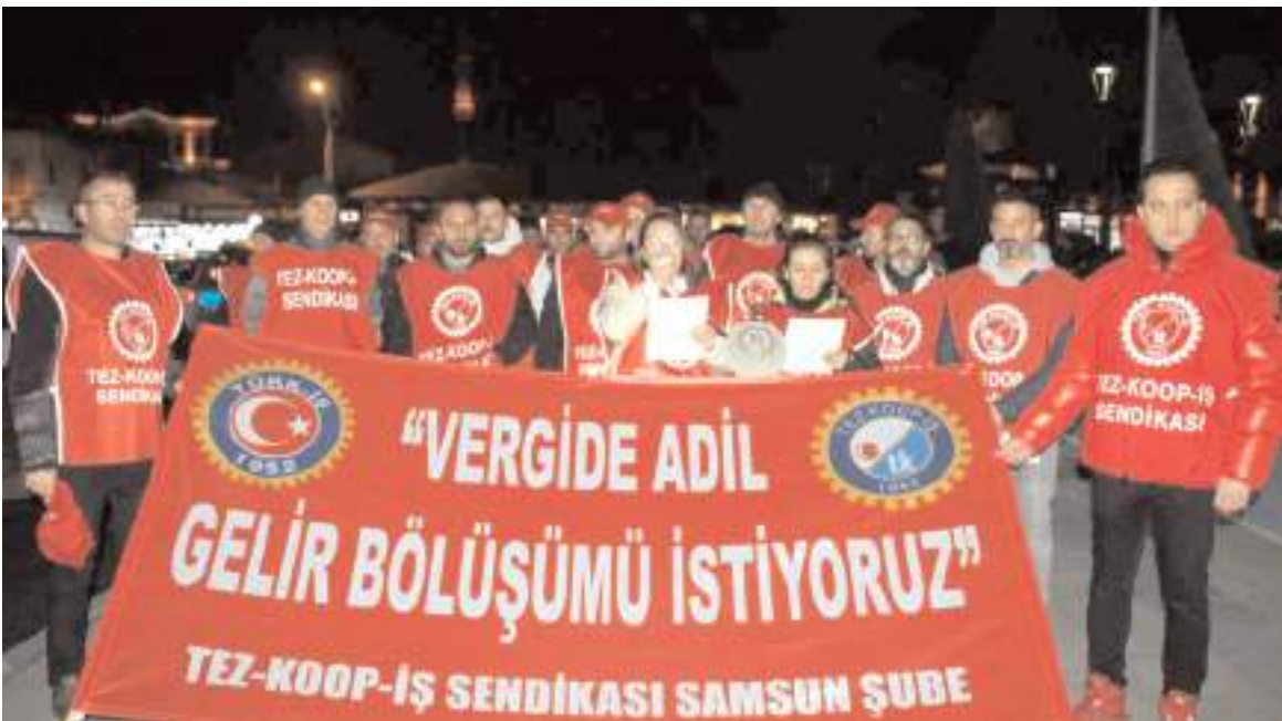
Tez-Koop-İş Sendikası, Çorum'da basın açıklaması yaptı.