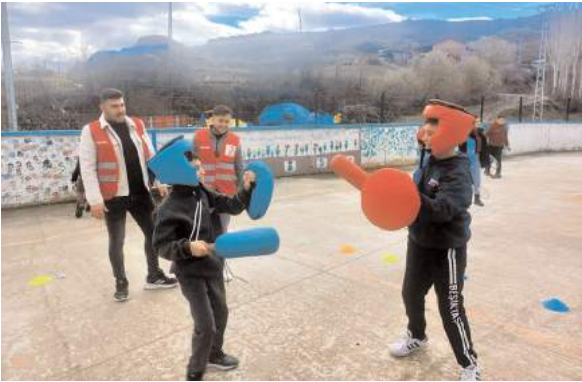
Öğrenciler oyunlarda gönüllerince eğlendiler.

duvar boyama etkinlikleri gerçekleştirildi.(AA)