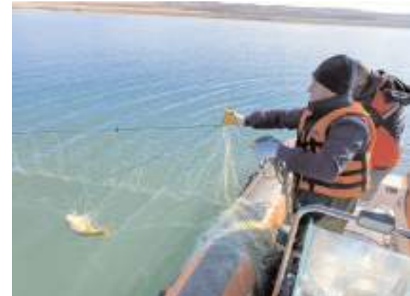
Ekipler tarafından sudan çıkartılan ağa el konuldu.