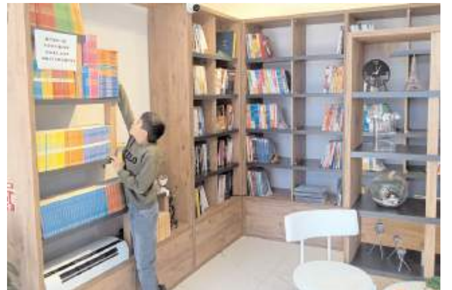
Kafe modern tasarımı ile dikkat çekiyor.