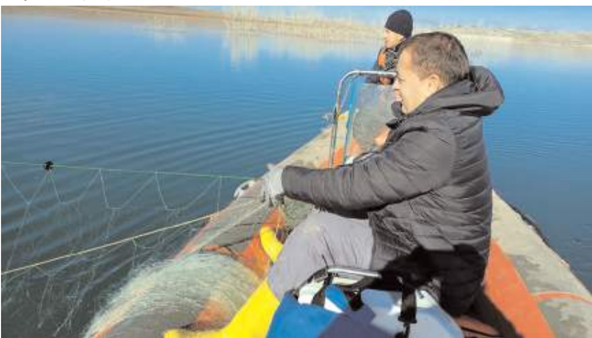
Ekipler tarafından sudan çıkartılan ağa el konuldu.