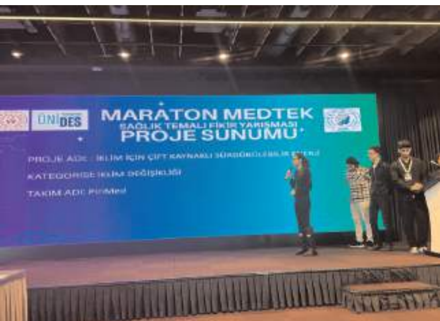
PiriMed takımı projeleri hakkında bilgi verdi.

Geliştirilen sistem, filtre sonrası elde edilen enerjiyi kullanarak metan gazının yanması so-