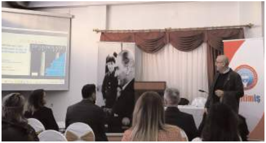
Eğitim İş Sendikası Çorum Şubesi'nin işyeri temsilci eğitimi hafta sonu yapıldı.