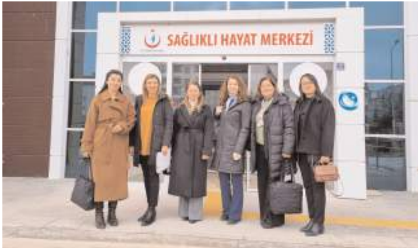
Sağlık Bakanlığı heyeti İl Sağlık Müdürlüğünde inceleme yaptı.