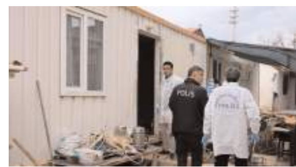
Olay Antalya'nın Aksu ilçesine bağlı Cihadiye Mahallesi'nde meydana geldi.