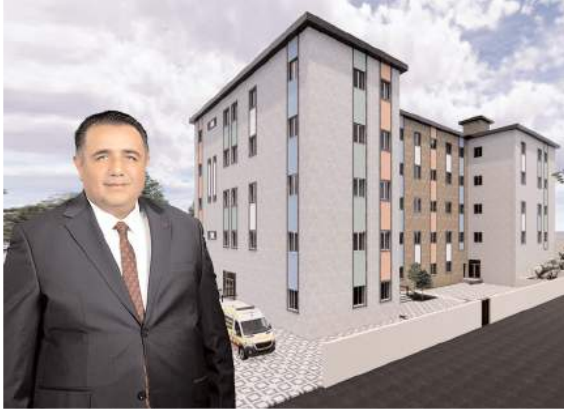
Milletvekili Oğuzhan Kaya, proje hakkında açıklamalarda bulundu.