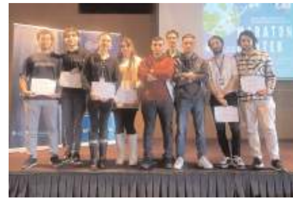
Yarısmaya katılan Hitit Üniversitesi öğrencileri.