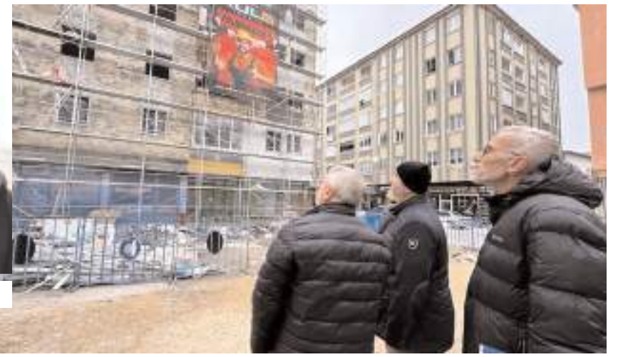
Belediye Başkanı Halil İbrahim Aşgın, çalışmalarını yakından takip etti.