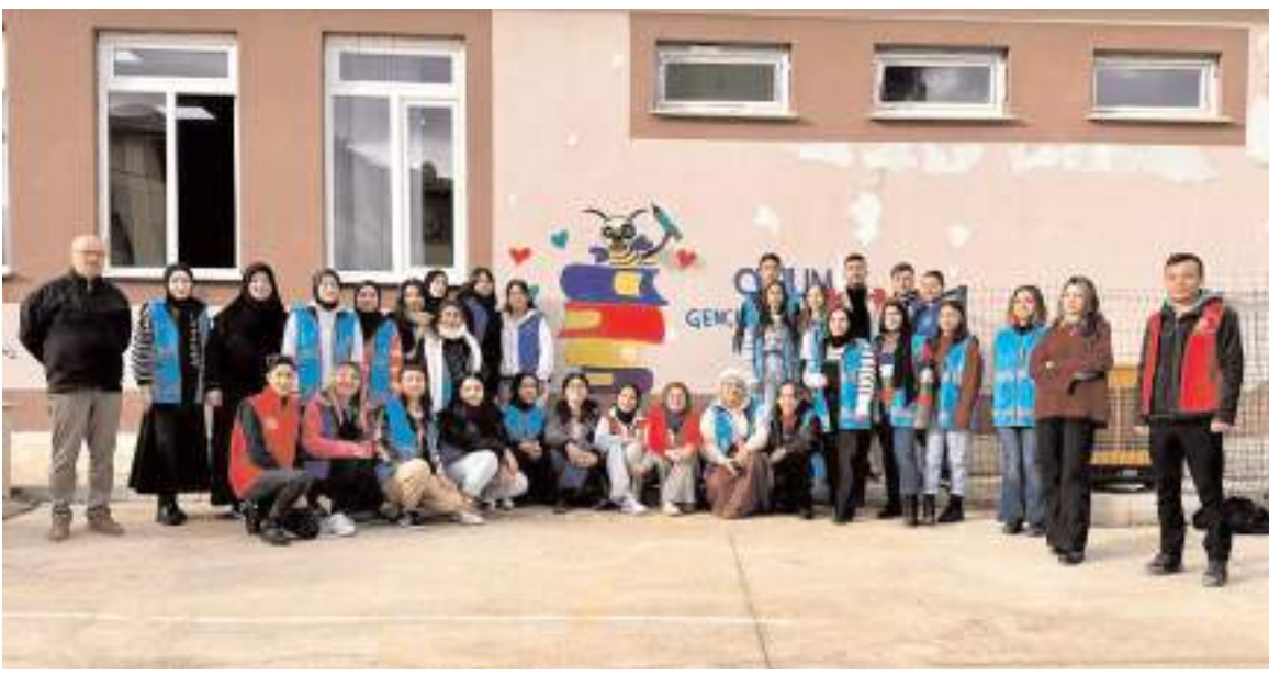
Etkinlikleri İskilip Gençlik Merkezi görevlileri ve İskilipli Atıf Hoca Kız Yurdu'ndan gönüllü öğrencileri gerçekleştirdiler.