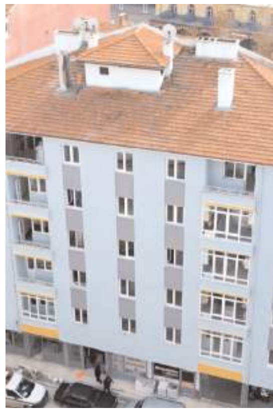
Arıncı Apartmanı'nın patlamada zarar gören cephesi tamir edildi.