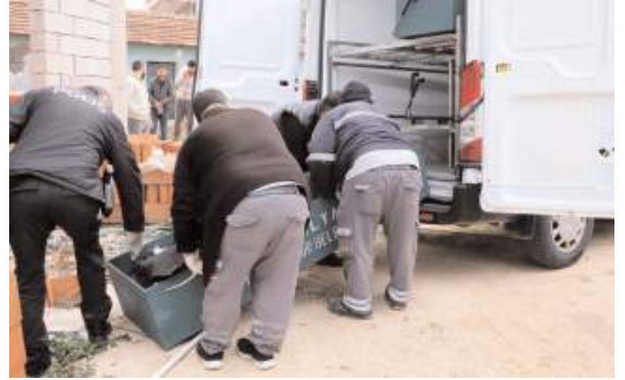
Merhumun cenazesi yapılan otopsinin ardından Çorum'a getirildi.

Olay yerini inceleme ekipleri yaptıkları çalışma-