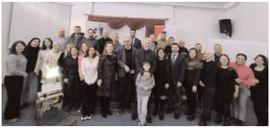
Eğitimin sonunda hatıra fotoğrafı çekildi.