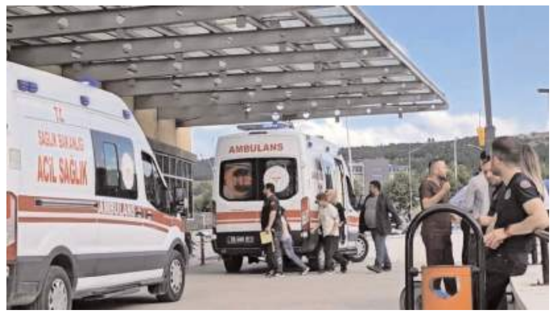
18 öğrenci, ilde bulunan hastanelere kaldırıldı.

Özverili çalışmalarından dolayı tüm personele teşekkür eden Vali Çalgan, çalışmalarında kolaylık ve başarılar diledi. (İHA)