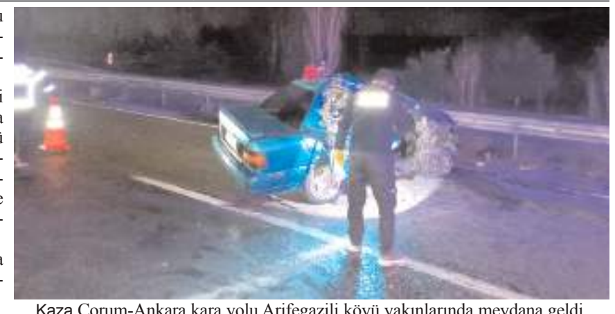
Kaza Çorum-Ankara kara yolu Arifegazili köyü yakınlarında meydana geldi.

Sağlık ekiplerince kaza yerinde ilk müdahalesi