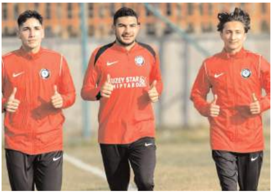
U 19 takımından Erzincanspor maçı kadrosuna alınan üç isim dünki antrenmanda