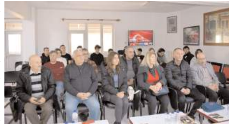
Söyleşiye çok sayıda davetli katıldı.