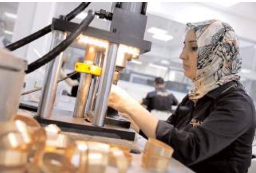
Mücevher sektöründe en fazla ihracat 2,3 milyar dolarla Birleşik Arap Emirlikleri'ne yapıldı.