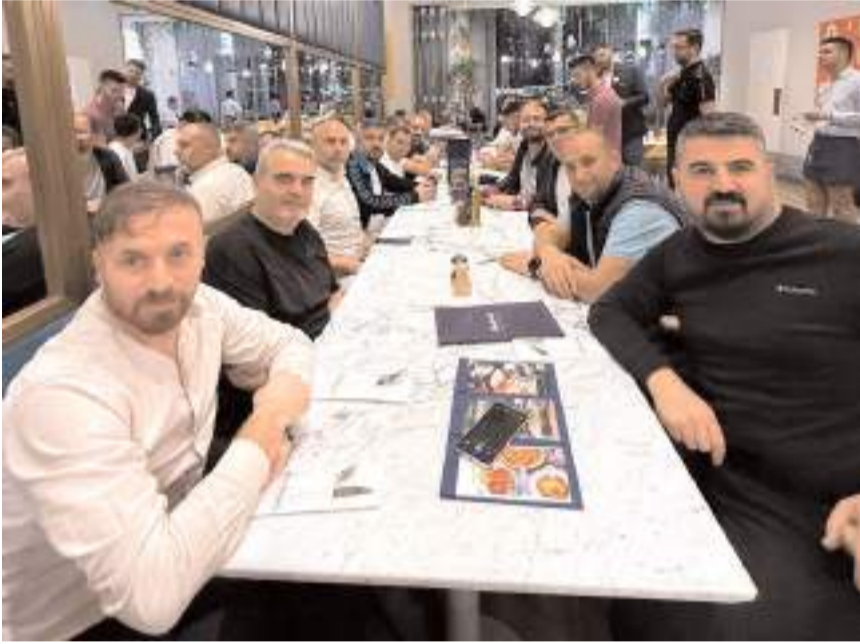
Esnaflar Dubai'nin sanayide ve teknolojide bulunduğu konumu inceledi.