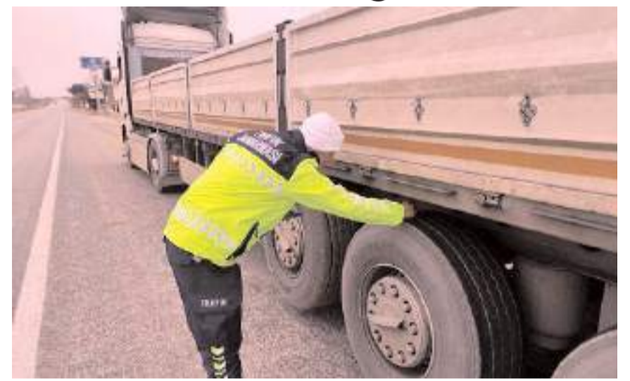
Jandarma ekipleri ticari araçların lastiklerini kontrol etti.

Denetimlerde 2 bin 683 yük ve yolcu taşıyan araç kontrol edilirken, kış lastiği uygulamasına uymayan araç şoförler uyarılarak, Trafik İdari Para Cezası uygulandı. (Haber Merkezi)