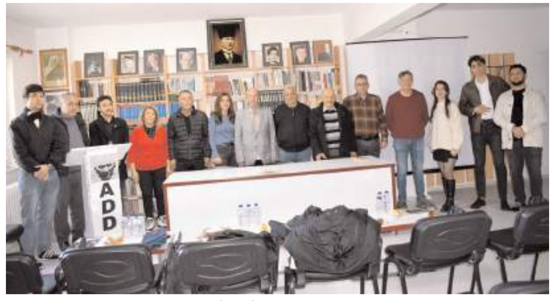
ADD Çorum Şubesinde "Atatürk'ün İsmet İnönü'ye Gönderdiği Mektup" adlı bir söyleşi yapıldı.