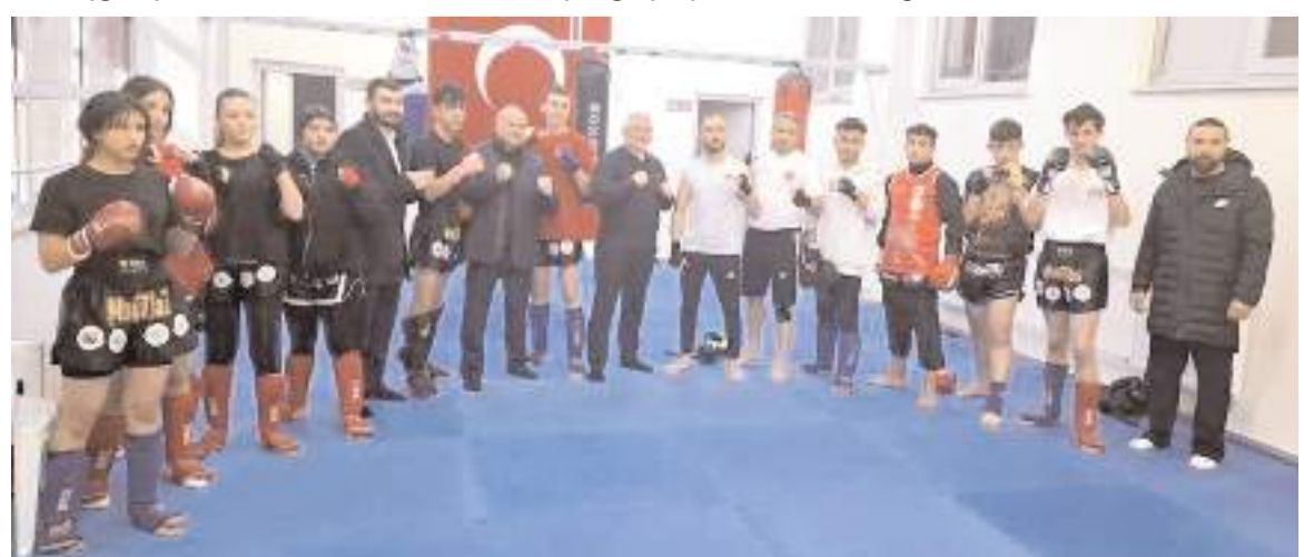
Muay Thai alıřması yapan sporcular misafirleri karřısında hnerlerini sergilediler