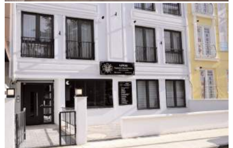
İşletme Üçtutlar Mahallesi Anadolu 5. Sokak Mumcu Residence'cesta bulunuyor.