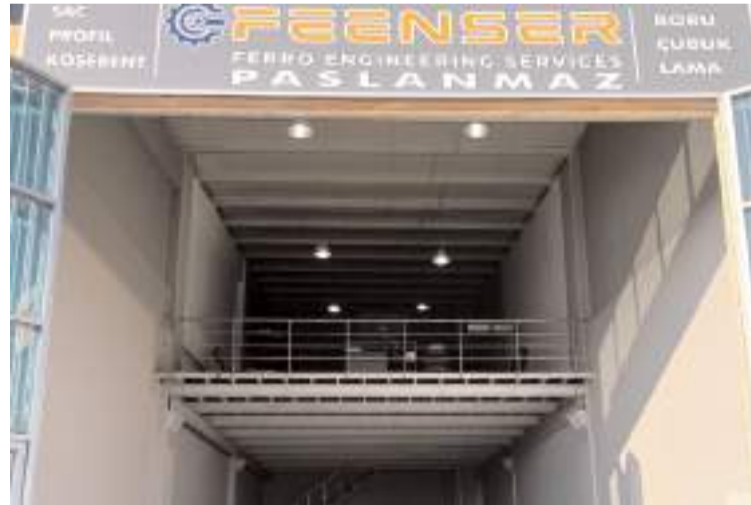
Firma Mimar Sinan Mahallesi Sanayi Sitesi 20. Cadde Numara 142 adresinde faaliyet gösteriyor.