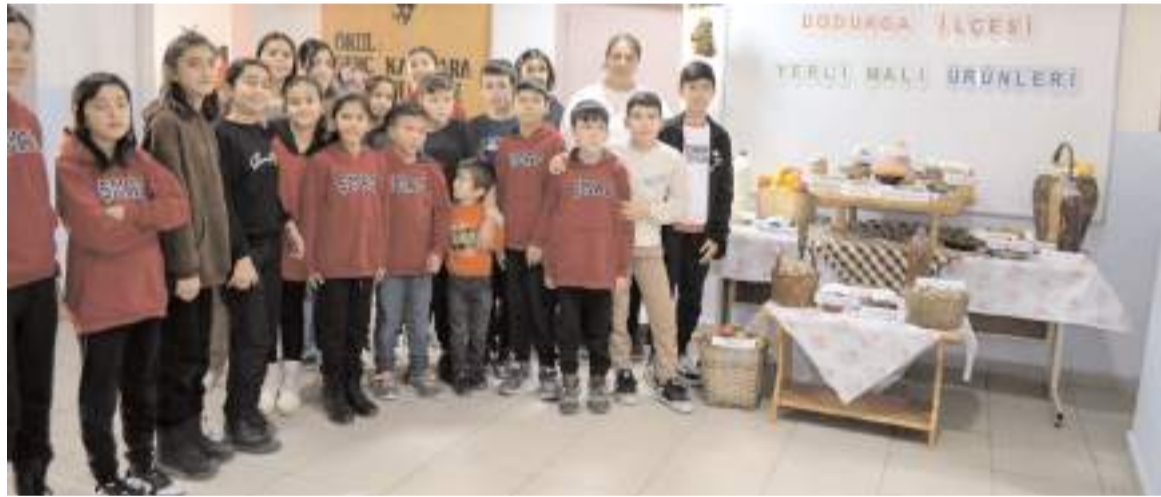
Dodurga Şehit Murat Alıcı Ortaokulu'nda etkinlik düzenlendi.

Okulun girişinde ise Dodurga'da üretilen Dodurga pirinci, Dodurga bey ayvası, ceviz, erişte, kuşburnu ve reçel çeşitleri ile çeşitli meyvelerden elde edilen meşrubatların yer aldığı "Dodurga yerli malı ürünleri" köşesi oluşturuldu.