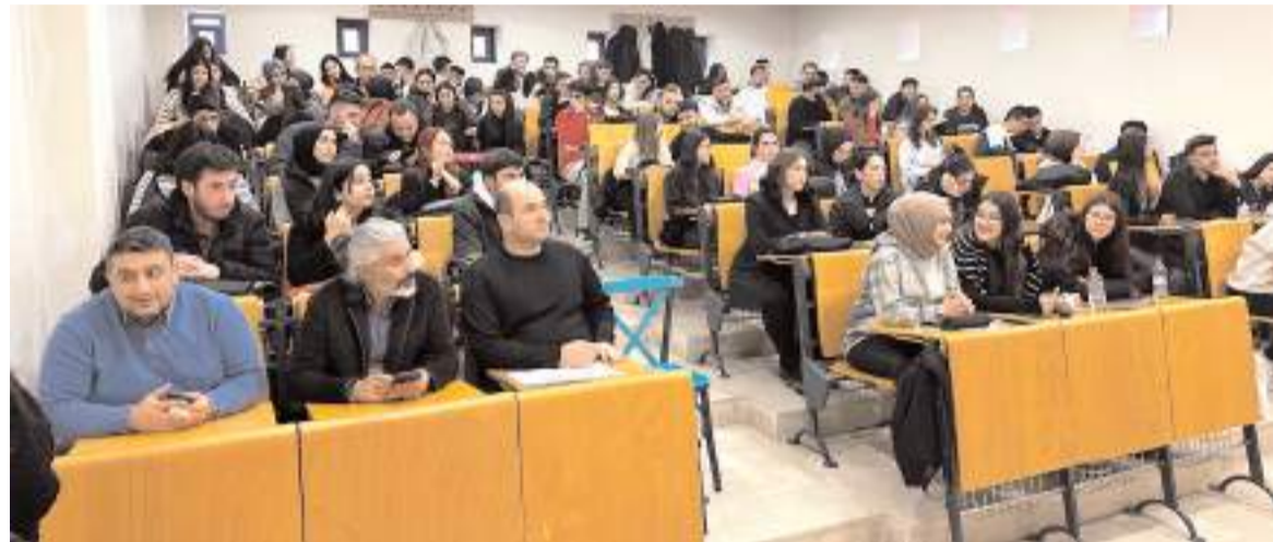
Programa ilgi yüksek oldu.