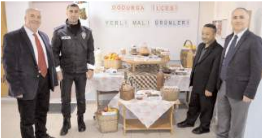
İlçede Yerli Malı Haftası yöresel ürünlerle kutlandı.

Çorum'un Dodurga ilçesinde öğrenciler Yerli Malı Haftası'nı ilçede üretilen yöresel ürünlerle kutladı.