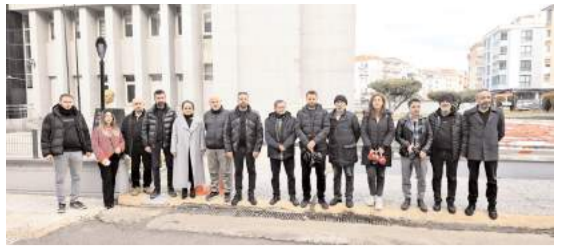
Derişođlu'nun korumaları tarafından hakaret ve sözlü taciz ile birlikte darbedilen gazeteciler, basın açıklamalı eylem yaparak, korumalar hakkında suç duyurusunda bulundu.