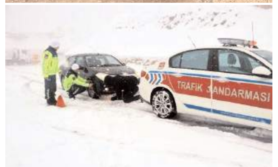
Kış lastikleri çekici, tanker ve otobüslerde 4 mm'den, kamyonet, minibüs ve otomobil türü araçlarda ise 1.6 mm'den az olmamalı.