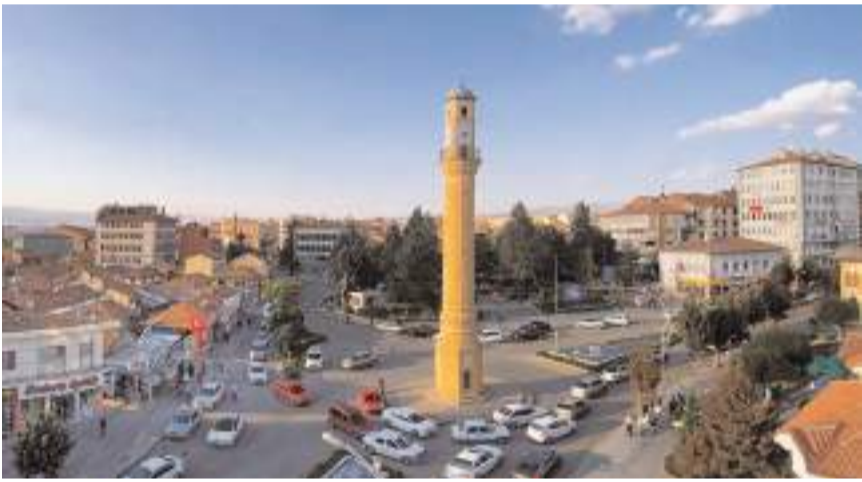
Potansiyel rekabetçi iller arasında Çorum'un yanı sıra Sivas, Düzce ve Mardin de yer aldı.