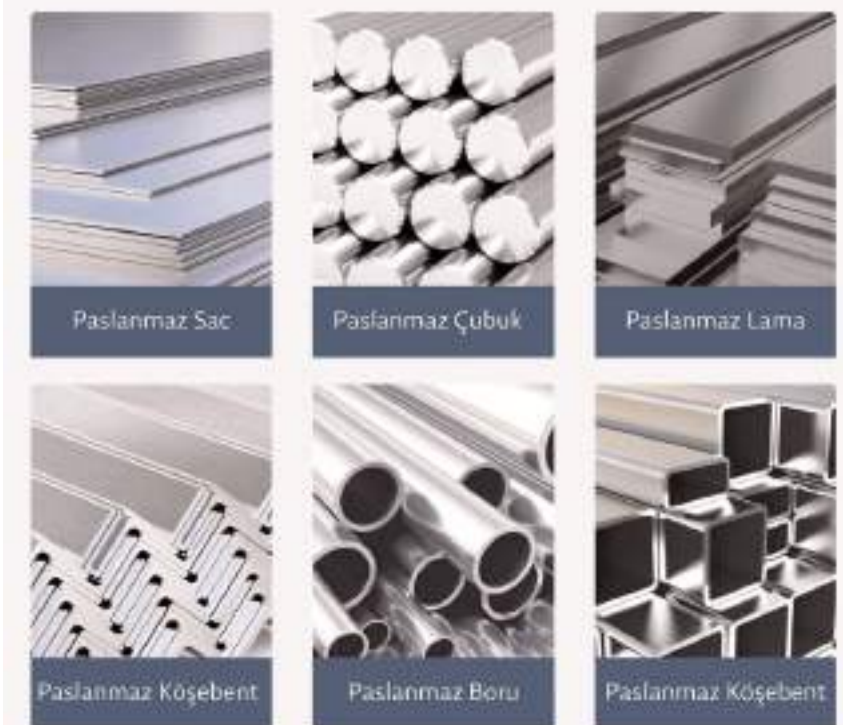
Firma çok sayıda ürünü müşterilerine sunuyor.