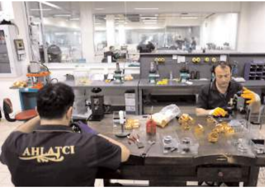
Çorum İstanbul'dan sonra Türkiye'de en fazla mücevher ihracatının gerçekleştirildiği il oldu.

Mücevher sektörü, Libya'ya 285,1 milyon dolar, İtalya'ya 164,9 milyon dolar, Meksika'ya 284,8 milyon dolar ihracat yaptı. (A.A)