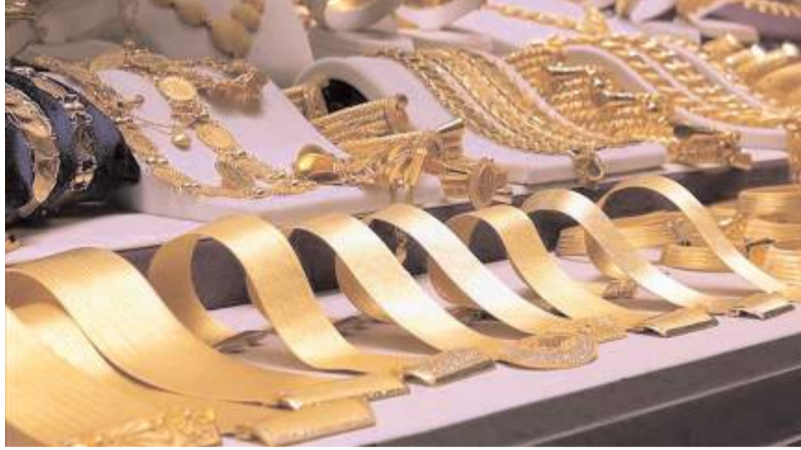
Çorum İstanbul'dan sonra Türkiye'de en fazla mücevher ihracatının gerçekleştirildiği il oldu.