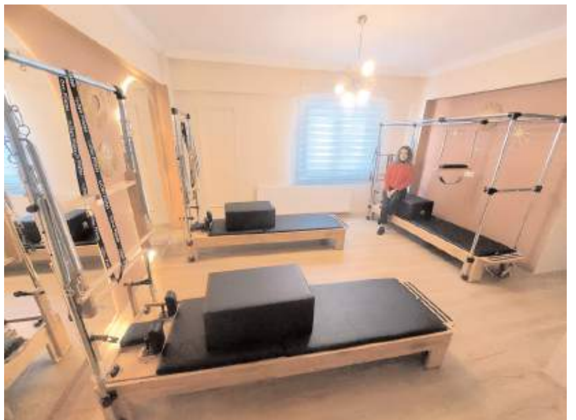
Merkez modern alt yapısı ile dikkat çekiyor.