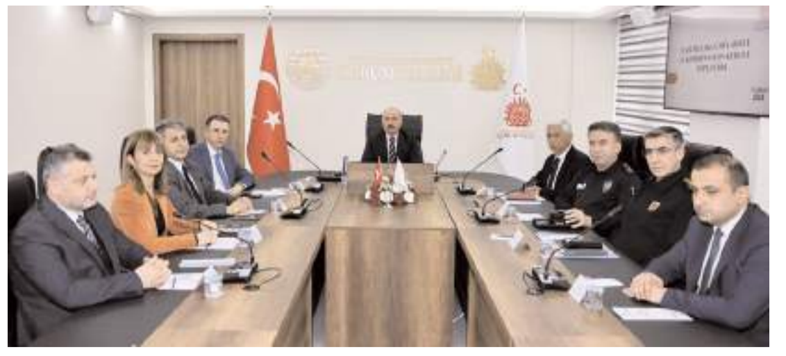
Toplantı Vali Ali Çalgan'ın başkanlığında yapıldı.