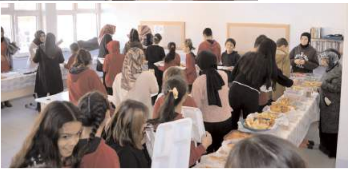
Öğrenciler ile aileleri yöresel ürünleri tükettiler.