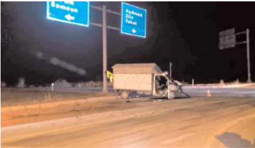
Kaza Alaca'da Zile kavşağında meydana geldi.