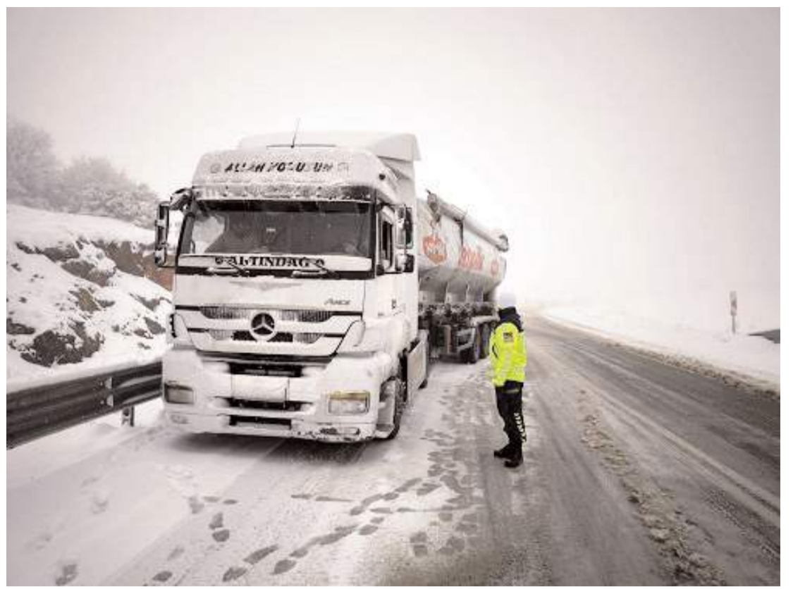
Kış lastiği uygulaması 1 Aralık- 1 Nisan tarihleri arasında zorunlu.