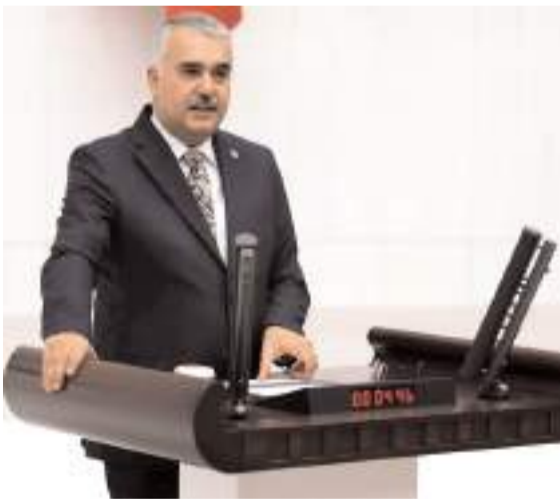
Milletvekili Yusuf Ahlatcı

AK Parti Çorum Milletvekili Av. Yusuf Ahlatcı, TBMM'de yaptığı konuşmada, savunma sanayisindeki yerli ve milli başarıları dikkat çekti. Ahlatcı, "2002'de 56 olan proje sayısı, bugün %80 yerlilik oranıyla 1132'ye ulaştı. Savunma sanayimizle gurur duyuyoruz, hainlere inat daha fazla çalışacağız." ifadelerini kullandı.