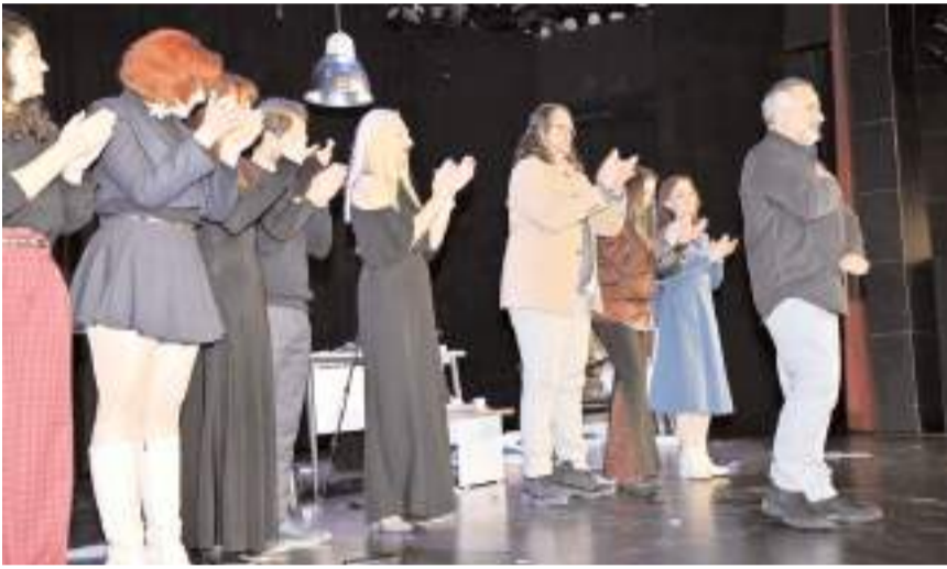
Oyuna ilgi yüksek oldu.