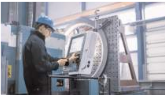
Potansiyel rekabetçi iller arasında Çorum'un yanı sıra Sivas, Düzce ve Mardin de yer aldı.