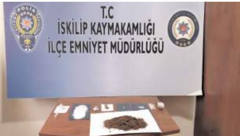
Şahısların üzerinde yapılan aramada uyuşturucu madde ele geçirildi.

Çorum'un İskilip ilçesinde polis ekipleri tarafından uyuşturucu madde ile yakalanan 2 şahıs gözaltına alındı.