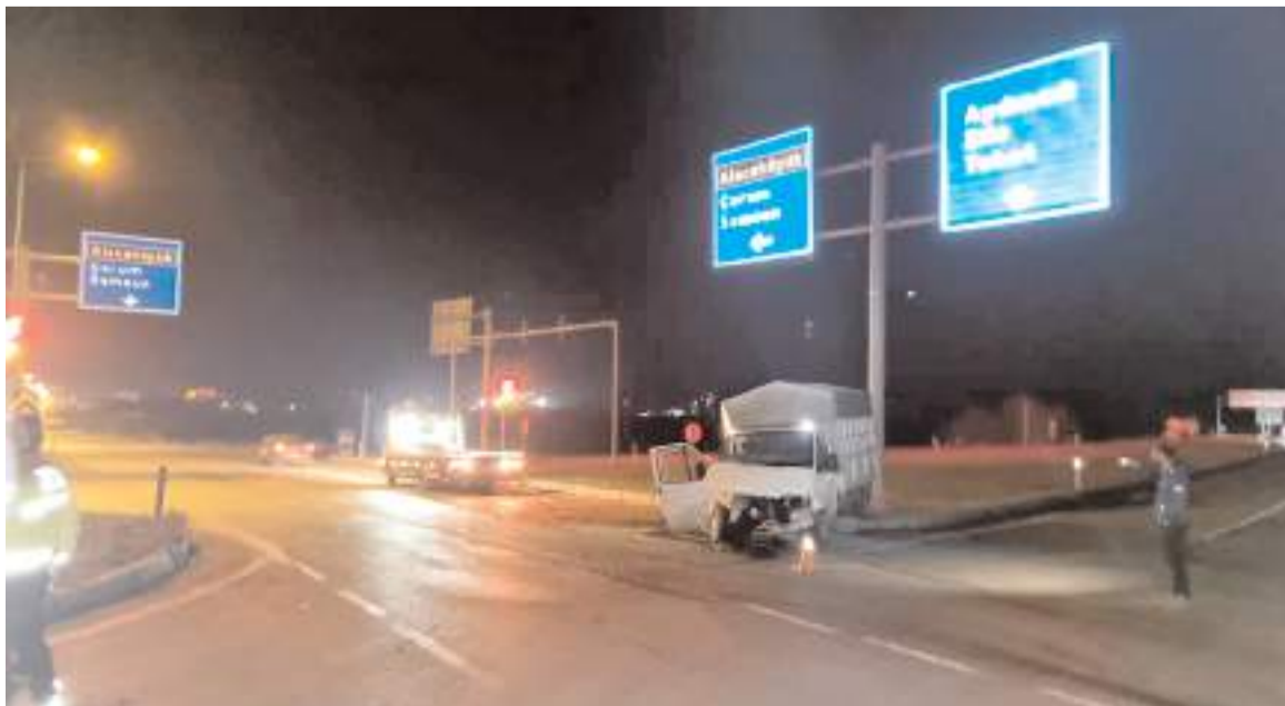
Kaza nedeniyle kavşakta trafik kontrollü olarak verildi.