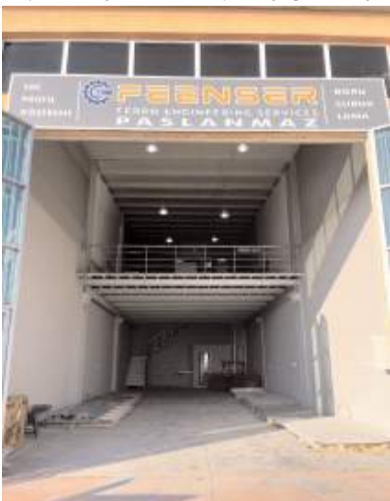
Firma Mimar Sinan Mahallesi Sanayi Sitesi 20. Cade Numara 142 adresinde faaliyet gösteriyor.