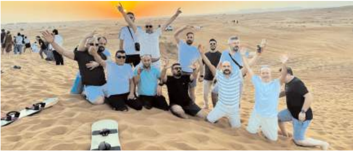
Esnaflar Dubai'de bol bol hatıra fotoğrafı çekindiler.