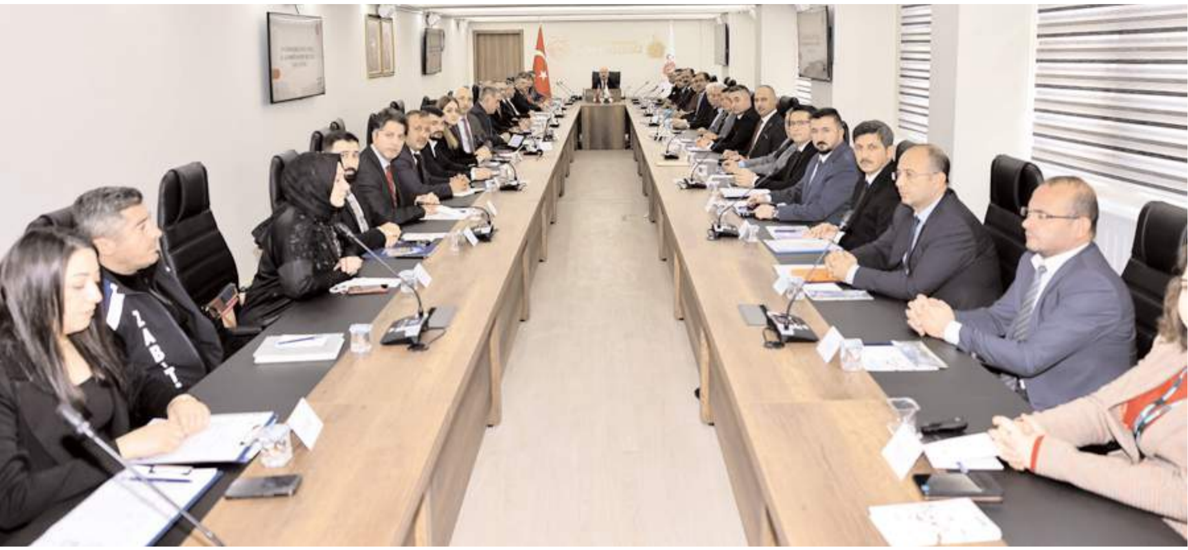
Toplantıda, bağımlılıkla mücadele konusunda kurumlar tarafından yürütülen proje, etkinlik ve faaliyetler hakkında bilgilendirme sunumları yapıldı.