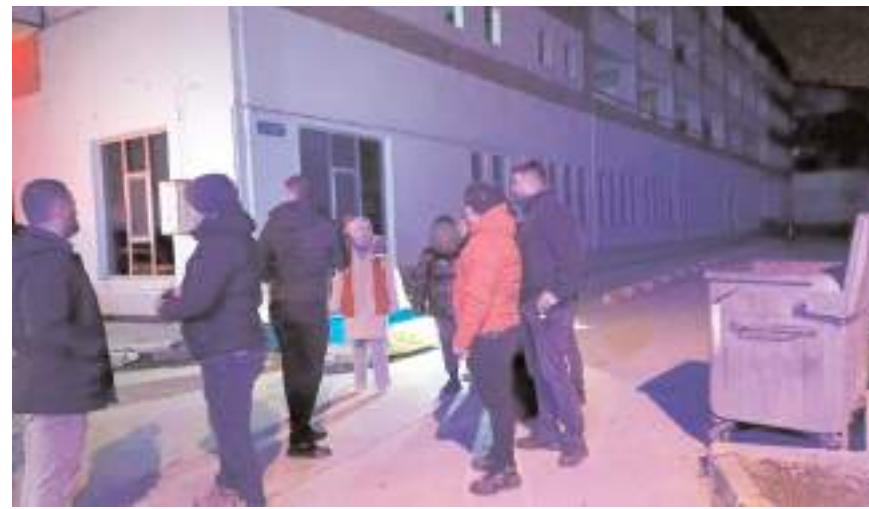
Olay, Çepni Mahallesi Kubbeli 2. Sokak'ta meydana geldi.