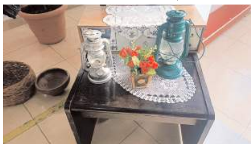
Müze, ilçede geçmişte kullanılan eski eşyalar ve yöresel ürünler, ziyaretçilerin beğenisine sunuldu.