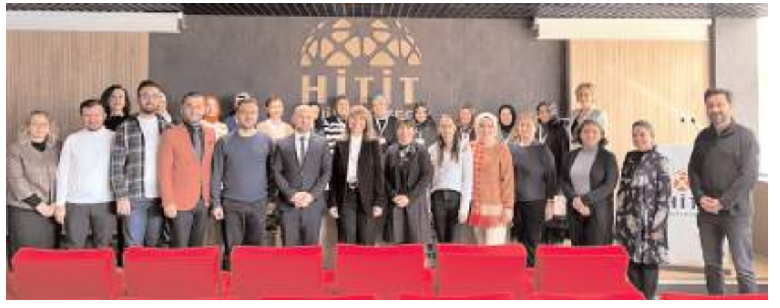
Programın sonunda hatıra fotoğrafı çekildi.