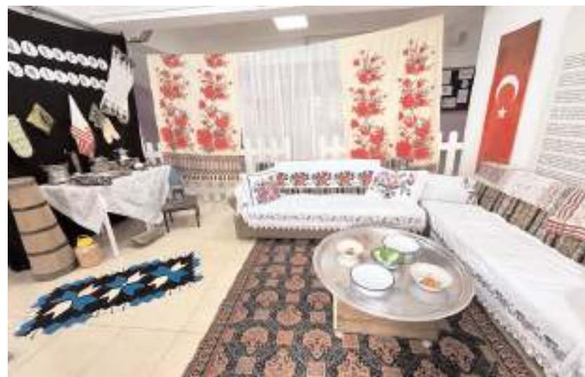
Müze Mustafa Kemal İlkokulunda açıldı.

Açılış töreninin ardından öğrenciler ve davetliler müzeyi gezdi.