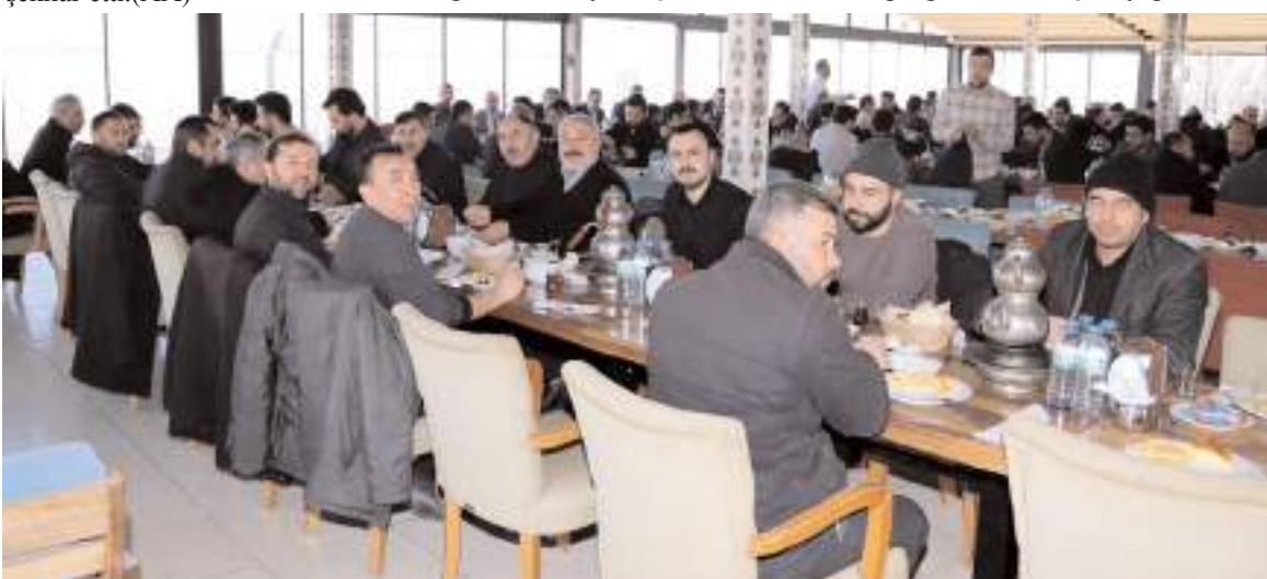
Toplantıda ilçedeki cami ve Kur'an kurslarının eksikleri konuşuldu.