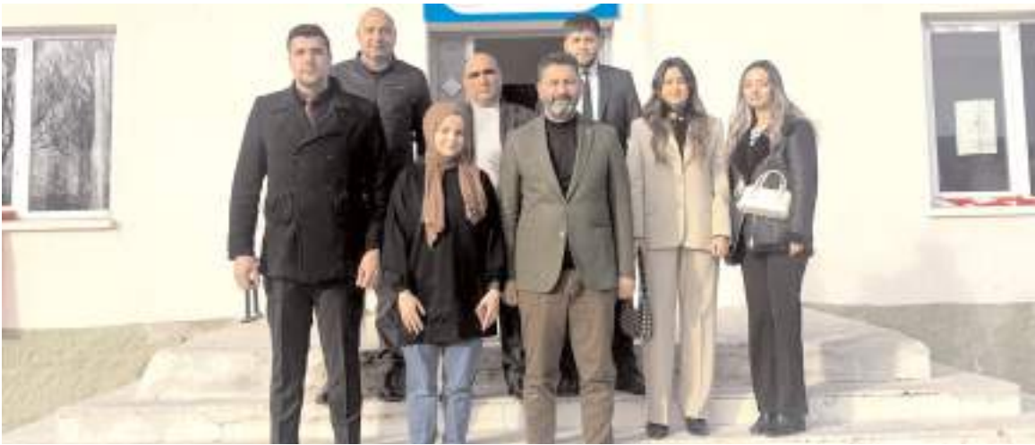
Gençler, Çiçekli Köyü İlkokulunu ziyaret ettiler.