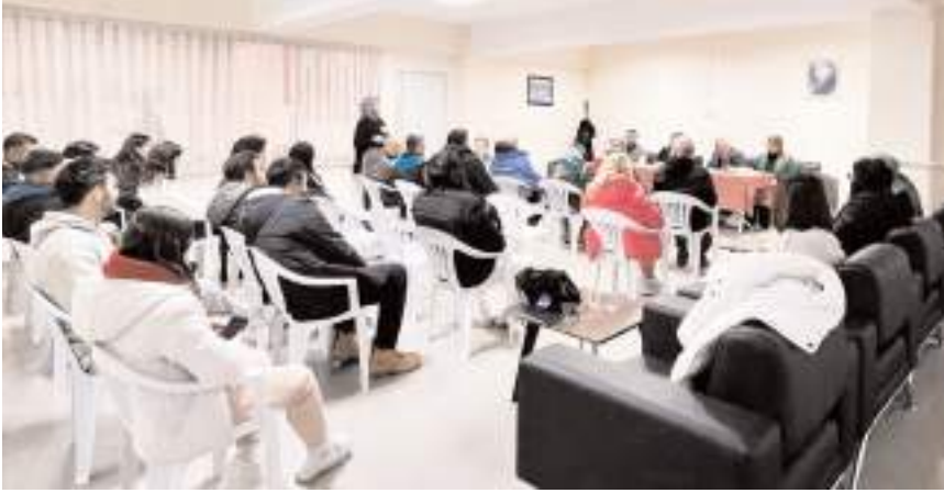
Judo grup maçlarının teknik toplantısı dün Tevfik Kış Spor Salonu'nda yapıldı

İki gün sürecek olan grup maçları sonunda sıketlerinde ilk üç sırayı alan sporcular Ocak ayında Uşak'ta yapılacak Türkiye Şampiyonasında mücadele etmeye hak kazanacaklar.