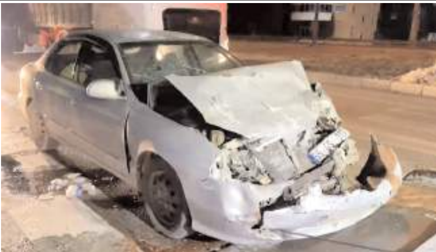
Kaza, Ankara-Samsun karayolu Yaydığın kavşağında meydana geldi.

Kaza ile ilgili inceleme başlatıldı.