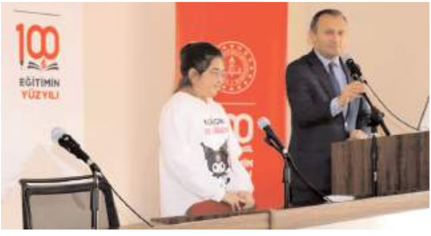
Toplantıda öğrencilerde görüşlerini açıkladılar.

İl Millî Eğitim Müdürlüğü Cemil Çağlar yaptığı konuşmada, "İl Millî Eğitim Müdürlüğü camiası olarak yaptığımız çalışmalarla ilgili bu toplantımızda siz değerli komisyon üyelerimizi bilgilendirerek, Türkiye Yüzyılına yakışır şekilde ilimizin eğitimini bulunduğu yerden daha ileriye nasıl götürebileceğimiz konusunda değerli katkılarınıza ihtiyacımız vardır. Millî Eğitim camiamız 91.243 öğrencisi, 6.917 öğretmeni, resmi ve özel toplam 678 okul ve kurumuyla Çorum ilinin en büyük ailesidir. Fiziki olarak baktığımızda ilimizde ciddi bir sorun gözükmemekle birlikte muhtelif sorunların çözümüyle ilgili yol haritaları belirlenerek çözüm odaklı çalışmalarımız devam etmektedir. İlimizin eğitim kalitesinin daha ileriye gideceğinden de eminiz" dedi.