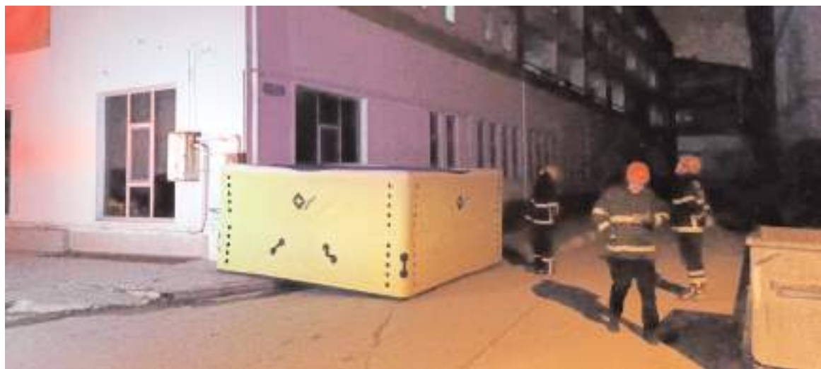
Olay yerinde hava yastığı açıldı.