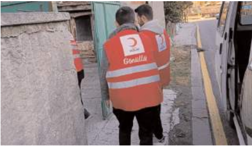
Yardım kolilerini gönüllüler ailelere ulaştırdı.