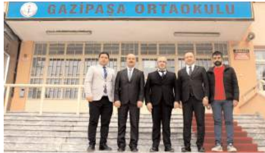
Proje Çorum Eczacı Odası ile İl Milli Eğitim Müdürlüğü hayata geçirdi.