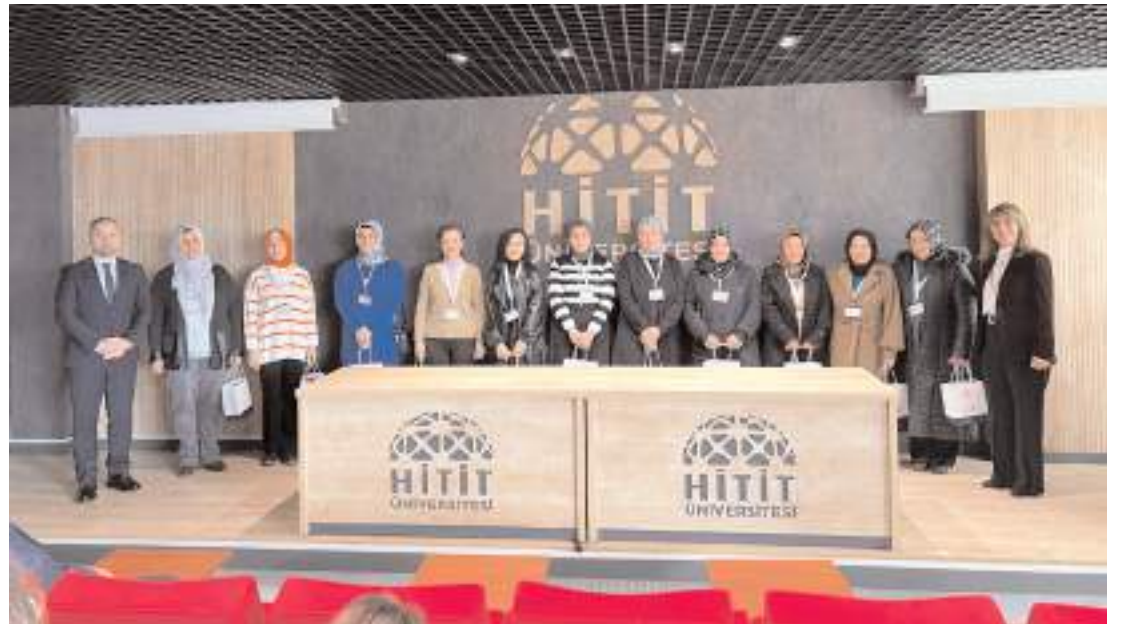
Eğitimlerde aile içi iletişim, eşler arası ve çocuklarla iletişim hakkında bilgiler verdi.