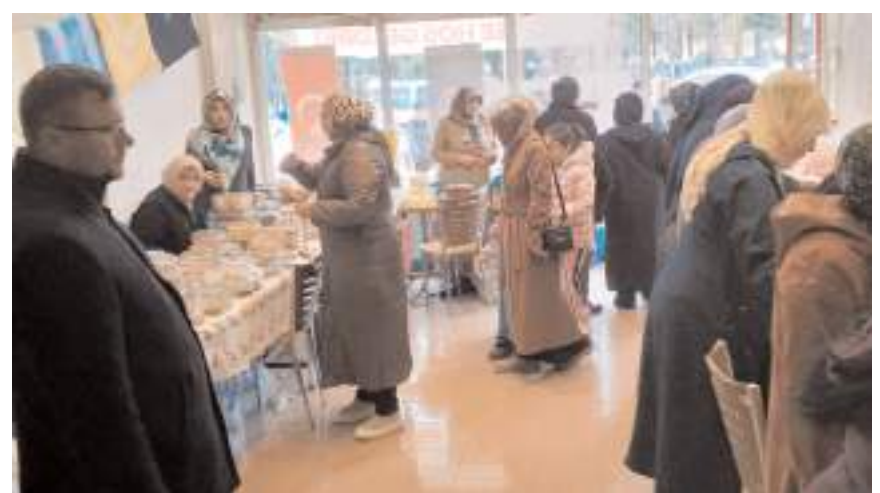
İskilip Müftülüğünce ilçe merkezindeki 2 ayrı iş yerinde açılan kermeste çeşitli yöresel ürünler, yiyecek ve kıyafetler satışa sunuldu.

ler, yiyecek ve kıyafetler satışa sunuldu. İskilip Müftüsü Şuayip Güllü, AA muhabirine yaptığı açıklamada, İsrail'in saldırıları nedeniyle mağdur olan Filistinlilere destek olmak amacıyla kermes düzenlemeye karar verdiklerini söyledi.