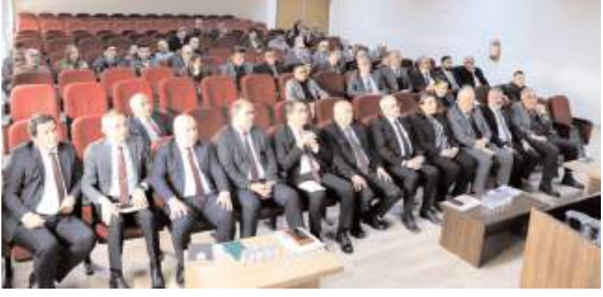
Toplantıda eğitim öğretim çalışmaları değerlendirildi.