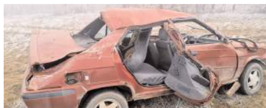
Kazada araç hurdaya döndü.