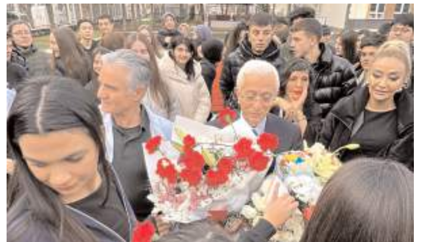
Uğurlama töreninde duygulu anlar yaşandı.