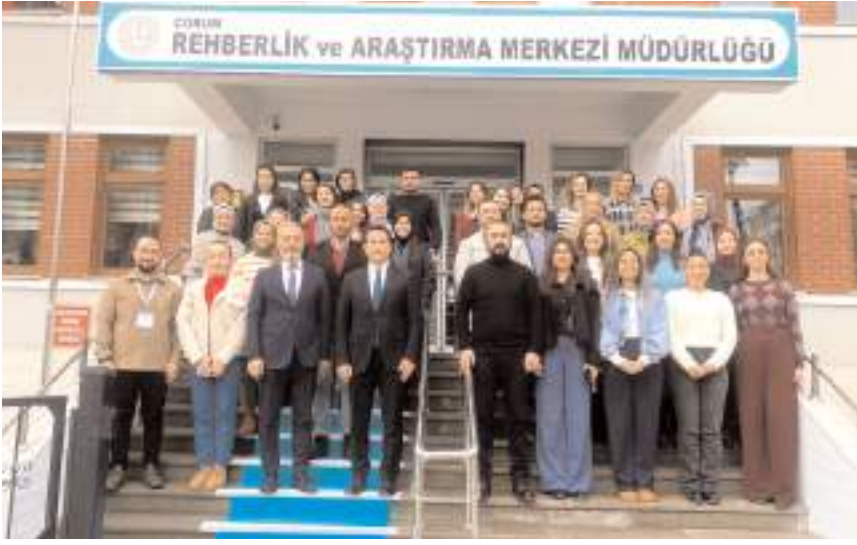
Eğitimin sonunda hatıra fotoğrafı çekildi.