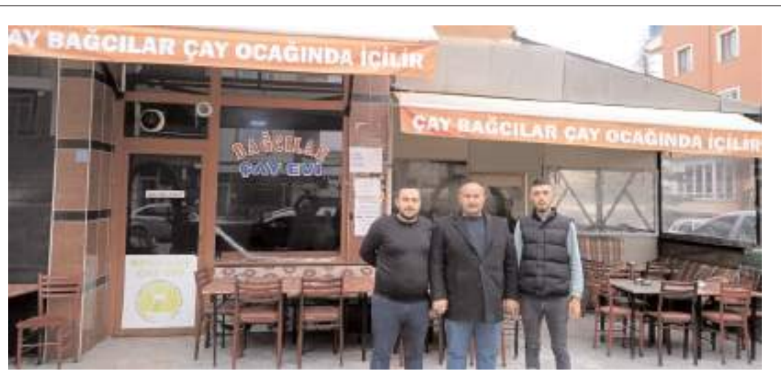
Çay Ocağı Gülabibey Mahallesi Bağcılar Caddesinde faaliyet gösteriyor.