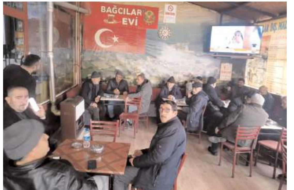
Bağcılar Çay Ocağı, tavşan kanı çayıyla çay sevenlerin durağı oldu.