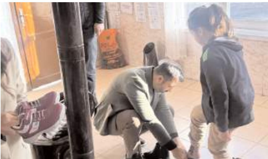
Öğrencilere bot hediye edildi.