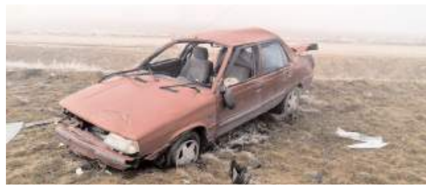
Kaza Haydar köyü yakınlarında meydana geldi.