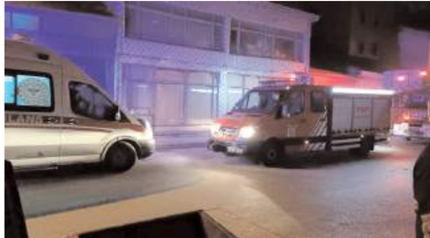
Olay yerinde sağlık ve itfaiye ekipleri tedbir aldı.