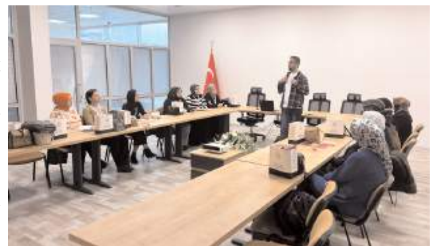
"Altın Bilgi Günleri" 6 hafta sürecek.