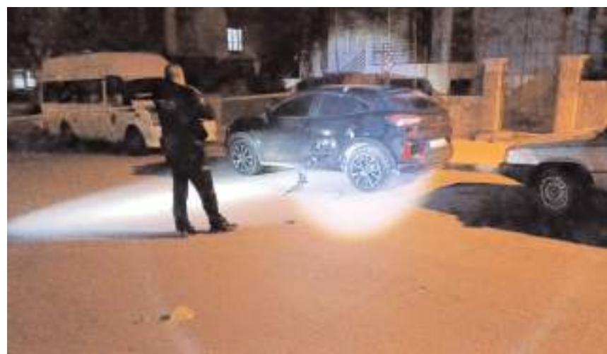
Olay, Kale Mahallesi Gelincik 1. Sokak'ta meydana geldi.

■ Çorum'da park halindeki bir araca kimliği belirsiz kişi ya da kişiler tarafından defalarca silahla ateş edildi. * HABERİ'3'DE