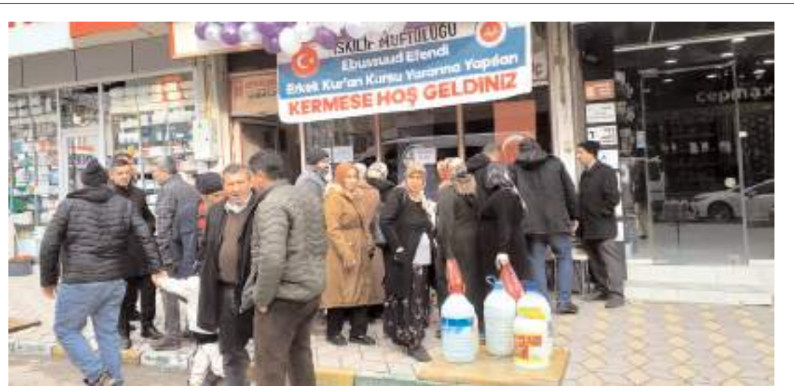
Kermeslere vatandaşların ilgisi yüksek oldu.