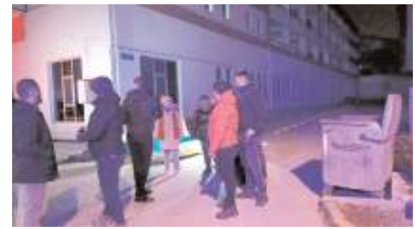
Olay, Çepni Mahallesi Kubbeli 2. Sokak'ta meydana geldi.