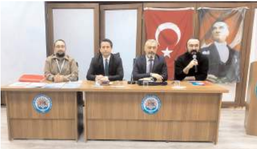
Eğitim Rehberlik Araştırma Merkezi'nde yapıldı.