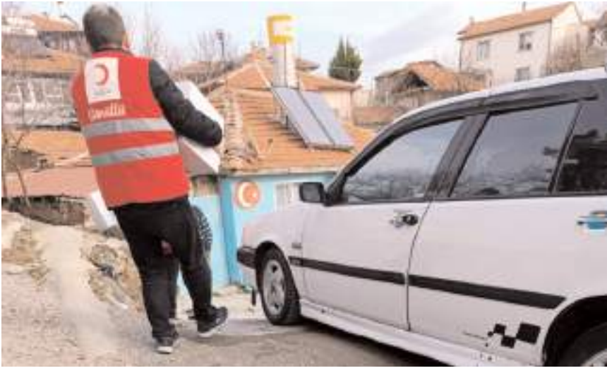
Kızılay 65 aileye 130 yardım kolisi dağıttı.