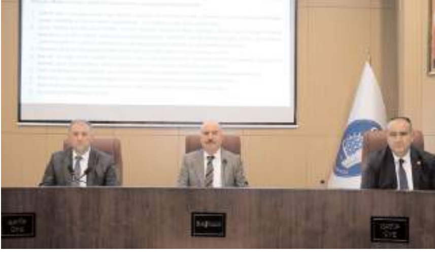
Çorum İli Sahipsiz Hayvanları Koruma Birliğinin Aralık ayı olağan meclis toplantısı gerçekleştirildi.

■ Çorum İli Sahipsiz Hayvanları Koruma Birliği tarafından oluşturulacak olan hayvan bakımevleri ve doğal yaşam alanları projelendirme ve ihale aşamasına geldi. * HABERİ'6'DA