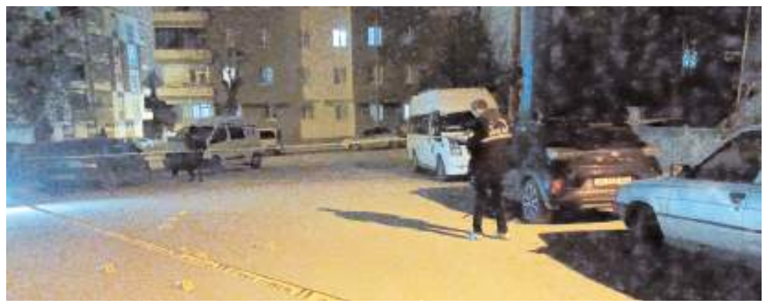
Olay, Kale Mahallesi Gelincik 1. Sokak'ta meydana geldi.

Edinilen bilgiye göre, İl Jandarma Komutanlığı ekipleri tarafından, Çankırı'da 3, Çorum'da 6 ve Ankara'da 2 olmak üzere toplam 11 faili meçhul hırsızlık olayını gerçekleştirdikleri tespit edilen 3 şahıs için harekete geçildi. Yapılan operasyonlarda 17 noktadan elde edilen 102 saatlik kamera görüntülerinin incelenmesi neticesinde kimlikleri tespit edilen şahıslar yakalanarak gözaltına alındı. Adliyeye sevk edilen şahıslar çıkarıldıkları mahkemece tutuklandı. (İHA)