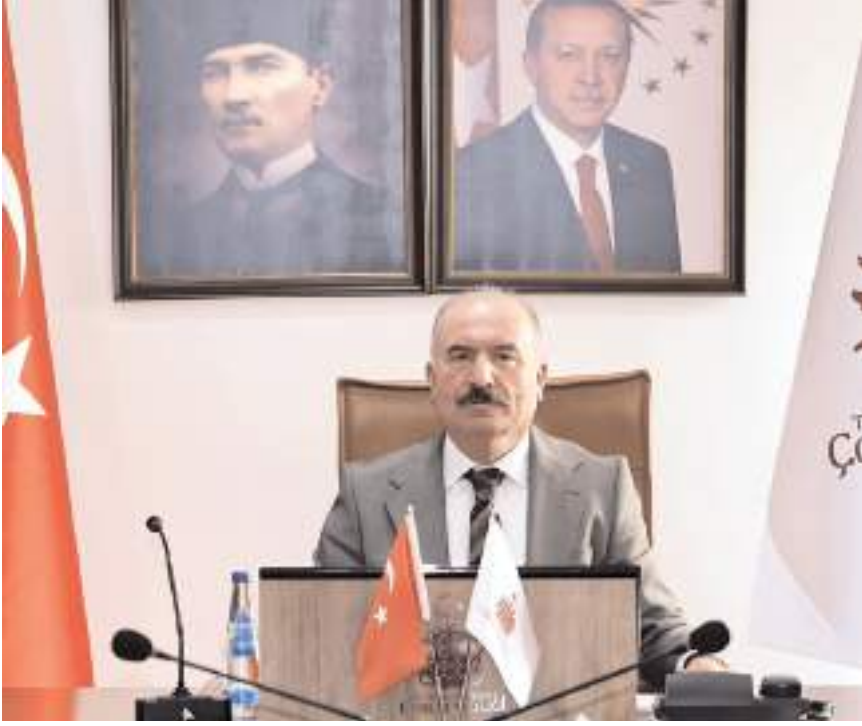
Toplantı Vali Ali Çalgan'ın başkanlığında yapıldı.