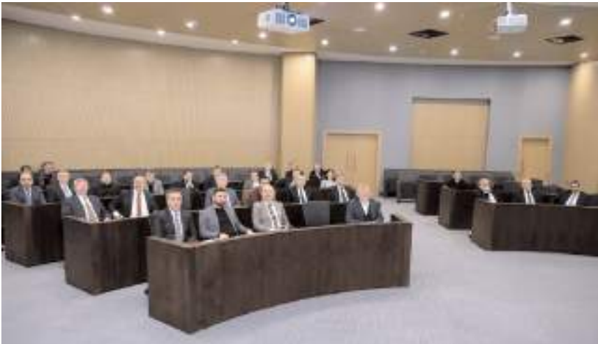
Toplantıda gündem maddeleri görüşülerek karara bağlandı.