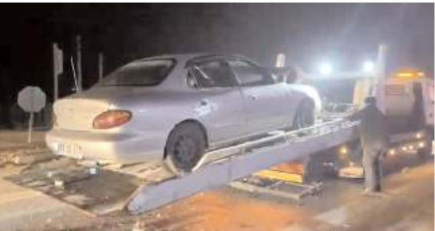
Araçlar çekici ile kaza yerinden kaldırıldı.