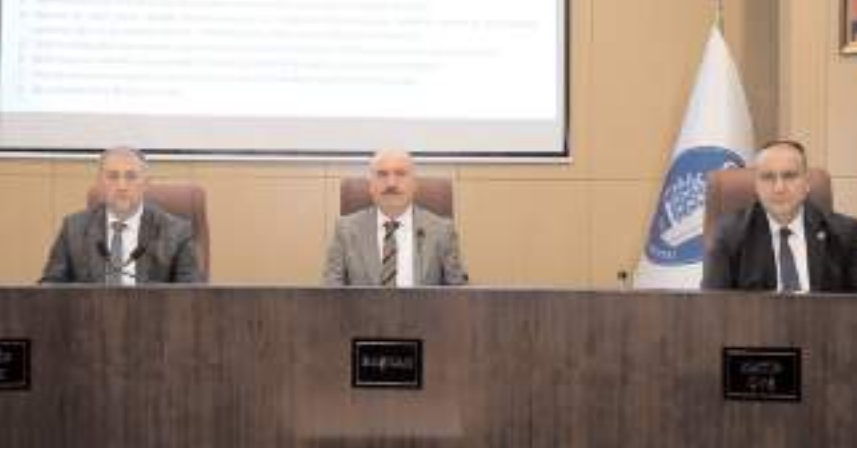
Çorum İli Sahipsiz Hayvanları Koruma Birliğinin Aralık ayı olağan meclis toplantısı gerçekleştirildi.

Birliğimizce bugüne kadar yapılan çalışmalarla, ülke genelinde ciddi bir probleme dönüşen sahipsiz sokak hayvanları sorununu hem insan sağlığını hem de hayvan haklarını bir arada gözeterek bütüncül bir yaklaşımla çözüme gayretini içersindeyiz. Bu sorun mahiyeti itibarıyla yalnızca kamu tedbirleri ile çözülemeyeceğinden toplumun tüm kesimlerinin sağduyu çerçevesinde bu çalışmalarda sorumluluk üstlenmesi büyük bir önem arz etmektedir." (Haber Merkezi)