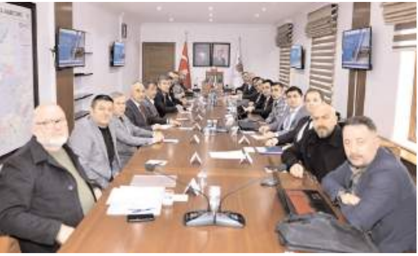
Toplantıya resmi kurumların temsilcileri ile esnaf temsilcileri katıldı.