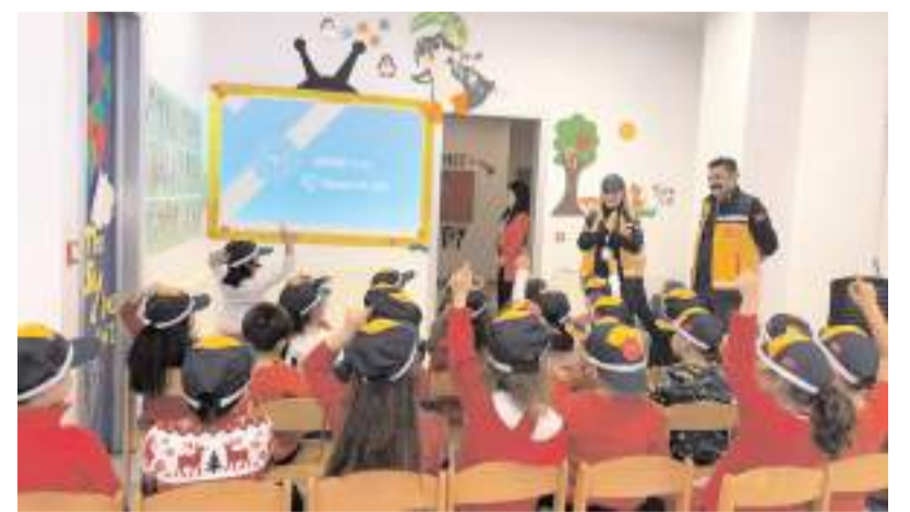
İl Ambulans Servisi Başhekimliği personeli, 112 Acil Sağlık Hizmetleri hakkında öğrencilere bilgi verdi.

Eğitim sonunda ayrıca ambulansın iç donanımını hakkında da bilgilendirme yapıldı.