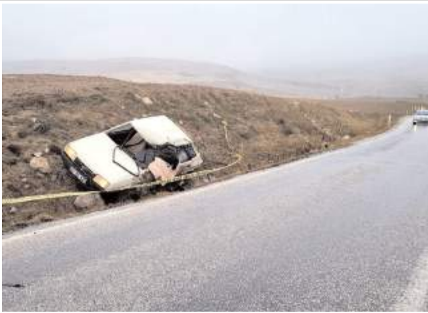
Kaza Alaca-Zile kara yolu Çopraşık köyü yakınlarında meydana geldi.