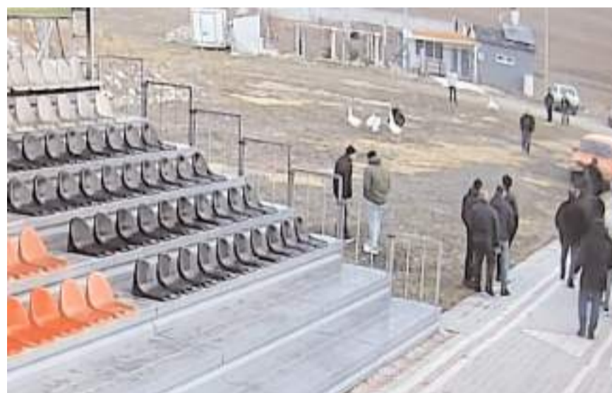
Kaz dövüşü İlçe Stadyumu'nda tribünlerin arkasında yapıyordu.