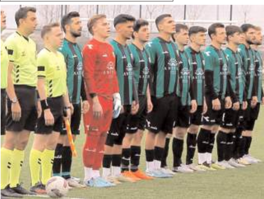
Mimar Sinanspor Çarşambaşpor maçının serenomisinde hakemler ile birlikte

Maçın ardından memleketlerine giden futbolcular cuma günü Çorum'da toplanarak ikinci yarı hazırlıklarına başlayacaklar. Ligde iki haftalık aranın ardından ikinci yarı 19 Ocak pazar günü oynanacak maçlarla başlayacak. Mimar Sinanspor ikinci yarının ilk maçında grubun şampiyonluk adaylarından Çankırı FK ile deplasmanda karşılaşacak.