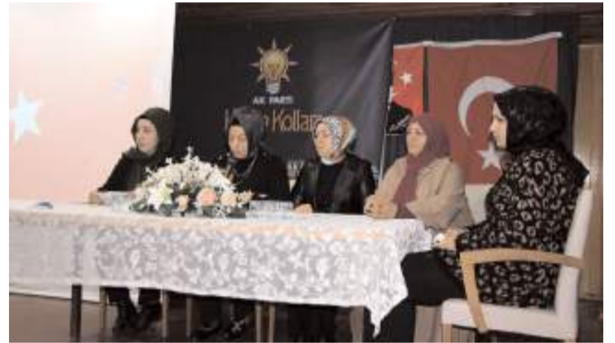
Kongrede ilk olarak divan heyeti belirlendi.