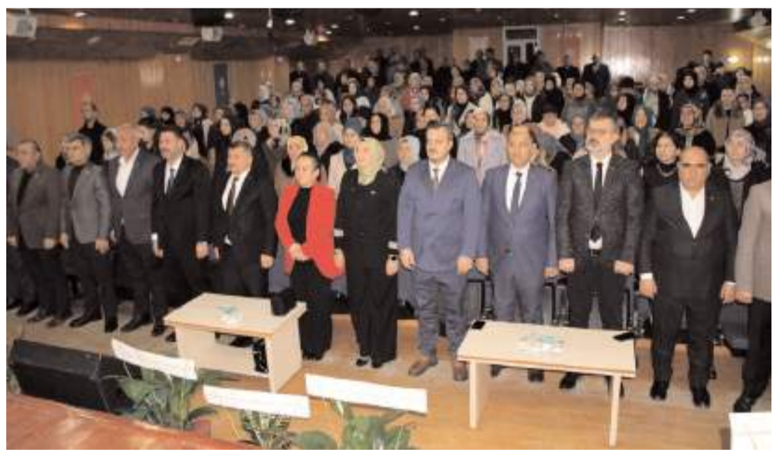
Kongreye katılım yüksek oldu.