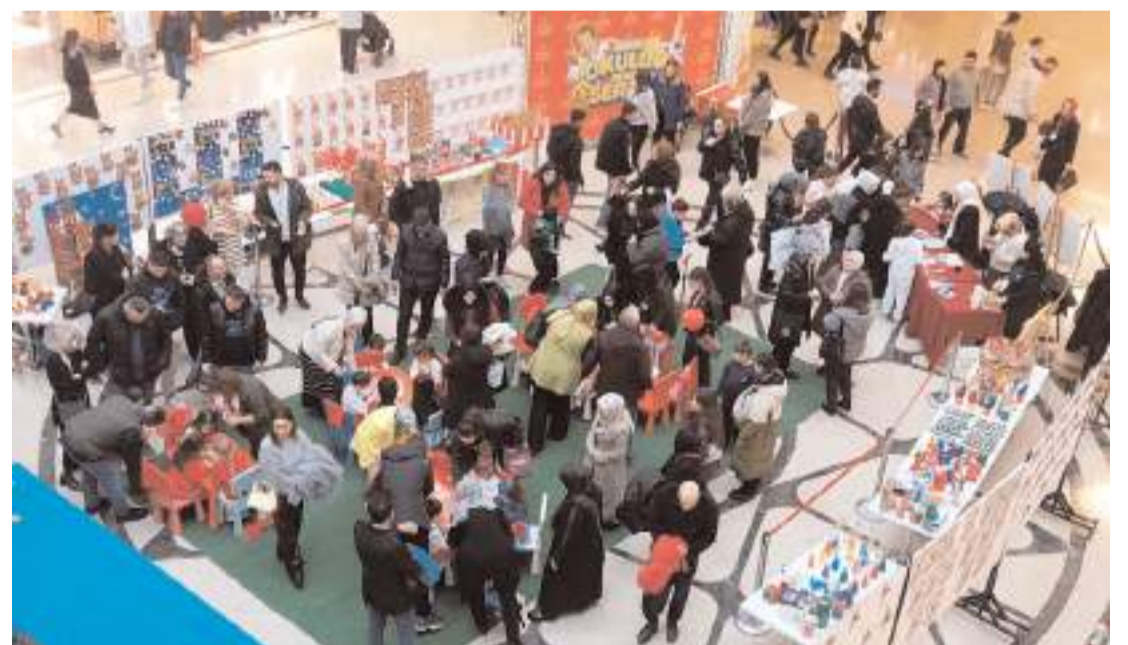
Etkinlik AHL Park AVM'de gerçekleştirildi.