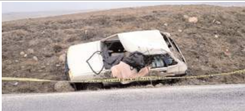
Kaza Alaca-Zile kara yolu Çopraşık köyü yakınlarında meydana geldi.