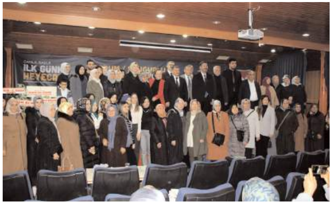
Kongrenin sonunda toplu hatıra fotoğrafı çekildi.

Sağlıklı Hayat Merkezlerinde görevli sorumlu hekim ve diyetisyen, herhangi bir sağlık kuruluşunda 90 gün içerisinde yapılmış olan tahlil ve tetkik sonuçlarını, kullandıkları sağlık bilgi yönetim sistemi ekranları üzerinden görüntüleyebileceklerdir. Vatanadaşlar tüm sonuçlarını kendi e-Nabız profillerinde görüntüleyebileceklerdir. Birinci, ikinci ve üçüncü basamak sağlık hizmetlerinin dijital entegrasyonu aracılığıyla yeni eklenecek hizmet türleri (tetkik, görüntüleme, danışmanlık vb.) sağlık bilgi yönetim sistemi vasıtasıyla sisteme otomatik entegre edilebilecek olup il sağlık müdürlükleri, hastaneler ve birinci basamak tesislerinde bu güncellemeler takip edilerek hizmetlerin devamlılığı sağlanacaktır." (Haber Merkezi)