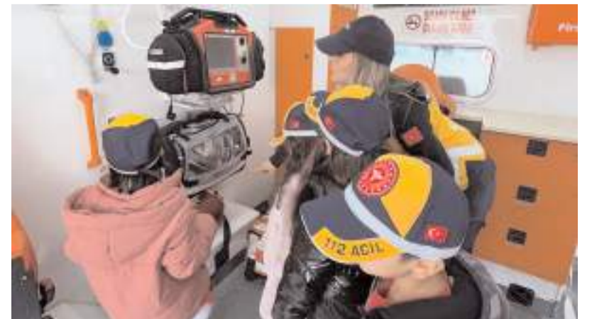
Öğrenciler ambulansı gezerek yakından görme fırsatı buldular.