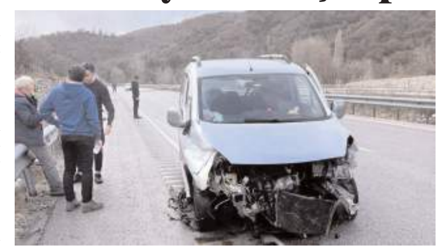
Kaza Koparan'da meydana geldi.

sürücüsü olay yerine gelen sağlık ekiplerinin ilk müdahalesinin ardından hastaneye kaldırılarak tedavi altına alındı.