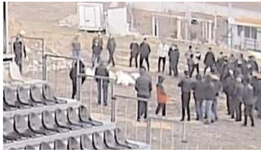
Kimlikleri belirlenen 70 kişiye 7 bin 216'şar lira ceza kesildi.

Çorum'un Alaca ilçesinde kaz dövüşü yaptırdığı belirlenen 70 kişiye 7 bin 216'şar lira idari para cezası uygulandı.