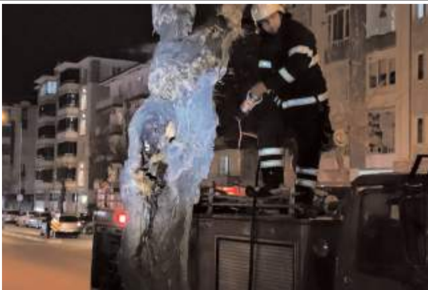
İtfaiye ekipleri ağaç kül olmadan yangını söndürdü.