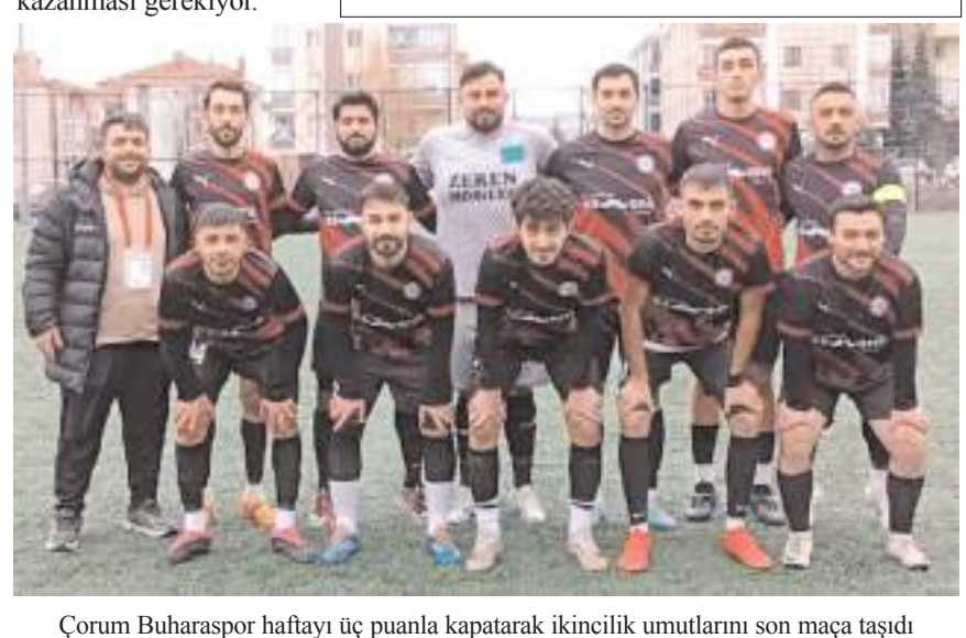
Çorum Buharasper haftayı üç puanla kapatarak ikincilik umutlarını son maça taşıdı