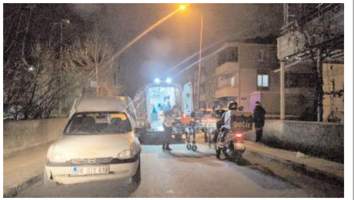
Olay Kale Mahallesi Meram 4. Sokak'ta meydana geldi.