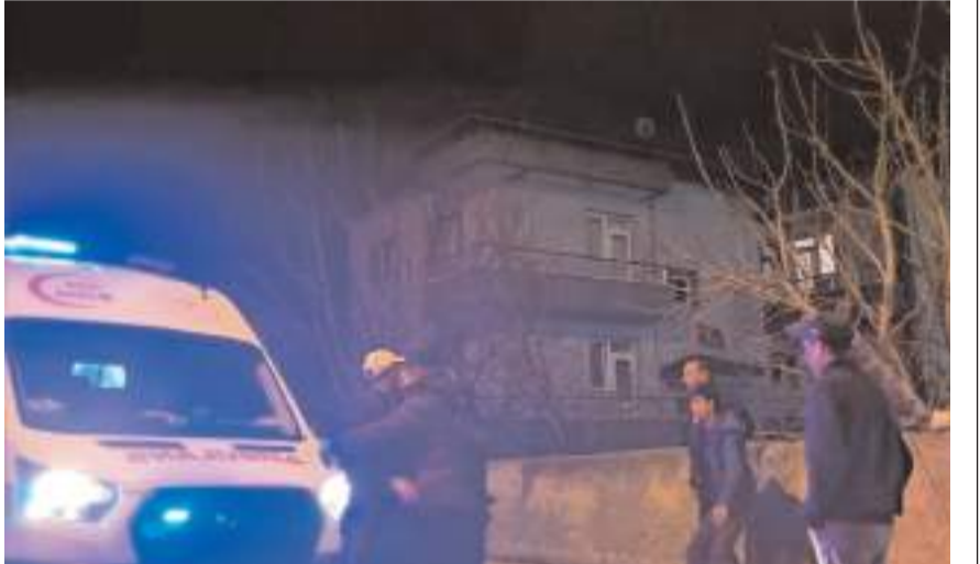
Kavgada 1 kişi yaralandı.

Yaralı, sağlık ekiplerince yapılan müdahalenin ardından Hitit Üniversitesi Erol Olçok