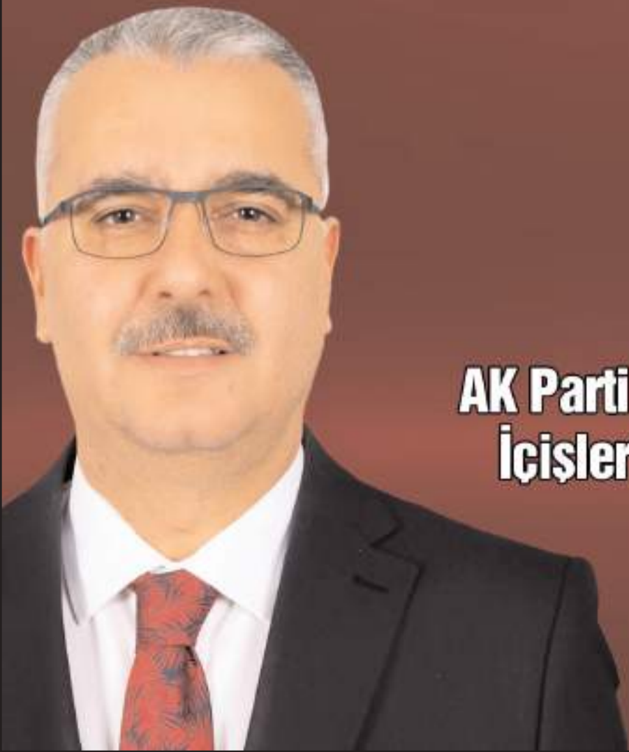
AK Parti Çorum Milletvekili İçişleri Komisyon Üyesi

Yeni Yılınızı Tebrik Eder, 2025 Yılıının Çorumumuza ve Ülkemize Hayırlara Vesile Olmasını Dilerim.