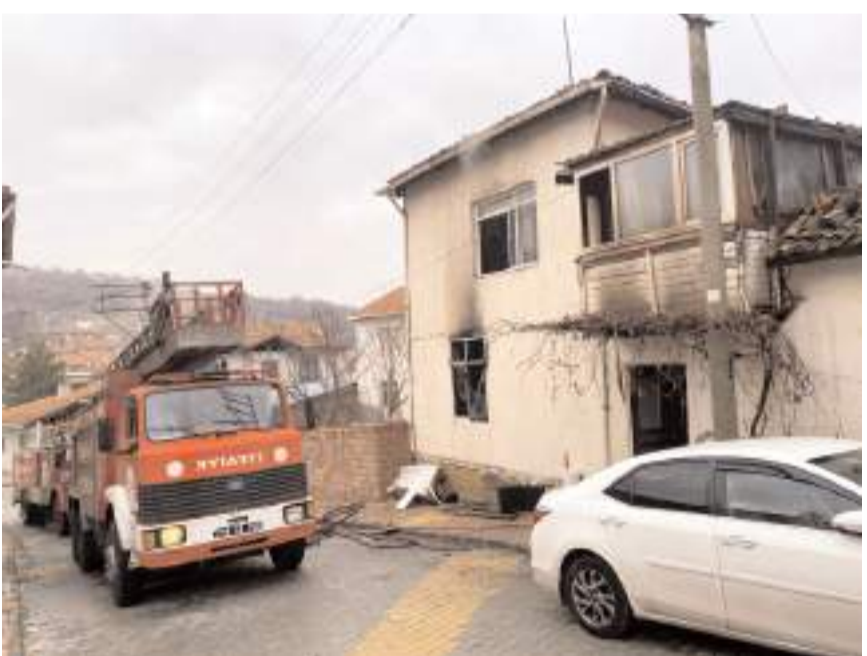
Olay Mecitözü Camikebir Mahallesi'nde bir evde meydana geldi.