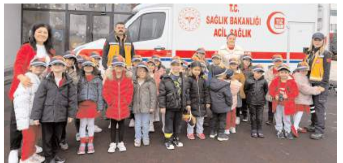
İl Ambulans Servisi Başhekimliği personeli, öğrenciler ile bir araya geldi.