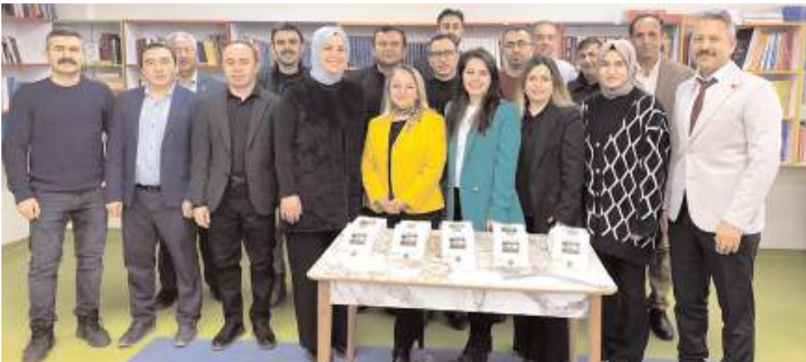
Kitapta 20 öğretmenin imzası var.