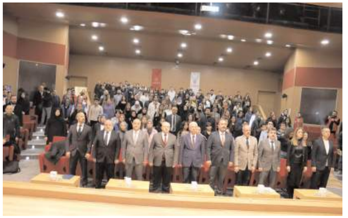
Çalıştay MYO Ethem Erkoç Konferans Salonunda yapıldı.

gençler ve kadınlar olmak üzere, çiftçiyle, emekliyle, esnafla, sanayiciyle, apartman görevlileriyle, devlete bağlı namuslu bürokratlarla el ele vereceğiz. Güzel Cumhuriyetimizi demokrasiyle taçlandırmak üzere çıktığımız bu yolda, inanıyorum ki, milletimizle birlikte zafere ulaşacağız. 2025, umudun, birlikteliğin, barışın, ekonomik refahın, barışın onuruna yaraşır bir yaşamın yılı olacak. 2025, demokrasi zaferinin yılı olacak. 2025, liyakatin, şeffaflığın, kuvvetler ayrılığının, kirlilikten arınmış namuslu siyasetin yılı olacak. 2025 yılı dili, dini, rengi, ırkı, mezhebi fark etmeksizin şanlı Türk bayrağı altında birleşenlerin, 'Yaşasın tam bağımsız Türkiye' diyen gerçek vatanseverlerin yılı olacak. Cumhuriyetimizi demokrasi ile taçlandırdığımızda, milletimiz demokrasi ve hukukun üstünlüğüyle; çiftçimiz tarlasıyla; evlatlarımız bilimle, çağdaş ve laik eğitimle buluşacak. Biz inandık, halkımız da inansın. Yeni yıl tüm ülkemize sağlık, mutluluk ve refah getirsin. Başta Çorum olmak üzere Türkiye ve dünyanın dört bir yanındaki hemşehrilerimin yeni yılını kutluyor, halkımıza esenlikler diliyorum." (Haber Merkezi)