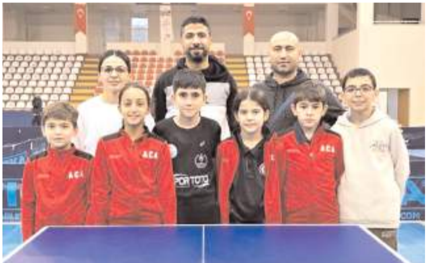
Şampiyonada mücadele eden Çorum Arenaspor sporcu ve antrenörleri toplu halde

Okul Sporları yıldızlar ve gençler A ve B kategorisi Kros il birinciliği Millet Bahçesinde yapıldı. Yıldızlar ve Gençlerde 90 sporcunun mücadele ettiği il birinciliğinde takımlarda dereceye giren okullara kupa ferdî kürsüye çıkan sporculara ise madalyaları verildi.