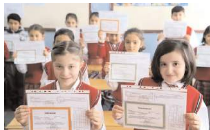
İlkokullarda karne uygulaması yerine gelişim raporu uygulamasına geçilecek.

"Özel okul ücretlerini takip ediyoruz. Eğitim