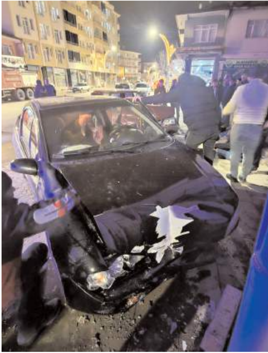
Kaza, Alaca ilçesi Çorum Caddesi'nde meydana geldi.

Çorum'un Alaca ilçesinde 2 otomobil çarpışması neticesinde meydana gelen kazada 3 kişi yaralandı.