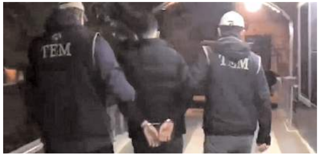
"Gürz-34" operasyonlarında 536 şüpheli örgüt üyesi yakalandı.

Polis ekipleri kazayla ilgili inceleme başlattı.