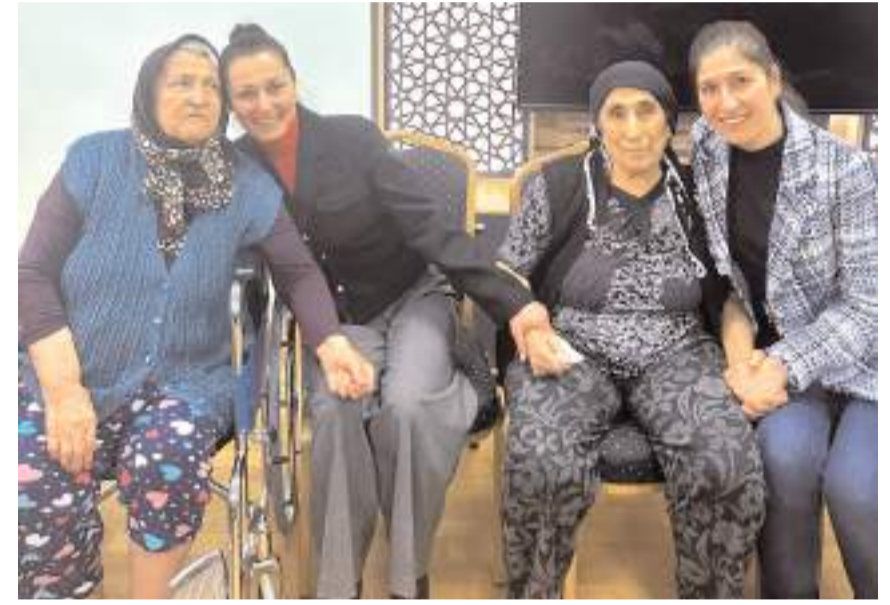
CHP'liler Huzurevi'nde yaşlıların yeni yılını kutladılar.

CHP Kadın Kolları yöneticileri tarafından düzenlenen etkinlikler kapsamında daha sonra ise Huzurevi ziyaret edilerek yaşlıların yeni yılını kutlandı. (Haber Merkezi)