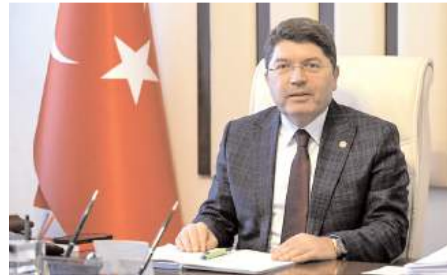
Adalet Bakanı Yılmaz Tunç

edecek. AK Parti Merkez İlçe Başkanlığı Kongresine katılacak olan Tunç, kongrenin ardından Ankara'ya hareket edecek. (Haber Merkezi)