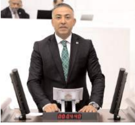
Milletvekili Mehmet Tahtasız

Sayıştay'ın 2023 yılı raporu doğrultusunda PTT ile ilgili tespitleri paylaşan Cumhuriyet Halk Partisi (CHP) Çorum Milletvekili ve KİT Komisyonu üyesi Mehmet Tahtasız, "2018 yılında Varlık Fonu'nda devredilen PTT deyim yerindeyse bir daha iflah olmadı. 184 yıllık köklü bir tarihi olan ve yaklaşık 3.150 şube ile 613 acenteye hizmet veren PTT göz göre göre batırılıyor. Asıl amacın PTT'nin zararlarını büyütürken özelleştirmek ol-