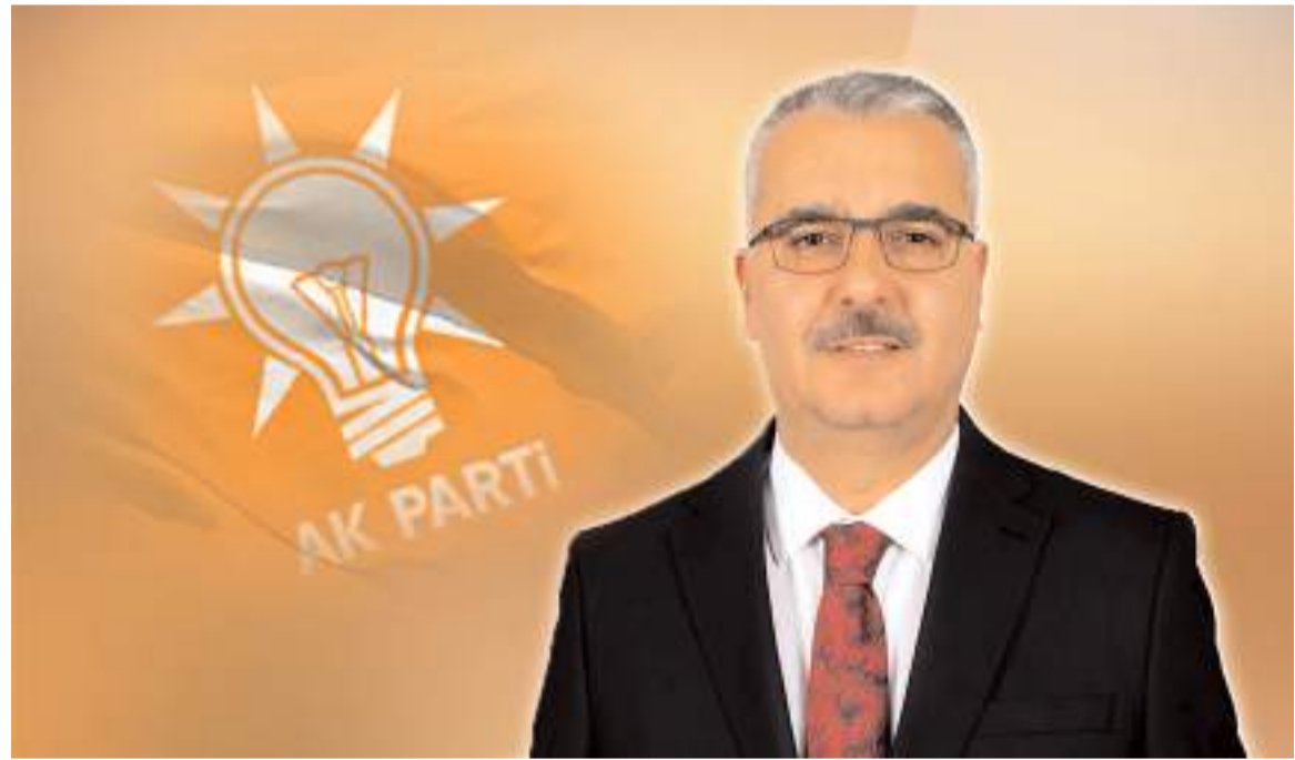
AK Parti Çorum Milletvekili Av. Yusuf Ahlatcı