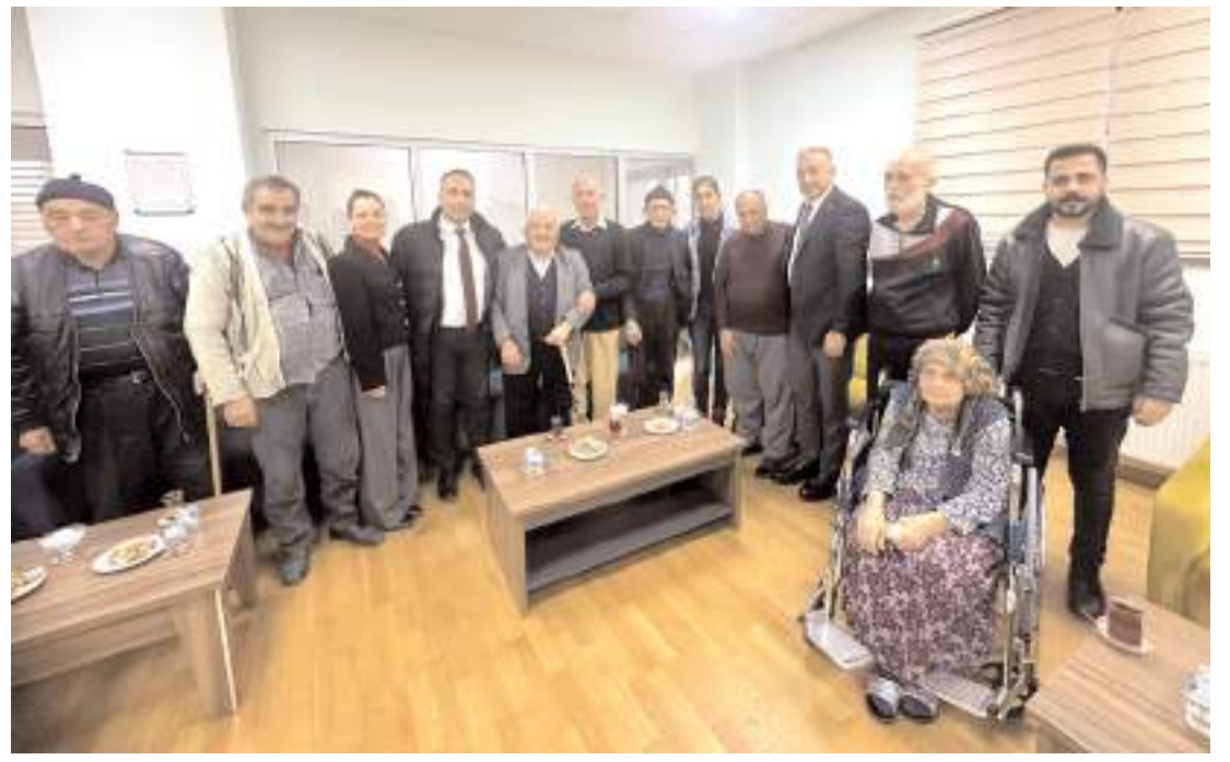
CHP'liler Huzurevi'ni ziyaret etti.