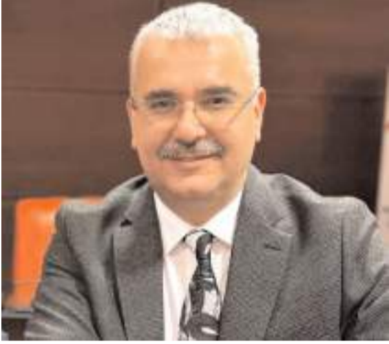
Milletvekili Av. Yusuf Ahlatıcı

"Bir yılı daha geride bırakırken, geleceğe dair bir adım atmanın heyecanını birlikte yaşıyoruz. Her yeni yıl geçmişte yaşananları hatırlamak, ders almak ve önümüze çıkan yeni yolları umutla karşılamak için bir fırsattır. Umut ve heyecanla karşıladığımız yeni yılda Çorum'unumuzun gelişmesi ve daha yaşanabilir bir şehir haline gelmesi için