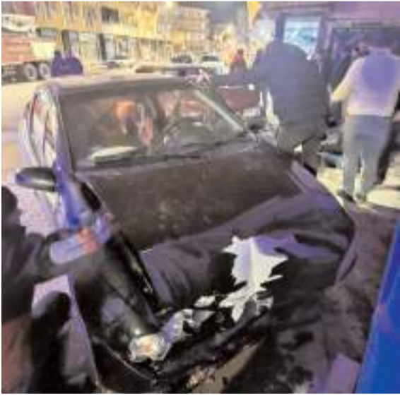
Kaza, Alaca ilçesi Çorum Caddesi'nde meydana geldi.