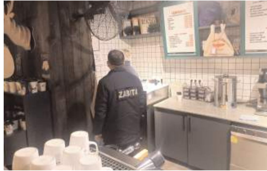
Kafe ve eğlence yerlerinin mutfak bölümlerinde hijyen denetimi yapıldı.

Denetimlerde tespit edilen olumsuzluk durumun-