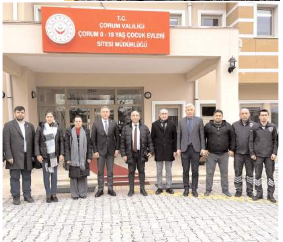
CHP heyeti Sevgi Evlerini ziyaret etti.