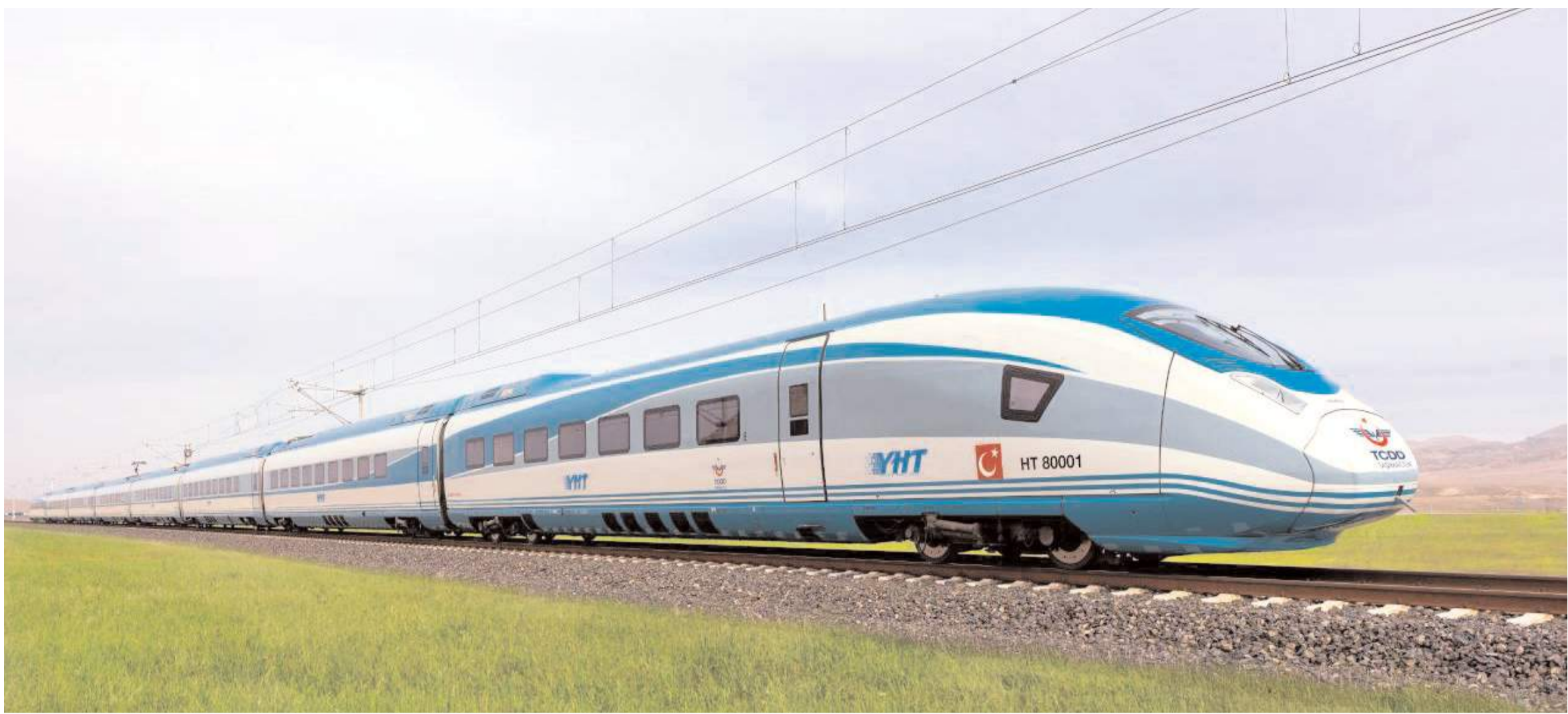
Delice-Çorum hızlı tren hattı ihalesi Demiryollar İşletmesi Genel Müdürlüğünde dün yapıldı.