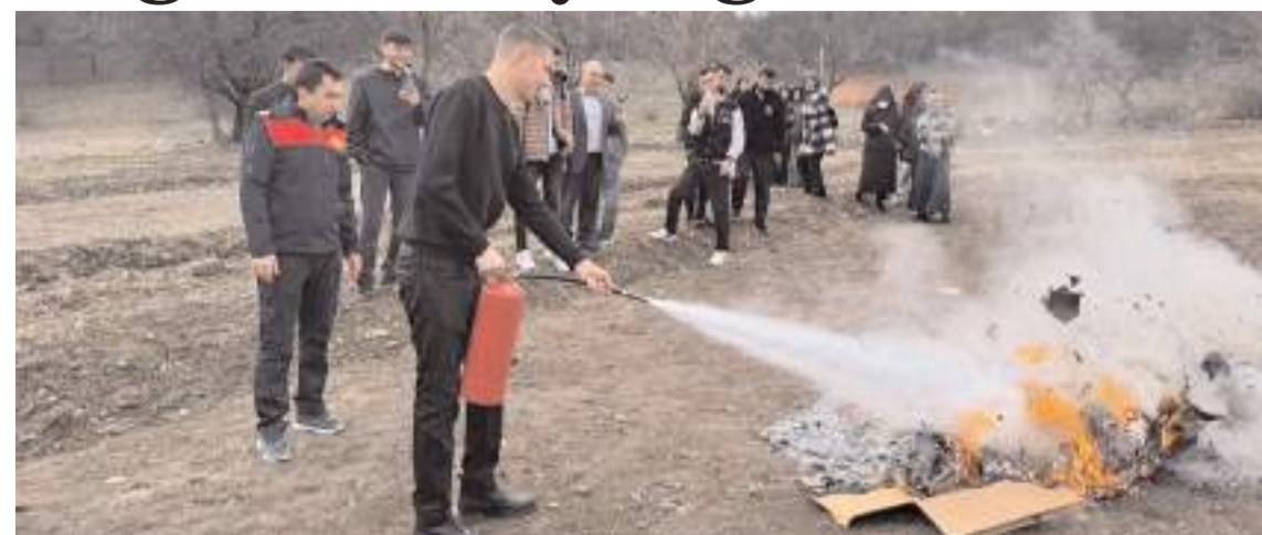
Tatbikatta yangınlara müdahale şekilleri uygulamalı olarak gösterildi.

Eğitimde olası bir afet durumunda nasıl hareket edilmesi gerektiği, afet öncesi ve sonrası gibi durumlar hakkında bilgiler verilirken, uygulamalı olarak gerçekleştirilen yangın tatbikatında öğrenciler yangına nasıl müdahale edecekleri konusunda bilgilendirildi.