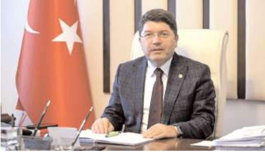
Adalet Bakanı Yılmaz Tunç

■ Adalet Bakanı Yılmaz Tunç 4 Ocak Cumartesi Çorum'a gelecek. * HABERİ 9'DA