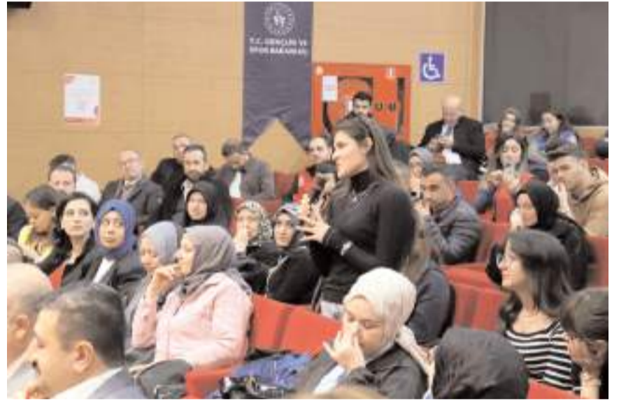
Çalıştayda gençler geleceğe yönelik beklentilerini dile getirdiler.

Afet Yönetimi ve Dayanıklılık, Bilim ve Teknoloji, Çevre ve İklim, Değer, Sosyal Kapsayıcılık, Eğitim ve Hayat Boyu Öğrenme, Gençlik Bilgilenmesi, Gençlik Sağlığı, İstihdam ve Girişimcilik, Uluslararası Gençlik Çalışmaları başlıkları altında 81 ilde gerçekleştirilen çalıştay, 11 politika alanı ve alt başlıkları çerçevesinde salon programı ve atölye