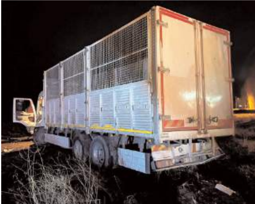
Kazada kamyonda maddi hasar meydana geldi.