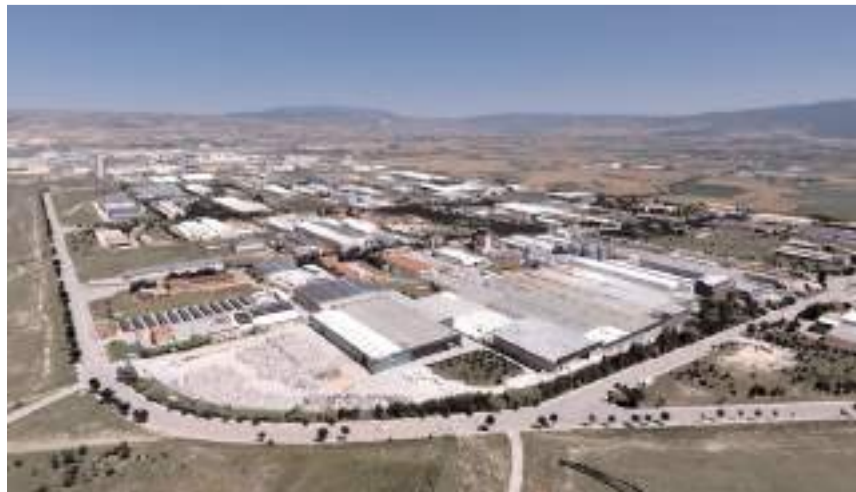
Çorum'un dış ticaret verilerinde ise Kasım ayında bir önceki aya göre düşüş yaşandı.