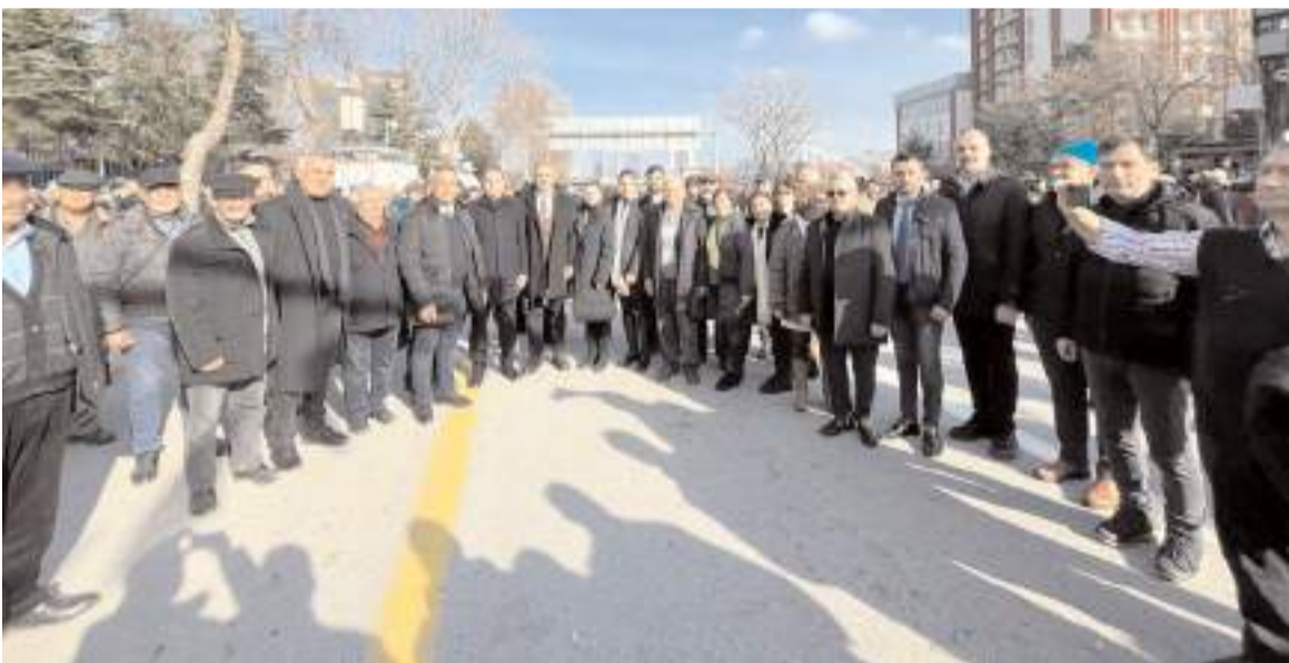
Mitinge Çorum CHP kalabalık bir ekiple katıldı.

Gençlik ve Spor Bakanlığı tarafından araştırma temelli çalışmalara dayanan politikaların gençlerin gelişimine katkıda bulunacak fırsatları sunmasının yanında, ayrıca toplumun sürdürülebilir kalkınmasına da katkı sağlamayı hedefleyen çalıştaylarla, ayrıca gençleri toplumsal yapının güçlü bir parçası haline getirmeyi amaçlayan kapsamlı bir yol haritası sunarken, ülkemiz gençlerine yönelik ulusal politikaların şekillenmesinde gençlerin aktif katılımını sağlamak ve görüşlerini doğrudan politika geliştirme sürecine dahil etmek amaçlanıyor. (Haber Merkezi)