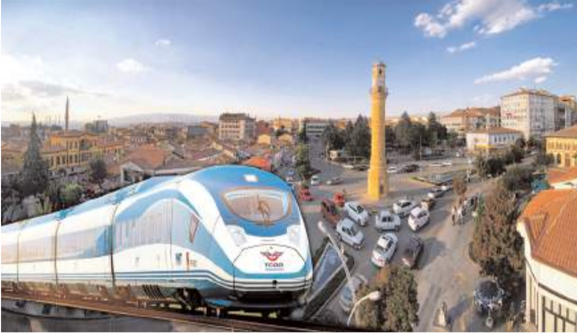
Yapılacak olan değerlendirmenin ardından ihalenin sonucu açıklanacak.