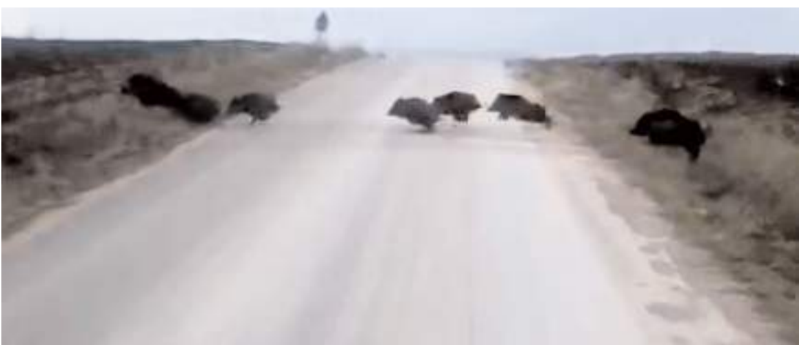
Yolun karşısına geçen domuz sürüsü şaşkınlığa neden oldu.

sonucudur. Hele bu kendini bilmez yıllarca dinamitlemeye çalıştığı ama başaramadığı “Türk-Kürt kardeşliğini yeniden güçlendirmek” ten söz etme ve “yeni paradigma”dan bahisle kendini devletin meşru muhatabı görme cüreti akıl alır gibi değildir. Türkiye, ağırlaştırılmış müebbet hapse mahkum ettiği eli kanlı bir teröristin himmetine elbette muhtaç değildir. Böyle bir izlenim doğması kabul edilemez. Atatürkçü Düşünce Derneği olarak siyasi partilerimiz dahil tüm kurumlarımızdan devlet yönetiminin ciddi bir görev olduğu bilinciyle davranmalarını ve milletimizin duygularını incitecek, ulusal onurumuzu zedeleyecek karar ve uygulamalardan kaçınmalarını bekliyoruz. Türkiye Devleti, ülkesi ve milletiyle bölünmez bir bütündür ve büyükü Atatürk’ün dediği gibi, Türkiye Cumhuriyeti’ni kuran Türkiye halkına Türk Milleti denir.” (Haber Merkezi)