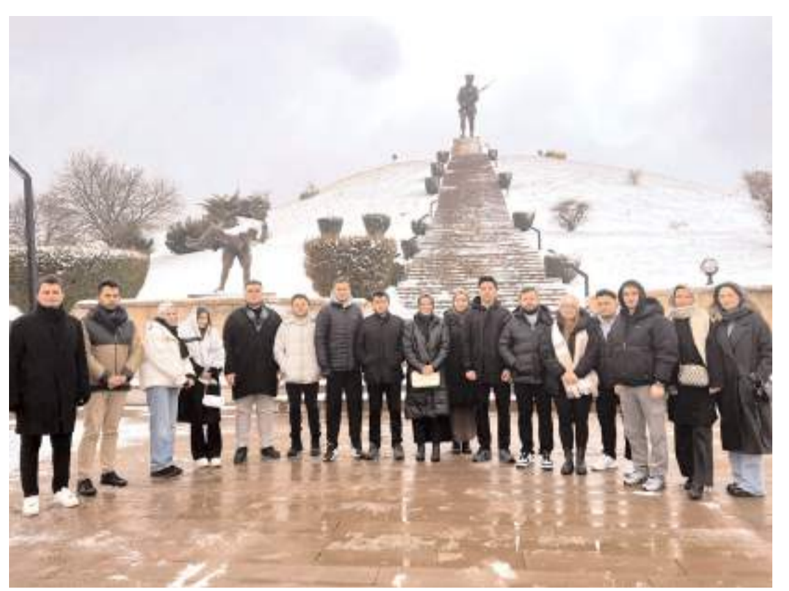
ÇESİAD’lı gençler ilçenin tarihi ve turistik yerlerini gezdi.

önüne domuz sürüsü çıktı. Seyir halindeki araç fark eden domuz sürüsü hızla yoldan geçerek bölgeden uzaklaştı. O anlar ise vatandaş tarafından cep telefonu ile görüntüldü. (İHA)