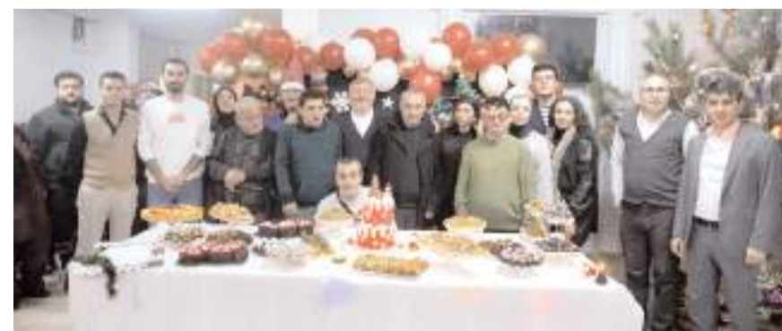
Yeni yıl yaş pasta kesilerek kutlandı.

Etkinlik, hatıra fotoğraflarının çekilmesi ve katılımcıların iyi dilek temennileriyle sona erdi.(AA)