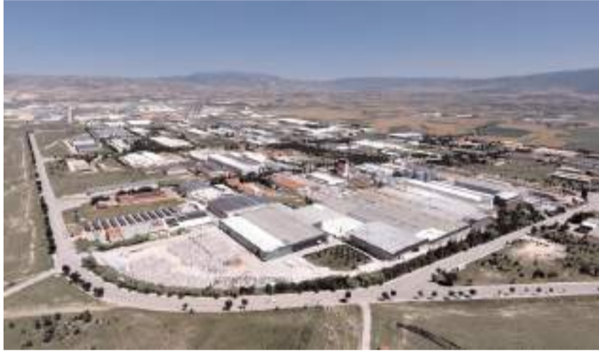
Çorum'un dış ticaret verilerinde ise Kasım ayında bir önceki aya göre düşüş yaşandı.