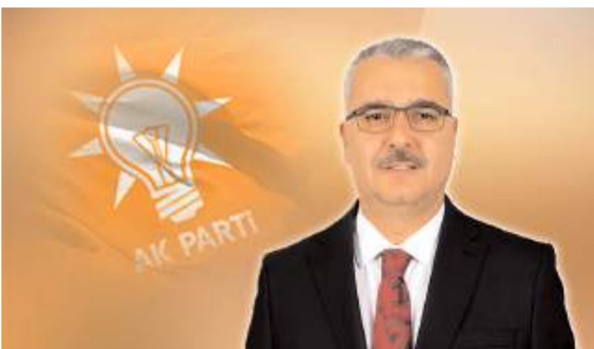
AK Parti Çorum Milletvekili Av. Yusuf Ahlatcı

■ Delice-Çorum hızlı tren hattı ihalesinin gerçekleştirilmesinin ardından açıklama yapan AK Parti Çorum Milletvekili Av. Yusuf Ahlatcı ihalenin haberini "yeni yılın ilk hediyesi" olarak duyurdu.