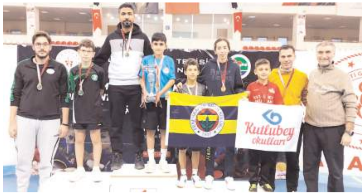
Minik U 11 en iyiler Türkiye şampiyonasında dereceye giren sporcular ödül töreninde kürsüde görülüyor