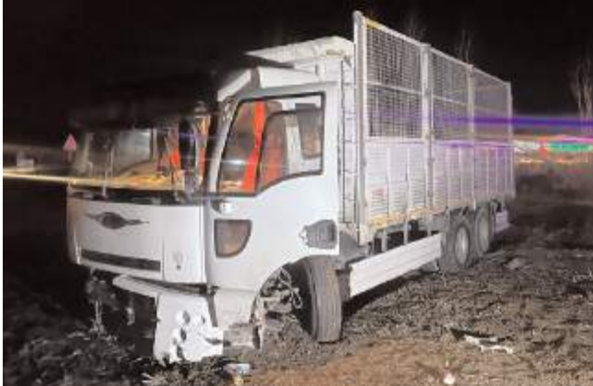
Kaza, Sungurlu ilçesi Çorum-Ankara karayolunda meydana geldi.

Kaza ile ilgili inceleme başlatıldı. (İHA)