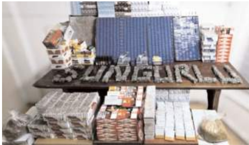
8 bin 104 gram kıyılmış kaçak tütün, 89 bin 120 dolu makaron, sigara sarma makineleri ve çeşitli gümrük kaçağı eşyalar ele geçirildi.

tesi, hukuk eğitimi, kaymakamlık süreci ve kaymakamlığın görev ve sorumlulukları hakkında öğrencilere bilgi verdi. Öğrencilerin sorularını da yanıtlayan Yüce, verimli bir eğitim hayatı geçirmelerini temenni etti.(AA)