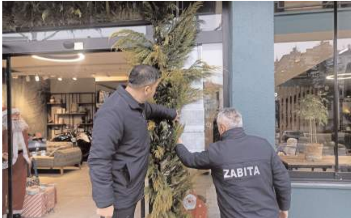
Çorum Belediyesi Zabıta Müdürlüğü ekipleri denetimlerde girişlerde ücret tabelası olup olmadığını kontrol etti.

mimiyetimle ifade etmek isterim ki belirlenen oranın üzerinde yapılacak zammın, getirisinden fazla götürüsü olacaktır. Yoksa aynı gemide bulunduğumuzu en iyi bizler biliyoruz. Önümüzdeki dönemde enerjimizin büyük bir bölümünü ekonomik gerekçelerle yayımlanmamış, elimizden giden veya gitmek üzere olan ilanlara harcamamız gerekiyor. Bu mesele, Kurumumuzun ve sizlerin bireysel gayretleriyle üstesinden gelinebilecek boyutu çoktan aşmış görünümde. Sektördeki meslek kuruluşlarına bir kez daha çağrıda bulunuyor; dalgaların kararı aşındırması misali resmî ilanların maalesef gün gün eridiğini hatırlatıyorum. Tüm bunları ifade ederken mesleğimiz adına asla kara tablo çizmiyoruz, aksine gerçekleri konuşmanın sorunun tespitine ve çözüm üretilmesine katkı sunacağımızı düşünüyorum. Ve her şeye rağmen önümüzdeki yıllarda mesleki anlamda çok daha nitelikli, ekonomik anlamda çok daha güçlü, dış etmenlere karşı çok daha dirençli yayınlara sahip olacağımıza inanıyoruz. Kurumumuz bundan önce olduğu gibi bundan sonra da sizlerin yanında olmayı; çoğulcu, katılımcı, akılcı hareket etmeyi ve istişare mekanizmasını işletmeyi sürdürücektir. Gelecek perspektifimiz ise tümüyle nitelikli ve istikrarlı gazeteler ile internet haber sitelerine kavuşmaktır. Bu duygu ve düşüncelerle yeni yılınızı tebrik ediyor; aileniz, sevdikleriniz ve çalışma arkadaşlarınızla birlikte geçireceğiniz mutlu seneler diliyorum. Saygılarımla." (Haber Merkezi)