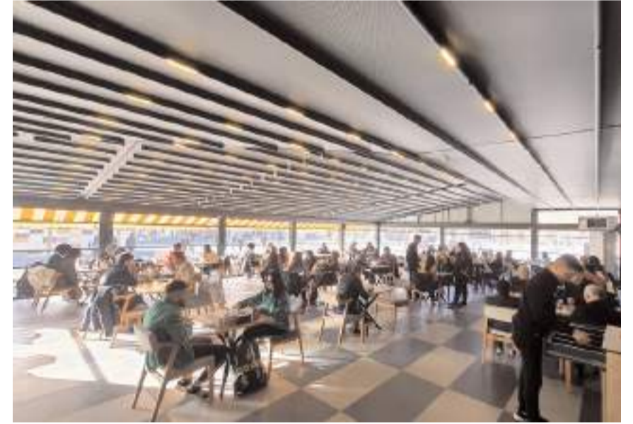
Çorum Belediyesi Sosyal Tesisleri 2024 yılı içerisinde 670 bin adıyla 2 milyon üzerinde ziyaretçi ağırladı.