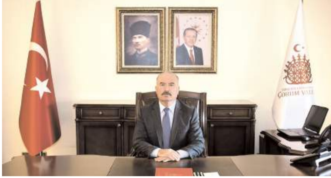
Çorum Valisi Ali Çalgan