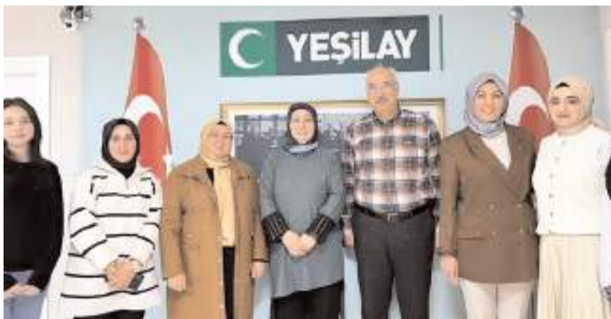
Çorum Genç Diyanet üyeleri öğrencilerle birlikte Yeşilay Çorum Şubesini ziyaret etti.