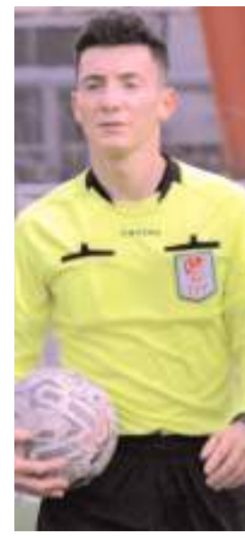
Ertuğrul Ramazan Boyraz Bölgesel'de devam