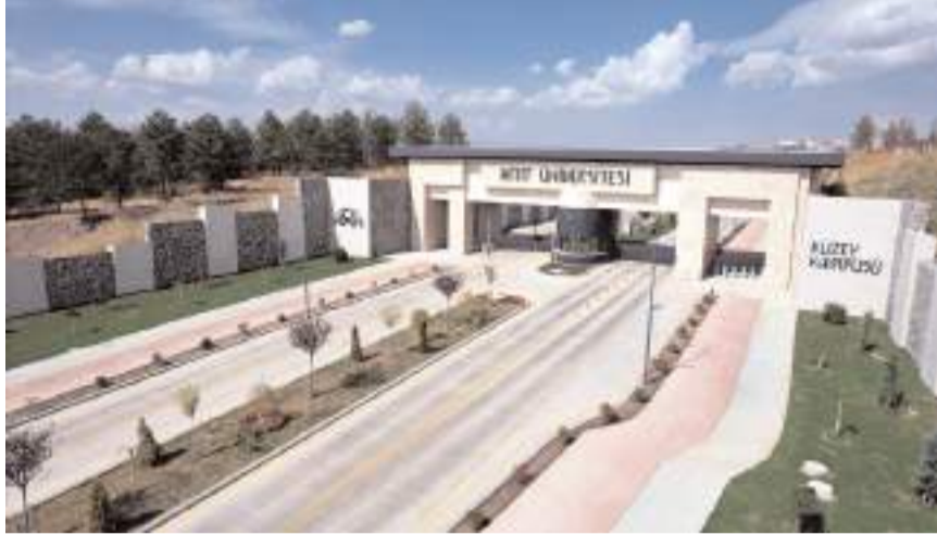
Hitit Üniversitesi, toplam 65 akademik personel alacak.