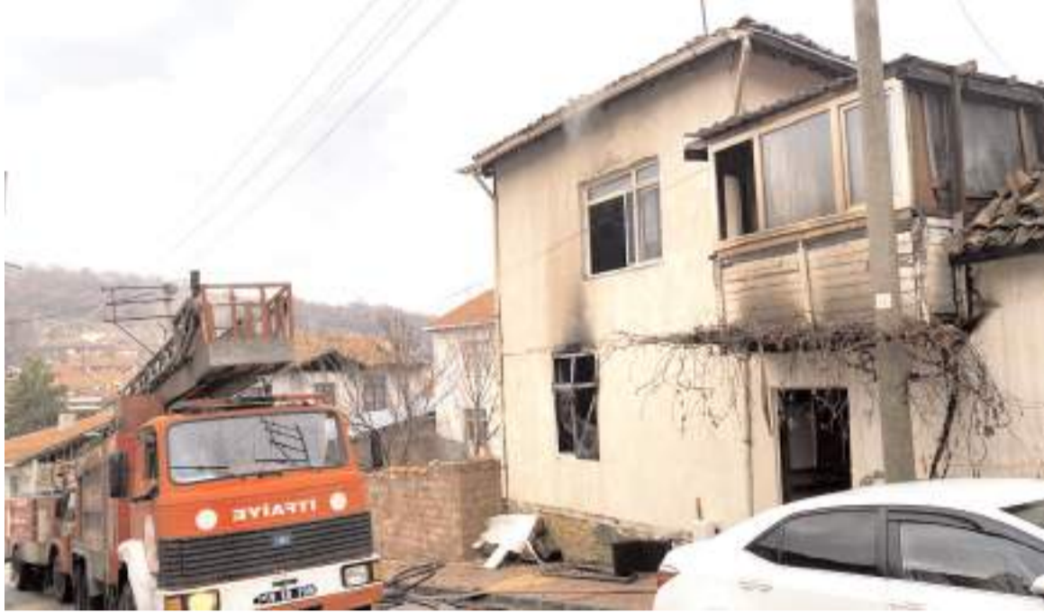
Olay 29 Aralık'ta Mecitözü'nde meydana gelmişti.

Günlerdir Hitit Üniversitesi Erol Olçok Eğitim ve Araştırma Hastanesi Yoğun Bakım Servisi'nde yaşam mücadelesi veren Astsubay Başçavuş, doktorların bütün müdahalelerine rağmen kurtarılamadı.