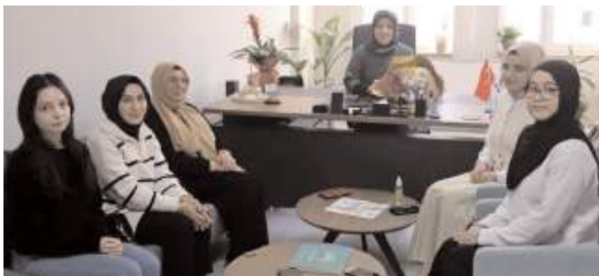
Gençler Yeşilay'ın faaliyetleri hakkında bilgi aldılar.