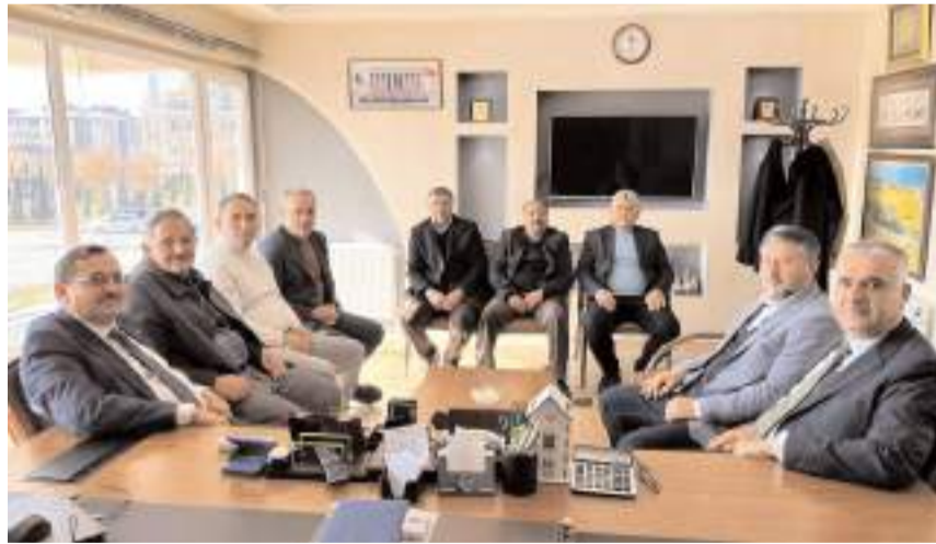
Milletvekili Av. Yusuf Ahlatcı, Çorum Ziraat Odasını ziyaret etti.

AK Parti Çorum Milletvekili Av. Yusuf Ahlatcı, Ziraat Odası, Esnaf ve Sanatkarlar Odaları Birliği ve Baro'yu ziyaret ederek, çiftçilerin ve esnafın taleplerini dinledi.