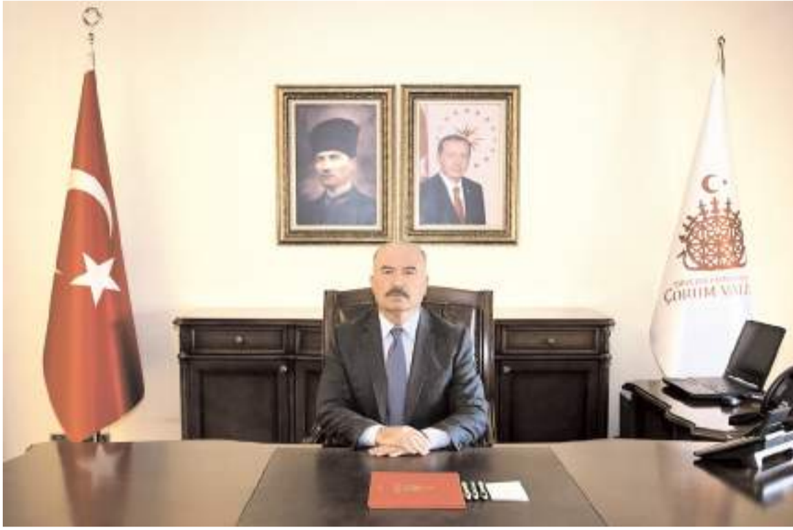
Çorum Valisi Ali Çalgan

İdarelerin, bu Kanuna göre yapılacak ihalelerde; saydamlığı, rekabeti, eşit muameleyi, güvenilirliği, gizliliği, kamuoyu denetimini, ihtiyaçların uygun şartlarla ve zamanında karşılanmasını ve kaynakların verimli kullanılmasını sağlamakla sorumlu oldukları, aralarında kabul edilebilir doğal bir bağlantı olmadığı sürece mal alımının, hizmet alımının ve yapım işlerinin bir arada ihale edilemeyeceği, eşik değerlerin altında kalmak amacıyla mal ve hizmet alımları ile yapım işlerinin kısımlara bölünemeyeceği, bu Kanuna göre yapılacak ihalelerde açık ihale usulü ve belli istekliler arasında ihale usulünün temel usuller olduğu, diğer ihale usullerinin Kanunda belirtilen özel hallerde kullanılabileceği, aynı Kanunun "İdarelerce Uyulması Gereken Diğer Kurallar"