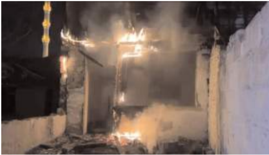
İtfaiye ekipleri yangını büyümeden söndürdü.