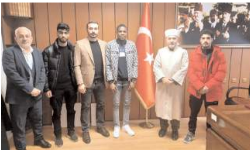
Günün anısına hatıra fotoğrafı çekildi.