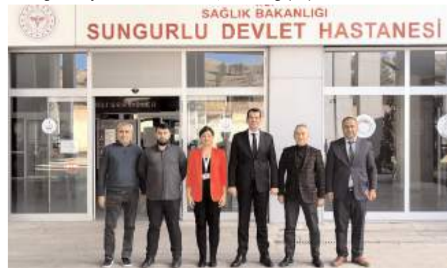
Ziyaretin ardından hatıra fotoğrafı çekildi.