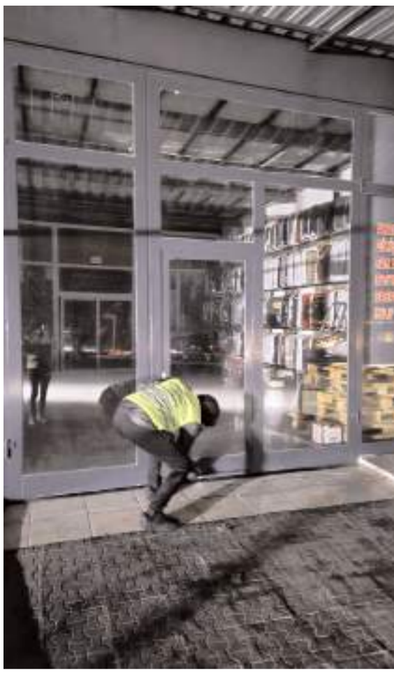
ÇOSAD yönetimi esnafra yılın ilk günü siftah parası bıraktı.