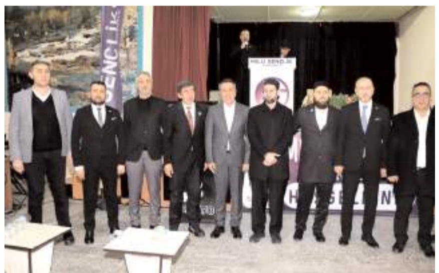
Programın sonunda toplu hatıra fotoğrafı çekildi.