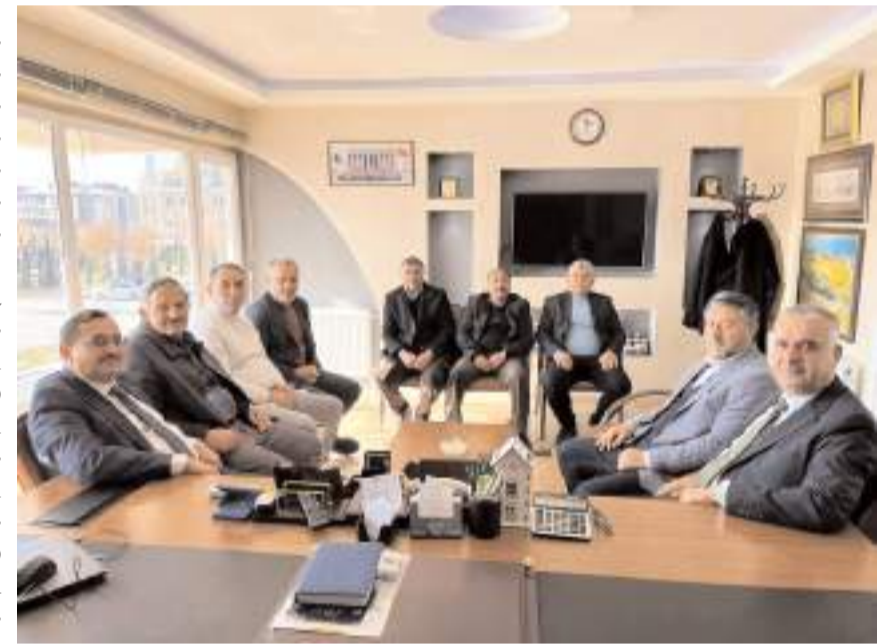
Milletvekili Av. Yusuf Ahlatcı, Çorum Ziraat Odası'nı ziyaret etti.