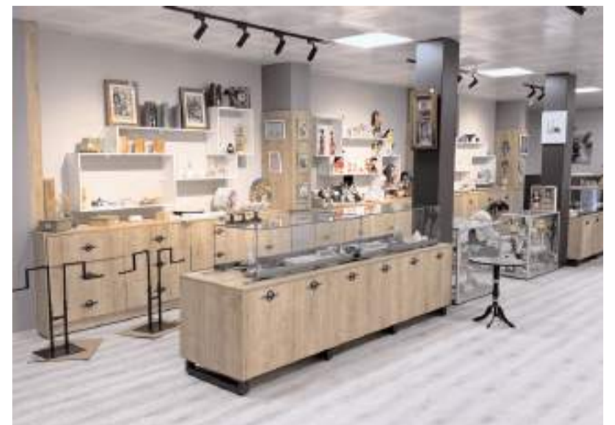
Kadın El Emeği Çarşısı, geçen yıl faaliyete başladı.