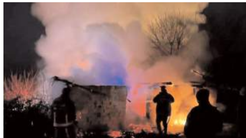
Geçen yıl İskilip'te 30 köy yangını çıktı.