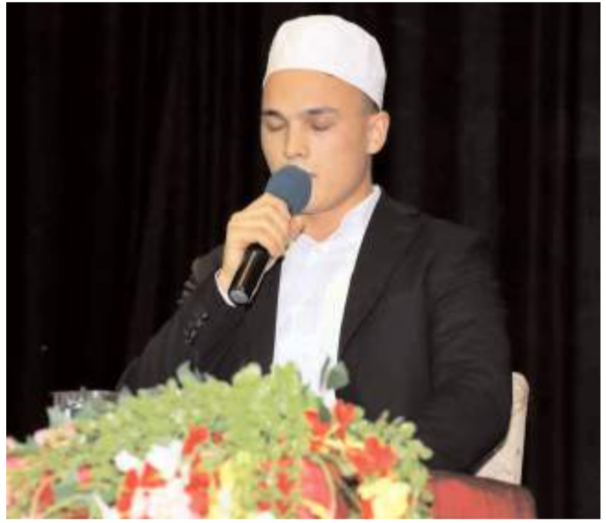
Program Kur'an-ı Kerim tilaveti ile başladı.

Milli Gençlik Derneği Sungurlu İlçe Temsilciliği Mekke'nin Fethi ve Kudüs Gecesi yoğun katılım ile düzenlendi.