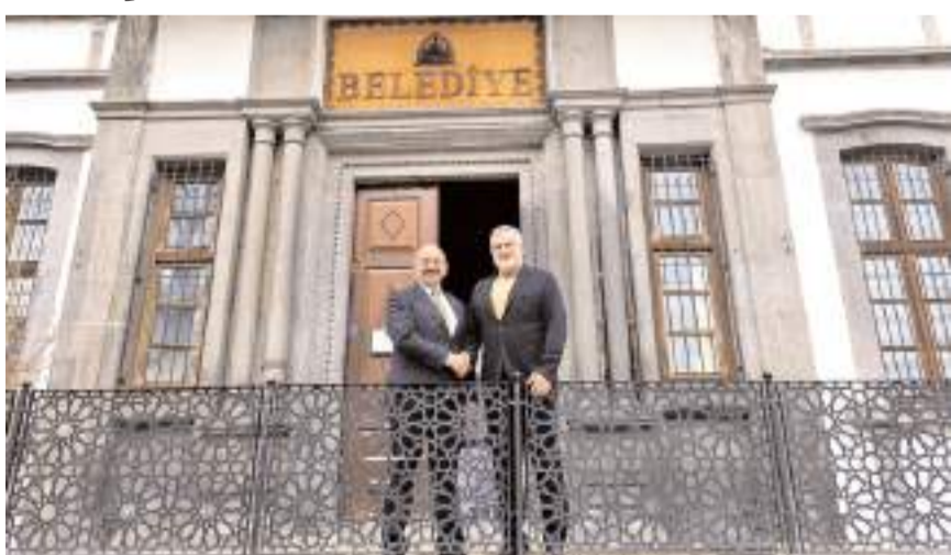
Ziyarete birlikte yapılabilecek projeler istişare edildi.