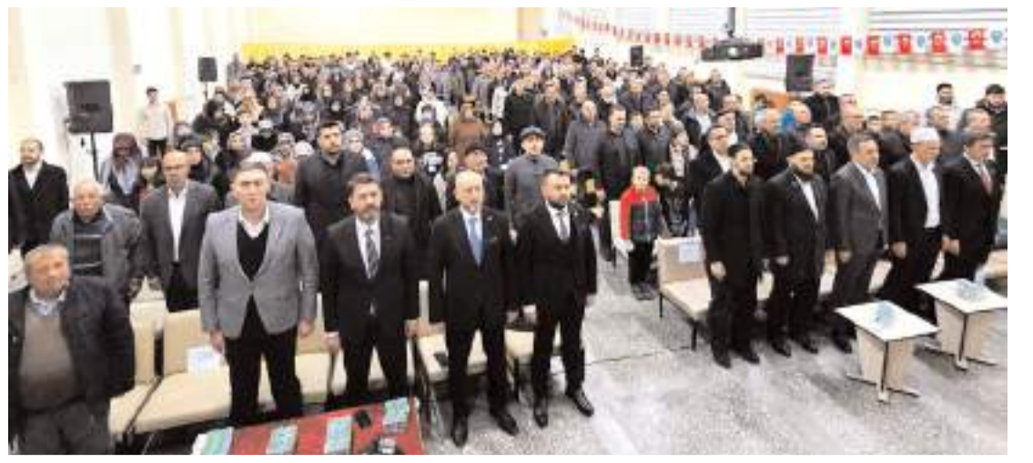
Program Sungurlu Mesleki ve Teknik Anadolu Lisesi Konferans Salonunda yapıldı.