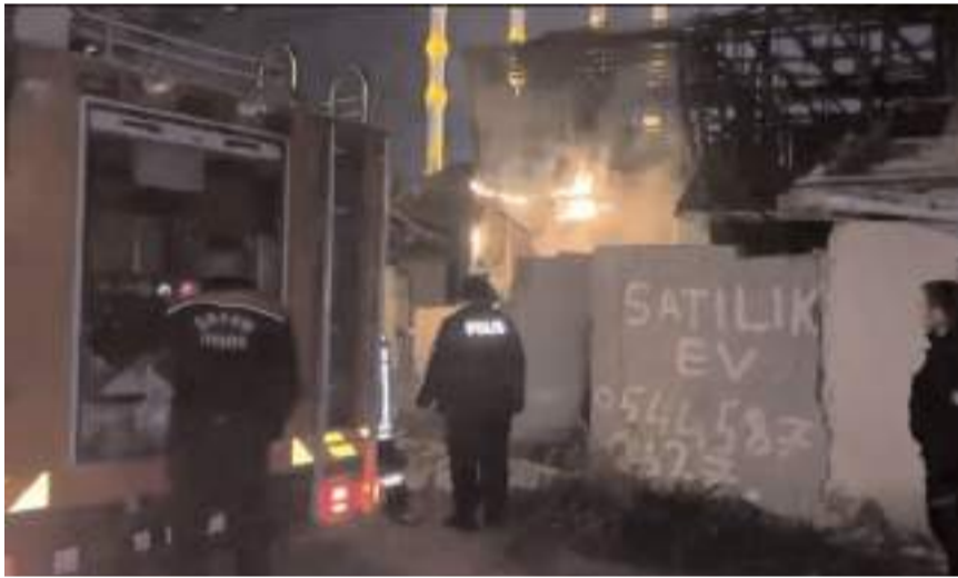
Olay, Ömür 2. Sokak'ta meydana geldi.

Ekipler yangının sebebini belirlemesi için inceleme başlattı. (İHA)