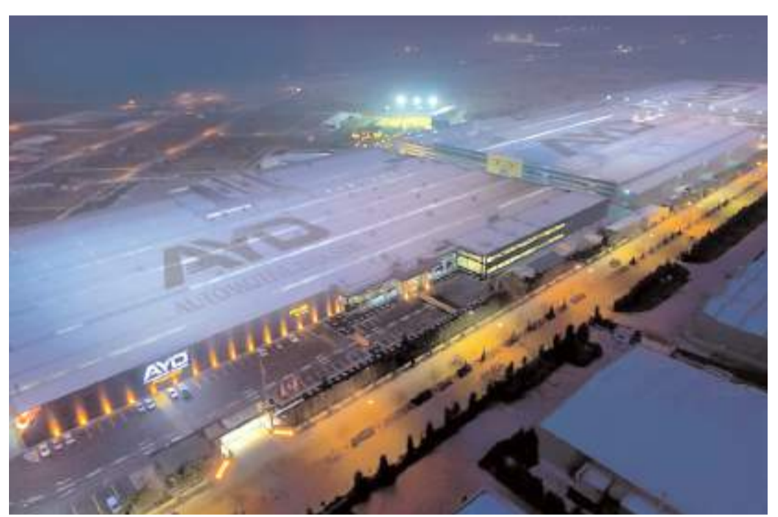
Çorum Oto Tamirciler, Makine Kurulum ve Onarımcıları, Makine Yedek Parça Satıcıları, Tornacılar Esnaf ve Sanatkarlar Odası Konya'ya teknik gezi düzenleyecek.

Sağlıklı Hayat Merkezlerinde görevli sorumlu hekim ve diyetisyen, herhangi bir sağlık kuruluşunda 90 gün içerisinde yapılmış olan tahlil ve tetkik sonuçlarını, kullandıkları sağlık bilgi yönetim sistemi ekranları üzerinden görüntüleyebilecek. Vatandaşlar tüm sonuçlarına kendi e-Nabız profillerinden ulaşabilecek. (A.A)