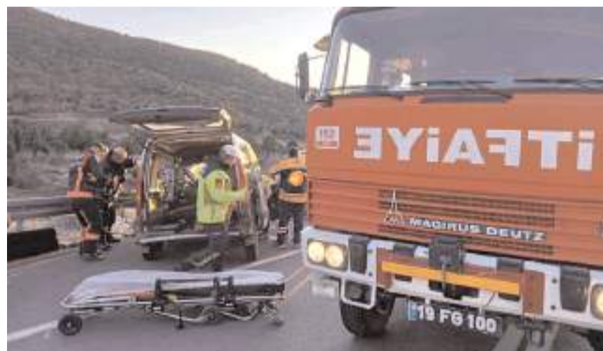
İtfaiye müdürlüğü 7 araç ve 23 personel ile hizmet veriyor.

Ekipler tarafından 2024 yılında 147 olaya müdahale edildi. 2024 yılındaki çalışmalarla ilgili yapılan açıklamada, "Bir itfaiye noktası olarak, 7 araç ve 23 personel ile her türlü olaya müdahale etmeye hazır bir şekilde görev yapmaktayız. 2024 yılı itibarıyla toplam 147 olaya müdahale edilmiştir. Bu olayların 12'si ev yangını, 30'u köy yangını, 6'sı araç yangını, 30'u anız yangını, 15'i bağ-bahçe yangını, 4'ü dükkan yangını, 6'sı çöplük yangını, 4'ü orman yangını, 10'u baca yangını, 15'i trafik kazası, 10'u su basını, 5'i insan kurtarma, 10'u hayvan kurtarma ve 10'u ilçe dışı olaylardır. Ayrıca, 25 iş yeri denetimi gerçekleştirilmiştir. Hizmet içi eğitimler kapsamında kamu personeline yangın müdahale temel eğitimi verilmiş ve 6 kamu kuruluşunda tatbikat yapılmıştır" ifadelerine yer verildi. (İHA)