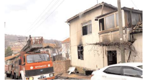
Olay 29 Aralık'ta Mecitözü'nde meydana gelmişti.