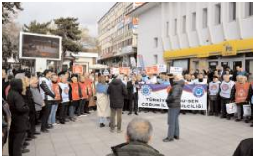
Basın açıklaması Merkez PTT önünde yapıldı.