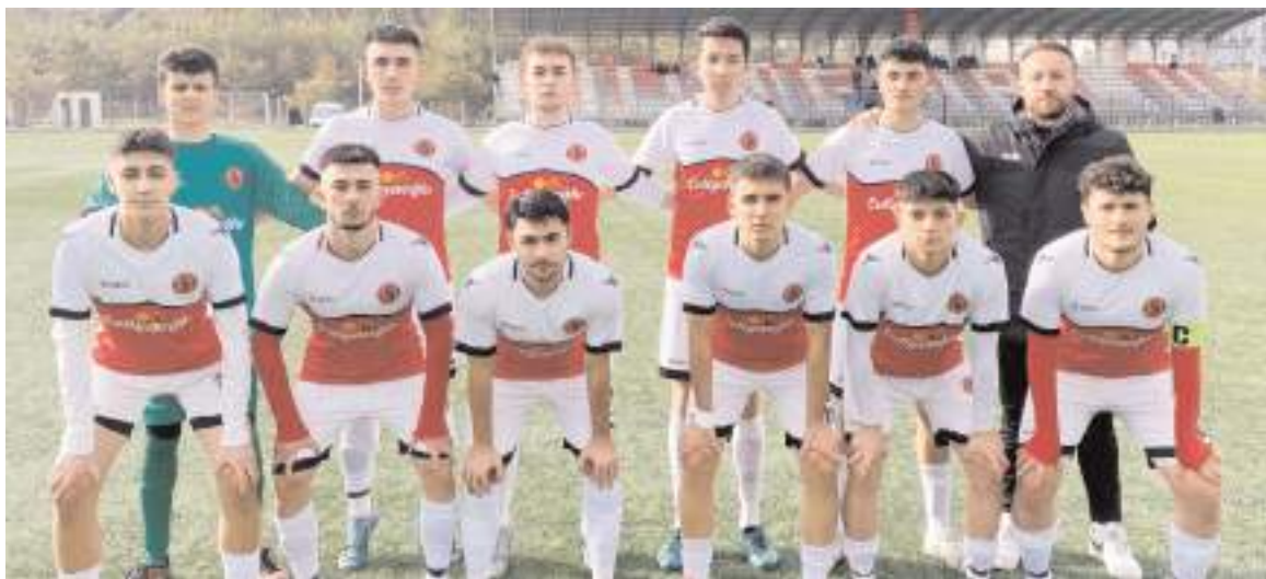
Sungurlu Belediyespor ilk maçını farklı kazanarak liderlik koltuğuna oturdu

Ligde ikinci hafta maçları bu hafta sonu oynanacak maçlarla devam edecek.