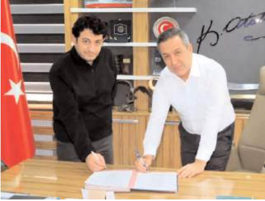
42 km'lik içme suyu isale hattının ihalesi yapılarak yüklenici firma ile sözleşme imzalandı

Sungurlu Belediyesinden konuyla ilgili yapılan açıklamada, "İller Bankası'ndan sağladığımız kredi ve hibe destekleriyle içme suyu isale hattımızın tamamını yenileyip Sungurlu'muzu asbestli borulardan ve bugüne kadar yaşadığı su sorunundan kurtaracağız" denildi. (Haber Merkezi)