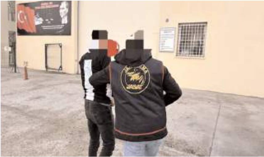
Jandarma ekipleri aranan suçluların bulunmasına yönelik çalışmaları devam ediyor.