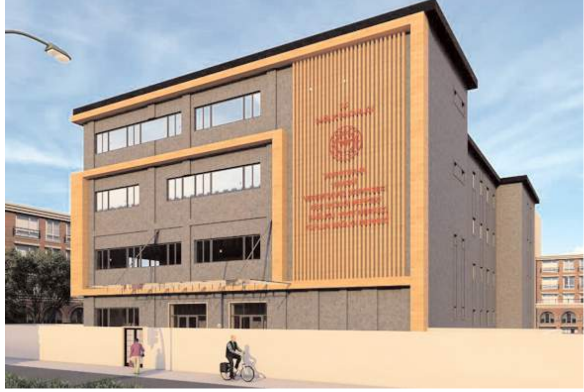
5 katlı sağlık tesisi 4700 m2 kapalı alana sahip olacak.

Kaya, Sağlıklı Hayat Merkezi bünyesinde Kanserle Mücadele Birimi(kolon, rahim ağzı, meme kanseri taramaları), Tütün ve Bağımlılık Yapıcı Maddelerle Mücadele Birimi(sigara bıraktırma polikliniği), Ruh Sağlığı Programları Birimi(psikolog, sosyal çalışmacı), Fiziksel Aktivite Salonu(fizyoterapist), Koruyucu Ağız ve Diş Sağlığı Hizmetleri Birimi(diş hekimi), Çocuk Gelişimi Birimi, Enfeksiyon Kontrol Birimi ve Eğitim Salonlarının hizmet vereceğini ifade etti.