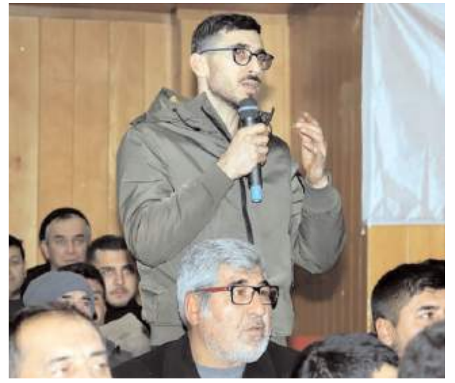
Esnafın projeye ilgili görüşlerini dile getirdiler.