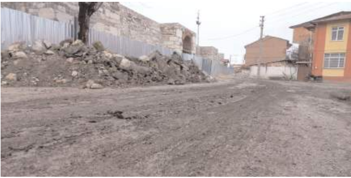
Bölgede oturan vatandaşlar çamur sorununun çözülmesini istiyor.