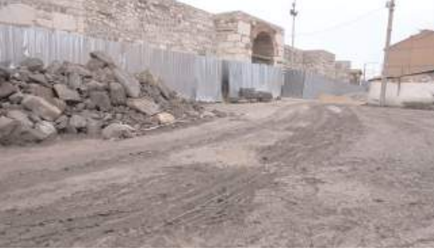
Kale bölgesinde oturan vatandaşlar sıcakta tozdan yağışlı havadan çamurdan dertli.