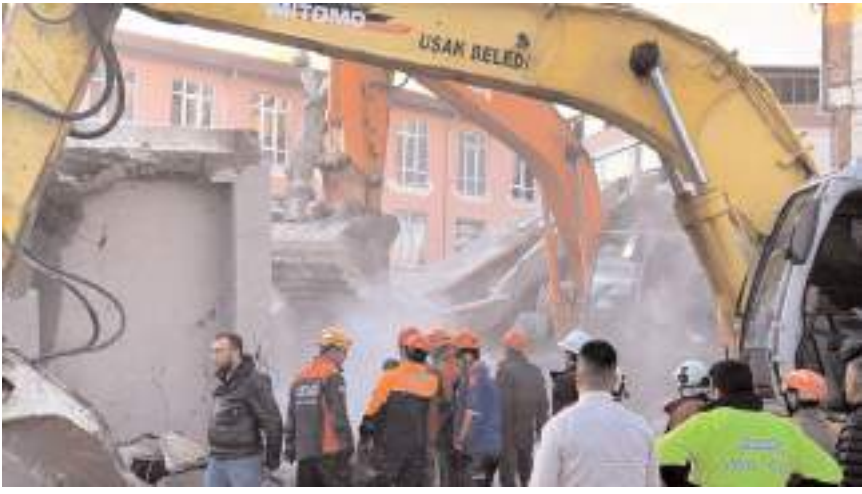
Olay Uşak'ta bir işhanının yıkımı sırasında meydana geldi.