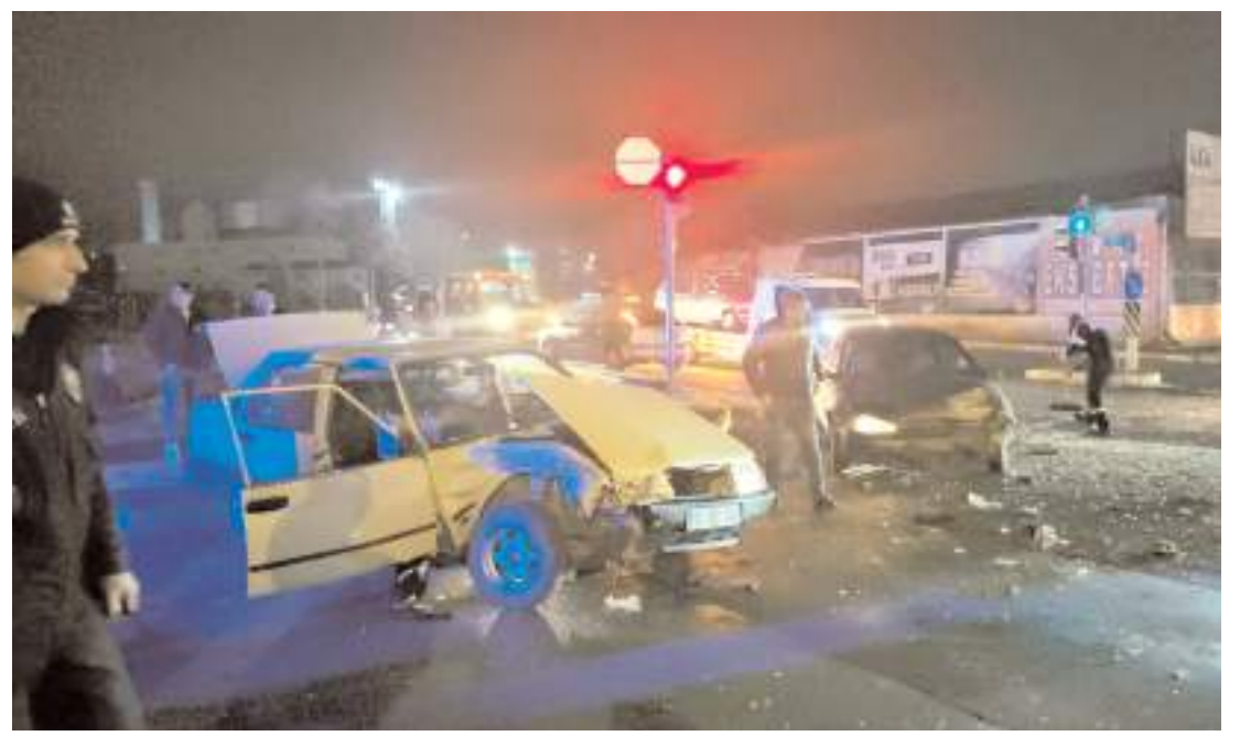
Kaza İnönü Caddesi Fen Lisesi Kavşağında meydana geldi.

Operasyonları koordine eden Cumhuriyet Başsavcılıklarımızı ve operasyonları gerçekleştiren Kahraman Polislerimizi tebrik ediyorum." (İHA)