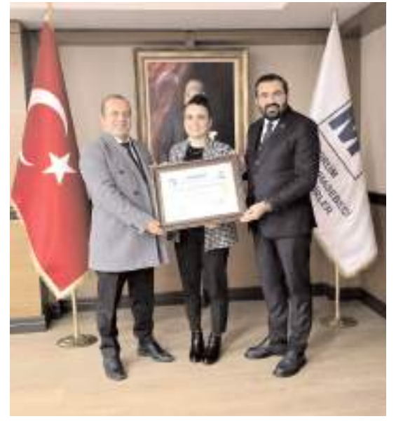
SMMMO'da yeni ruhsat alan üyeler için ruhsat töreni düzenlendi.