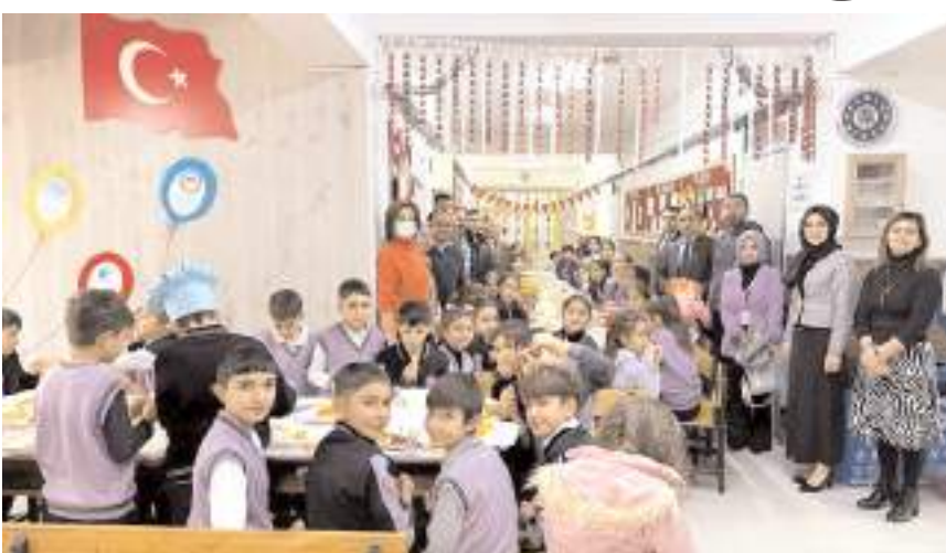
Program Sakarya İlkokulu'nda yapıldı.