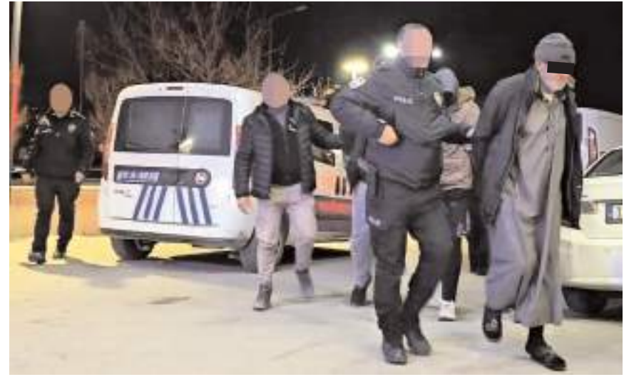
Şüpheli 5 kişi çıkarıldıkları mahkeme tarafından tutuklanarak cezaevine gönderildi.