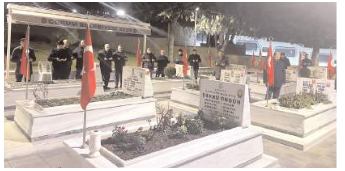
Programda şehitler için dua edildi.