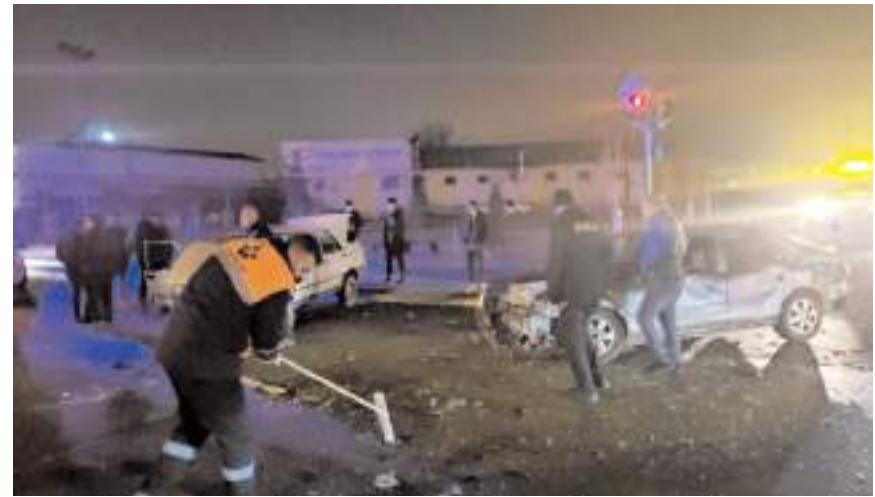
Kaza nedeniyle trafik kontrollü olarak verildi.

Yaralıları sağlık ekiplerinin müdahalesinin ardından Hitit Üniversitesi Erol Olçok Eğitim ve Araştırma Hastanesi'ne kaldırıldı.(AA)