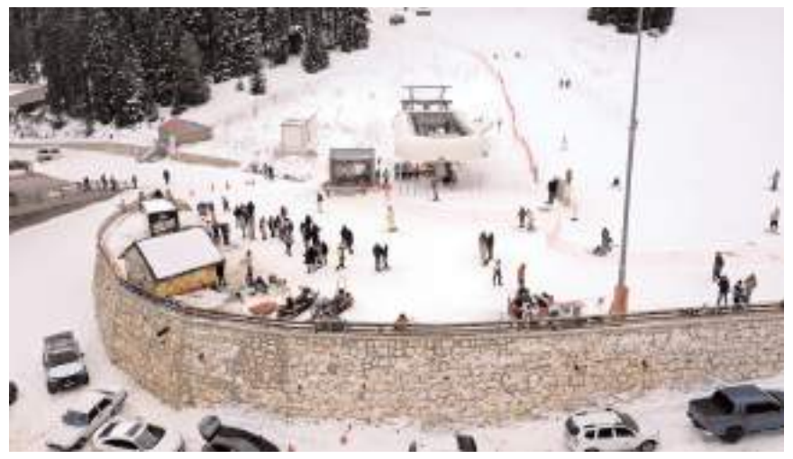
Kayak merkezine Çorumlularda ilgi gösteriyor.

Kış turizm merkezlerinden Ilgaz Dağı'ndaki Yurduntepe Kayak Merkezi'nde hafta sonu yoğunluğu yaşanıyor.