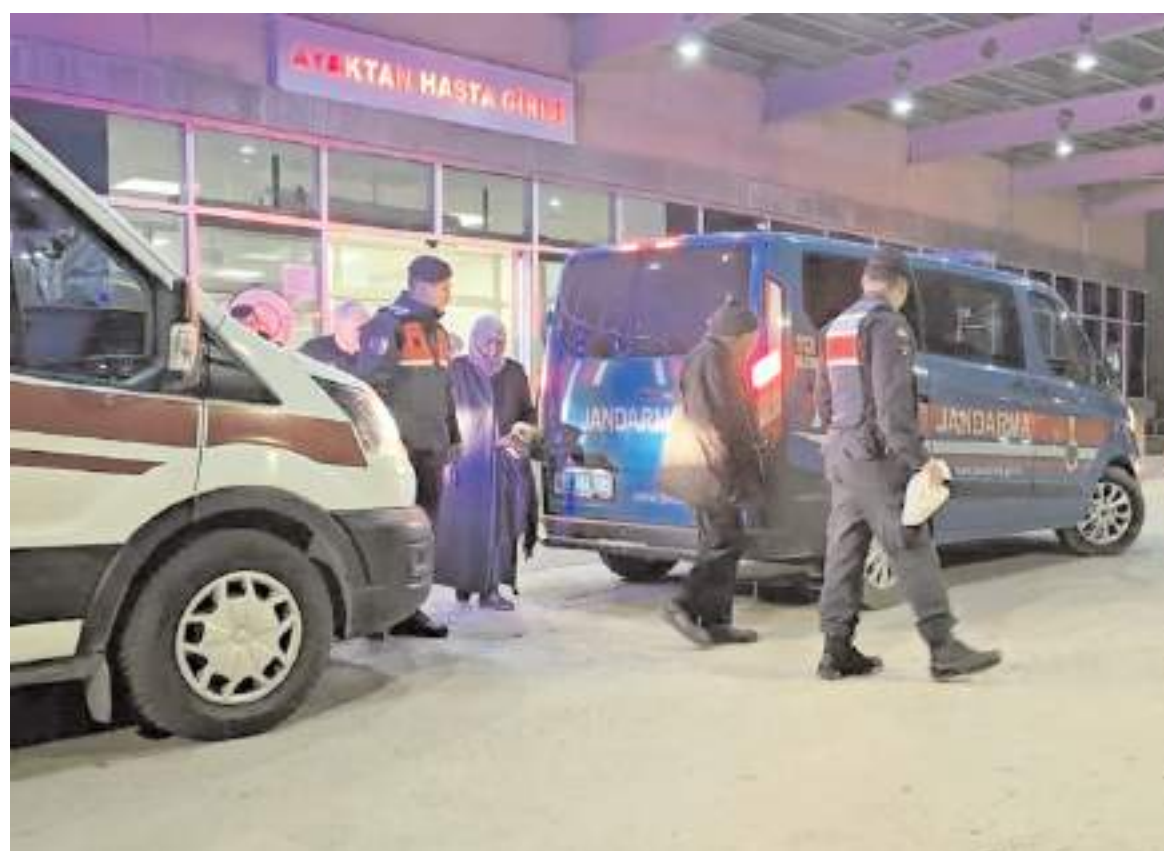
Jandarma ekipleri, yaşlı kadın ile eşini Büyük Dövençi'deki evlerine götürdü.