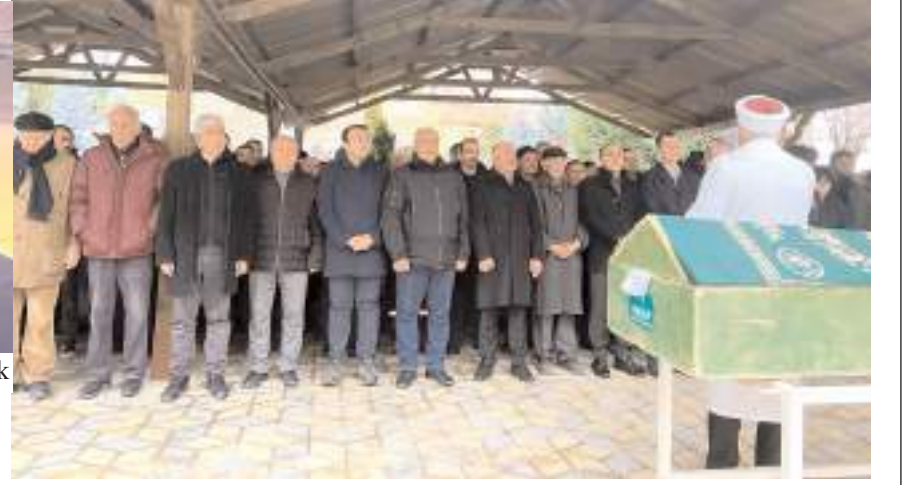
Merhumun cenazesi Hacıkaranı Mezarlığı'na defnedildi.