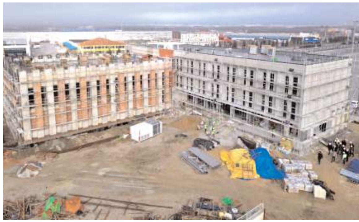
Güreş Eğitim Merkezi inşaatında kaba bölümü bitti ve ince işçilik hızla devam ediyor. Merkezin iki aya kadar hizmete açılması bekleniyor. Çorum modern bir güreş eğitim merkezine kavuşacak

adımlarla yürüyoruz. Yaptığımız spor yatırımları bunun en büyük göstergesidir. Gençlik ve Spor Bakanlığı Spor Toto Teşkilat Başkanlığımızın desteklediği proje tamamlandığında, eski stadyum yanında yer alan güreş merkezi yıkılacak ve bu alan Millet Bahçesi'ne katılacak." dedi.