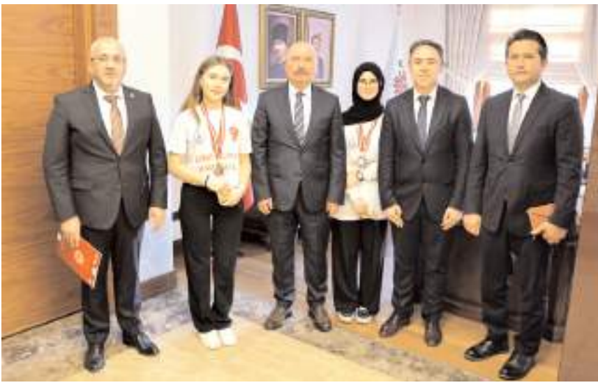
Ziyarette hatıra fotoğrafı çekildi.