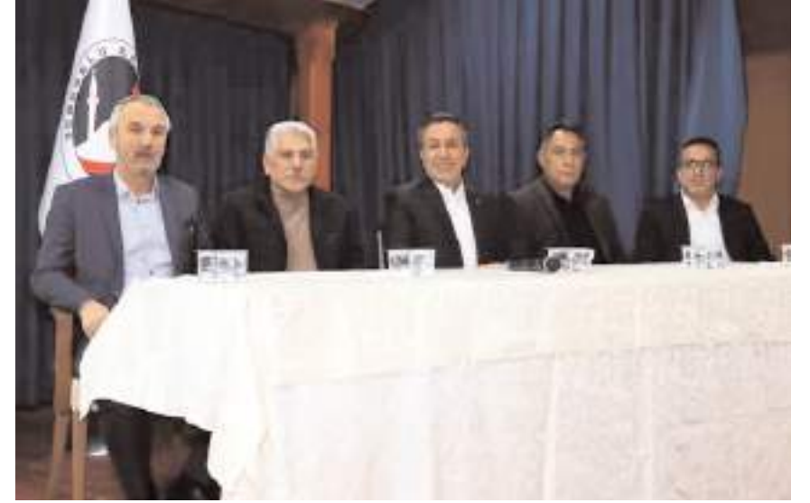
Toplantıya Sungurlu Belediyesi, Madeni Sanatkarlar Esnaf Odası ile Esnaf ve Sanatkarlar Kredi Kefalet Kooperatifi yetkilileri katıldı.