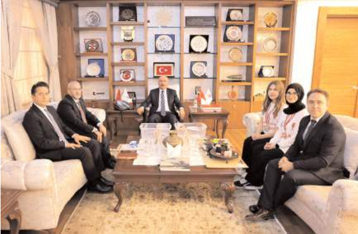
Öğrenciler projeleri hakkında Vali Çalgan'a bilgi verdiler.