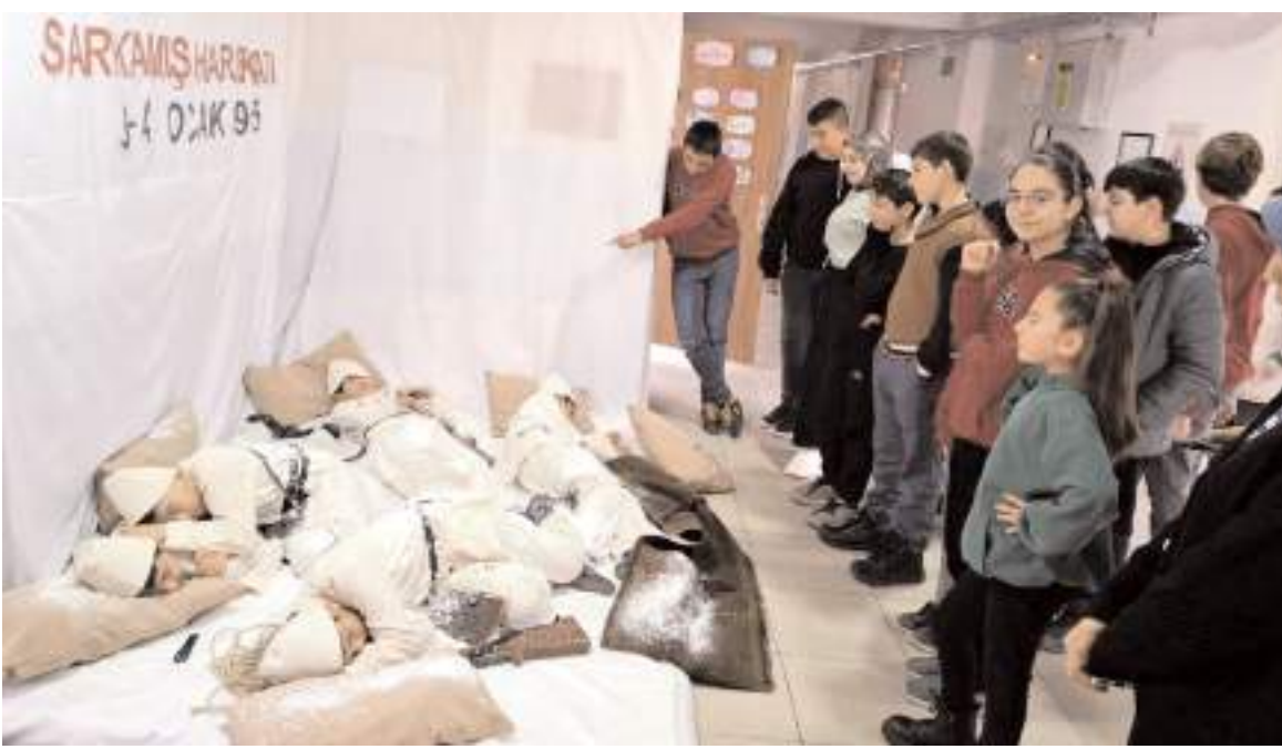
Anma programı Dodurga Şehit Murat Alıcı Ortaokulu'nda yapıldı.

Çalışmalar kapsamında asbestli boruların değiştirilip abone bağlantıları tamamlanan 37 km'lik hattan sonra, 42 km'lik içme suyu isale hattının daha yenilenmesi için ihale yapılarak yüklenici firma ile sözleşme imzalandı. İşin bu yıl yaz sonuna kadar bitirilmesi hedefleniyor.