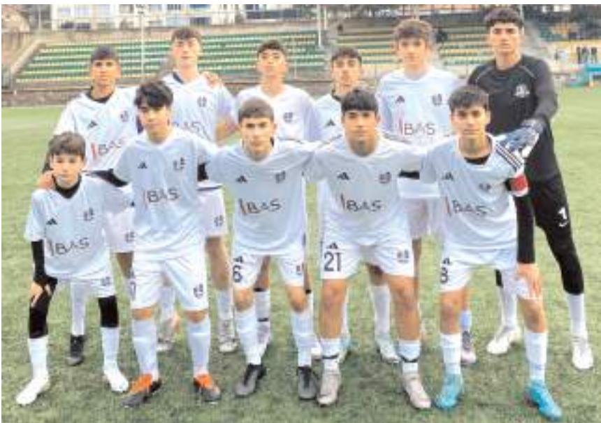
Vefaspor U 15 takımı grupta oynadığı beşinci maçında kazanarak liderliğini sürdürdü

B grubunda Vefa Gençlikspor ligdeki altıncı maçında altıncı galibiyetini İskilipspor'u 10-0 gibi farklı skorla yenerek aldı ve açık ara liderliğini sürdürdü. İskilipspor sahasında HE Kültürspor ile 1-1 berabere kalarak haftayı iki puan kaybı ile tamamladı. Gençlerbirliği ise Sungurlu Belediyespor deplasmanında tek golle üç puanı alarak ayrıldı ve ilk iki iddiasını devam ettirdi. Grubun diğer maçında ise Alaca Belediyespor, Hattuşaspor deplasmanından 3-1'lik galibiyet ve ve üç puanla dönerek yarışta bende varım dedi.