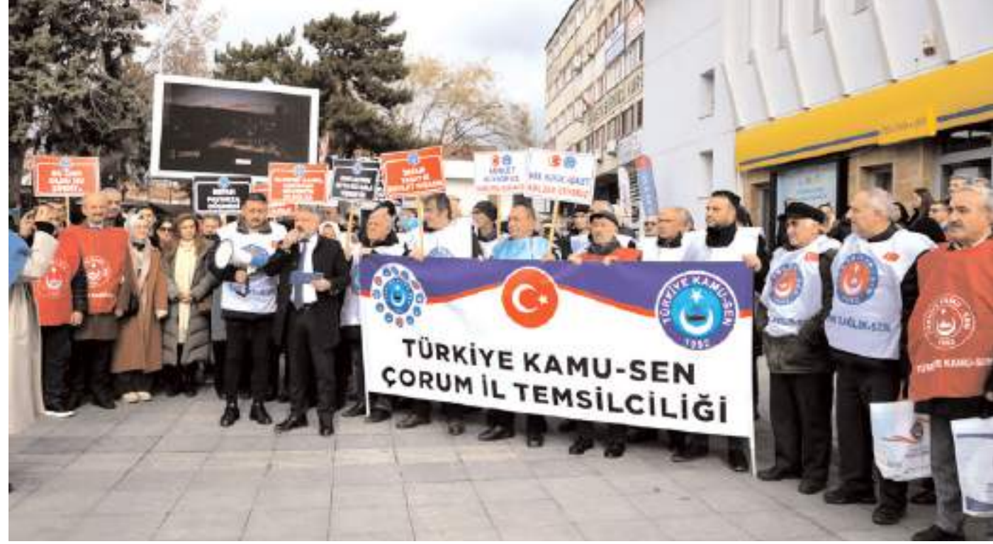
Türkiye Kamu-Sen Çorum İl Temsilciliği, zam oranlarına tepki gösterdi.

Biz Türkiye Kamu-Sen olarak memur ve emekli maaşlarının yeniden değerlendirme oranına güncellenmesini, üzerine refah payı eklenerek gerçek anlamda bir zamma kavuşturulmasını talep ediyoruz. Ek zam ve refah payının kalıcı bir biçimde düzenlenmesini istiyoruz. Gelir vergisinin adaletle düzenlenmesini, herkesin kazancı ile orantılı bir vergilendirmeye tabi tutulma-