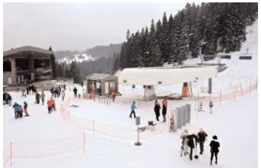
Merkezte hafta sonları yoğunluk artıyor.

Yurduntepe Kayak Merkezi İşletme Sorumlusu Hakkı Kaya, "Yarıyıl tatili ile yoğunluğun artmasını bekliyoruz. Bugün itibarıyla ikinci kayak etabını da açtık. Profesyonel kayakçılar pistte 6 bin 500 metre kayabiliyor. Teleferiği vatandaşlar gezi amaçlı kullanabilirken, kayakseverler iki etabı da kullanabiliyor. Kızakseverler kızakla, kayakseverler kayakla gün boyu dolu dolu aktivitelerle bir gün geçirebiliyor." dedi.(AA)