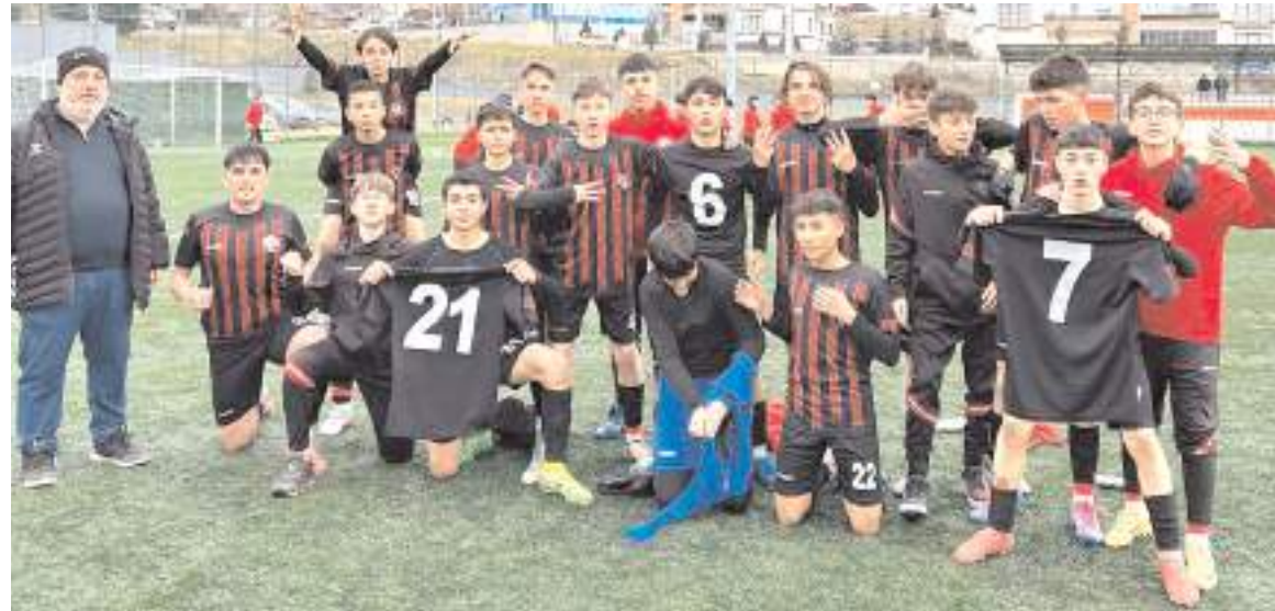
Çorum FK U 14 takımı Kastamonuspor deplasmanından üç puanı üç golle almayı başardı

GOLLER: 5. dak. İbrahim, 10. dak. Şirin, 35. dak. Özken, 70. dak. Kerem (Çorum FK). 25. dak. Ömer Hüseyin (Kastamonuspor).