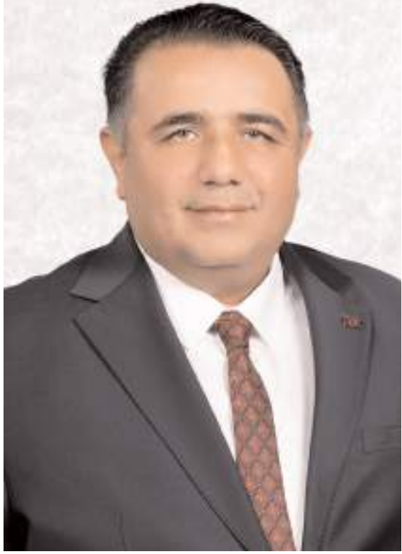
Milletvekili Av. Oğuzhan Kaya