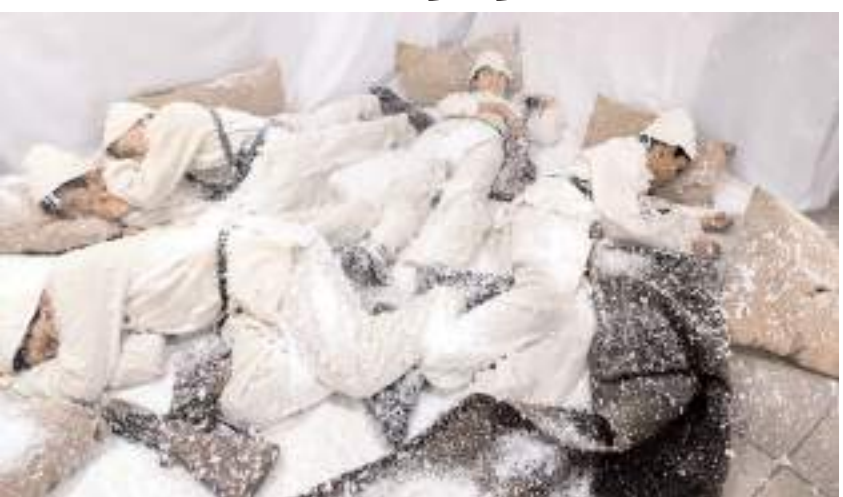
Sarıkamış Harekati sırasındaki hava şartlarını gösteren dekor oluşturuldu.

Çorum'un Dodurga ilçesinde Sarıkamış Harekati'nin 110. yıl dönümü dolayısıyla anma etkinliği yapıldı.