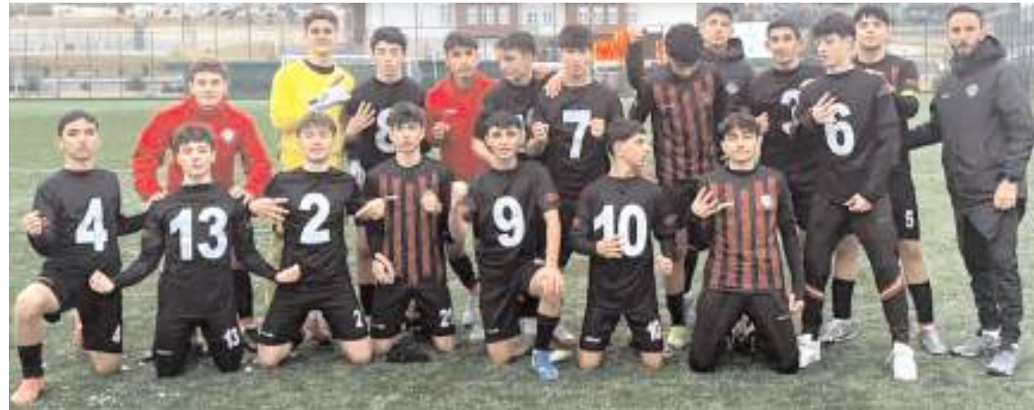
Çorum FK U 15 takımı Kastamonuspor deplasmanından 4-1'lik galibiyet ile dönmeyi başardı

Pazar günü ise Çorum FK U 14 ve U 15 takımları Kastamonuspor deplasmanında mücadele ettiler. İlk maçta Çorum FK U 14 takımı Kastamonuspor'u 3-0 yenirken ikinci maçta ise U 15 takımı rakibini 4-1 yendi ve haftayı dört maçta dört galibiyet ile tamamladı.