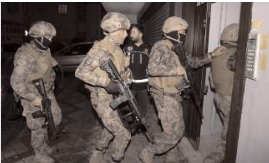
Operasyonlarda bin 713 şüpheli yakalandı.

"Cumhuriyet Başsavcılıklarımız ile Emniyet Genel Müdürlüğü Narkotik Suçlarla Mücadele Başkanlığı koordinesinde, İl Emniyet Müdürlüklerince; 2 bin 569 ekip, 6 bin 442 personel, 32 hava aracı ve 48 narkotik dedektör köpeğinin katılımıyla; Ankara, İzmir, Gaziantep, Konya, İstanbul, Adana, Samsun, Bursa, Mersin, Şanlıurfa, Diyarbakır, Manisa, Zonguldak, Antalya, Hatay, Kocaeli, Malatya, Tekirdağ, Denizli, Kayseri, Trabzon, Aksaray, Balıkesir, Eskişehir, Sakarya, Sivas, Muğla, Aydın, Osmaniye, Rize, Çorum, Yozgat, Kilis, Niğde, Erzurum, Kahramanmaraş, Van, Çanakkale, Karaman, Kırklareli, Afyonkarahisar, Düzce, Edirne, Elazığ, Erzincan, Kütahya, Adıyaman, Çankırı, Hakkâri, Ağrı, Burdur, Siirt, Yalova, Amasya, Giresun, Tokat, Bolu, Mardin, Bartın, Iğdır, Kars, Muş, Sinop, Ordu, Isparta, Kırıkkale, Kırşehir, Nevşehir, Batman, Bingöl, Kastamonu, Şırnak, Artvin, Bilecik, Bitlis, Karabük ve Uşak'ta düzenlenen 'Narkokapan-5' operasyonları sonrasında bazı illerimizde ele geçirilen