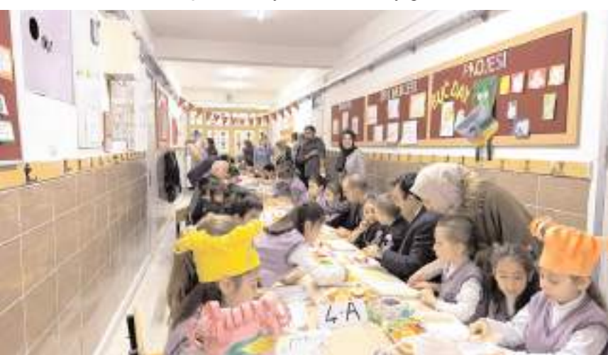
Eğitime ilçe protokolü de katıldı.

Çorum'un İskilip ilçesinde öğrencilere meyvelerin düzenli tüketilmesi konusunda eğitim verildi.