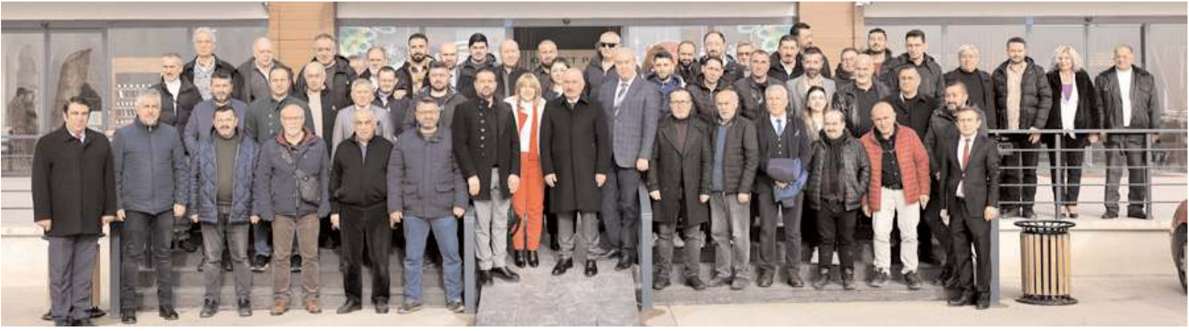
İkinci Bahar Lokantasında yapılan programın ardından toplu hatıra fotoğrafı çekildi.