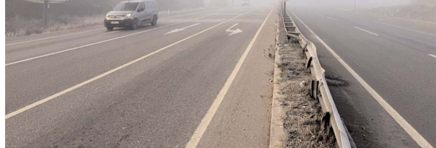
Etkili olan sis trafiği olumsuz etkiledi.