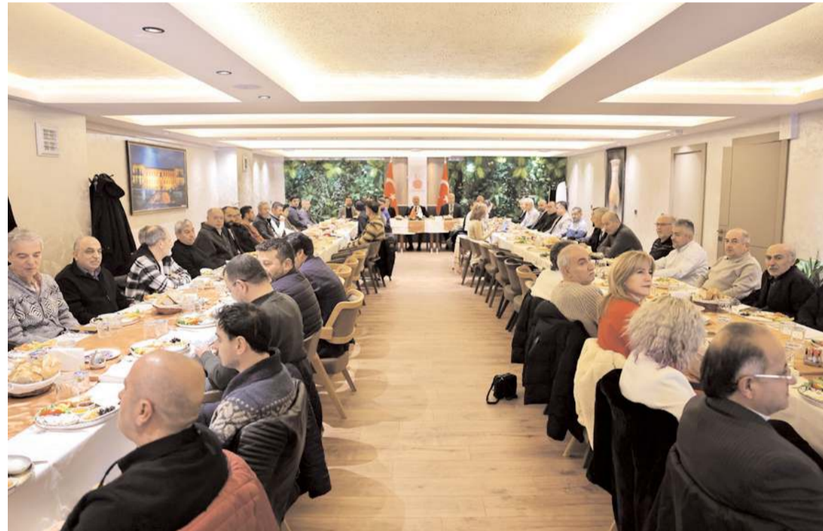
10 Ocak Çalışan Gazeteciler Günü dolayısıyla yapılan programa katılım yüksek oldu.