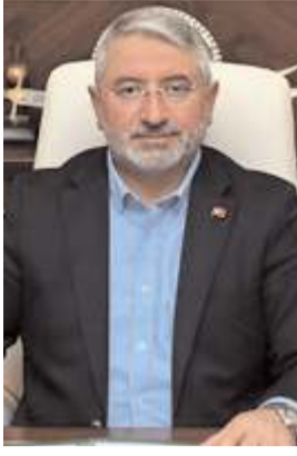
Halil İbrahim Aşgın

"Basın mensuplarımız; kamuoyunu doğru bilgilendirmek, kurumlarla vatandaşlarımız arasındaki ilişkilerin güçlenmesine katkı sağlamak ve sorumlu, ilkeli gazeteciliği yerine getirmek gibi önemli görevler üstlenmektedir. Halkımızın talep ve beklentilerini yansıtarak önemli bir kamu görevini yerine getiren çalışan Gazeteciler Günü'nü kutluyor, sağlıklı, huzurlu ve başarılı bir yıl diliyorum." (Haber Merkezi)