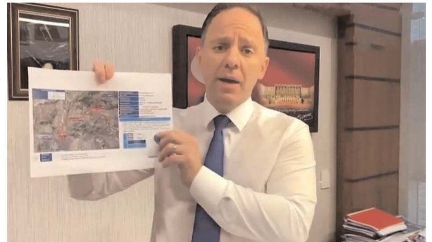
CHP Zonguldak Milletvekili Deniz Yavuzylmaz

Yavuzylmaz’ın konuya ilişkin paylaşımı şöyle: “Doğru bir proje, AK Parti tarafından nasıl büyük bir soyguna dönüştürüldü? AK Parti’nin Delice-Çorum Hızlı Tren Hattı İhalesinde yaptığı devasa peş-