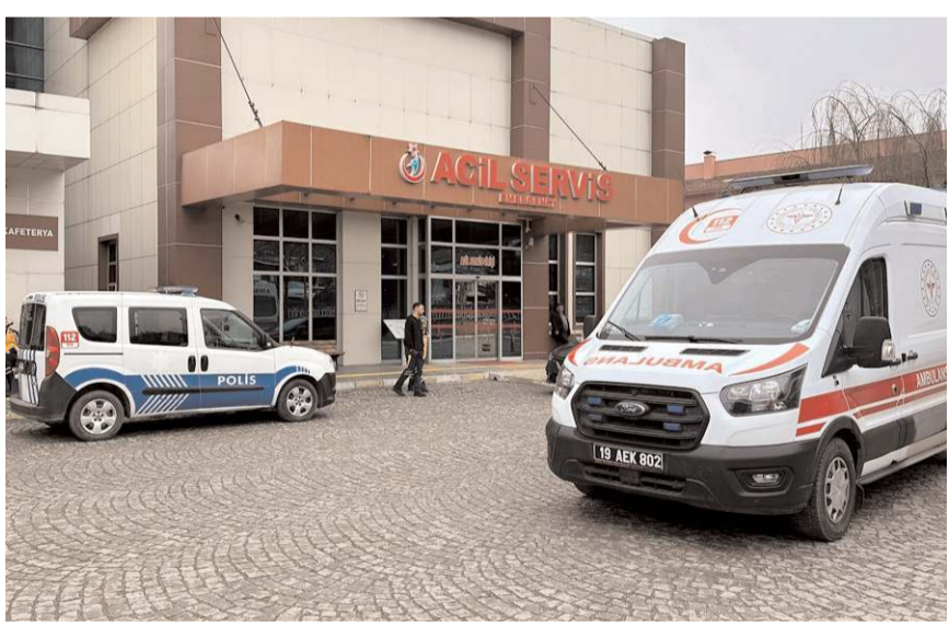
Öğrenciler Kargı Ahmet Hamdi Akpınar İlçe Devlet Hastanesi'nde tedavi altına alındı.