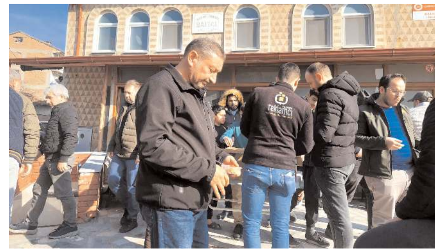
Cuma namazından sonra helva dağıtıldı.