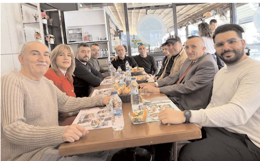
Programa çok sayıda basın mensubu katıldı.