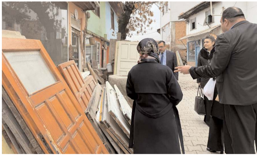
Proje heyeti incelemelerde bulundu.