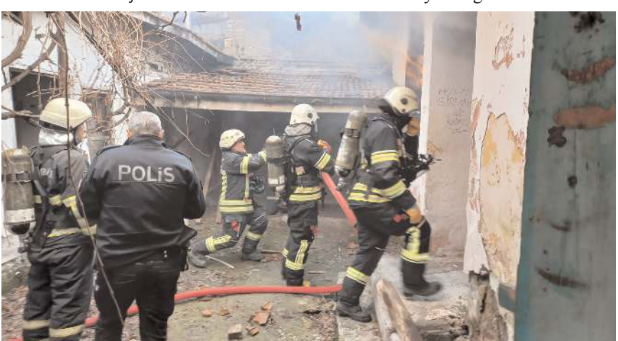
İtfaiye ekipleri yangını büyümeden söndürdü.