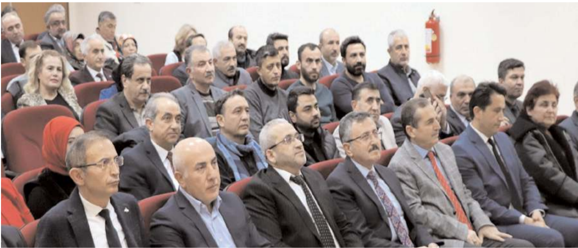
Program İl Millî Eğitim Müdürlüğü toplantı salonunda yapıldı.

Yurdumuzun dört bir köşesinde hizmet yarışına devam eden tüm meslektaşlarıma ve ailelerine mutlu, huzurlu, sağlıklı ve başarılı bir yıl temenni ediyorum" şeklinde belirtti. (Haber Merkezi)