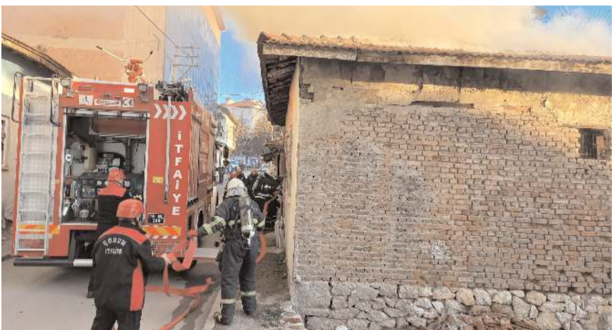
Olay Kale Mahallesi Milönü 3. Sokakta meydana geldi.

Olay yerine gelen Çorum Belediyesi İtfaiye Müdürlüğü ekipleri yangına müdahale ederek büyümeden söndürdü. Olayla ilgili inceleme başlatıldı.