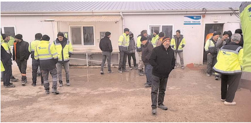
İşçiler maaşlarına yapılan zammın geri alınması nedeniyle iş bırakmıştı.

Greve giden işçilere firma tarafından iş akitlerinin sona erdirildiği bildirildi. Yaklaşık 40 işçinin işten çıkarıldığı bildirildi. Tünel inşaatında kamyon ve inşaat şöforlerinin maaşlarını 2 ay zamlı alan şöforlerin, daha sonra maaşlarına yapılan zamlar kesildi. Yapılan zammın geri çekilmesine tepki gösteren şöforler, 2025 yılında da zam oranlarının ne olacağını belli olmadığını belirterek duruma tepki göstermek amacıyla greve gitmişlerdi.