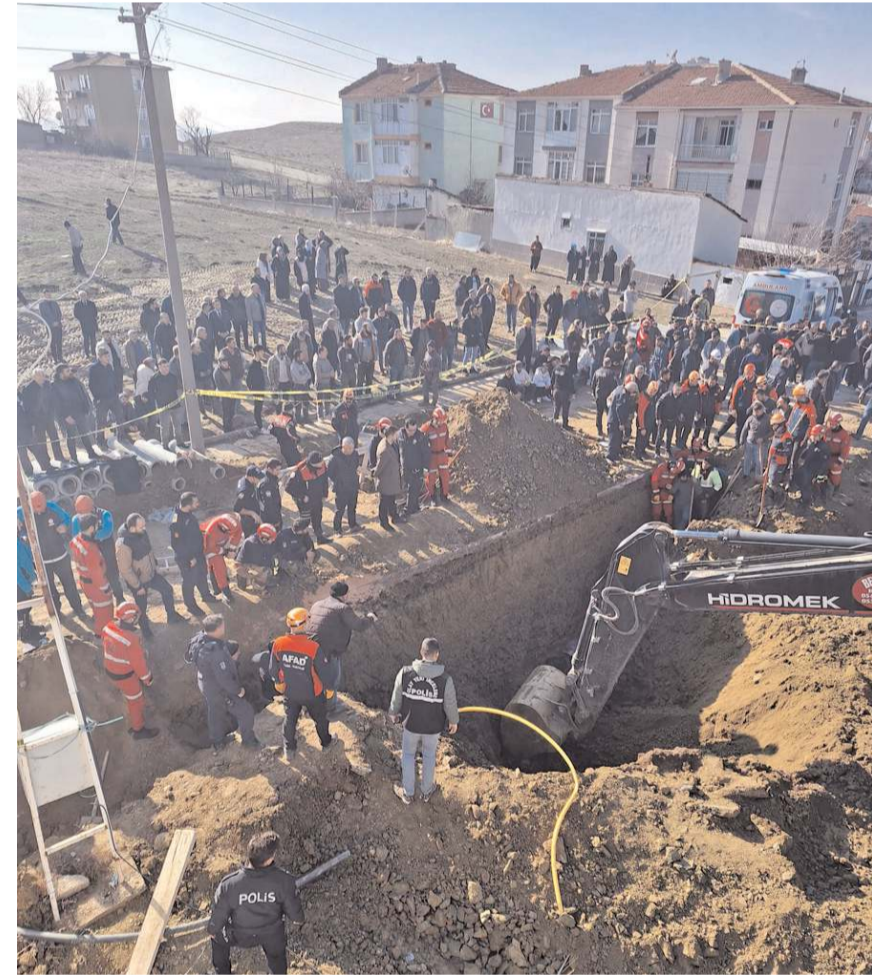
Kurtarma ekipleri iki işçinin cansız bedenlerini toprak altından çıkarttı.