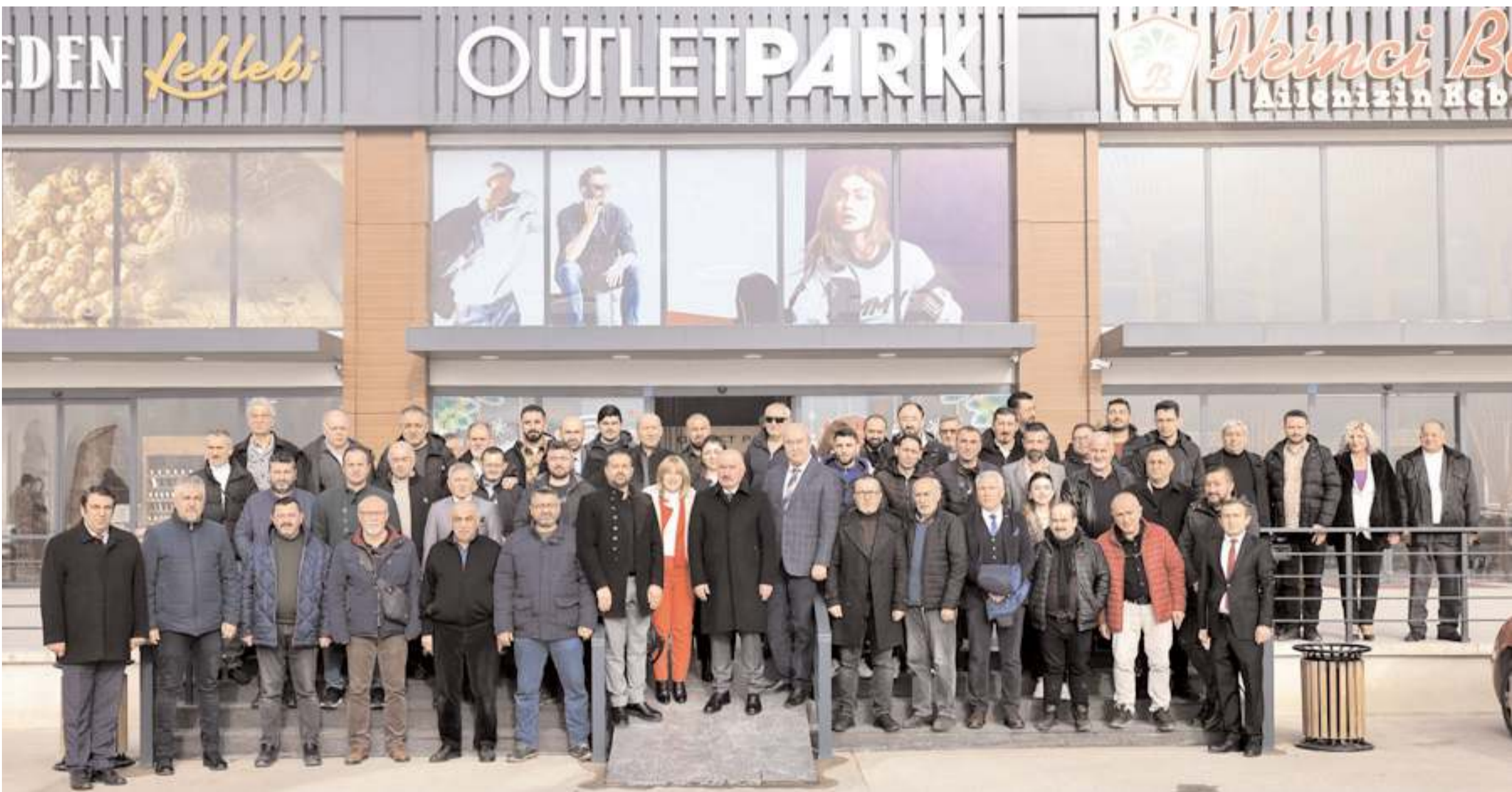
İkinci Bahar Lokantasında yapılan programın ardından toplu hatıra fotoğrafı çekildi.