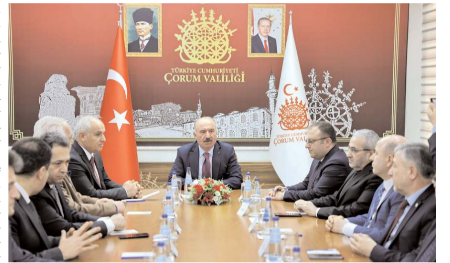
Proje ile nitelikli bir mesleki eğitim verilmesi hedefleniyor.

leki ve Teknik Anadolu Lisesi'nde pilot olarak uygulanacak SİMEP projesi daha sonra tüm meslek liselerimize yaygınlaştırılacaktır" dedi.