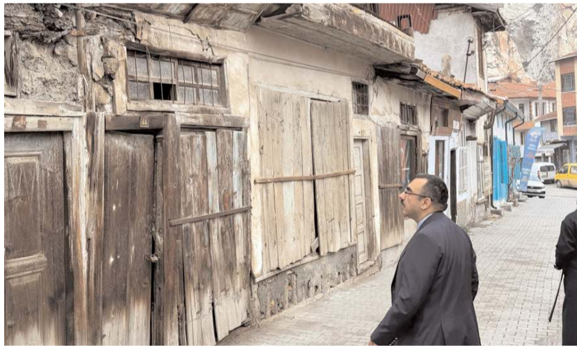
İskilip Meslekler Müzesi projesi, Orta Karadeniz Kalkınma Ajansı (OKA) tarafından desteklenecek.