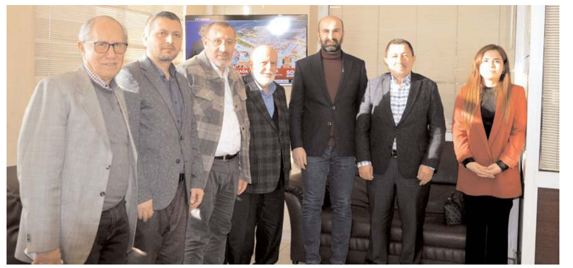
Ziyaretin anısına toplu fotoğraf çekinildi.