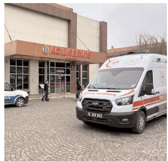
Öğrenciler Kargı Ahmet Hamdi Akpınar İlçe Devlet Hastanesi'nde tedavi altına alındı.