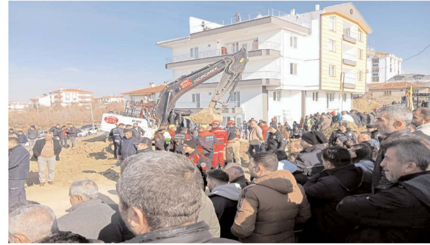
Olay Ankara'nın Polatlı ilçesinde meydana geldi.

Olayla ilgili incelemelerin devam ettiği öğrenildi. (İHA)