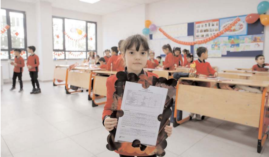
Çorum'da 86 bin 536 öğrenci karne aldı.