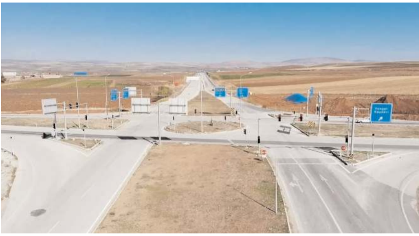
Kavşakta her yıl çok sayıda ölümlü trafik kazası meydana geliyor.