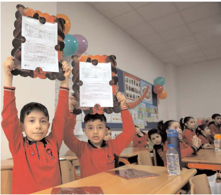
Öğrenciler tatile girmenin sevincini yaşadılar.