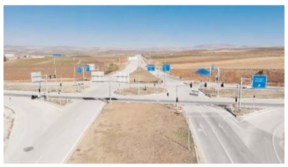
Kavşakta her yıl çok sayıda ölümlü trafik kazası meydana geliyor.