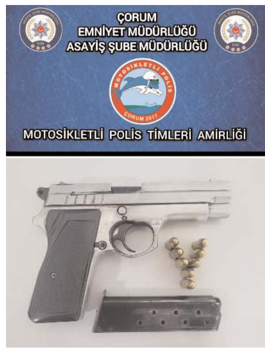
Uygulamalarda 4 ruhsatsız tabanca, 4 kurusıkı tabanca, 5 tüfek ele geçirildi.