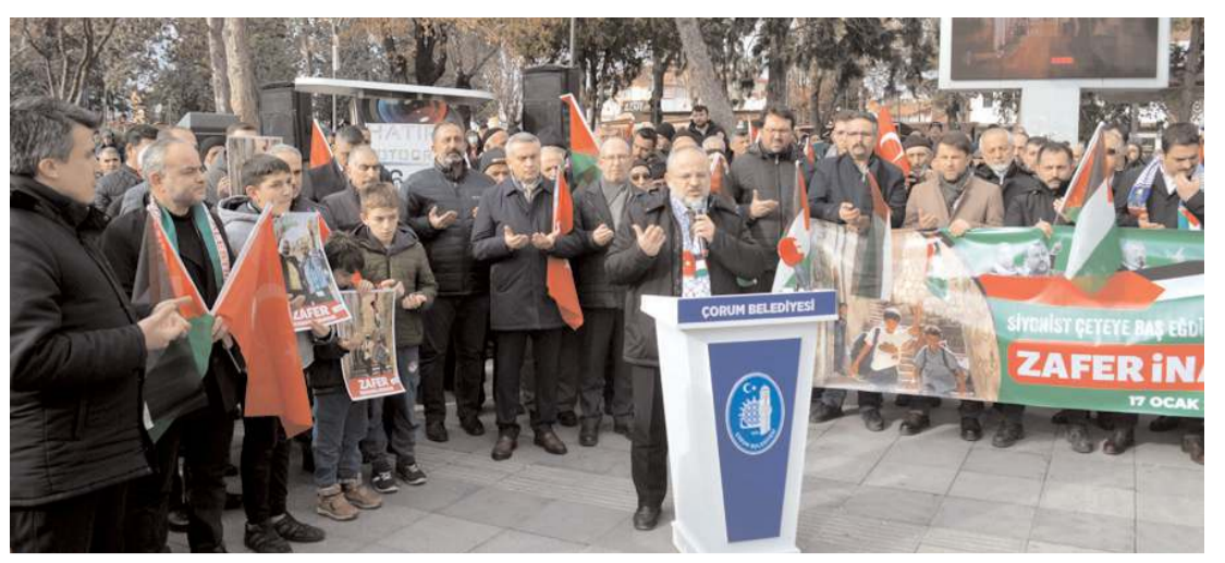
Eylem yapılan dua ile sona erdi.

■ AK Parti Çorum Milletvekili Yusuf Ahlatcı, AK Parti Genel Başkanı ve Cumhurbaşkanı Recep Tayyip Erdoğan'ı ziyaret ederek Kırıkale-Çorum-Samsun Hızlı Tren hattı için teşekkür etti. * HABERİ 2'DE