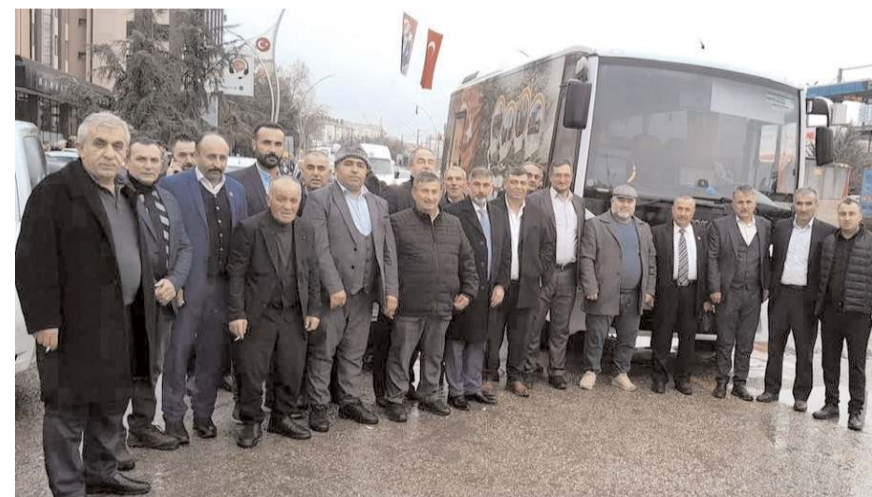
Alaca köy muhtarları Ankara'ya gitti.

Başkan İsbir ise yaptığı açıklamada, "Nerede bir mağduriyet varsa gücümüzün yettiği oranda destek oluyoruz, olmaya devam edeceğiz. Bende size çalışmalarınızda başarılar diliyorum" dedi. (Haber Merkezi)