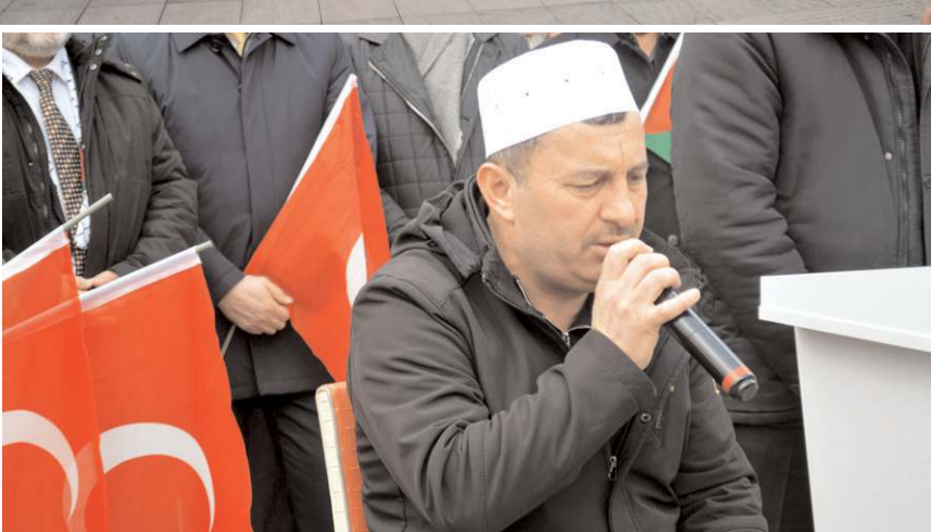
Eylem Kur'an-ı Kerim tilaveti ile başladı.