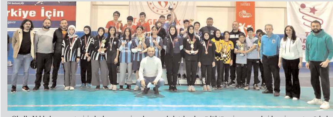
Okullu Yıldızlar masa tenisinde dereceye giren kız ve erkek takımları ödül töreni sonrasında idareci ve antrenörlerle

Final maçlarının ardından düzenlenen törenle okullara kupa ve sporculara madalyaları verildi.