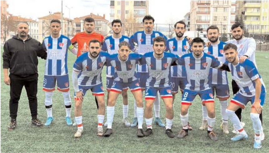
Gülabibeyspor ikinci maçında yarın Osmancıkgücüspor deplasmanında mücadele edecek

İlk haftanın kazanan diğer takımı Gülabibeyspor ise Osmancıkgücüspor deplasmanında yoluna kayıpsız devam etmek istiyor. İlk hafta Alaca ilçe derbisinden 0-0 berabere ayrılan Alaca Belediyespor, Ulukavakspor deplasmanında puan ararken Alacagücüspor ise sahasında İskilipspor ile karşılaşacak.