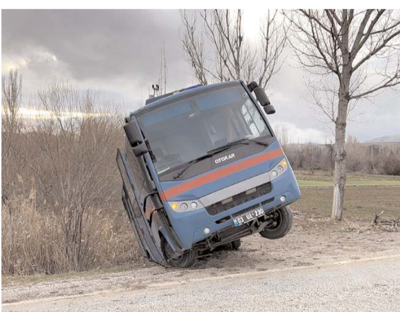
Kaza, Sungurlu-Alaca karayolunda meydana geldi.