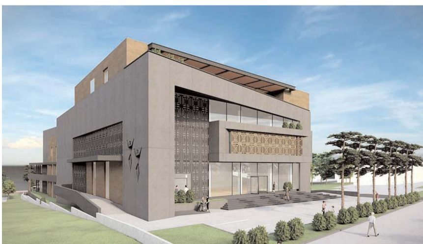
Merkez Şehir Parkı'na inşa edilecek.