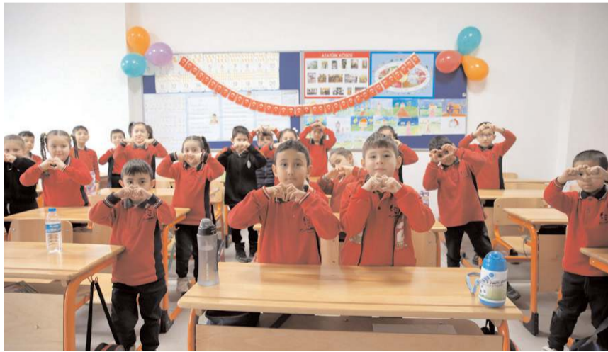
Karne dağıtım töreni Atatürk İlkokulu'nda yapıldı.

■ Çorum'da 2024-2025 eğitim öğretim yılının sona ermesiyle 493 okulda 86 bin 536 öğrenci ve 7 bin 417 öğretmen yarıyıl tatiline girdi. * HABERİ 3'TE