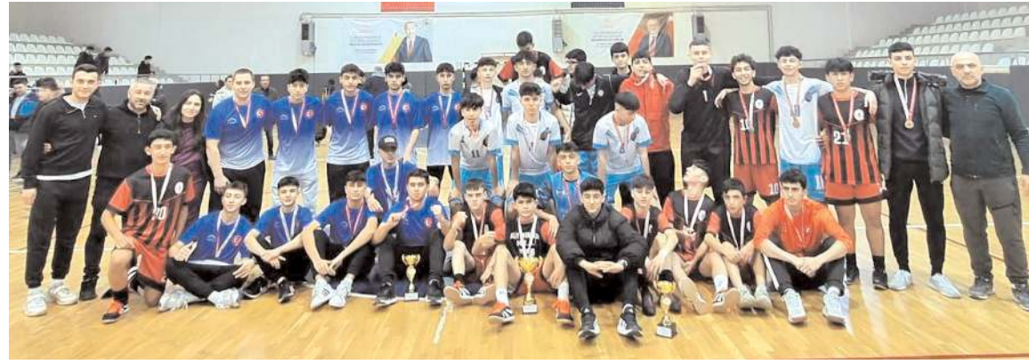
Genç erkekler futsalda dereceye giren okullar ödül töreni sonrasında idareci ve öğretmenler toplu halde

Olayların ardından düzenlenen törenle dereceye giren okullara kupa sporcularına ise madalyaları verildi.