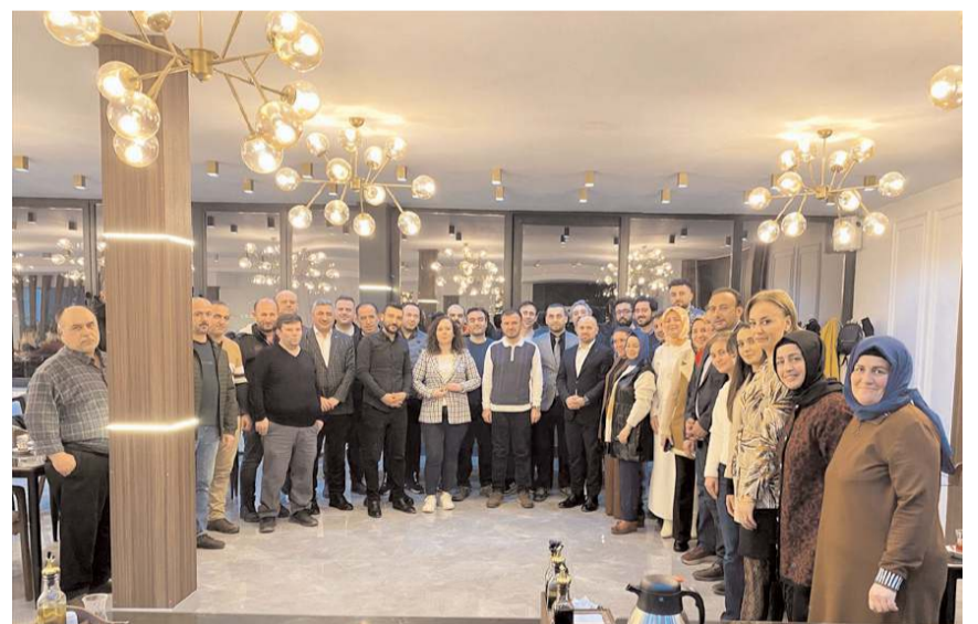
Yemeğin ardından hatıra fotoğrafı çekildi.