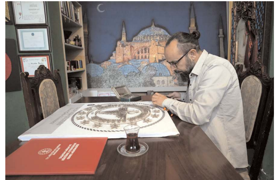
Ayasofya-i Kebir Camii Şerifi resminde 120 bin çivi kullanıldı.