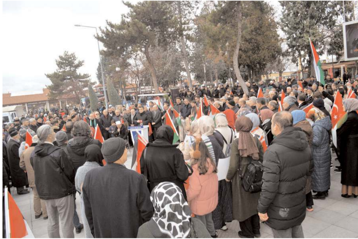
Saat Kulesi Meydanında yapılan basın açıklamasına katılım yüksek oldu.

Rabbimize şükürler olsun. Şam'ın fethini müslümanlara nasip eden rabbimiz bir gün Filistin'de de zafer nasip edecektir inşaallah. Kahrolsun İsrail, kahrolsun siyonizme destek veren ABD, Batılı küresel emperyalizm. Yaşasın Gazze direnişimiz. Yaşasın nehirde denize özgür Filistin. Yaşasın küresel intifada. Buradan Gazze'nin kahraman halkına, izzeti kuşanan liderlerine, şehid Yahya Sinvar'a, şehid İsmail Heniyye'ye ve daha nice yiğit kahramanlara selam olsun. Siyonist işgale direnen mücahitlere selam olsun. Tüm Çorum halkına selam olsun. Allah yar ve yardımcımız, yardımcınız olsun Allah'a emanet olun." Eylem yapılan duanın ardından sona erdi.