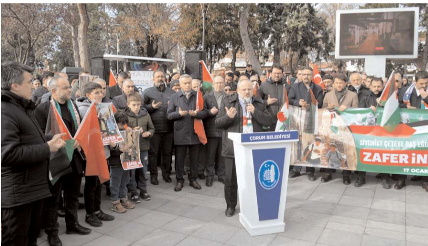
Eylem yapılan dua ile sona erdi.