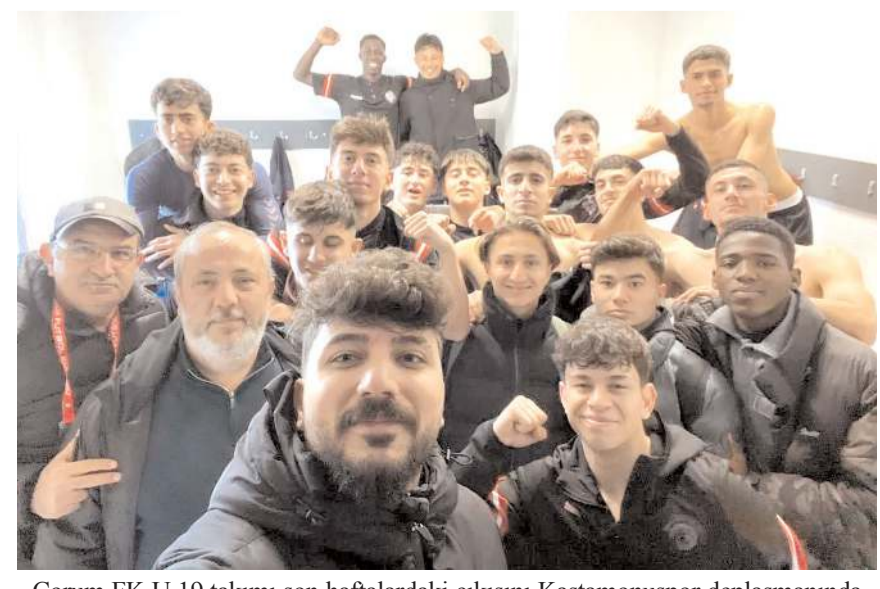
Çorum FK U 19 takımı son haftalardaki çıkışını Kastamonuspor deplasmanında sürdürerek ilk iki iddiasını devam ettirmek istiyor

Grupta Malatya spor ilk yarıyı 26 puanla yedinci sırada tamamlarken Arapgirspor takımı ise 18 puanla dokuzuncu sırada bulunuyor. Maç yarın saat 13'de Arapgir İlçe Stad'ında oynanacak.