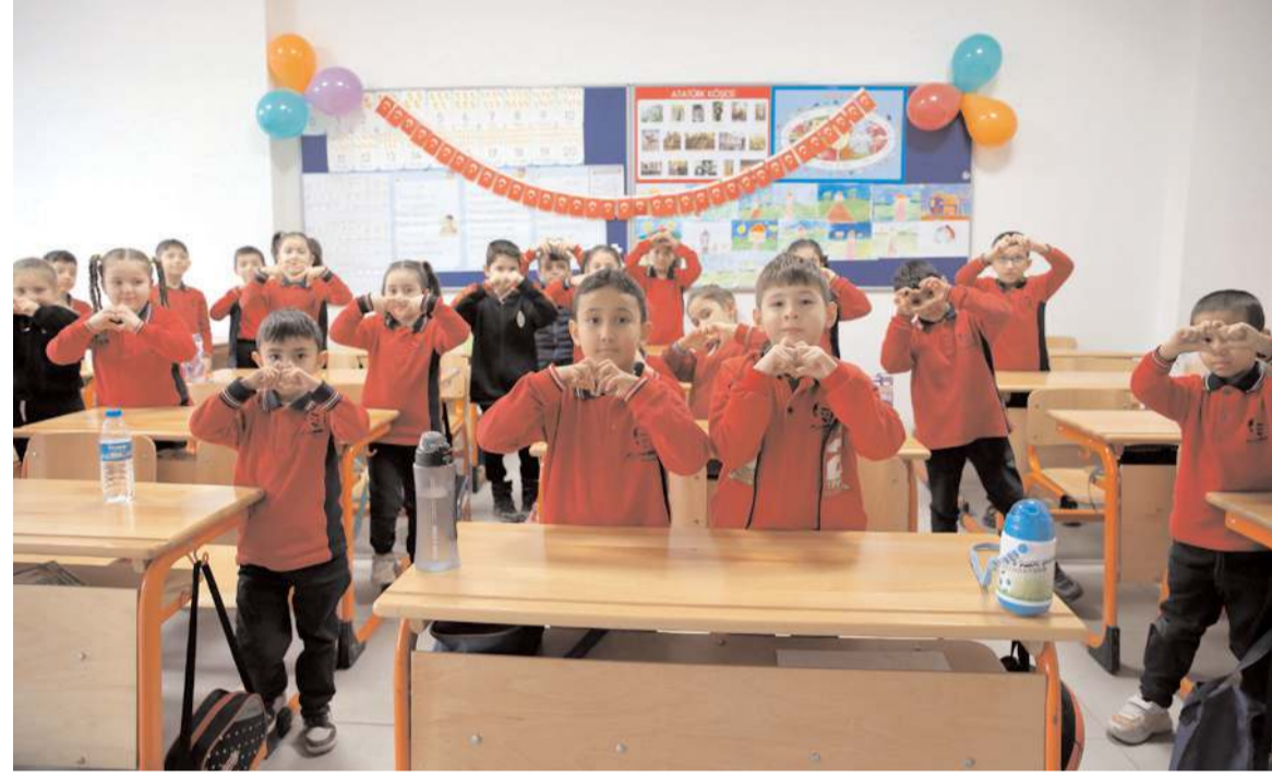
Karne dağıtım töreni Atatürk İlkokulu'nda yapıldı.

sinde İstiklal Marşı'nı okuyarak eğitim yılını sonlandırdı.