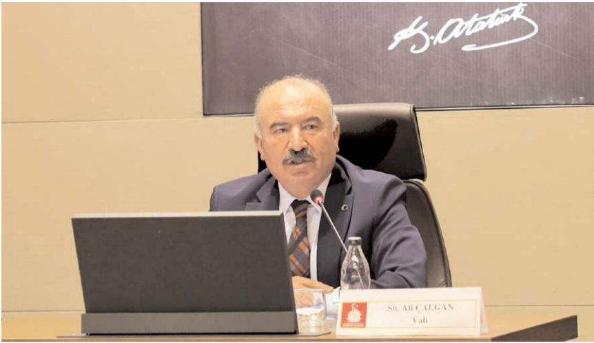
Toplantı Çorum Valisi Ali Çalgan'ın başkanlığında yapıldı.