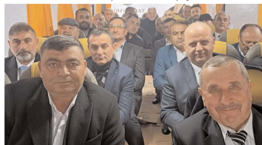
Muhtarlar Ortaköy Belediye Başkanı Taner İsbir'e teşekkür ettiler.