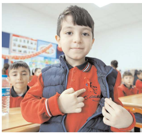
Öğrencilere kamelerini Çorum Valisi Ali Çalgan verdi.