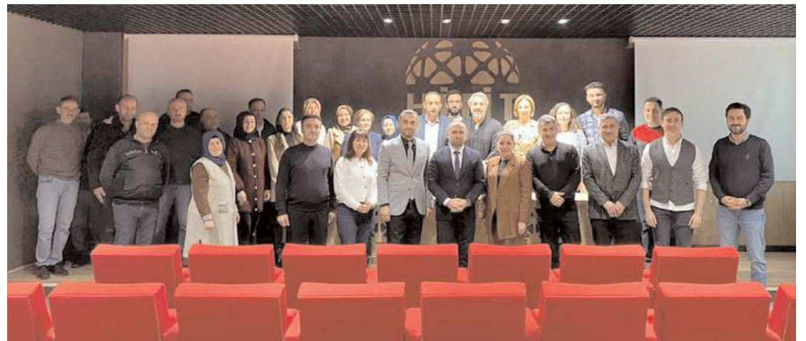
Hitit Üniversitesi Sungurlu Meslek Yüksekokulunda devir teslim töreni yapıldı.

Tören karşılıklı plaket ve çiçek takdiminin ardından düzenlenen veda yemeği ile sona erdi. (Haber Merkezi)