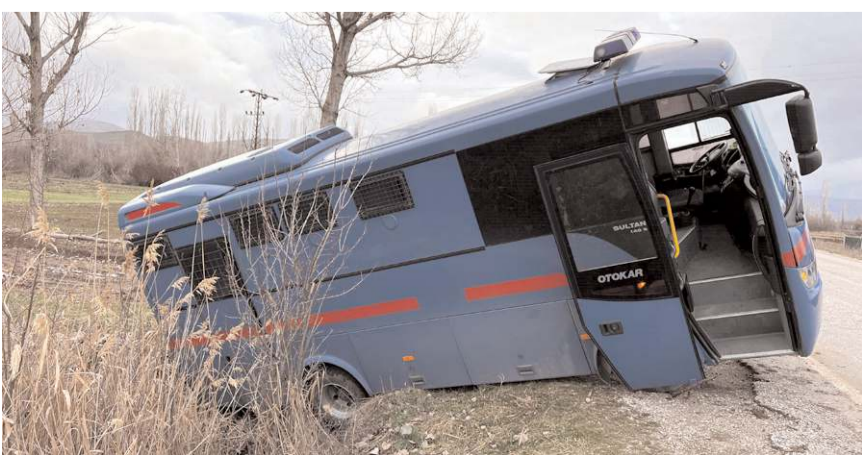
Kaza, Sungurlu-Alaca karayolunda meydana geldi.

Çorum'un Sungurlu ilçesinde hükümlü taşıyan nakil aracının yoldan çıkarak yan yattı. Araçta bu-