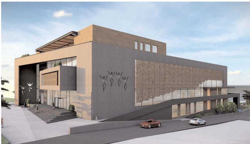
Projenin Kültür ve Turizm Bakanlığı Bakan Yardımcısı hemşehrimiz Gökhan Yazgı'nın ilçeyi ziyaretinde açıklaması bekleniyor.

Gökhan Yazgı'nın ayrıca Sungurlu'da yapılacakları kültür ve turizm yatırımları hususunda açıklamaları da bekleniyor. (Haber Merkezi)