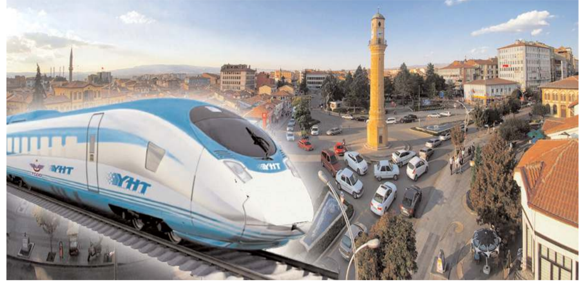
İhalenin ardından yüklenici firmalarla sözleşme imzalandı.

Bu arada yaklaşık 86 milyar TL'ye mal olacak projenin 2025 Yatırım Programı'na alınırken, 2025 yılında projeye 4 milyar TL'lik kaynak ayrıldığı öğrenildi.