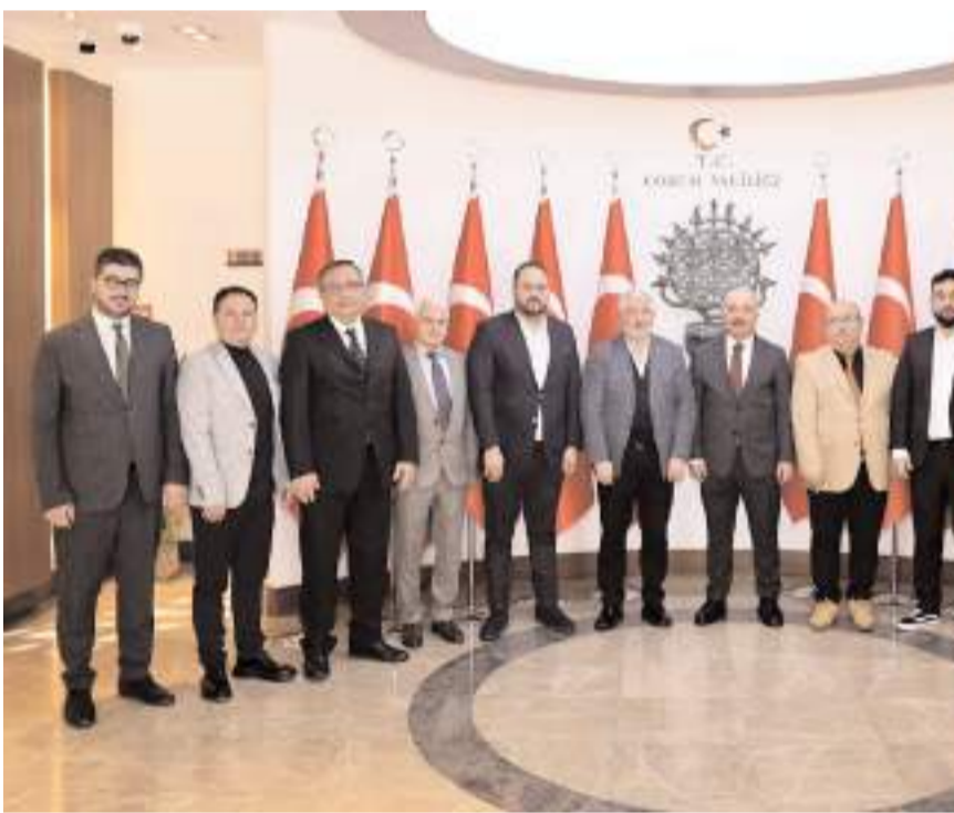
Ziyaretin sonunda toplu hatıra fotoğrafı çekinildi.