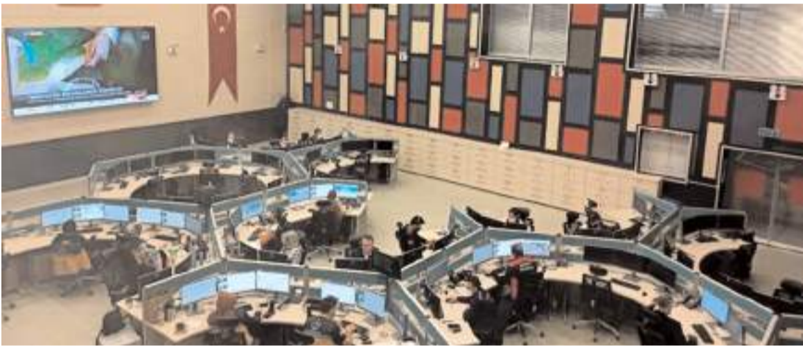
Çorum 112 Acil Çağrı Merkezi okullarda bilgilendirme çalışmalarında yapıyor.