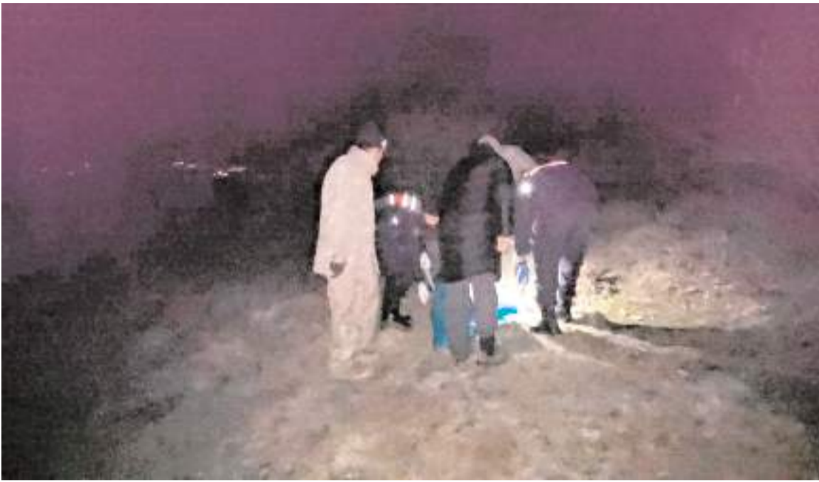
Sedat Uysal'ın cesedi Hızırde köyü yakınlarındaki ormanlık alanda bulunmuştu.

43 yaşındaki Uysal'ın cenazesi Ulumezarlık'ta toprağa verildi.