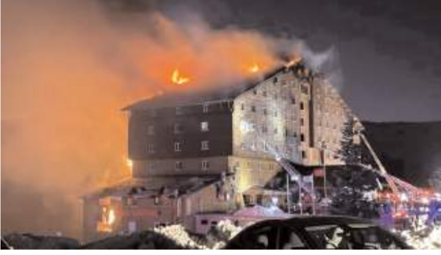
Yangında otel kullanılmaz hale geldi.