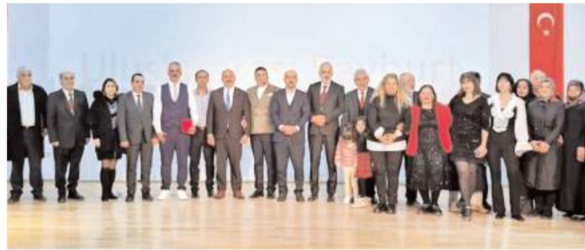
Programın sonunda hatıra fotoğrafı çekildi.