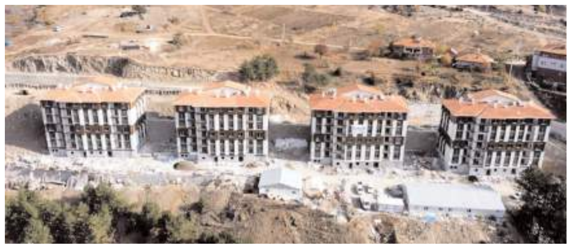
TOKİ Oğuzlar'da 106 konut inşa ediyor.

HAKİMİYET, genç çifti kutlar ömür boyu mutluluklar diler.