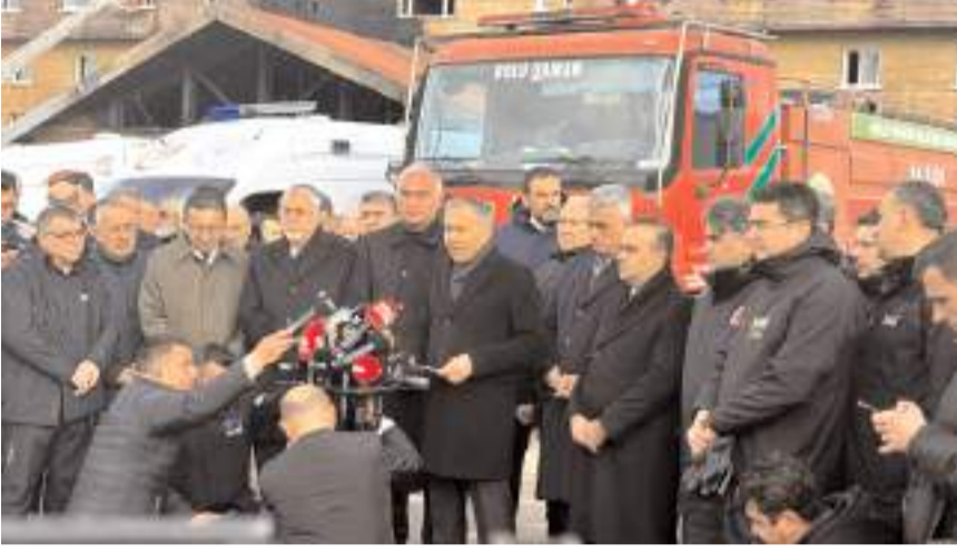
İçişleri Bakanı Ali Yerlikaya, yangınla ilgili açıklama yaptı.

Adalet Bakanı Yılmaz Tunç, 6 Cumhuriyet savcısının görevlendirildiği Bolu Kartalkaya Kayak Merkezi'nde otel yangınına