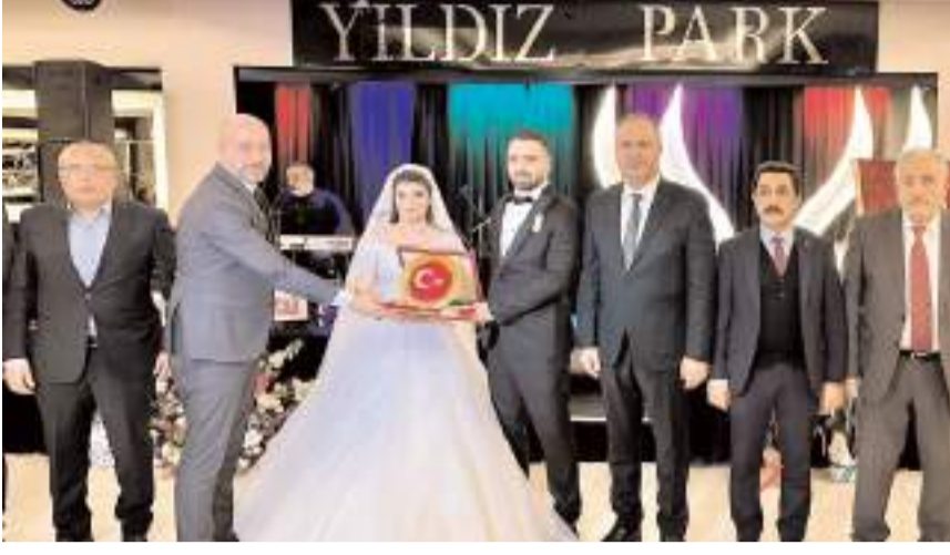
MHP heyeti genç çifti tebrik ederek hediye verdi.