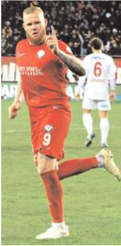
Thomas'ın kasiğinden sakatlığı bulunuyor

Ziraat Türkiye Kupası grup 2. maç programı açıklandı