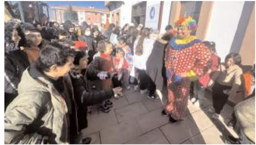
Tatil boyunca devam edecek olan etkinliklerin ilki Akkent Gençlik Merkezi'nde yapıldı.