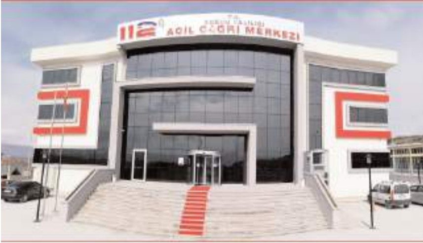
Çorum 112 Acil Çağrı Merkezine geçen yıl gelen toplam 615 bin 056 çağrının 281 bin 120'si asılsız çıktı.