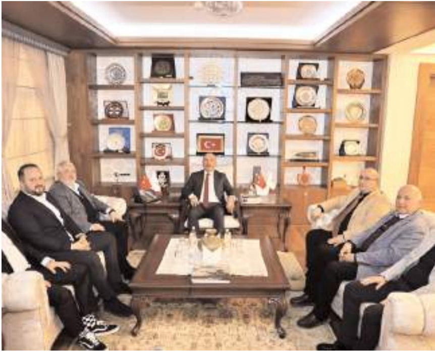
Ziyarette, Çorum Organize Sanayi Bölgesi'nin mevcut gelişimi ve geleceği üzerine görüş alışverişinde bulunuldu.