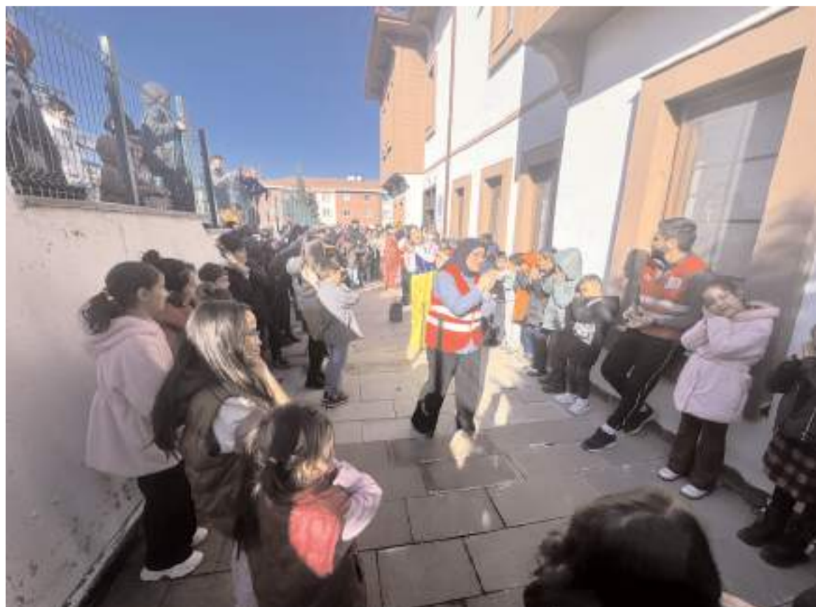
Çocuklar etkinliklerde gönüllerince eğlendiler.