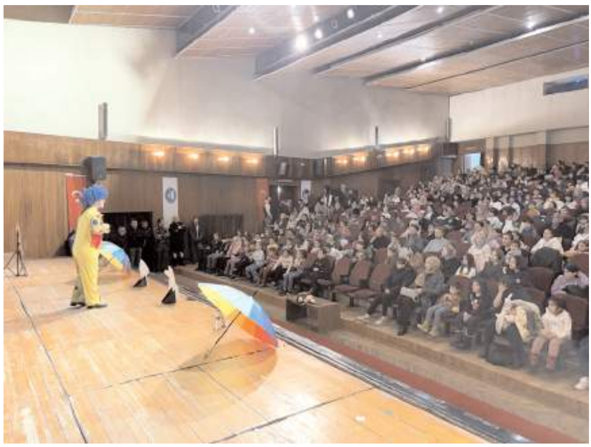
Oyun Devlet Tiyatro Salonu'nda sahnelendi.