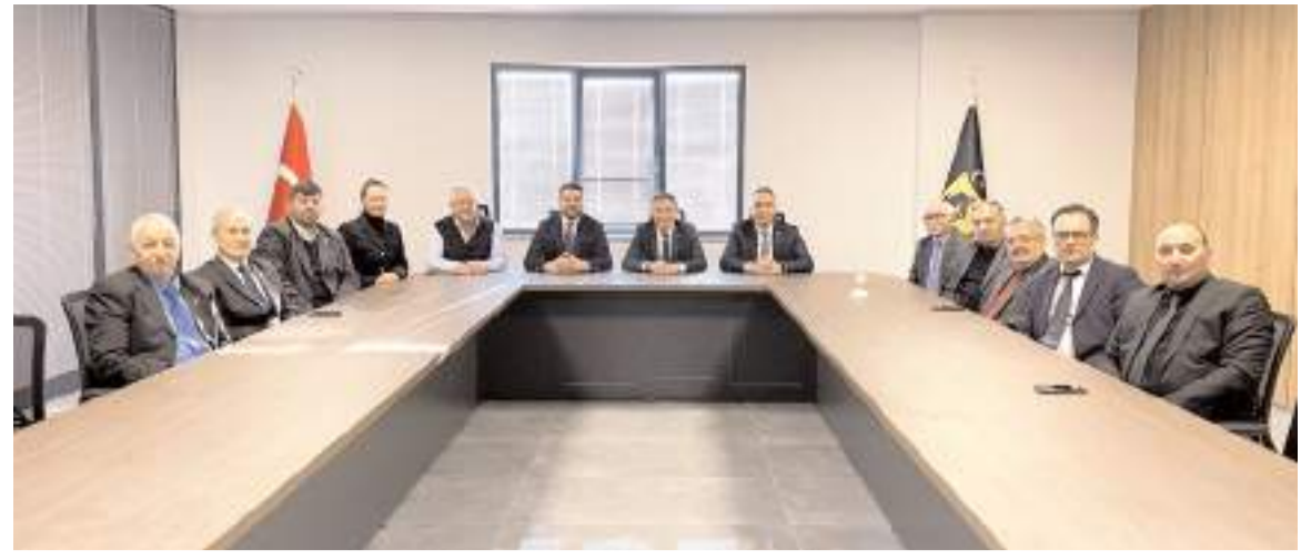
Cumhuriyet Halk Partisi heyeti Damızlık ve Sığır Yetiştiricileri Birliği'ni ziyaret etti.