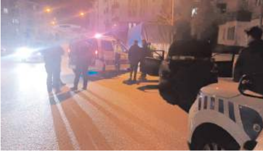
Olay Nurettin Bey Caddesi'nde meydana geldi.

Edinilen bilgiye göre, Çorum İl Emniyet Müdürlüğü ekipleri tarafından Nurettin Bey Caddesi'nde yapılan denetim sırasında durdurulmak istenen otomobil sürücüsü, "dur" ihtarına uymayarak kaçmaya başladı. Ekipler tarafından takibe alınan otomobil sürücüsü, kovalamaca neticesinde Aşıklar Tepesi mevkiinde yakalandı. Ekipler tarafından yapılan kontrolde kaçan A.T.'nin yetersiz ehliyetle araç kullandığı tespit edildi. Ekipler tarafından şahsa ilgili kural ihlallerinden 32 bin 245 TL cezai işlem uygulandı. Sürücünün kullandığı araç ise çekici yardımı ile otoparka çekildi. (İHA)