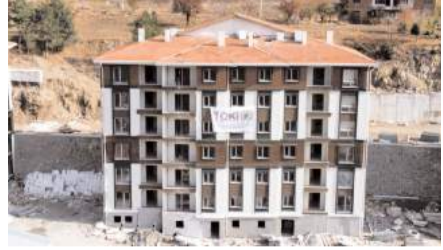
Konutlar Gölbaşı Mahallesi yapılıyor.

2021 yılında ihale edilerek inşaatına başlanan konutların bu yıl tamamlanarak hak sahiplerine evlerinin teslim edilmesi bekleniyor.