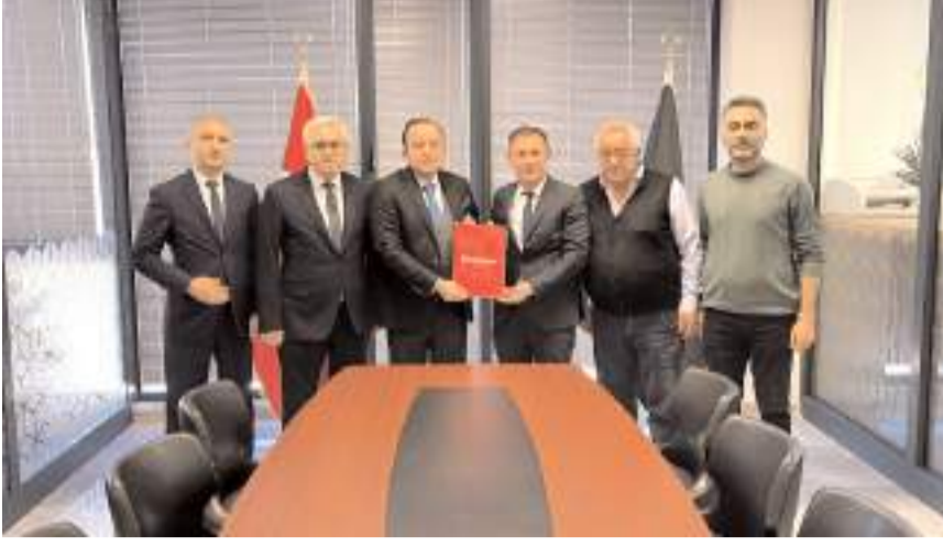
Damızlık Sığır Yetiştiricileri Birliği ile Ziraat Bankası arasında protokol imzalandı.