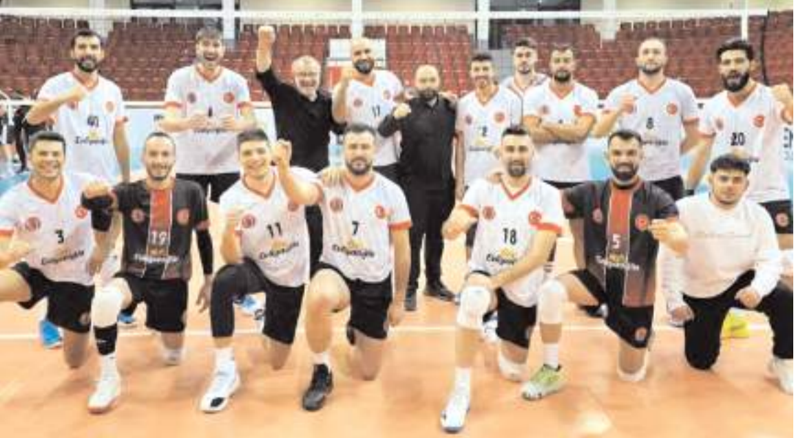
Sungurlu Belediyespor grubun namağlup lideri TVF Spor Lisesi önünde rakibin ünvanını almak için mücadele edecek

zorlu maçı Trabzon A klasman hakemi Sema Kayıkcı yönetecek. Kayıkcı'nın yardımcılığını ise Gümüşhane'den Bahtiyar Çelik yapacak. Maçın gözlemcisi ise Turgut Yıldırım.