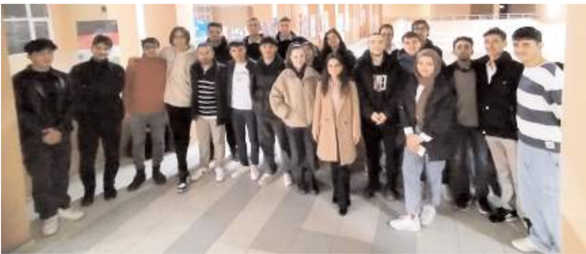
Öğrenciler Grafik ve Animasyon dersi kapsamında infografik posterler tasarladı.

huzurlu bir ortam sağlamak amacıyla işbirliğine devam edeceklerini belirtti. (Haber Merkezi)