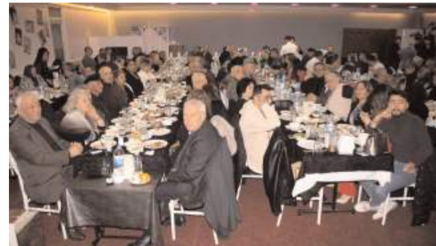
Etkinlik Güleriyüz Tesisleri'nde gerçekleştirildi.