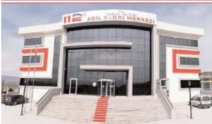
Toplam çağrının yüzde 46'sının asılsız olması durumu ciddiyetini ortaya koydu.

Çorum 112 Acil Çağrı Merkezi Müdürlüğü 2024 yılı istatistiklerini açıkladı. Geçen yıl toplam 615 bin 056 çağrı gelirken bunların 281 bin 120'si asılsız, 333 bin 936'sı ise gerçek çağrıdan oluştu. * HABERİ8'DE