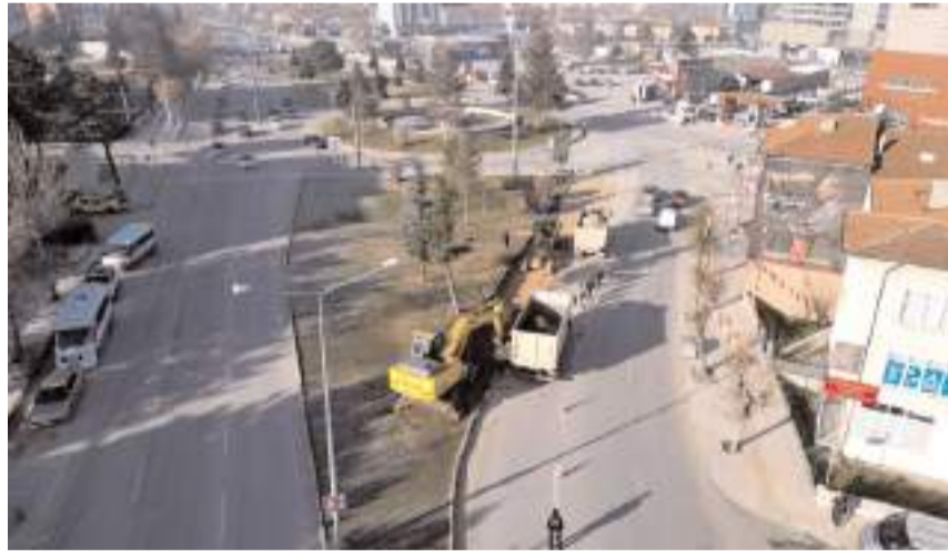
yoğunluğunun önüne geçilmesi hedefleniyor.

Ulaşım Hizmetleri Müdürlüğüne bağlı ekipler, kavşakta çalışmalarına başlarken, o bölgede yaşanan trafik