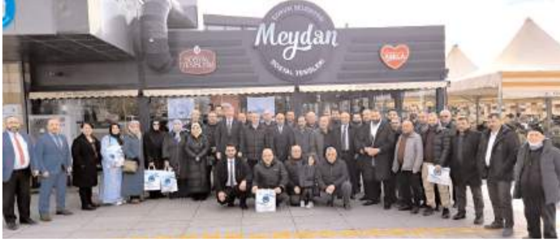
Türk Diyanet Vakıf-Sen Çorum Şubesi 2025 yılı istişare ve bilgilendirme toplantısı Çorum Belediyesi Meydan Sosyal Tesislerinde yapıldı.

Türk Diyanet Vakıf-Sen Genel Başkanı Nuri Ünal, Çorum'da yapılan toplantıda değerlendirmelerde bulunarak, "Diyanet ve vakıflar çalışanlarının mutlu ve huzurlu olması için mücadele ediyoruz. Diyanet çalışanları din görevlileri olarak bizler, bütün siyasi görüş ve düşüncülerin dışında, herkesin hocası olarak milletimize hizmet etmenin gayreti içerisindeyiz" dedi. * HABERİ2'DE