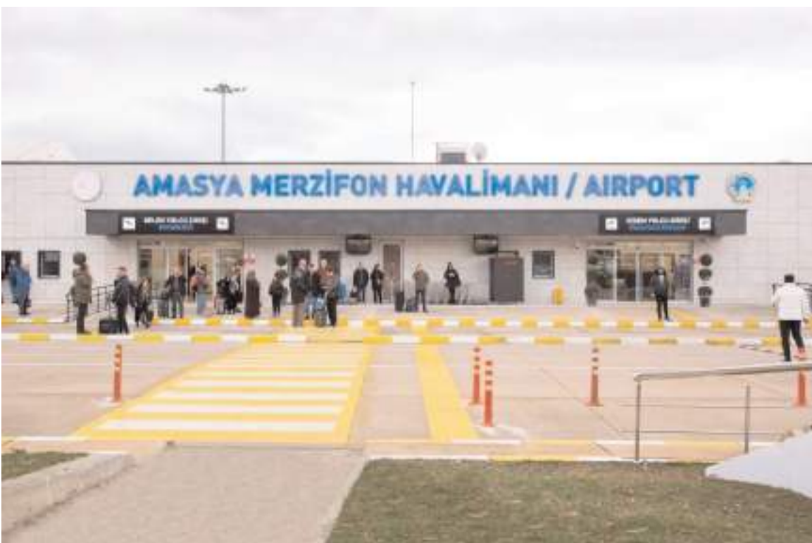
Amasya Merzifon Havalimanı'nda Aralık ayında, iç hat yolcu trafiği 11 bin 553 dış hat yolcu trafiği 3 bin 57 oldu.

aralık) dönemde ise Amasya Merzifon Havalimanı'nda yolcu trafiği 138 bin 661, uçak trafiği bin 105, yük trafiği (kargo+posta+bagaj) ise bin 227 ton olarak gerçekleşti.