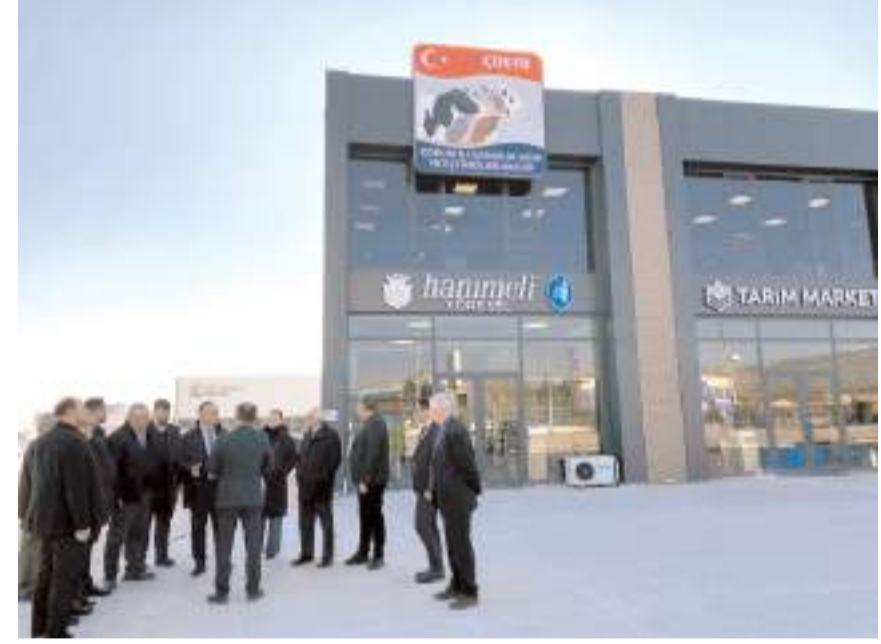
CHP heyeti Damızlık ve Sığır Yetiştiricileri Birliği'ni gezdi.

Birlik olarak her zaman çitayı üst seviyeye çıkarmaya