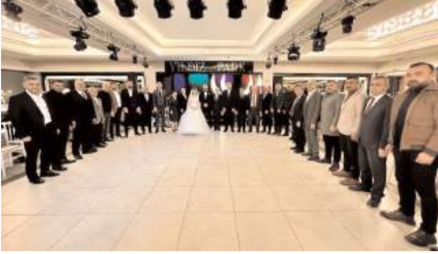
MHP heyeti ile genç çift hatıra fotoğrafı çekindi.