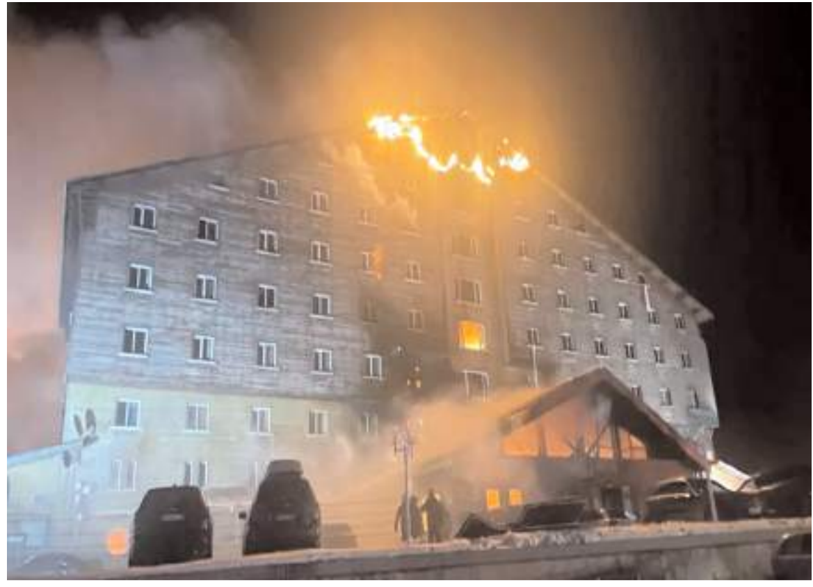
Yangın olayı 12 katlı Grand Kartal Otel'de meydana geldi.

Bolu'da, Koroğlu Dağlarının zirvesinde yer alan kayak merkezinde hizmet veren 12 katlı otelde, dün sabah saat 03.30 sıralarında çıkan yangında 66 kişi hayatını kaybederken, 51 kişi de yaralandı. Adalet Bakanı Yılmaz Tunç, 6 Cumhuriyet savcısının görevlendirildiği Bolu Kartalkaya Kayak Merkezi'nde otel yangınına ilişkin başlatılan soruşturma çerçevesinde aralarında işletme sahibinin de bulunduğu 4 kişinin gözaltına alındığını açıkladı. * HABERİ10'DA