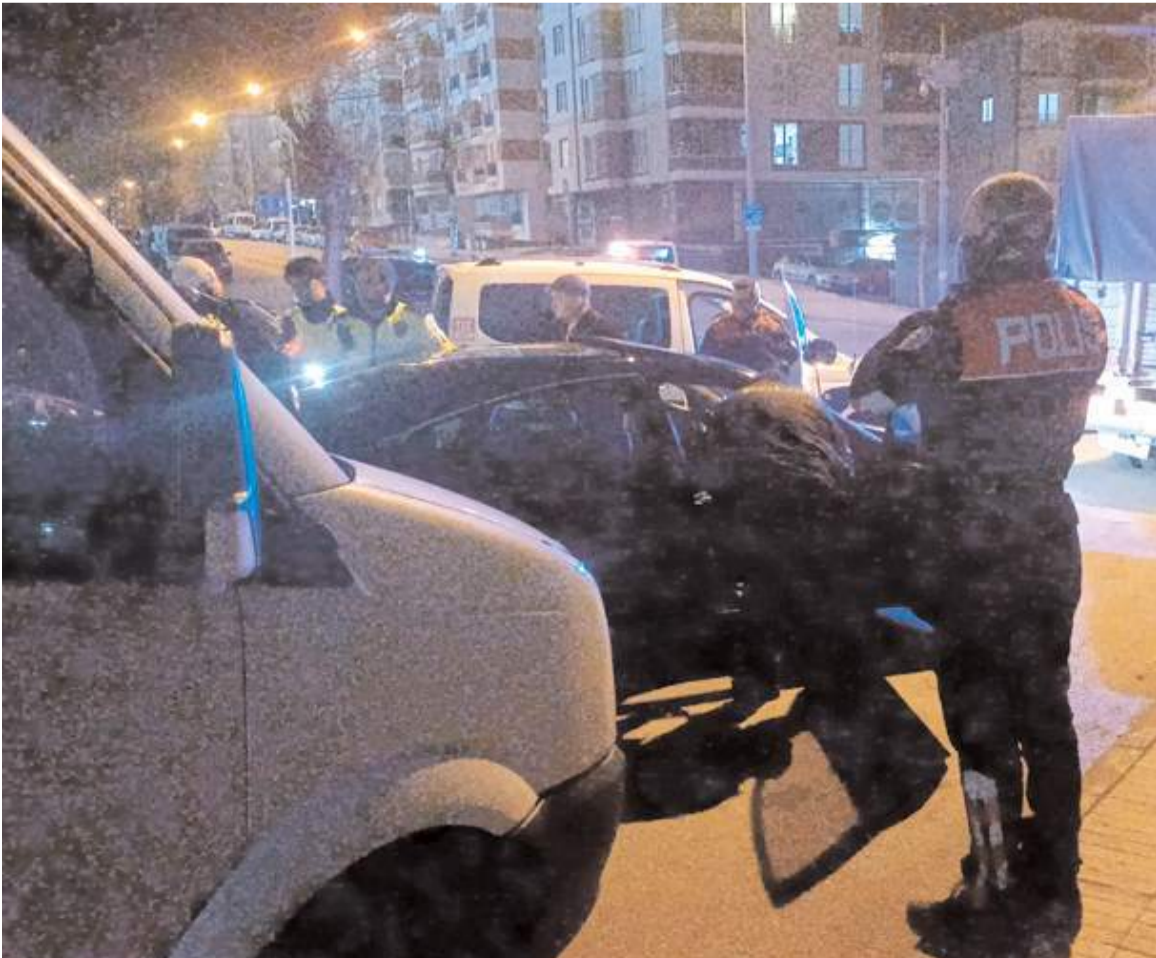
Otomobil sürücüsü, kovalamaca neticesinde Aşıklar Tepesi mevkiinde yakalandı.