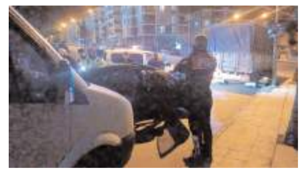
Otomobil sürücü, kovalamaca neticesinde Aşklar Tepesi mevkiinde yakalandı.

TÜİK'in bölgesel gayrisafi yurtiçi hasıla (GSYH) verilerine göre 10 yıllık sürede kişi başına gelir artışında en kötü performans yüzde 12.01'lik düşüş ile Çorum, Amasya, Tokat ve Samsun illerini kapsayan TR83 Bölgesi'nde yaşandı. * HABERİ4'TE