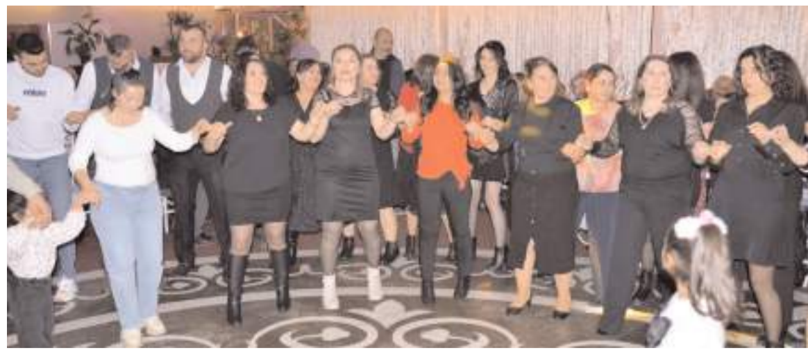
Geceye katılanlar gönüllerince eğlendiler.