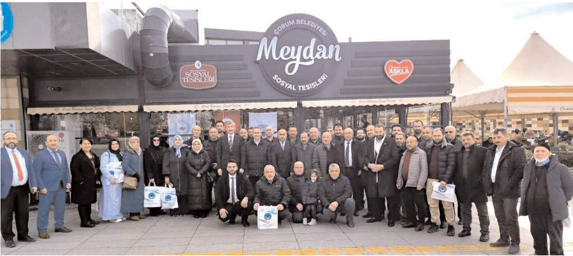
Türk Diyanet Vakıf-Sen Çorum Şubesi 2025 yılı istişare ve bilgilendirme toplantısı Çorum Belediyesi Meydan Sosyal Tesislerinde yapıldı.