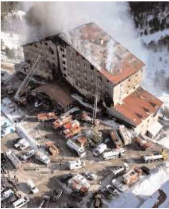
Yangına çok sayıda itfaiye aracı müdahale etti.

Çalışma ve Sosyal Güvenlik Bakanı Vedat Işıkhan, Kartalkaya Kayak Merkezi'ndeki otelde çıkan yangınla ilgili dört başmüfettiş görevlendirildiğini bildirdi.