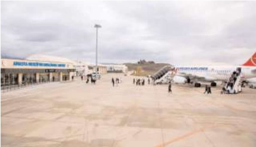
2024 yılı Aralık ayında Amasya Merzifon Havalimanı'nda 14 bin 610 yolcuya hizmet verildi.

Buna göre; Amasya Merzifon Havalimanı'nda Aralık ayında, iç hat yolcu trafiği 11 bin 553 dış hat yolcu trafiği 3 bin 57 oldu. Böylece Aralıkta toplam 14 bin 610 yolcuya hizmet