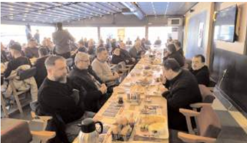
Toplantıya katılım yüksek oldu.