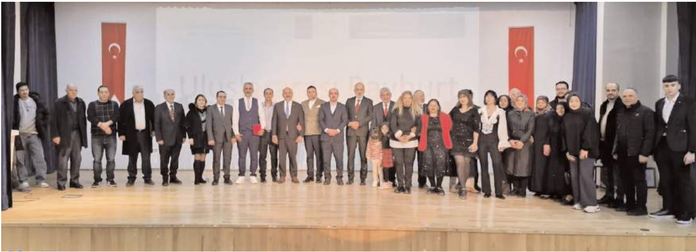
6. Uluslararası Şair Zihni Kültür Sanat Ödülleri Çorum Belediyesi Buhara Kültür Merkezinde yapılan törenle verildi.