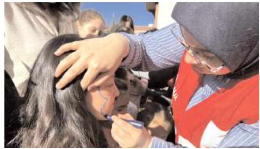
Şenlikte yüz boyama yapıldı.