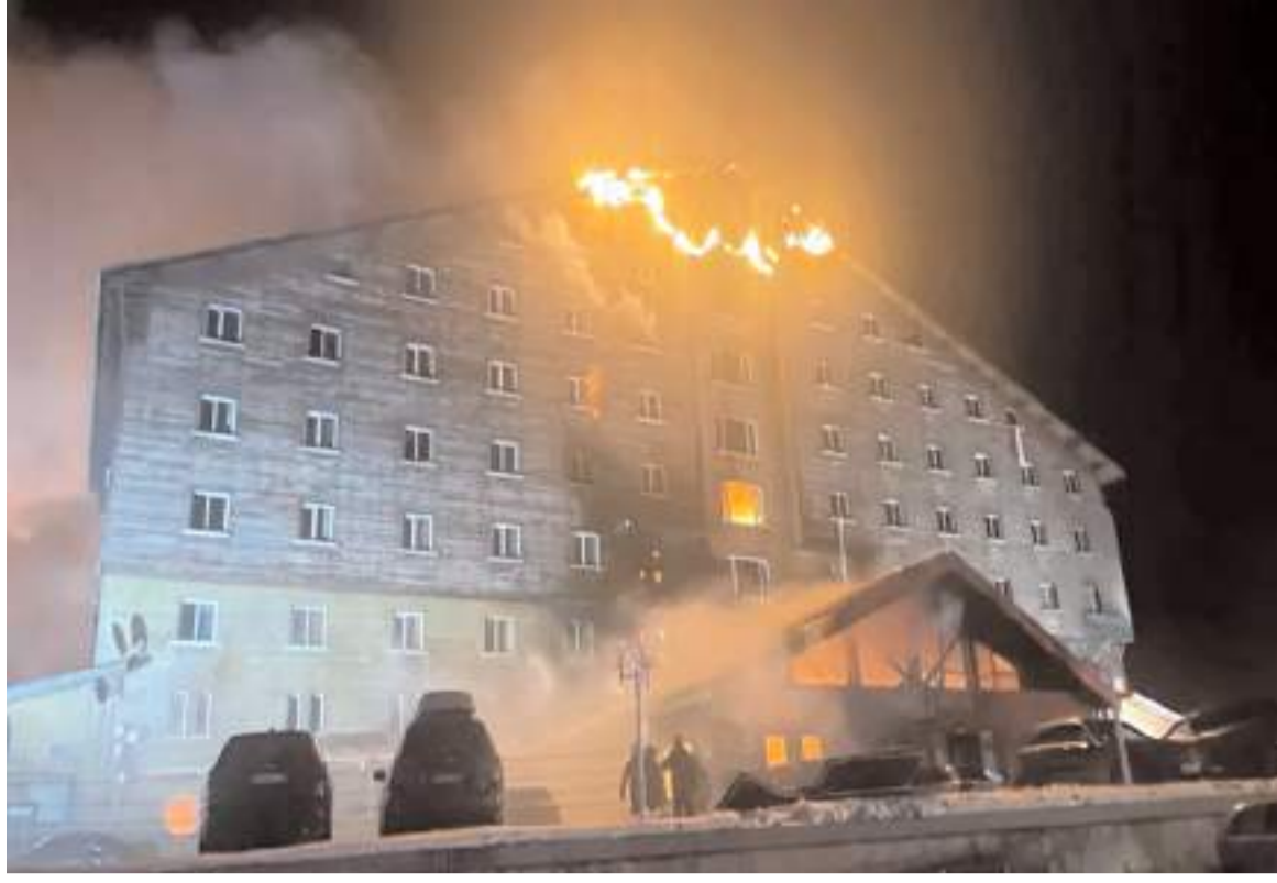
Yangın olayı 12 katlı Grand Kartal Otel'de meydana geldi.