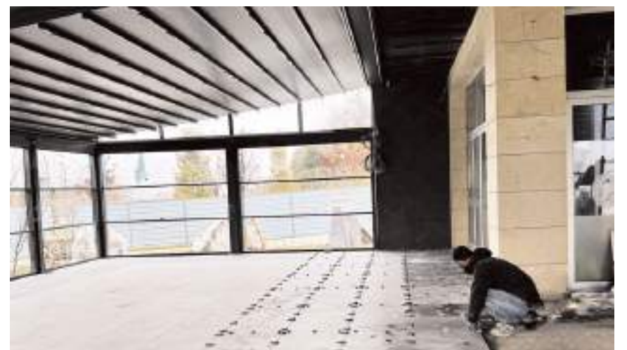
Kadınlar Lokalinde son rötuşlar yapılıyor.