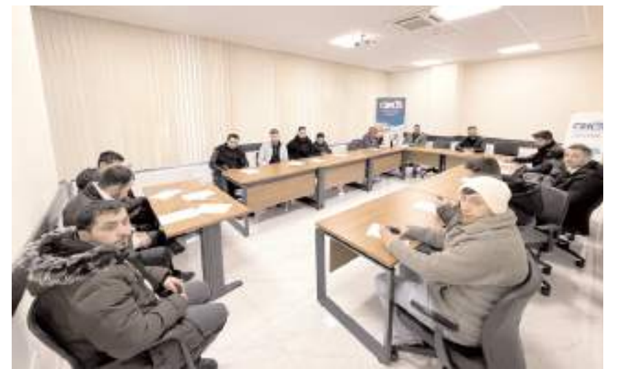
Başvuru şartlarını karşılayan 26 kişi görüşme için ÇOKİŞ'e davet edildi.

ÇOKİŞ aracılığıyla açılan personel alım ilanına başvurular kısa süre içerisinde dolarken başvuru şartlarını karşılayan 26 kişi görüşme için ÇOKİŞ'e davet edildi. TMA İnsan Kaynakları ve İdari İşler Müdürü tarafından gerçekleştirilen mülakatlarda adaylarla yüz yüze görüşmeler sağlandı. Sungurlu İhtisas Savunma Sanayi Bölgesinde hizmet veren TMA Fişek Fabrikasına personel alımı için ÇOKİŞ Karriyer Merkezi'nde gerçekleştirilen toplu görüşmenin ardından şartları karşılayan personellerin kısa süre içerisinde açıklanacağı belirtildi. (Haber Merkezi)