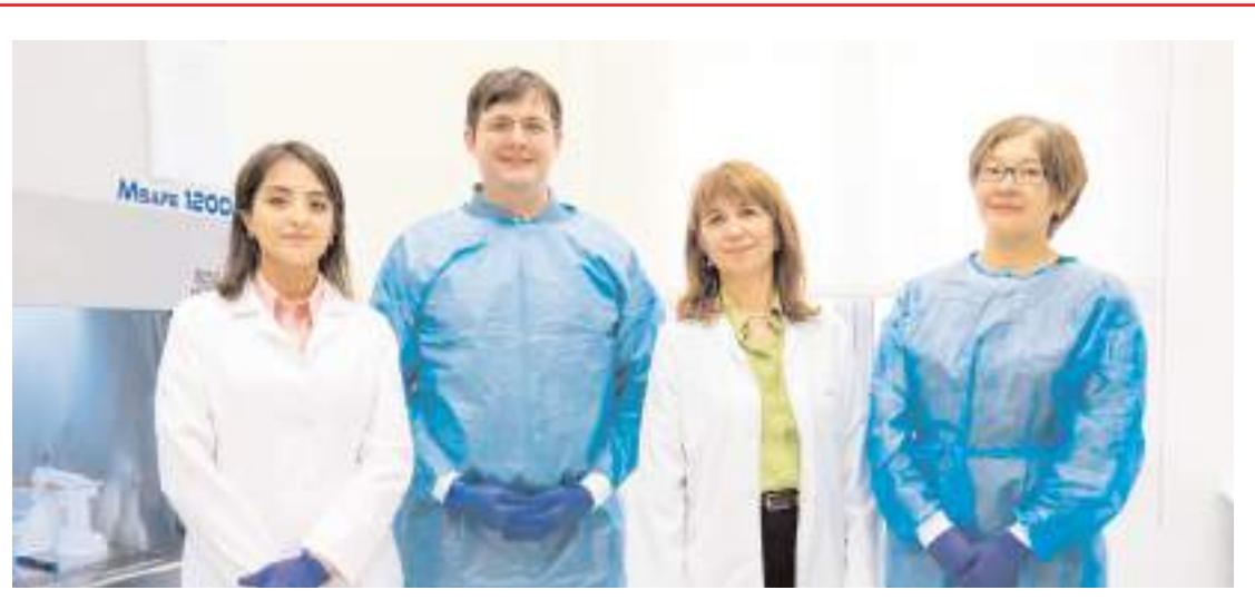
Amerikan Ulusal Sağlık Enstitüsünün desteğiyle Hitit Üniversitesi Teknoloji Merkezinde yeni bir laboratuvar kuruldu.