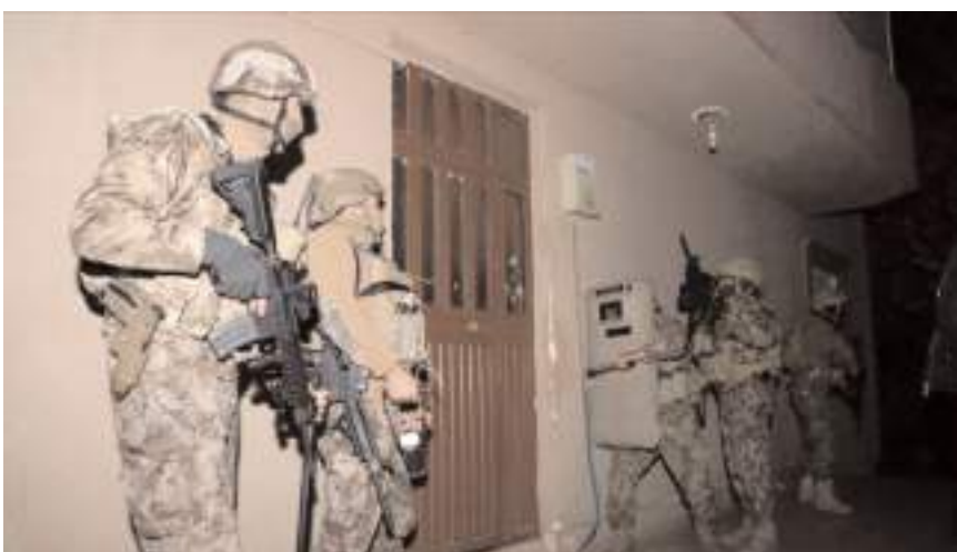
Operasyonlarda 100 şüpheli terör örgütü mensubu yakalandı.

talya, Çankırı, Çorum, Düzce, Eskişehir, Gaziantep, İstanbul, Kahramanmaraş, Kocaeli, Kırşehir, Mersin, Nevşehir, Sakarya, Samsun, Şanlıurfa, Yalova, Amasya, Çanakkale, Diyarbakır, Kayseri, Kırıkkale, Elazığ ve Malatya'da düzenlenen operasyonlarda yakalanan şüphelilerin; DEAŞ terör örgütü içerisinde faaliyet gösterdikleri, terör örgütüne finans sağladıkları ve sosyal medya hesapları üzerinden DEAŞ terör örgütünün propagandası yaptıkları tespit edildi. Operasyonlar sonucu, örgütsel doküman ve dijital materyal ele geçirildi. Operasyonları koordine eden Cumhuriyet Başsavcılıklarımızı ve operasyonları gerçekleştiren kahraman polislerimiz ile kahraman jandarmamızı tebrik ediyorum" ifadelerini kullandı. (İHA)