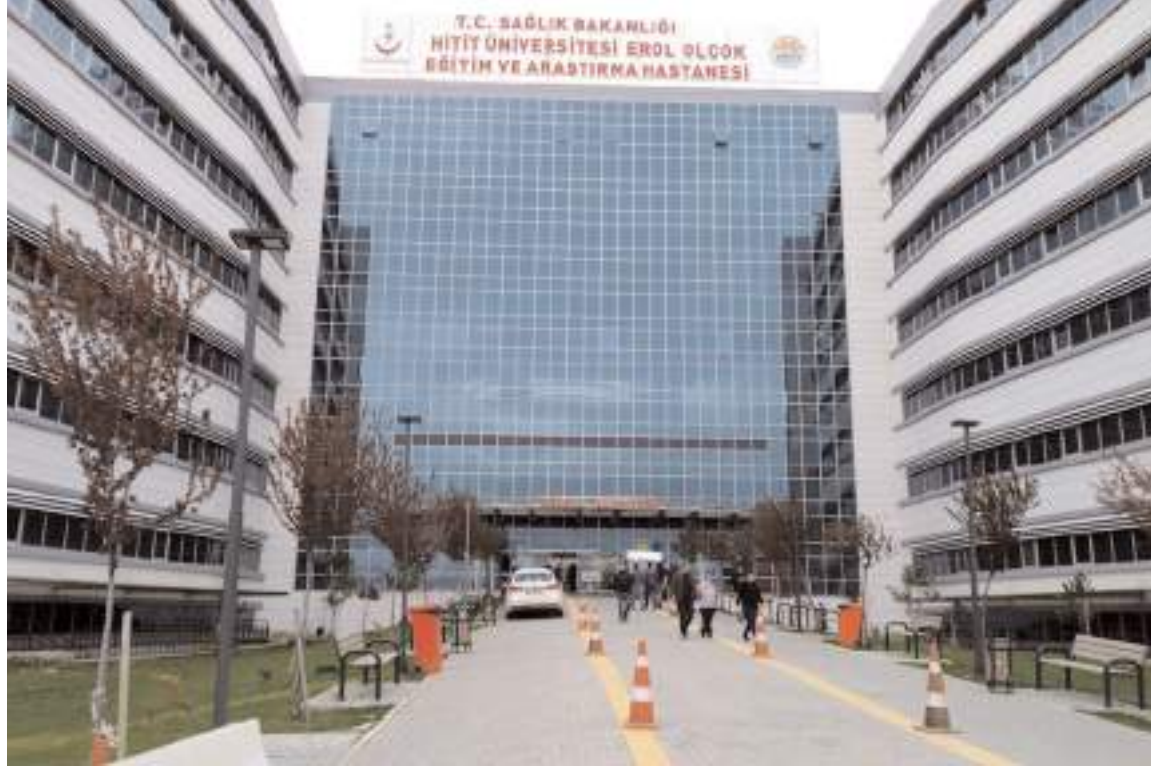
"Mesai Dışı Poliklinik Hizmeti" uygulaması, hafta içi her gün 17:00 / 20:00 saatleri arasında devam ediyor.