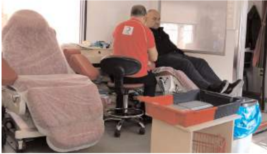
Kan bağışında bulunmak isteyenler Atatürk Meydanı'nda kurulan gezici kan bağışı aracına gidebilirler.

Türk Kızılay'ı Çorum Kan Bağışı Merkezi ekibi, Sungurlu'da kan bağışı kampanyası başlattı.