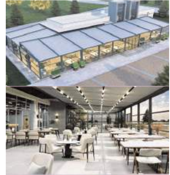
Çorum Belediyesi Kadınlar Lokali Millet Bahçesi'nde yer alıyor.