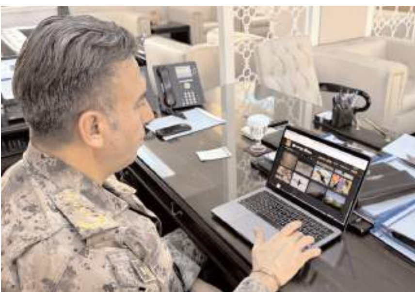
Seçkide çok güzel fotoğrafların yer aldığını belirten Pehlivan, AA çalışanlarına teşekkür etti.