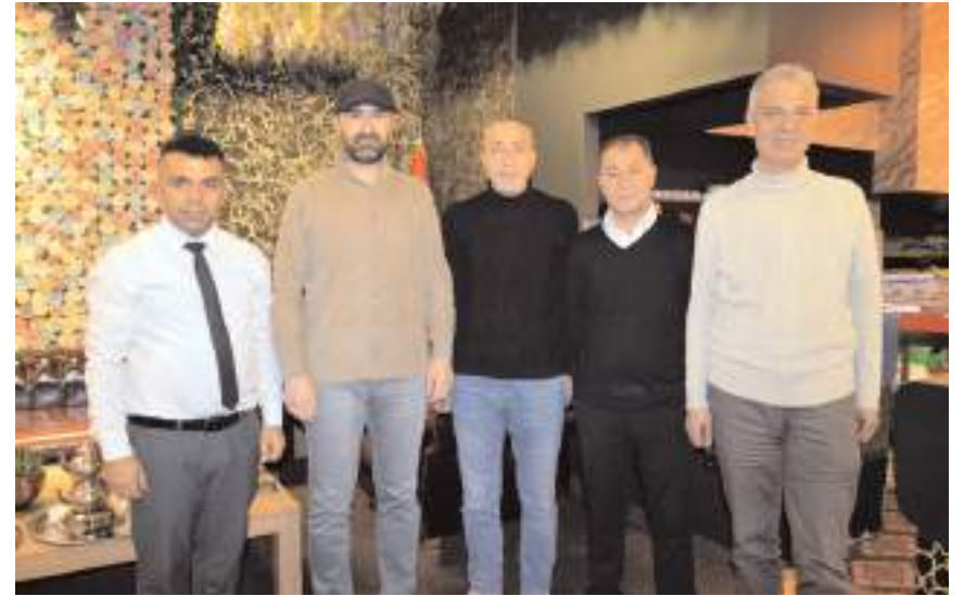
Yemek programı Közde Mangal Restoran'da gerçekleştirildi.