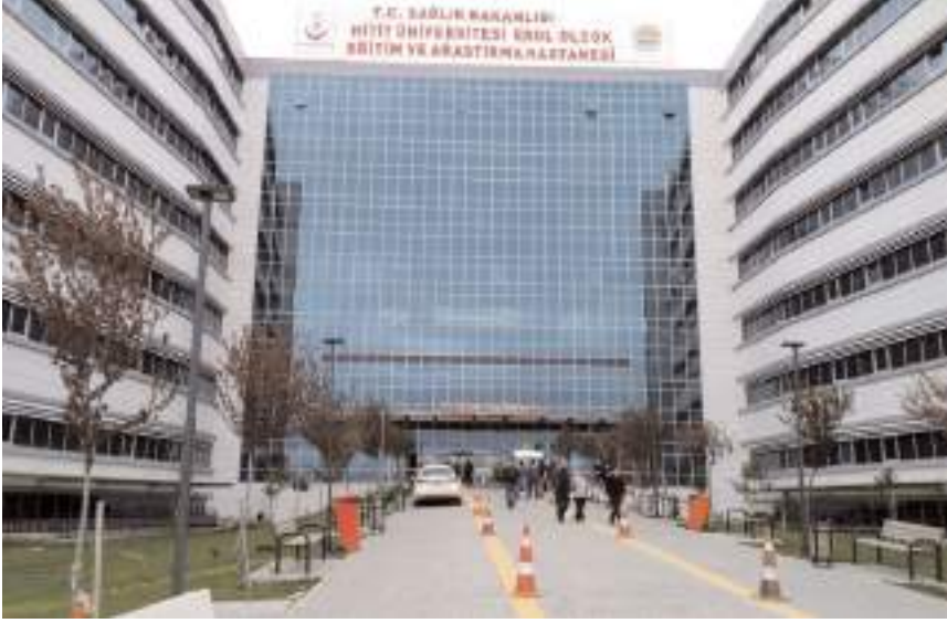
"Mesai Dışı Poliklinik Hizmeti" uygulaması, hafta içi her gün 17:00 / 20:00 saatleri arasında devam ediyor.

Mesai dışı poliklinikler MHRS sistemine tanımlanırken, poliklinik randevusu almak 182 nolu telefondan alınabilecektir.