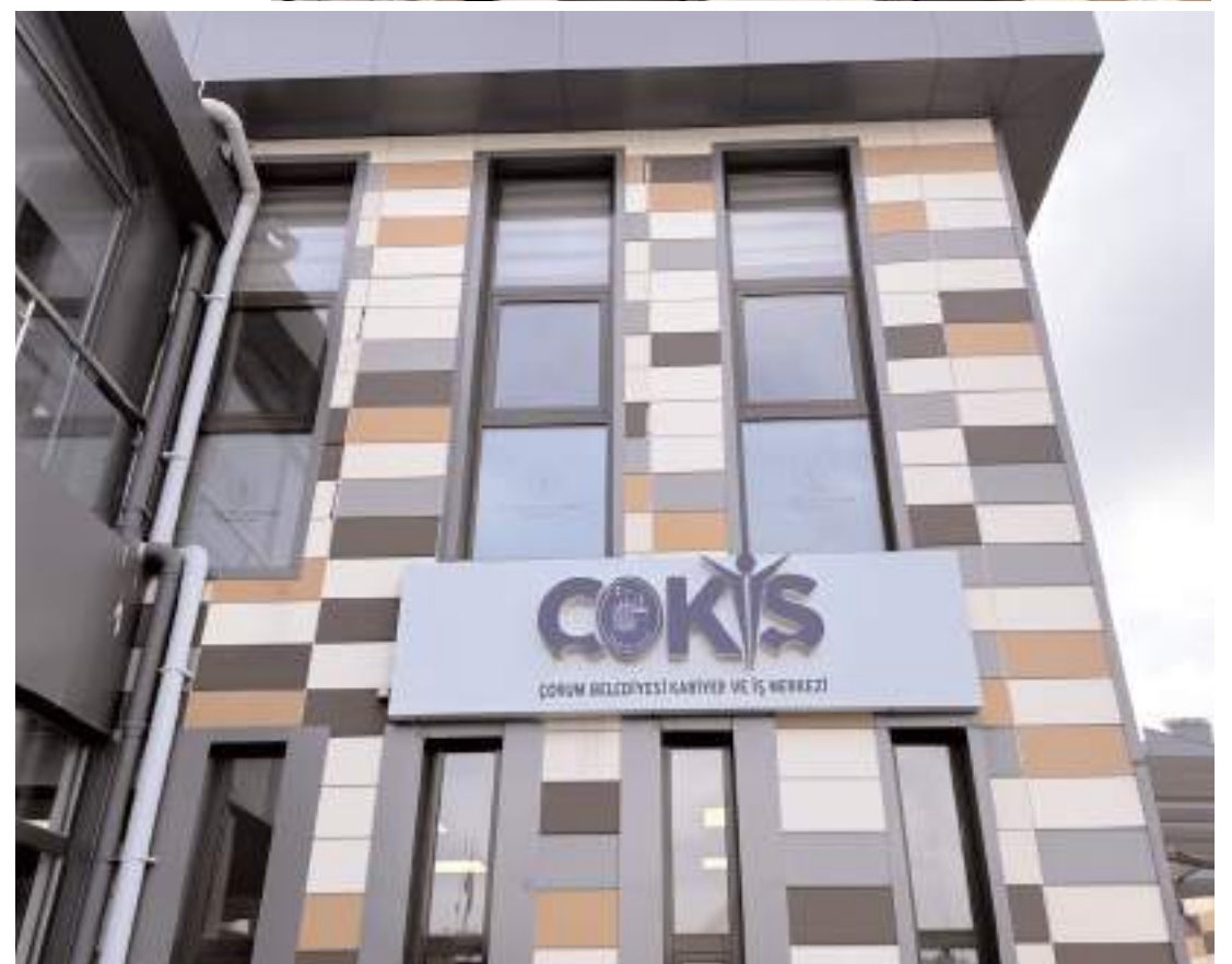
ÇOKİŞ Kadeş Barış Meydanında bulunuyor.