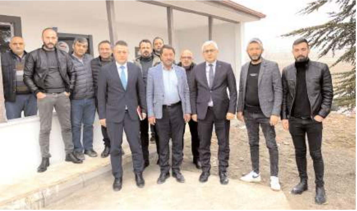
Ziyaretin sonunda hatıra fotoğrafı çekildi.