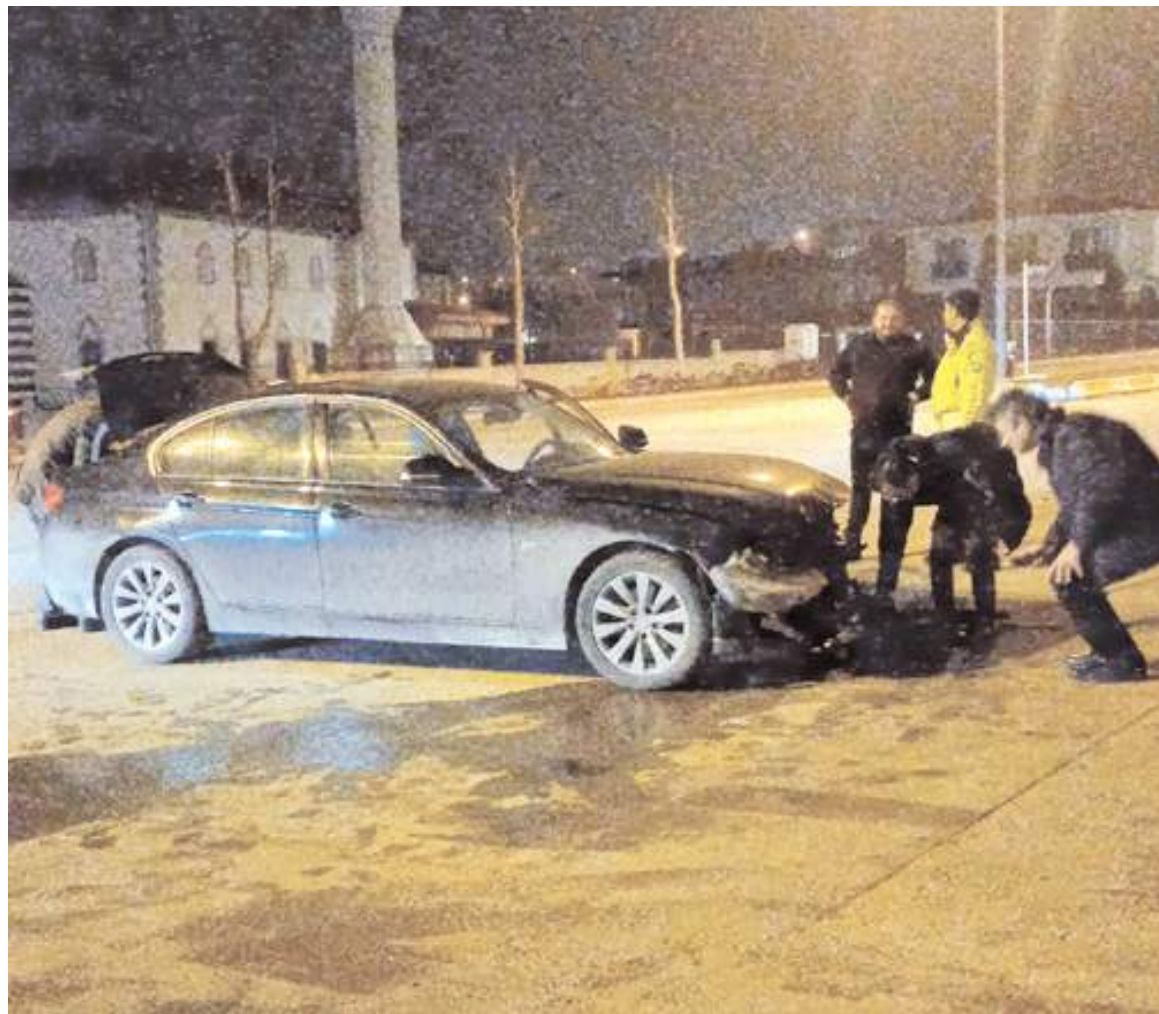
Kazada araçlarda maddi hasar meydana geldi.

Çorum'da iki araca çarpan otomobilin sürücüsü, kazadan yara almadan kurtuldu. Kazanın saniye saniye güvenlik kamerasına yansıdı.