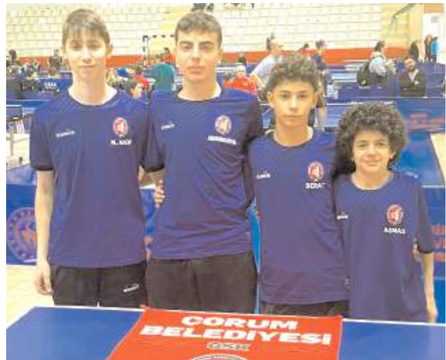
Çorum Belediyespor B takım 11. olarak klasmanda mücadele etmeye devam edecek

2. liginde ilk iki etap sonunda ilk sekiz takım final grubunda mücadele edecek. Liginde Altay, Yıldırımspor, Çorum Belediyespor B takımı, Isparta Genç Hareketspor, Gaziantep Belediyespor, Yalova Belediyespor, Çorum Gençlik ve Antakya Belediyespor takımları kendi aralarında yaptıkları maçlar sonunda son altı sırada alan takımlar 3. lige düşecek.