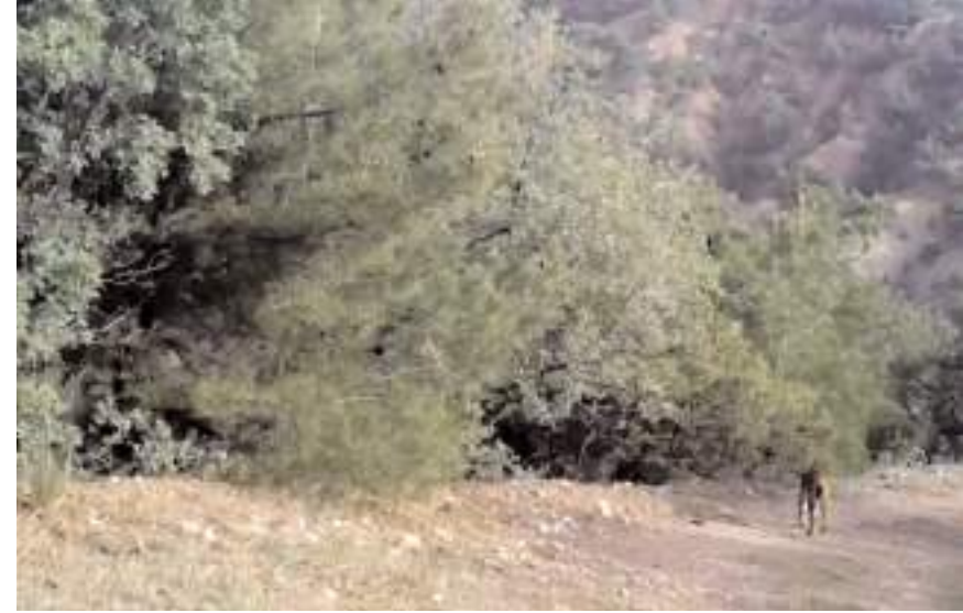
Nesli tükenmekte olan vaşakta görüntülendi.