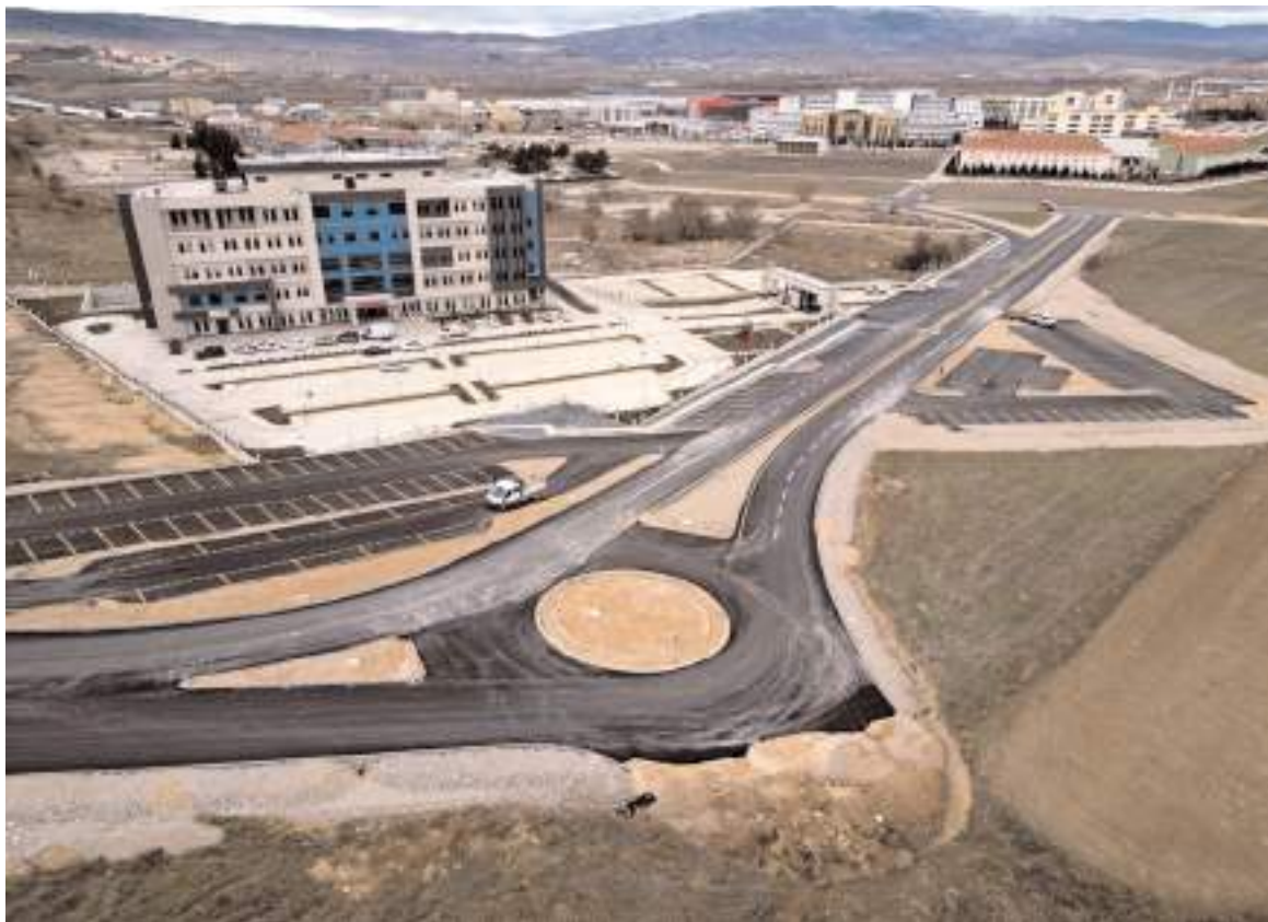
Ömer Emiroğlu Ağız ve Diş Sağlığı Hastanesinde ise Şubat ayında mesai dışı poliklinik hizmeti Salı ve Perşembe günleri saat 17:00-19:00 arasında verilecek.