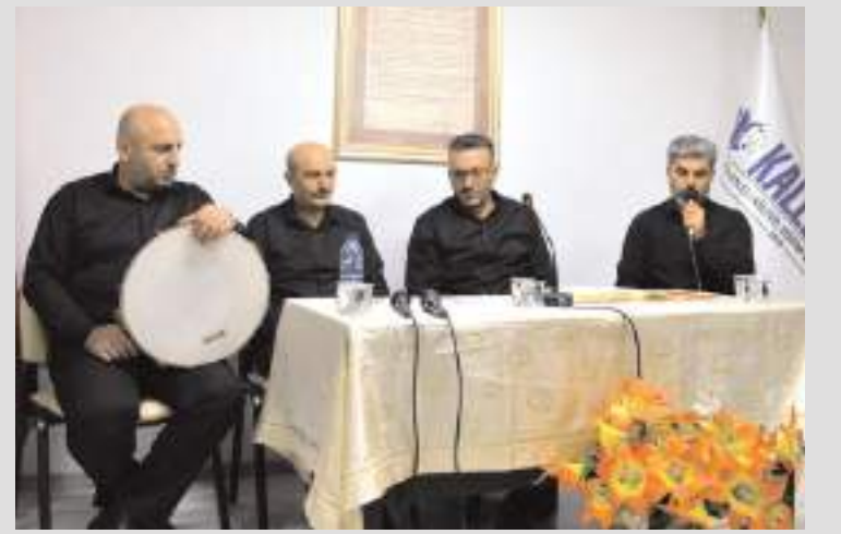
Tasavvuf musikisi korusu ilahi, naat ve kasideler seslendirdi.

hüzünleri beraberce paylaştığı kendisine her zaman destek olan hayat arkadaşı Hz. Hatice'yi kaybetti. Bütün bunlar azmını kırmadı. Yanına evlatlığı Zeyd'i alarak bir ümit ışığı yakalayabilmek amacıyla Taif'e gitti. Hedefi Taiflileri ikna ederek Mekke'de bulamadığı desteği burada temin edebilmekte. Gel gör ki Taifliler ona inanmadıkları gibi, alay ettikleri, hatta ayakta kımıldamaya çalışarak taşa tutturdular. Hz. Peygamber karşılaştığı bunca eziyete rağmen, kendisini taşa tutan serisi gürhu için dua etti. Yüce Allah'tan onların soyundan yalnız Allah'a ibadet eden, ona hiçbir şeyi ortak koşmayan bir nesil çıkartmasını niyaz etti. En sıkıntılı zamanında gördüğü bunca eziyete rağmen alicenaplığı göstermiş, kendisini taşıyanların ıslahını istemek suretiyle âlemlere rahmet olduğunu ortaya koymuştur. İşte Miraç mucizesi Hz. Muhammed'e bu olayların ardından hem bir teselli kaynağı olmuş hem de artık Hicretle bir-