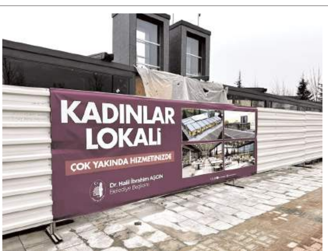
Çorum Belediyesi Kadınlar Lokali Millet Bahçesi'nde yer alıyor.

Belediye Başkanı İsmail Çizikci ise, taziye ziyaretinden duyduğu memnuniyetini dile getirerek, "Bizleri bu acılı günde ziyaret ederek, acılarımızı paylaşan ve taziye ziyaretinde bulunan Taner İsbir'e teşekkür ederim" dedi. (Haber Merkezi)