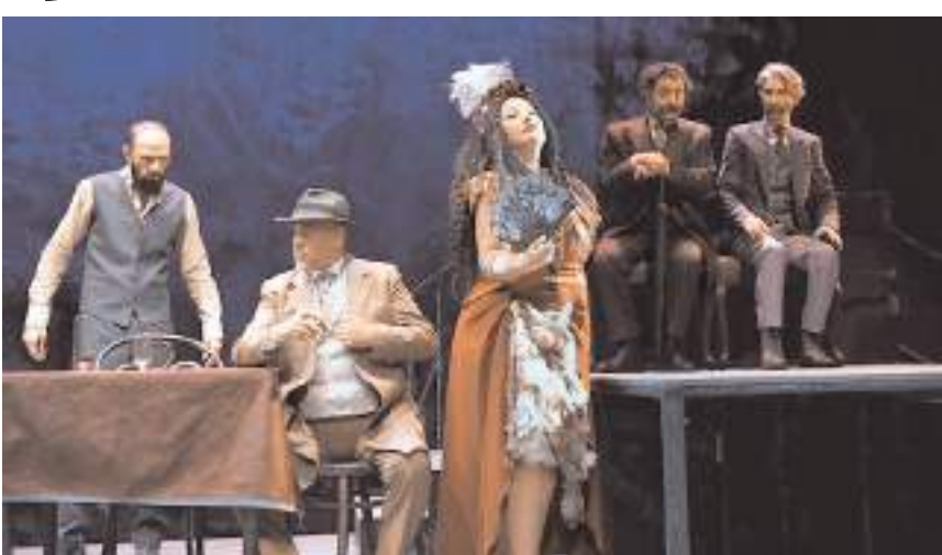
Oyun 31 Ocak Cuma ve 1 Şubat Cumartesi günü sahnelenecek.