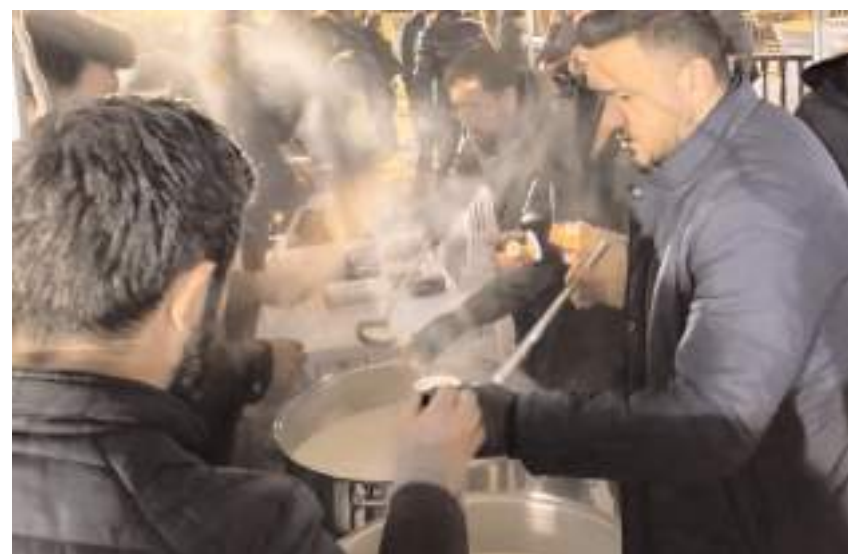
Çorum Damızlık Sığır Yetiştiricileri Birliği, Miraç Kandili gecesinde geleneği bozmayarak vatandaşlara süt ikram etti.