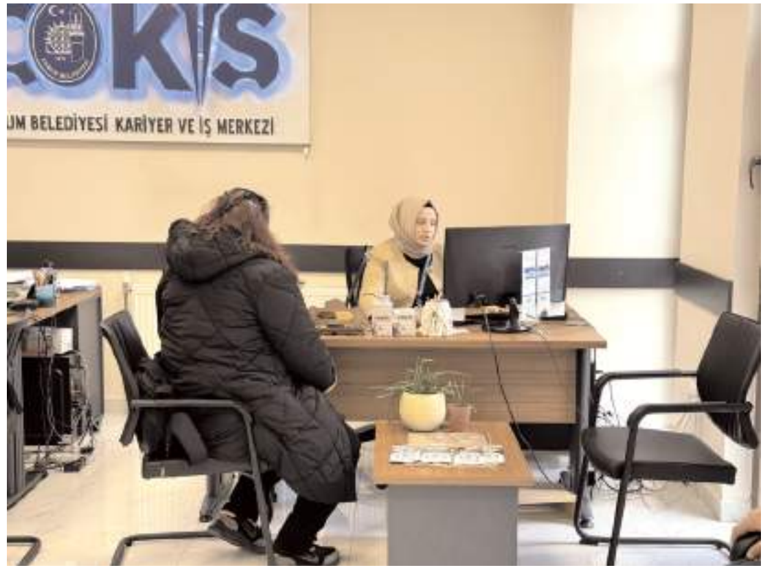
ÇOKİŞ TMA Fişek Fabrikası'nın personel alımına aracı oldu.

Gözaltına alınan 2 şüpheli, emniyetteki işlemlerinin ardından sevk edildikleri adliyeye çıkarıldıkları hakimlikçe tutuklandı.(AA)