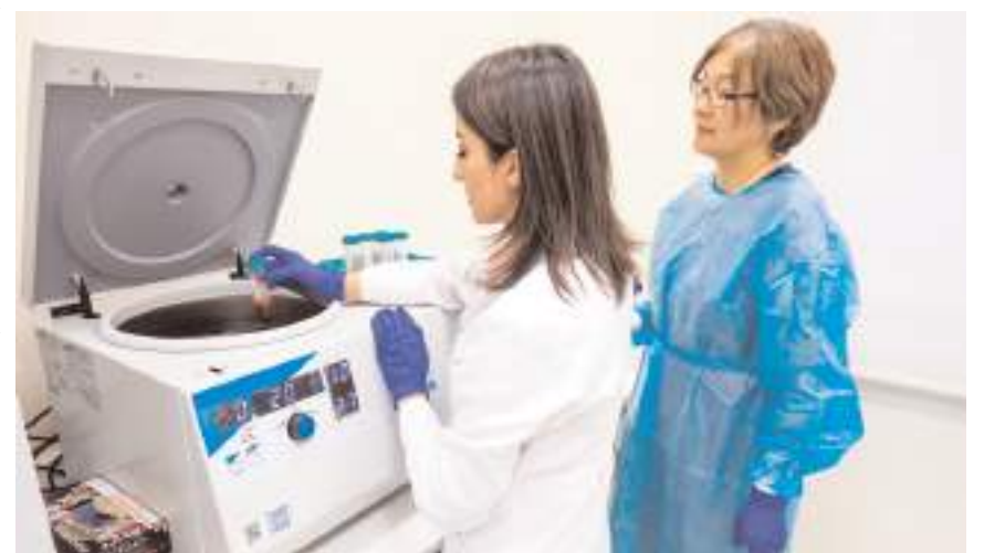
Proje Amerikan Ulusal Sağlık Enstitüsünce destekleniyor.