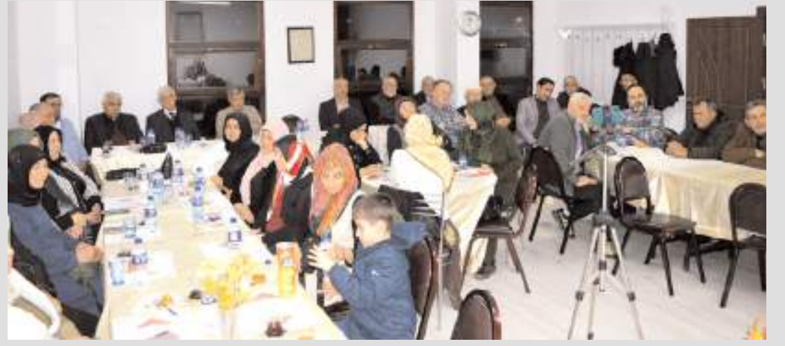
Kaleli Vakfı'nda yapılan programda Miraç'ın öneminden bahsedildi.