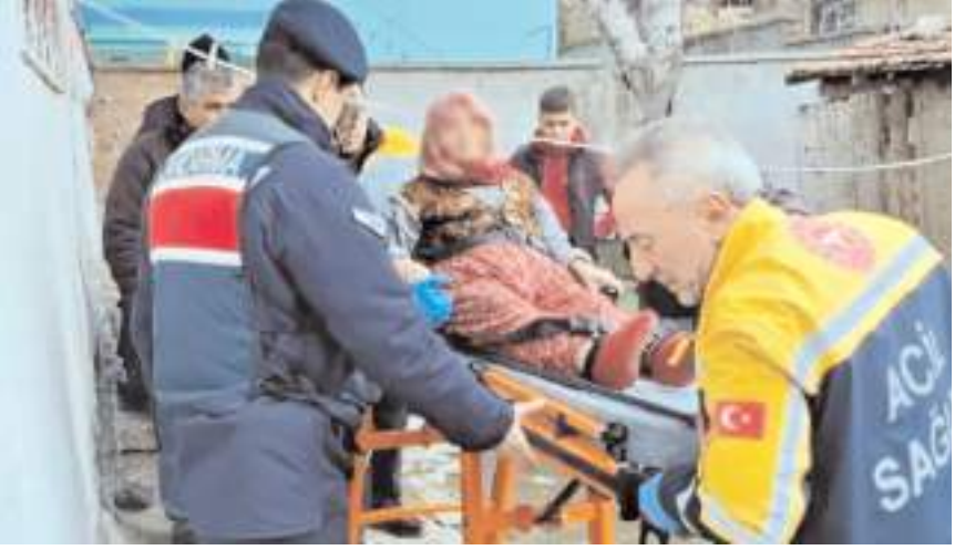
Yaşlı kadın ilk olarak hastaneye götürüldü.

Çorum'da yakınlarının ilgilenmek istemediği 90 yaşındaki kadın, jandarma ekiplerince huzurevine yerleştirildi.