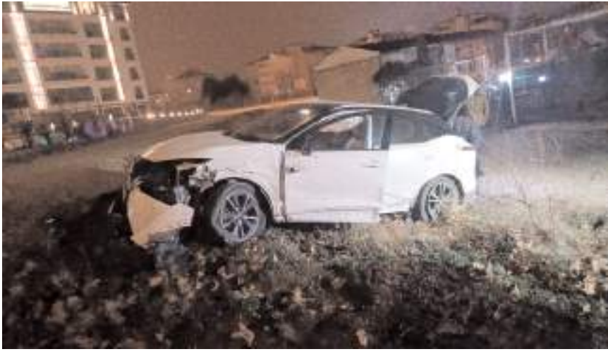
Kaza Buhara 27. Sokak'tan İlhan Gürel Caddesi'nde meydana geldi.