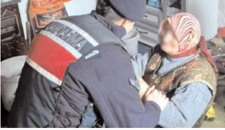
Yaşlı kadın jandarma ekiplerince kentteki bir huzurevine yerleştirildi.