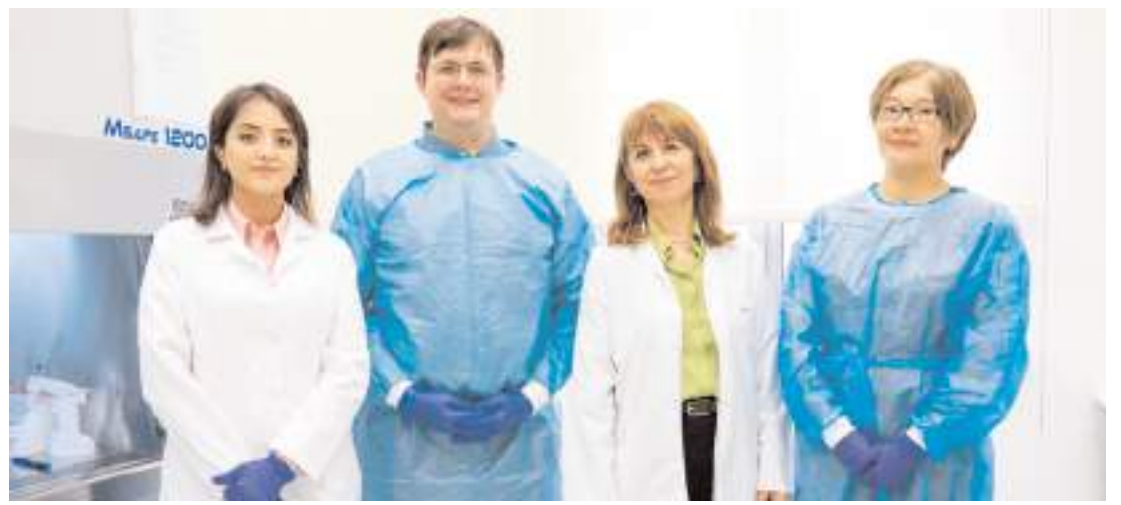
Amerikan Ulusal Sağlık Enstitüsünün desteğiyle Hitit Üniversitesi Teknoloji Merkezinde yeni bir laboratuvar kuruldu.