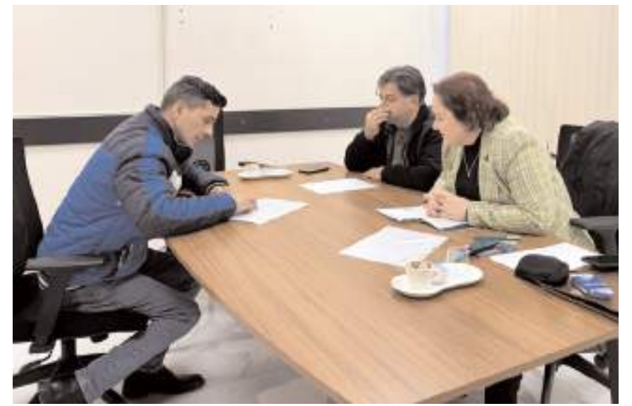
Gerçekleştirilen mülakatlarda adaylarla yüz yüze görüşmeler yapıldı.