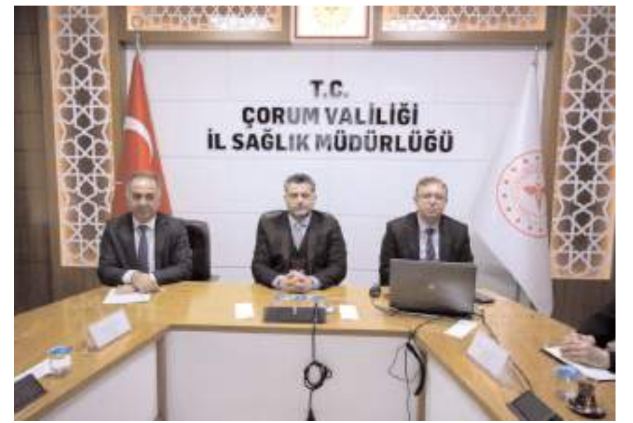
Toplantıda muhtarlara sağlık hizmetleri hakkında bilgi verildi.

ve görüş ve önerilerini dinledi. 36.392 kadına mamografi çekilmek suretiyle meme kanseri taraması, 50.169 kadından smear alınarak rahim ağzı kanseri taraması ve 45.622 kadın ve erkekte gizli kan ba-