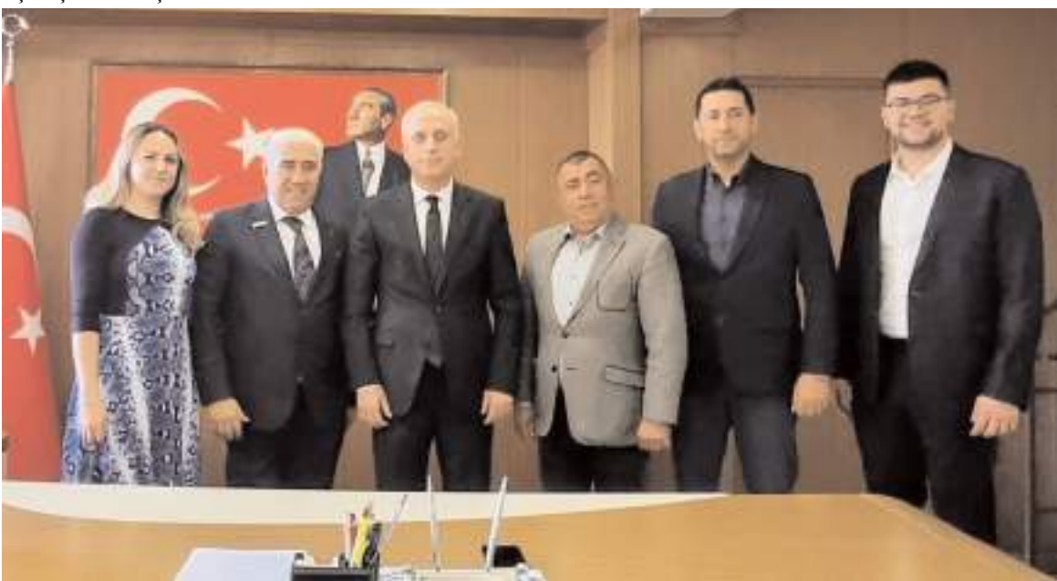
Ziyaretin anısına toplu fotoğraf çekildi.

vermeye hazır olduklarını belirterek, daha güçlü bir Antalya için çalışmaların devam edeceğini ifade etti. (İHA)