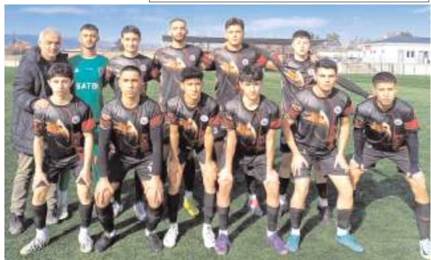
HE Kültürspor ligdeki dördüncü galibiyetini alarak iddiasını ortaya koydu

Osmancıkgücüspor- Sungurlu Belediyespor.