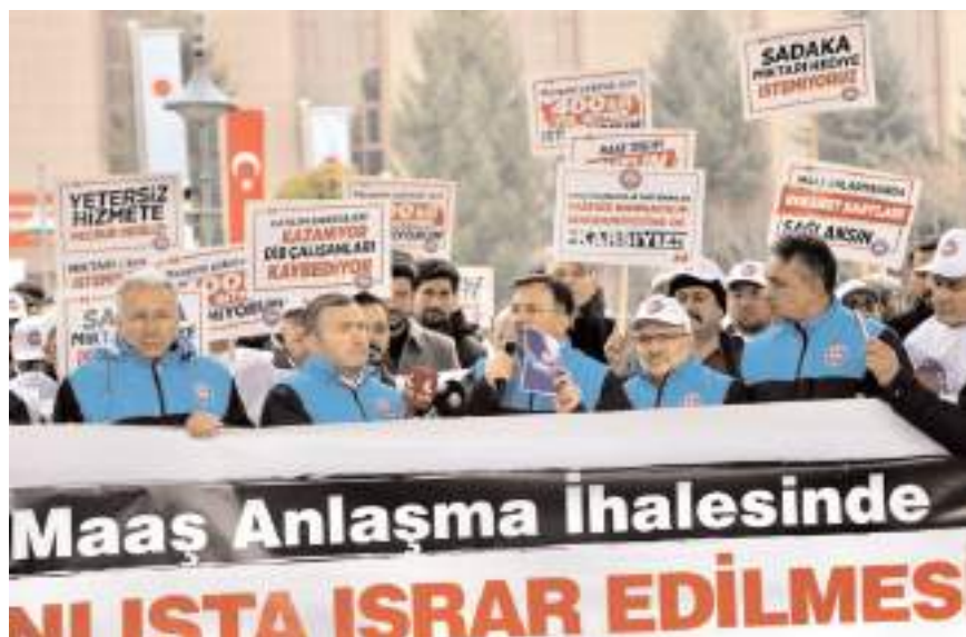
Diyanet İşleri Başkanlığı önünde yapılan basın açıklamasında 'maaş promosyon ihalesine' tepki gösterildi.