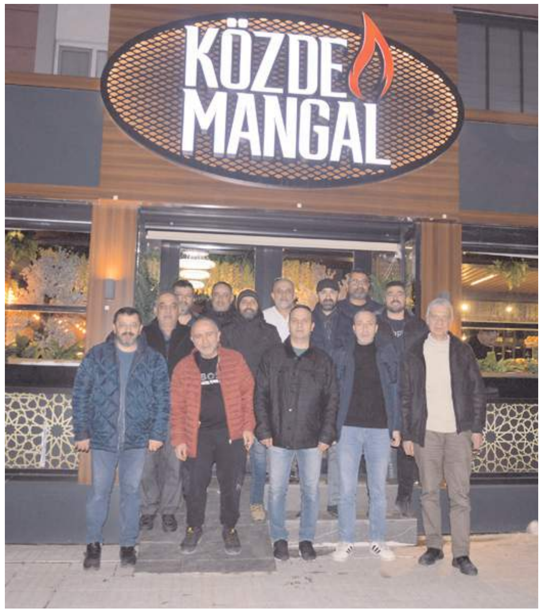
Yemeğin ardından günün anısına toplu fotoğraf çekildi.