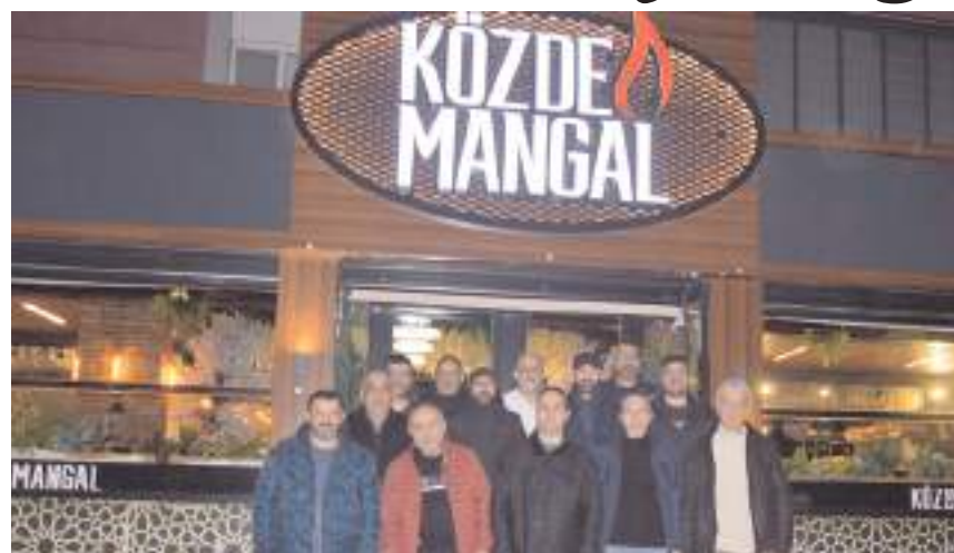
Yemeğin ardından günün anısına toplu fotoğraf çekildi.