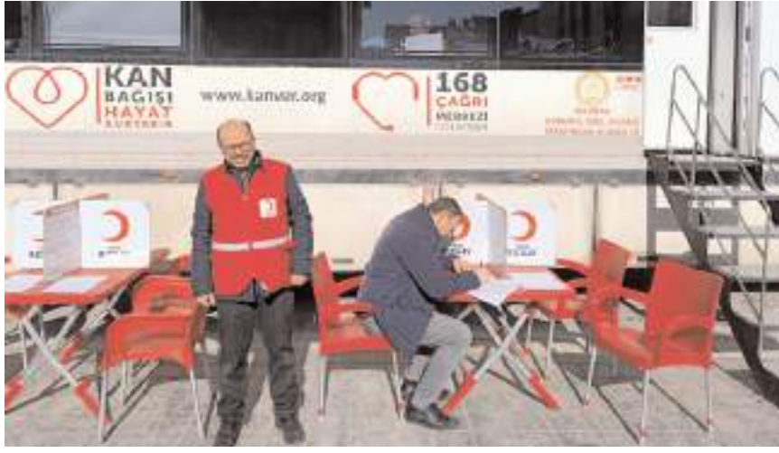
Kan bağışı kampanyası 27-28-29 Ocak tarihlerinde 10.30 ile 18.00 saatleri arasında düzenlenecek.