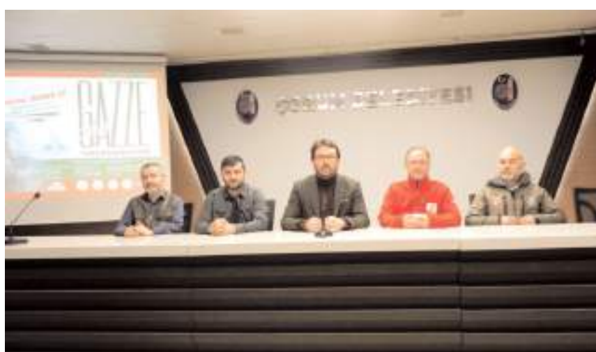
İnsani Değerler Platformu basın açıklaması gerçekleştirdi.

İnsani Değerler Platformu İsrail'in katliam ve soykırımına maruz kalan Gazze için yardım kampanyası başlattı. Platform üyeleri Turgut Özal İş Merkezi Belediye Konferans Salonu'nda düzenlenen toplantıda yaptıkları açıklamada, "Gazze halkı imtihanı en güzel biçimde verdi, şimdi sıra bizde" dediler. * HABERİ'2'DE