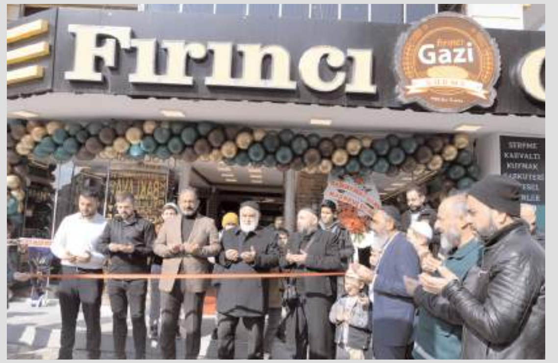
Yapılan duanın ardından açılış kurdelesini kesildi.

Katılımın yüksek olması beklenen geceye, siyasetten iş dünyasına, sivil toplum kuruluşlarından sanat camiasına kadar birçok farklı alandan isimlerin katılması öngörülmüyor.