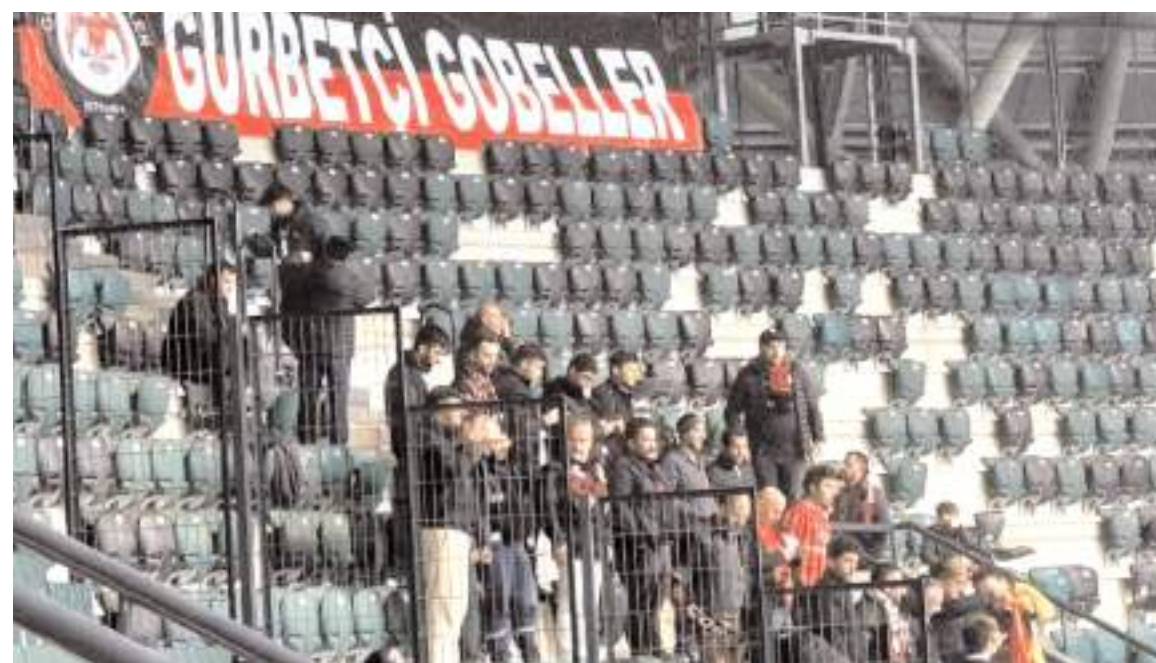
Çorum FK'yı zorlu Kocaelispor deplasmanında İstanbul'dan gelen taraftarlar yalnız bırakmadı. Kocaelispor maçı için İstanbul'dan yaptıkları organize ile gelen Gurbetçi Göbeller taraftar grubu doksandakı takımlarına destek verdiler