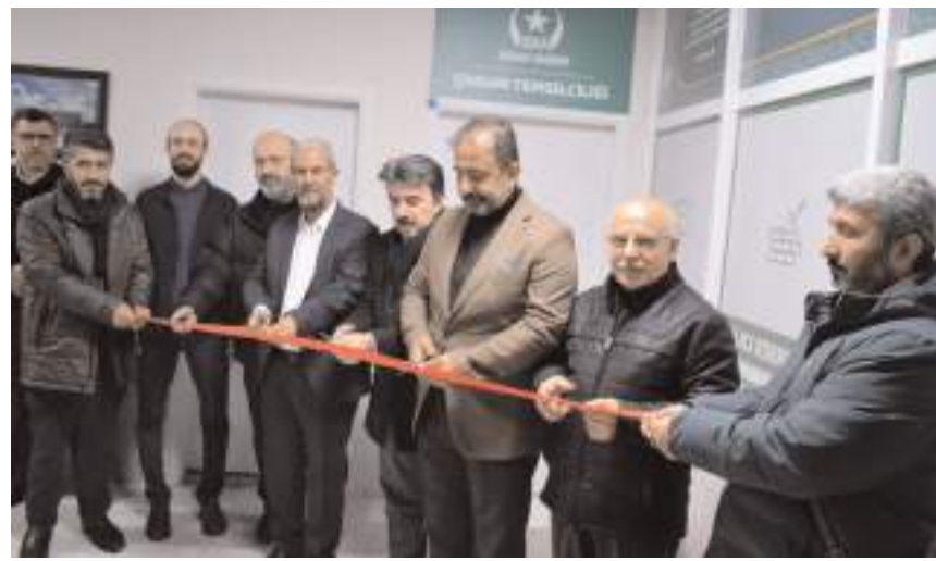
Yapılan duanın ardından açılış kurdelesini kesildi.