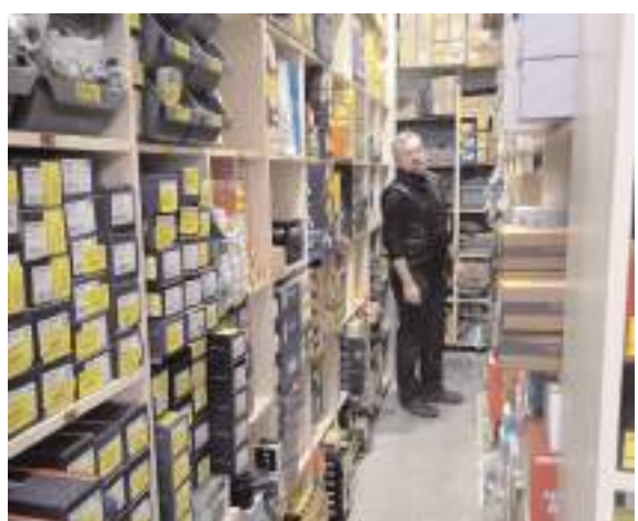
Firma Çorum Sanayi Sitesi 18. Cadde'de faaliyet gösteriyor.

çalara Mimar Sinan Mahallesi Çorum Sanayi Sitesi 18. Cadde'de hizmet veren Bulut Otomotiv'de ulaşabileceklerini söyledi.