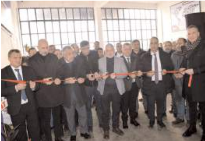
Yapılan duanın ardından açılış kurdelesi kesildi.