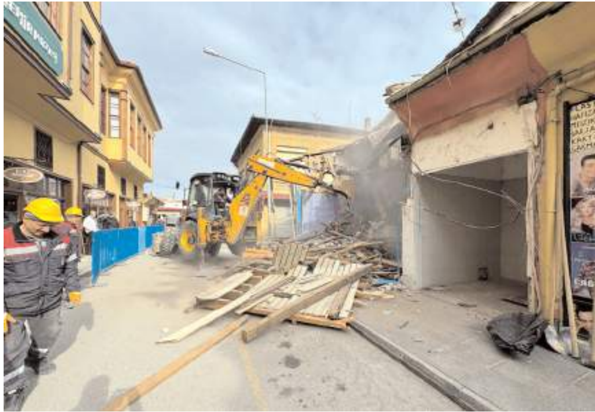
Taşınan balıkçı dükkanları yıkıldı.