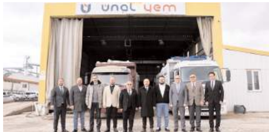
Ziyaretin ardından toplu hatıra fotoğrafı çekildi.

Vali Ali Çalgan, Çorum Organize Sanayi Bölgesi'nde faaliyet gösteren Ünal Yem Fabrikasını ziyaret etti. * HABERİ'4'DE