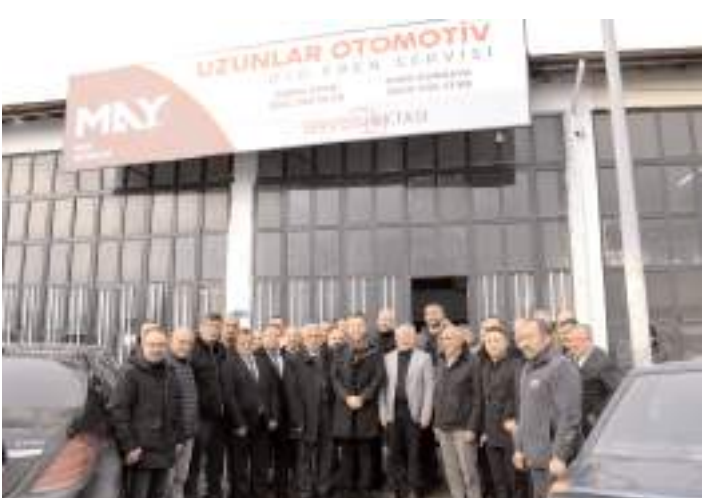
Açılışın ardından toplu hatıra fotoğrafı çekildi.

rum Sanayi Sitesi'nde bulunan Uzunlar Otomotiv'de açılış töreni düzenlendi.