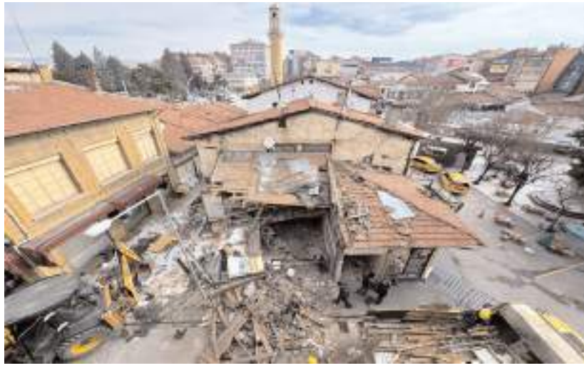
Taşınan balıkçı dükkanları yıkıldı.

Çorum'un en önemli tarihi yapılarından Veli Paşa Hanı'nın tamamen ortaya çıkmasını ve Saat Kulesi ile bir bütün olmasını sağlayacak olan tarihi meydan projesinde ikinci etap çalışmaları aralıksız sürüyor. Belediye Başkanı Dr. Halil İbrahim Aşgın'ın seçim projeleri arasında yer alan tarihi meydanın ikinci etap çalışmaları kapsamında Saat Kulesi civarında bulunan balıkçı esnafının Geçici Balıkçılar