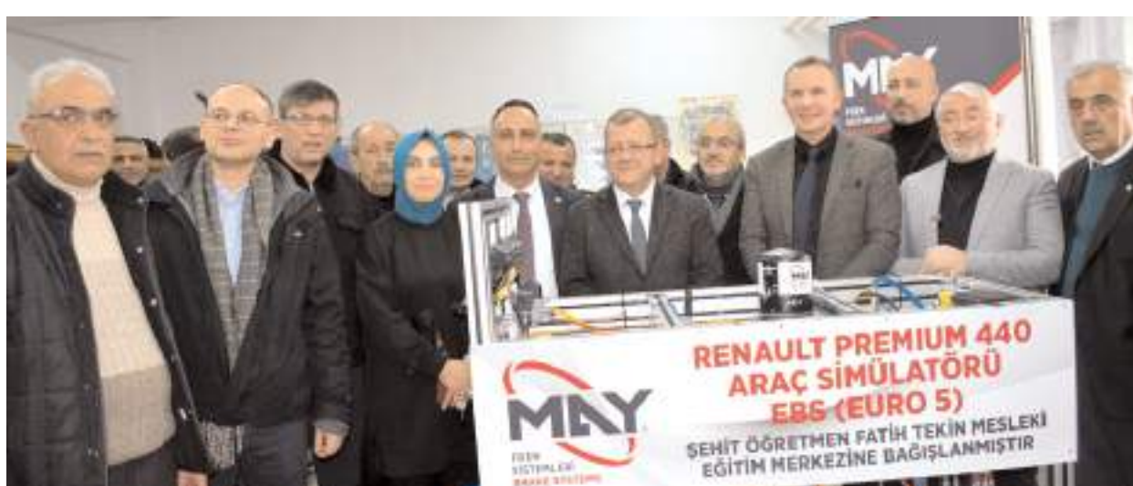
Açılışın ardından hatıra fotoğrafı çekildi.

May Fren Sistemleri Ar-Ge faaliyetleri sayesinde 2018 yılında geliştirdiği TKC-008 C test cihazı ile ağır vasıtaların fren sistemlerinde Can Bus ile haberleşen elektromekanik valflerin arıza tespitini nokta atışı yapmayı başarmıştır. Bu test cihazı ile birlikte de MAY Fren Servis Noktası Projesini hayata geçirmiştir. Bu sayede MAY Fren kullanıcılarına arıza tespit cihazı yanında ihtiyaç duyduğu valf, basınç sensörü, solenoid bobin vb. tamir takımlarını sunarak fabrikasından teknik destek veren tek firma olmuştur." (Haber Merkezi)