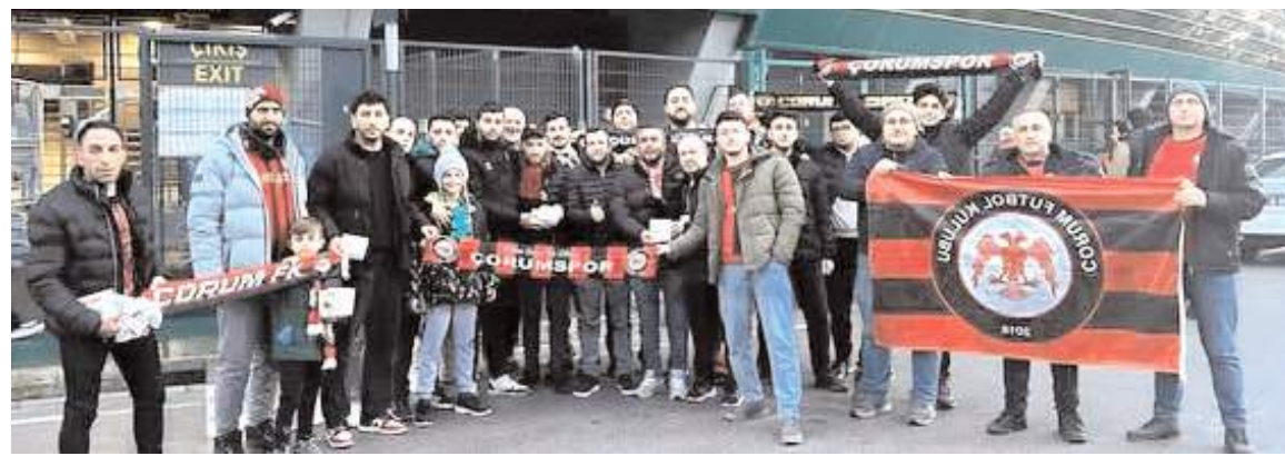
Kocaelispor taraftarları ile Çorum FK taraftarları maç öncesi dostluk görüntüsü verdi ve pişmaniye hediye etti

Kocaelispor Yönetimi tarafından, maça gelen Çorum FK yöneticisi, basın mensubu ve taraftarlarına üzerinde, "Şehrimize hoş geldiniz. Kocaelispor dostluğunu unutmaz" yazılı pişmaniye ikram edildi. Kocaelisporlu taraftarlar Çorum'a ne zaman gitse Leblebi ikramı yapılmıştı. Bu kez Kocaelispor ev sahibi olduğu için, misafirlerimize pişmaniye ikram edildi.