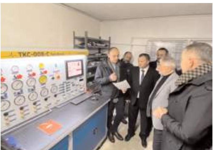
Firma yetkilisi sistem hakkında bilgi verdi.