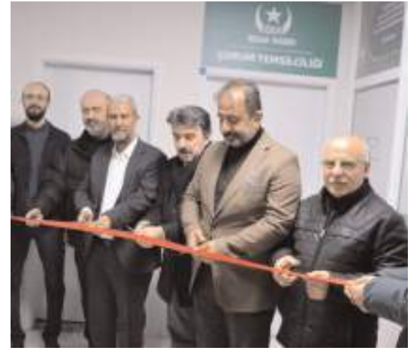
Yapılan duanın ardından açılış kurdelesini kesildi.