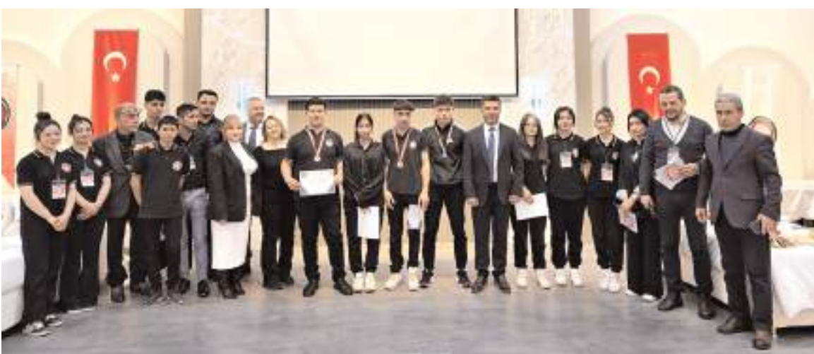
Yarışmada derece elde edenlere ödül verilirken tüm yarışmacılara da katılım belgesi takdim edildi.

Soruşturma kapsamında 6'sı tutuklu olmak üzere 78 şüpheli hakkında adli işlem yapıldığının belirtildiği açıklamada, "17 şüpheli ve 1 suçta sürüklenen çocuk gözaltına alınmıştır. Soruşturma tüm yönleri ile titizlikle devam etmekte olup, gerektiğinde ayrıca bilgi verilecektir" ifadeleri yer aldı. (Haber Merkezi)