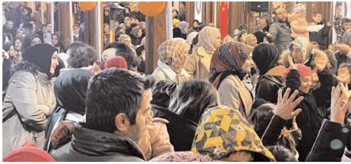
Ramazan Akşamları programı Bedesten yanında bulunan Çorum Park'ta yapıldı.