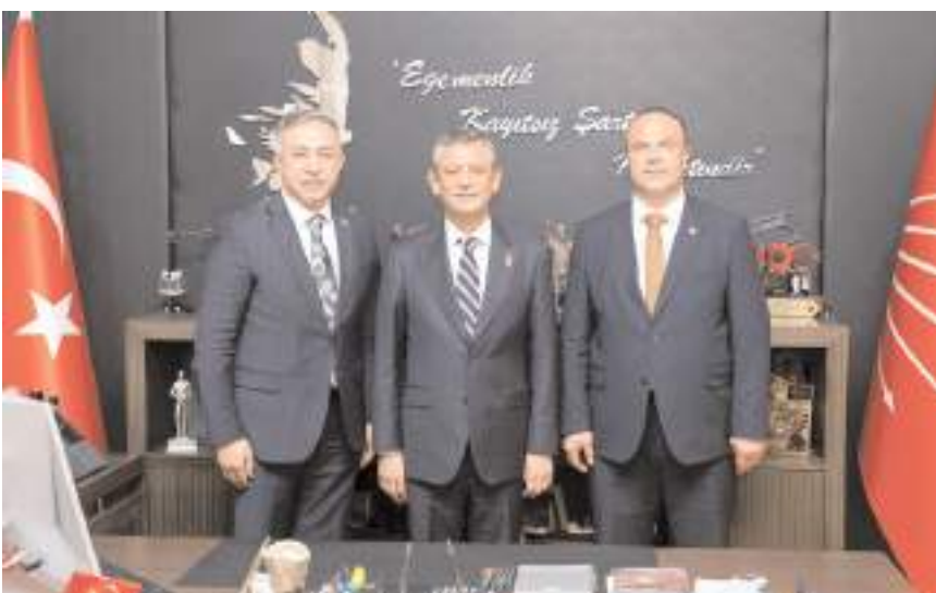
CHP Çorum Milletvekili Mehmet Tahtasız ve Aşdağul Belediye Başkanı Şenol Öncül, CHP Genel Başkanı Özgür Özel'i ziyaret etti.