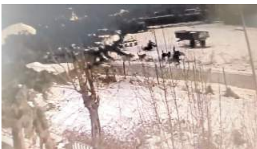
Olay Mecitözü'nde yaşandı.