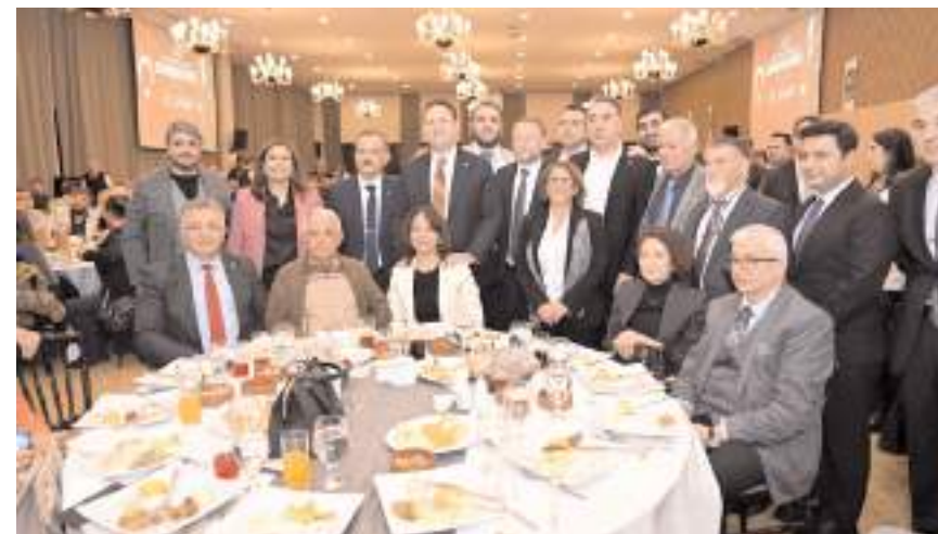
Programı Çorum Hitit Dernekleri Federasyonu düzenledi.