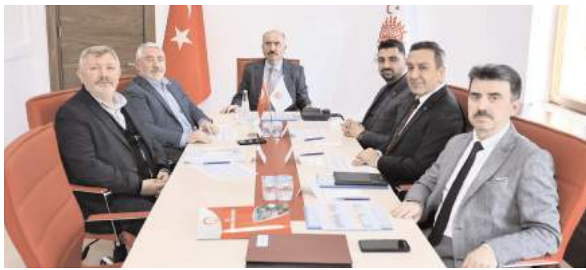
Çorum Sahipsiz Hayvanları Koruma Birliği Şubat ayı Encümen Toplantısı yapıldı.