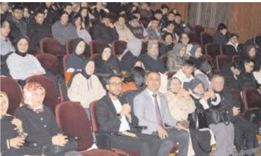
Seminer Devlet Tiyatro Salonunda yapıldı.