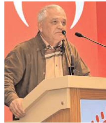
Programda konuşmalar yapıldı.