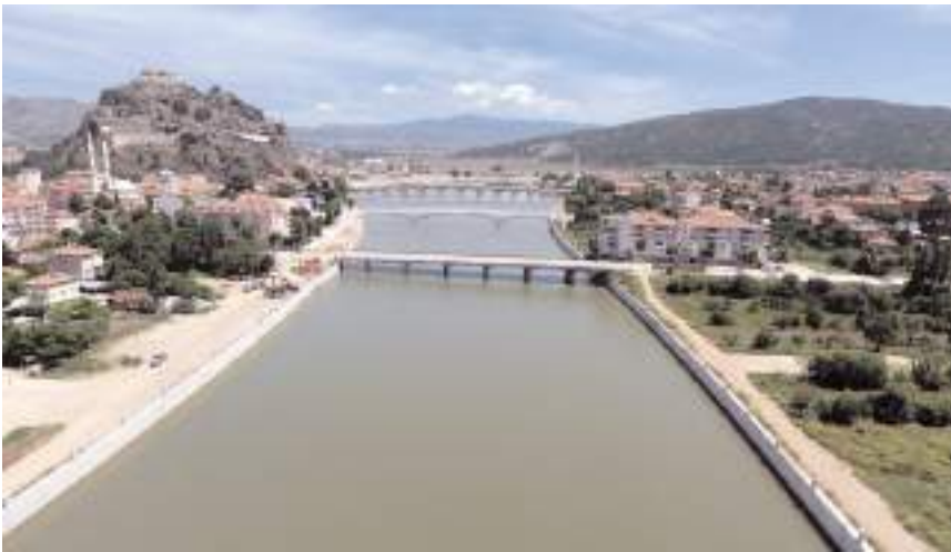
22 yılda 77 adet taşkın koruma tesisi yapıldı.