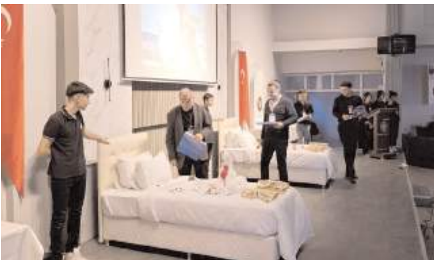
Öğrenciler yarışmada hünerlerini sergilediler.