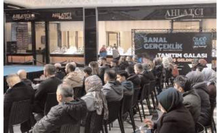
"Eğitimde Sanal Gerçeklik" tanıtım galasına katılım yüksek oldu.