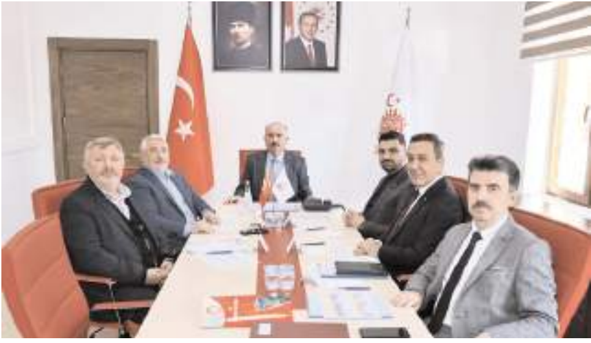
Çorum Sahipsiz Hayvanları Koruma Birliği Şubat ayı Encümen Toplantısı yapıldı.

■ Çorum Sahipsiz Hayvanları Koruma Birliği Şubat ayı Encümen Toplantısı, Vali Ali Çalgan başkanlığında gerçekleştirildi.