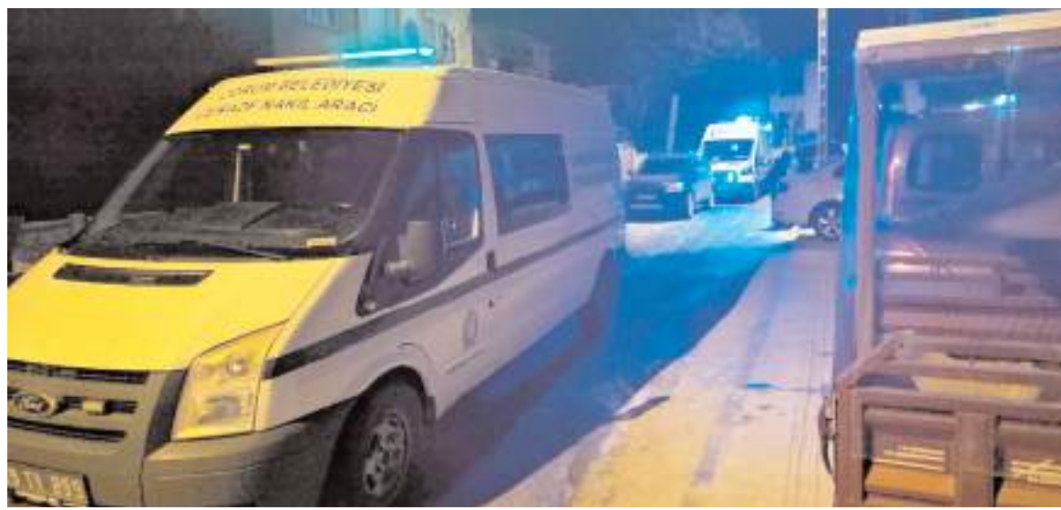
Olay Ulukavak Mahallesi Çatalhavuz 12. Sokak'taki bir evde meydana geldi.

Şiddet, toplumun temel yapı taşlarından biri olan aile kurumunu zayıflattı. Kadına yönelik şiddet ve aile içi şiddet, sadece bireysel bir sorun değil, toplumsal bir meseledir. Bu sorunu kökten çözmek için kapsamlı bir politika izlemeye devam edeceğiz" ifadelerini kullandı. A Parti'nin kadına yönelik şiddet, aile içi şiddet ve cinsel şiddete karşı sıfır tolerans ilkesiyle hareket edeceğini belirten Müstet, "Hukuki düzenlemelerden ekonomik desteğe, kolluk kuvvetlerinin eğitilmesinden toplumsal farkındalığa kadar her alanda etkin politikalar hayata geçireceğiz. Şiddetle mücadelede kararlıyız" diyerek açıklamasını tamamladı. (Haber Merkezi)