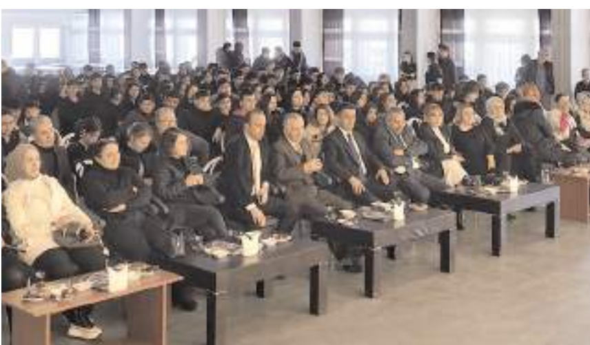
Yarışmayı çok sayıda davetli ile okul idareci öğretmen ve öğrencileri izledi.