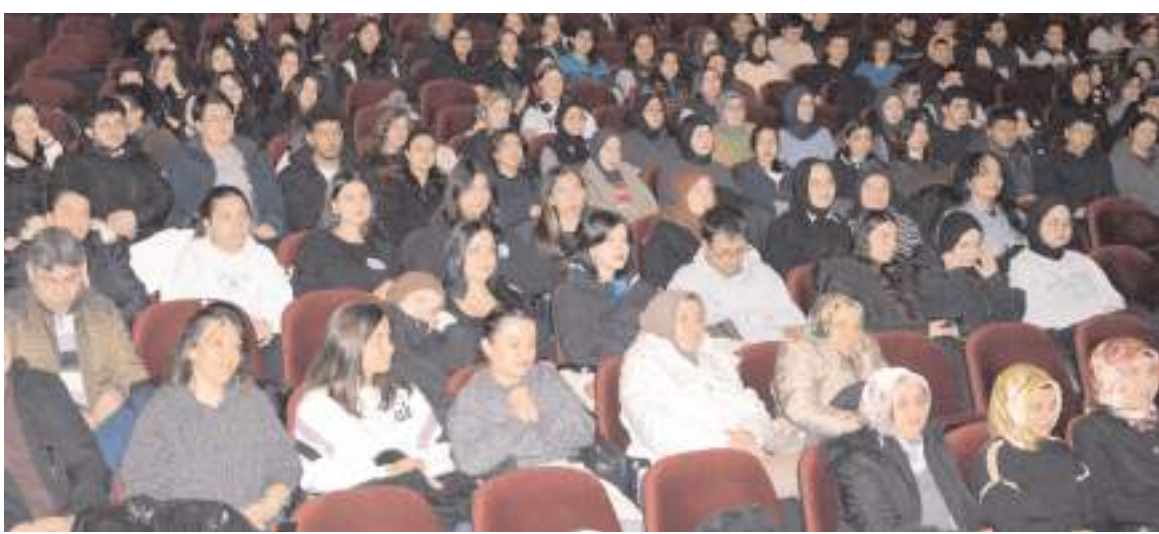
Eğitime öğrencilerin ilgiyi yüksek oldu.