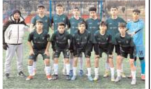
Mimar Sinanspor U 15 takımı şampiyonluk maçına çıkıyor