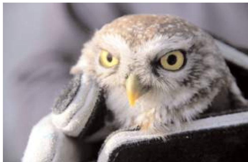
Yaralı baykuşu Jandarma Komutanlığı ekipleri, Tekke Dağı mevkinde devriye gezerken buldu.

Çorum'un Oğuzlar ilçesinde, jandarma ekiplerince bulunan yaralı baykuş tedavi altına alındı.