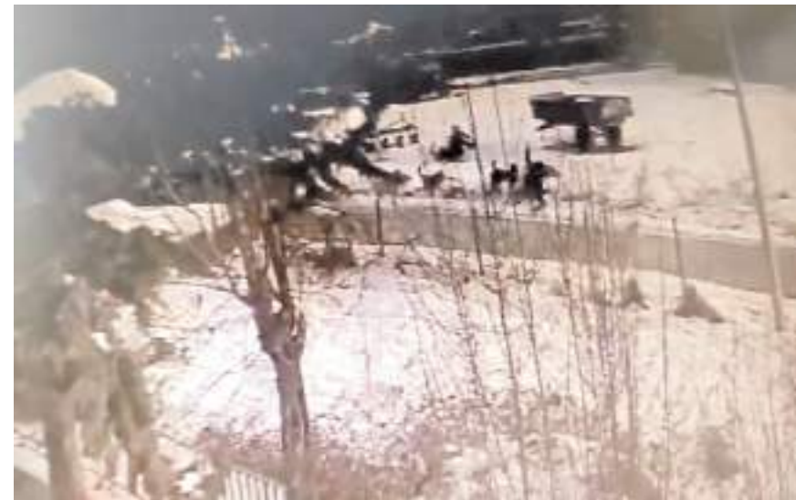
Olay Mecitözü'nde yaşandı.

ralanan çocuğun hastanede tedavisi sürüyor. (Haber Merkezi)