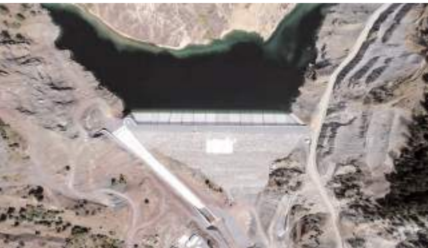
Çorum'da son 22 yılda 14 baraj, 4 gölet ve 1 adet yeraltı depolaması yapıldı.