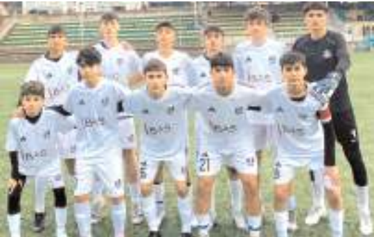
Vefaspor bugün kazanıp şampiyon olmak istiyor