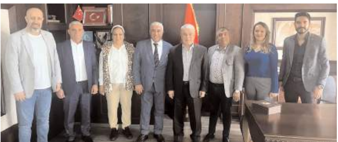
Ziyaretin sonunda hatıra fotoğrafı çekildi.