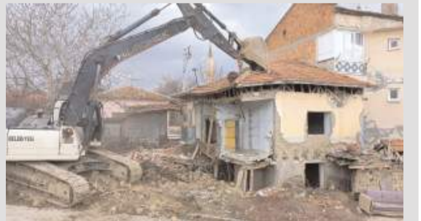
Belediye ekipleri ilçe merkezinde yasal süreci tamamlanan metruk binaları yıktı.