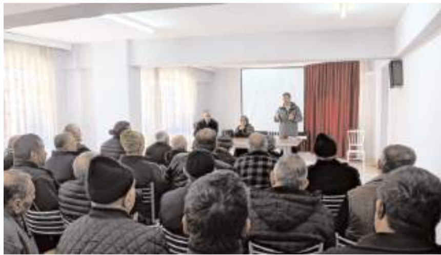
Toplantı Oğuzlar Belediyesi Konferans Salonu'nda yapıldı.

Çorum'un Oğuzlar ilçesinde çiftçilere Tarım ve Kırsal Kalkınmayı Destekleme Kurumunca (TKDK) verilen hibe destekleri hakkında bilgi verildi.