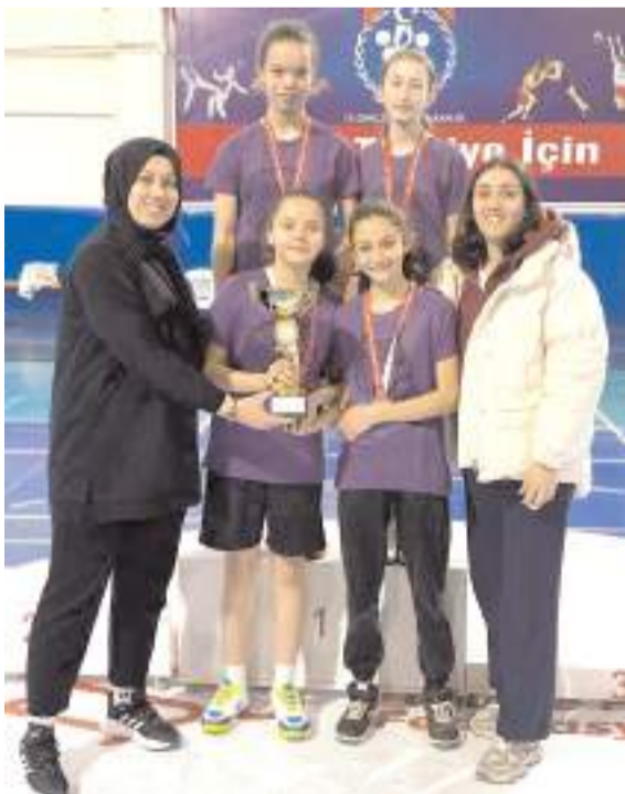
Yıldız kızlarda şampiyon olan Cumhuriyet Ortaokulu ilimizi grup maçlarında temsil etmeye hak kazandı

Müsabakaların ardından düzenlenen törenle üç okulu kupa ve madalyaları verildi. Şampiyon olan Cumhuriyet Ortaokulu 18-20 Mart tarihlerinde Sinop'ta yapılacak grup müsabakalarında ilimizi temsil edecek.