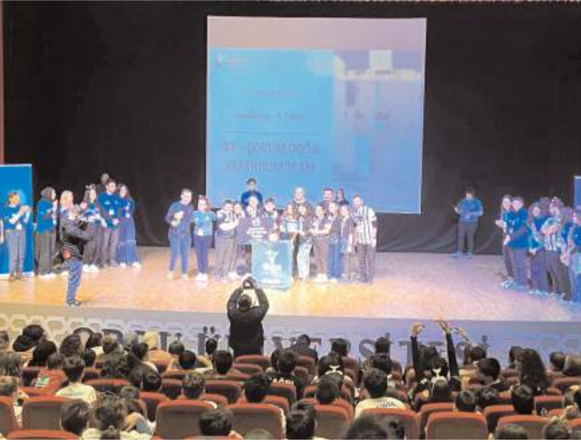
Çorum Doğa Platinum Team, turnuvanın Özdeğerler Kupası'nı kazandı.