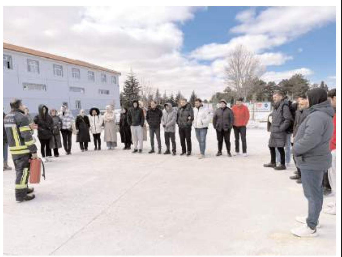
Eğitim İtfaiye Müdürlüğü'nde verildi.