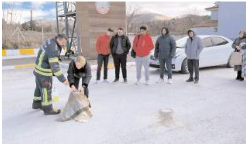
Personele yangınlara müdahale şekilleri uygulamalı olarak gösterildi.