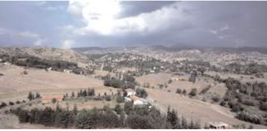
Osmancık'a bağlı Başpınar köyü yetiştirdiği baletlerle dikkat çekiyor.