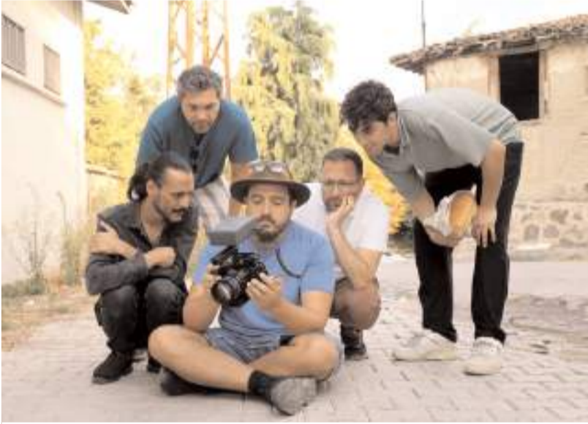
Belgesel Kültür ve Turizm Bakanlığı Sinema Genel Müdürlüğü'nün desteği ile çekildi.