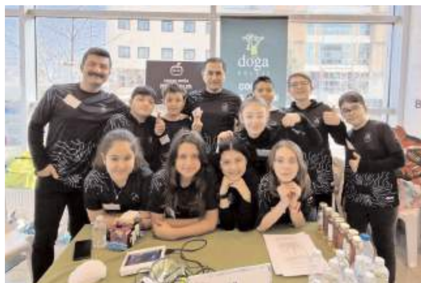
Çorum Doğa Platinum Team