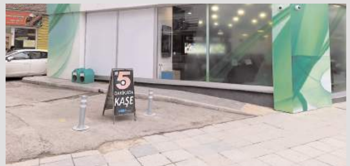
Uğur Yönetmen'in gözü gibi baktığı sokak kedileri için kedi evi konuldu.