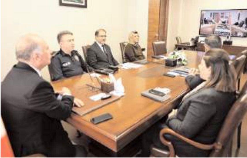
Toplantı Video Konferans Sistemi ile yapıldı.