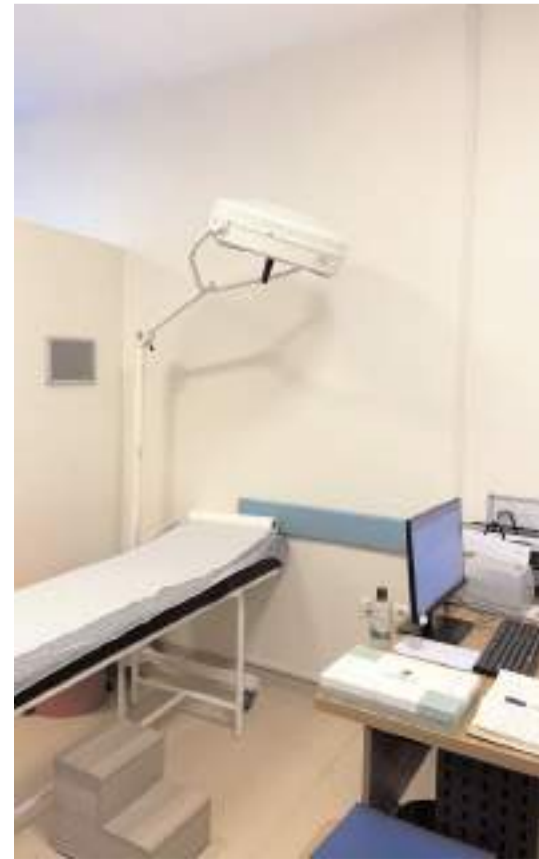
Proktoloji Ünitesinde ilk hafta 60 hastaya hizmet verildi.