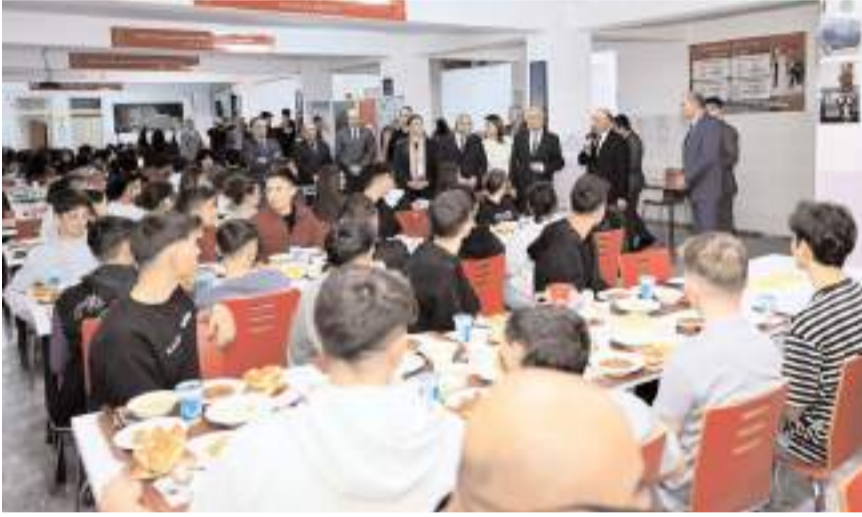
Program Özejder Sosyal Bilimler Lisesi Pansiyonunda yapıldı.