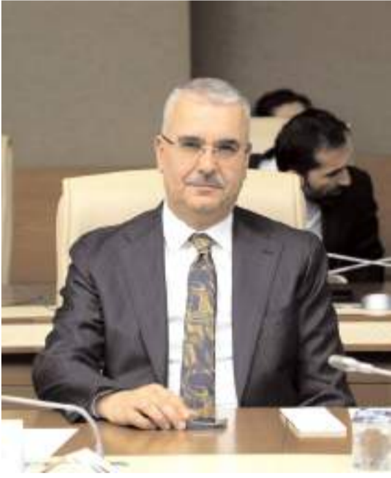
Milletvekili Yusuf Ahlatcı