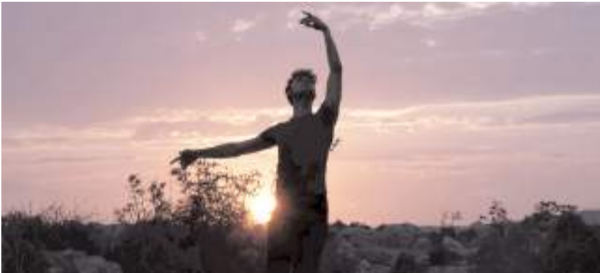
Belgesel, Çorum'un Osmancık ilçesine bağlı Başpınar köyünden yetiştirilen 13 baletin ilham verici yolculuğunu anlatıyor.