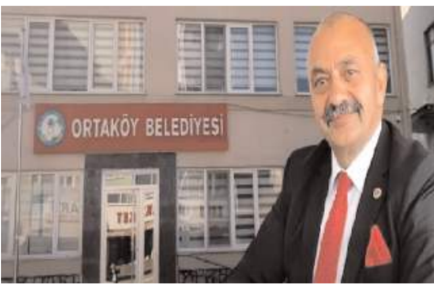
Ortaköy Belediye Başkanı Taner İsbir, denetimler hakkında bilgi verdi.