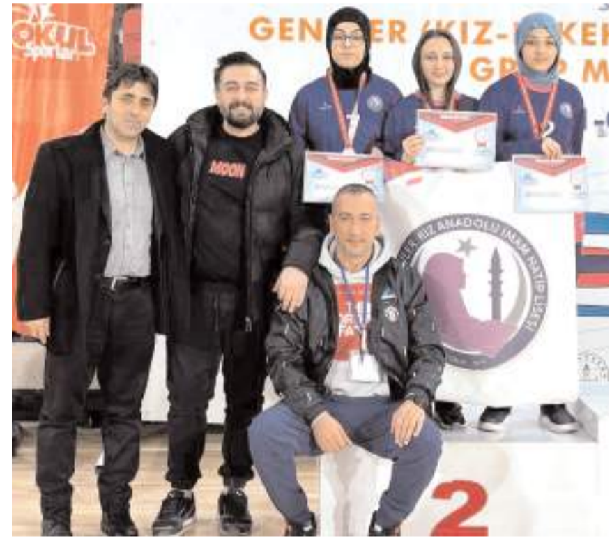
Buharaevler Kız Anadolu İmam Hatip Lisesi takımı ödül töreni sonrasında

Çorum'da dört gün süren Liseli Gençler Floor Curling bölge birinciliğinde üç kategoride 53 okul mücadele etti. Kızlarda Buharaevler Kız Anadolu İmam Hatip Lisesi finalde kaybederek ikinci oldu. Üç kategoride ilk dört sırada yer alan okullar 16-21 Mart'ta Erzurum'da yapılacak Türkiye Şampiyonasında mücadele edecekler.