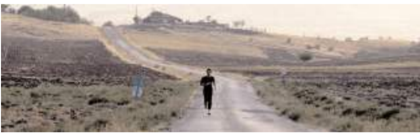
'Baletler Köyü Belgeseli'nin çekimleri tamamlandı.