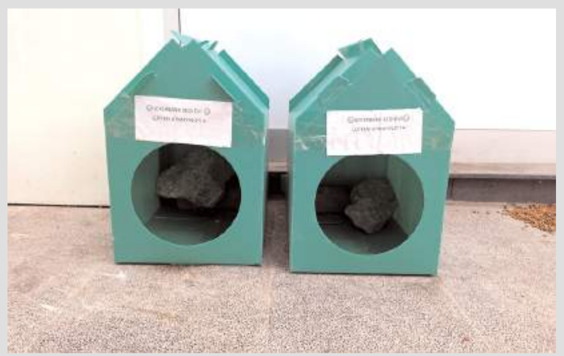
Uğur Yönetmen'in vefat etmesinin ardından sahihsiz kalan kediler sıcak bir yuvaya kavuştu.