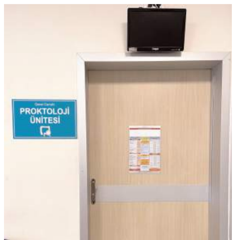
Proktoloji Ünitesi Genel Cerrahi kliniği bünyesinde hizmet vermeye başladı.