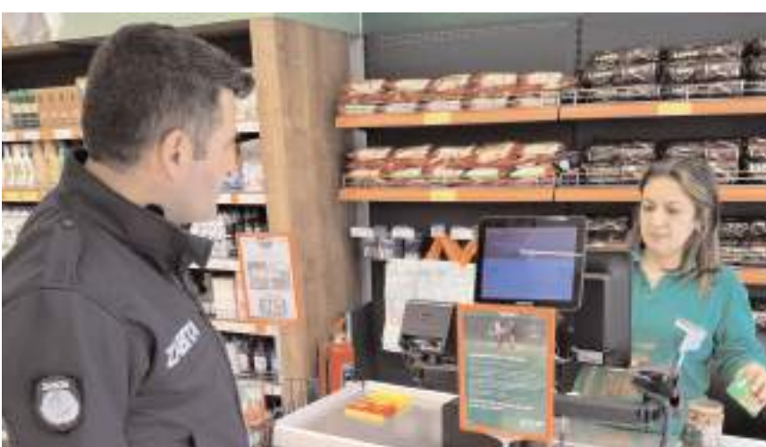
Denetimlerde ürünleri raf ve kasa fiyatları kontrol edildi.

Ortaköy Belediyesi Zabıta ekipleri Ramazan'da denetimlerini artırdı.