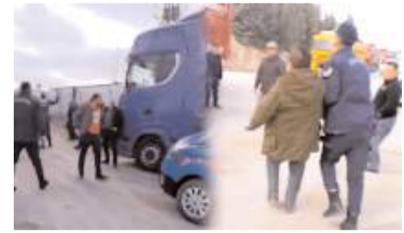
Nakliyeciler TMO önünde kavgaya çıktılar.