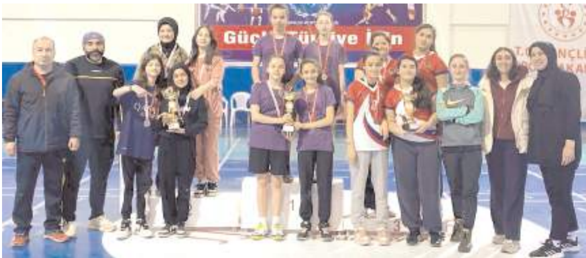
Yıldız kızlar badmintonda mücadele eden üç okul ödül töreninde kürsüde toplu halde görülüyor