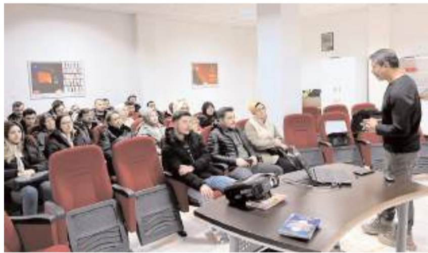
Personele ilk olarak teorik eğitim verildi.