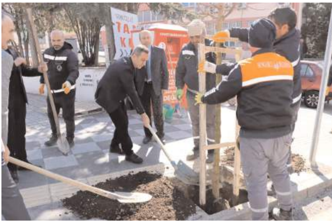
Sungurlu Belediyesi baharın gelmesi ile birlikte ağaçlandırma çalışmalarına başladı.