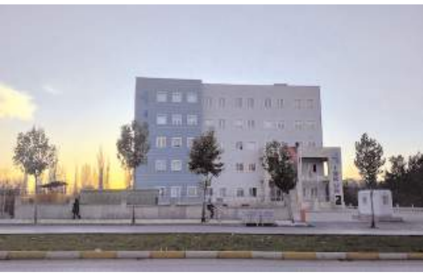
İşçi alımı İŞKUR tarafından İUP kapsamında yapıldı.