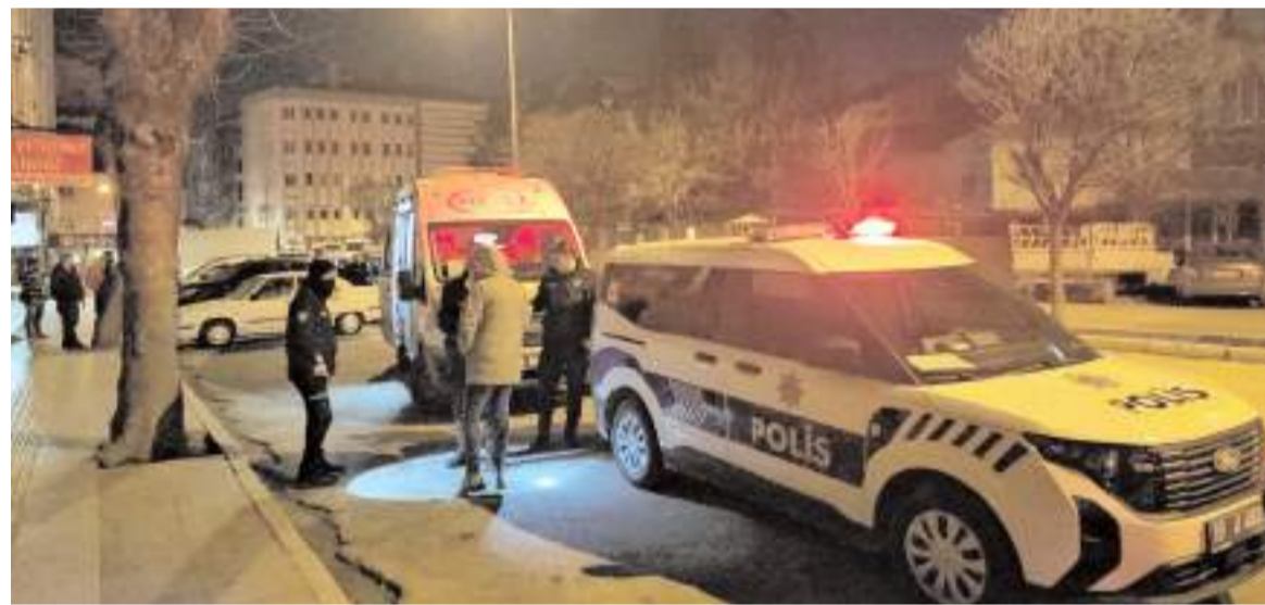
Olay Kale Mahallesi Uğur Mumcu Caddesi'nde meydana geldi.