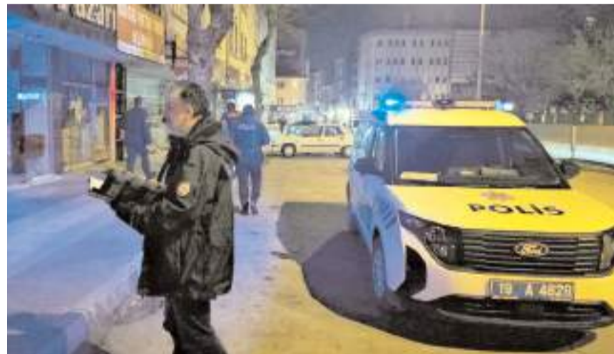
Polis ekipleri olay yerinde inceleme yaptı.