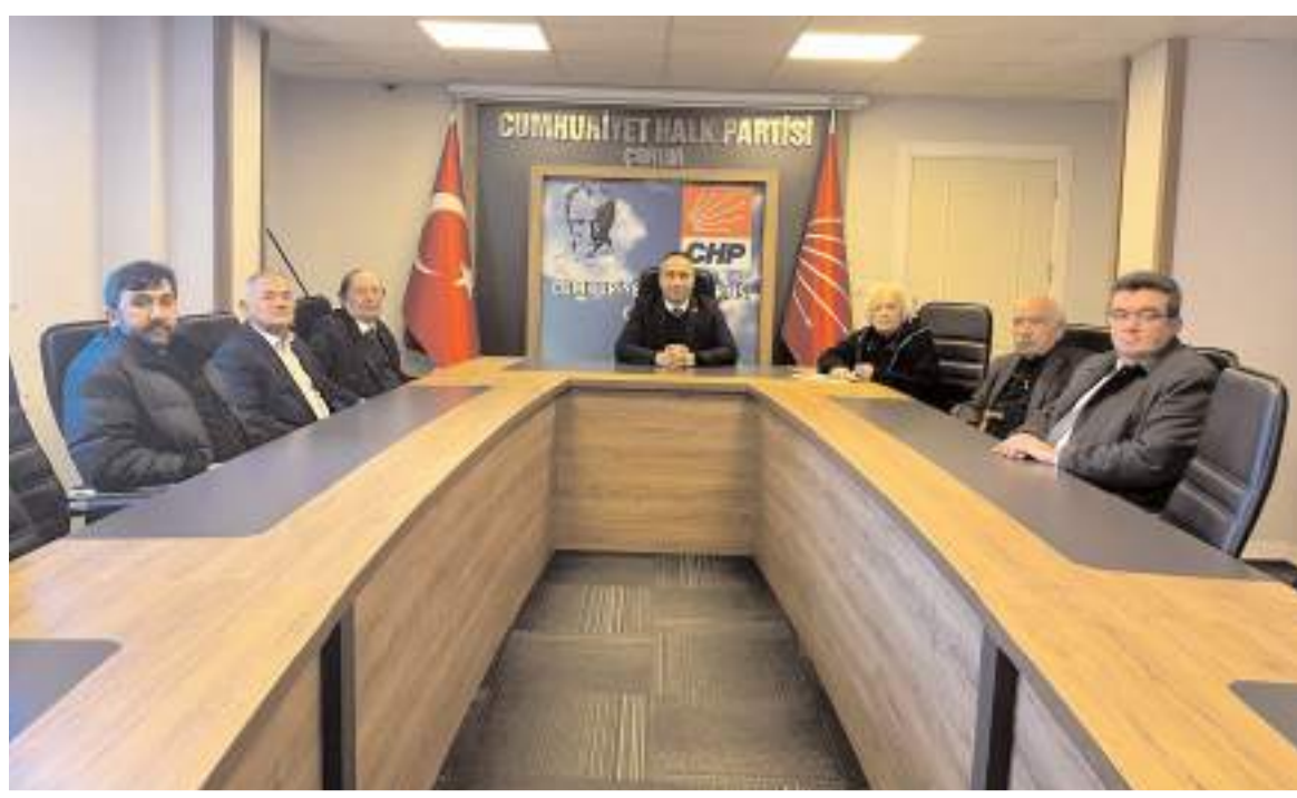
Toplantıda cumhurbaşkanı adayı belirleme seçim hazırlıkları ve partinin üye seferberliği değerlendirilerek, görüş ve öneriler alındı.

Ekipler, fiyat etiketi denetimlerine de ağırlık vererek ürünlerin raf fiyatları ile kasa fiyatları arasındaki uyumu kontrol etti. Haksız fiyat artışları ve tüketiciyi yanıltıcı etiket kullanımı konusunda işletmelere uyarılarda bulunuldu. Zabıta Müdürlüğü ekipleri, vatandaşların sağlıklı ve güvenilir alışveriş yapabilmesi için denetimlerin Ramazan ayı boyunca da devam edecek. Vatandaşlar, karşılaştıkları olumsuz durumları zabıta ekiplerine bildirerek denetim sürecine katkıda bulunabilecek" dedi. (Haber Merkezi)