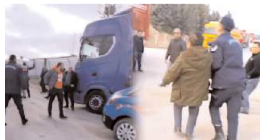
Nakliyeciler TMO önünde kavga ettiler.

Hatırlanacağı üzere geçtiğimiz hafta Toprak Mahsulleri Ofisi'nin taşıma ihalesini kazanan Osmancık Taşıyıcılar Kooperatifi üyeleri ile ihaleye giren ancak yüksek teklif verince ihaleyi kaybeden Çorumlu nakliyeciler arasındaki tartışma bitmek bilmiyor. Önceki gün ihaleyi kazanan Osmancık Taşıyıcılar Kooperatifi üyelerini