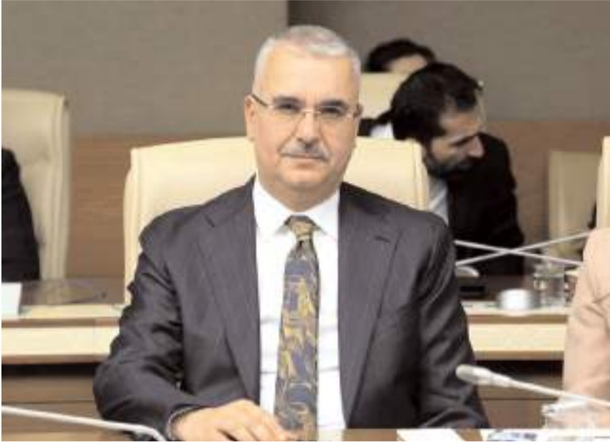
Milletvekili Yusuf Ahlatcı