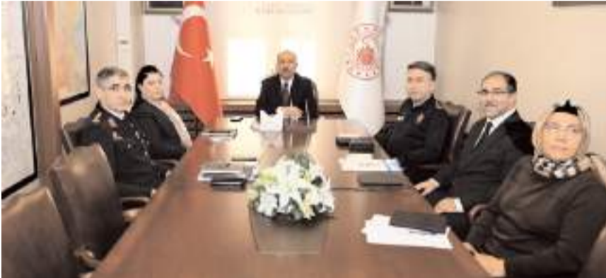
Toplantıda 2025 yılının "Aile Yılı" ilan edilmesi nedeniyle yapılacak olan çalışmalar istişare edildi.