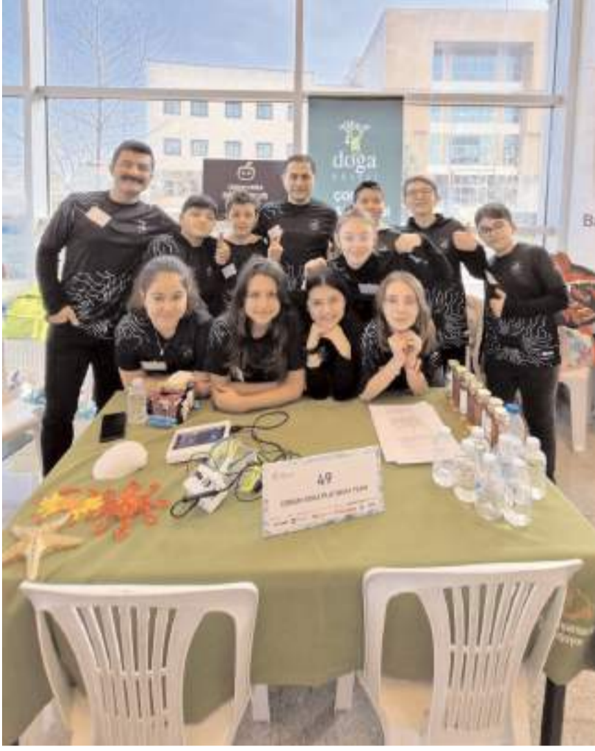
Çorum Doğa Platinum Team