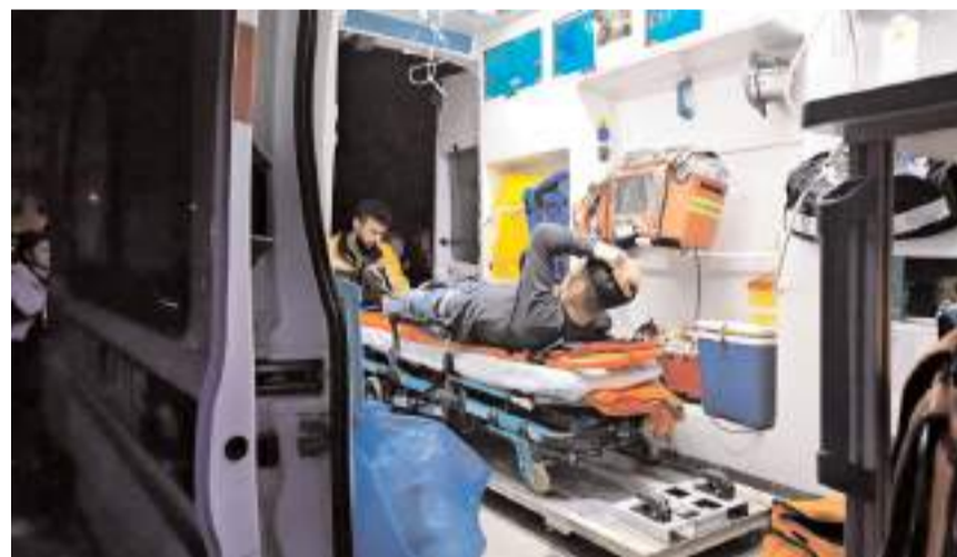
Yaralanan E.Y'ye ilk müdahale ambulansda yapıldı.