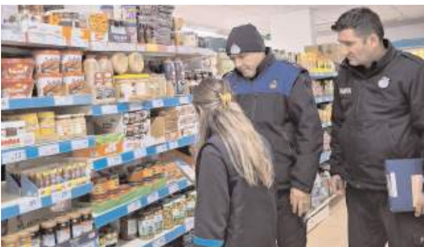
Ekipler ürünlerin son kullanma tarihlerini kontrol etti.