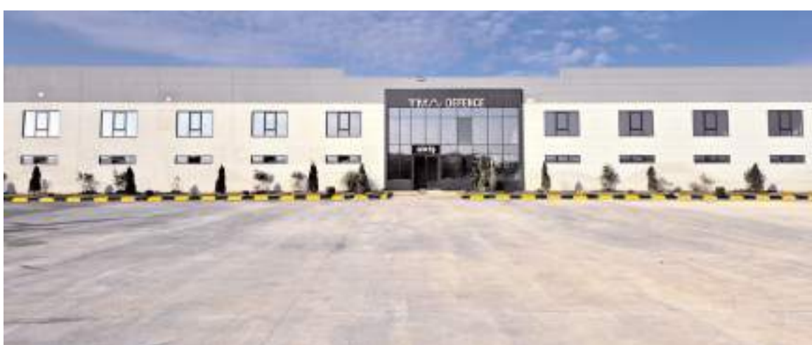
Firma Sungurlu Organize Sanayi Bölgesinde faaliyet gösteriyor.