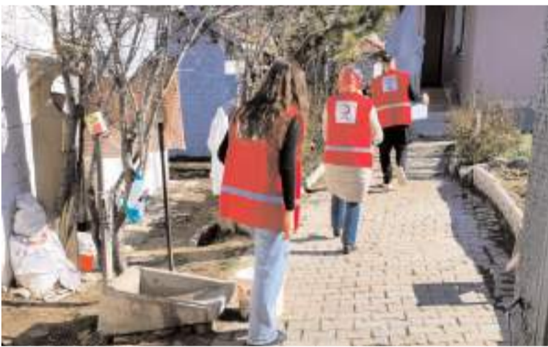
Yardımcı kolileri ilçe de yaşayan ihtiyaç sahiplerine tek tek teslim edildi.

Yapı denetim firmalarının tamamından, konunun bağımsız bir kurul tarafından incelenmesi amacıyla üniversiteler bünyesindeki öğretim elemanlarına ilgili projelerin performans analizlerinin hazırlatılarak belediyeye 02.04.2025 tarihine kadar sunulması istenmiştir. Konuyla ilgili olarak Hitit Üniversitesi öğretim elemanları çalışmalara başlamıştır. Performans raporlarından çıkacak sonuca göre gerekli işlemler ivedilikle