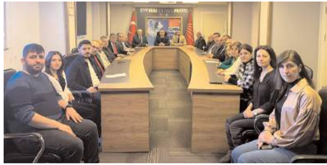
Söyleşi programı CHP İl Başkanlığı toplantı salonunda yapıldı.