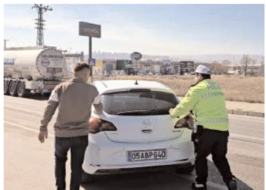
Kaza nedeniyle trafik kontrollü olarak verildi.