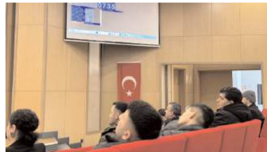
348 personel için kura çekimi noter huzurunda gerçekleştirildi.

listesine Çorum Belediyesi web sitesinde duyurular bölümünden veya aşağıdaki linkten ulaşabilirsiniz. (Haber Merkezi)