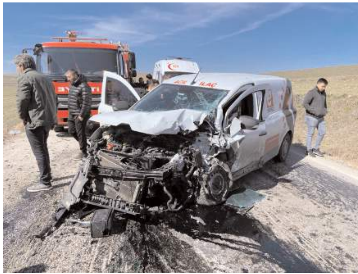
Kaza Sungurlu-Alaca kara yolu ayrımında meydana geldi.