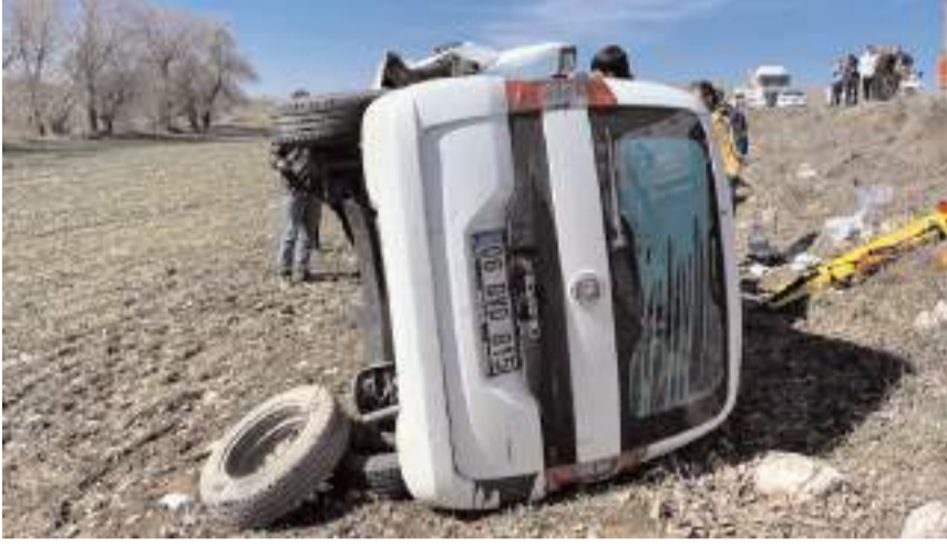
Kazada araçlar hurdaya döndü.