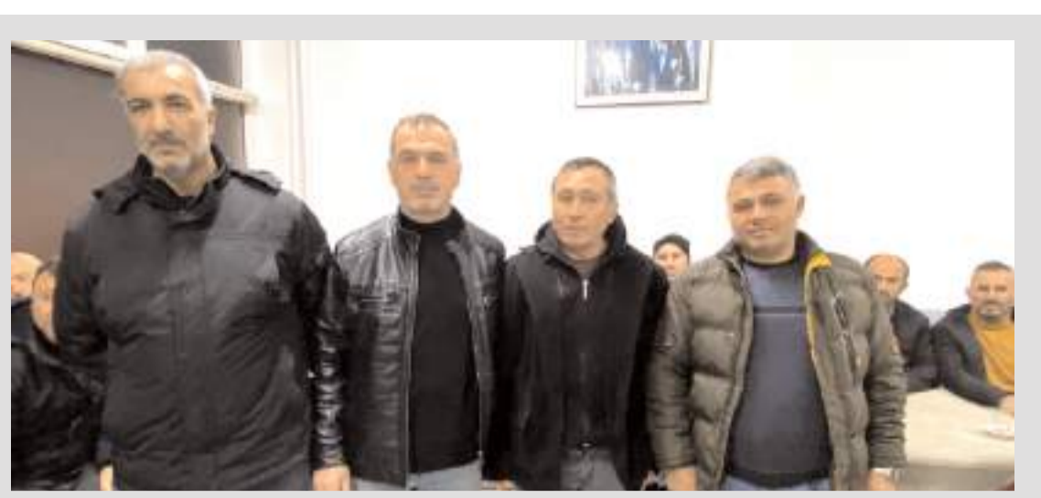
Demirciler yaptıkları toplantıda yeni yevmiyeleri belirlediler.