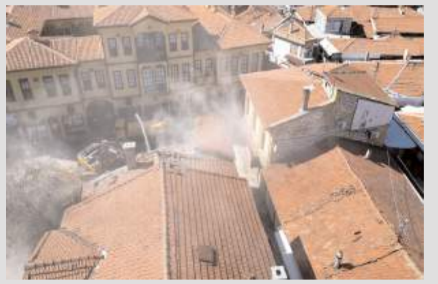
Bölgede yıkım çalışmalarının tamamlanmasıyla Veli Paşa Hanı'nın önü de açılmış olacak.