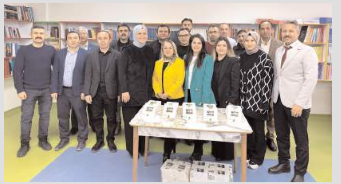
Mili Eğitim Bakanı Yusuf Tekin, bir araya gelerek eğitim kitabı yazar 20 öğretmeni tebrik etti.