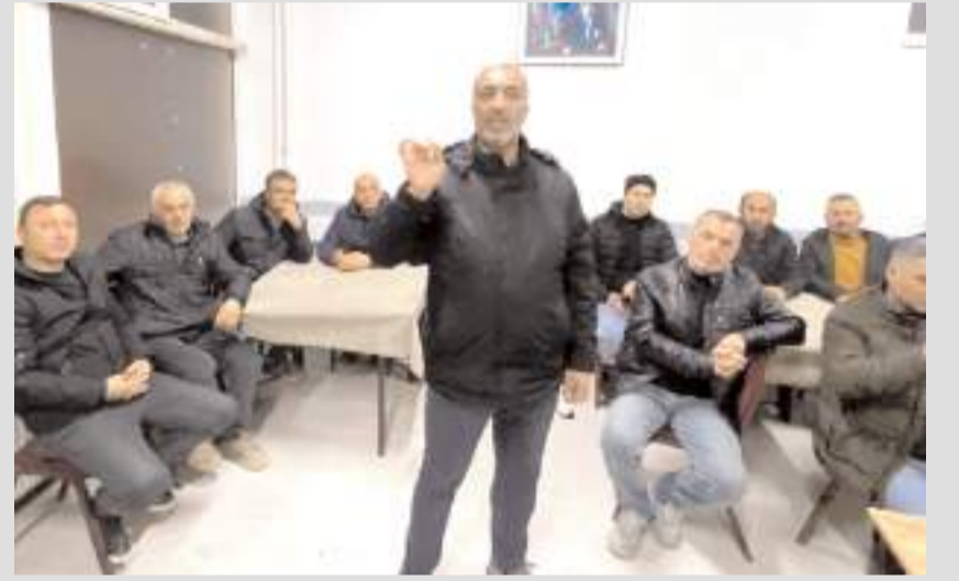
Toplantının ardından açıklama yapıldı.