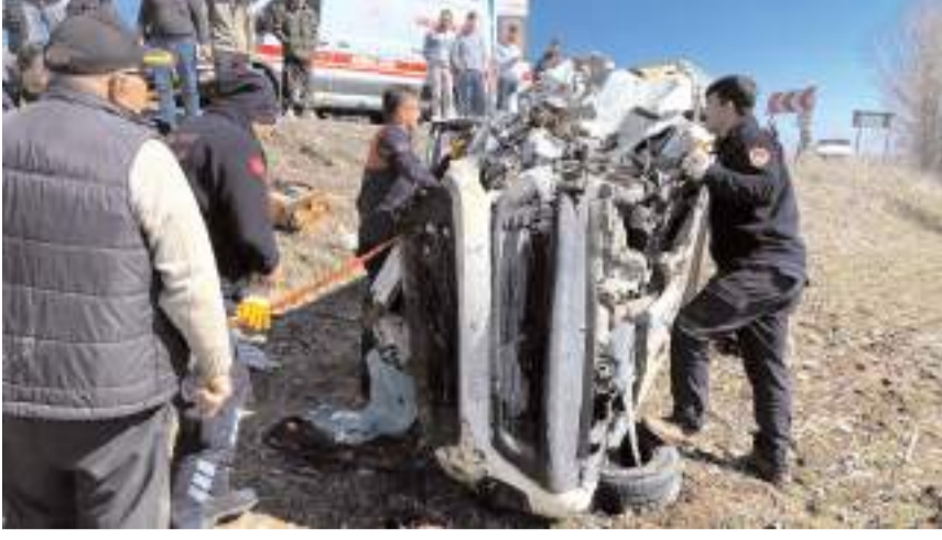
Araçta sıkışan yolcuu itfaiye ekipleri kurtardı.