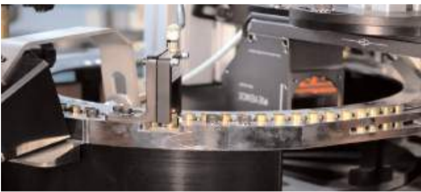
ARCA Savunma, sektöründeki en büyük ihracatçıları arasında ilk 5'te yer alıyor.