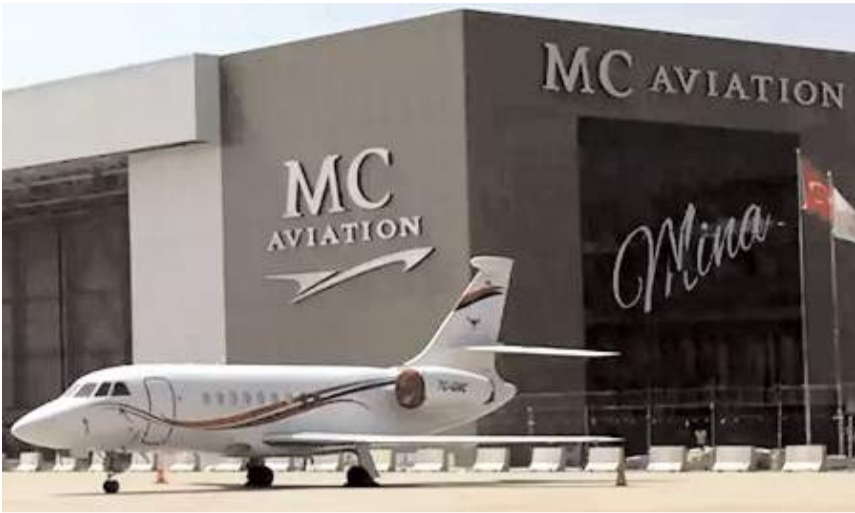
ARCA Savunma 2012 yılında kurulan MC Havacılık'ı bünyesine aldı.