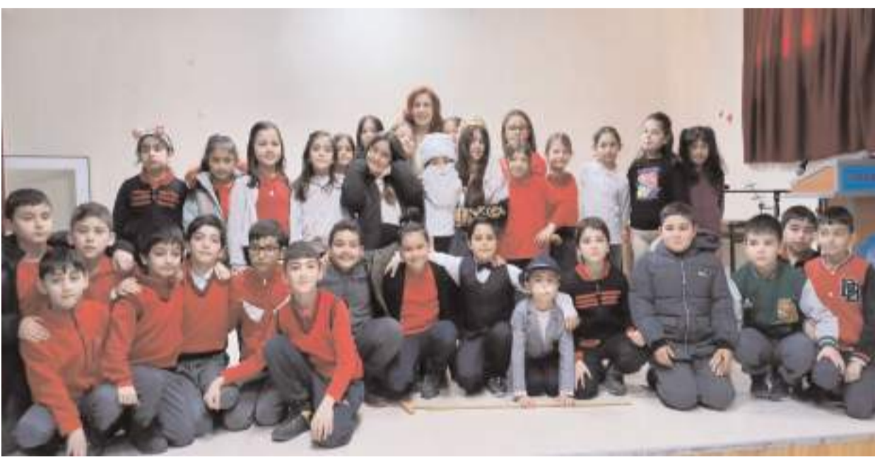
Öğrenciler günün anısına hatıra fotoğrafı çekindiler.