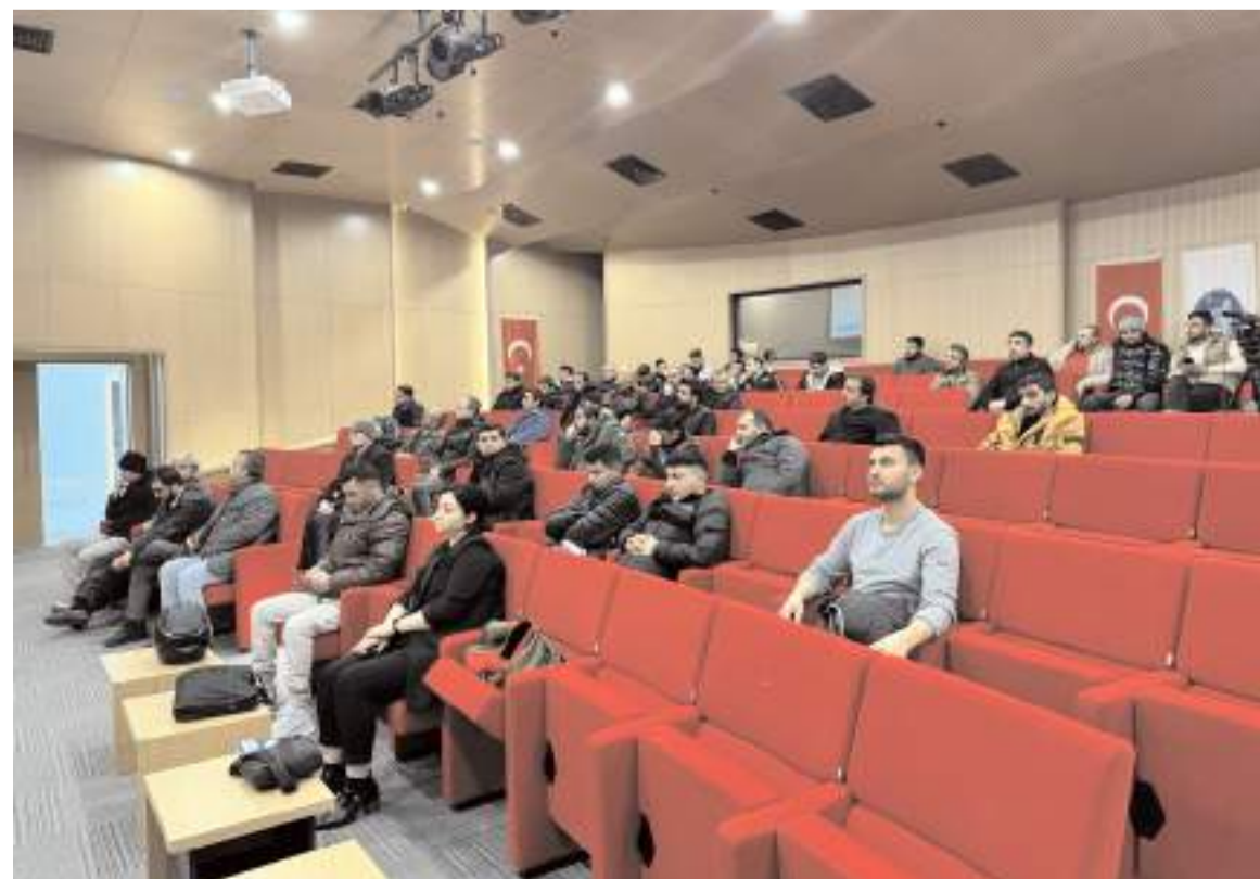
290 kişi 6 ay geçici Çorum Belediyesi bünyesinde görev yapacak.