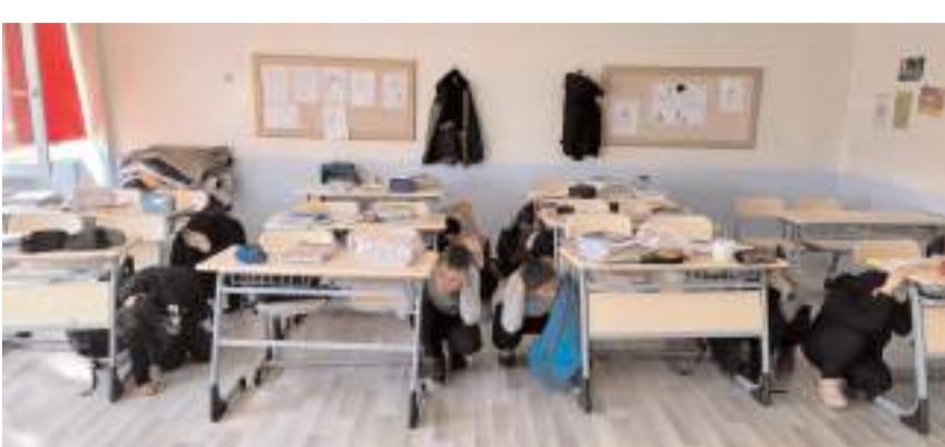
Öğrenciler bir deprem anında nasıl hareket etmeleri gerektiğini uygulamalı olarak gerçekleştirdiler.