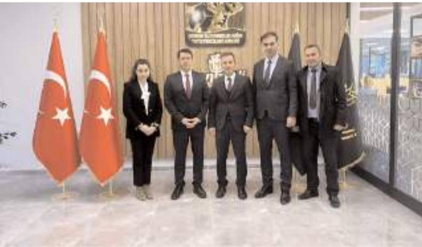
İmza töreninin ardından hatıra fotoğrafı çekildi.

Krediden yararlanmak isteyen Çorum İli Damızlık Sığır Yetiştiricileri Birliği üyeleri, doğrudan Vakıfbank Çorum Şubesi'ne