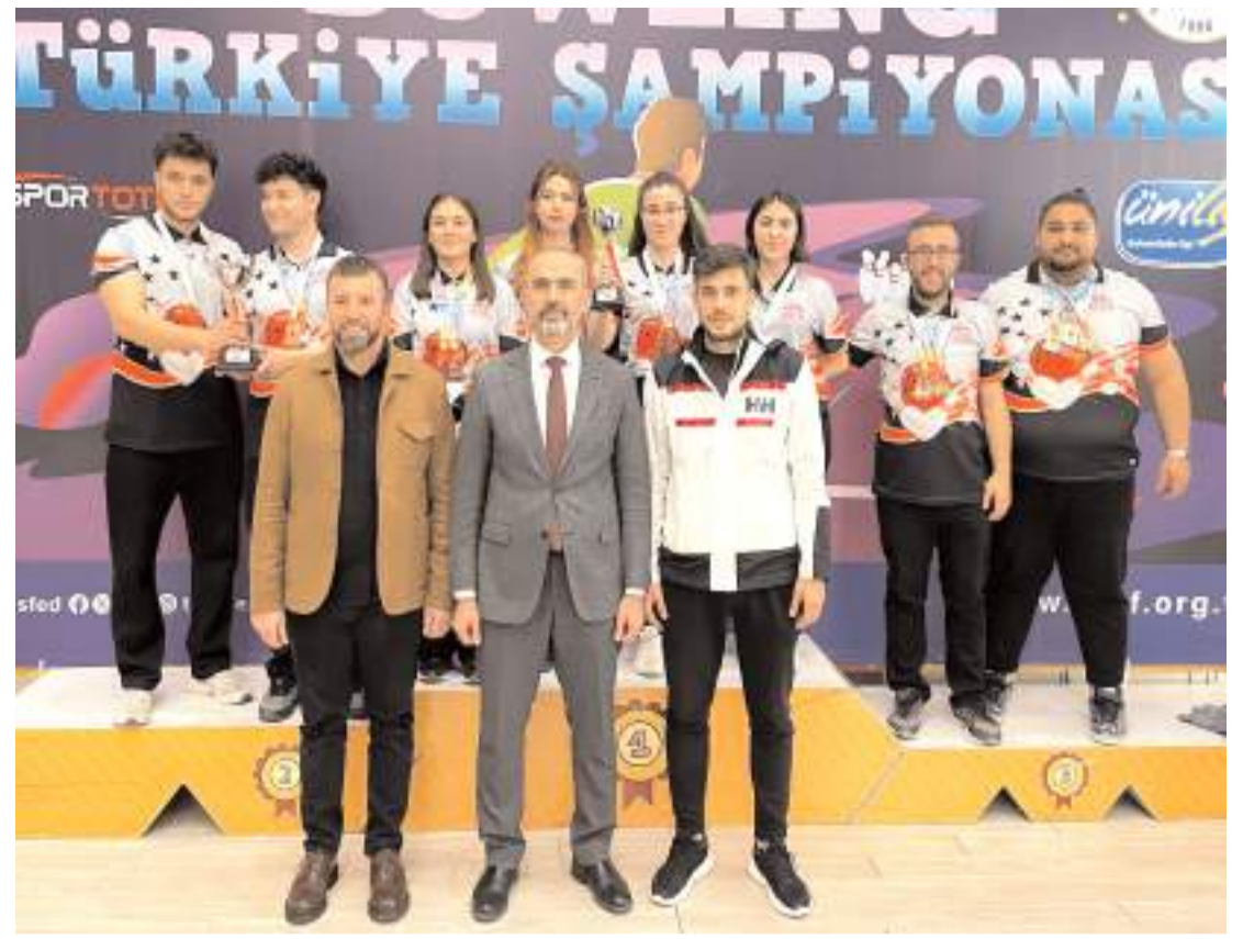
Hitit Üniversitesi Bowling takımı Samsun'da yapılan ödül töreni sonrasında kazandığı ödüller ile toplu halde kürsüde