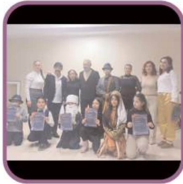
Öğrenciler aileleriyle birlikte Aşık Veysel ve Nasreddin Hoca'nın hayatlarını canlandırdılar.