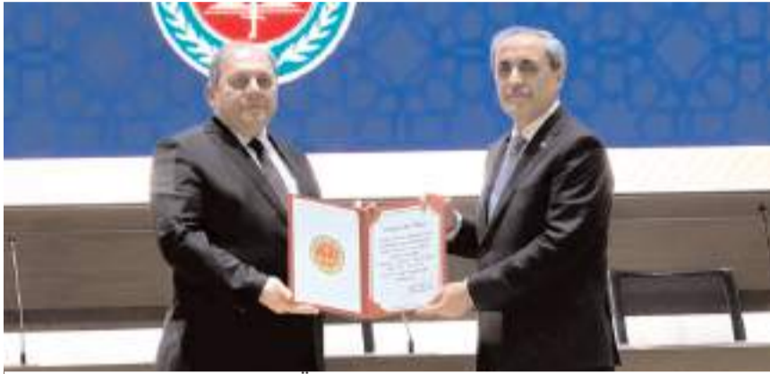
Yargıtay Başkanı Ömer Kerkez, hemşehrimiz Bekir Şahin'e, Yargıtay Onur Belgesi takdim etti.

Şahin, Yargıtay Cumhuriyet Başsavcısı'yken Halkların Demokratik Partisi (HDP) hakkında kapatma davası açmıştı.