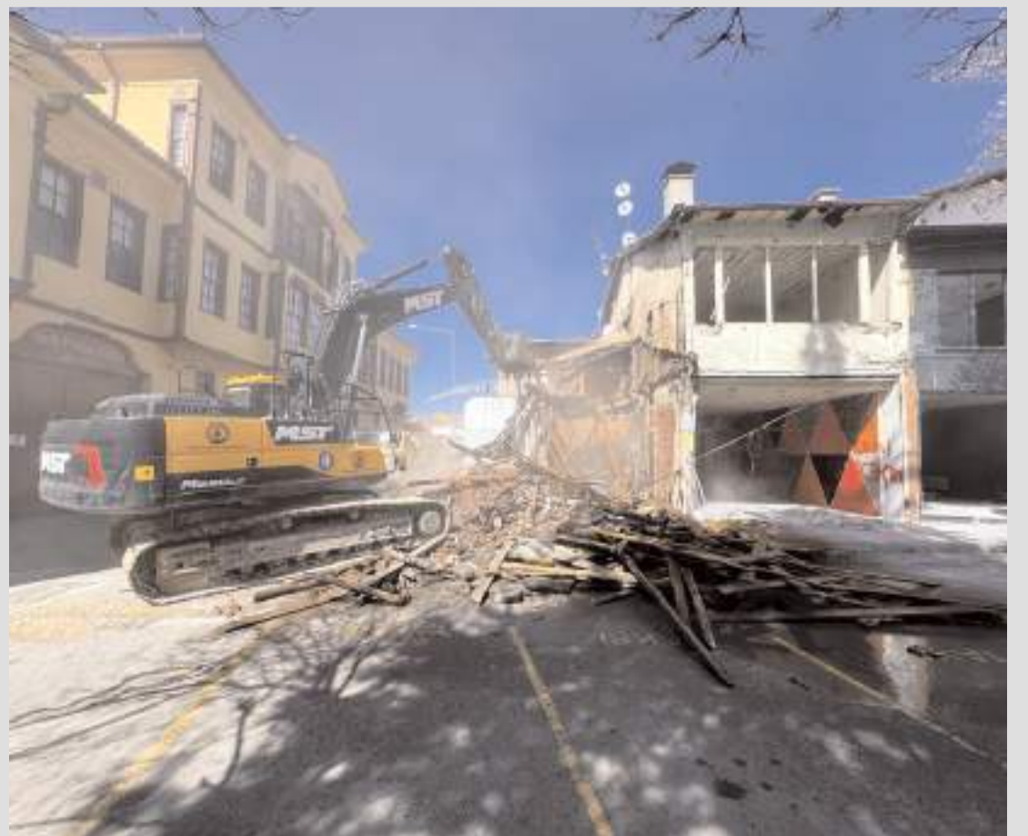
Tarihi Meydan'da çalışmalar hız kazandı.