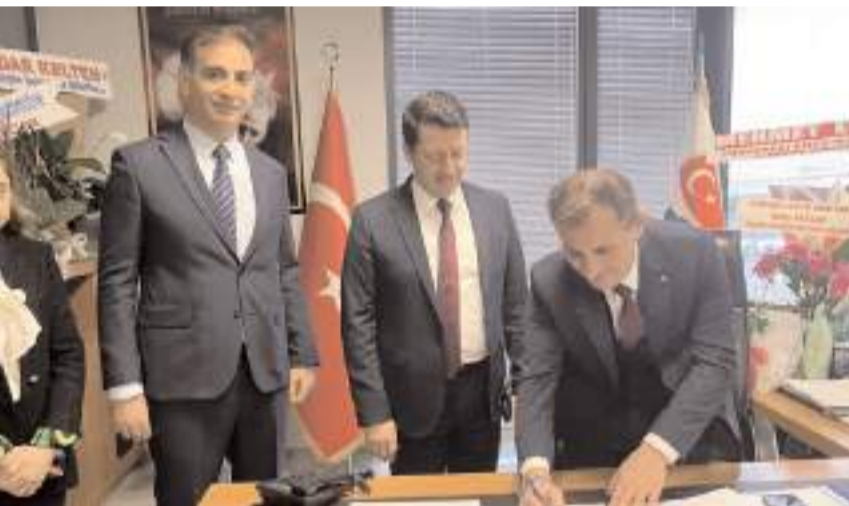
İmza töreninin ardından hatıra fotoğrafı çekildi.