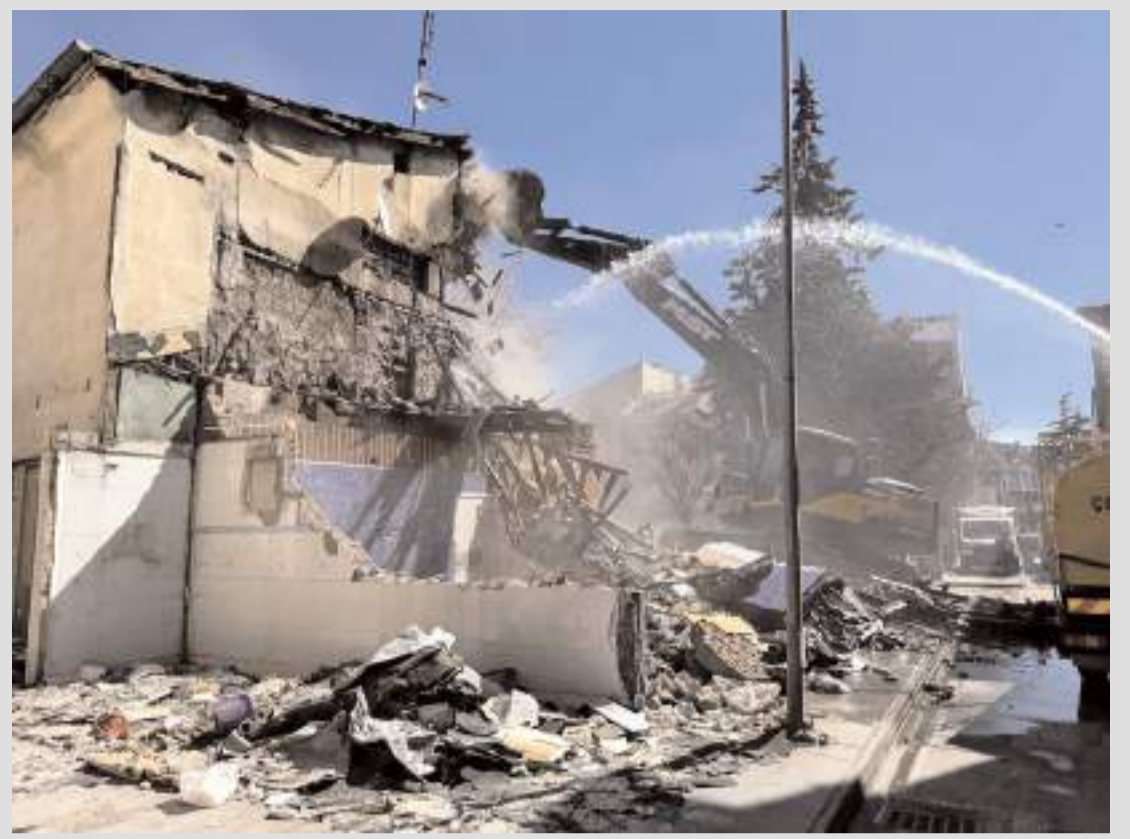
Balıkçıların taşınmasıyla başlatılan yıkım süreci diğer iş yeri sahiplerinin de dükkanlarını boşaltmasıyla birlikte devam ediyor.

Senaryo gereği acil toplanma bölgelerinde toplanan öğrencilere, deprem esnasında yapılması gerekenler anlatıldı.(AA)