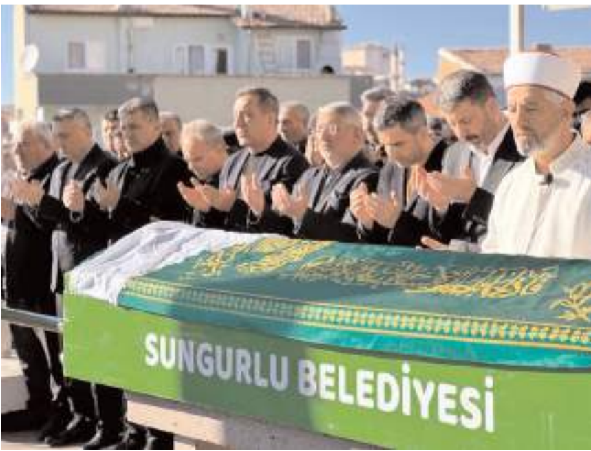
Merhume için Sungurlu Ulu Camiinde cenaze namazı kılındı.

HAKİMİYET, merhumeye Allah'tan rahmet ailesi ve sevenlerine başsağlığı diler.