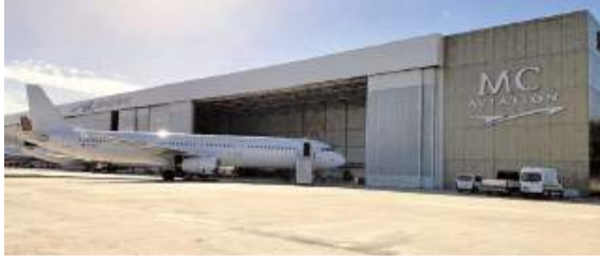
Şirket, İstanbul Atatürk Havalimanı Özel Hangarlar Bölgesi'nde 8.500 metrekarelik modern bir tesis işletiyor.