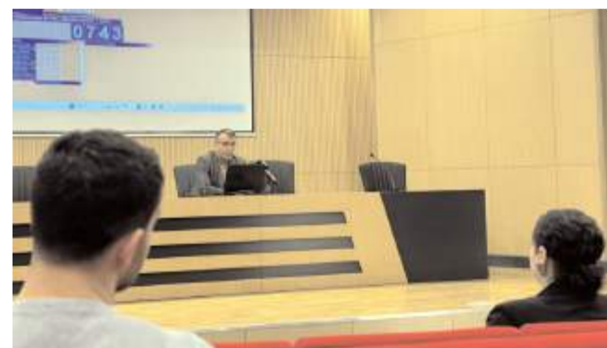
10 otobüs şoförü ve 48 arazöz şoförü için kura çekimi yapılmadı.