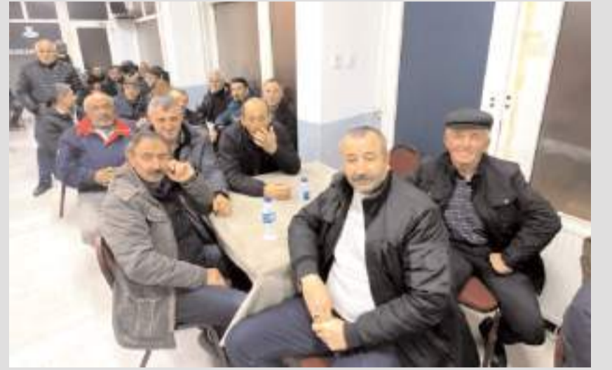
Yeni yevmiyeler 5 Mart 2025 tarihinden itibaren geçerli.

İnşaatlarda soğuk-sıcak, yağmur-çamur demeden çalıştıklarını, hayat pahalılığının artık canlarına tak ettiğini dile getiren demir ustaları ise, "çocuklarımızın rızkını kazanmaya, evimize ekmek götürmeye çalışıyoruz. Artık yevmiye fiyatı konusunda istikrar sağladık. Kimse ayrı hareket etmeyecek. Fiyatımız 3 bin liradır" şeklinde konuştular.