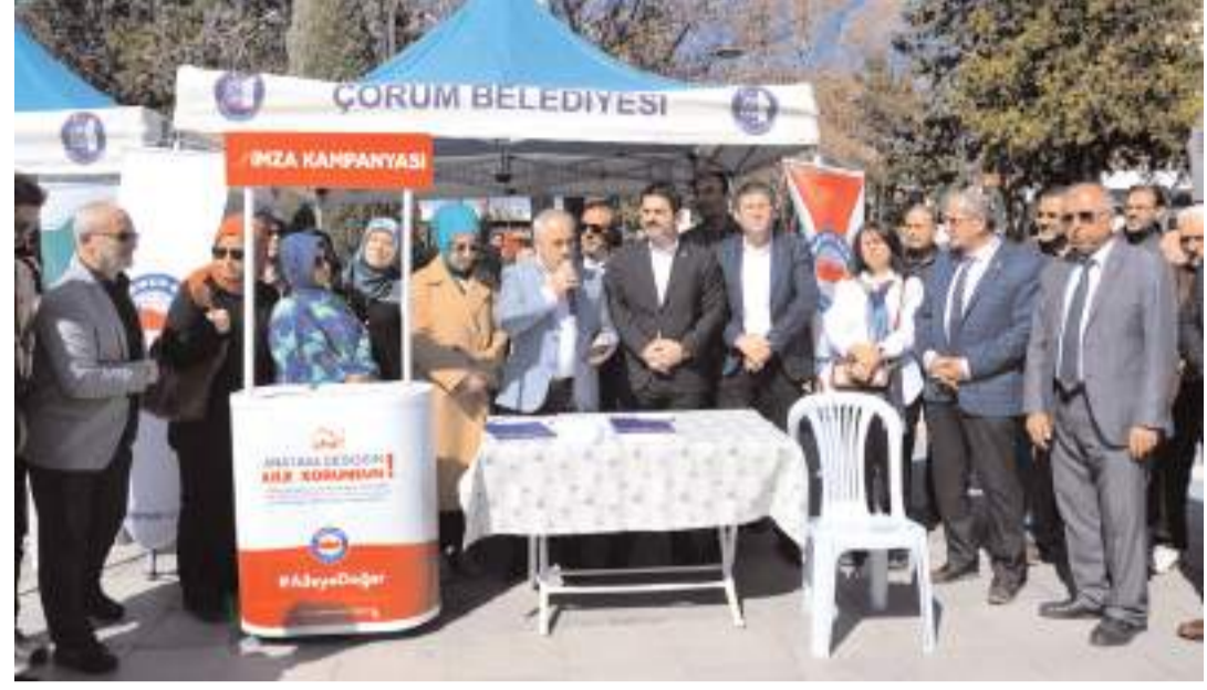
Memur Sen, aile yapısının korunması ve kılık kıyafet özgürlüğünün Anayasal güvence altına alınması için 'Anayasa değişsin, aile korunsun' sloganıyla imza kampanyası başlattı.

Anayasa'nın 41. maddesine, "Aile, kadın ve erkekten oluşur. Aile ilişkisinin temeli evliliklidir" cümlesinin eklenerek anayasal güvence verilmesini talep ettiklerini belirten Okumuş; "Aile kurumunun sapkın ideolojilere karşı korunmasını ve ailenin tanımının, kadın, erkek ve çocuklardan oluşan bir yapı olarak kabul edilmesini istiyoruz. Ayrıca, kadınlarımızın başörtüsü nedeniyle ayrımcılığa uğramaması için başörtüsü özgürlüğünün anayasal güvence altına alınmasını talep ediyoruz. Anayasa'nın 24. maddesinde gereken düzenlemenin yapılmasını istiyoruz. Ailemizi korumak ve başörtüsü özgürlüğünün güvence altına almak için Gazi Meclisimizi biran önce harekete geçmeye çağırıyoruz. Memur-Sen olarak, aileyi korumak ve başörtüsü özgürlüğünün güvence altına alınması için başlattığımız imza kampanyasıyla diyoruz ki "Anayasa değişsin, Aile korunsun." Yarınlarımızın korunması ve güvence altına alınabilmesi için bugünden harekete geçmeye ve kampanyamıza tüm halkımızı destek olmaya çağırıyoruz. Memur-Sen Genel Merkezimizin öncülüğünde tüm illerde kurulan stantlarımız kıymetli halkımızın duyarlılığına matuftur. Biz de ilimizde standımızla tüm vatandaşlarımızı imzalarını atmaya ve kampanyayı desteklemeye davet ediyoruz. Kampanyamıza www.imza.memur-sen.org.tr adresinden katılabilirsiniz." ifadelerini kullandı.