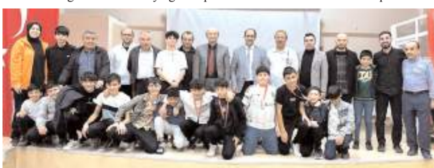
Erkekler satrançta dereceye giren sporcular ve protokol üyeleri ödül töreni sonrası