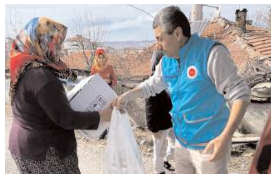
Vatandaşların zekat, fitre ve hayır bağışları ihtiyaç sahiplerine ulaştırıldı.

"Toplumumuzun her kesiminden vatandaşlarımızın vakfımıza ulaştırdığı bağışlar, ihtiyaç sahiplerine ulaştırılıyor. Bu yardımlaşma ruhu, birbirimize olan dayanışmamızı güçlendirerek, toplumsal huzurumuzu sağlıyor" diyen Yıldırım, bağış yapan tüm Çorumlu hayırseverlere teşekkür etti.