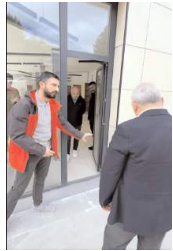
Başkan Aşgın, yaşanan sorunlar hakkında teknik ekipten bilgi aldı.