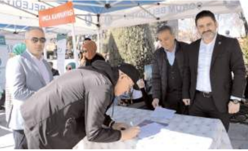
İmza kampanyası 1 Mayıs'a kadar devam edecek.