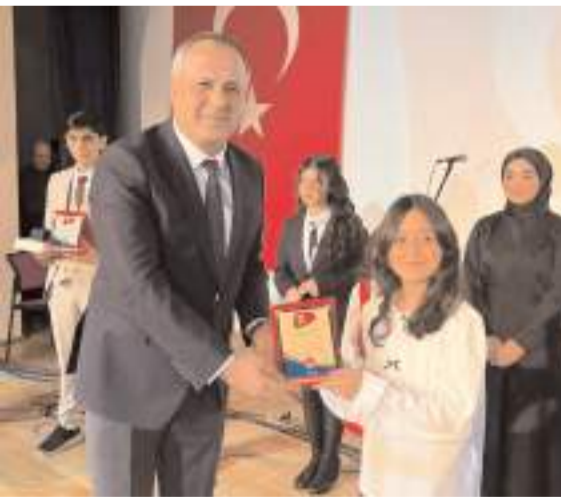
Yarışmada derece elde eden öğrencilere plaket ve ödül verildi.