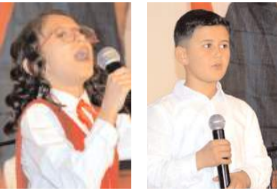
Öğrencilerin performansları bol bol alkış aldı.

3 farklı kategoride organize edilen yarışmacılara ödülleri protokol üyeleri tarafından takdim edildi.