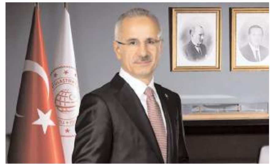
Ulaştırma ve Altyapı Bakanı Abdulkadir Uraloğlu

Yeni düzenlemeyle en az 2, en fazla 4 kişinin aynı otobüs ve güzergahta biletli olarak seyahat etmek istediklerinde, aile olduklarını bildirdiklerinde indirimden faydalanabileceğini vurgulayan Uraloğlu, indirimden yararlanmak için yolcuların, aynı soyadı taşıması veya aile olduklarını ilgili mevzuata uygun bir belgeyle kanıtlanmasının yeterli olacağını ifade etti. (A.A)