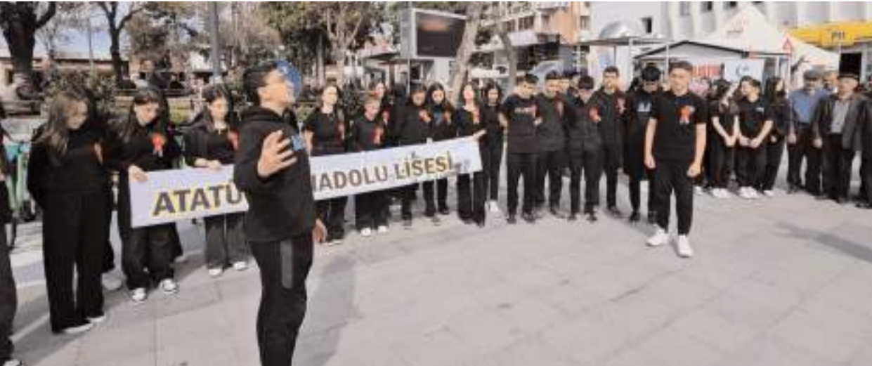
Etkinlik Hürriyet Meydanı'nda yapıldı.

Öztürk, "İstiklal Marşı'mızın hangi zorluklar altında yazıldığını anlatmak amacıyla öğrencilerimiz tarafından hazırlanan oratoryoyu kentten bir kaç noktada sergileyeceğiz." dedi.(AA)