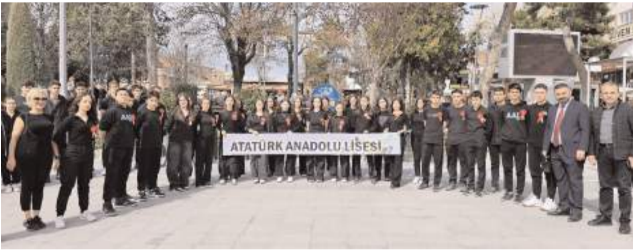
Oratoryoyu Çorum Atatürk Anadolu Lisesi öğrencileri sahneledi.