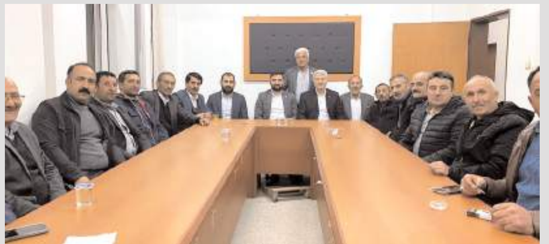
İftarın ardından yapılan toplantıda köy muhtarları taleplerini ilettiler.