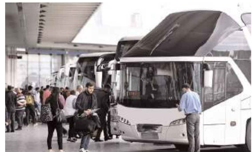
Uygulamadan en az 2, en fazla 4 kişi yararlanabilecek.