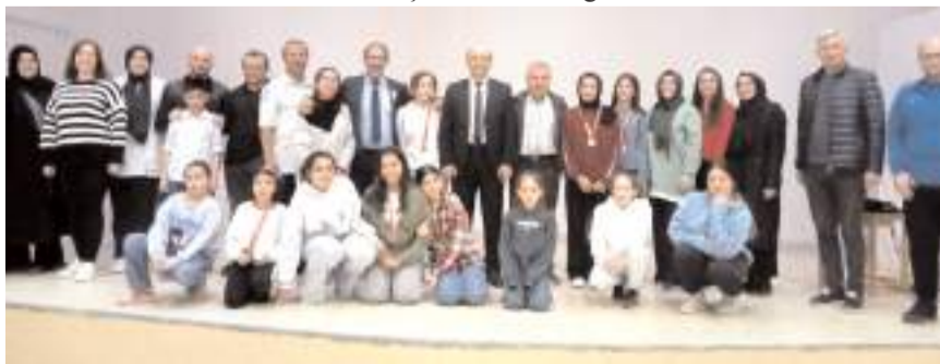
Kızlar kategorisinde dereceye giren sporcular ödül töreni sonrasında toplu halde