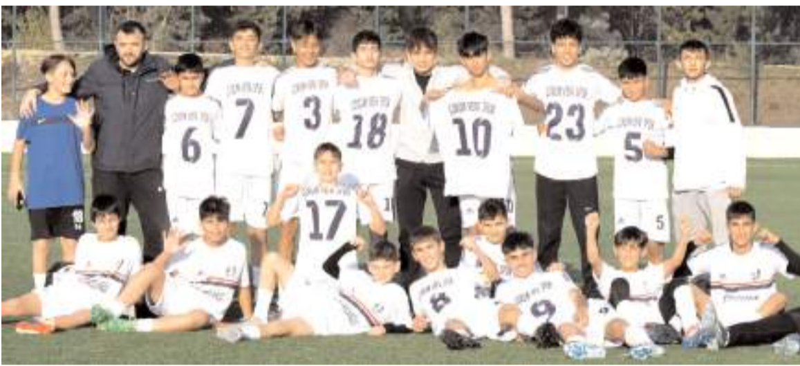
Vefaspor U 14 takımı grup birinciliği maçları için Yozgat'ta mücadele edecek

Aynı tarihlerde ilimizde yapılacak olan U 14 1. Kademe maçlarında ise iki Ankara takımı ile birlikte Amasya, Samsun, Kırıkkale ve Kastamonu şampiyonları mücadele edecek. Gruplarda mücadele edecek kulüp isimleri ise önümüzdeki günlerde belli olacak.