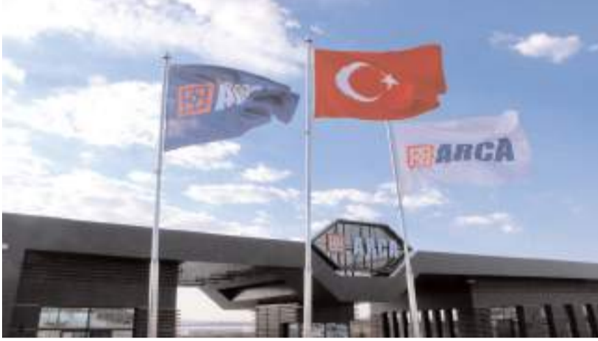
Arca Savunma Sungurlu OSB'de üretim yapıyor.