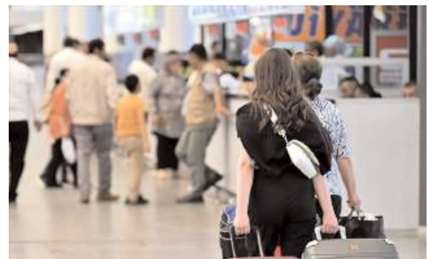
Yeni düzenleme 17 Mart Pazartesi'den itibaren uygulanabilecek.