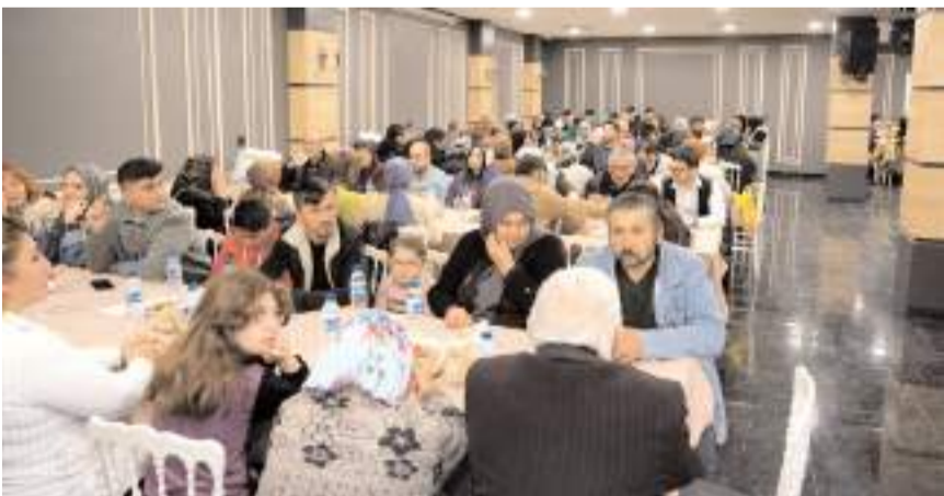
İftar programı Çorum Belediyesi Mimar Sinan Düğün Salonu'nda yapıldı.