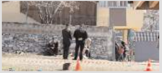
Olay Kargı'nın Akkise köyünde meydana geldi.

Güvenlik güçleri, gaspçıları yakalamak için çalışma başlattı.(AA)