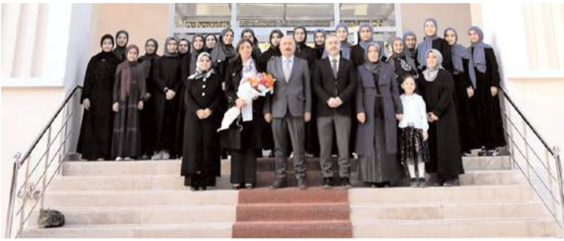
Ziyaretin anısına hatıra fotoğrafı çekildi.