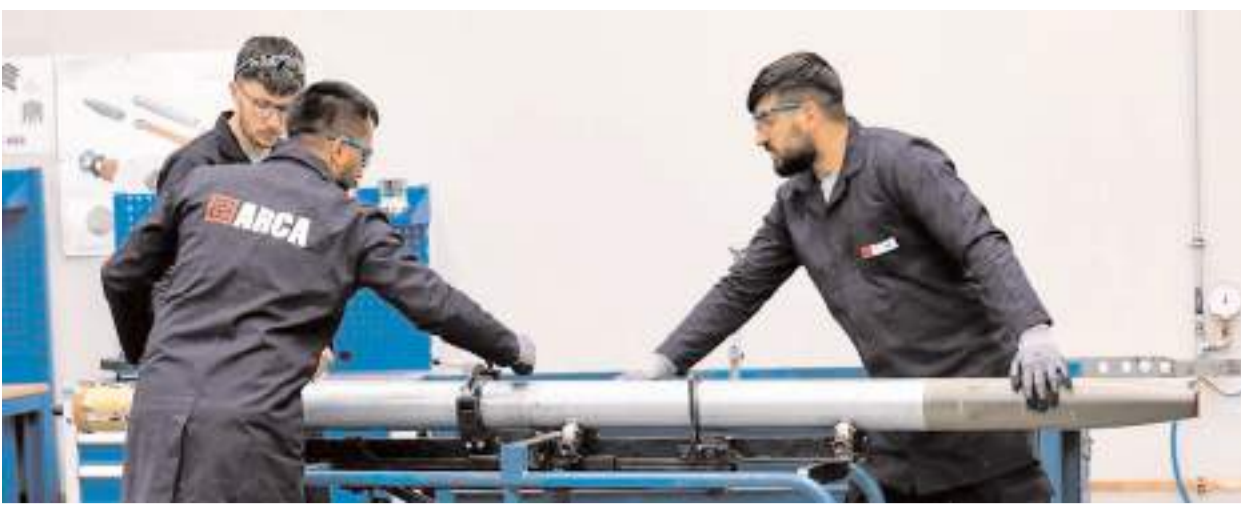
Arca Savunma'nın Sungurlu kampüsünde personel sayısı bini geçti.