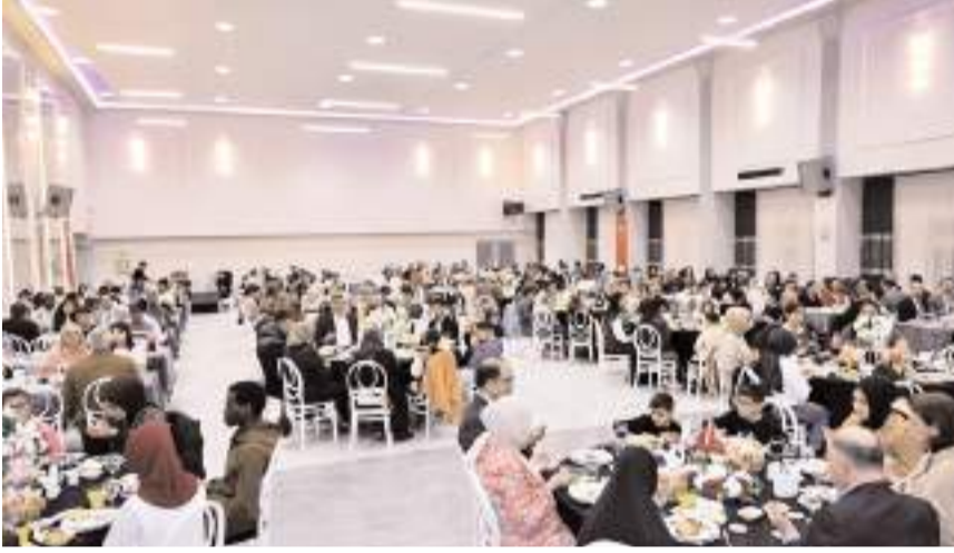
Program Aile ve Sosyal Hizmetler İl Müdürlüğü tarafından düzenlendi.