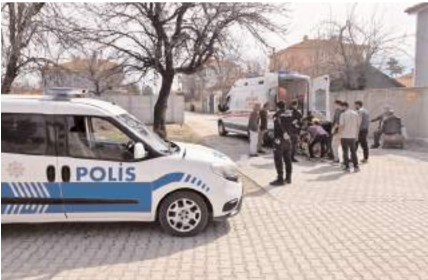
Sağlık ekiplerince ilk müdahalesi yapılan vatandaş hastaneye kaldırıldı.