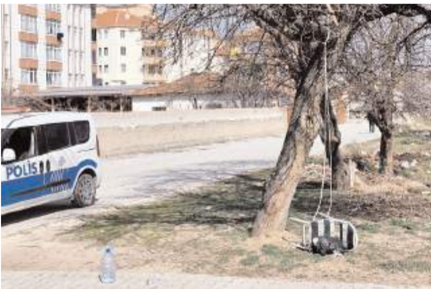
Olay, Alaca'da Denizhan Mahallesi Paşabahçe Sokak'ta meydana geldi.

Polis ekipleri olayla ilgili inceleme başlattı. (İHA)