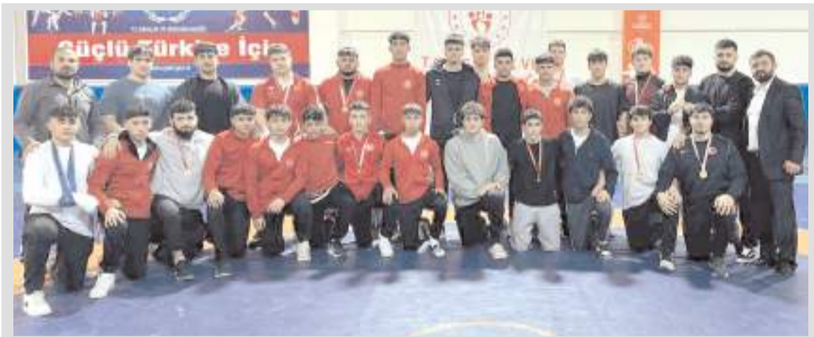
U 20 Güreş il birinciliğinde dereceye giren sporcular tören sonunda toplu halde antrenörleri ile birlikte görüldü

Müسابakalar sonunda sıklotlerinde dereceye giren sporculara madalya verildi. Sıklotlerinde birinci olanlar ilimizi Türkiye Şampiyonasında temsil etmeye hak kazandılar.