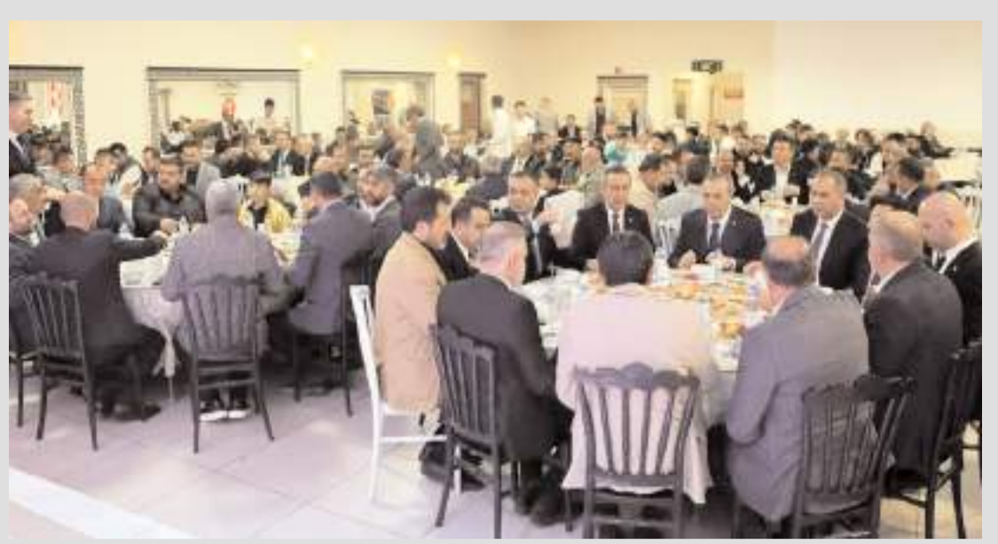
İftar programa katılım yüksek oldu.

Enerji Bakanlığına bağlı Türkiye Kömür İşletmeleri (TKİ) Kurumu; Çorum ili, Dodurga ilçesi sınırları içindeki S:90124 sicil numaralı maden ruhsat sahasında yer alan yaklaşık 7 milyon 110 bin ton kömür rezervinin "Ruh-satın Satış Yolu İle Devri" ihalesini 26 Mart'ta, Edirne ilinin Merkez ilçesinde bulunan 201701445 sicil numaralı maden ruhsat sahasındaki yaklaşık 21 milyon ton kömür rezervinin "Ruh-satın Satış Yolu İle Devri" ihalesini 27 Mart günü yapacak. Geçen hafta da Çayırhan maden sahası özelleştirilmişti.