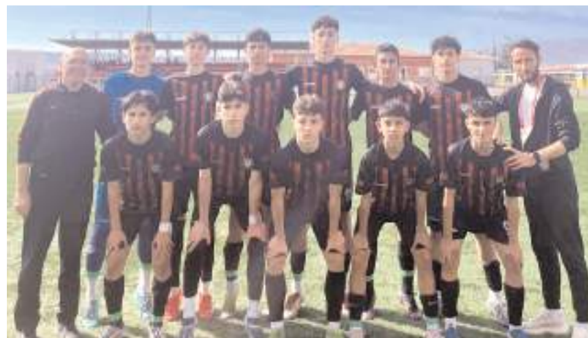
Çorum FK U 15 Kırşehir önünde zorlanmadan galip gelerek haftayı üç puanla kapattı