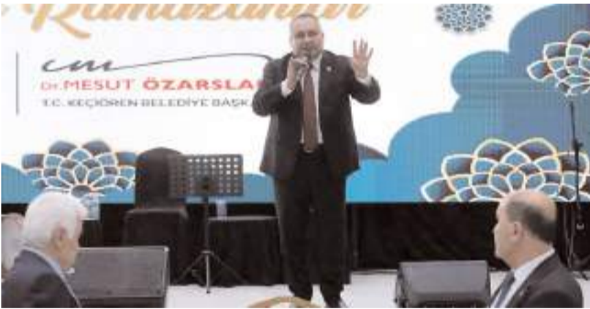
Keçiören Belediye Başkanı Mesut Özarslan, programda konuşma yaptı.

İftar programına Ankara Çorumlu Dernekler Federasyonu Genel Başkanı Hayri Çağır, Çorum Hitit Dernekleri Federasyonu Genel Başkanı Özgür Ardiç, Keçiören Çorumlular Federasyonu Başkanı Okay Erözgün, Ankara Büyükşehir Belediyesi Meclis Başkan Vekili Ertan Işık, 25, 26 ve 27. dönem Ankara Milletvekili Nevzat Ceylan, Çorum dernek, vakıf, federasyon yöneticileri ve Ankara'da yaşayan Çorumlu vatandaşlar katıldı. (İHA)