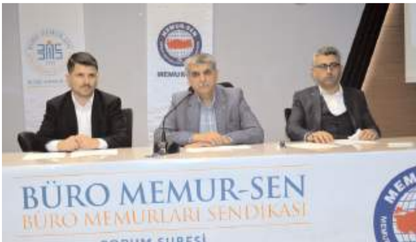
Genel kurulda ilk olarak divan heyeti oluşturuldu.