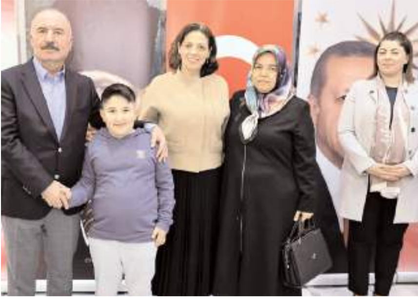
"Dünya Yetimler Günü" nedeniyle iftar programı düzenlendi.