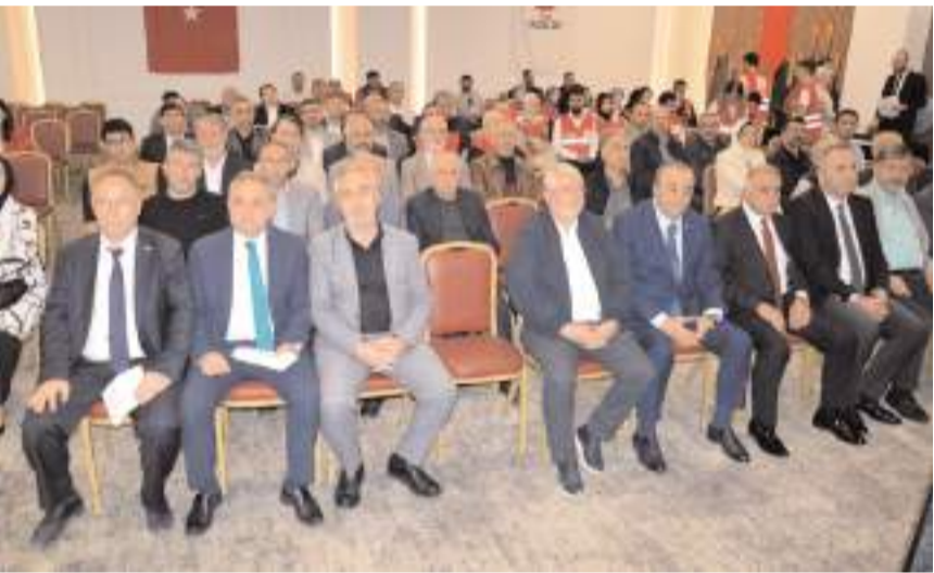
Genel kurul Anitta Otelde yapıldı.