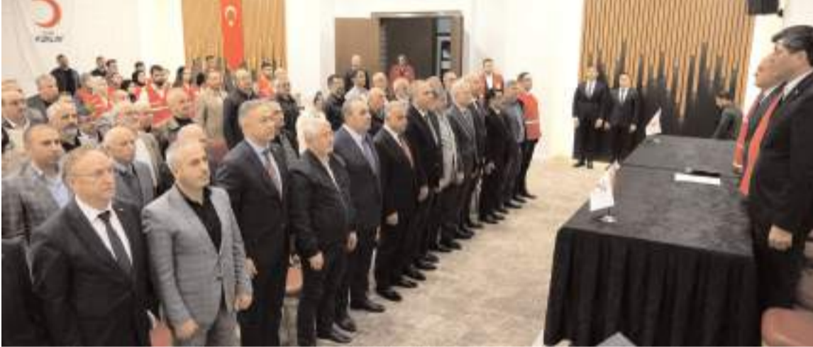
Genel kurul Anitta Otelde yapıldı.