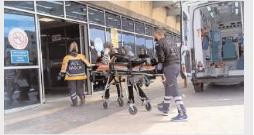
Yaralılar hastanede tedavi altına alındılar.