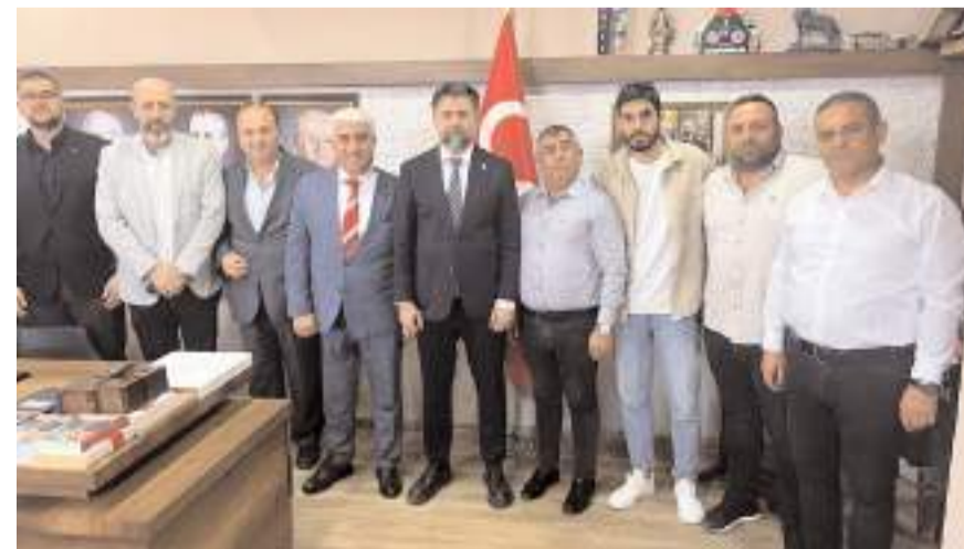
Ziyaretin anısına toplu fotoğraf çekildi.

na büyük katkı sağlayacaktır" şeklinde konuştu.