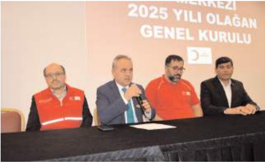
Genel kurulda ilk olarak divan heyeti belirlendi.