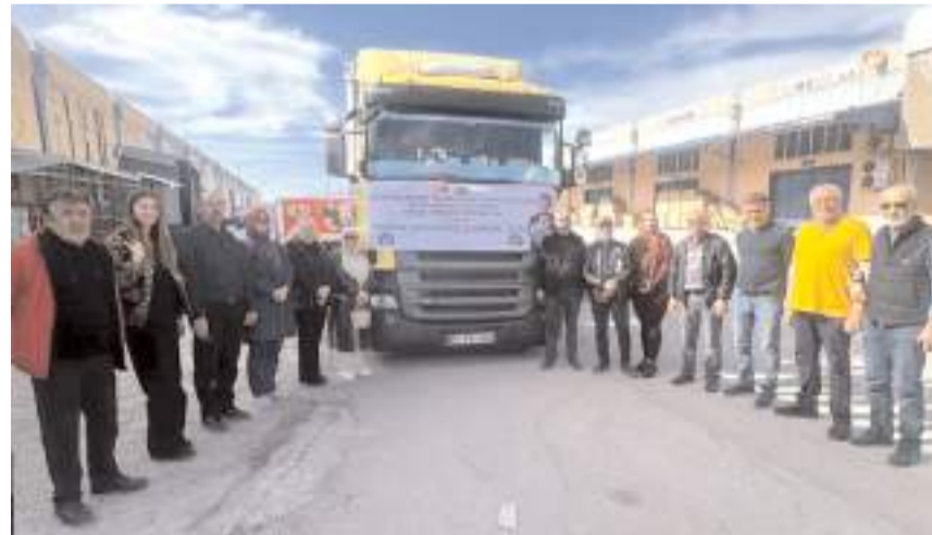
Yardımların yer aldığı tır Toptancılar Sitesinden uğurlandı.

Çorum'da Kafkas Kültür Derneği, Kafkas Dernekleri Federasyonu (KAFFED), Eğitim Araştırma Yardımlaşma, Arama Kurtarma Derneği (ANDA) ve Çorum Gıda Bankası Yardımlaşma ve Dayanışma Derneğince temin edilen 1 tır gıda malzemesi, Suriye'deki savaş mağdurlarına ulaştırılmak üzere uğurlandı. * HABERİ'5'TE