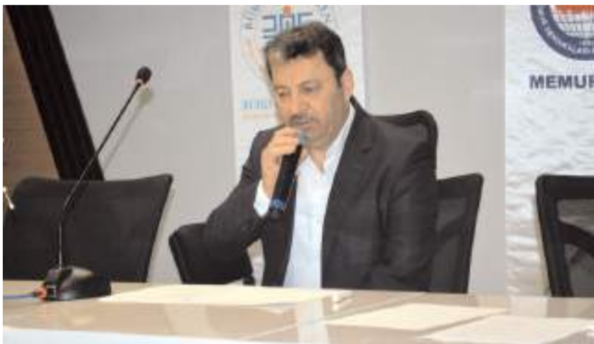
Genel kurul Kur'an-ı Kerim tilaveti ile başladı.