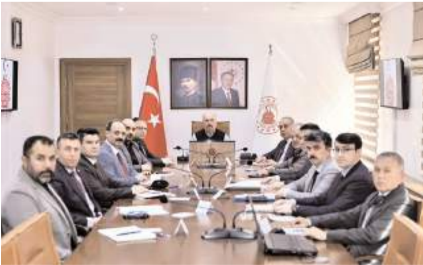
Vali Ali Çalgan, konuyla ilgili birimlerin temsilcileriyle toplantı yaptı.

Vali Çalgan ilgili tüm kurumlar ile ilçe ve belde belediyeleri tarafından çalışmalara ivedilikle başlanması, iletişim, işbirliği ve koordinasyon içerisinde ciddiyetle yürütülmesi talimatını verdi.