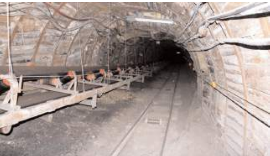
Dodurga'da 7 milyon 110 bin ton kömür rezervi bulunuyor.