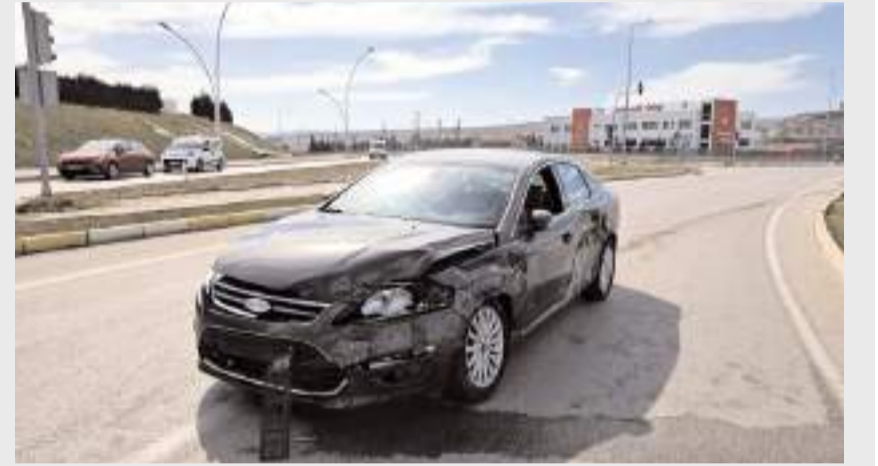
Kazada her iki araçta da maddi hasar meydana geldi.

Yaralılar, sağlık ekiplerinin müdahalesinin ardından Hitit Üniversitesi Erol Olçok Eğitim ve Araştırma Hastanesi ile kentte bulunan bir özel hastaneye kaldırıldı.(AA)