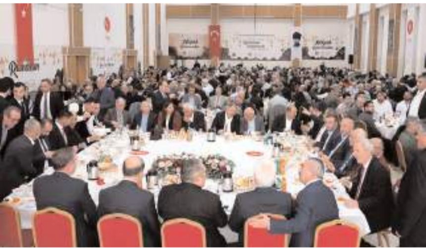
İftar programına katılım yüksek oldu.