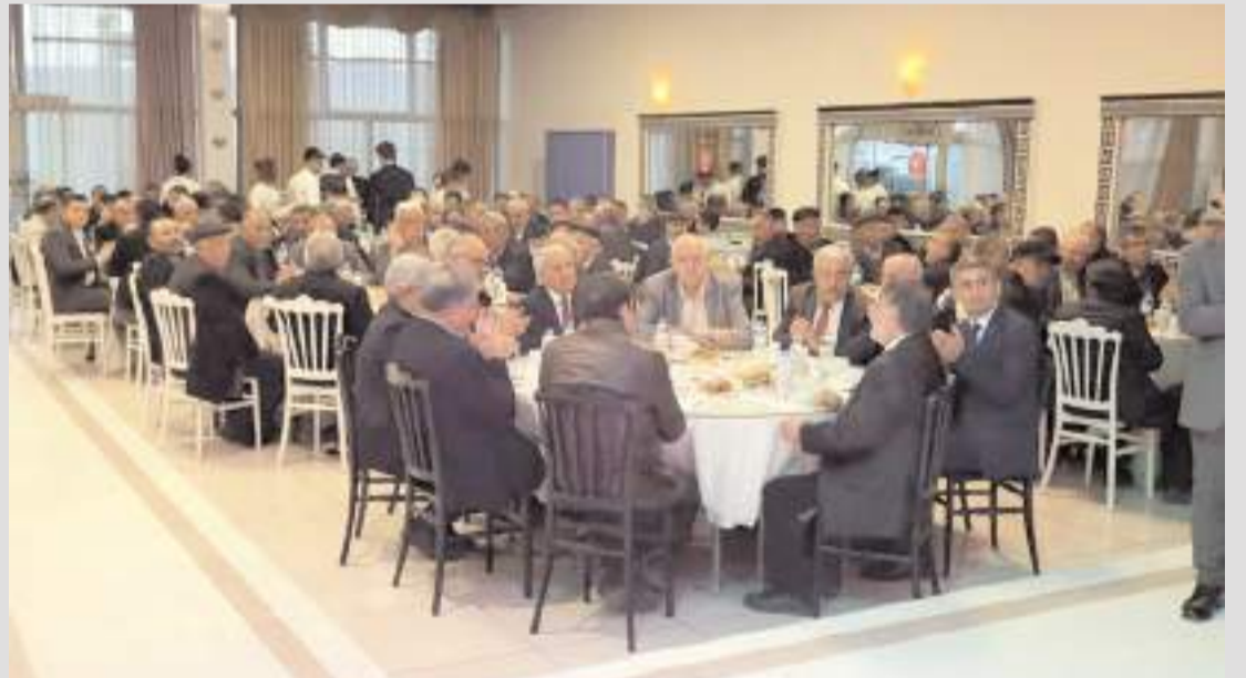
İftara MHP teşkilatı, oda başkanları, köy ve mahalle muhtarları katıldı.