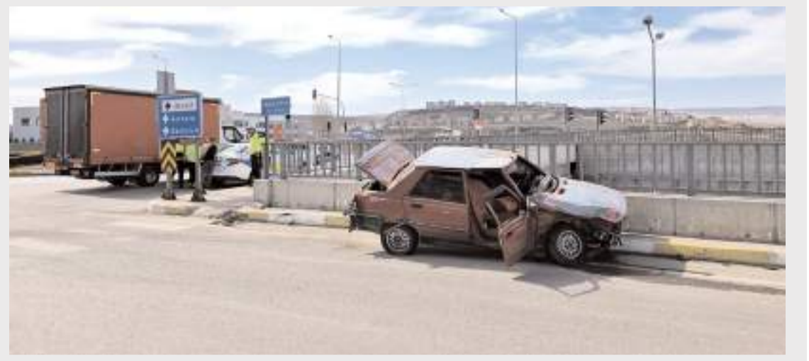
Kaza Çevreyolu Bulvarı Burunçiftlik Kavşağı'nda meydana geldi.

Şanlıurfa, Malatya, Edirne, Ankara, Kütahya, Hakkari, Uşak, Balıkesir, Mersin, Bursa, Aksaray ve Çorum olmak üzere 23 ilde son iki haftada düzenlenen operasyonlarda, 416 kilogram uyuşturucu madde ile 192 bin 976 adet uyuşturucu hap ele geçirildi. Olaylarda 56 şüpheli yakalanırken, şüphelilerden 44'ü tutuklandı, 12 şahıs hakkında ise adli kontrol kararı verildi. (İHA)