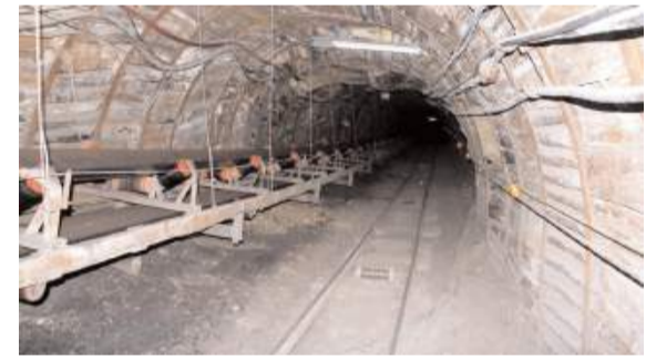
Dodurga'da 7 milyon 110 bin ton kömür rezervi bulunuyor.