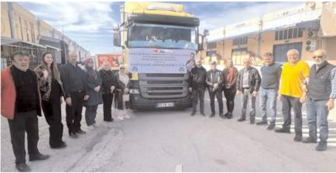
Yardımların yer aldığı tır Toptancılar Sitesinden uğurlandı.

"Yıllardır ramazan ayını vesile kılarak yardımlaştırıyoruz. Bu yıl yaralarını sarmaya çalışan Suriyeli kardeşlerimizle paylaşmak bizlere ayrı bir mutluluk vermiştir. Paylaştığımız dünyalıklar bizdeki emanetlerdir. Asıl sahibi Yüce Yaradan'dır. Emegi geçenlere teşekkür ediyorum."(AA)