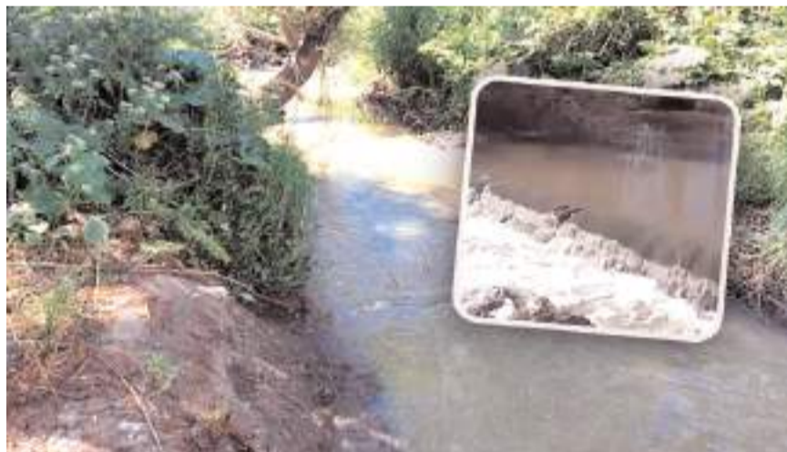
Derinçay'da kirlilik her geçen gün artıyor

"Köylülerimiz bize gönderdikleri videolu mesajlarla bu kirliliğe isyan ediyor. Gelen görüntüler içimizi acıtıyor. Derinçay