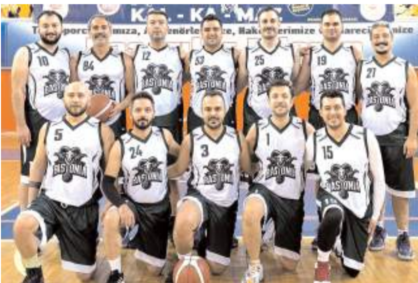
Bastonia takımı yarı final maçını kazanarak finale yükselmeyi başardı