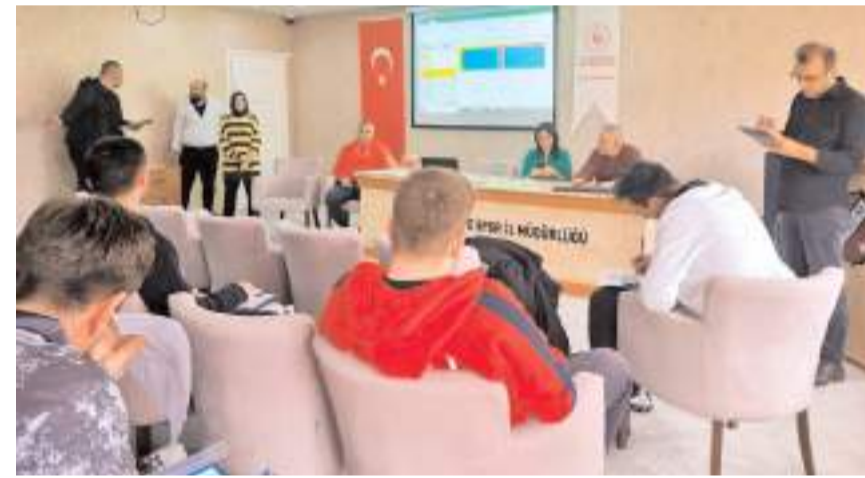
Okullu Yıldızlar basketbol yarı final maçları teknik toplantısı yapıldı