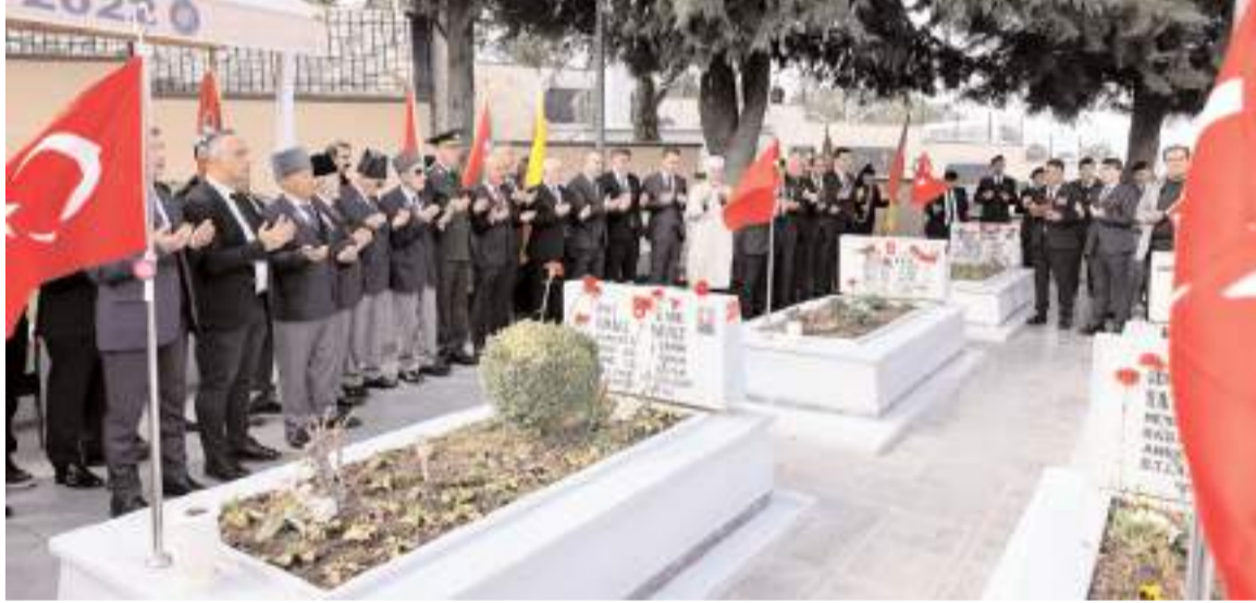
Programda tüm şehitler için dua edildi.

■ 18 Mart Şehitleri Anma Günü ve Çanakkale Zaferi'nin 110. yıl dönümü nedeniyle şehitlikte program düzenlendi. Kur'an-ı Kerim tilavetinin de okunduğu programda şehitlerin kabirleri ziyaret ederek karanfil bırakıldı. * HABERİ2'DE