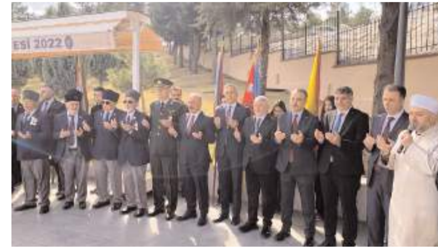
Programda tüm şehitler için dua edildi.

Çelenk sunumuyla başlayan program saygı duruşunda bulunulması ve İstiklal