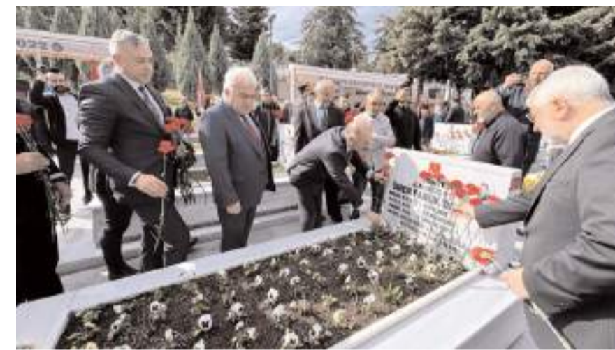
Protokol üyeleri şehit kabirlerine çiçek bıraktı.