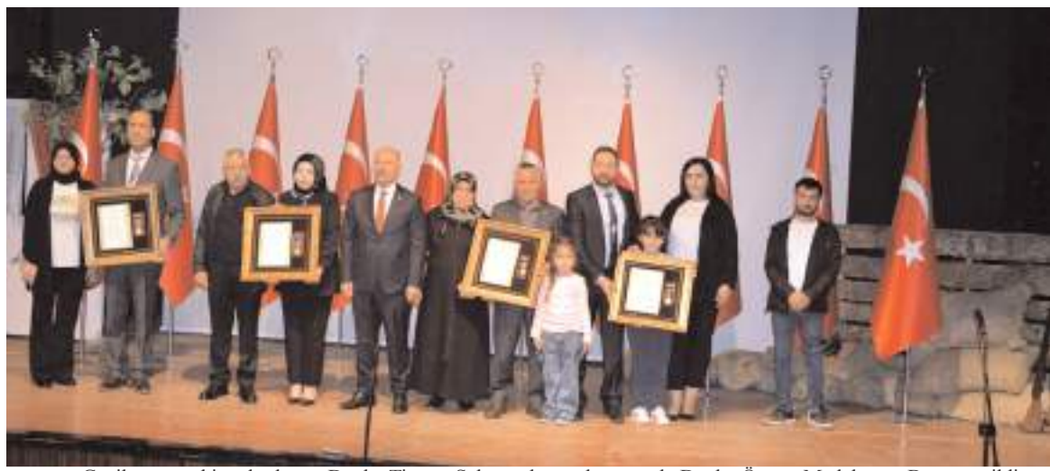
Gazilere ve şehit yakınlarına Devlet Tiyatro Salonunda yapılan törenle Devlet Övünç Madalyası ve Beratı verildi.

18 Mart Şehitleri Anma Günü ve Çanakkale Zaferi'nin 110. yıl dönümünde, başta Gazi Mustafa Kemal Atatürk ve silah arkadaşları olmak üzere, vatan toprağına düşerek şehadet şerbetini içen tüm aziz şehitlerimizi rahmet, minnet ve sonsuz şükranla anıyorum. Ruhları şad, mekânları cennet, makamları peygamberlere komşu olsun. Ne mutlu şehitlerimizin izinden yürüyenlere. Ne mutlu bu cennet vatan uğruna can verenlere. Ne mutlu türkümlü diyene." (Haber Merkezi)