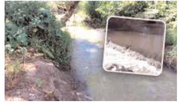
Derinçay'da kirlilik her geçen gün artıyor