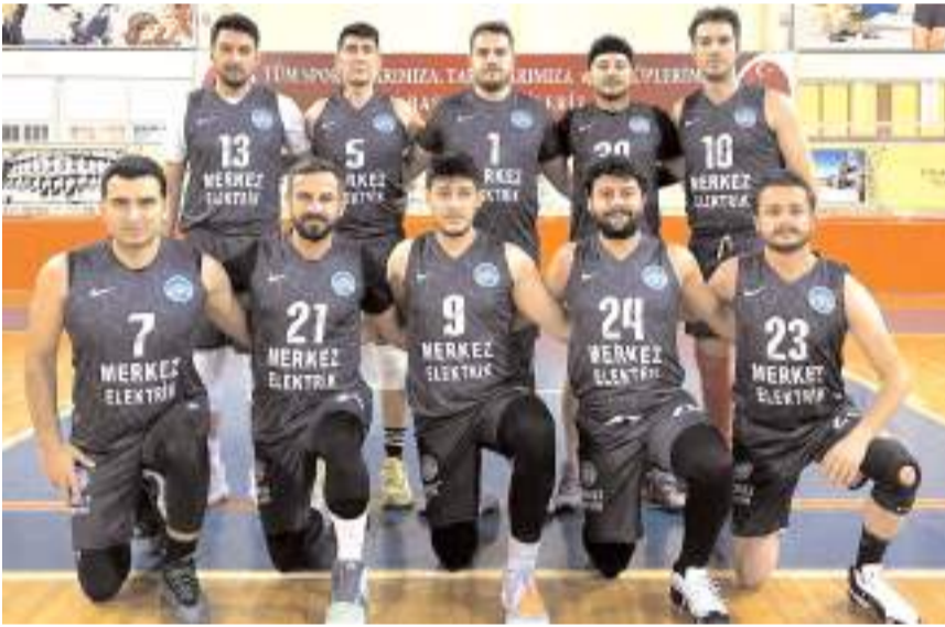
Merkez Elektrik takımı zorlu maçı kazanarak finale yükselen takım oldu

21 Mart cuma saat 21'de Atatürk Spor Salonunda Gelişim Basketbol ile Erdemli Tarım takımları üçüncülük dördüncülük maçında karşılaşacak. 22 Mart cumartesi günü ise saat 21'de Merkez Elektrik ile Bastonia takımları ise şampiyonluk maçına çıkacaklar. Bu maçın ardından düzenlenen törenle takımlara kupa ve madalyaları verilecek.