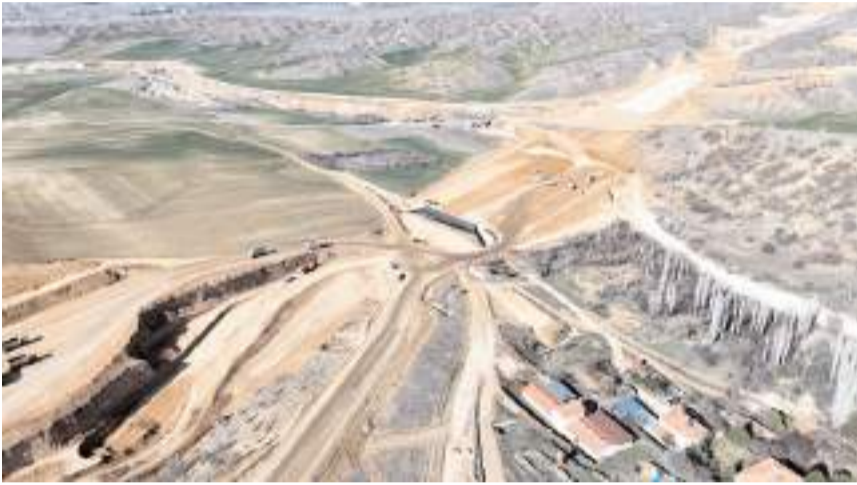
Ankara-Kırıkkale-Delice Otoyolunda çalışmalar hızla devam ediyor.

Çorum'dan Ankara'ya gideceklerin ulaşımını daha rahat ve kolay sağlayacak Ankara-Kırıkkale-Delice Otoyolu'nda çalışmalar hızla devam ediyor.