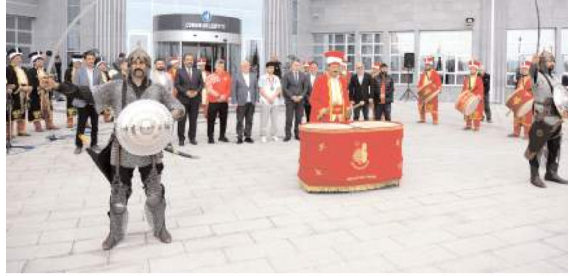
Avrupa üçüncüsü milli güreşçi için Çorum Belediyesi önünde mehterli karşılama töreni yapıldı