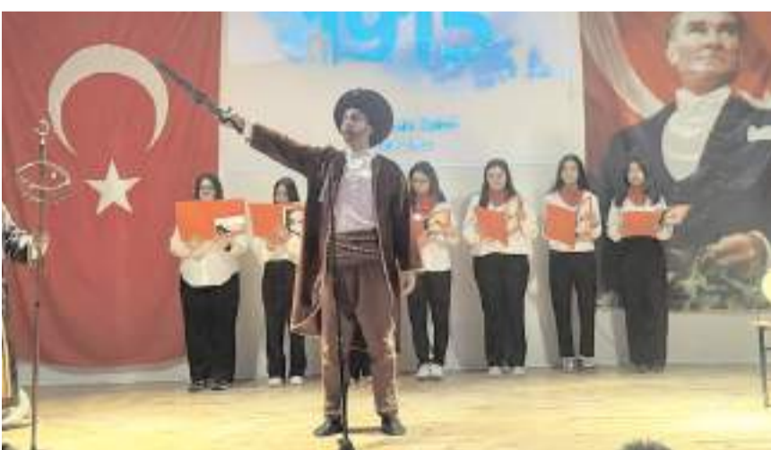
Öğrencilerin sahnelediği Çanakkale tiyatrosu bol bol alkış aldı.