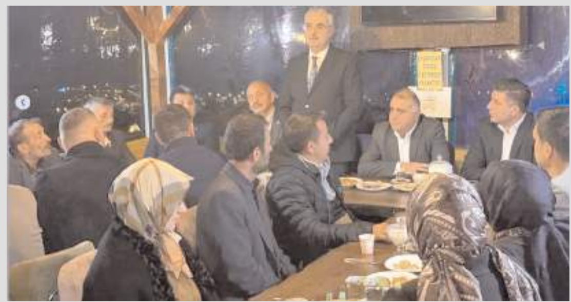
AK Parti Çorum Milletvekili Yusuf Ahlatcı, programda konuşma yaptı.