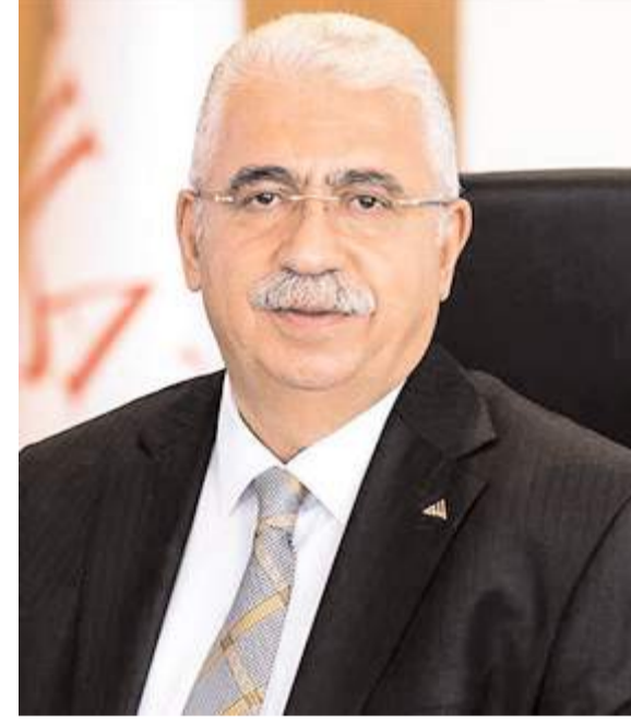
Ahlatcı Holding Yönetim Kurulu Başkanı Ahmet Ahlatcı