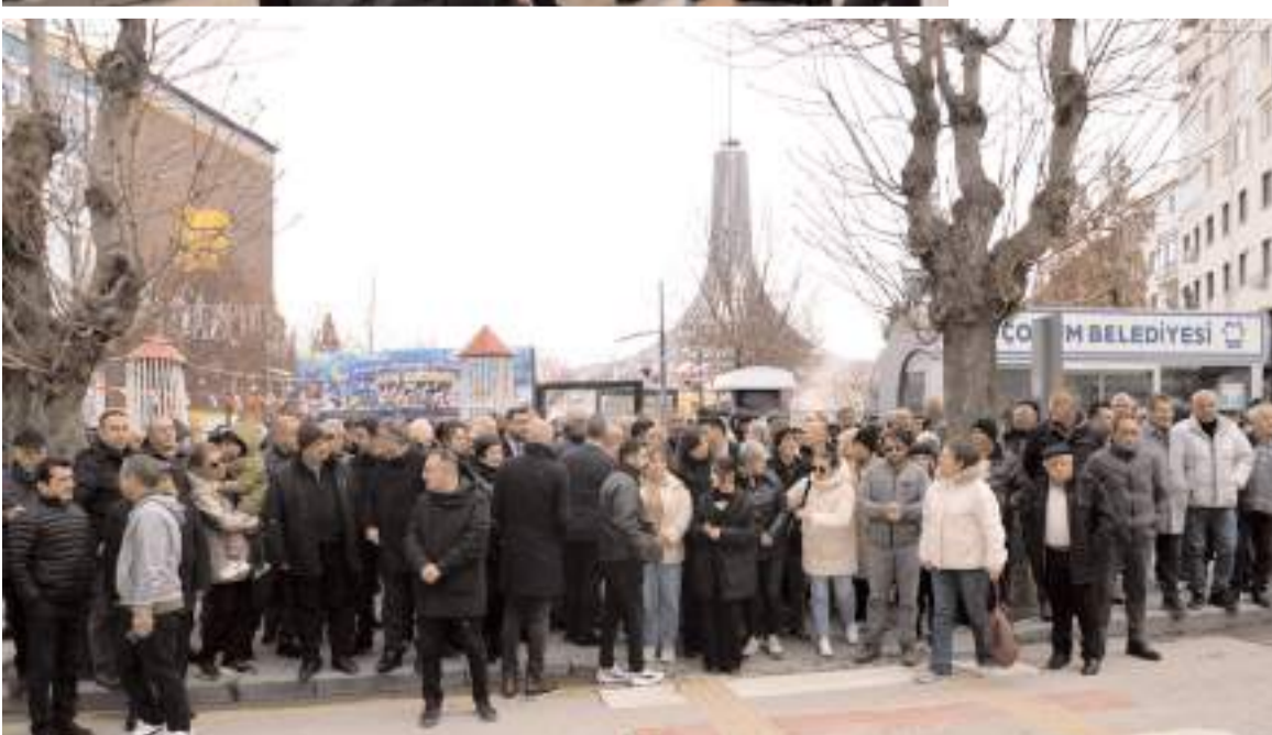
Protesto eylemi Çorum Park önünde gerçekleştirildi.