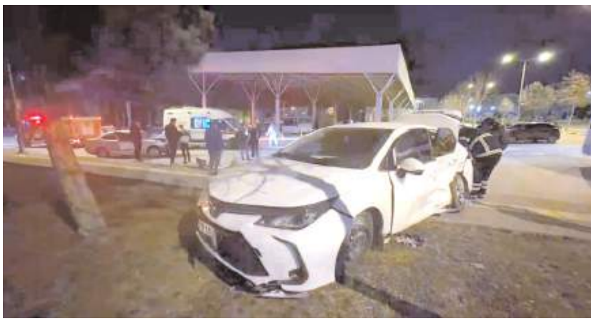
Kaza Buhara 4. Cadde ile Buhara 3. Cadde kesişiminde meydana geldi.