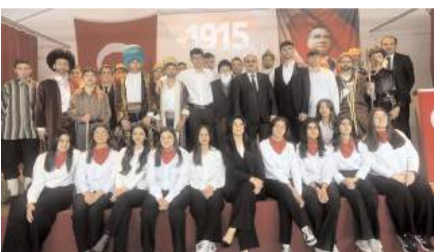
Programın sonunda hatıra fotoğrafı çekildi.

Program öğrenci ve öğretmenler ile protokol üyelerinin toplu fotoğraf çekimi ile sona erdi. (Haber Merkezi)