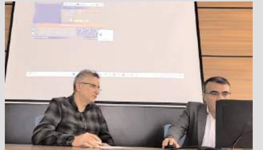
TYP için kura çekimi Noter huzurunda yapıldı.

mında Çorum merkezde 110, Alaca 10, Bayat 5, Boğazkale 5, Dodurga 5, İskilip 10,