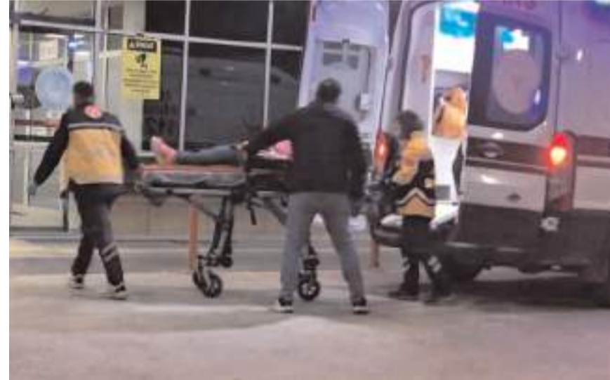
Yaralılar hastanede tedavi altına alındı.

Kazada yaralanan sürücüler sağlık ekiplerinin müdahalesinin ardından kentteki hastanelere kaldırıldı.(AA)