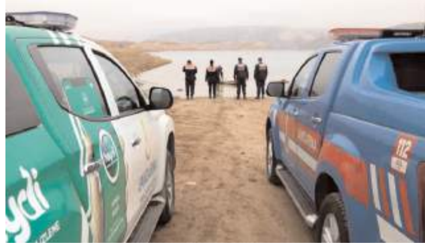
Olay Obruk Baraj Göleti Kum Çelteği'nde meydana geldi.