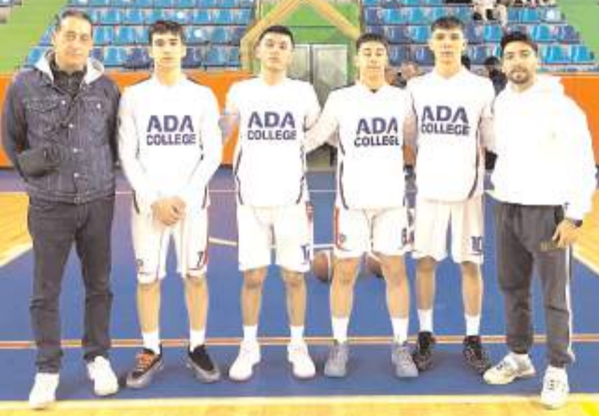
Ada Koleji erkek takımı grubundaki iki maçında kazanarak final için avantaj yakaladı

Kız takımı grubunda ilk maçında İstanbul takımına 14-7 kaybetti. Temsilcimiz bugün saat 10'da Ankara Özel Bilim ile 10.40'da ise Eskişehir ile iki maç yapacak. Bu iki maçını kazanması halinde grup ikinci olarak üst tura yükselecek.