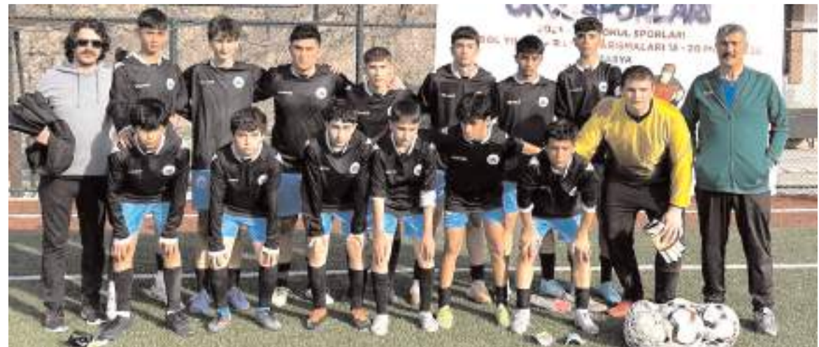
Yıldırım Beyazıt İmam Hatip Ortaokulu Amasya'da iki maçını kazanarak bugün finalde mücadele edecek

Yıldırım Beyazıt İmam Hatip Ortaokulu grup birinciliği için bugün saat 17.00'de Ankara TED ile karşılaşacak. Bu maçı kazanması halinde grup birincisi olarak yarı final grubuna yükselcek.