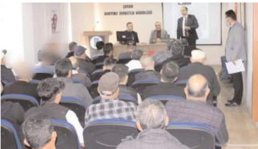
Denetimli Serbestlik Müdürlüğünde seminer düzenlendi.