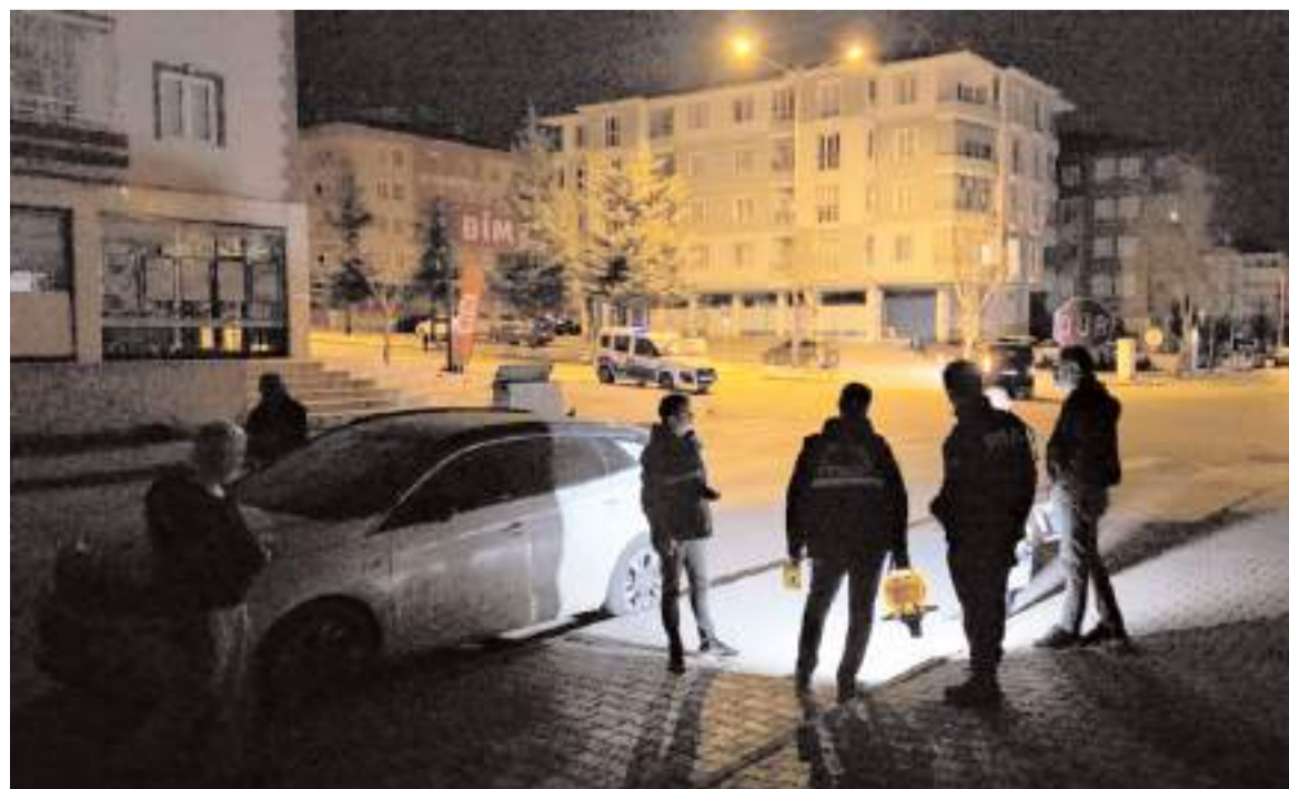
Polis ekipleri olay yerinde inceleme yaptı.

Polis, olaya karışan şüphelilerin yakalanması için çalışma başlattı.(AA)