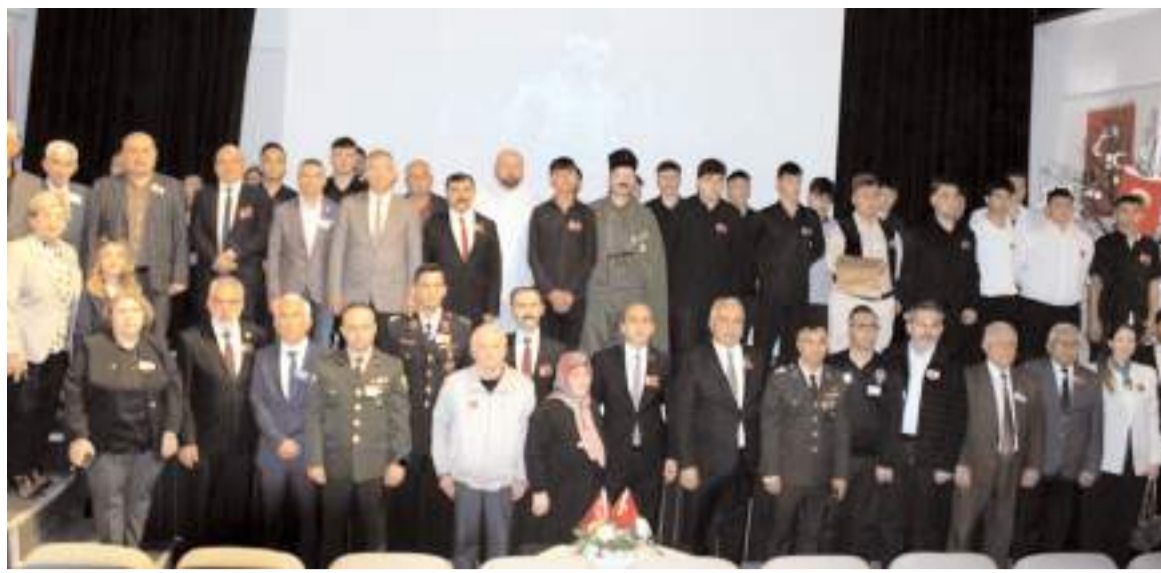
Günün anısına fotoğraf çekildi.