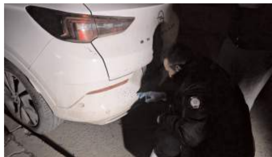
Olayda çevrede bulunan araçlarda maddi hasar meydana geldi.