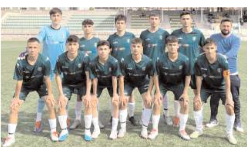
Mimar Sinanspor U 17 takımı sezona farklı galibiyet ile başladı liderlik koltuğuna oturdu