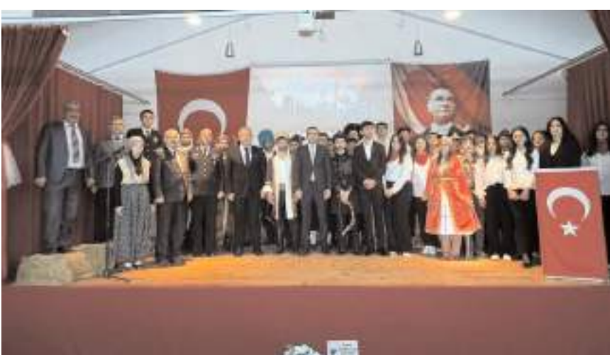
Programı Çok Programlı Anadolu Lisesi organize etti.