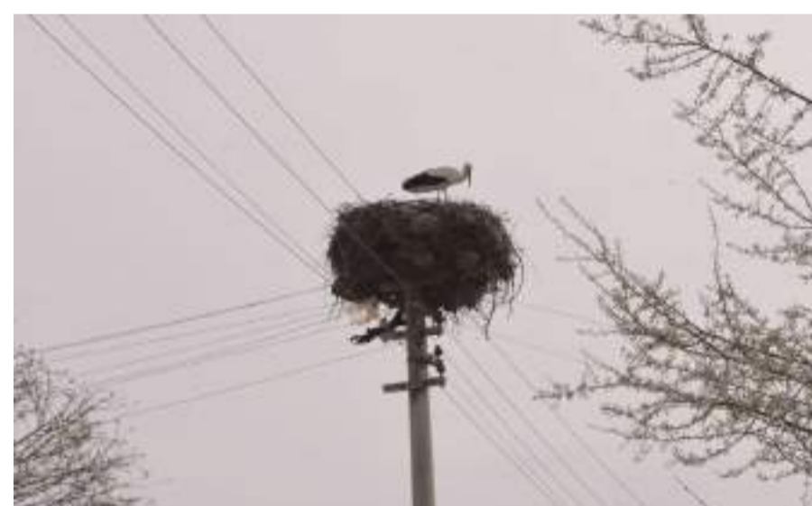
İlkbaharın gelmesi ile birlikte leylekler gelmeye başladı.

Ağustos a kadar yuvalardaki yavrularını büyütecek olan leylekler, daha sonra tekrar Afrika ülkelerine doğru kanat çırpmaya başlayacak.(AA)