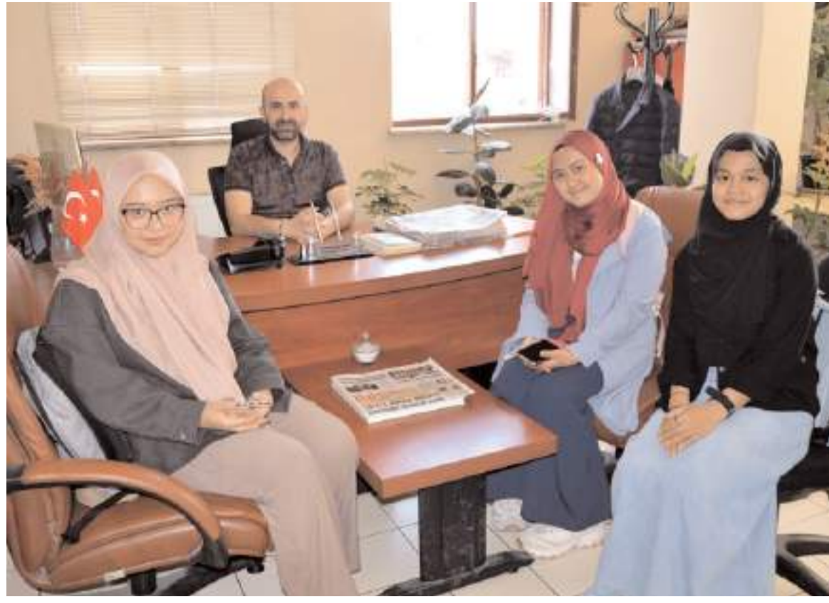
Öğrenciler gazetecilik hakkında bilgi aldılar.