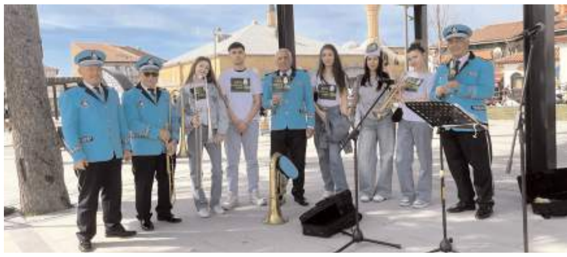
Öğrenciler çeşitli etkinlikler yaptılar.