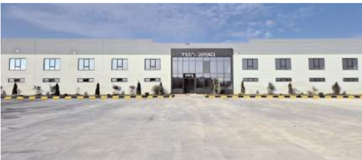
TMA Savunma Fişek Fabrikası Sungurlu'da üretim yapıyor.