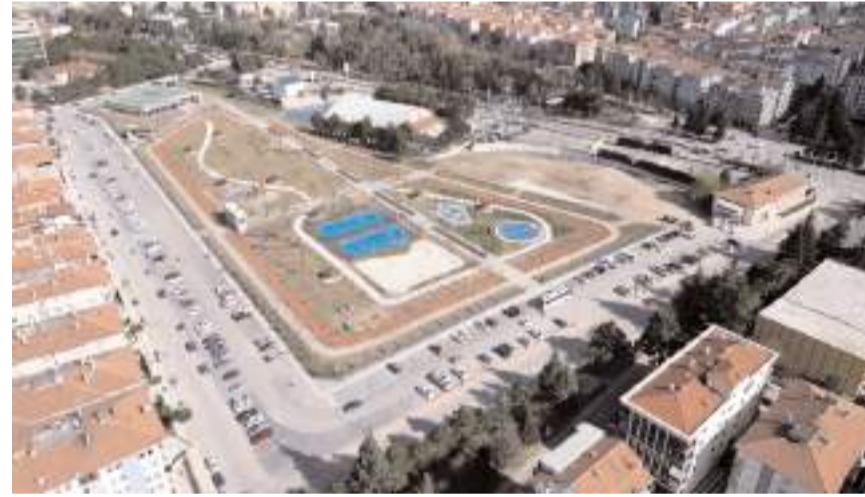
Yüzüncü Yıl Millet Bahçesi projesinin geçici kabulü yapıldı.