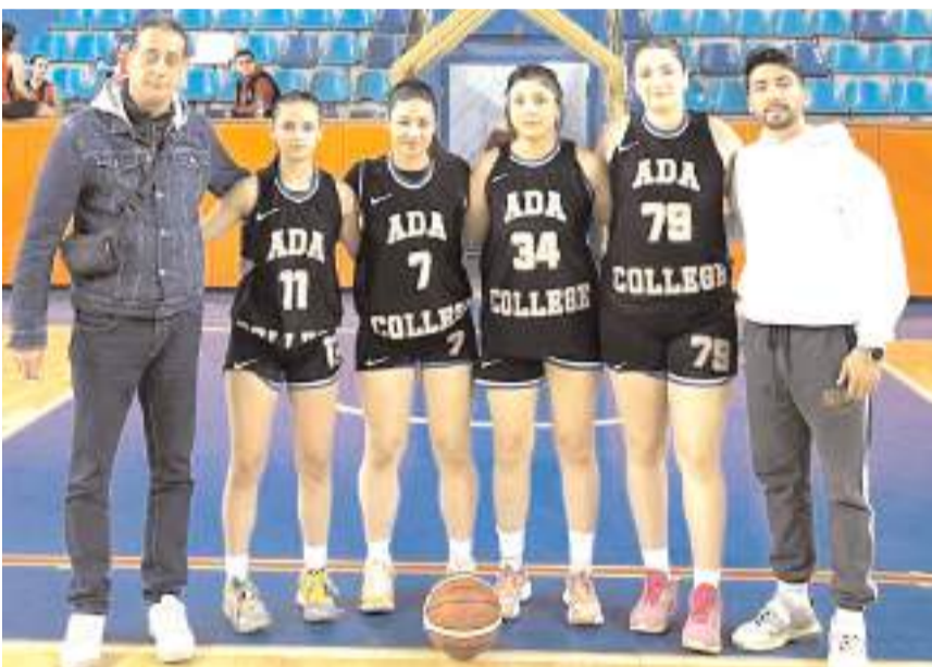
Ada Koleji kız takımı bugün iki maçında kazanarak finale yükselmek istiyor