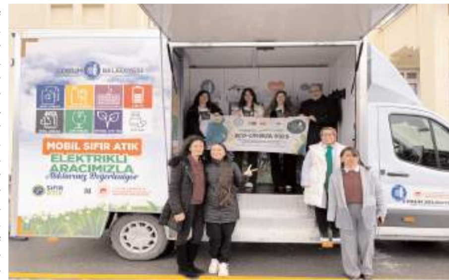
Çorum Belediyesi'nin çevre dostu elektrikli mobil sıfır atık aracı okulu ziyaret etti.