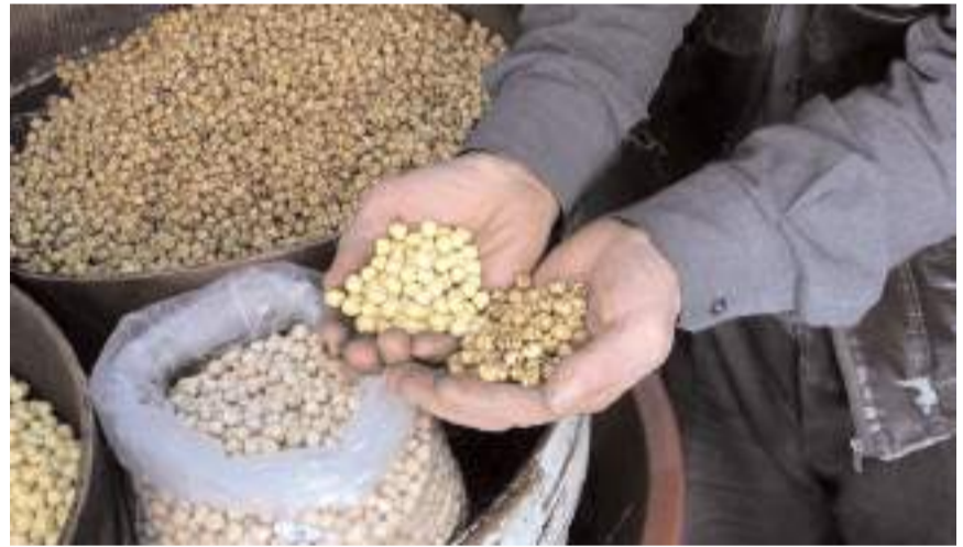
Bodur, 66 yıldır geleneksel yöntemlerle leblebi üretiyor.

miyle birlikte nohut normal haline göre daha da sert bir hale gelir. Nohut fırınlanma işlemine hazırlanırken ortalama 2 saat ıslanmış kalması gerekir. Kabuk soyulma işlemi sanat hatası olmaması için ıslanmış nohodu 20 saat sonra eleme işleminden geçirmek gerekiyor. Nohudun leblebiye dönüşmesi için olmazsa olmaz ocağını yakarız ve böylelikle belirli bir kaloriye gelmesini sağlarız. Tavanın hacmine göre 5 ya da 6 kilogram nohut dökülür. Islanmış ve elenmiş nohut iyi bir şekilde ısınana kadar karıştırmak gerekiyor. Kavurma işlemini gerçekleştirdiğimiz tavanın iç kısmı keskiyle açılmış dişler sayesinde kabuğun soyulmasına ve zedelenmesine yardımcı olur. Bu yapılan işlem yaklaşık 8 veya 10 dakika sürer. Kızartma işlemi yapılırken tavanın içindeki dişler yanık çizgisi oluşturarak leblebinin üzerinde nokta nokta olma-