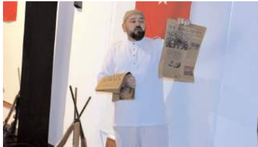
Öğrenciler Çanakkale Oratoryosunu sahnelediler.

İskilip Mesleki ve Teknik Anadolu Lisesi öğretmen ve öğrencileri tarafından hazırlanan Kur'an-ı Kerim Tilaveti, günün anlam ve önemini belirten şiirlerin okunması, Şehitler Tepesi Boş Değil adlı video gösterisi, Çanakkale Oratoryosu ve ödül töreni ile sona erdi.