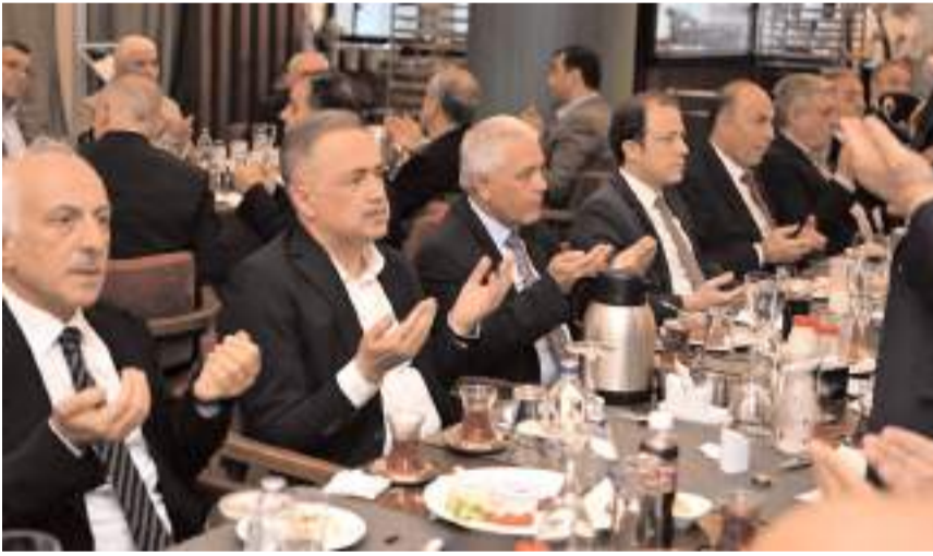
Program Ankara ATO Congressium 1073 Restoranda yapıldı.