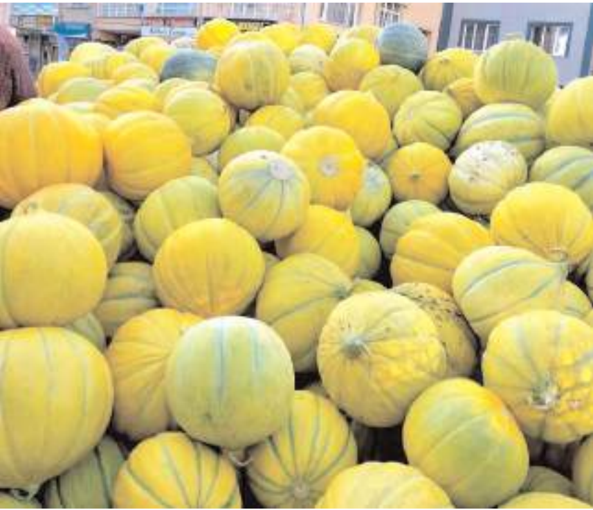
Meşhur 10 dilim Sungurlu kavunu.