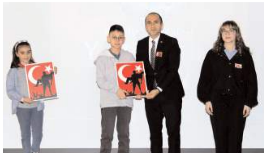
Yarışmalarda derece elde eden öğrencilere ödülleri verildi.