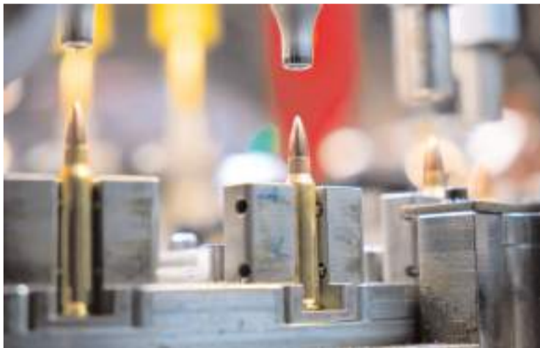
MİTE markalı fişekler, yurt dışından sonra yurt içinde de satışa çıkacak.

TMA Savunma Fişek Fabrikasında üretilen yerli ve milli MİTE markalı 5,56x45 mm, 7,62x51 mm, 9x19 mm fişekler, gelen yoğun talep üzerine MKE AŞ yurtiçi satış noktaları ve fişek bayilerinde 21 Mart 2025 Cuma gününden itibaren satışa sunulacak. (Haber Merkezi)