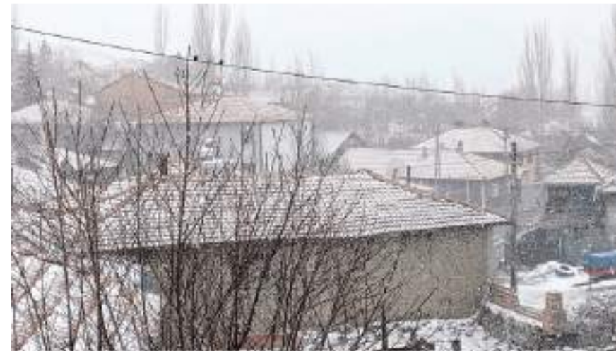
Havaların soğuması ile yüksek kesimlere beyaza büründü.

Kar yağışının Cumartesi gününe kadar devam etmesi beklenirken, hava sıcaklıkları Pazartesi gününden itibaren yeniden yükselecek.