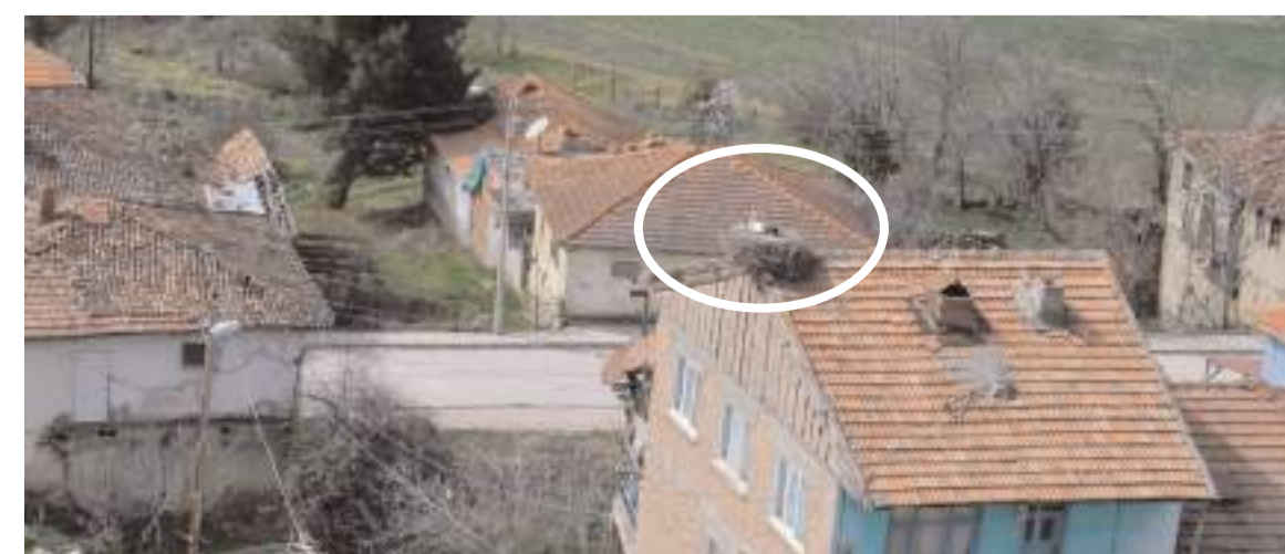
Leylek yuvaları yeniden dolmaya başladı.