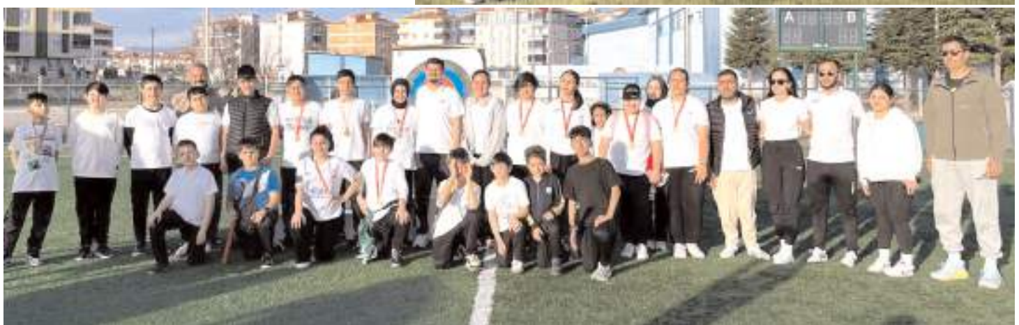
Okullar okçuluk il birinciliğinde mücadele eden sporcular ödül töreni sonrasında öğretmen ve antrenörleri ile birlikte toplu halde