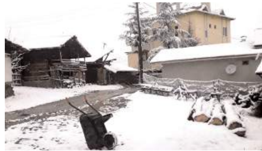
Soğuk havaların birkaç gün daha süreceği tahmin ediliyor.