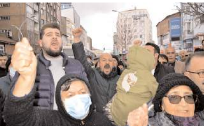
Basın açıklamasına çok sayıda CHP'li katıldı.