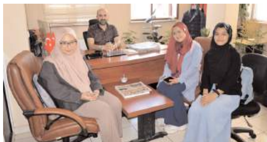
Öğrenciler gazetecilik hakkında bilgi aldılar.