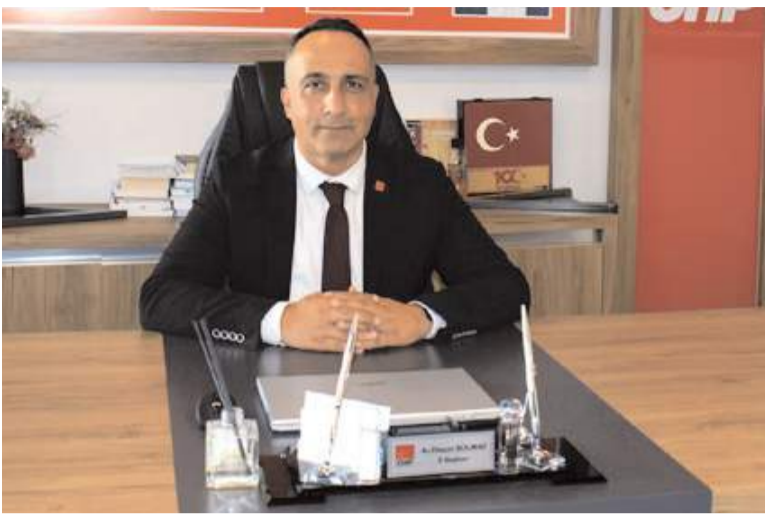
CHP İl Başkanı Av. Dinçer Solmaz