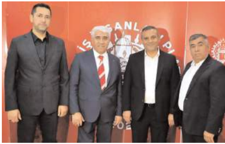
Programı Çorumlu İş İnsanları Platformu düzenledi.