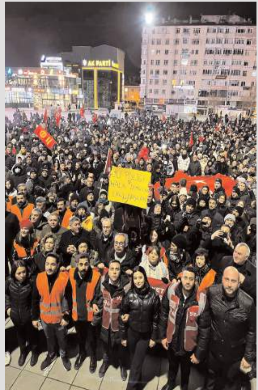
Yürüyüş Kadeş Barış Meydanında sona erdi.