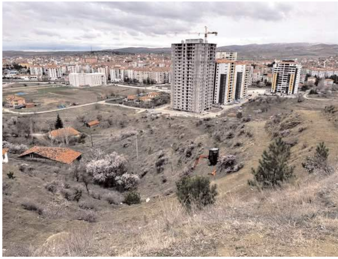
Lavanta Tepesi projesi mesire alanında hayata geçirilecek.

Sungurlu Belediyesinden yapılan açıklamada, "Sungurlu Belediyesi olarak 12 ay süresince haşere ilaçlamamızda doğal dengeyi gözeterek, çevre ve insan sağlığına zararsız biyolojik ürünleri tercih ediyoruz. İlaçlama programımızı doğaya en az ilaç salacak şekilde, ağırlıklı olarak larva ilaçlaması yapıyoruz. Yaklaşan yaz ayları öncesi almış olduğumuz 35 ULV-Mistblower marka araç üstü başlıklı püskürtücüsünün yanı sıra tabancasıyla da insanların girmekte zorlandığı alanları da verimli şekilde haşereye karşı ilaçlamaya imkan verecek" denildi. (Haber Merkezi)