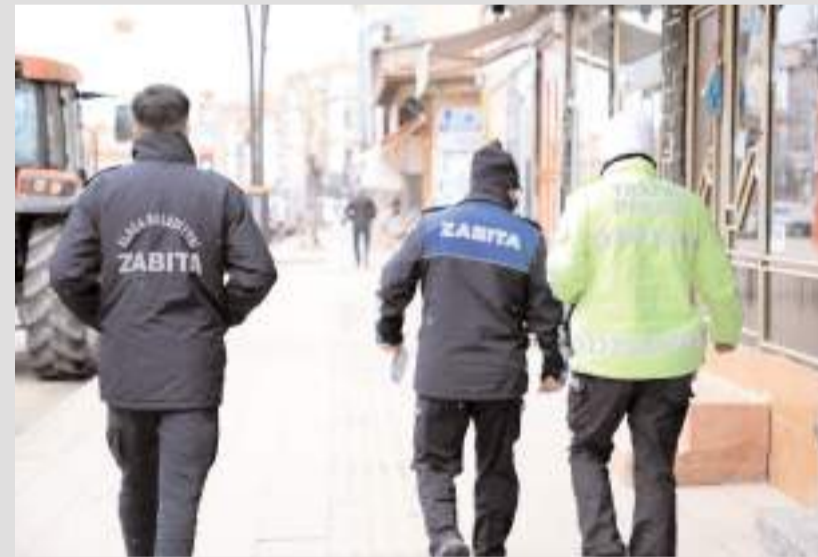
Alaca Belediyesi ve trafik ekipleri, kaldırım işgallerine karşı denetimler yapacak.