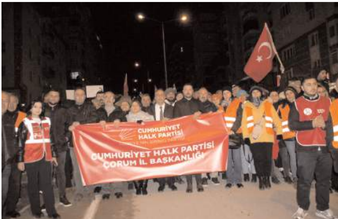
Yeşil Fırın önünde toplanan partililer sloganlarla Kadeş Meydanı'na kadar yürüdü.