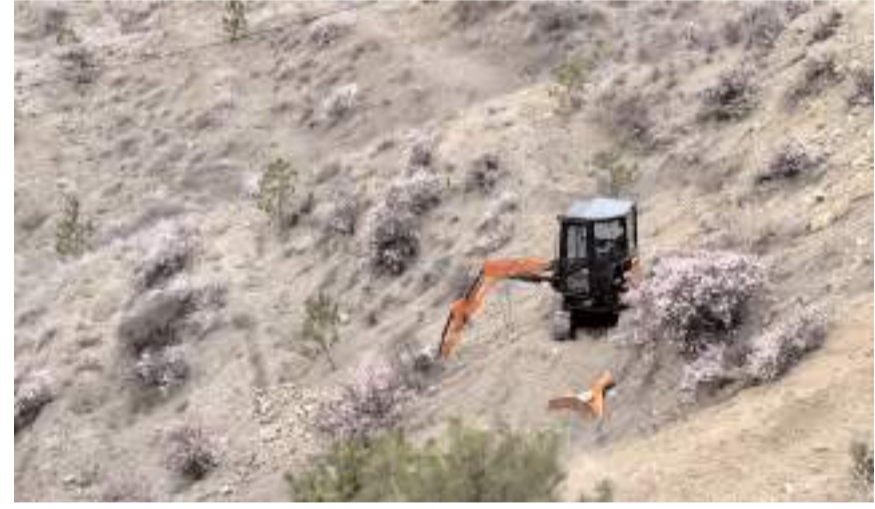
Projenin hayata geçirileceği alanda teraslama çalışması yapılıyor.

Sungurlu Belediye Başkanı Muhsin Dere'nin geçtiğimiz günlerde dile getirdiği Lavanta Tepesi projesinde çalışmalar başladı. Mesire alanının bulunduğu tepede iş makinesi vasıtasıyla başlatılan teraslama çalışmalarının tamamlanmasının ardından lavantaların dikimi gerçekleştirilecek. (Haber Merkezi)