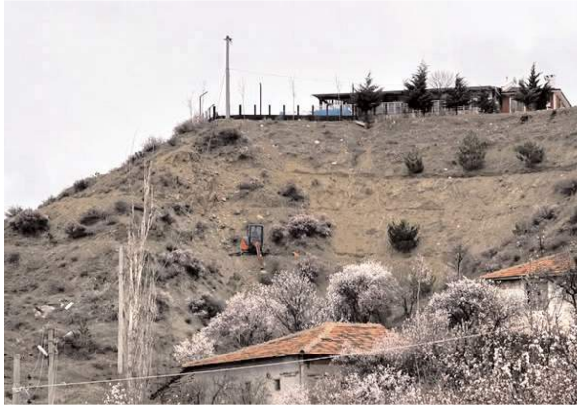
Tepenin teraslanmasının ardından lavanta fidanları dikilecek.

Çalışmalar kapsamında sökülen eski asbestli boruların yerine 42 km'lik içme suyu isale hattını inşa çalışmaları devam ediyor. (Haber Merkezi)