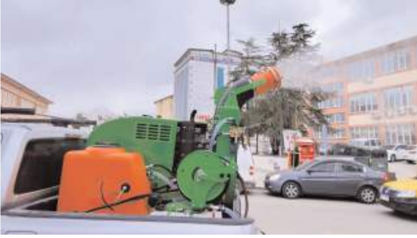
Yaklaşan yaz ayları öncesinde 35 ULV-Mistblower marka araç üstü başlıklı püskürtücü faaliyete başladı.