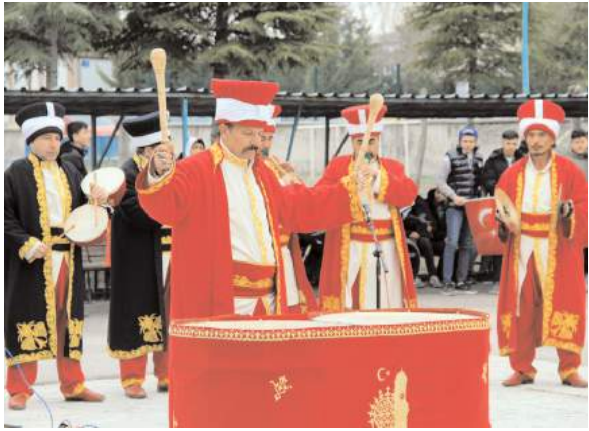
Çorum Belediyesi mehter takımı gösteri yaptı.