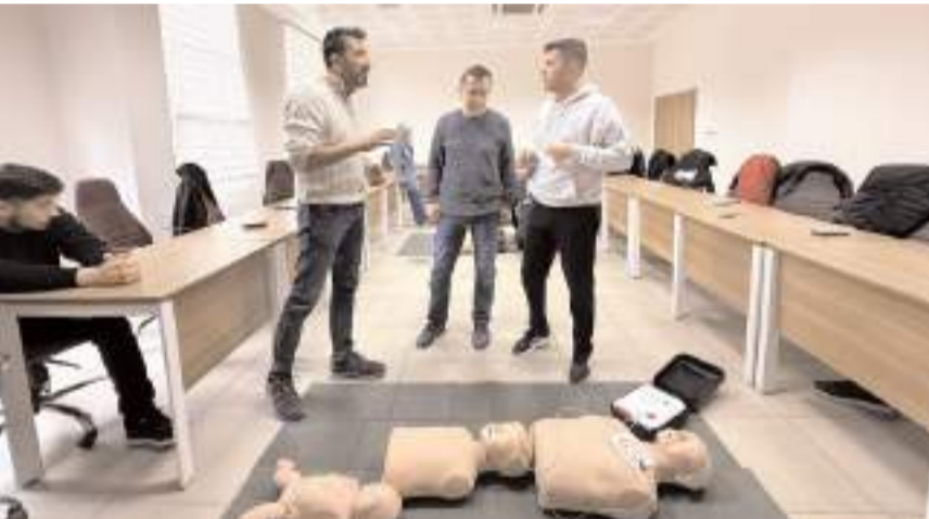
Eğitimlerin ardından yapılan değerlendirmede başarılı olan personele, üç yıl geçerli olacak "İlk Yardımcı" belgesi verilecek.