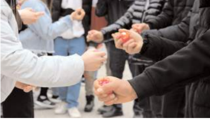
Programda yumurta tokuşturma yarışması yapıldı.