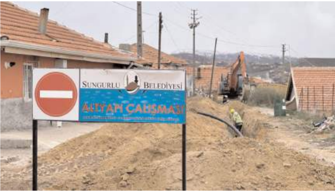
Çalışmalar kapsamında eski asbest borular değiştiriliyor.