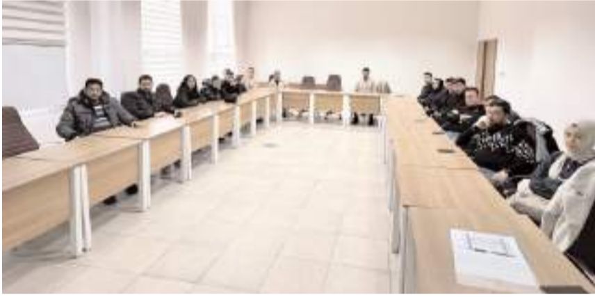
Eğitim Çorum Belediyesi İnsan Kaynakları ve Eğitim Müdürlüğü tarafından düzenlendi.

yanlış yapılan değerlendirilmede başarılı olan personele, üç yıl geçerli olacak "İlk Yardımcı" belgesi verilecek. (Haber Merkezi)