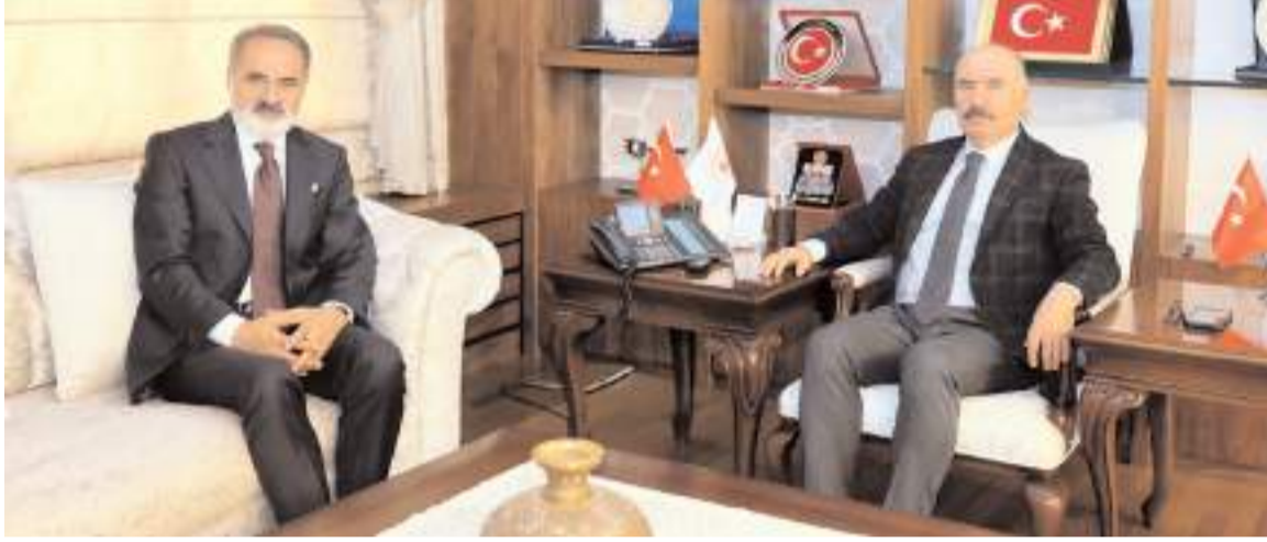
Ziyarette Çorum'da yapılacak olan demiryolu projesi hakkında konular ele alındı.

Çorum sınırları içerisinde yapılacak çalışmalarla ilgili koordinasyonu gerektiren konular ele alındı. (Haber Merkezi)