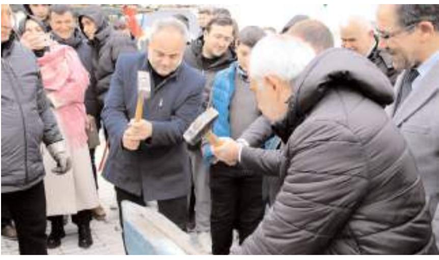
Programda protokol üyeleri demir dövdüler.

■ Çorum'da Nevruz Bayramı düzenlenen etkinliklere coşkuyla kutlandı. Gençler, ateş yakıp demir dövdü, çeşitli oyunlarla doyusya eğlendi.