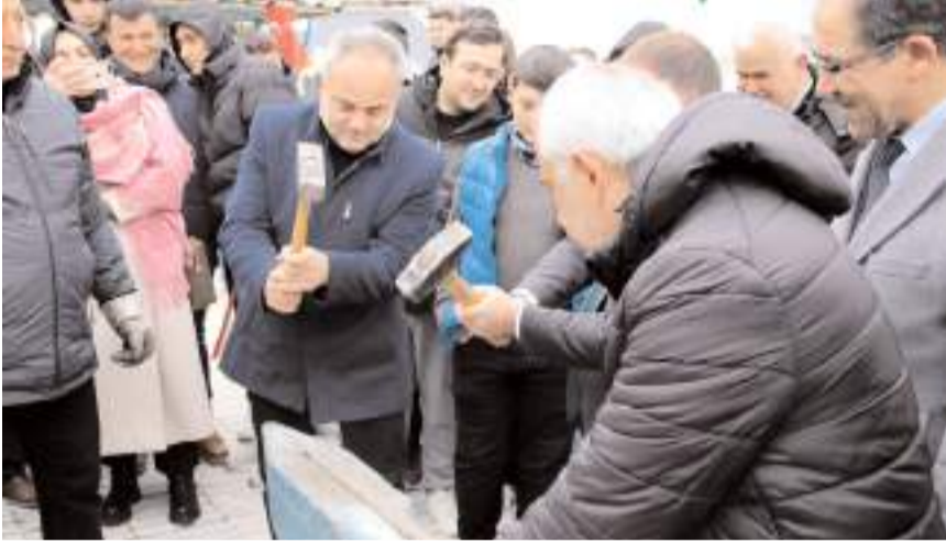
Programda protokol üyeleri demir dövdüler.