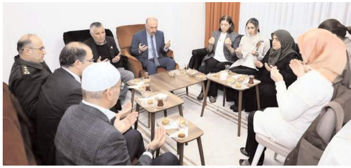
Ziyarette tüm şehitler için dua edildi.