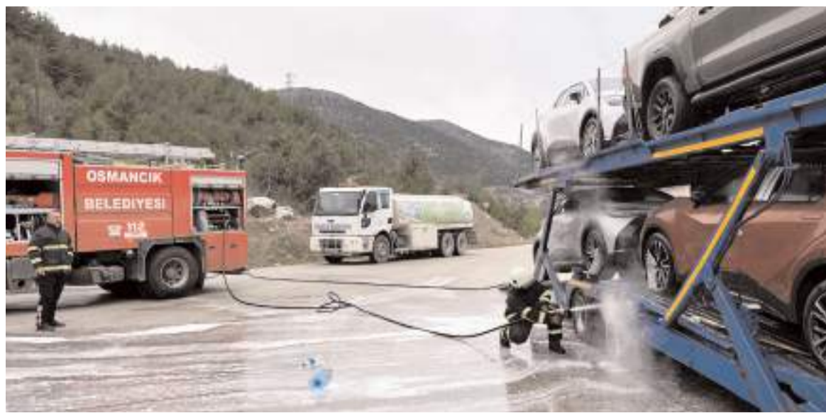
İtfaiye ekipleri yangını büyümeden söndürdü.