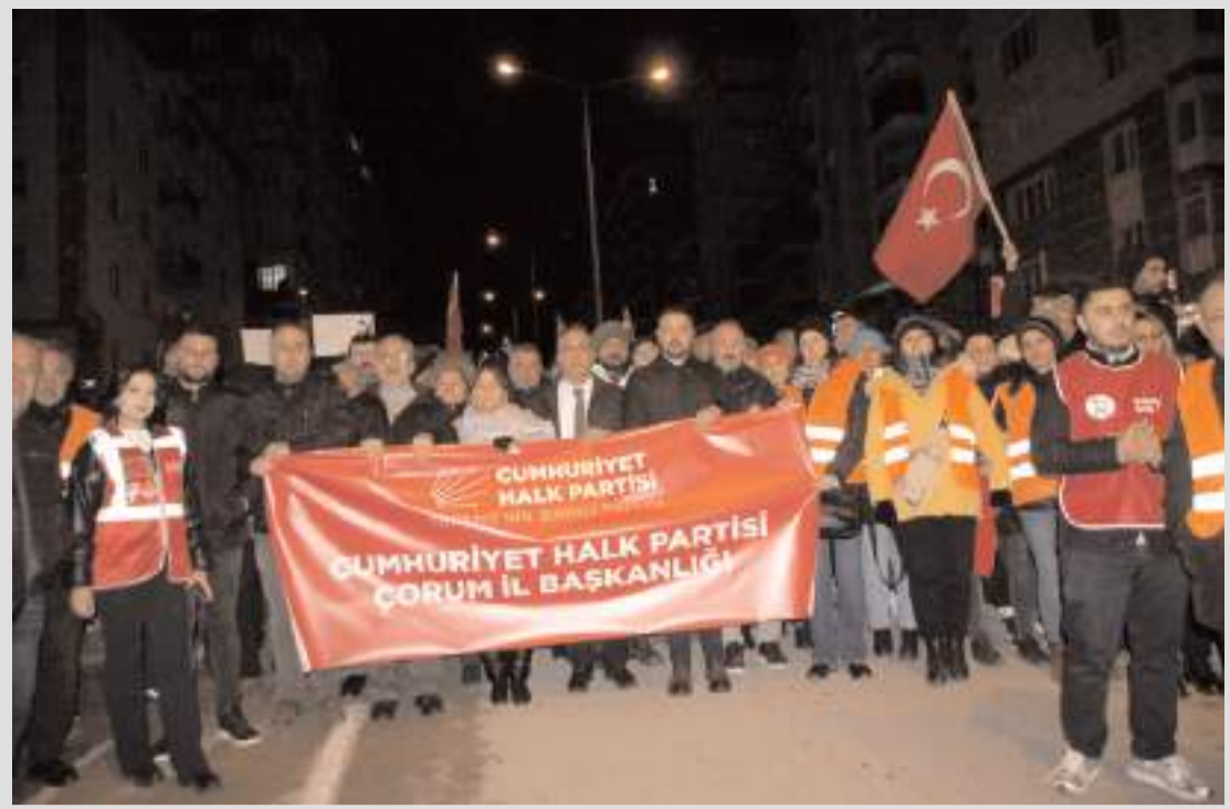
Yeşil Fırın önünde toplanan partililer sloganlarla Kadeş Meydanı'na kadar yürüdü.