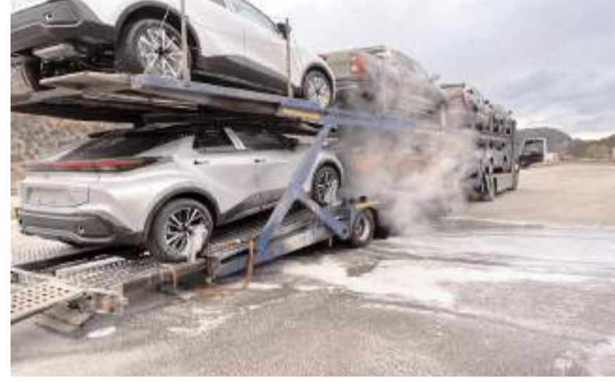
Olay Osmançık-Gümüşhacıköy arasında Baldıran mevkinde meydana geldi.

Osmancık Belediyesi itfaiye ekiplerince söndürülen yangında tırın dorse bölümünde hasar oluştu.