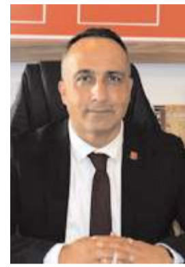
Av. Dinçer Solmaz