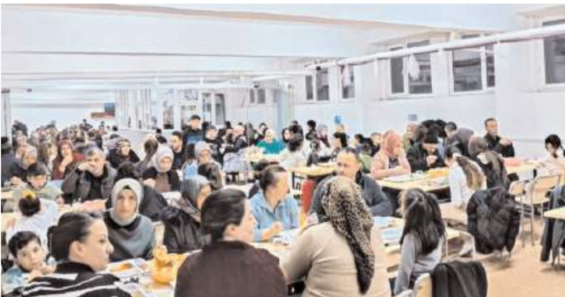
İftar programı Oğuzlar Ortaokulu ve Oğuzlar İmam Hatip Ortaokulunda yapıldı.