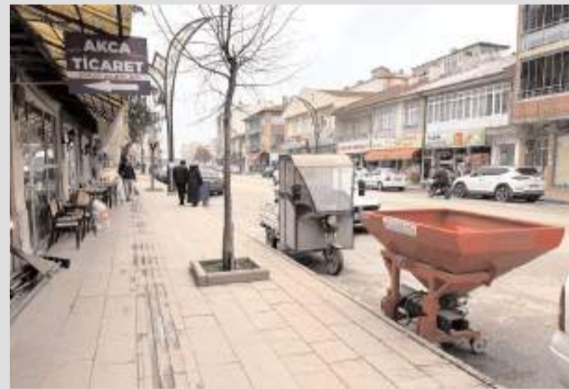
Esnaflar kaldırım işgalleri konusunda uyarıldı.