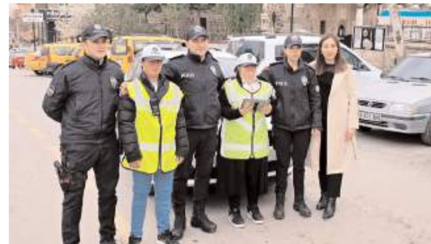
Down sendromlu öğrenciler, trafik denetimi yaptı

Sungurlu İlçe Emniyet Müdürlüğü tarafından Dünya Down Sendromlular Günü dolayısıyla, Bölükbaşı Özel Eğitim Merkezi'nde eğitim gören dört özel birey için etkinlik düzenlendi. Down sendromlu öğrenciler polis memurları ile birlikte ilçede trafik denetimi yaptı. Daha sonra Sungurlu Çarşı Polis Merkezi Amirliği ve İlçe Emniyet Müdürlüğü'nü ziyaret eden Down sendromlu öğrenciler, çeşitli etkinliklerle unutulmaz bir gün geçirdi. Öğrencilere polislik mesleğiyle ilgili önemli bilgiler verildi. (İHA)