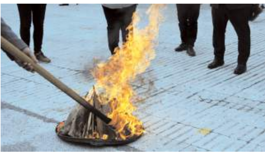
Kutlama programında Nevruz ateşi yakıldı.

Çorum'da Nevruz Bayramı düzenlenen etkinliklere coşkuyla kutlandı. Gençler, ateş yakıp demir dövdü, çeşitli oyunlarla doyasıya eğlendi.