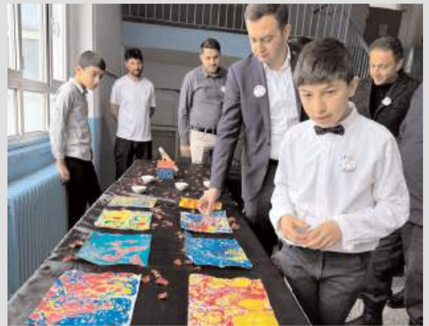
Sergide öğrenciler tarafından yapılan eserler yer aldı.