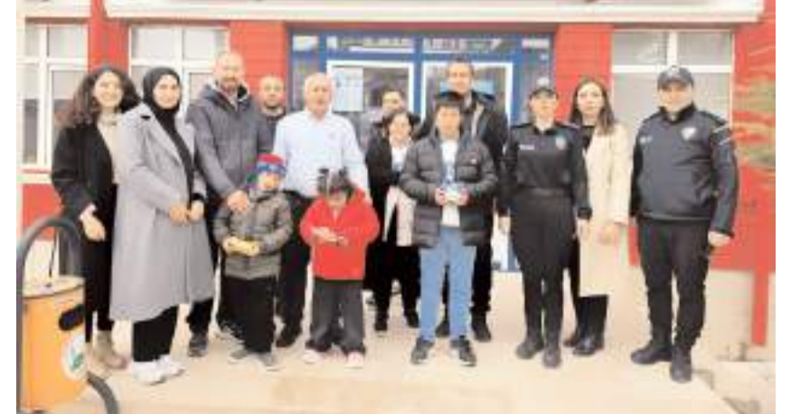
Öğrenciler, Sungurlu Çarşı Polis Merkezi Amirliği ve İlçe Emniyet Müdürlüğü'nü ziyaret etti.