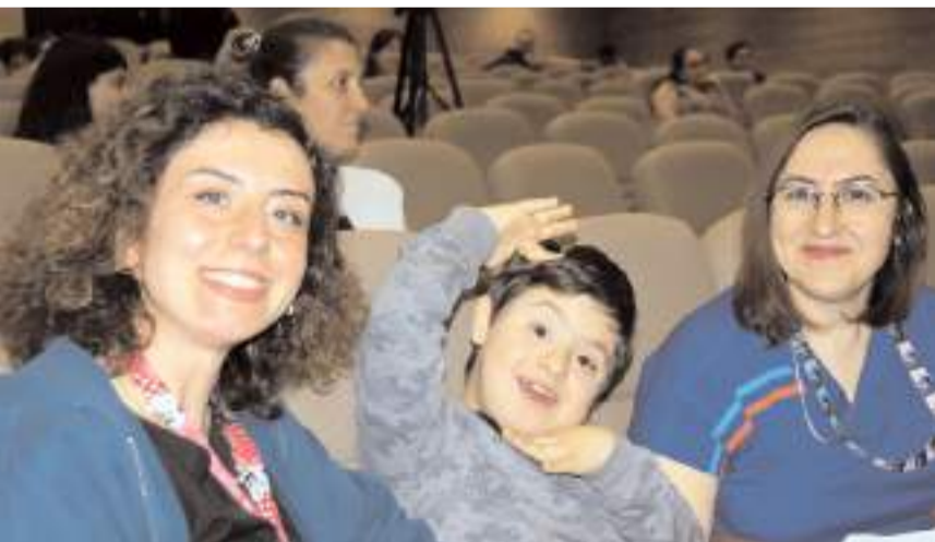
Dünya Down Sendromu Farkındalık Günü nedeniyle Hitit Üniversitesi Erol Olçok Eğitim ve Araştırma Hastanesinde program yapıldı.