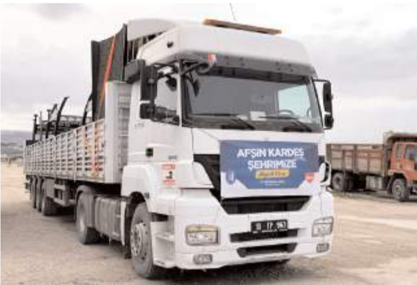
10 adet kamerye, Afşin'e gönderildi.

Çorum Belediye Meclisi Şubat ayı oturumunda kardeş şehir Afşin Belediyesi'nin kamerye talebi görüşülerek karara bağlanmıştı. Belediye Meclisi'nin oybirliğiyle aldığı karar doğrultusunda Çorum Belediyesi Park ve Bahçeler Müdürlüğü tarafından temin edilen 10 adet kamerye, Afşin'e gönderildi. (Haber Merkezi)