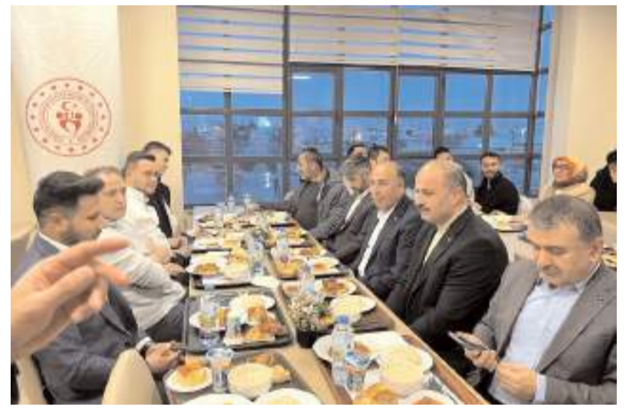
Program Kredi ve Yurtlar Kurumu öğrenci yurdunda yapıldı.

Ramazan ayının dayanışma ve paylaşım ruhunu yansıtan iftar programında protokol üyeleri öğrencilerle sohbet etti.