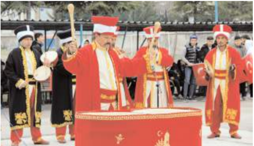
Çorum Belediyesi mehter takımı gösteri yaptı.