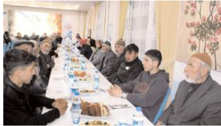
Program İskilip Öğretmenevi'nde düzenlendi.