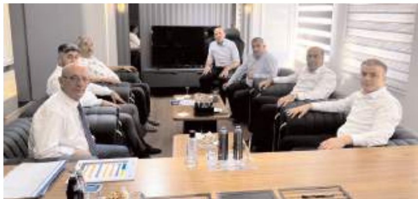
Toplantıda, Karma Organize Sanayi Bölgesi (OSB) için yapılacak çalışmalar ele alındı.

■ Alaca'da hayata geçirilmesi planlanan Karma Organize Sanayi Bölgesi (OSB) projesi için Alaca Ticaret ve Sanayi Odası ev sahipliğinde geniş katılımlı bir toplantı yapıldı. * HABERİ'6'DA