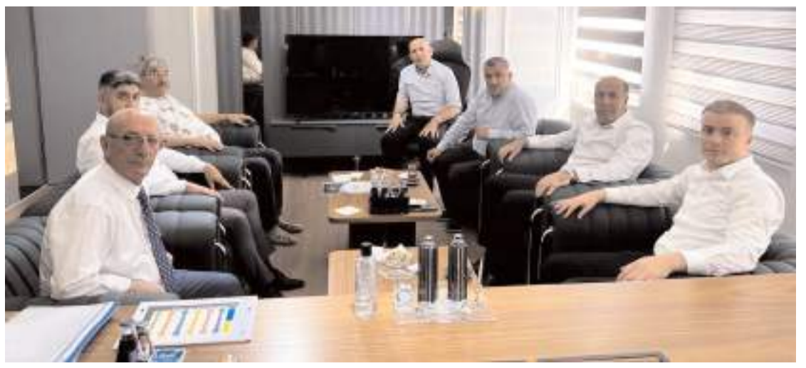
Toplantıda, Karma Organize Sanayi Bölgesi (OSB) için yapılacak çalışmalar ele alındı.