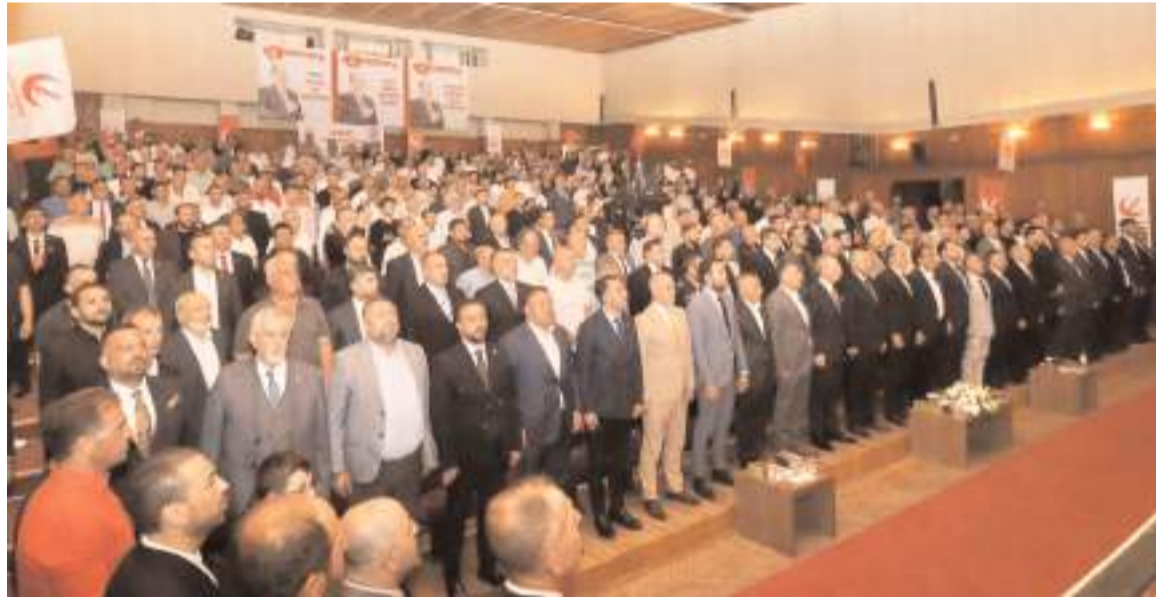
Yeniden Refah Partisi Çorum İl Teşkilatının 3. Olağan İl Kongresi Devlet Tiyatro Salonunda yapıldı.

■ Yeniden Refah Partisinin Çorum İl Kongresinde konuşan Genel Başkan Fatih Erbakan, 2026'da seçime gidilmesi gerektiğini ifade ederek Erbakan, "Bu iktidarın, bu hükümetin bundan sonra bu millete yapacağı en büyük iyilik, 2026 yılı ilkbaharında erken seçim sandığını milletin önüne koymaktır. 2026 ilkbaharında sandığı milletin önüne getirin, bu aziz millet, milli görüşü yeniden iktidar yapsın" dedi. * HABERİ'2'DE