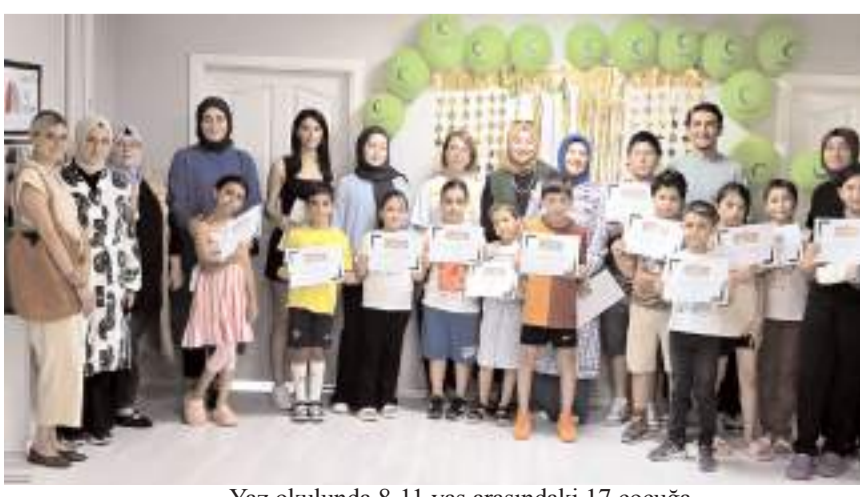
Yaz okulunda 8-11 yaş arasındaki 17 çocuğa bağımlılıkla mücadele eğitimi verildi.