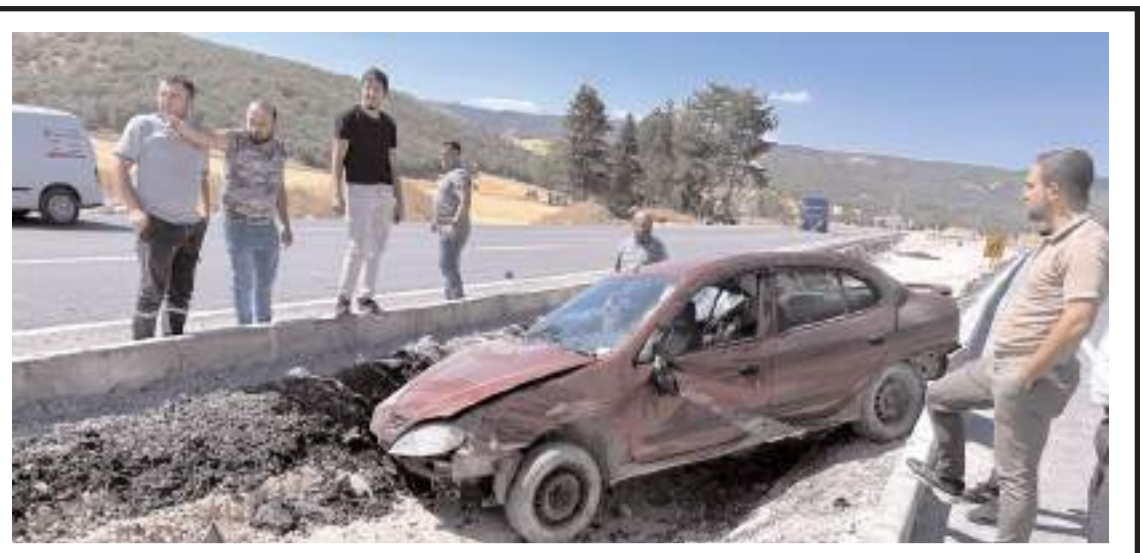
Kaza Çorum-Osmancık kara yolu Gölün yazı mevkisinde meydana geldi.