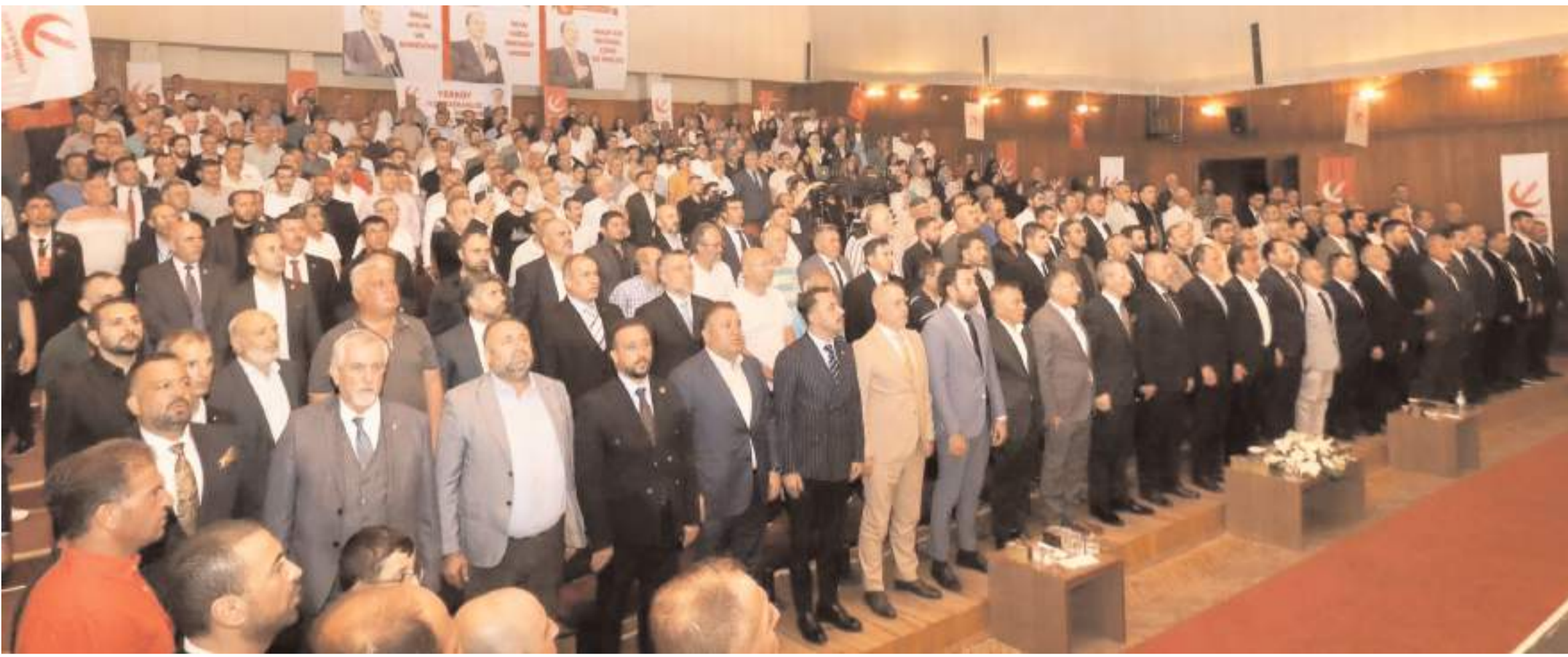
Yeniden Refah Partisi Çorum İl Teşkilatının 3. Olağan İl Kongresi Devlet Tiyatro Salonunda yapıldı.