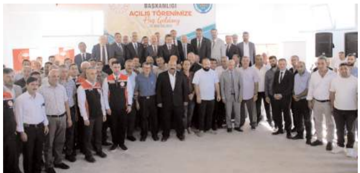
Çorum Ziraat Odası Hububat Eleme Tesisi düzenlenen törenle açıldı.