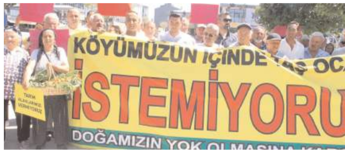
Basın açıklaması Kadeş Barış Meydanında yapıldı.

Etkinlik sonunda katılımcılar, "İyi ki bu büyük ailenin bir parçasıyız" duygusunu dile getirerek programdan memnuniyetlerini ifade etti.