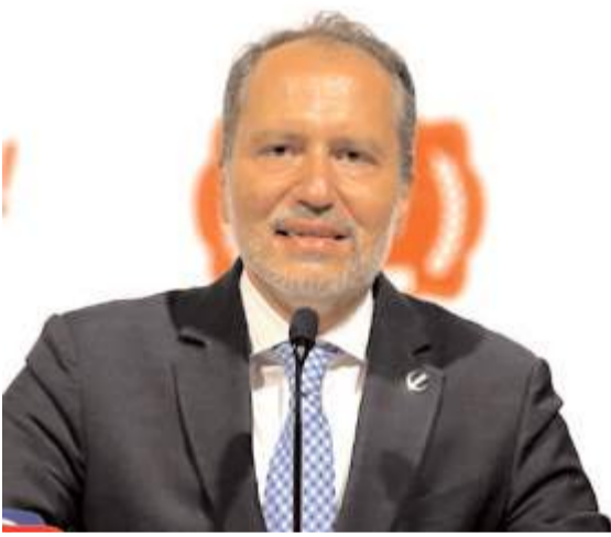
Yeniden Refah Partisi Genel Başkanı Fatih Erbakan

■ Çorum Belediyesinden yapılan açıklamada bazı basın kuruluşlarına ait sosyal medya sayfalarında, maaş promosyonu ihalesiyle ilgili gerçeği yansıtmayan haberler ve bilgiler yer aldığı belirtildi. * HABERİ'4'TE