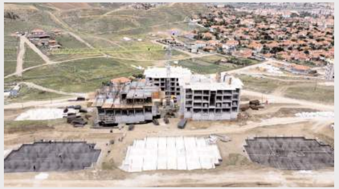
Sungurlu'da 3. Etap TOKİ konutlarının inşaatı hızla devam ediyor.

Belediyemizin önceliği her zaman çalışanlarımızın menfa-