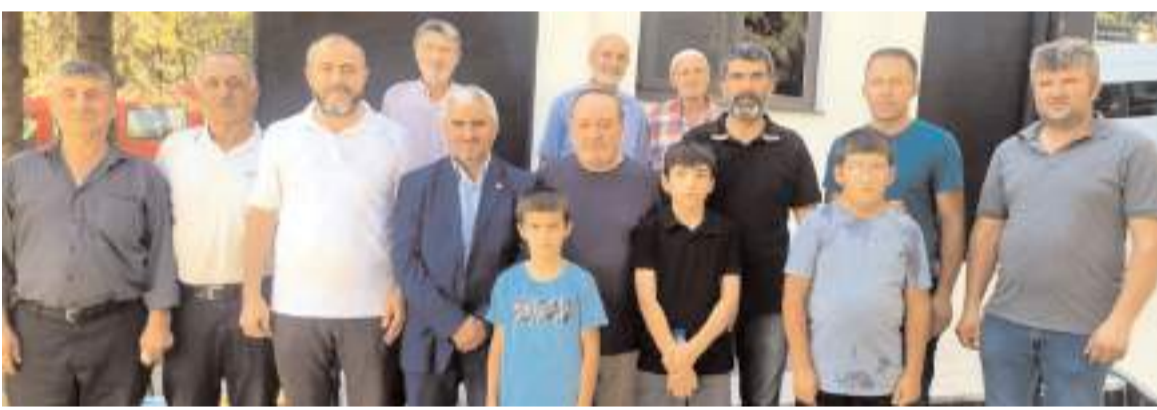
Kongrenin sonunda hatıra fotoğrafı çekildi.