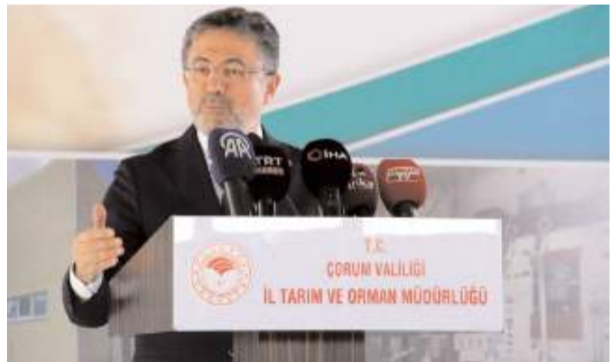
Tarım ve Orman Bakanı İbrahim Yumaklı

Sabahtan geldiğimiz andan itibaren karar vericilerin tarımsal üretim için hep beraber omuz omuza verip, bir adım daha öteye gitmek için neler yapılması gerektiğiyle ilgili çalıştığını gördüm. Bize düşen de bu kervana, bu zincire önderlik ederek onların önünü açacak hususlarda onlarla beraber olmak. İnşallah bu ve benzeri tesislerin Çorum için, Türkiye'nin dört bir tarafında üretim yapan üreticilerimiz için hayırlı olmasını diliyorum" diye konuştu.(İHA)