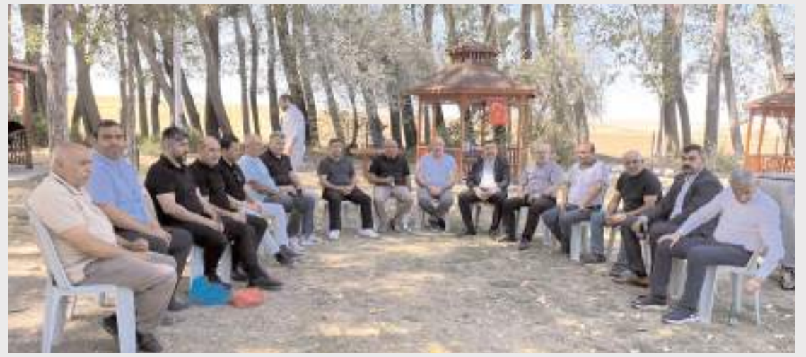
Türk Büro-Sen Çorum Şubasının, "Birlik ve Dayanışma Şenliği & Aile Buluşması" programı Alaca'da yapıldı.