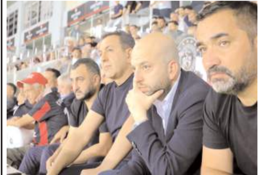
Maçın son dakikalarında yönetim endişeli gözlerle maçı böyle takih etiler