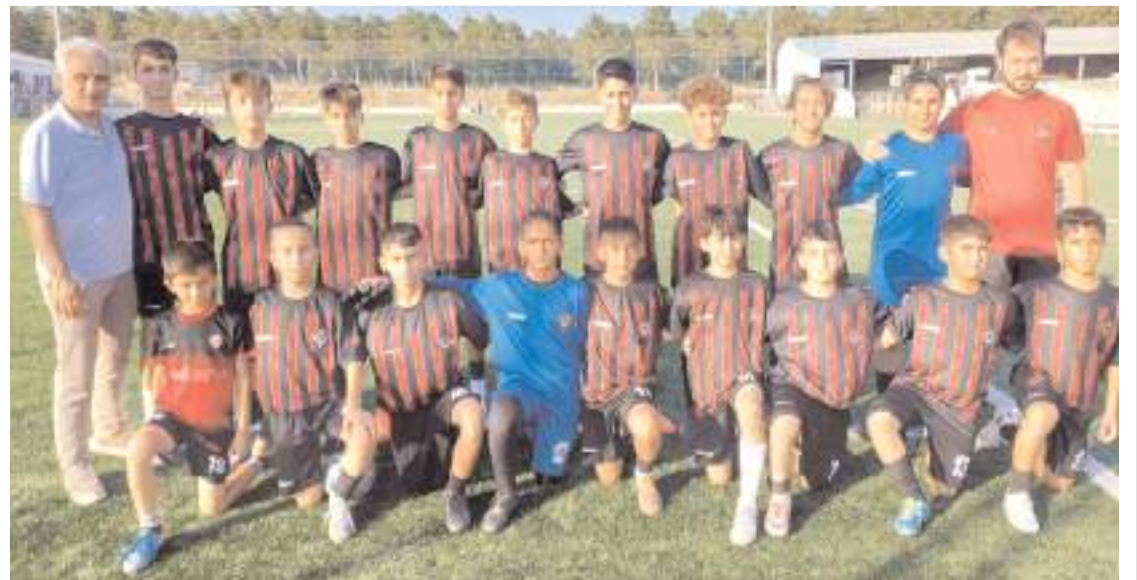
Arca Çorum FK minik takımı grubunda dört maçında kazanarak grup birincisi olarak çeyrek finale yükseldi

Çarşamba günü oynanacak yarı final maçlarının ardından il birinciliği perşembe günü oynanacak final maçı ile sona erecek.