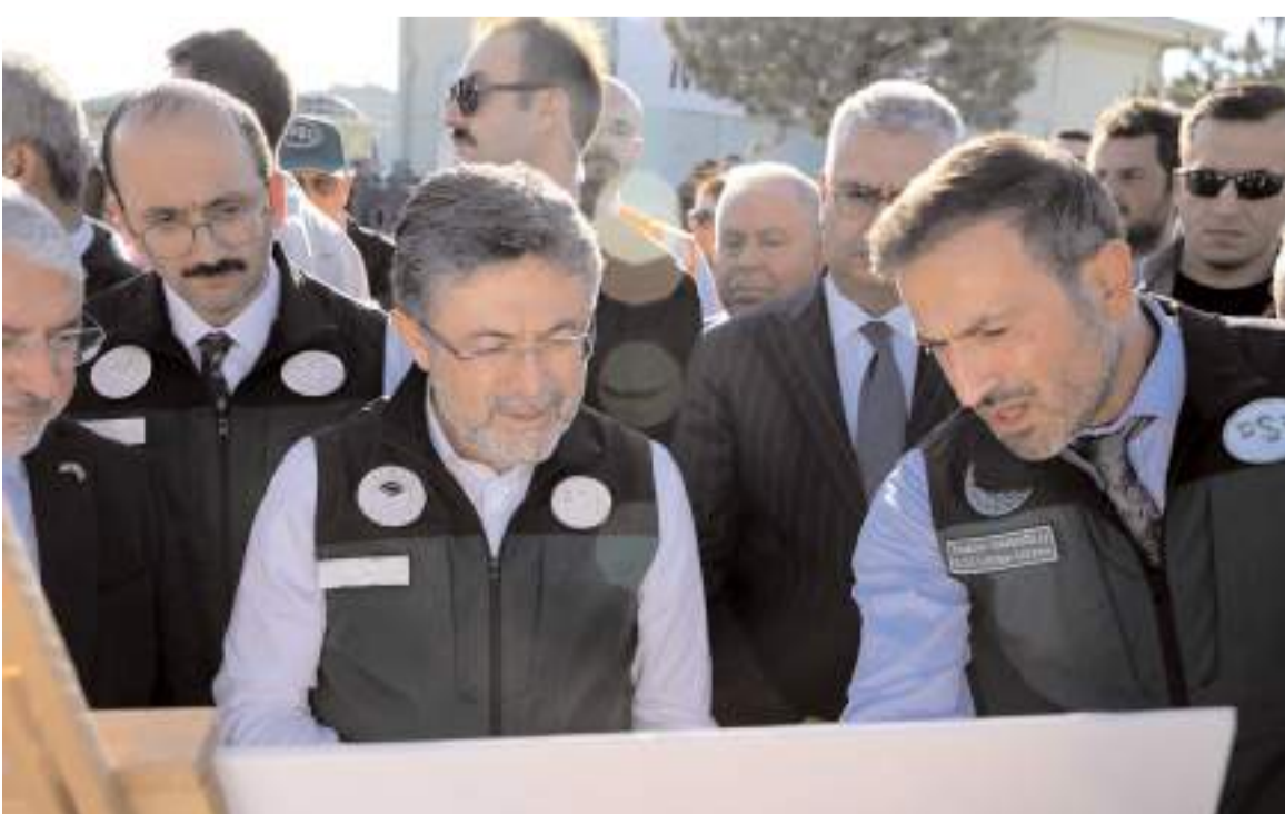
Tarım ve Orman Bakanı İbrahim Yumaklı, projenin son durumu hakkında bilgi aldı.