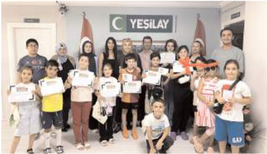
Öğrencilere katılım belgeleri verildi.

nusunda bilinçli olmasını istediğini belirterek, "Oğlum şu anda küçük ama ilerleyen yıllarda daha doğru ortamlarda bulunmasını, yanlış alışkanlıklardan uzak durmasını istediğim için bu tür faaliyetlere katılmasını önemsiyorum." şeklinde konuştu.(AA)