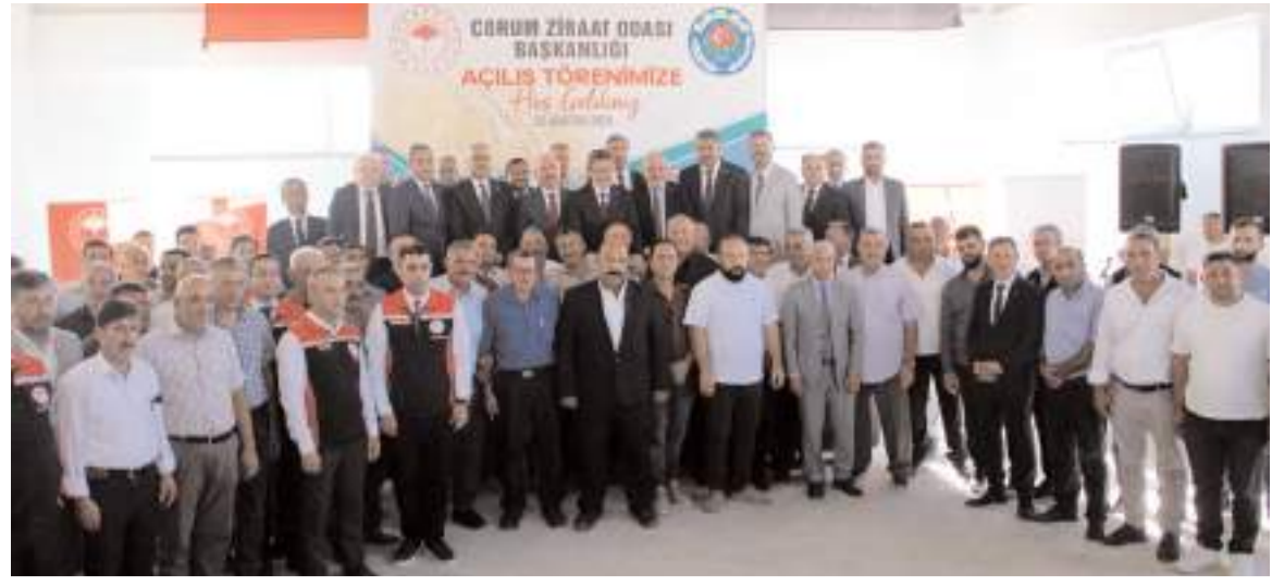
Ziraat Odası Tohum Eleme Tesisi düzenlenen törenle açıldı.

■ Çorum OSB'de hayata geçirilen DSİ Koçhisar Barajı 2. Kademe İçme Suyu Arıtma Tesisi ve Depolama İletim Hatları projesini inceleyen Tarım ve Orman Bakanı İbrahim Yumaklı, iklim değişikliğiyle birlikte suyun öneminin daha da artacağına dikkati çekerek, su tasarrufu çağrısında bulundu. * HABERİ'3'DE