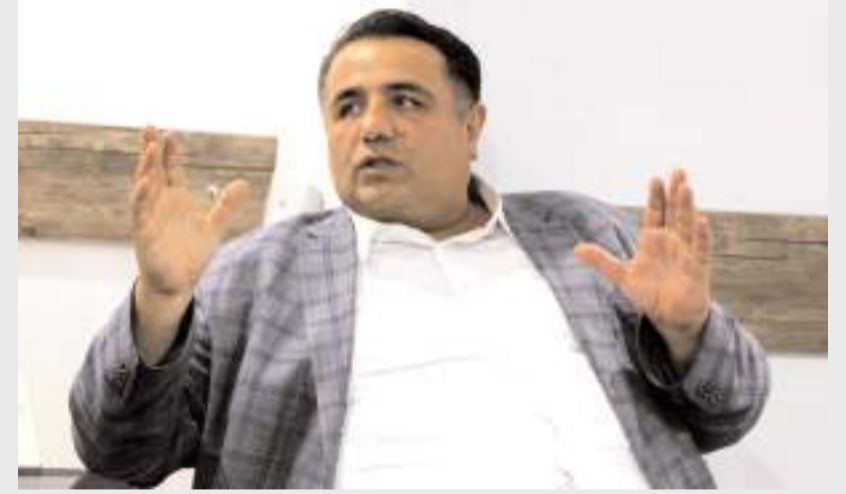
AK Parti Çorum Milletvekili Oğuzhan Kaya

AK Parti Çorum Milletvekili Oğuzhan Kaya, Sungurlu'ya 4. Etap TOKİ konutlarının yapılacağı müjdesini verdi. Geçtiğimiz yıllarda TOKİ tarafından ilçeye 1. ve 2. Etap konutları kazandırılmış, Manastır Tepesi yanında ise 3. Etap TOKİ inşaatları hızla devam etmeye başlamıştı. Gazetemizi ziyaret eden Milletvekili Oğuzhan Kaya, TOKİ'nin Sungurlu için 4. Etap Konut projesi çalışmalarına başladığını açıkladı. Kaya, yine Manastır Tepesi yanı-