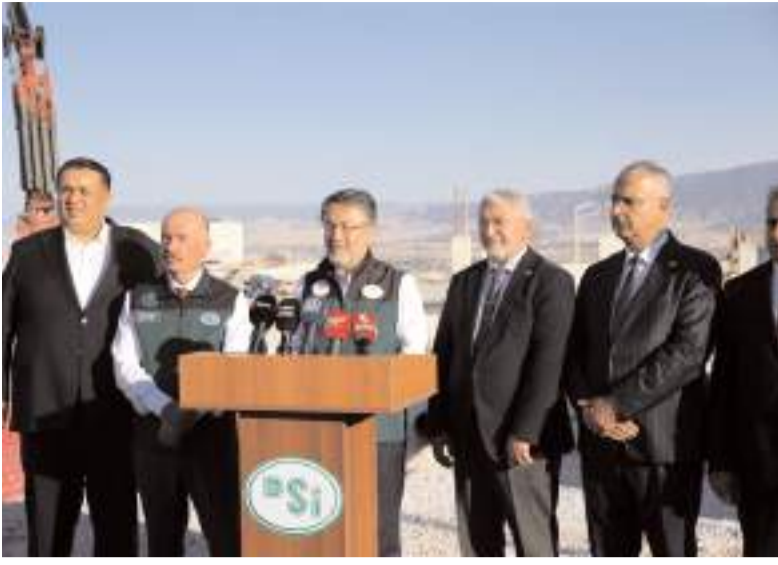
Tarım ve Orman Bakanı İbrahim Yumaklı, açıklamalarda bulundu.

■ Çorum OSB'de hayata geçirilen DSİ Koçhisar Barajı 2. Kademe İçme Suyu Arıtma Tesisi ve Depolama İletim Hatları projesini inceleyen Tarım ve Orman Bakanı İbrahim Yumaklı, iklim değişikliğiyle birlikte suyun öneminin daha da artacağına dikkati çekerek, su tasarrufu çağrısında bulundu. * HABERİ'3'DE