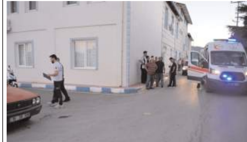
Kaza Esentepe Mahallesi Zübeyde Hanım Caddesi'nde meydana geldi.