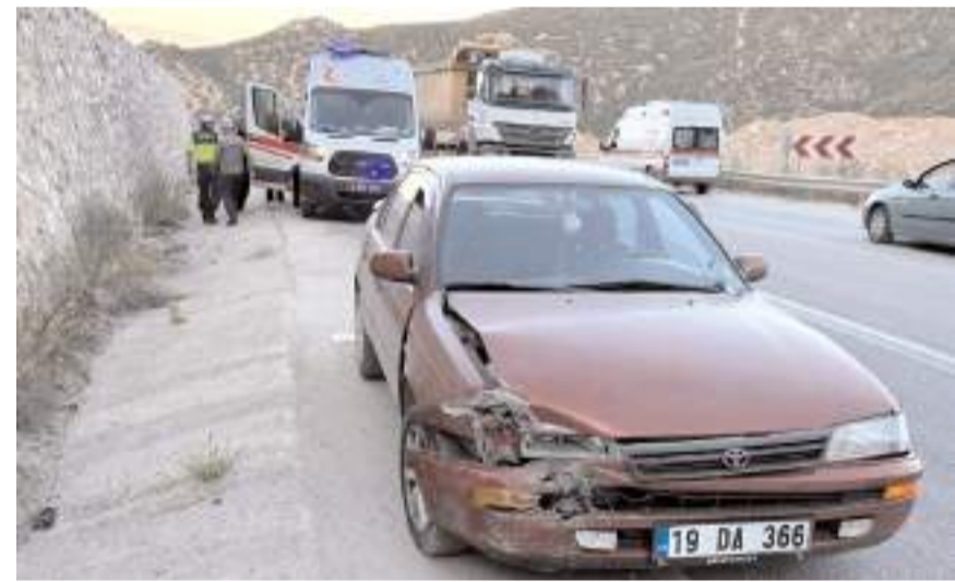
Kaza Kırkdilim mevkisinde meydana geldi.

Kazada yaralanan sürücü, sağlık ekiplerinin ilk müdahalesinin ardından Hitit Üniversitesi Erol Olçok Eğitim ve Araştırma Hastanesi'ne kaldırıldı.(AA)