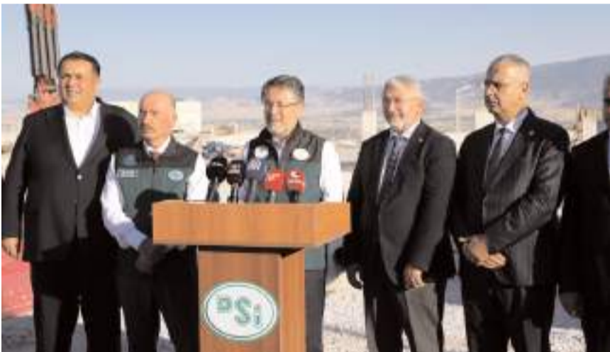
Tarım ve Orman Bakanı İbrahim Yumaklı, açıklamalarda bulundu.