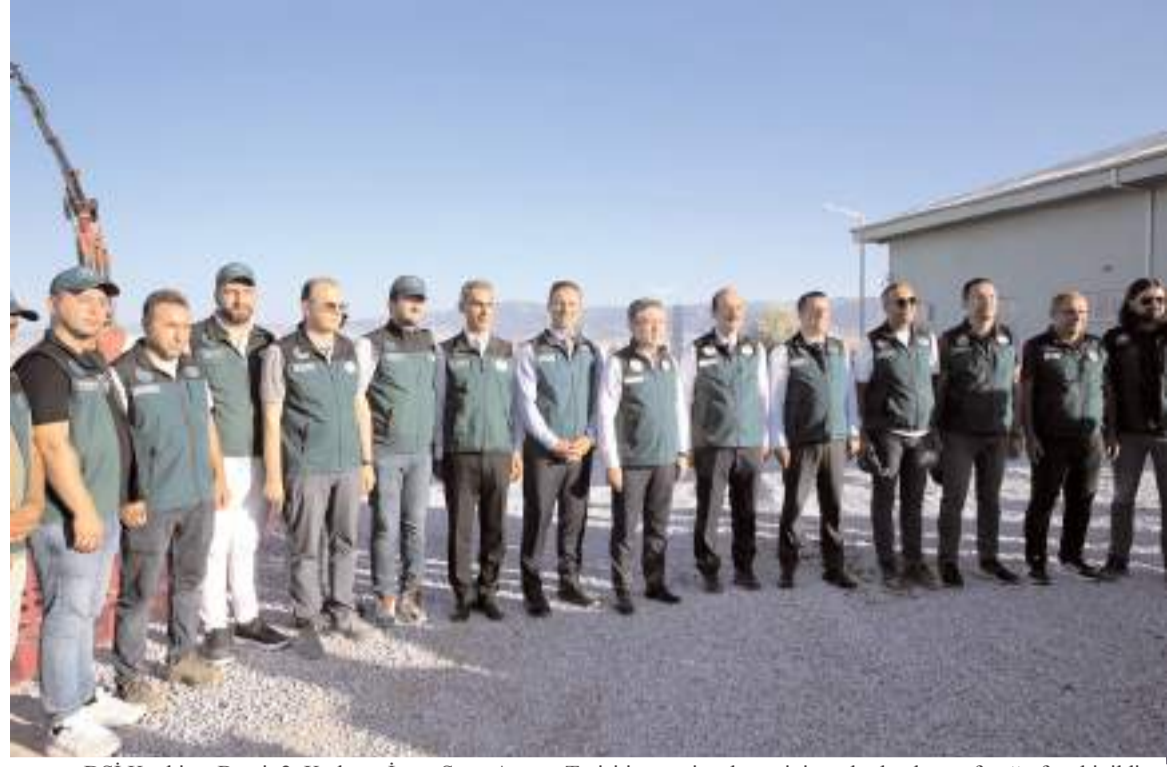
DSİ Koçhisar Barajı 2. Kademe İçme Suyu Arıtma Tesisi inşaatı incelemesinin ardından hatıra fotoğrafı çekildi.