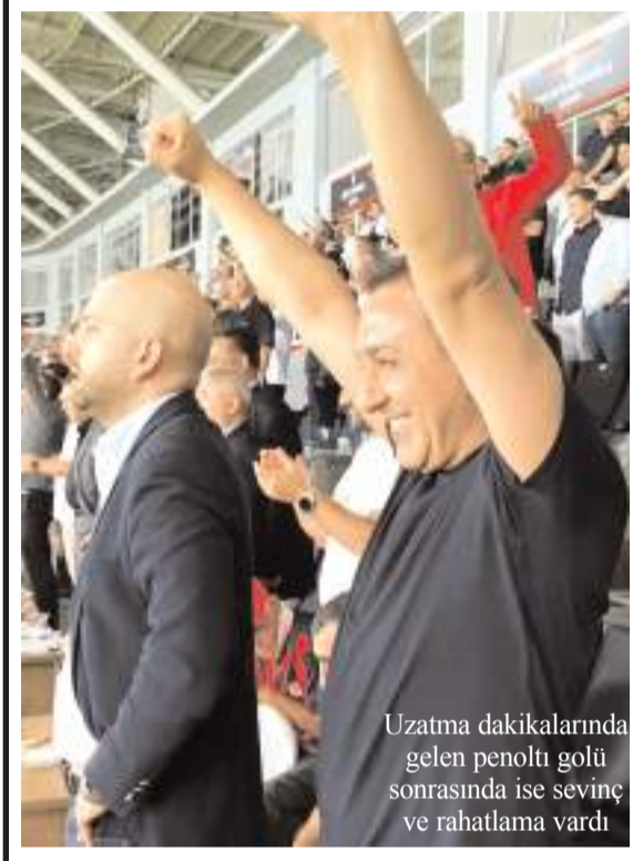
Uzatma dakikalarında gelen penaltı golü sonrasında ise sevinç ve rahatlama vardı