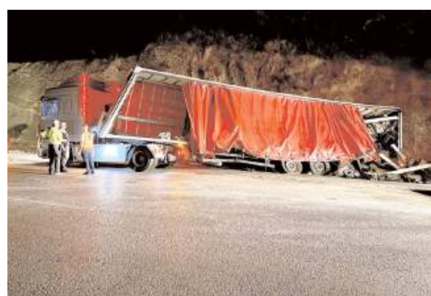
Kaza Samsun'un Kavak ilçesinde meydana geldi.

Sürücünün yara almadan atlattığı kazada, ulaşım bir süre tek şeritten kontrollü sağ-