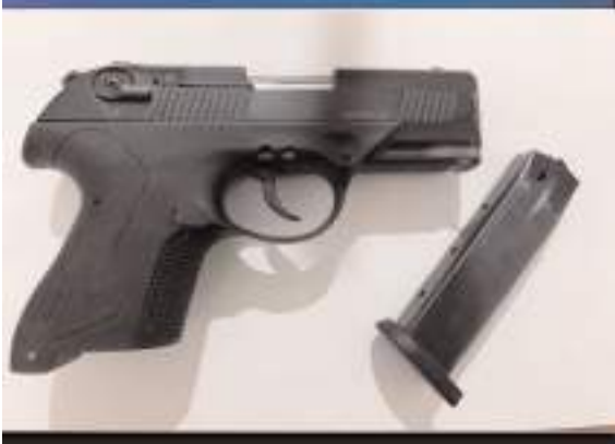
Polis ekipleri uygulamalarda silah ve uyuşturucu madde ele geçirildi.