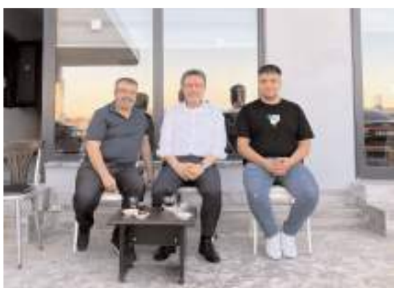
Bakan Yumaklı, bir akaryakıt istasyonunda mola verdi.

İstasyon sahibi Ömer Zengin, Bakan Yumaklı'yı karşılarında görünce büyük bir şaşkınlık yaşadıklarını belirterek, "Sayın Bakanımız korumalarıyla birlikte çay içip dinlendi, bizlerle sohbet etti. Çok memnun bir şekilde istasyonumuzdan ayrıldı. Bizler de kendisini ağırlamaktan büyük mutluluk duyduk" dedi. (Haber Merkezi)