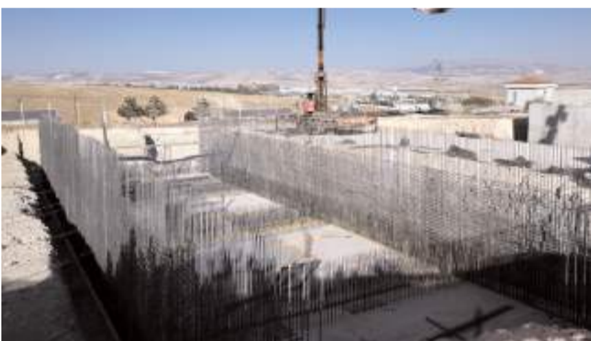
DSİ Koçhisar Barajı 2. Kademe İçme Suyu Arıtma Tesisi ve Depolama İletim Hatları projesi Çorum OSB'de hayata geçiriliyor.