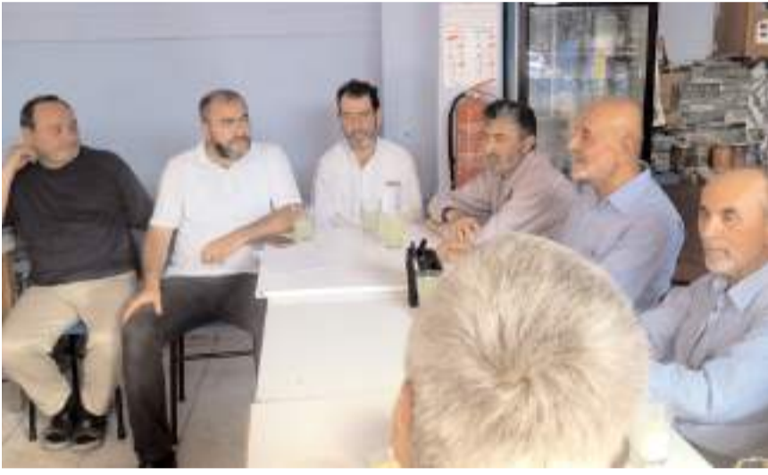
Kongrede ilk olarak divan heyeti belirlendi.