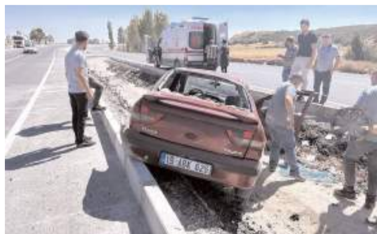
Kazada otomobilde maddi hasar meydana geldi.

Çorum'da aracın orta refüje çarpması sonucu yaralanan sürücü hastanede kaldırıldı.