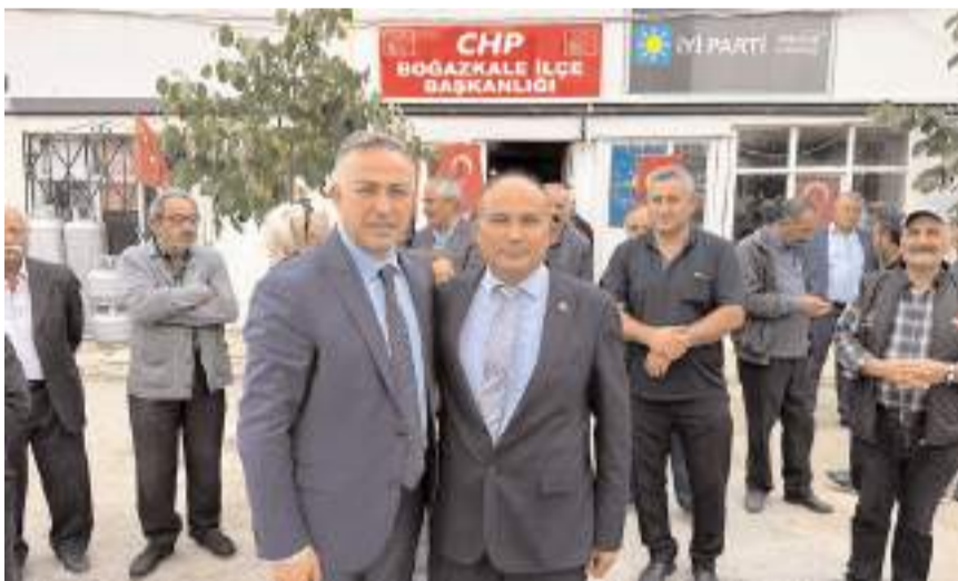
CHP Çorum Milletvekili Mehmet Tahtasız, Fevzi Helik'i tebrik etti.

Kongre ile ilgili bir açıklama yapan CHP Çorum Milletvekili Mehmet Tahtasız; "Boğazkale İlçemizde gerçekleştirdiğimiz Olağan Kongremizle birlikte partimize uzun yıllar emek veren ve ilçe başkanlığı yapan Mehmet Kurtçu başkanımız, yapılan seçimle