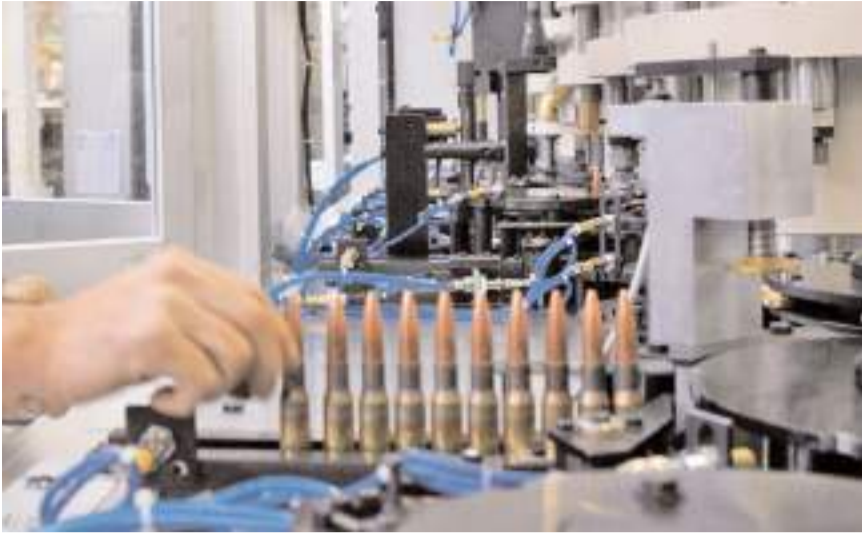
Firma mühimmatta üretiyor.