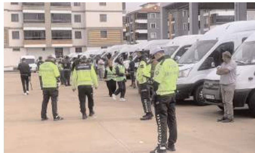
Denetimlerde servis araçlarının teknik donanımları, koltuk sayıları, emniyet kemerleri, şoförlerin belgeleri ve rehber personel durumları tek tek kontrol edildi.