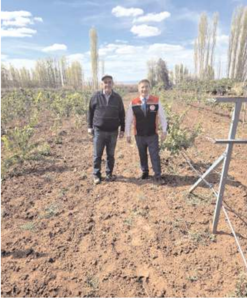
Teknik personel, ilçedeki bağ ve ceviz bahçelerinde sonbahar ve kış bakımı kapsamında incelemelerde bulundu.