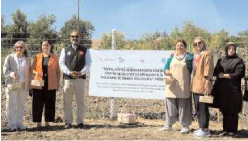
Etkinliği Bizimora Kadın Girişimi Üretim ve İşletme Kooperatifi düzenledi.