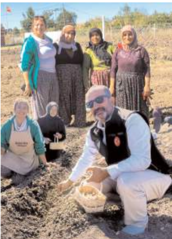
Davetiler de safran dikimine katıldı.