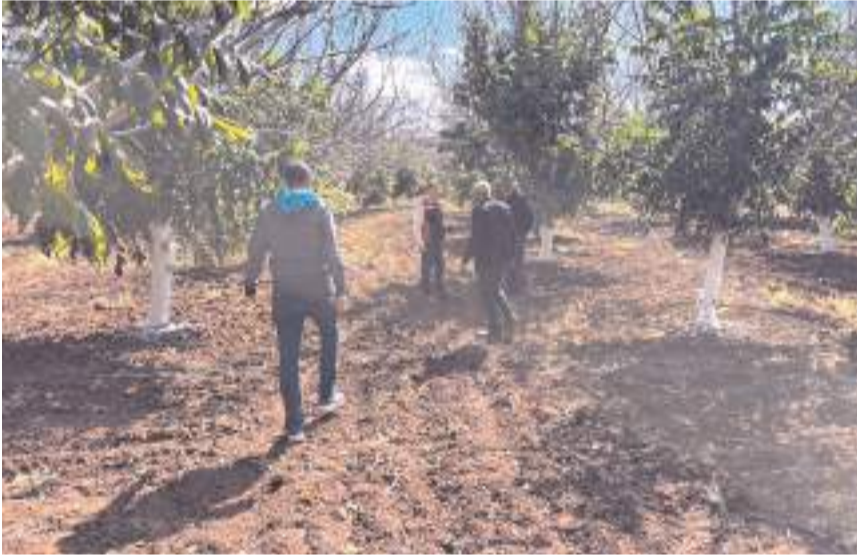
Uzmanlar, sahadaki gözlemler ışığında anlık önerilerde bulunarak birebir çözüm yolları sundu.