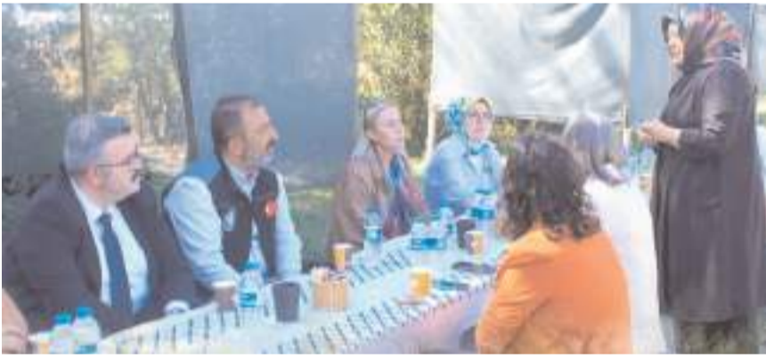
Program Eskice köyünde yapıldı.