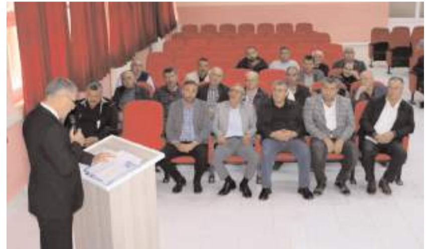
Toplantıda gündem maddeleri görüşülerek oylandı.