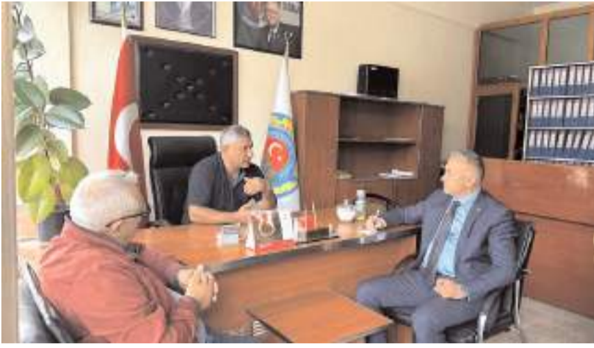
CHP Çorum Milletvekili Mehmet Tahtasız, Boğazkale Ziraat Odası Başkanı Derviş Balkoca'yı ziyaret etti.

Derinlemesine bir fizibilite yapılmadan alındığını düşündüğümüz bu karar yeniden gözden geçirilmelidir" diye konuştu.