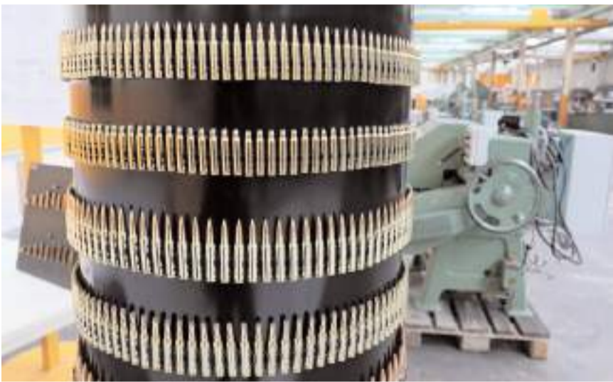
Firma 2018 yılında BAE merkezli Edge Group tarafından satın alınmış.