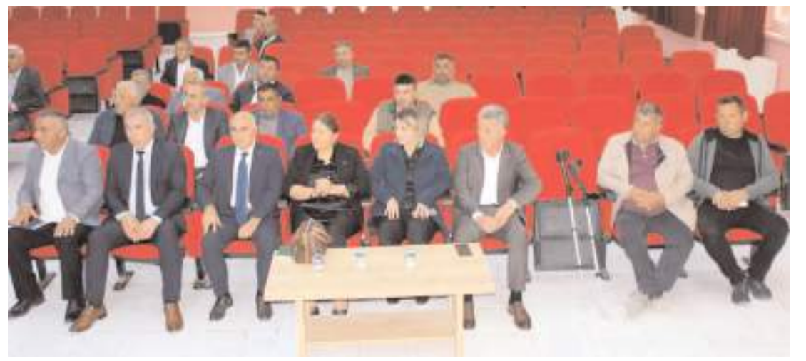
Toplantı Mecitözü Kaymakamı Fatma Gül Nayman'ın başkanlığında yapıldı.