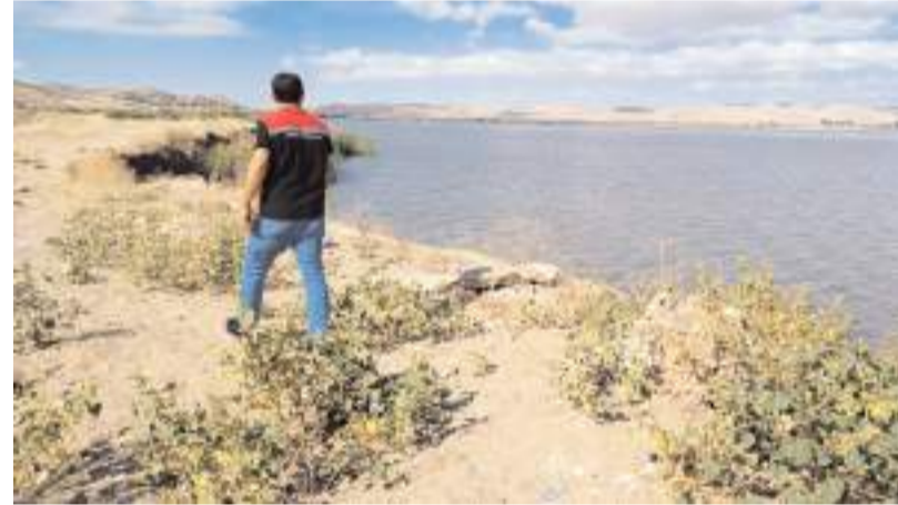
Ekipler göl ve barajlarda su ürünleri denetimleri gerçekleştirdi.