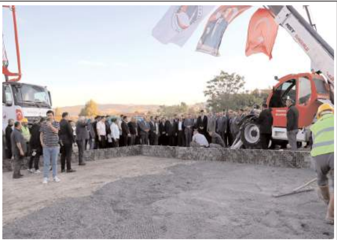
Tesis Sungurlu Bölge Trafik Denetleme Şube Müdürlüğü yakınlarında inşa ediliyor.