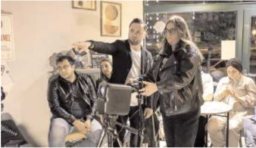
Katılımcılara günlük hayatta daha güzel ve estetik fotoğraf çekmenin incelikleri uygulamalı olarak gösterildi.