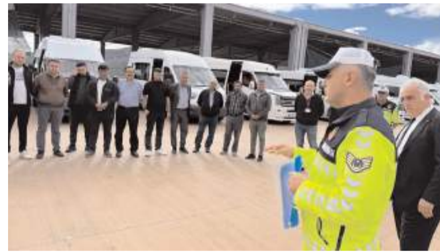
Ekipler servis sürücülerine uyarılarda bulundu.