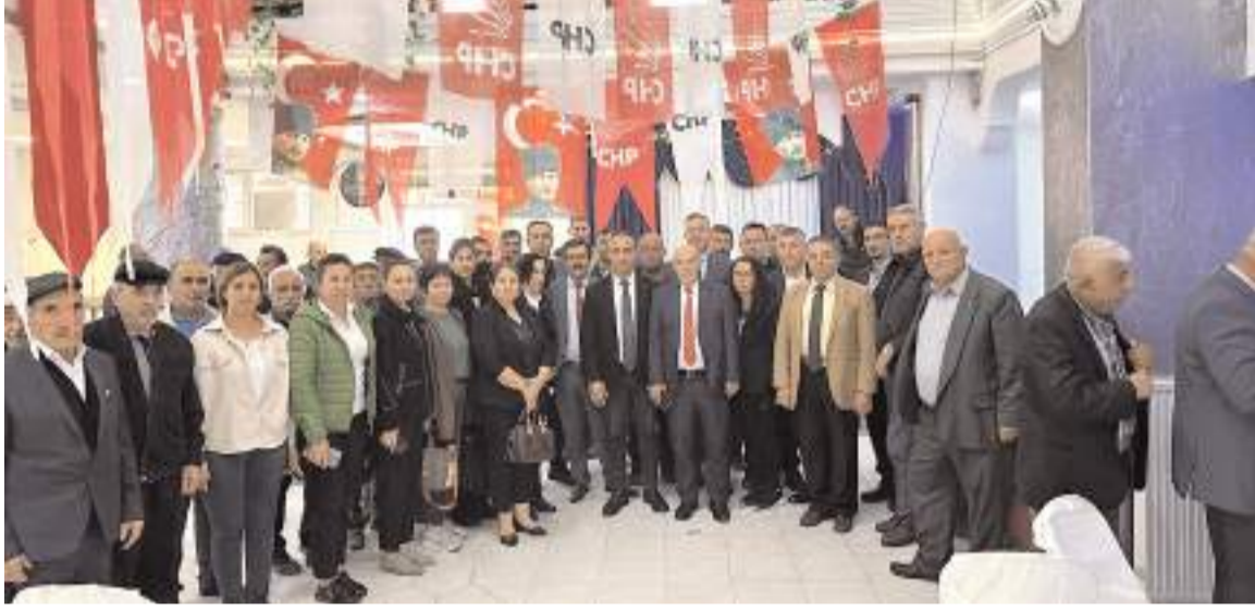
Kongrenin sonunda toplu hatıra fotoğrafı çekildi.