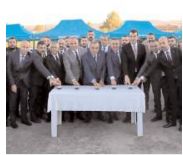
Tesis Sungurlu Bölge Trafik Denetleme Şube Müdürlüğü yakınlarında inşa ediliyor.