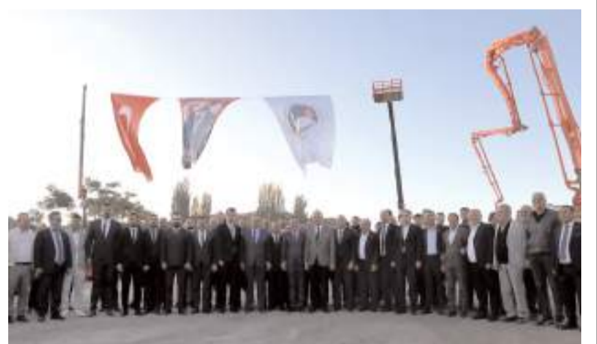
Tesis 1260 metrekare kapalı, 3 bin metrekare açık alana sahip olacak.