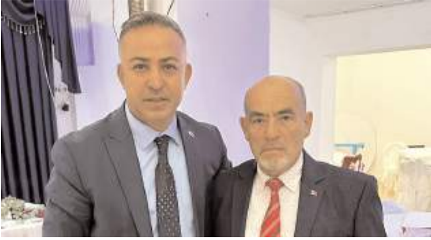
CHP Çorum Milletvekili Mehmet Tahtasız, Mecitözü İlçe Başkanı Ahmet Bilgin'i tebrik etti.

CHP Mecitözü İlçe Başkanlığı'nın Olağan Kongresi önceki gün gerçekleştirildi.