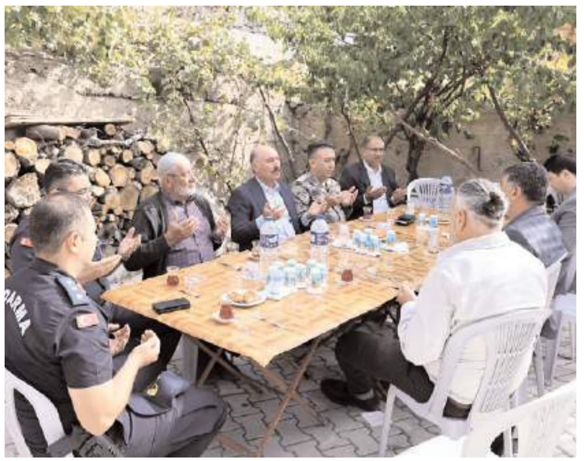
Mevlid programı Merkeze bağlı Eskikaradona köyünde düzenlendi.