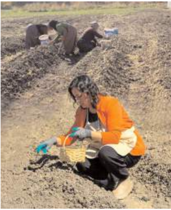
Davetliler de safran dikimine katıldı.