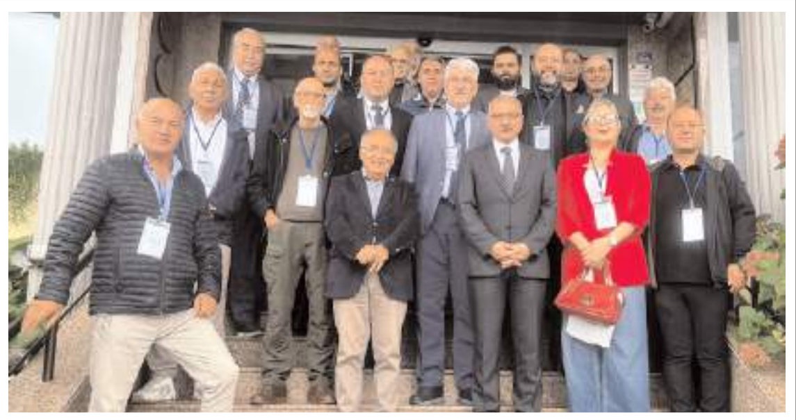
Genel kurulda üç yıl boyunca görev alacak yeni yönetim, denetim, onur, yüksek işiştare ve üst kurul delegeleri belirlendi.