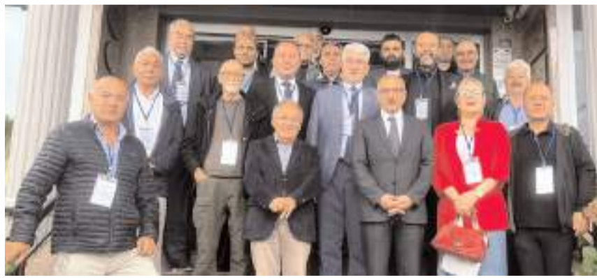
Genel kurulda üç yıl boyunca görev alacak yeni yönetim, denetim, onur, yüksek istişare ve üst kurul delegeleri belirlendi.