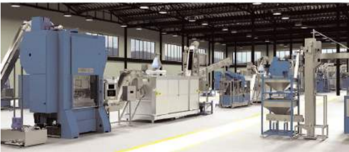
Firma mühimmat üretim tesisleri de kuruyor.

Türk savunma sanayinin yükselen yıldızlarından Çorum merkezli Arca Savunma, 106 yıllık Fransız mühimmat devi Manurhin için masada. 2018'de iflas eden ve ardından Birleşik Arap Emirlikleri'nin (BAE) sermayesiyle ayakta kalan şirket, Fransız basınına göre sessizce satışa çıkarıldı.