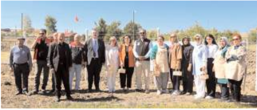
Programın sonunda hatıra fotoğrafı çekildi.