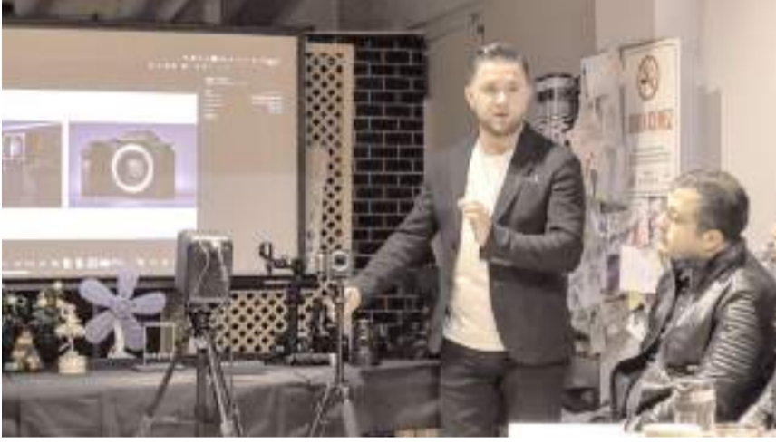
Eğitimi fotoğrafçı (fotoğraf sanatçısı) Deniz Ural verdi.