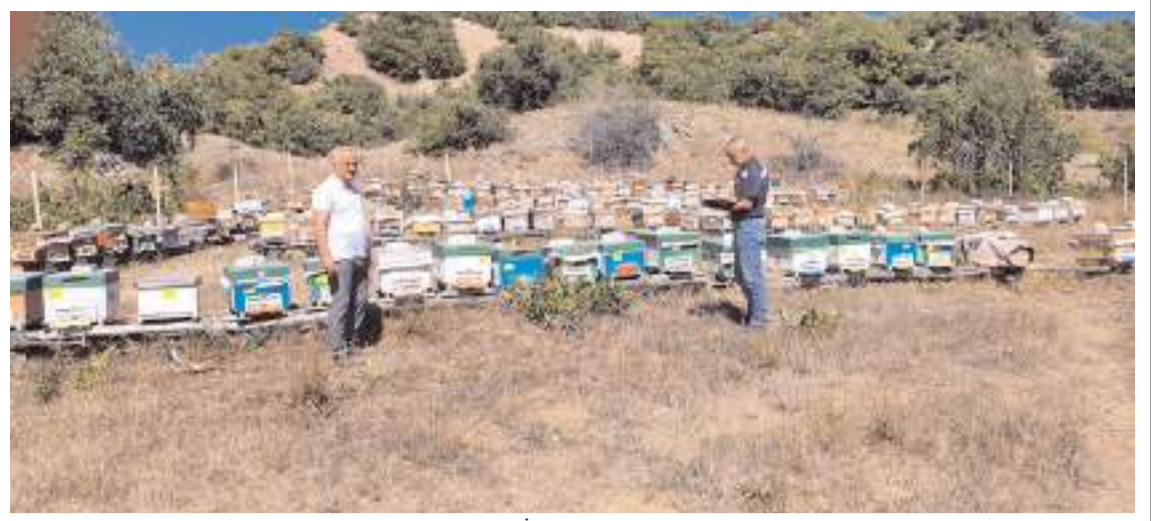
Tarım ve Orman İl Müdürlüğü ekipleri, 2025 yılı desteklemeleri öncesinde arı kovanlarını yerinde kontrol etti.

Çayın kilogram fiyatı geçen ay olduğu gibi bu ay da artış gösterdi. Diğer ürünlerden salça fiyatında yüzde 13, reçel fiyatında yüzde 16 artış oldu. Bal fiyatlarında ise yüzde 6 düzeyinde artış görüldü. Şeker ve pekmez fiyatları sabit kaldı. (Haber Merkezi)