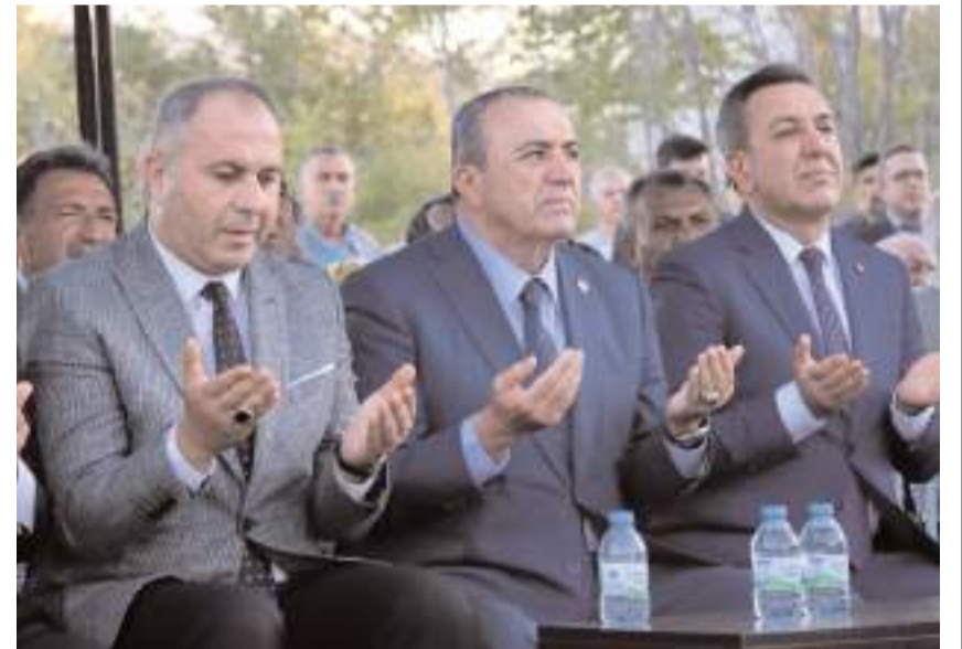
Yapılan duanın ardından tesisin temeli atıldı.