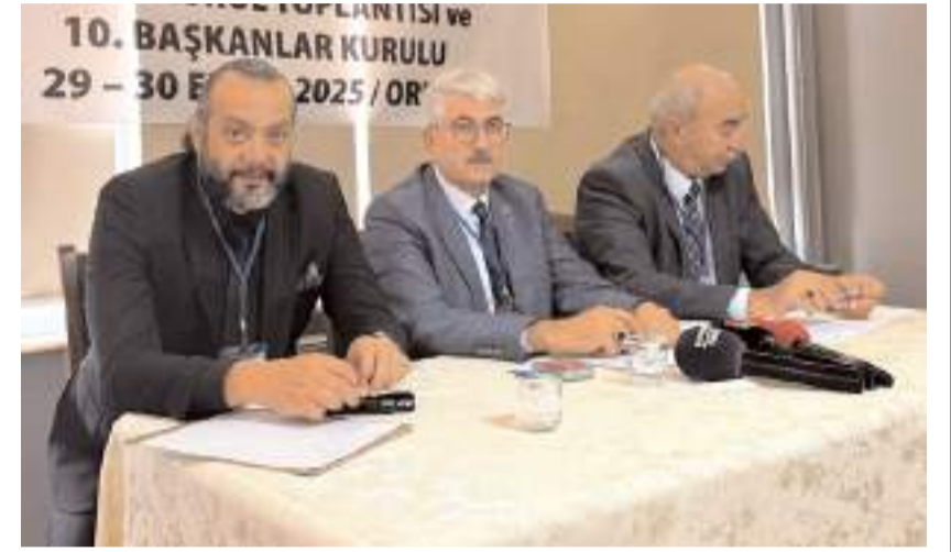
Genel kurulda ilk olarak divan heyeti belirlendi.