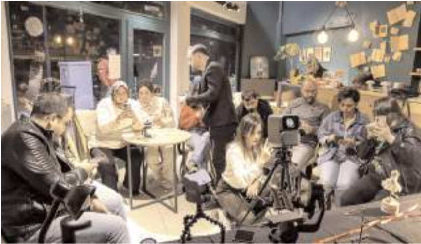
Program Café Rast Atölye'nin evsahipliğinde düzenlendi.