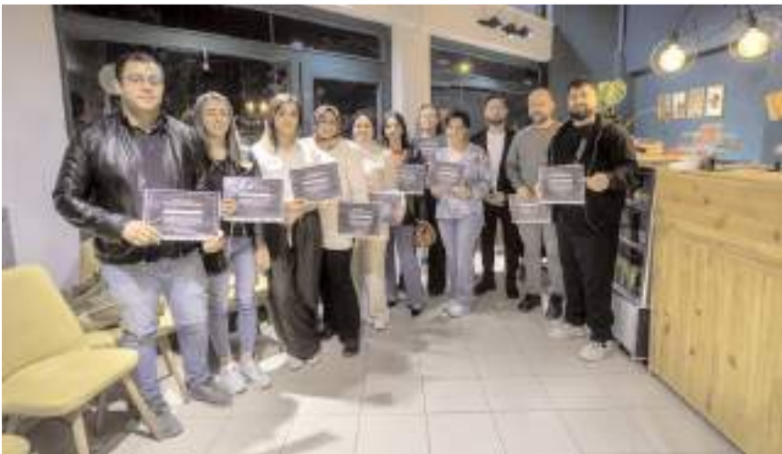
Eğitime katılanlara katılım belgeleri verildi.