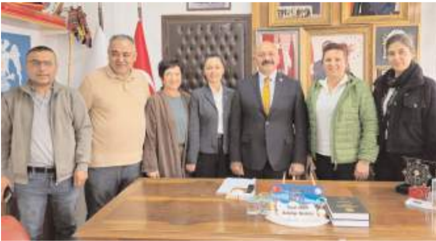
Ziyaretin anısına toplu fotoğraf çekildi.