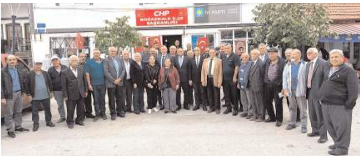
Kongrenin ardından hatıra fotoğrafı çekildi.

değişmez. Yenilenen yönetimimiz ve üyeleri-mizle birlikte Boğazkale'de de iktidar yürütüşümüze devam edeceğiz." ifadelerini kullandı (Haber Merkezi)