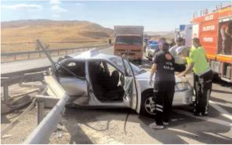
Kazada otomobil hurdaya döndü.

Kırıkkale'de kontrolden çıkan otomobilin bariyerlere çarpması sonucu meydana gelen kazada ağır yaralanan 25 yaşındaki Çorumlu genç hastanede hayatını kaybetti, 4 kişinin ise tedavisi devam ediyor.