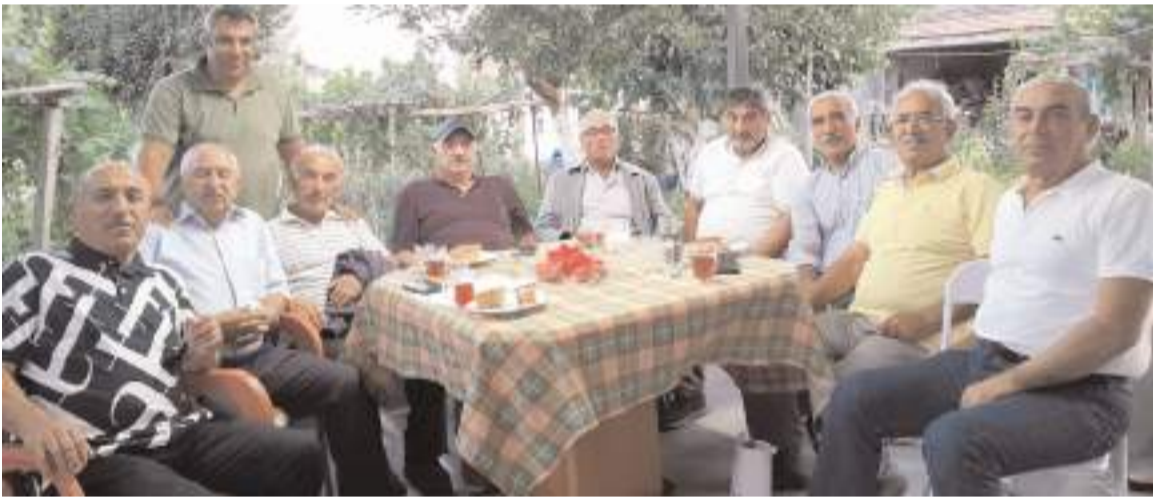
Köyün ileri gelenleri su kaynağı ile ilgili istişarede bulundular.

yeryüzünde güzel ahlakın, adalet ve faziletin timsali olmuş, barışın huzuru, hayır ve esenliğin yeryüzünde tesis edilmesini sağlamıştır. Sevgili Peygamberimizin müstesna hayatından bize gösterdiği ve inci mercan sözlerinden bizlere vaaz ettiği iyiliği, güzelliği, doğruluğu, emaneti korumayı insanı, eşref-i mahlukat olarak görüp hakkını vermeyi, zayıf, yetim, kimsesiz ve muhtaçlara yardım etmeyi, hayırda yarışmayı, birbirini sevmeyi hasılı her yönüyle hayırlı bir insan olmayı bizler de en önemli vazife görüp bu şuurla hayatımızı tanzim etmeliyiz. Müslümanlar için güzelliklere erişme, af ve mağfiyete ulaşmanın vesilesi ve en kutlu yolu olan bu gecenin birlik ve beraberliğimize, dirlik ve düzenimize vesile olması temennisiyle Çorumlu hemşehrilerimin ve tüm Müslümanların Mevlid Kandilini en kalbi dileklerle kutluyor, bu gecenin hayırlara vesile olmasını diliyorum." (Haber Merkezi)