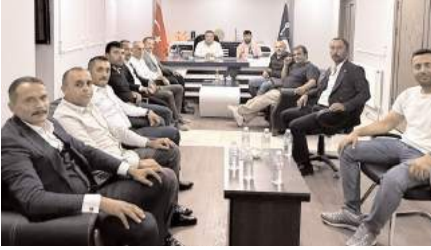
Anahtar Parti ilçe başkanları ile istişare toplantısı gerçekleştirildi.