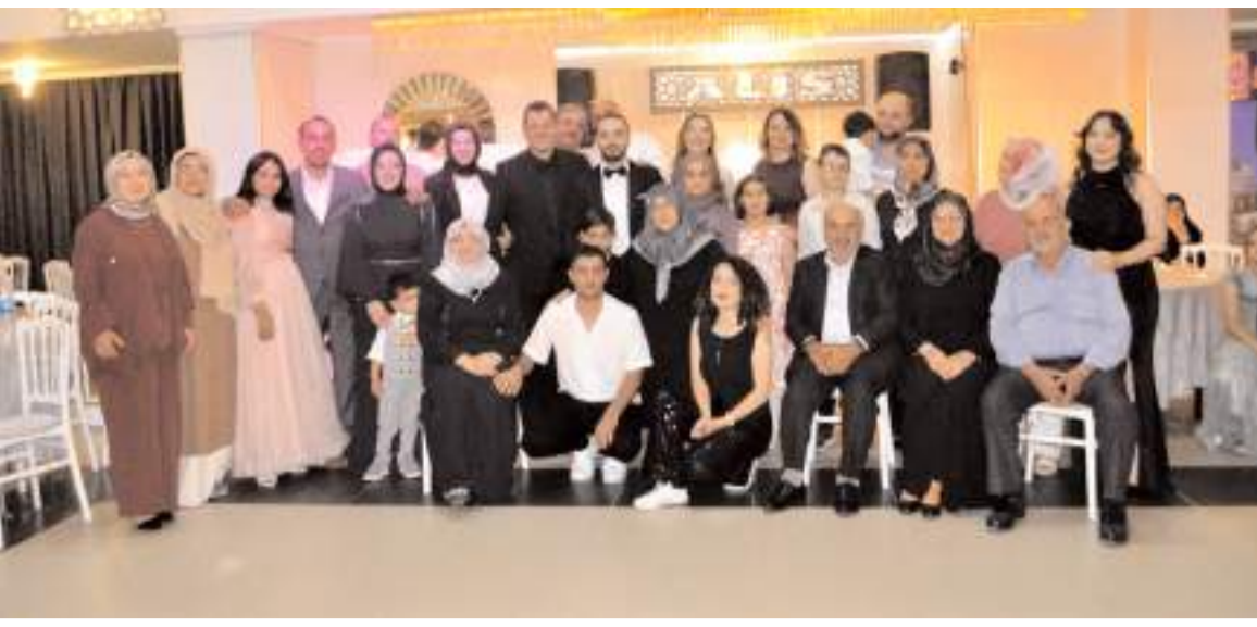
Genç çifti bu mutlu günlerinde yakınları yalnız bırakmadı.