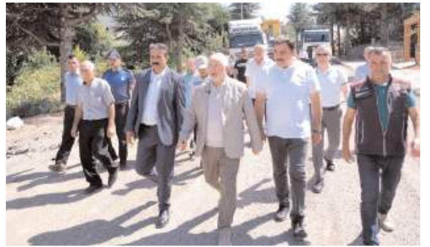
Başkan Aşgın çalışmaları yerinde inceledi.