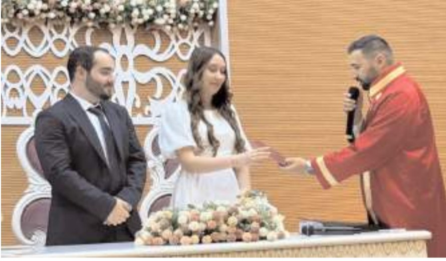
Genç çiftin nikahı Belediye Nikah Salonunda kıyıldı.

HAKİMİYET, genç çifti kutlar ömür boyu mutluluklar diledi.