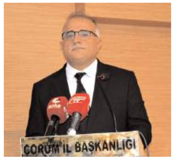
Av. Yakup Alar

"Türk demokrasi tarihinde reformculuğun adı ve adresi AK Parti olmuştur. 2002'de vesayet düzenine karşı çıkan, siyasetin paradigmasını değiştiren, statükoyu sarsan, millîti siyasetin asli unsuru yapan o büyük yürüyüş,