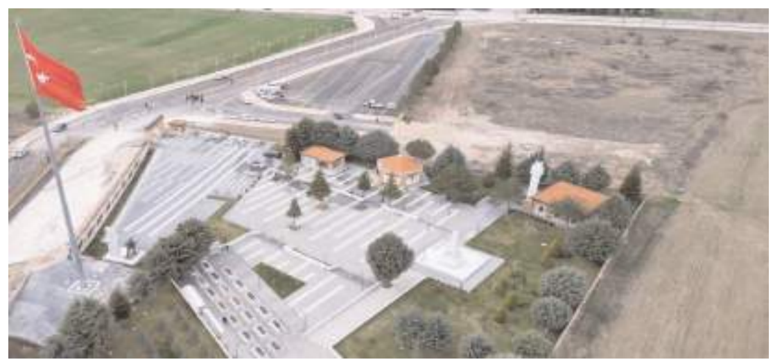
Arsanın büyüklüğü 11 bin 580 m2.

İsteklilerin teklifleriyle birlikte geçici teminat mektubu sunmaları da zorunlu. Teminat tutarları Lot-1 için 800 bin Türk Lirası veya 20 bin Amerikan Doları; Lot-2 için 250 bin Türk Lirası veya 6 bin 500 Amerikan Doları; Lot-3 için ise bir milyon 200 bin Türk Lirası veya 30 bin Amerikan Doları olarak belirlendi. Her üç lota da teklif verecek olanların, teminatları her lot için ayrı ayrı sunması gerekiyor. Teminat mektuplarının teklif son tarihinden itibaren en az 118 gün geçerli, yani 30 Ocak 2026 tarihine kadar geçerli olması isteniyor. (Enerji Günlüğü)