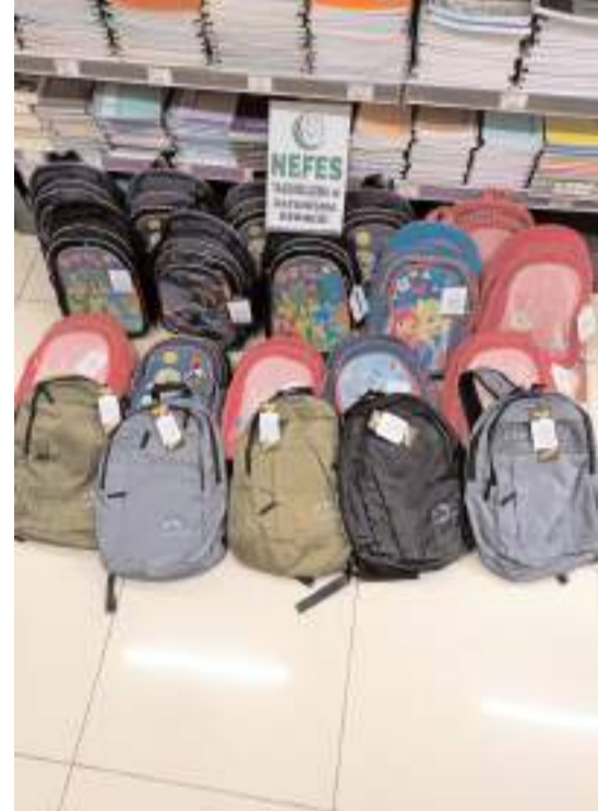
Dernek kampanyaya destek istedi.