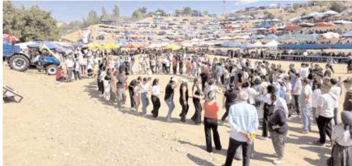
Şenliğe katılan vatandaşlar türküler eşliğinde bol bol halay çektiler.

SATILIK ARSA Küçük Sanayi Sitesi Dura Lazer yanında 1900 m2 arsa sahibinden satılıktır. 0 532 635 23 04