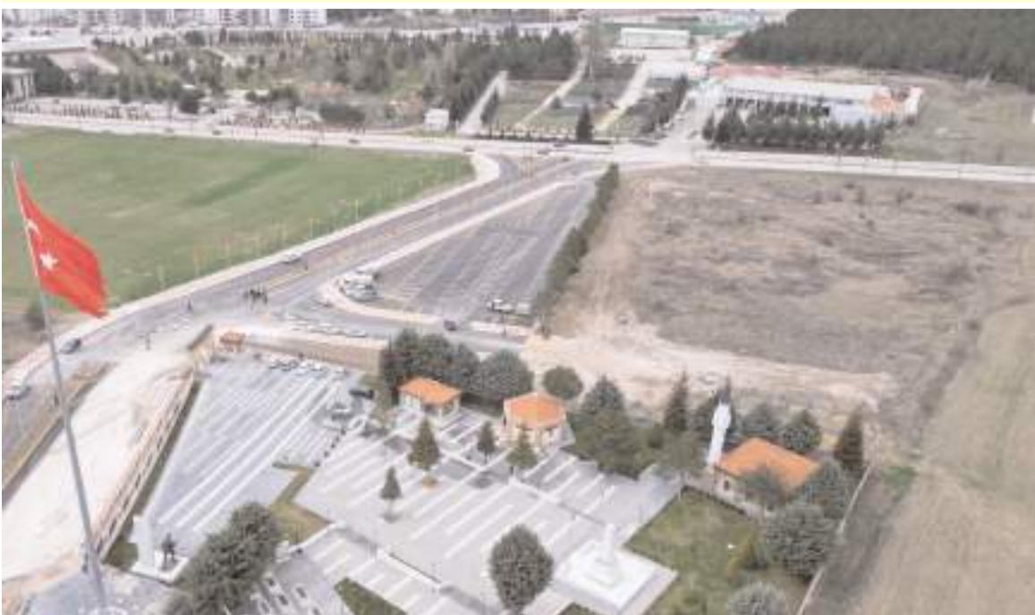
Arsanın büyüklüğü 11 bin 580 m2.

Çorum Belediyesi, İtfaiye Müdürlüğü karşısında Şehitlik yanında bulunan 11 dönümlük arazisini satışa çıkarttı. * HABERİ6'DA