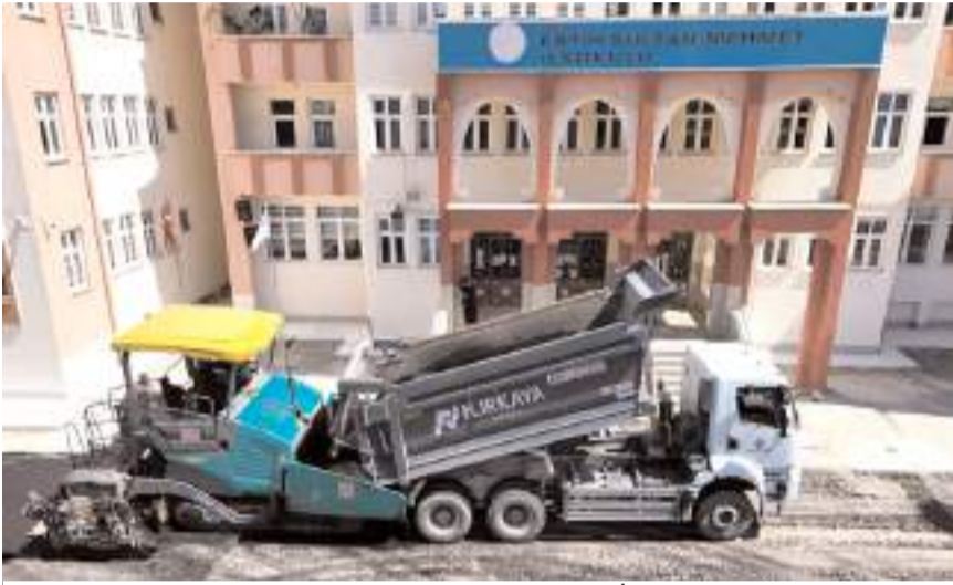
Belediye ekipleri Fatih Sultan Mehmet İlkokulu bahçesinde 3 bin metrekare alana 950 ton asfalt serdi.