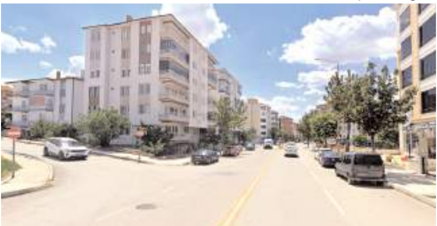
Belediye bölgede içme suyu şebeke hattı yapıyor.

çekleştirilecek içme suyu şebeke hattı yapım çalışması nedeniyle, Ekin Caddesi - Ata Caddesi kesişimi ile Ata Caddesi - Ata 9. Sokak kesişimi arasında kalan yolun çift yönlü olarak trafiğe kapatılacağını duyurdu.