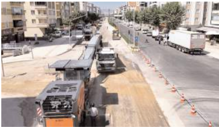
Osmancık Caddesinde 1600 metre uzunluğundaki yolun tek şeridini geçtiğimiz hafta tamamlayan ekipler, bu haftada da diğer şeritte asfalt öncesinde kazı ve dolgu çalışmalarına başladı.