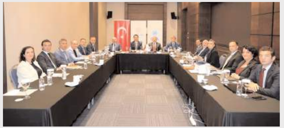
Toplantı Tokat Valisi Abdullah Köklü'nün ev sahipliğinde yapıldı.