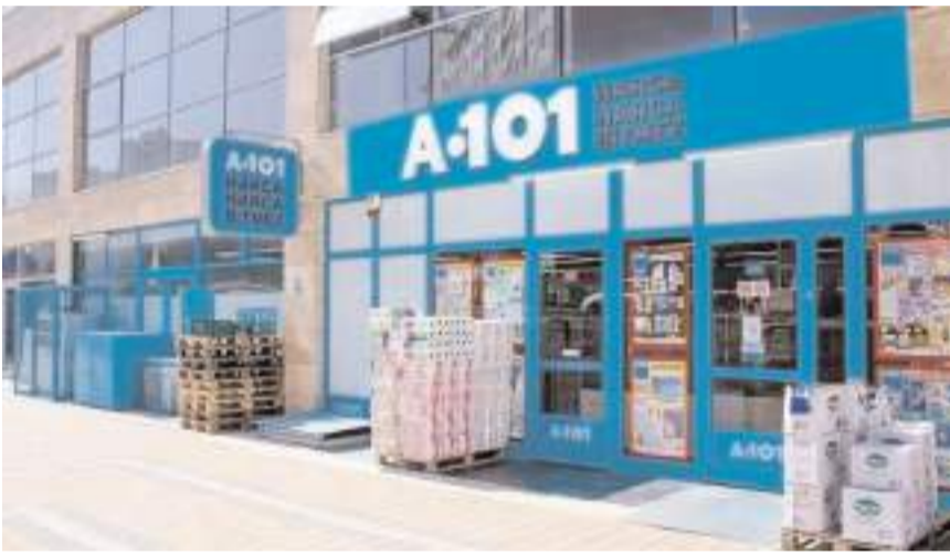
Kursiyerlerin en az yüzde altmış A 101 firması tarafından istihdam edilecek.