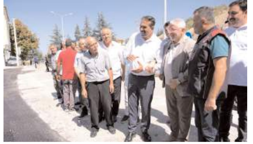
Başkan Aşgın, çalışmaların son durumu hakkında bilgi aldı.