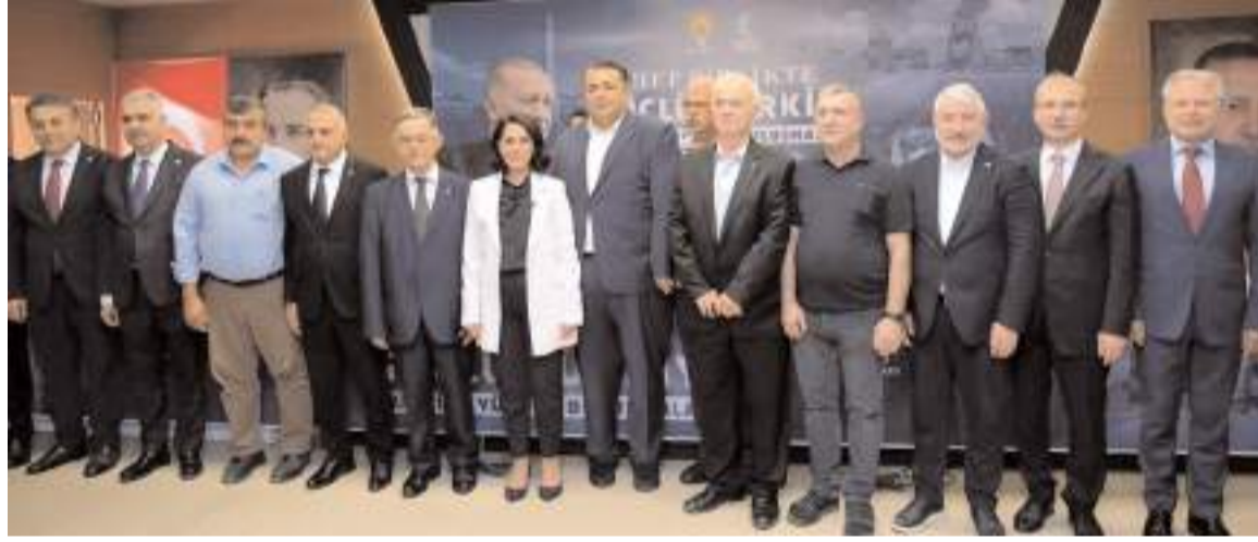
Toplantının ardından hatıra fotoğrafı çekildi.

Türkiye Yüzyılı Buluşmaları kapsamında Çorum'da yapılan toplantıda konuşan AK Parti Genel Başkan Yardımcısı Çevre ve Şehircilik Politikaları Başkanı Sevilay Tuncer, 24 yılda Çorum'a toplam değeri 120 milyar liraya ulaşan büyük yatırımlar yaptıklarını söyledi. * HABERİ2'DE