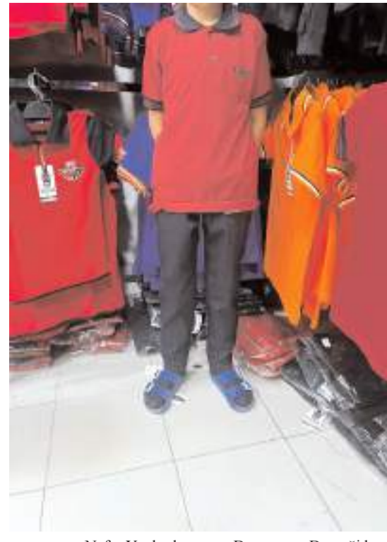
Nefes Yardımlaşma ve Dayanışma Derneği bu yılda okullar açılmadan önce eğitim yardımında bulunacak.

Amaçlarının yalnızca seçimlere hazırlanmak olmadığını vurgulayan Müstet, "Çorum'a ve ülkemize değer katacak, adaletli, şeffaf ve katılımcı bir siyaset anlayışını hakim kılmaktır. Bu doğrultuda ilk toplantımızda ortak hedeflerimizi belirledik ve yol haritamızı çizdik. Birlik ve beraberlik içerisinde çok daha güçlü bir teşkilat yapısı kuracağımıza, Çorum'da Anahtar Parti'yi hak ettiği noktaya taşıyacağımıza yürekten inanıyorum" diye konuştu.