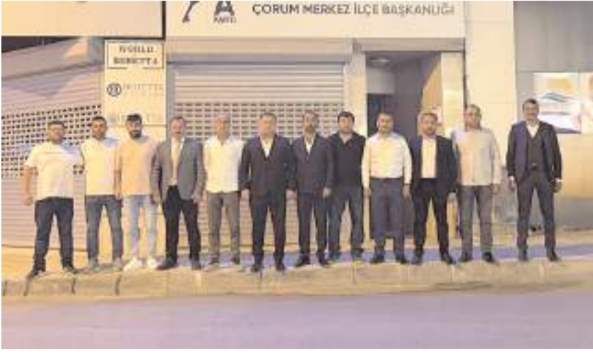
Toplantının ardından toplu hatıra fotoğrafı çekildi.