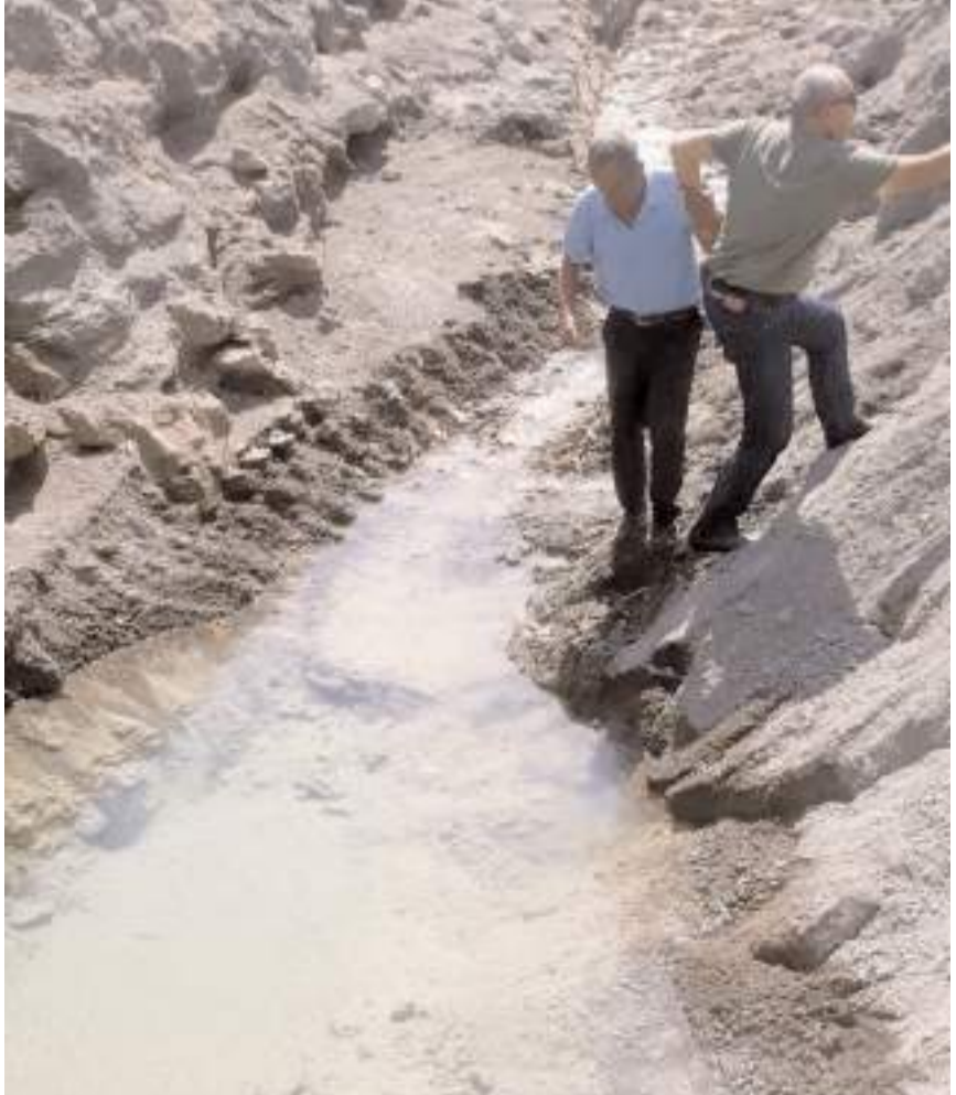
Suyu kaybolan çeşmenin kaynağı Yüksek Hızlı Tren Hattı çalışmalarında yeniden bulundu.