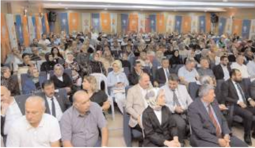
Programa katılım yüksek oldu.