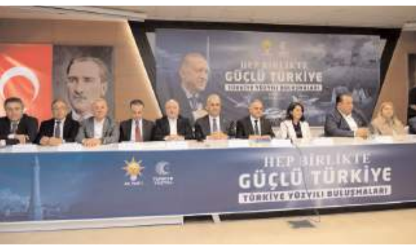
Toplantıda AK Parti MKYK üyeleri ve AK Parti Milletvekilleri il, ilçe, kadın ve gençlik kolları teşkilatı ile bir araya geldi.