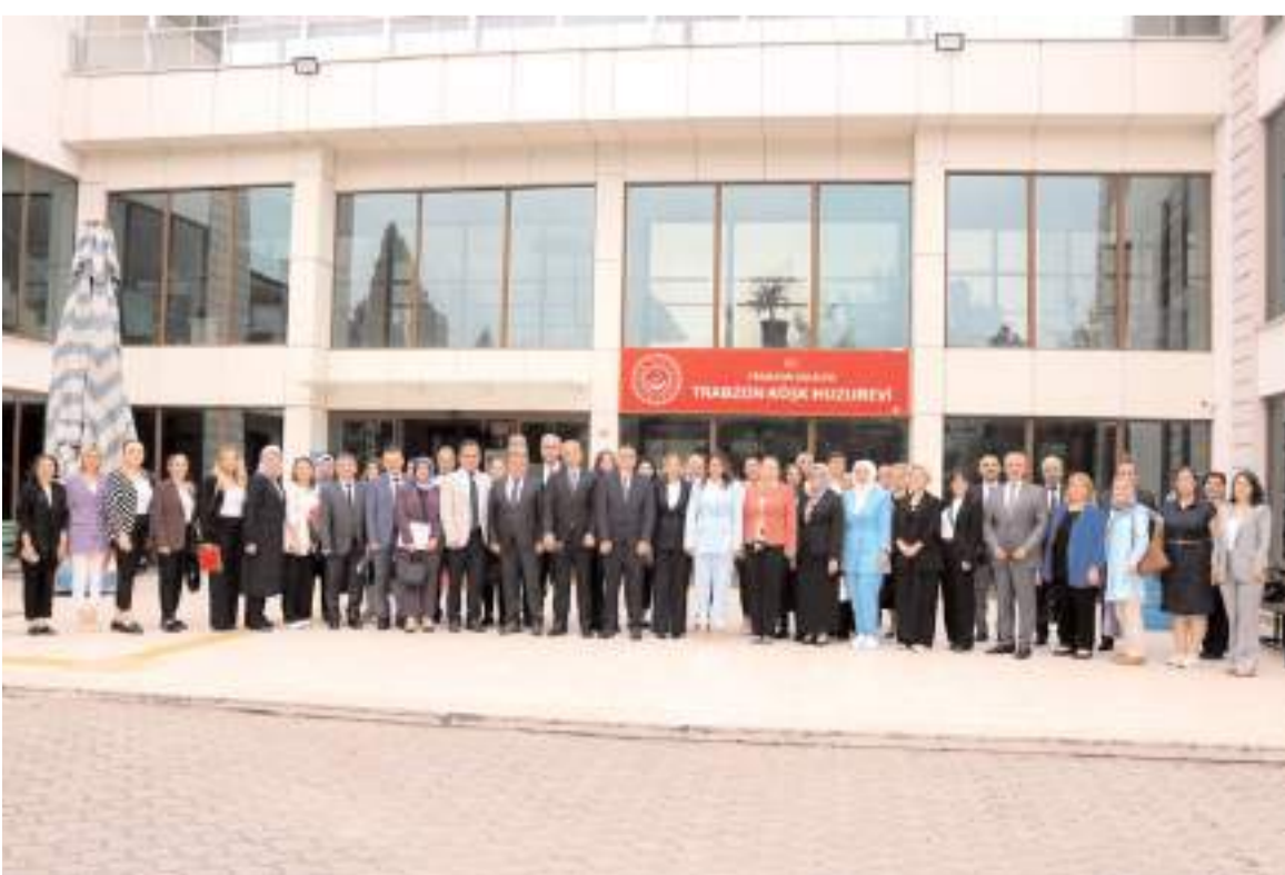
Toplantının ardından hatıra fotoğrafı çekildi.

Toplantıya bölge illerinin İl Müdürleri, Kadın Hizmetlerinden Sorumlu İl Müdür Yardımcıları, Şiddet Önleme ve İzleme Merkezi (ŞÖNİM) Müdürleri ile Kadın Konukevi Müdürleri katıldı.