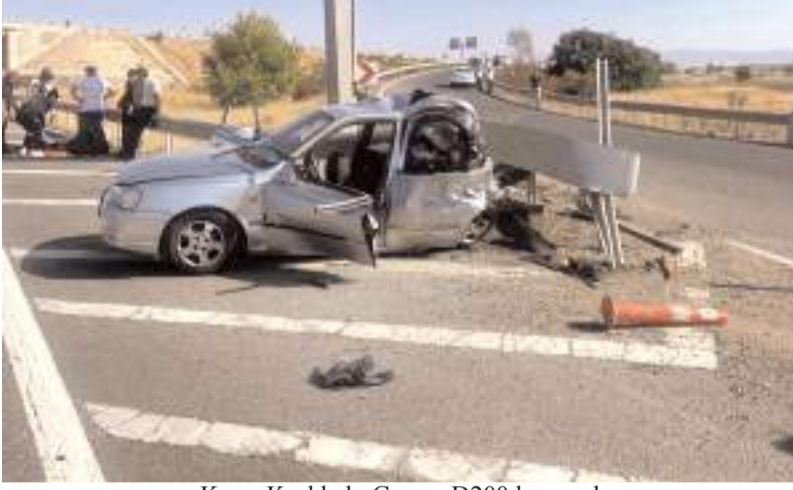
Kaza, Kırıkkale-Çorum D200 kara yolunun 63'üncü kilometresinde meydana geldi.