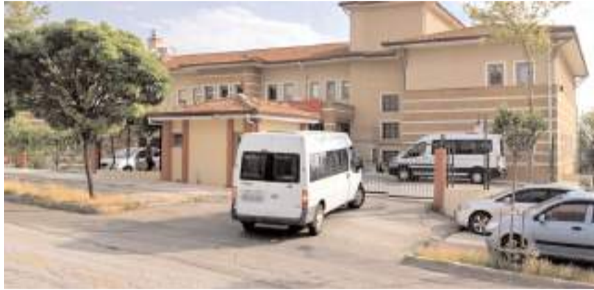
GES'lerden birisi Engelsiz Yaşam Merkezi çatısına kurulacak.

İhalenin 4734 sayılı Kamu İhale Kanunu ve 4735 sayılı Kamu İhale Sözleşmeleri Ka-