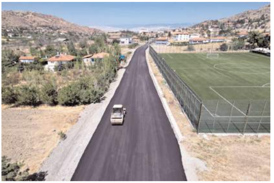
Çorum Belediyesi ilçede toplam 1600 metre uzunluğunda 3 ayrı yolda asfalt çalışması yaptı.