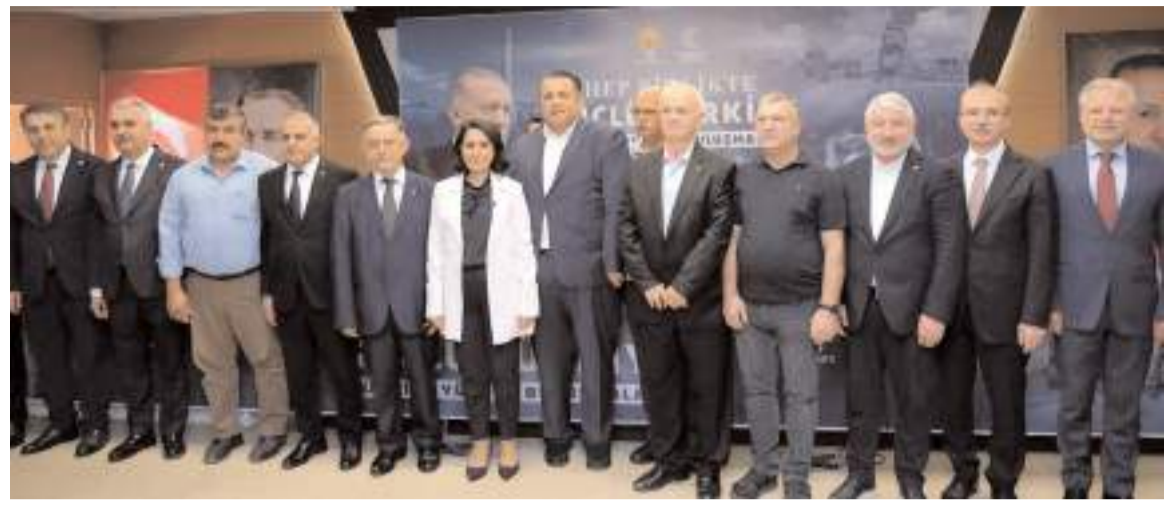
Toplantının ardından hatıra fotoğrafı çekildi.