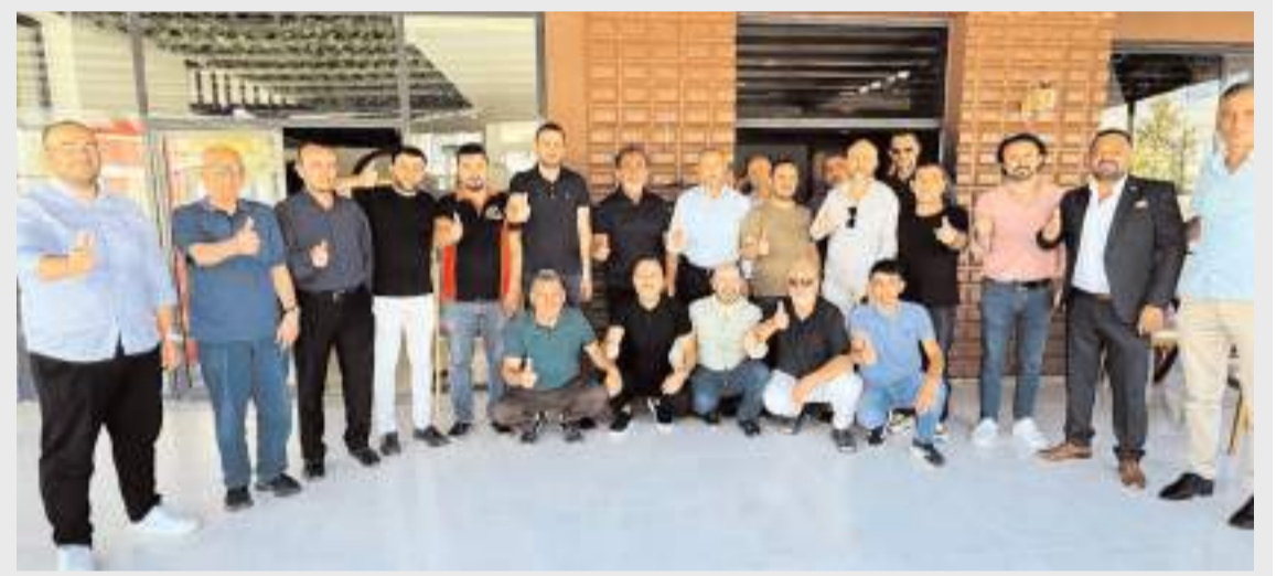
Yeniden Refah Partisi Genel Başkan Yardımcısı ve Kocaeli Milletvekili Mehmet Aşila da mazbatasını alan Nuri Kuşçu ve yönetimini ziyaret etti.

Yeniden Refah Partisi Genel Başkan Yardımcısı ve Kocaeli Milletvekili Mehmet Aşila da mazbatasını alan Nuri Kuşçu ve yönetimini ziyaret ederek hayırlı olsun dileklerini iletti.