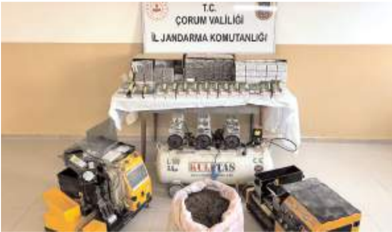
Operasyonda kaçak sigaralar ile üretiminde kullanılan makineler ele geçirildi.