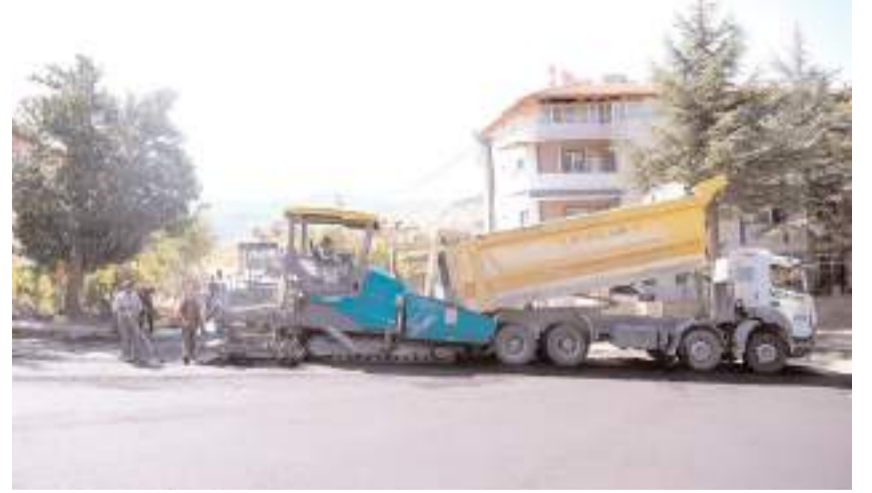
Çalışmalara Uğurludağ Belediyesi de kamyon desteği sağladı.