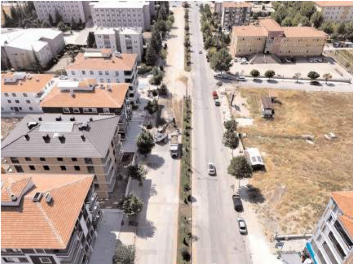
Belediye ekipleri Terminal Kavşağı'ndan Öğretmen Lisesi kavşağına kadar toplam 300 metre uzunluğunda yolu yeniliyor.