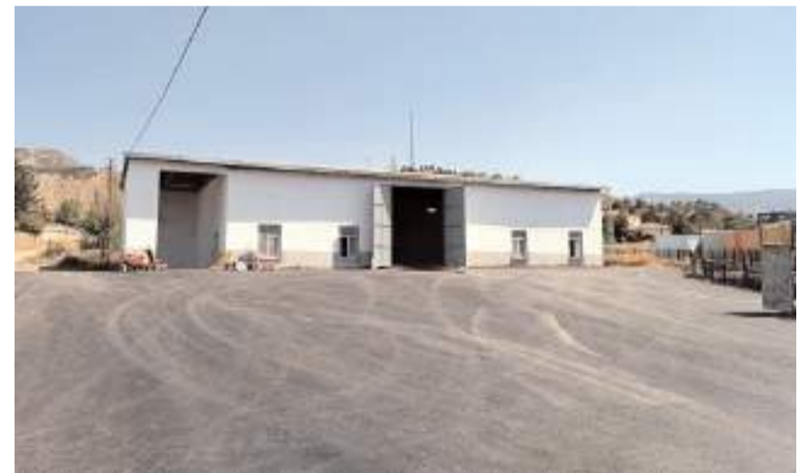
Tesis Uğurludağ Belediyesi ve Uğurludağ Ziraat Odası kurdu.

Torun, "Tesisin kurulmasındaki en büyük amacımız tarım alanında kaliteli elenmiş temiz tohum ihtiyacını karşılamak, tarımın bilinçli şekilde yapılmasını sağlamak ve üretkenliği artırmaktır. İnşaat aşaması tamamlanan tohum eleme tesisinin en kısa sürede makinelerinin kurulumu da yapılarak hizmete açılacak. Uğurludağ halkına hayırlara vesile olmasını temenni ederim." dedi.(AA)