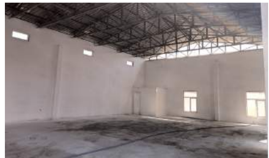
Tesisin inşasına Doğu Karadeniz Kalkınma Ajansında destek verdi.