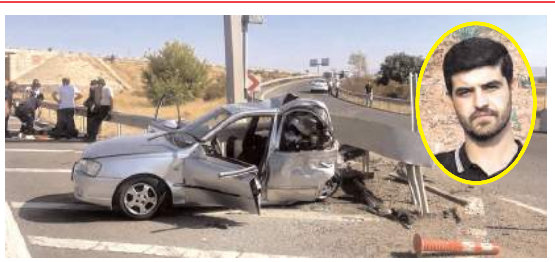
Kaza, Kırkkale-Çorum D200 kara yolunun 63'üncü kilometresinde meydana geldi.