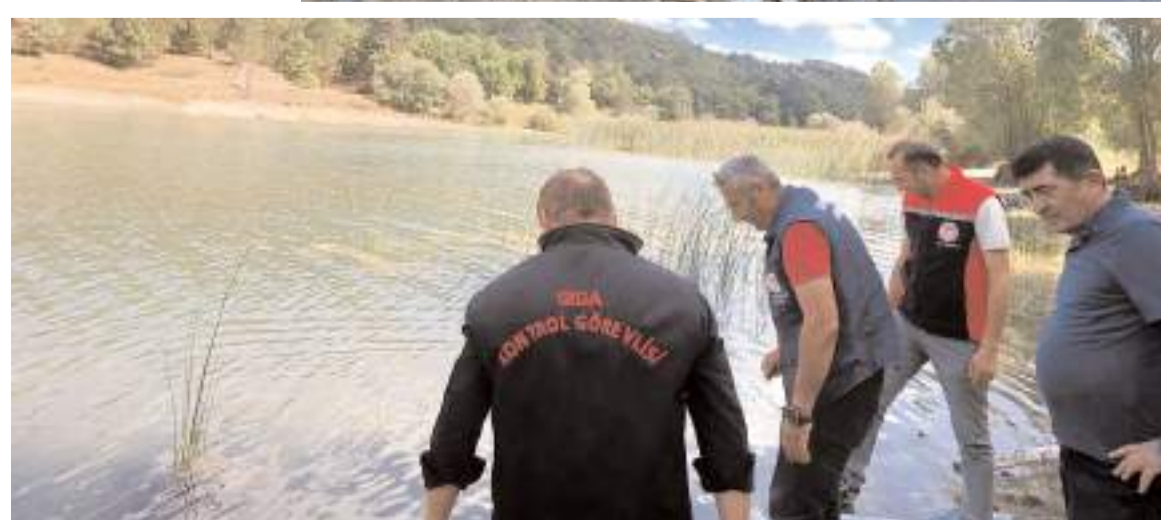
İlçelerde bulunan su kaynaklarına, toplam 281.000 adet yavru sazan balığı bırakıldı.