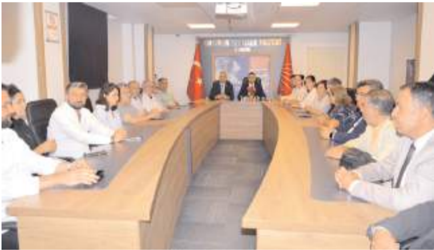
Basın toplantısında partililer hazır bulundu.