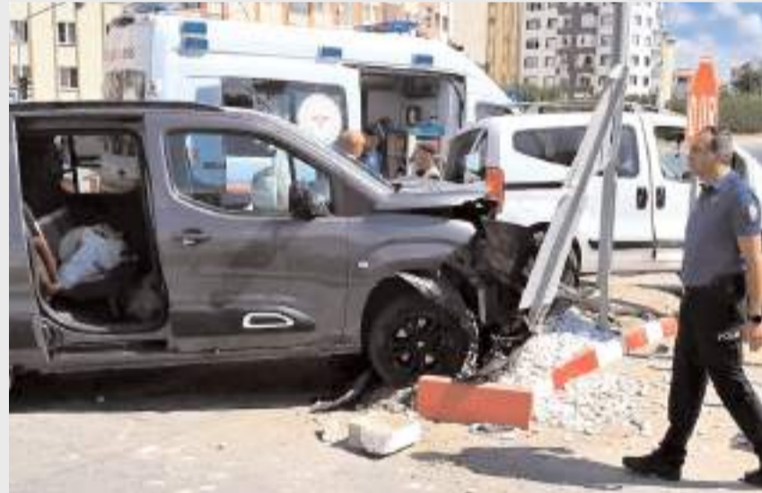
Kazada araçlarda ve trafik lambalarında maddi hasar meydana geldi.

Çorum-Sungurlu karayolundaki Taş Köprü Kavşağı'nda, trafik lambalarının çalışmadığı sırada üç aracın karıştığı zincirleme trafik kazası meydana geldi. Kazada 2 kişi yaralandı.