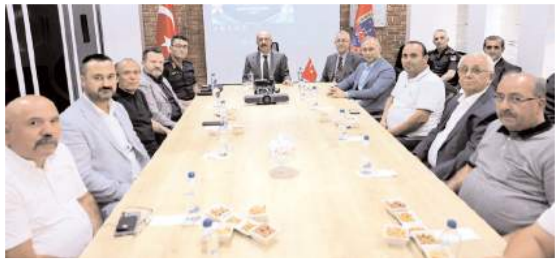
Jandarma Asayiş Vakfı Çorum İl Temsilciliği ilk yönetim kurulu toplantısını yaptı.