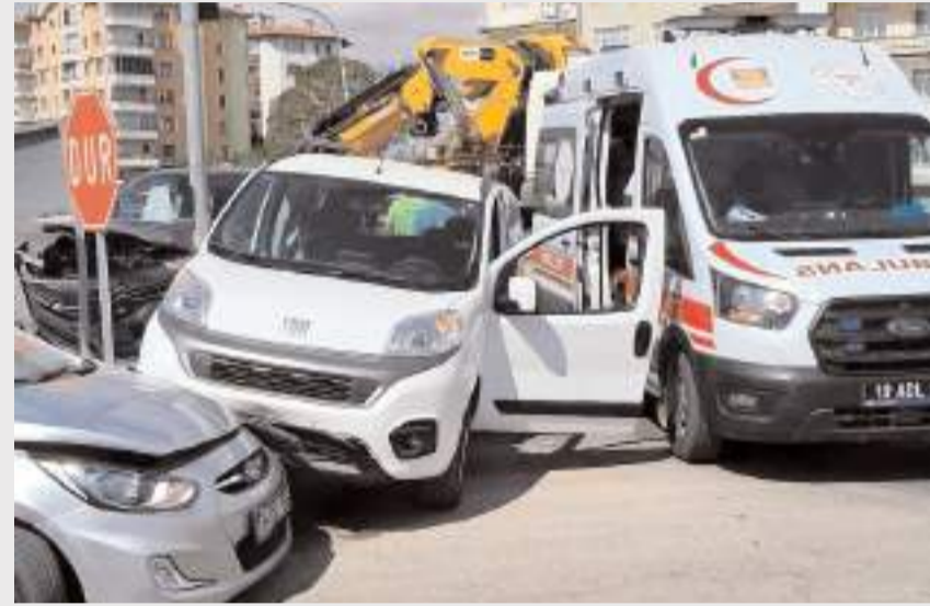
Yaralılar, sağlık ekiplerinin ilk müdahalesinin ardından hastaneye kaldırıldı.