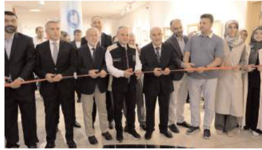
Sergi Çorum Belediyesi Sanat Galerisi ve Müzesi'nde açıldı.

Sergi 10 Eylül'e kadar gezilebilecek.(AA)