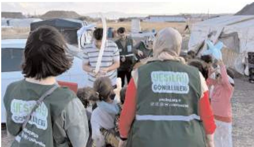
Yeşilay Çorum Şubesi, Mevlit Kandili nedeniyle tarım işçilerini ziyaret etti.

Ziyarette ayrıca, tarım işçilerinin çocuklarıyla çeşitli etkinlikler yapıldı.(AA)