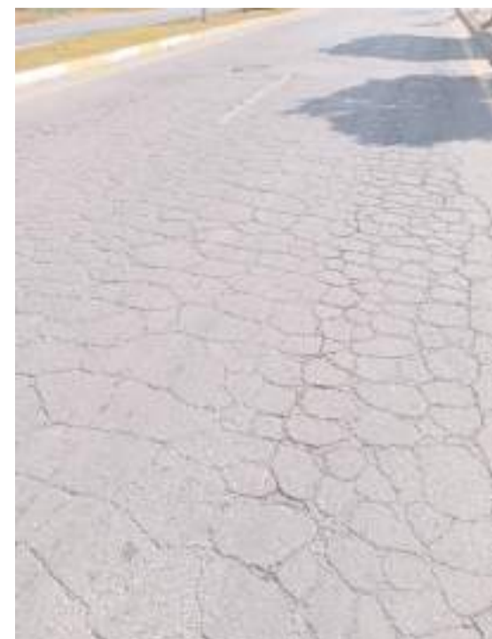
Akkent Caddesinde yolda meydana gelen bozulmalar trafik güvenliğini tehlikeye atıyor.

Mahallesinin çoğu bölgesinde hala 20 yıl önce TOKİ tarafından yaptırılan kaldırımların kullanıldığını ve buralarından geçen sürede bozulduğunu kaydeden Güler, "Mahalle sakinlerimiz bozuk kaldırımların yeniden yapılmasını ile ilgili taleplerini sürekli bizlere iletiyor. Bizde bu talepleri belediyeye defalarca bildirdik. Belediyeden ise bize 'sırası gelince yapılacak' şeklinde cevap veriyorlar. Ancak bu yıl şimdiye kadar hiçbir çalışma yapılmadı" ifadelerini kullandı.