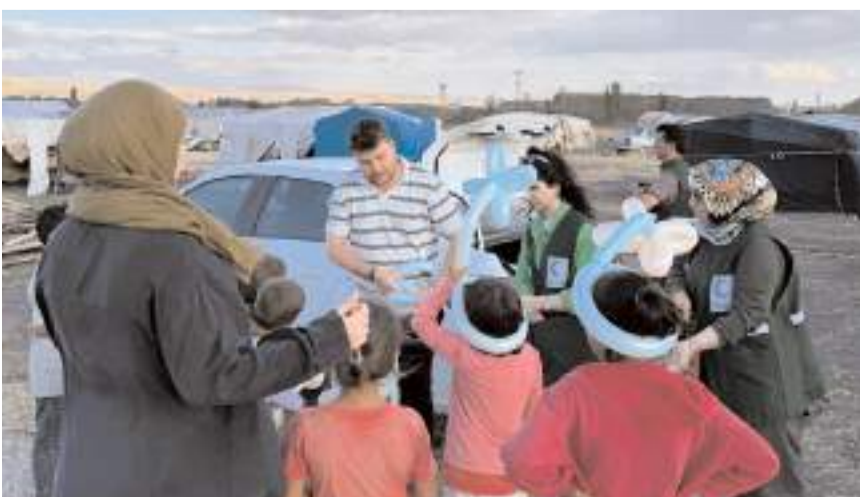
Ziyaretlerde çocuklara çeşitli hediyeler verildi.