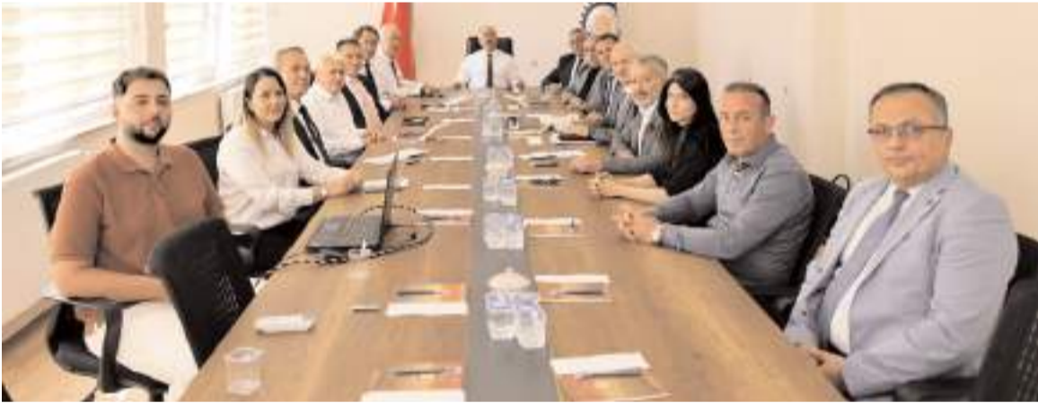
Toplantıda Çorum Mesleki Eğitim ve Sürekli Eğitim Merkezi Fizibilite Sunum Raporu ele alındı.