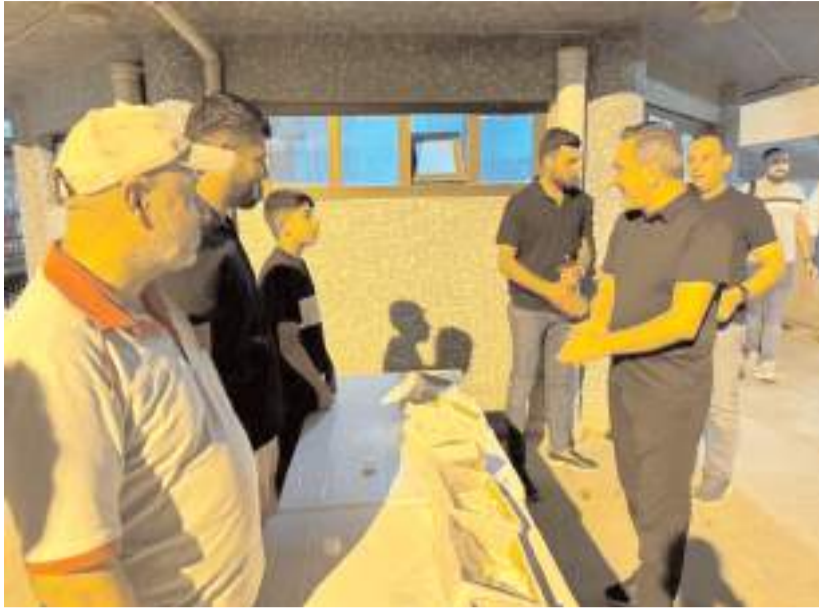
Sungurlu Belediyesi Mevlid Kandili sebebiyle cemaate lokum ikram etti.