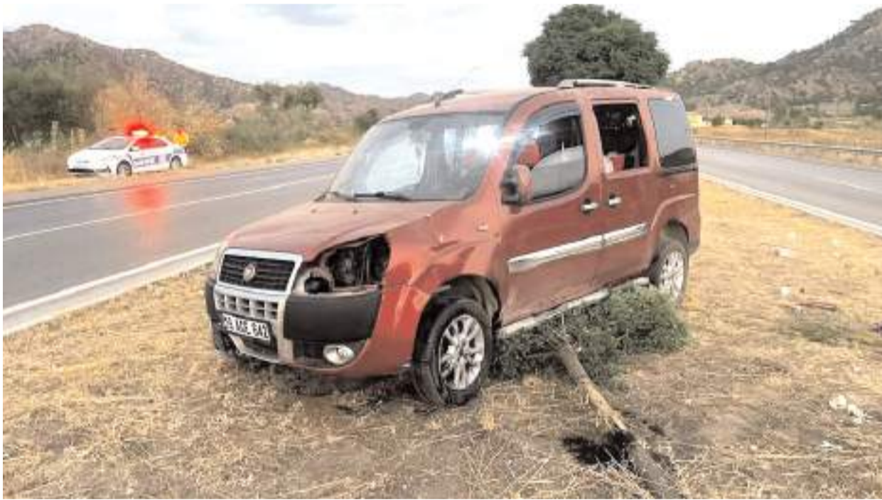
Ovacıksuyu köyü mevkiinde tatil dönüşü meydana gelen trafik kazasında bir çocuk yaralandı.

olan 13 yaşındaki çocuk, kazada hafif şekilde yaralandı. Yaralı çocuk olay yerine çağrılan sağlık ekipleri tarafından ilk müdahalesinin ardından hastaneye kaldırıldı. Diğer yolcuların sağlık durumlarının iyi olduğu öğrenildi.