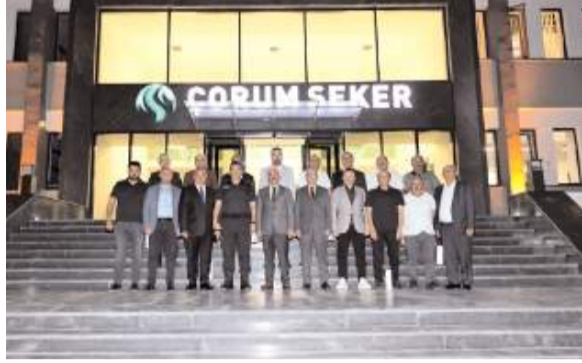
Toplantının ardından hatıra fotoğrafı çekildi.