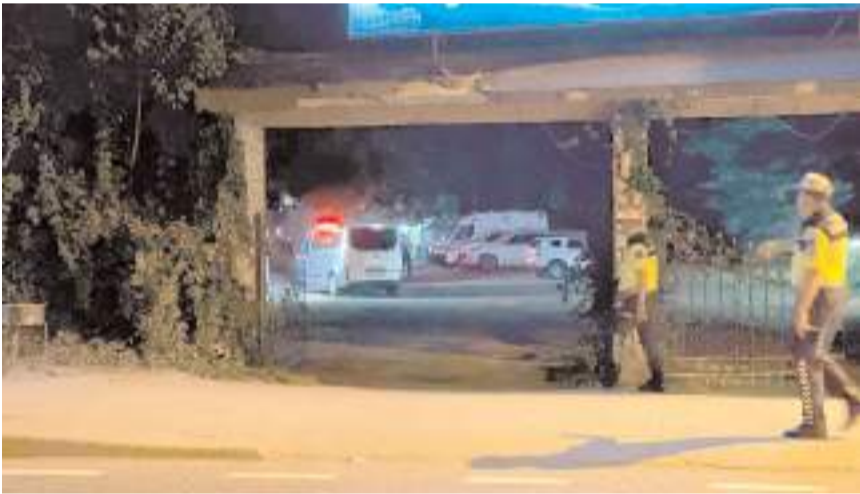
Olay Çekmeköy ilçesinin Ömerli Mahallesi'nde bir restoranda meydana geldi.