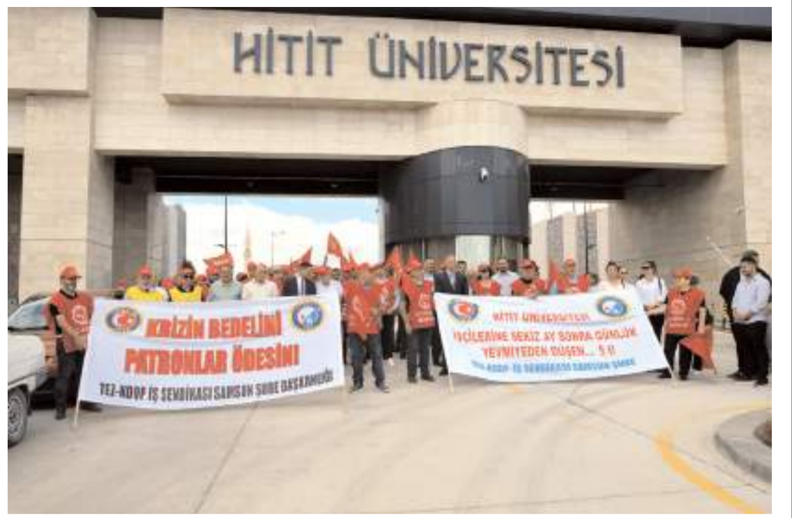
HİTÜ işçileri dün kampüs girişi önünde eylem yaptı.