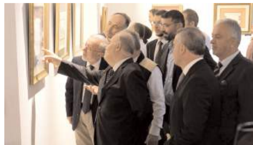
Davetliler sergiyi gezerek eserleri incelediler.