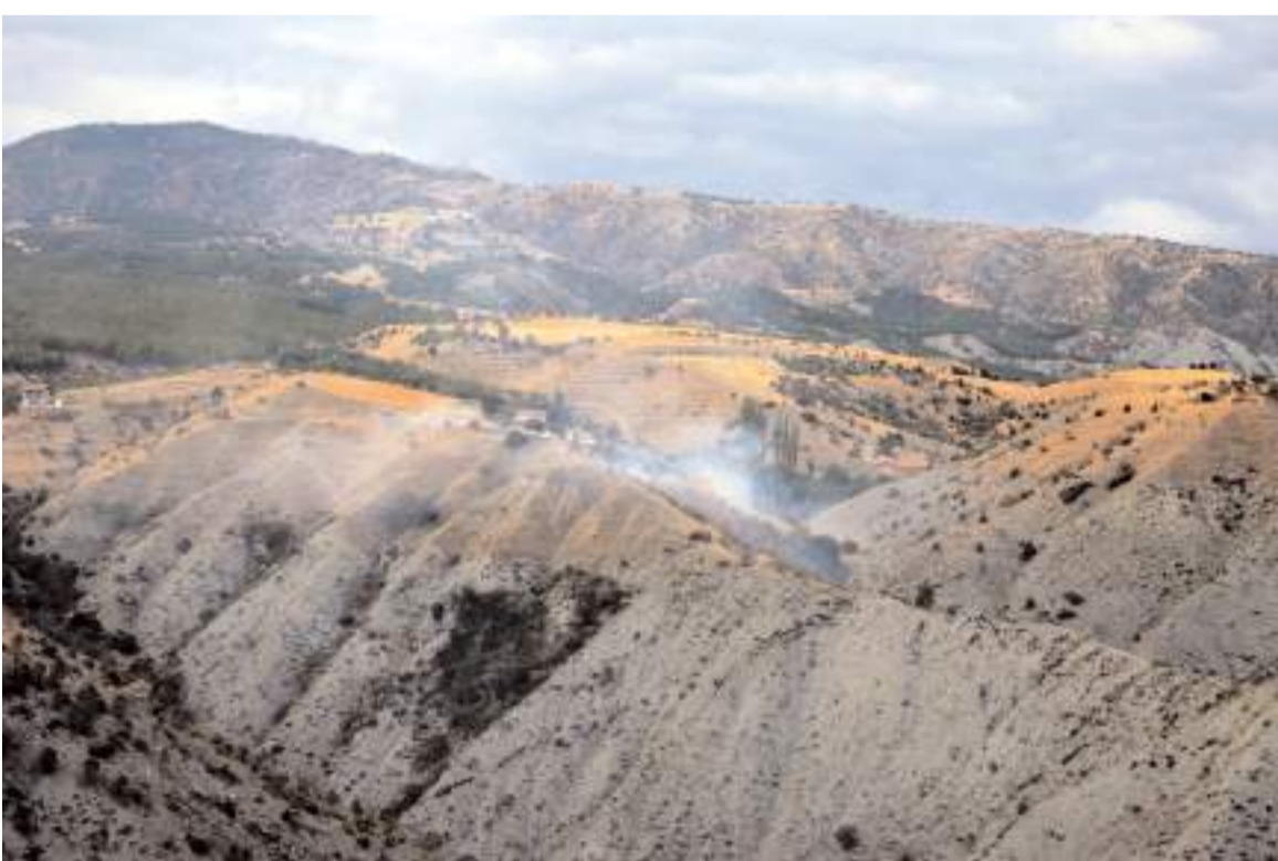
Yangın Dodurgada Çatar Mahallesi Karaağaç mevkiinde çıktı.

Emniyetteki işlemlerinin tamamlanmasının ardından adliyeye sevk edilen 2 şüpheli, çıkarıldıkları hakimlikçe tutuklandı.(AA)