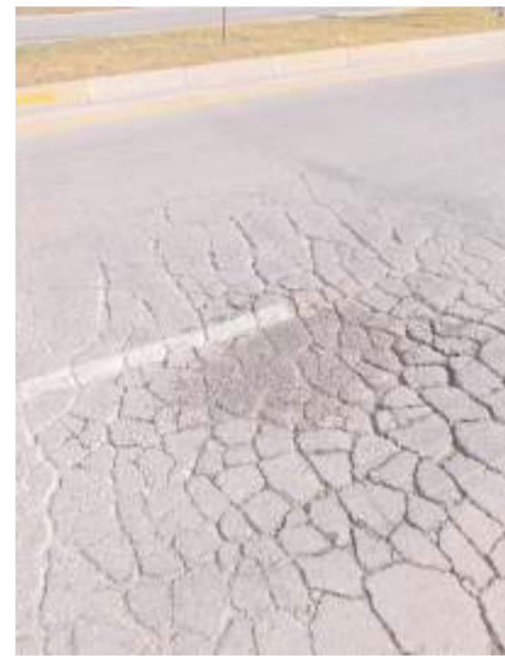
Akkent Caddesinin Burun Çiftliği Kavşağı ile Sevgi Evleri arasında kalan bölümünde yer yer bozulmalar olduğu dikkat çekiyor.

yönetim üreticinin ve köylünün yanında olduğunu kanıtlayamadı. 5 milyar dolarlık zararın hesabı hâlâ verilebilmiş değil. Bu tablo değişim ihtiyacını açıkça ortaya koymaktadır" diyerek açıklamasını tamamladı. (Haber Merkezi)