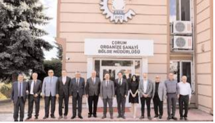
Toplantının ardından hatıra fotoğrafı çekildi.