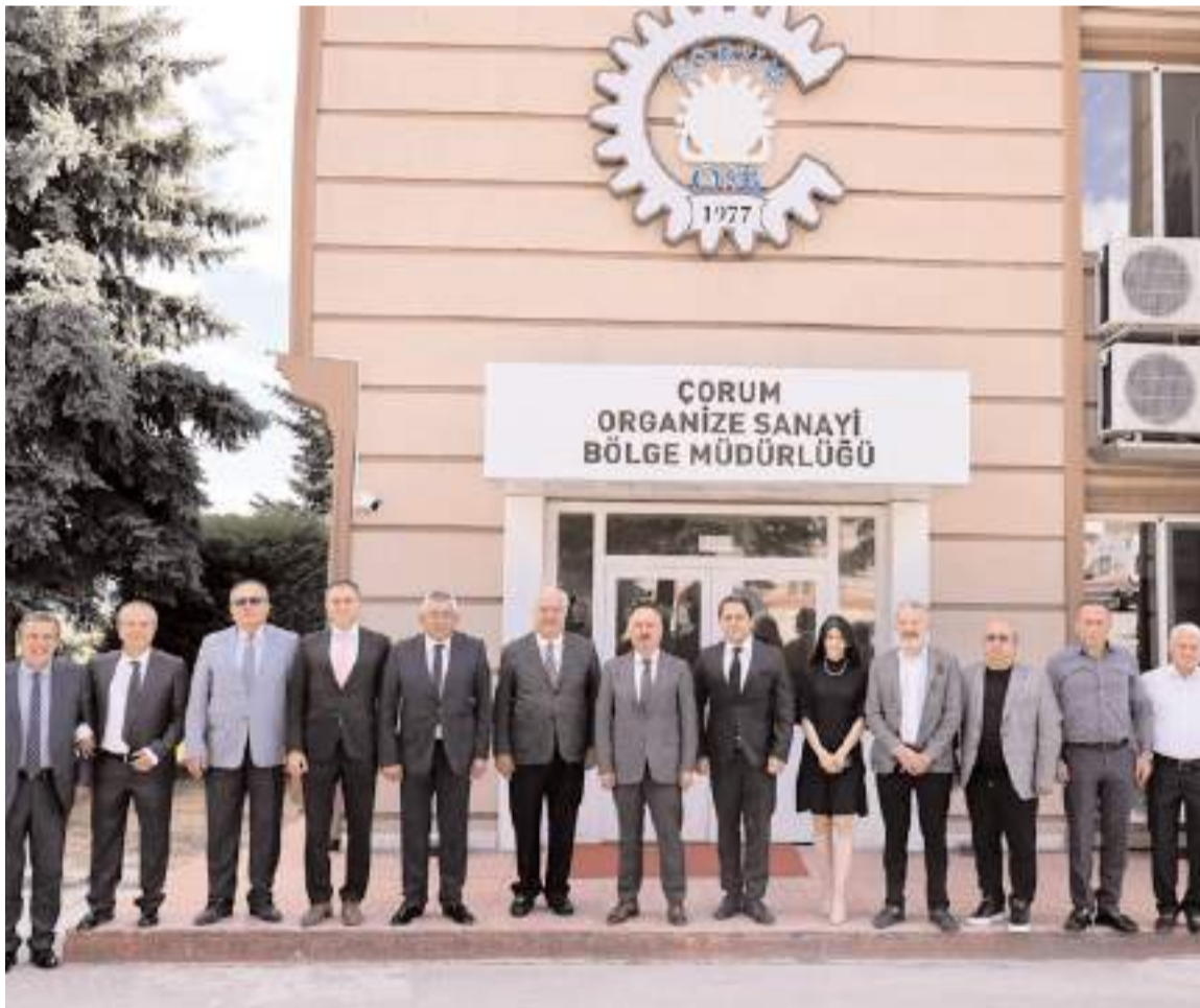
Toplantının ardından hatıra fotoğrafı çekildi.

■ Ankara Sanayi Odası 1. OSB heyeti ile Çorum OSB'de yapılan değerlendirme toplantısında konuşan Vali Ali Çalgan Çorum Mesleki Eğitim ve Sürekli Eğitim Merkezi Fizibilite Sunum Raporunun ele alındığını belirterek, "Hazırlanan fizibilite raporu sayesinde, sanayi ile eğitimi buluşturarak nitelikli iş gücümüzü artıracak ve kalkınmamızı hızlandıracaktır" dedi. * HABERİ4'TE