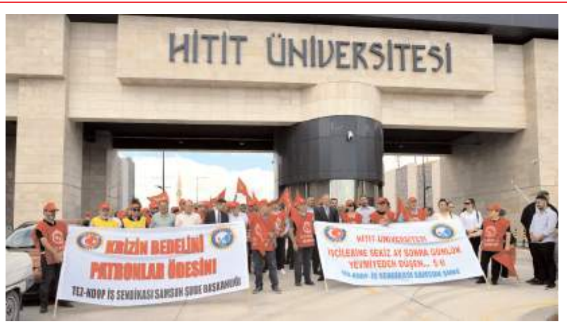
HİTÜ işçileri dün kampüs girişi önünde eylem yaptı.

■ Bir dönem Çorum'da Cumhuriyet Savcısı olarak görev yapan Çağlayan Adliyesi'nde görevli 58 yaşındaki Cumhuriyet Savcısı Ercan Kayhan saldırıda hayatını kaybetti. * HABERİ5'TE