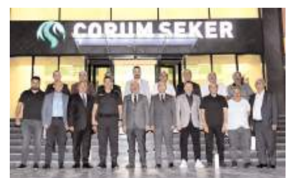
Toplantının ardından hatıra fotoğrafı çekildi.