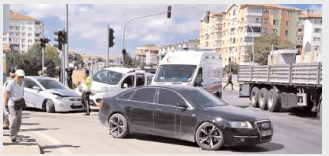
Kaza Taş Köprü Kavşağı'nda meydana geldi.

Dodurga Belediyesi itfaiye ekiplerinin müdahalesiyle söndürülen yangında yaklaşık 10 dekar ağaçlık alan zarar gördü.(AA)