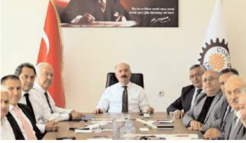
Toplantı Vali Ali Çalgan'ın başkanlığında yapıldı.