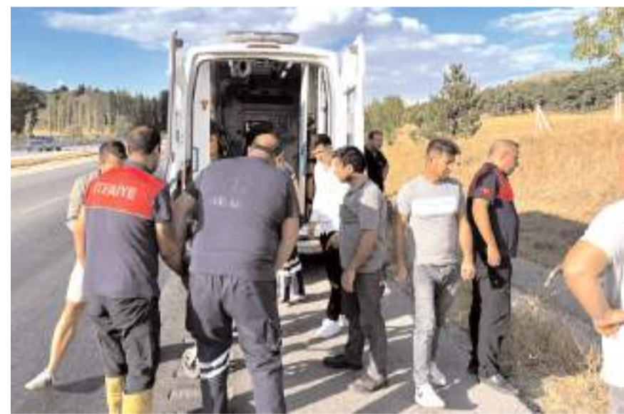
Yaralılar, olay yerinde yapılan ilk müdahalenin ardından Sungurlu Devlet Hastanesi'ne kaldırıldı.

Yaralılar, ambulanslarla Sungurlu Devlet Hastanesi'ne kaldırıldı.