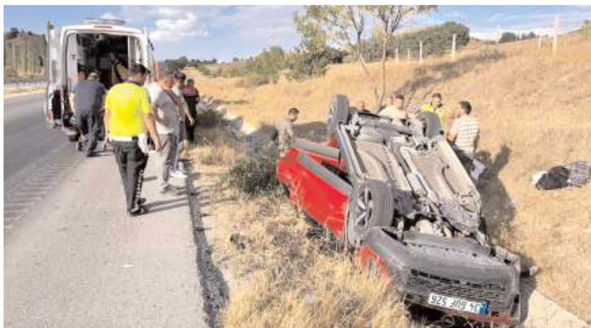
Kaza Çorum-Sungurlu kara yolu Arifegazili köyü yakınlarında meydana geldi.