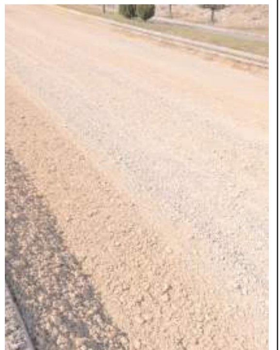
Akkent 1. Caddede yol onarım çalışmaları bitirilmeyi bekliyor.