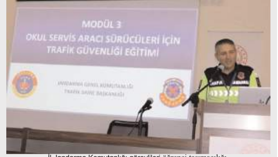
İl Jandarma Komutanlığı görevlileri öğrenci taşımacılığı, yeni dönemde aranacak hususlar hakkında bilgi verdi.