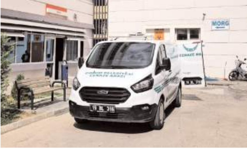
Sezer Şahin'in cenazesi Erol Olçok Eğitim ve Araştırma Hastanesi morguna kaldırıldı.

Çorum'da tır şoförü, park halindeki aracında ölü bulundu.