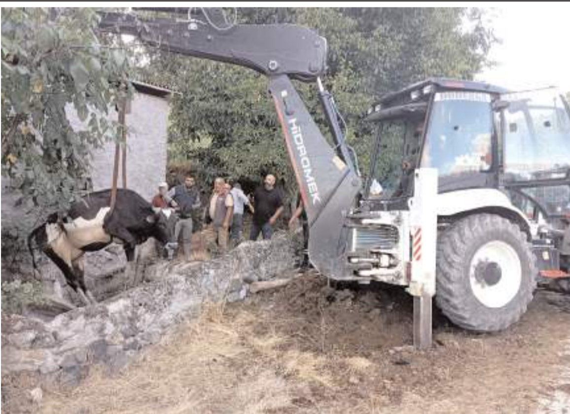
Su kuyusuna düşen inek kepçe yardımıyla kurtarıldı.

Karadağ için 17 Eylül tarihinde Uludağ Üniversitesi'nde emeklilik töreni düzenlenecek.