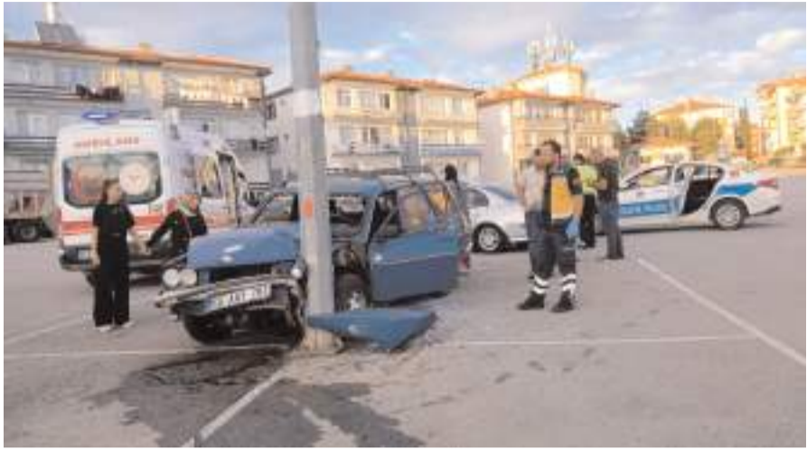
Kaza Cumartesi Pazarı içinde meydana geldi.