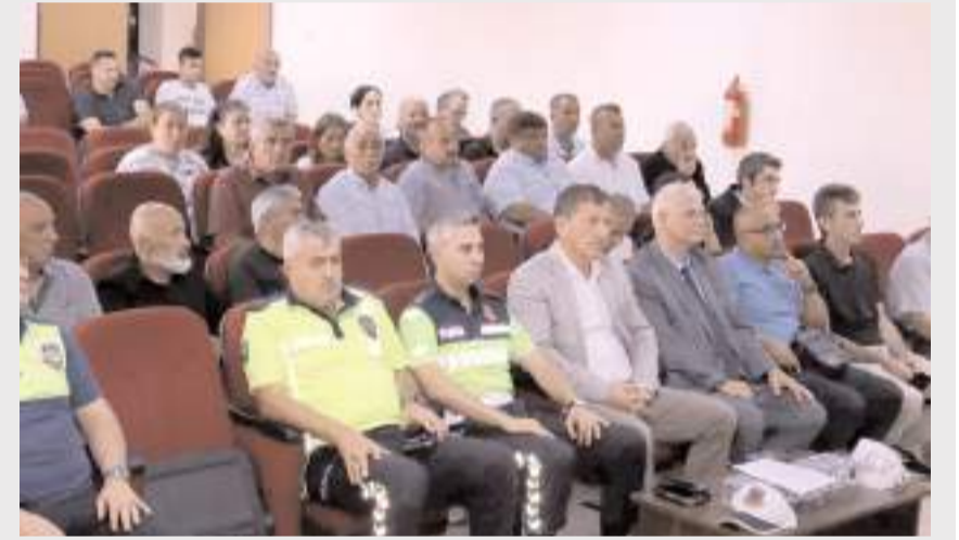
Seminere, okul servis aracı sürücülerini ve okul idarecileri katıldı.