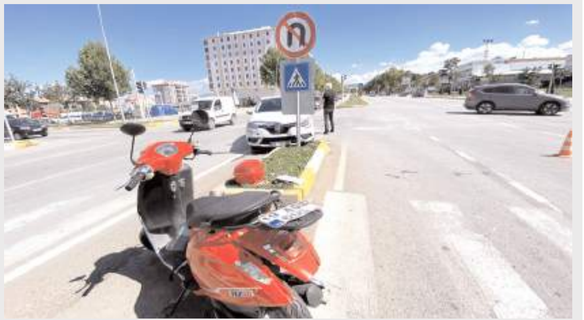
Kaza, İnönü Caddesi'nde meydana geldi.