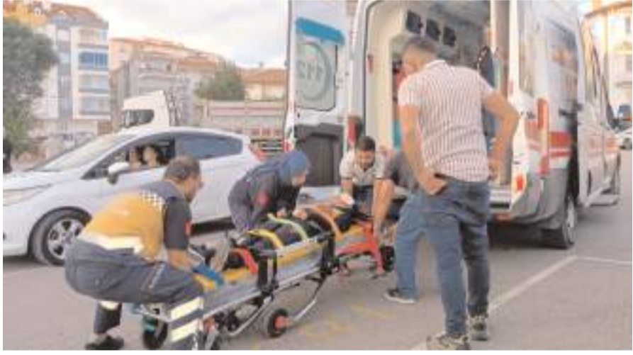
Yaralılar hastanede tedavi altına alındı.

Çorum'da aydınlatma direğine çarpan otomobildeki biri çocuk 2 kişi yaralandı.