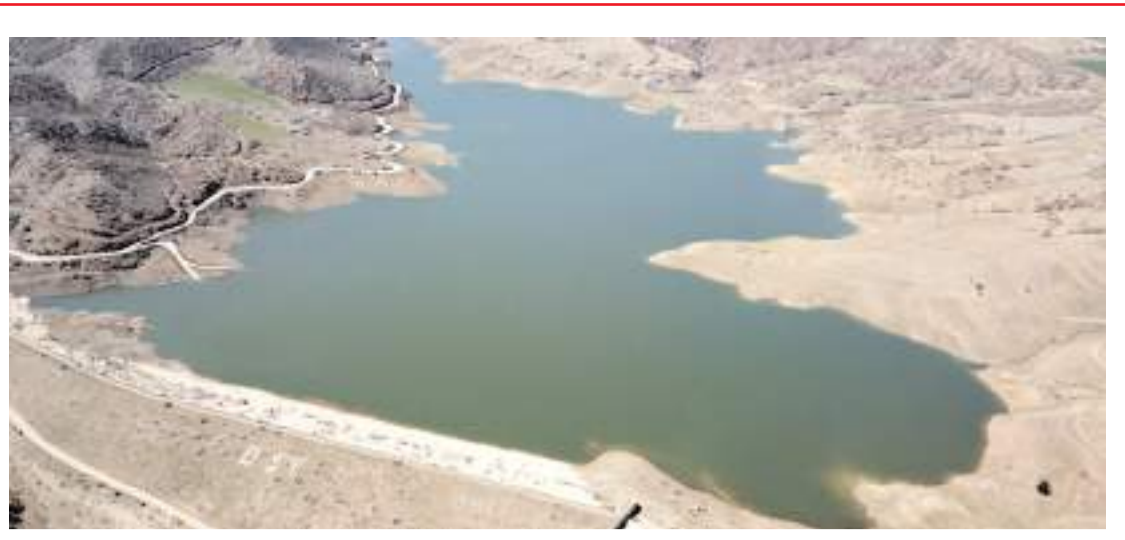
Proje kapsamında Yeni hayat ve Hatap barajlarından su alma sistemleri yenilenecek.

■ AK Parti Çorum Milletvekili Av. Yusuf Ahlatcı, Sanayi ve Teknoloji Bakanlığının hazırladığı Yerel Kalkınma Hamlesi Programı Tebliği'nde değişiklik yapıldığını belirterek, düzenlemenin Çorum sanayisine önemli katkılar sağlayacağını söyledi. * HABERİ8'DE