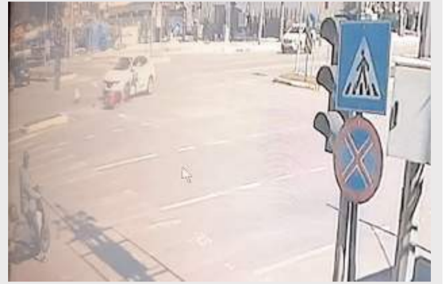
Kazada bir iş yerinin güvenlik kamerasına yansdı.

Polis ekipleri kazayla ilgili inceleme başlatırken, kaza anı bir iş yerinin güvenlik kamerasına yansdı. Görüntülerde motosiklet ve otomobilin aynı istikamette seyir halinde olduğu görülüyor. Otomobil kavşaktan dönüş yapmak isteyen motosiklete arkadan çarpıyor. Çarpmanın etkisiyle düşen motosiklet sürücüsü yerde sürükleniyor.(İHA)