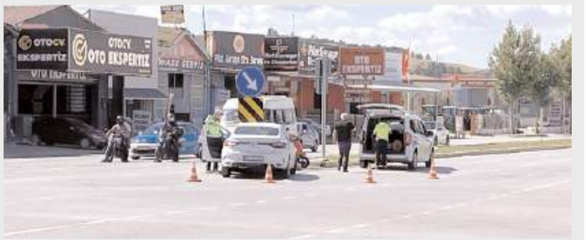
Kaza nedeniyle polis ekipleri olay yerinde inceleme yaptı.