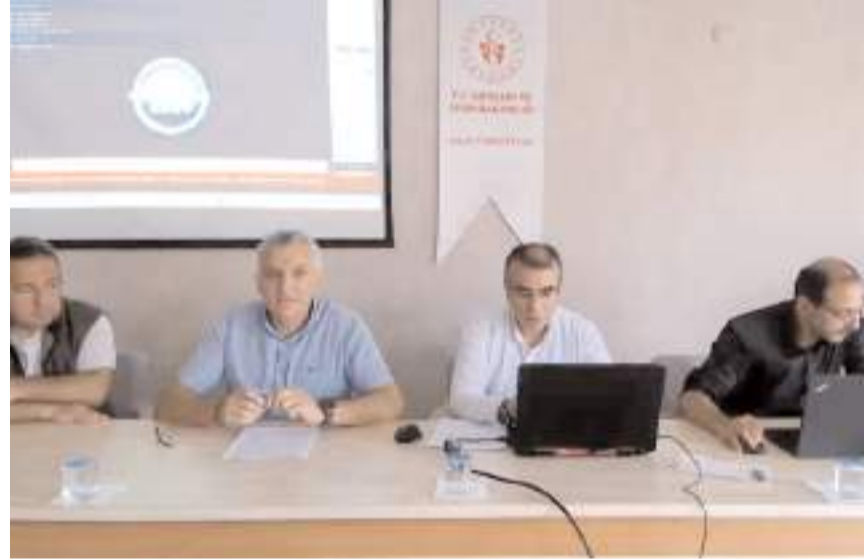
TYP kapsamında görev yapacak personel kurayla belirlendi.

İsmi çıkan vatandaşlar Gençlik ve Spor İl Müdürlüğü'ne giderek, gerekli evrakları tamamlandıktan sonra işe başlayacak. (Haber Merkezi)