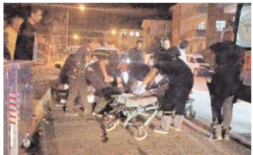
Olay, akşam saatlerinde Yavruturna Mahallesi Emek Caddesi'nde meydana geldi.

Olay, akşam saatlerinde Yavruturna Mahallesi Emek Caddesi'nde meydana geldi. Edinilen bilgiye göre, kimliği henüz belirlenemeyen bir şahıs, araçla caddede gelerek E.Y.'ye (50) tüfikle ateş açtı. Bacaklarına isabet eden saçmalarla yaralanan şahıs, sağlık ekiplerince Hitit Üniversitesi Erol Olçok Eğitim ve Araştırma Hastanesi'ne kaldırıldı. Saldırının ardından şüpheli, araçla olay yerinden kaçarak kayıplara karıştı. Polis ekiplerince olay yerinde inceleme yapıldı. Şüphelinin yakalanması için çalışmalar sürüyor.(İHA)