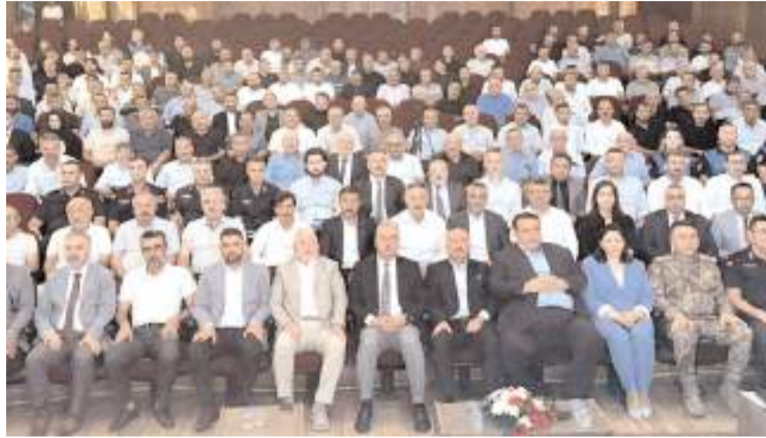
Toplantı Devlet Tiyatro Salonunda yapıldı.