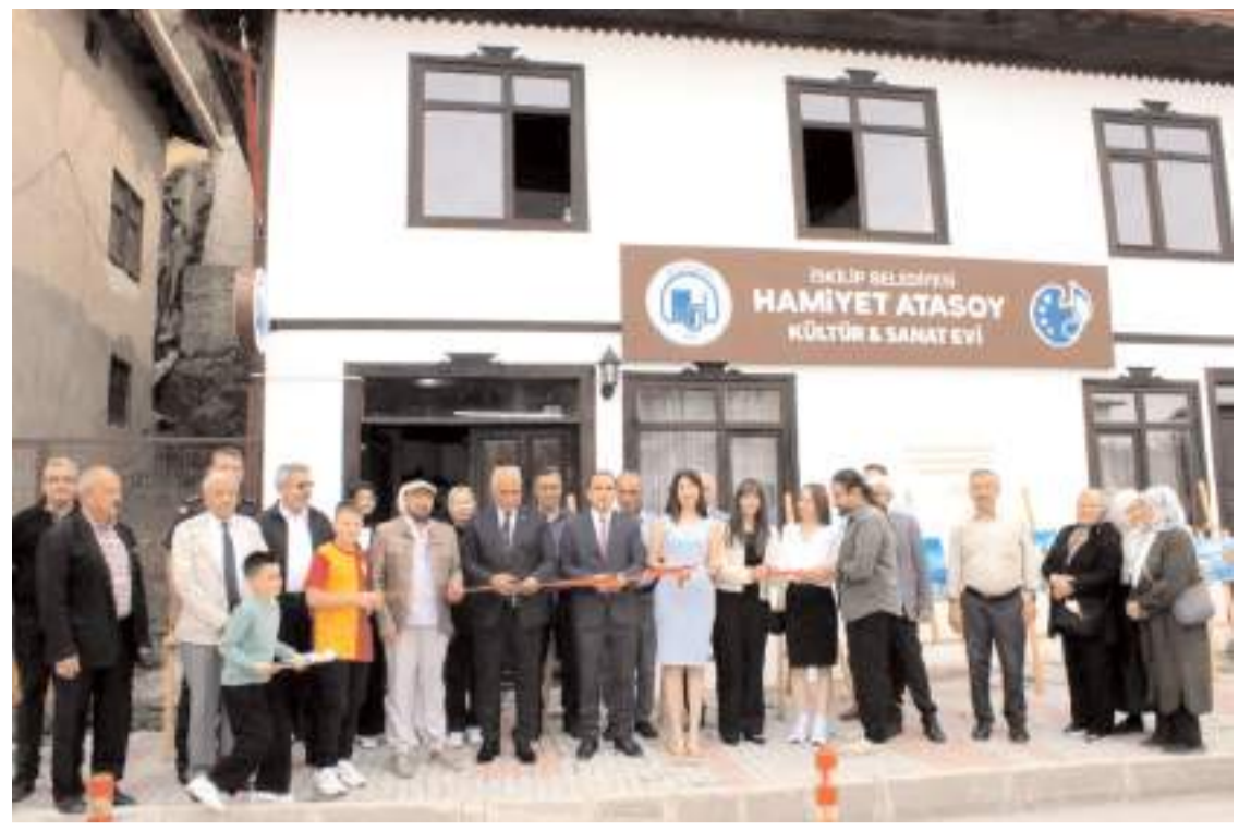
Serginin açılış kurdelesini ilçe protokolü kesti.

İhbar üzerine gelen ekipler, halat bağladıkları ineği kepçe yardımı ile kuyudan çıkardı.(AA)