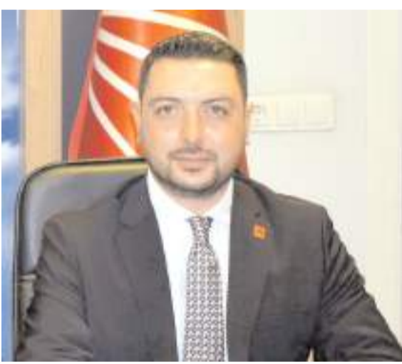
Av. Utku Ulaş Taşar