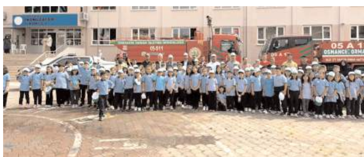
Programın sonunda toplu hatıra fotoğrafı çekildi.