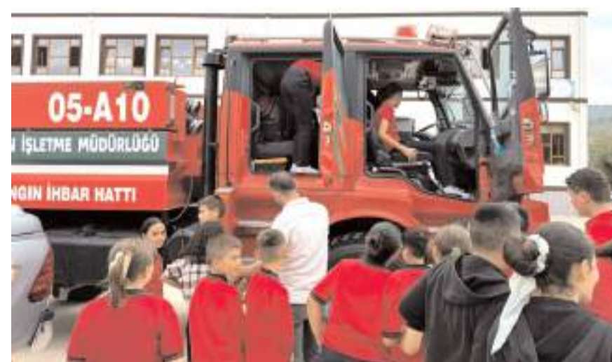
Öğrenciler ormancılardan kullandıkları araçları inceledi.