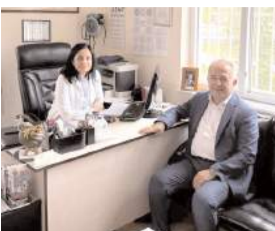
Ziyaretlerde, aile hekimlerinin halk sağlığı açısından taşıdığı kritik öneme vurgu yapıldı.

siyle Aile Sağlığı Merkezi çalışanlarına özveriyle hizmetlerinden dolayı teşekkür etti. (Haber Merkezi)