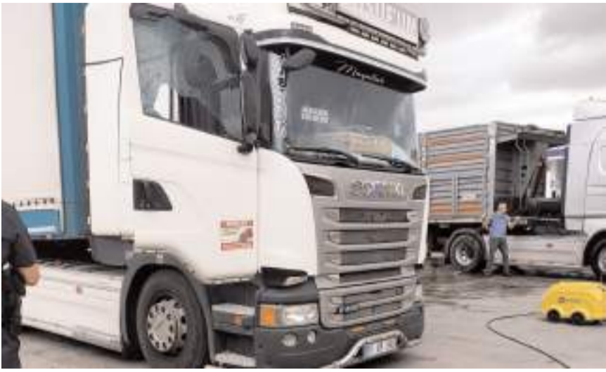
Olay Elvançelesi Köprüsü yakınındaki bir akaryakıt istasyonunda meydana geldi.