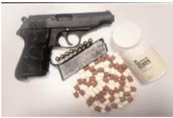
Uygulamalarda 8 adet ateşli silah ele geçirildi.