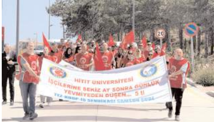
İşçiler bir süredir üniversite bahçesinde eylem yapıyorlardı.

■ Tez-Koop-İş sendikası ile Hitit Üniversitesi arasında yürütülen Toplu İş sözleşmesi görüşmelerinde anlaşma sağlandı.