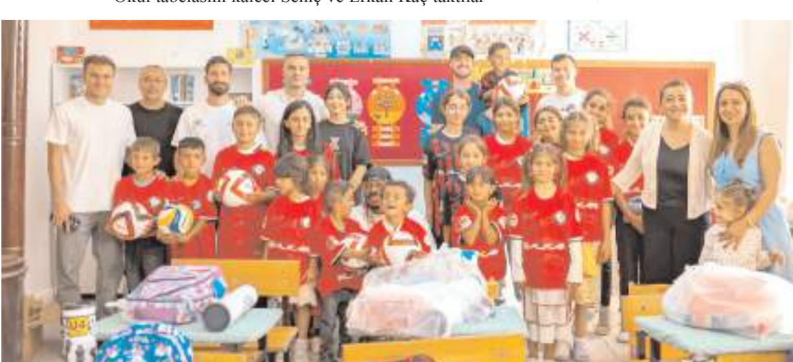
Arca Çorum FK formalarını giyen öğrenciler mutlu bir günü geride bıraktılar