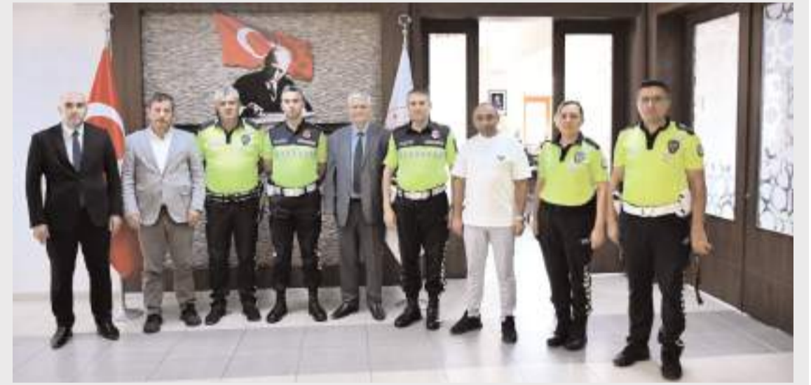
Programın ardından hatıra fotoğrafı çekildi.