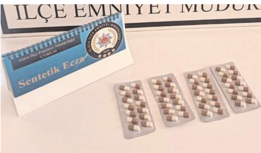
Şüphelilerde yapılan aramada 56 sentetik ecza hapı bulundu.