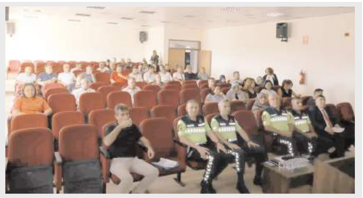
Seminer Milli Eğitim Müdürlüğü konferans salonunda yapıldı.