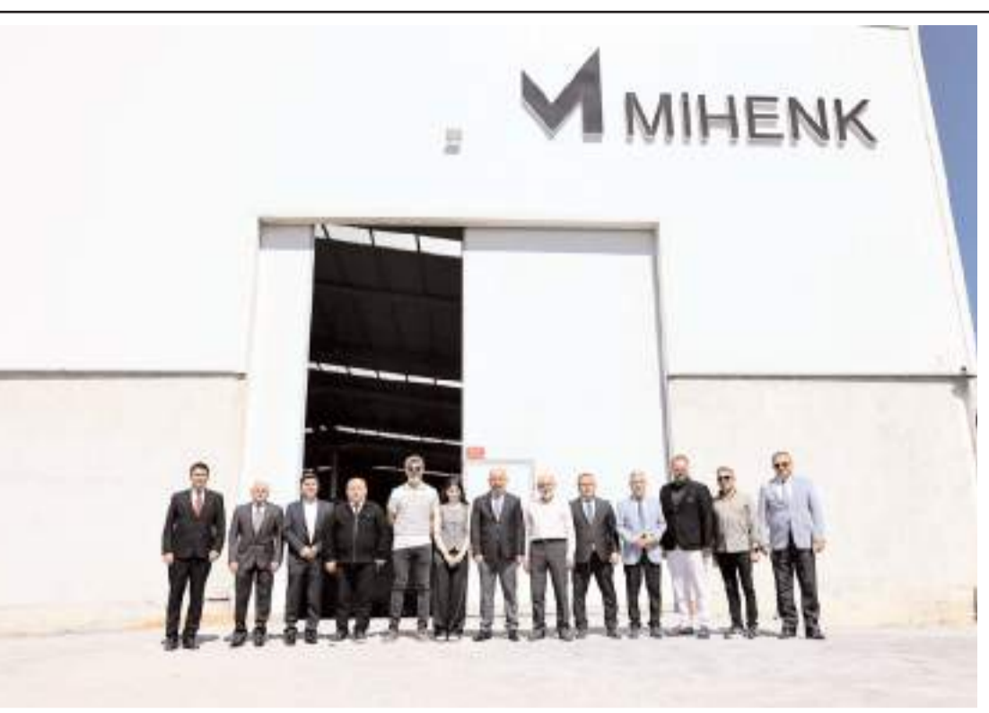
Ziyaretin anısına toplu fotoğraf çekildi.