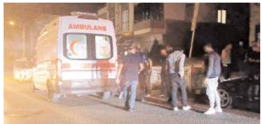
Yaralı şahıs sağlık ekiplerince hastaneye kaldırıldı.