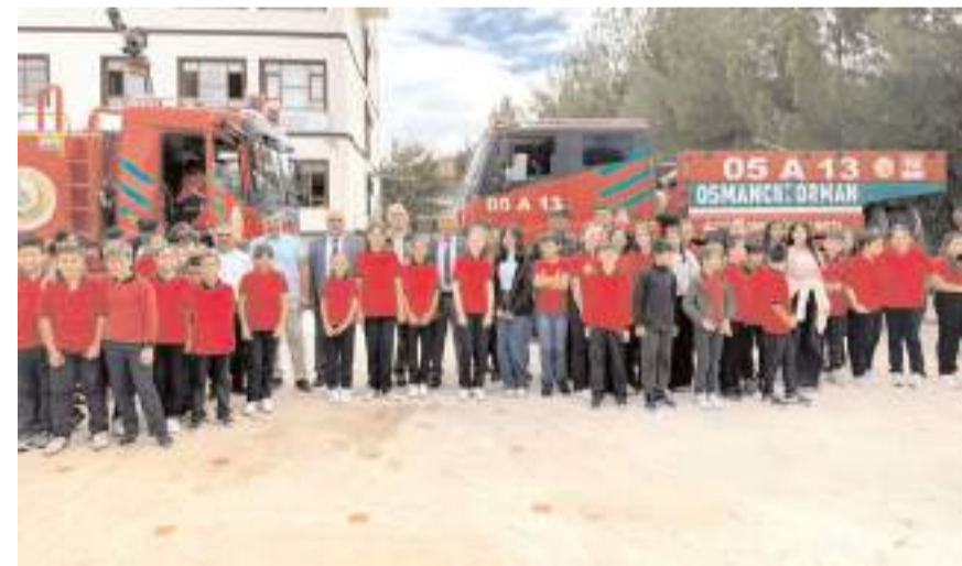
Öğrenciler İlçe Orman İşletme Müdürlüğünü ziyaret ettiler.

Orman Genel Müdürlüğü ile Milli Eğitim Bakanlığı arasında imzalanan protokol çerçevesinde öğrencilere yönelik "İlk Ders Yeşil Vatan" etkinliği düzenlendi. İlçe Orman İşletme Müdürlüğü ekipleri öğrencilere, doğa sevgisi, orman bilinci ve orman yangınlarına karşı farkındalığı artırmayı amaçlayan eğitimler verdi. Osmancık Nenehatun Ortaokulu ve İnönü Zaferi İlkokul öğrencilerine yönelik gerçekleştirilen eğitimlerde, yangınla mücadelede kullanılan ekipmanların tanıtımı, güvenli müdahale teknikleri, operasyonel görev paylaşımı, saha koordinasyonu ve kurumlar arası iletişim gibi konular uygulamalı olarak anlatıldı.(İHA)