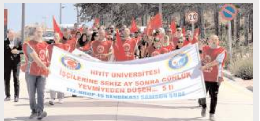
İşçiler bir süredir üniversite bahçesinde eylem yapıyorlardı.