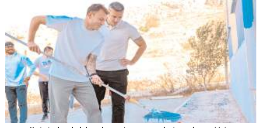
Futbolcular okul duvarlarının boyanmasında da yardımcı oldular