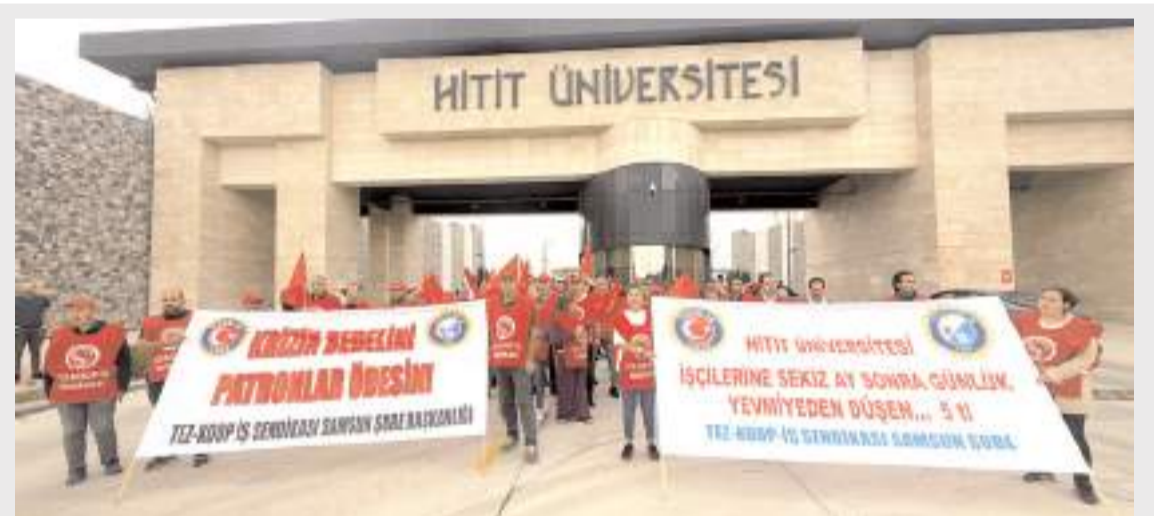
Tez-Koop-İş ile Hitit Üniversitesi arasında yürütülen Toplu İş sözleşmesi görüşmelerinde anlaşma sağlandı.

Fen Edebiyat Fakültesi Tarih Bölümü’ne 1