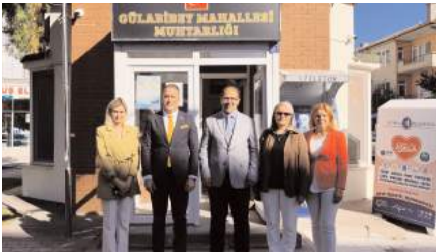
Ziyaretin anısına hatıra fotoğrafı çekildi.