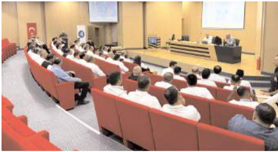
Programda ilk olarak teorik eğitim verildi.