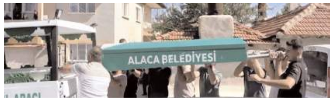
Olay, Alaca ilçesi Cengizhan Mahallesi İstiklal Sokak'ta meydana geldi.