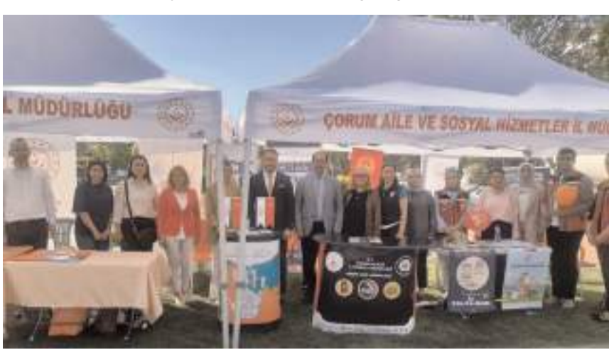
Kadına Yönelik Şiddetle Mücadelede Mahalle Buluşmaları” etkinliğinin ikincisi Gülabibey Mahallesi'nde gerçekleştirildi.