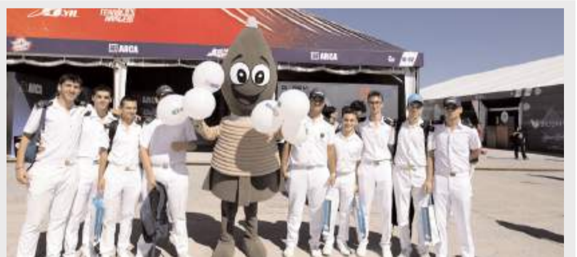
ARCA Savunma, dünyanın en büyük Havacılık, Uzay ve Teknoloji Festivali TEKNOFEST 2025'in Elmas Sponsoru oldu.