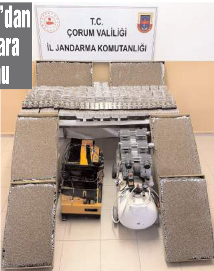
Aramalarda, 56 bin 980 adet doldurulmuş makaron, bir adet sigara dolum makinesi ve bir adet hava kompresörü ele geçirildi.

İki şüpheli, İlçe Jandarma Komutanlığı ekiplerince gözaltına alındı.(AA)