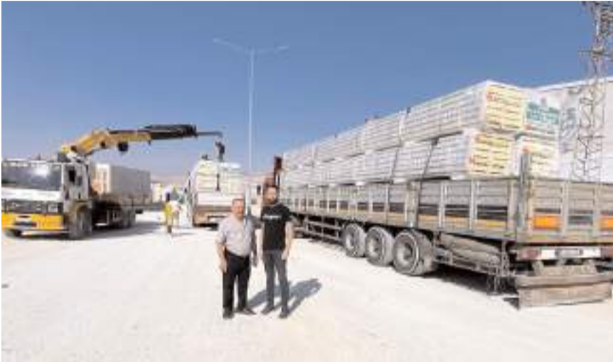
Zanaatkarlar Küçük Sanayi Sitesi'nde hummalı bir çalışma yürütülüyor.