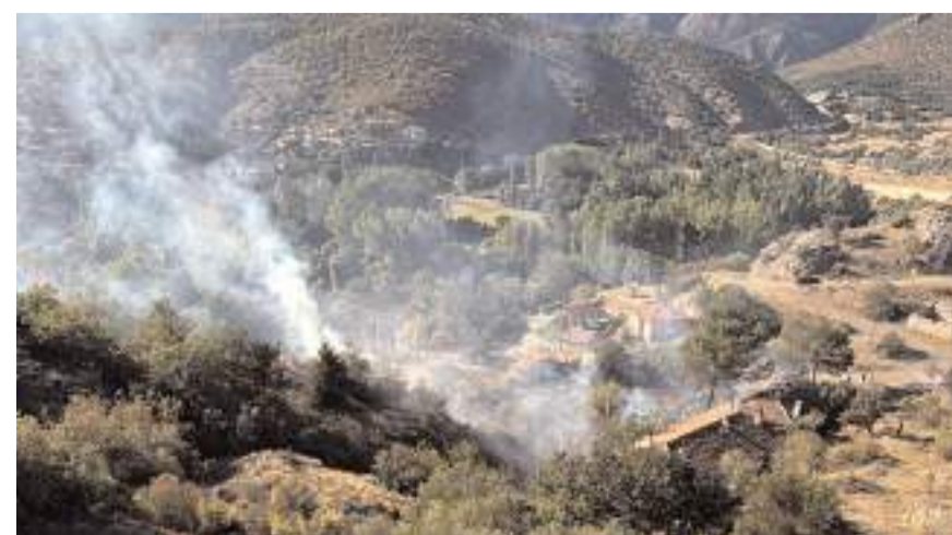
Yangın İlçeye bağlı Pelitözü köyü mevkinde çıktı.

İtfaiye ekipleri, yerleşim yerlerine yakın bölgedeki yangını büyümeden kontrol altına alarak söndürdü.(AA)