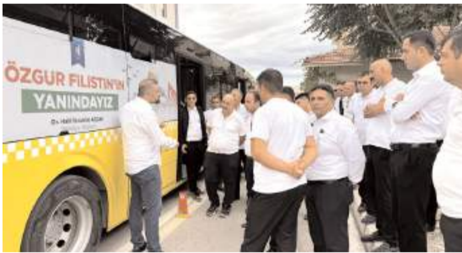
Uzmanlar otobüsler hakkında şoförlere uygulamalı olarak eğitim verdi.