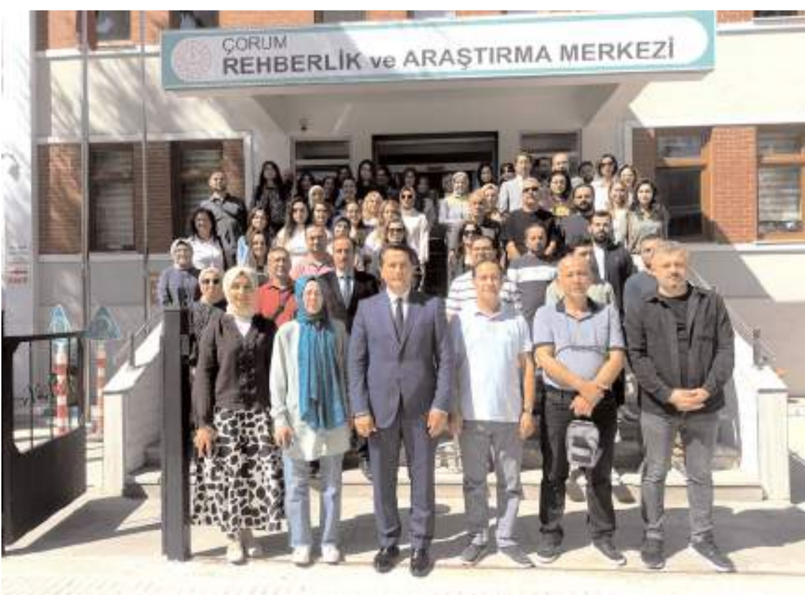
Toplantının ardından hatıra fotoğrafı çekildi.

yal Koruma, Önleme ve Krize Müdahale Ekibi toplantılarının eksiksiz bir şekilde yapılması, Okul Risk Haritaları ile RİBA çalışmalarının bakanlık takvimine uygun şekilde yapılması."