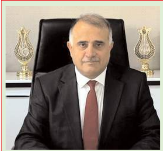
AK Parti İl Başkanı Av. Yakup Alar