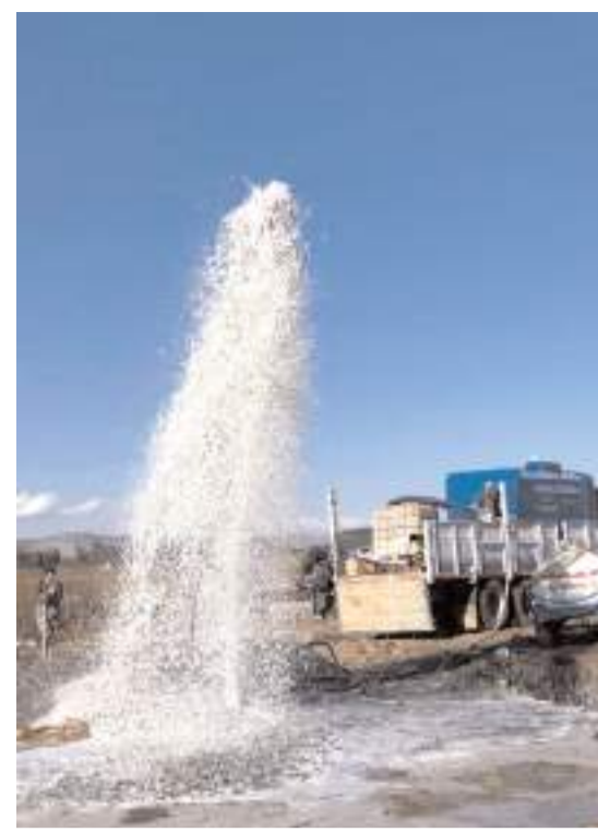
İl Özel İdaresinin su arama çalışmaları sonuç verdi.

Cemil Çağlar, emeği geçen tüm öğretmenlere ve öğrencilere teşekkür etti.