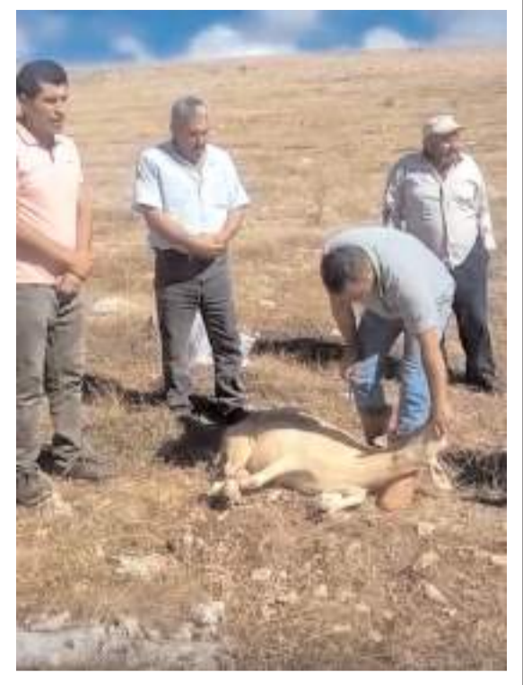
Suyun bulunması nedeniyle kurban kesildi.