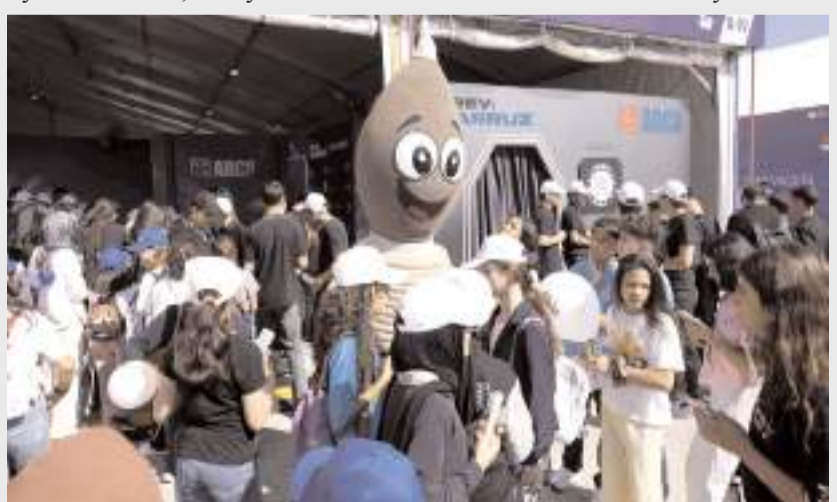
ARCA Savunma'nın standı, ziyaretçilerden büyük ilgi gördü.