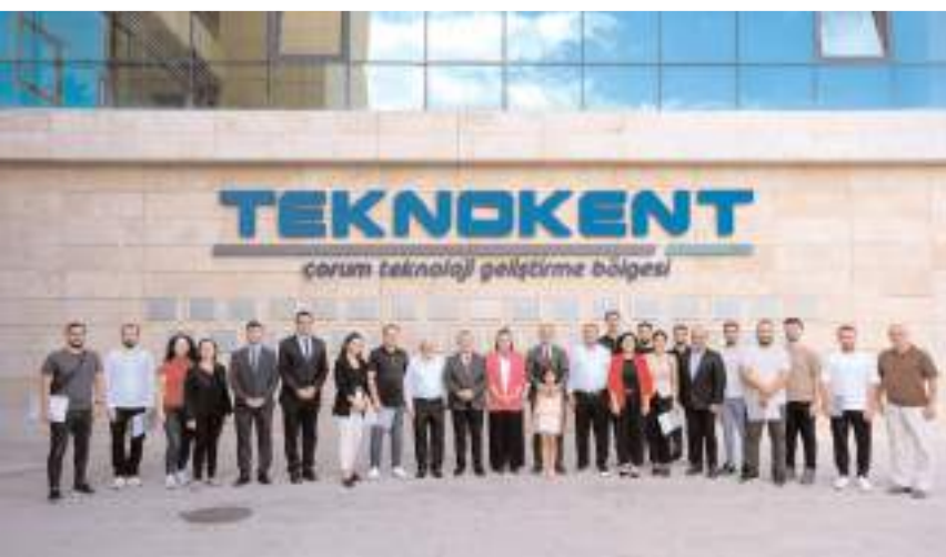
Sertifika töreninin ardından toplu hatıra fotoğrafı çekildi.