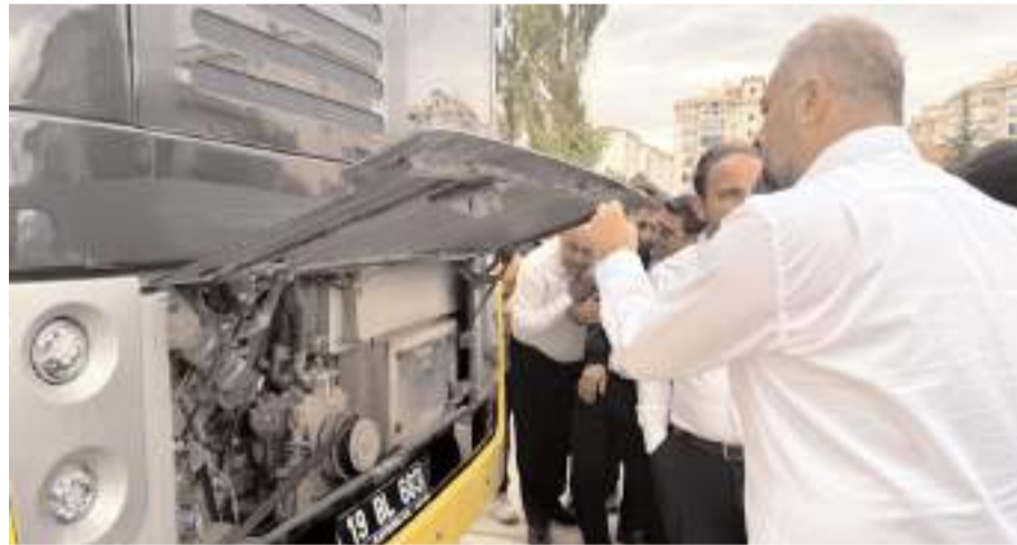
Şoförlere BMC araçların kullanımı ve kontrollerinin nasıl yapılması gerektiğini anlattı.