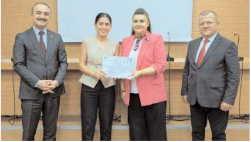
Eğitim programının tamamlanmasının ardından, Çorum Teknokent'te düzenlenen programda, katılımcılara sertifikaları verildi.