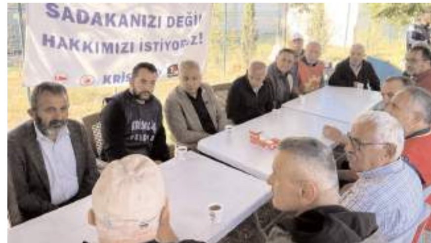
İşçilerin grevine EMEP Çorum Teşkilatı da destek verdi.

çilerle dayanışma içerisinde olacağını söyledi. (Haber Merkezi)