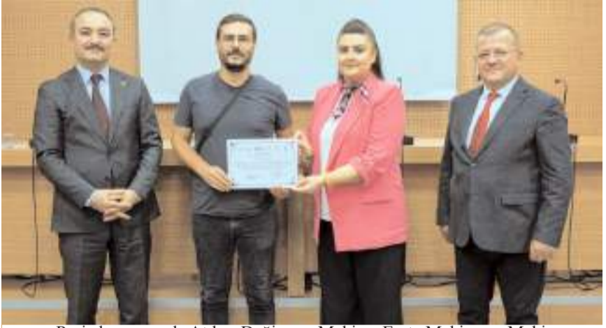
Proje kapsamında Atılım Değirmen Makina, Emta Makine ve Makine ve Enerji (MAKENAS) firmalarının personeli ile Hitit Üniversitesi Makine Mühendisliği öğrencilerine eğitim verildi.