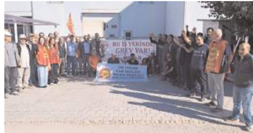
Fabrikada 97 işçi 62 gündür grev yapıyor.