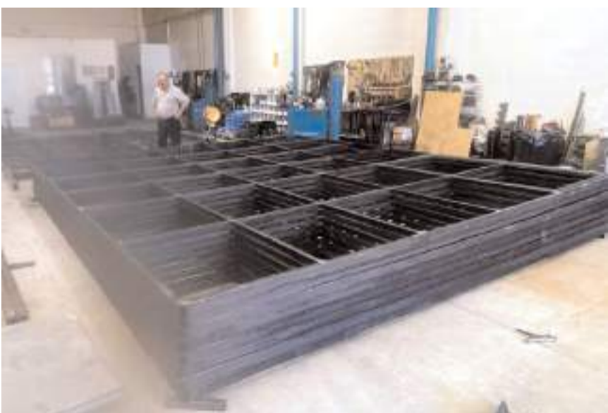
Kaba inşaatı tamamlanan işyerlerinin üstünün kapatılması, zeminine beton atılması ve kapılarının takılması işlemleri gün boyu devam ediyor.