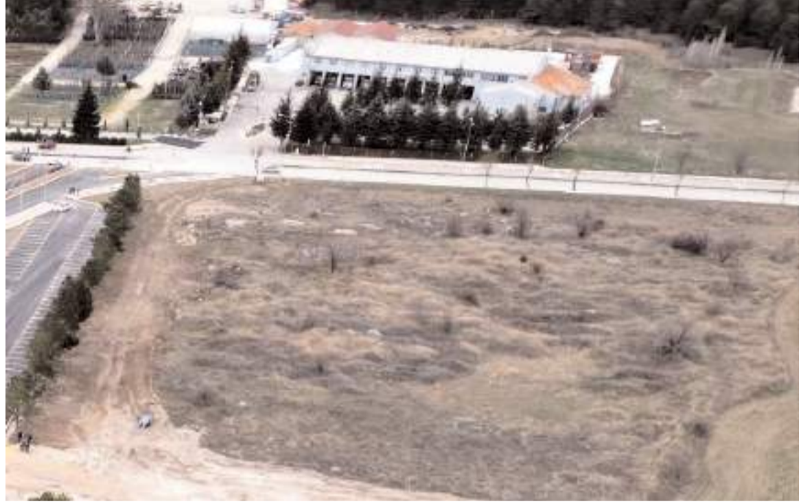
Çorum Belediyesi'nin mülkiyetine ait 11 bin 580 metrekare arazi geçtiğimiz günlerde satılmıştı.

“Belediyemize taşınmaz kazandırmak görev dönemimizde hassasiyet gösterdiğimiz en önemli