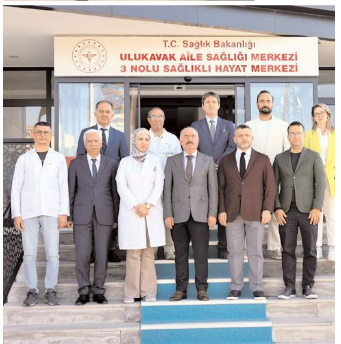
Ziyaretin sonunda günün anısına toplu fotoğraf çekildi.