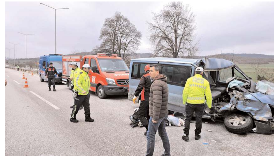
Araçta sıkışan sürücüye itfaiye ekipleri kurtardı.

İhbar üzerine olay yerine polis, jandarma, itfaiye ve sağlık ekipleri sevk edildi.