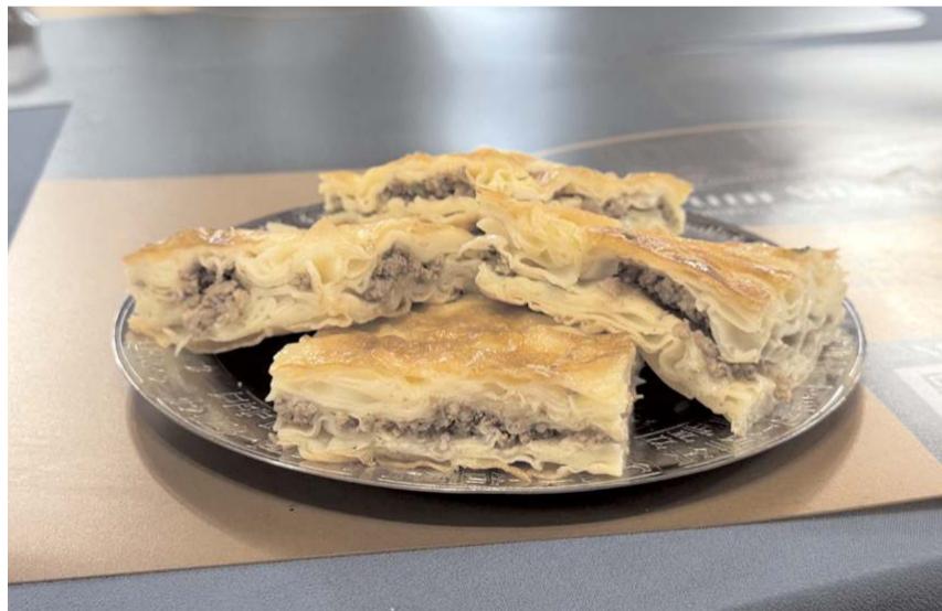
Çorum su böreği, Türk Patent ve Marka Kurumu tarafından coğrafi işaretle tescillendi.