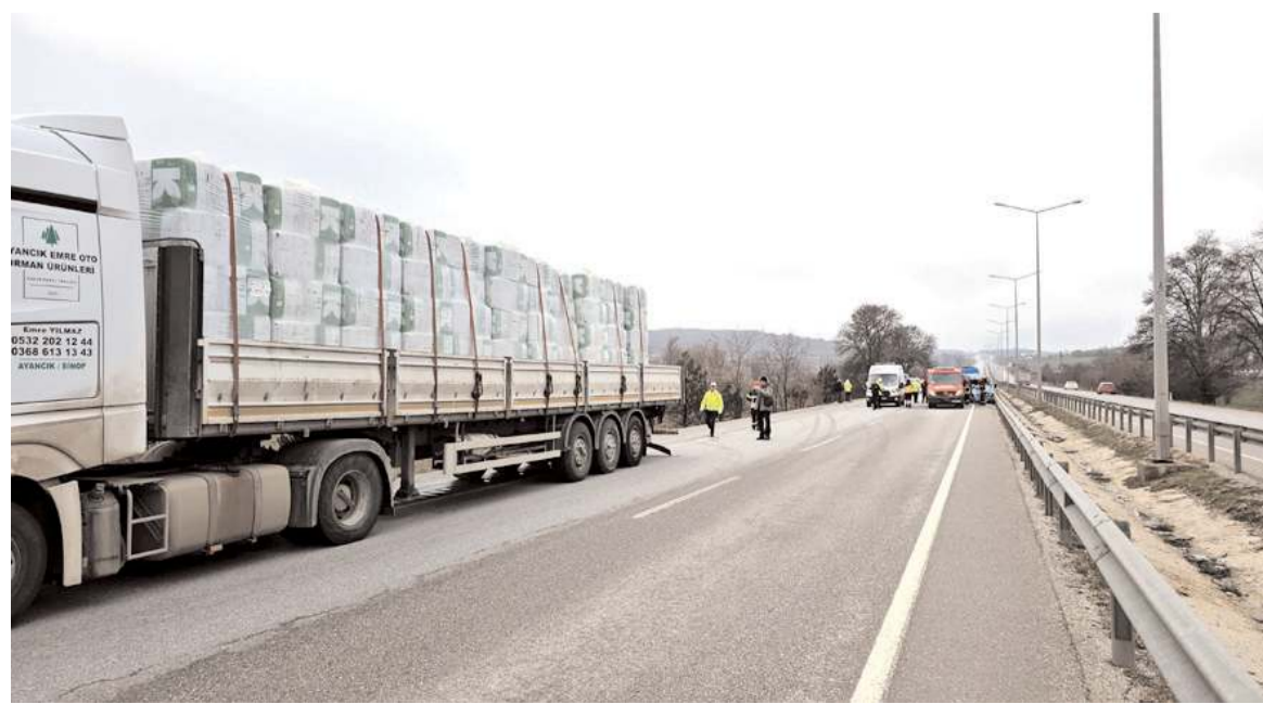
Kaza nedeniyle trafik bir süre durdu.

Sürücü ile eşinin hastanedeki tedavilerinin sürdüğü ve sağlık durumlarının ciddiyetini koruduğu öğrenildi. (AA)