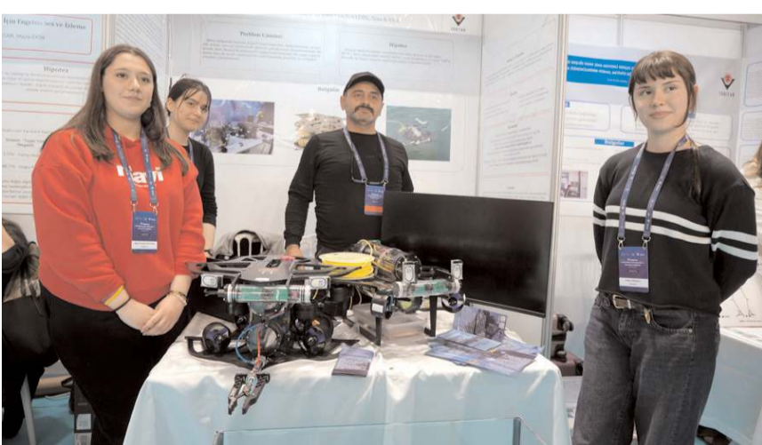
Projelerin ön inceleme ve değerlendirme süreçlerinde 30 farklı üniversiteden 210 öğretim üyesi görev aldı.