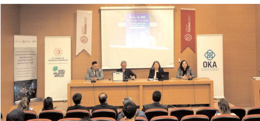
Panelde Ar-Ge faaliyetlerinin ticarileştirilmesi, fikri ve sınai mülkiyet haklarının ihracattaki rolü ve patent temelli rekabet avantajı başlıkları ele alındı.

Panelde yapılan paylaşımlarda, sınai mülkiyet haklarının ihracatta güvenli büyüme, katma değerli üretim ve uluslararası pazarlarda sürdürülebilir rekabet için temel bir araç olduğu vurgulandı. Ayrıca ajansın TÜRK PATENT Sınai ve Mülkiyet Danışma Birimi olarak sunduğu bilgilendirme ve yönlendirme hizmetlerinin, işletmelerin bu alandaki farkındalık ve uygulama kapasitesini güçlendirdiği ifade edildi. (İHA)