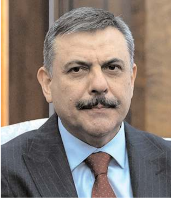
İçişleri Bakanlığı görevine atanan Çorum eski Valisi Mustafa Çiftçi