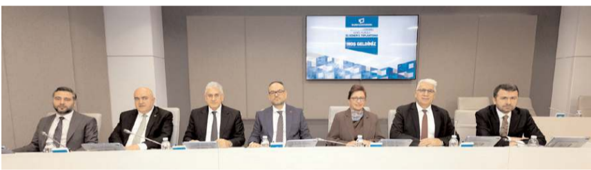
Basın İlan Kurumu 33. Dönem 6. Genel Kurul Toplantısı başladı.

Bu değişimin teknoloji ve altyapının güçlendirilmesini, yeni becerilerin kazanılmasını ve mesleki standartların çağın gereklerine göre yeniden ele alınmasını zorunlu kıldığını vurgulayan Genel Müdür Çay, şöyle konuştu: