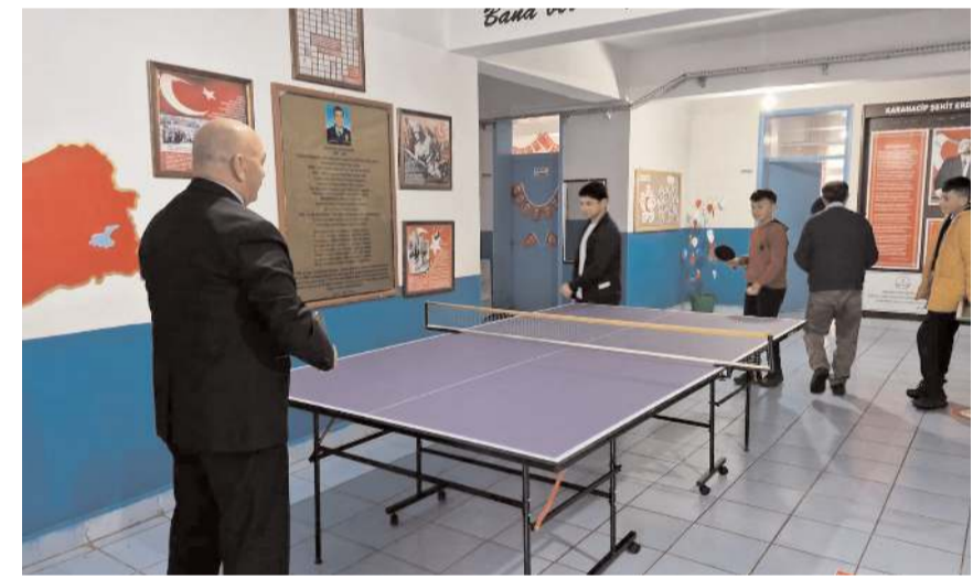
Başkan İsbir, öğrencilerle masa tenisi oynadı.