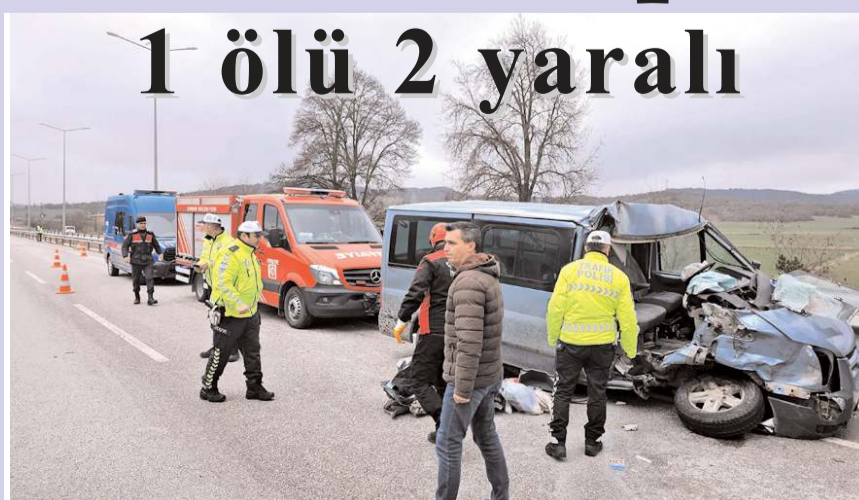
Araçta sıkışan sürücüyü itfaiye ekipleri kurtardı.