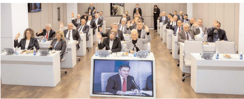
Başkanlık Divanı seçimi yapılarak yoklama alındı ve Genel Kurul Gündemi belirlendi.

"Kurumumuz, İletişim Başkanlığımızın da vizyonu doğrultusunda, basın sektörünün dönüşümüne yön veren ve yol haritası oluşturan kurumsal bir aktör olarak konumlanmaktadır. Bu anlayışla gerçekleştirdiğimiz 'Dijital Dönüşüm Çağında Habercilik: Yapay Zekâ ve Dijital Yetkinlikler' paneli, sektörün tam da bu ihtiyacına cevap veren önemli bir buluşma olmuştur. İletişim Başkanımız Sayın Prof. Dr. Burhanettin Duran'ın katılımlarıyla gerçekleşen panel yalnızca sektörel bir etkinlik olmaktan öteye geçerek devletin iletişim ve medya politikalarıyla uyumlu üst düzey bir buluşma olarak kamuoyunda karşılık bulmuştur. Akademi, sektör ve uygulayıcıların aynı çatı altında bir araya gelmesi; tartışmaları teorinin ötesine taşıyarak sahaya temas eden bir perspektif kazandırmıştır."