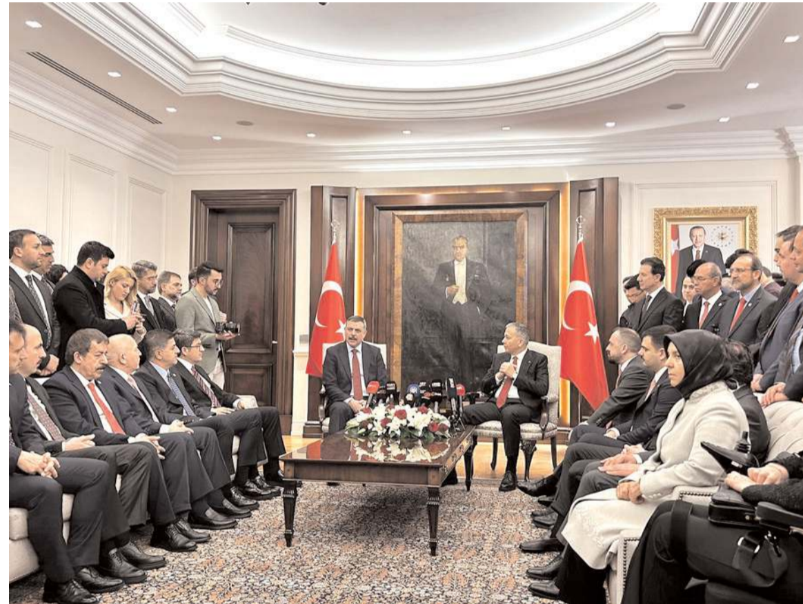
İçişleri Bakanlığında görev devir teslim töreni yapıldı.

İnşallah İçişleri Bakanlığında da, 81 ilimizle birlikte, ilimizde emniyet ve asayiş nasıl daha iyi bir noktaya taşındysak, aynı şekilde bakanlığımızın bünyesinde de memleket sathına yaymak suretiyle; kişilere karşı işlenen suçlarda, mal varlığına karşı işlenen suçlarda, narkotik suçlarla mücadelede ve düzensiz göçle mücadelede elimizden geldiği kadar, durmaksızın ve bütün gayretimizle çalışacağız. Gayret edeceğiz." (Haber Merkezi)