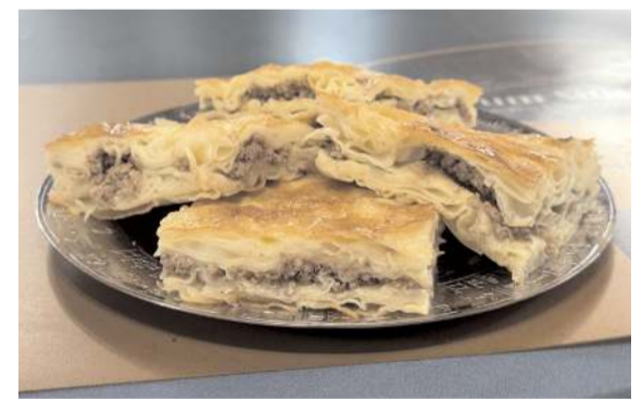
Çorum su böreği, Türk Patent ve Marka Kurumu tarafından coğrafi işaretle tescillendi.