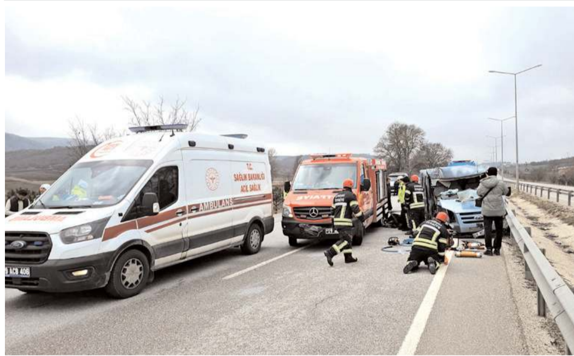
Kaza Çorum-Samsun kara yolu Kaymakçı mevkinde meydana geldi.

Safi Çorum Şeker Fabrikasından yapılan yazılı açıklamada, "Çorum Şeker Fabrikası, yaklaşık 2.500 çiftçiye sağladığı üretim ve gelir desteğiyle bölge ekonomisine katkı sunmaya devam etmektedir. Fabrika, binlerce çalışanıyla Türkiye ekonomisine istihdam ve üretim alanında önemli katkı sağlamaktadır. Mahkeme kararıyla birlikte, Çorum Şeker Fabrikası hakkında kamuoyunda oluşturulmaya çalışılan olumsuz algının hukuki dayanağının bulunmadığı ortaya konulmuştur" denildi. (Haber Merkezi)