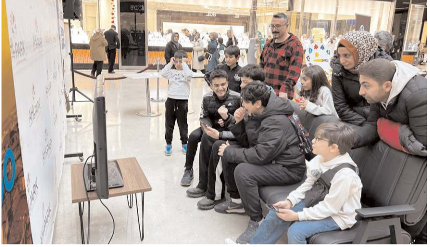
Etkinlikte, ziyaretçiler hem eğlendi hem de İngilizce öğrenmenin keyifli yönlerini keşfetti.

Çorum'da yabancı dil eğitimine yenilikçi bir bakış açısı kazandıran, Yavruturna Mahallesi Kulaksız 1. Sokakta hizmet veren Lango Yabancı Dil Kursu, AHL Park AVM'de düzenlediği interaktif stant etkinliğiyle büyük ilgi gördü.