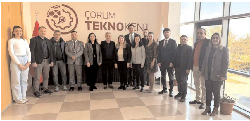
Panelin ardından hatıra fotoğrafı çekildi.