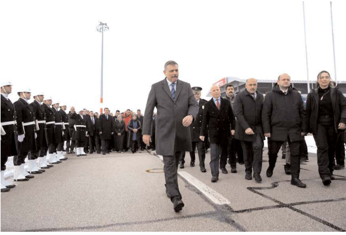
İçişleri Bakanı Mustafa Çiftçi, Erzurum Valiliği görevinden ayrılırak Ankara'ya uğurlandı.