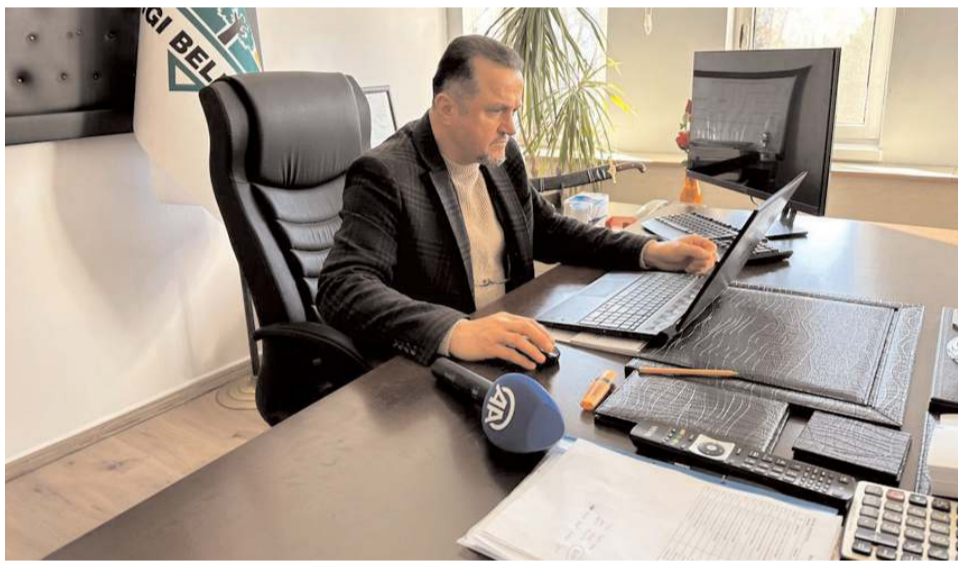
Kargı Belediye Başkanı Hamit Dereli, beğendiği fotoğrafları seçti.

Müslüman; Allah'a ve ahiret gününe inanan, imanın gereklerini yerine getirebilme gayreti içerisinde olan, ibadetlerini huşu içerisinde yapan, bütün iş ve davranışlarında Allah'ın rızasını kazanmayı amaçlayan kimsedir.