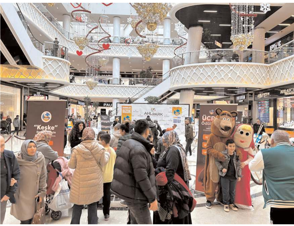
İnteraktif stant etkinliği büyük ilgi gördü.