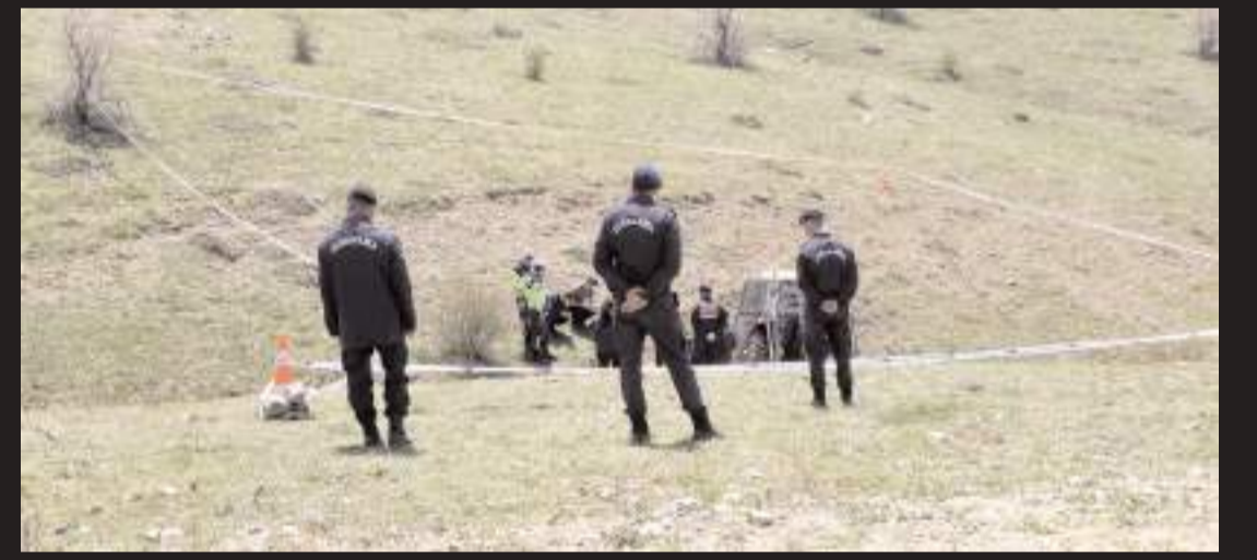
Jandarma ekipleri olay yerinde inceleme yaptı.

Jandarma ekipleri kazayla ilgili inceleme başlattı. (İHA)