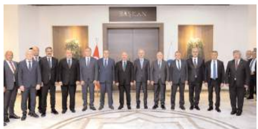
Ziyaretin anısına fotoğraf çekinildi.

guladı. Bakan Uraloğlu ise özellikle yeni çevre yolu konusunda çalışma yapılması için bakanlık yetkililerine talimat verdi.