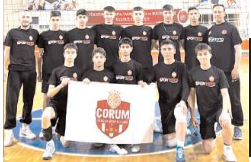
Çorum Gençlikspor yıldız erkek voleybol takımı bugün başlayacak grup maçlarına hazır

Çorum FK- Erzurumspor:M. Ali Metroğlu (Rize) İğdir FK- Amedspor: Ali Yılmaz (Gaziantep) Bandırma-Sivasspor: Batuhan Kolak (Antalya) Erok- Pendik: A. Deniz Kayatepe (Balıkesir) Bodrum FK- Saryyer: Turgut Doman (Eskişehir) Ümraniye- Keçiören : Çağdaş Altay (İstanbul)