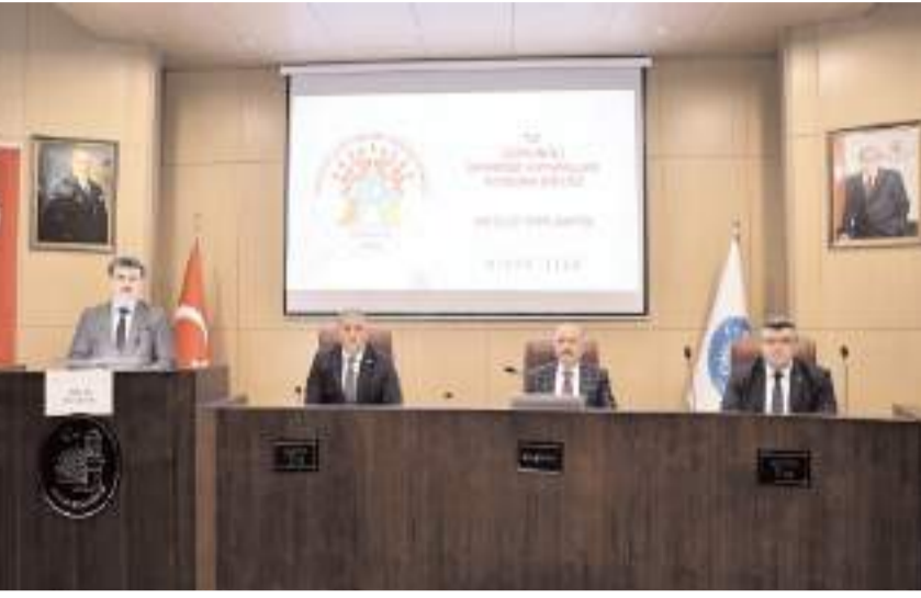
Toplantı Vali Ali Çalğan'ın başkanlığında yapıldı.