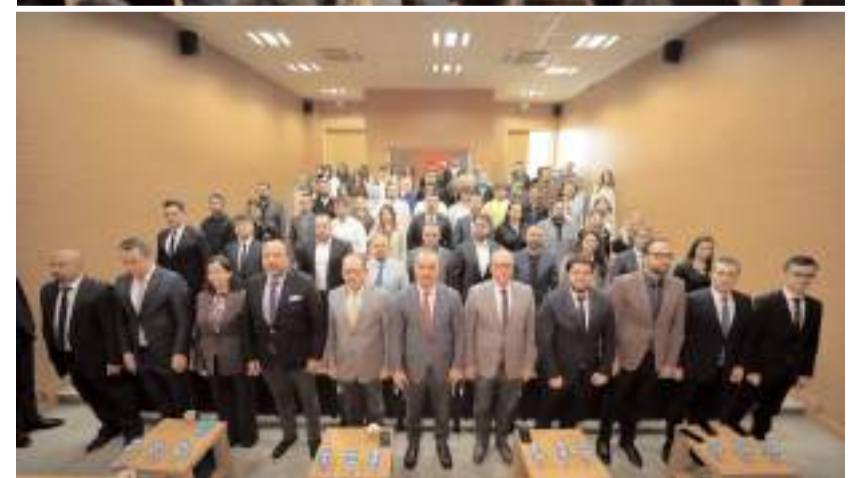
Toplantı Çorum Teknokent Konferans Salonunda yapıldı.

hirlerdeki girişimci Çorum'daki yatırımcıya ulaşabilecek. Hem yatırımcı ağımızı birleştirmiş oluyoruz hem de girişimci ağımızı birleştirmiş oluyoruz. Türkiye'de büyük teknoparklar kendi başlarına çok büyük etkin-