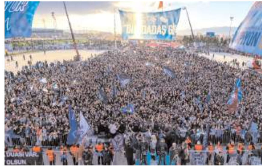
Şampiyonluk kutlamasında tören alanında binlerce Erzurumlu katıldı

Konuşmaların ardından sahneye tek tek çağrılan teknik heyet ve futbolculara madalyaları ve şampiyonluk kupası verildi. Havai fişek gösterileriyle süren kutlamalar, şarkıcı Merve Özbek konseriyle sona erdi.