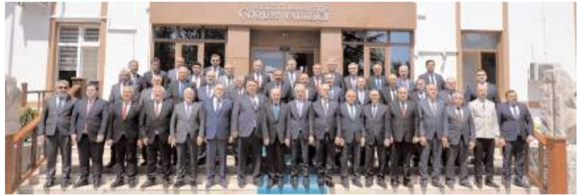
Bakan Abdulkadir Uraloğlu'nun ilk durağı Çorum Valiliği oldu.

İnşallah Havza-Samsun arasındaki da en kısa sürede yapım ihalesine çıkacağız. Çorum-Merzifon-Samsun kesimlerinin de tamamlanmasıyla; Ankara-Samsun arası seyahat süresi 2,5 saat olacak; yılda 12 milyon yolcu ve 14 milyon ton yük taşınacak."