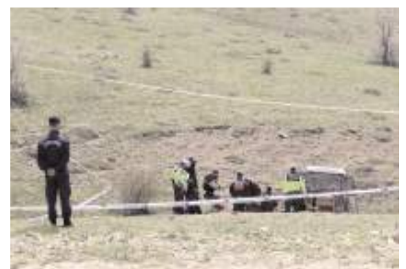
Kaza, Alaca ilçesi Gazipaşa köyü Öküzdere mevkiinde meydana geldi.

Türkiye İstatistik Kurumu tarafından açıklanan mart ayı dış ticaret verilerine göre Çorum'da bir önceki aya göre sert düşüş gösterdi. * HABERİ10'DA