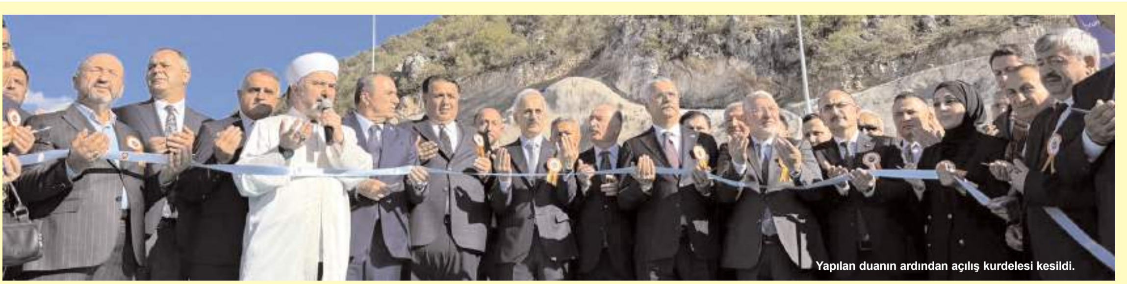
Yapılan duanın ardından açılış kurdelesini kesildi.