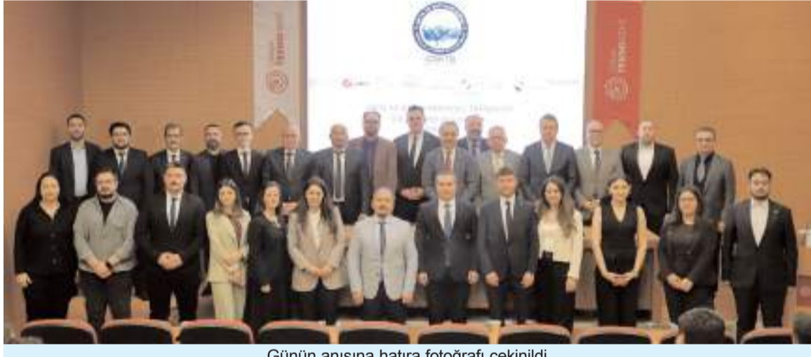
Günün anısına hatıra fotoğrafı çekildi.