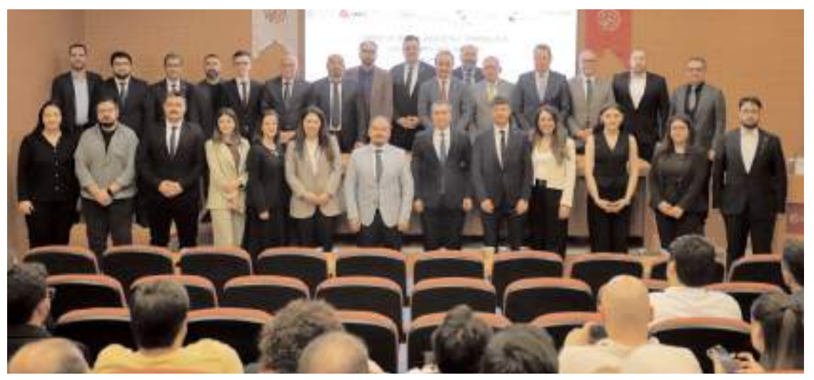
Günün anısına hatıra fotoğrafı çekildi.

Vali Ali Çalğan, sahipsiz hayvanların yaşam koşullarını iyileştirmeye yönelik çalışmaların kararlılıkla sürdürüldüğünü vurgulayarak, katkı sunan tüm belediyelere teşekkür etti.