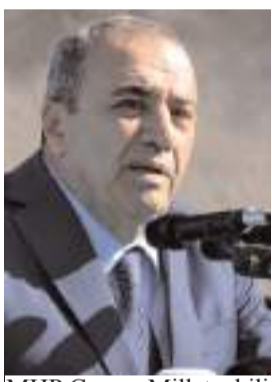
MHP Çorum Milletvekili Vahit Kayrı