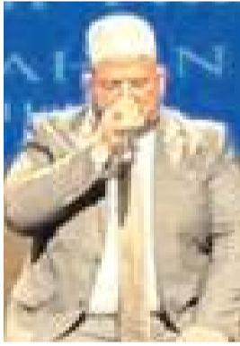
Program Kur'an-ı Kerim tilavetiyle başladı.

Çorum İl Müftülüğü ile Türkiye Diyanet Vakfı (TDV) Çorum Şubesi ev sahipliğinde "2026 Yılı Vekaletle Kurban Tanıtım Toplantısı" gerçekleştirildi.