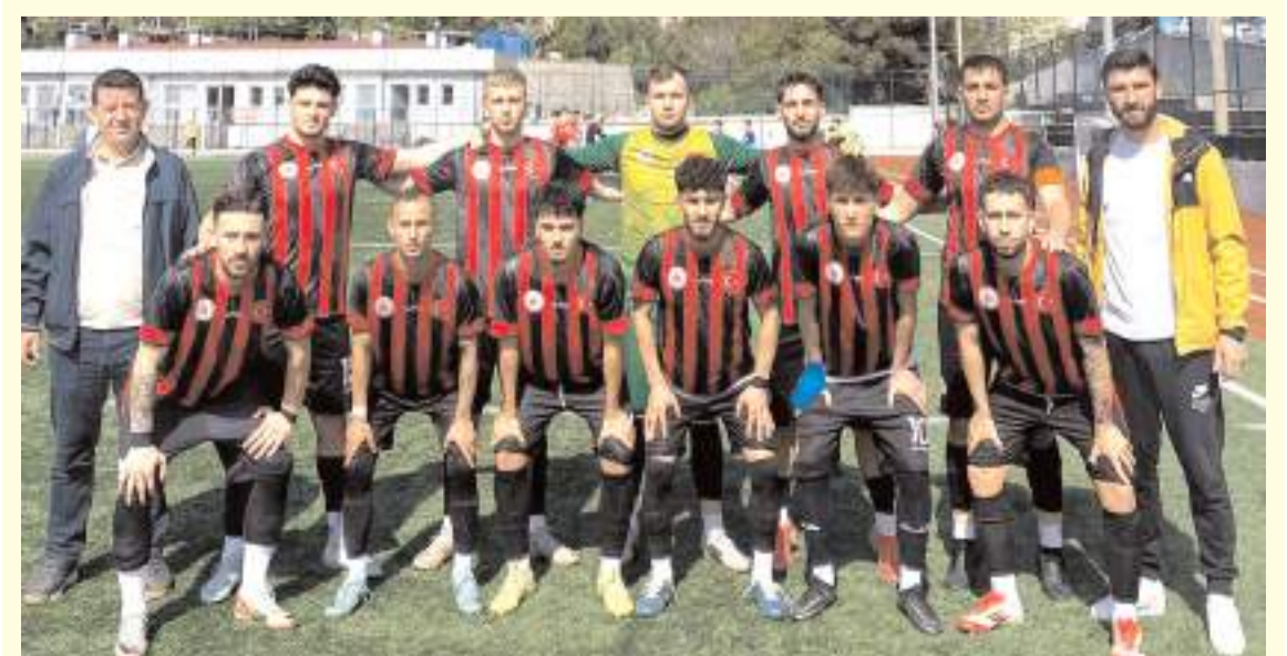
Çorum Yurt Lig futbol takımı grubunda ilk maçında Zonguldak ile 1-1 berabere kaldı

Çorum diğer maçında ise Kastamonu, Sinop'u 3-1 yenerek avantaj yakaladı. Çorum takımı bugün ikinci maçında Sinop ile yarın ise son maçında Kastamonu ile karşılaşacak. Grup maçları sonunda ilk iki sırayı alan takımlar çapraz olarak karşılaşacak ve kazanan takımlar Türkiye finallerine gitmeye hak kazanacaklar.