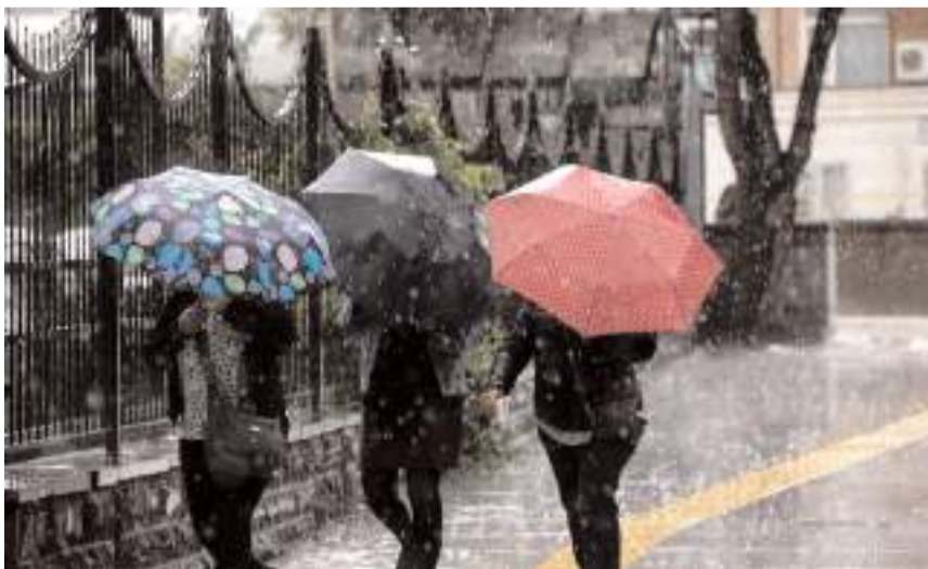
Vatandaşların kuvvetli yağışa karşı dikkatli olmaları istendi.

Vatandaşları kuvvetli yağışlar nedeniyle sel, su baskını, yıldırım, yerel küçük çaplı dolu,