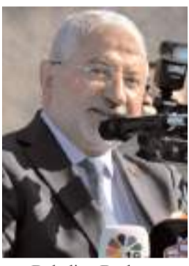
Belediye Başkanı Halil İbrahim Aşgın