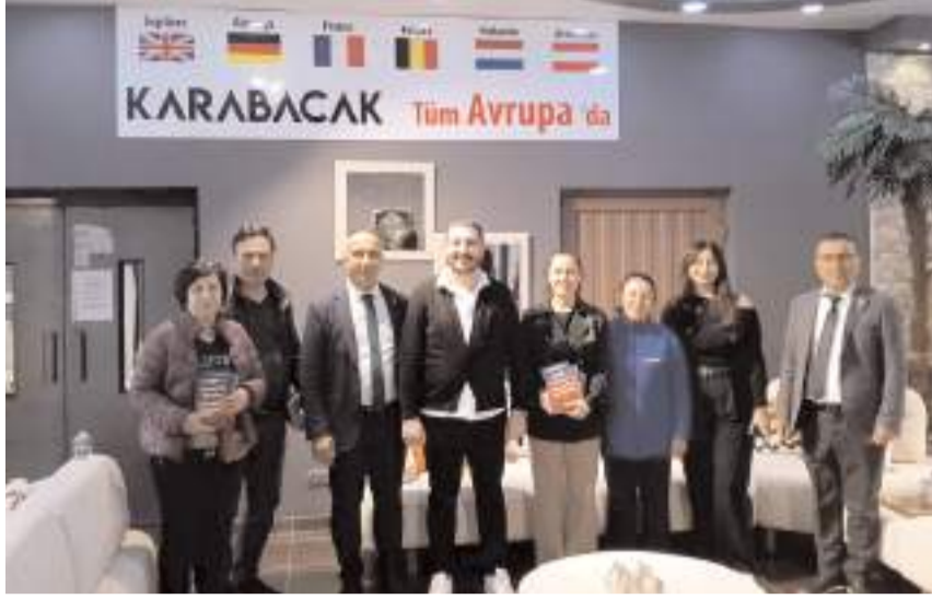
CHP heyeti esnafı ziyaret ederek 1 Mayıs kutlamalarına davet etti.