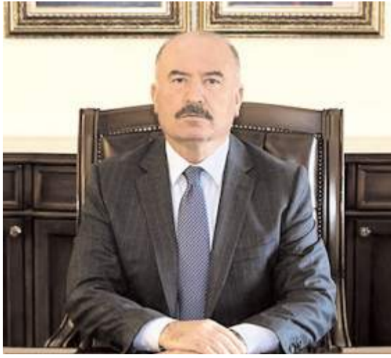
Vali Ali Çalgan

“Ülkemizin kalkınması, ekonomimizin büyümesi ve toplumsal refahın artması için gece gündüz demeden çalışan tüm işçi ve emekçi kardeşlerimizin 1 Mayıs Emek ve Dayanışma Günü’nü en içten dileklerle kutluyorum” diyerek mesajına başlayan Vali Ali Çalgan, “Tüm dünyada olduğu gibi ülkemizde de birlik, dayanışma ve emeğe saygının simgesi olan 1 Mayıs, üretimin ve kalkınmanın temel gücü olan işçi ve emekçilerin alın terinin, özverisinin ve emeğinin değerinin bir kez daha vurgulandığı