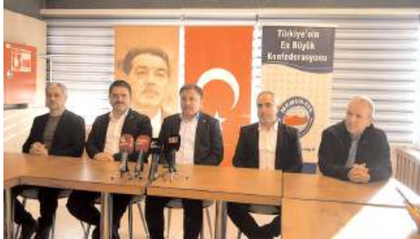
Basın toplantısında Memur-Sen Konfederasyonu tarafından Çorum'da yapılacak olan 1 Mayıs programı hakkında bilgiler verildi.