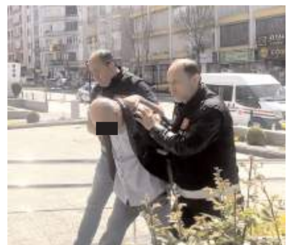
Gözüne alınan şahıs, emniyetteki işlemlerinin ardından adliyeye sevk edildi.