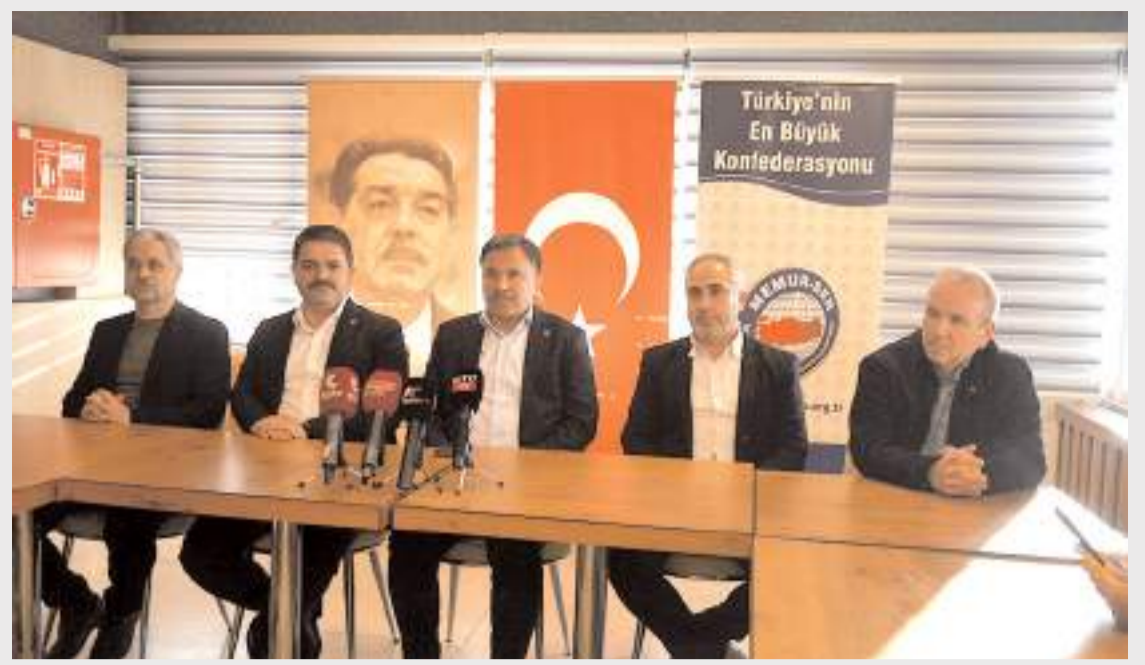
Basın toplantısında Memur-Sen Konfederasyonu tarafından Çorum'da yapılacak olan 1 Mayıs programı hakkında bilgiler verildi.

Solmaz, tüm emekçileri, sivil toplum kuruluşlarını ve siyasi partilerini 1 Mayıs kutlama etkinliklerine katılmaya, alanlarda omuz omuza mücadeleye destek vermeye davet etti. (Haber Merkezi)