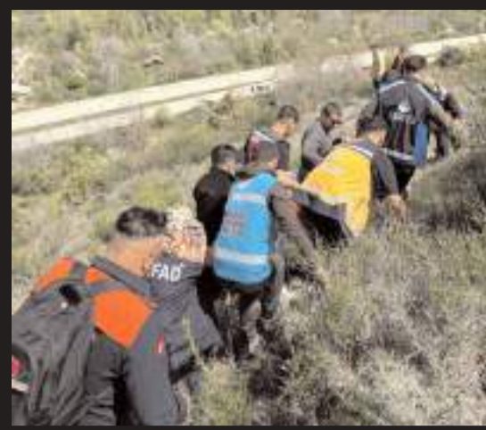
İskilip'te kaybolan 86 yaşındaki Alzheimer hastası yaşlı adam 48 saat sonra Kireçtepe mevkinde bulundu.