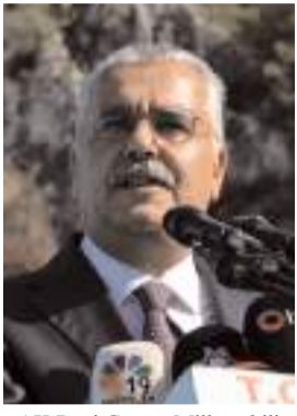
AK Parti Çorum Milletvekili Yusuf Ahlatcı