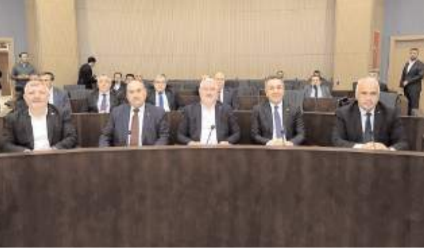
Toplantıda, birlik çalışmalarına yön verecek kararlar alındı.