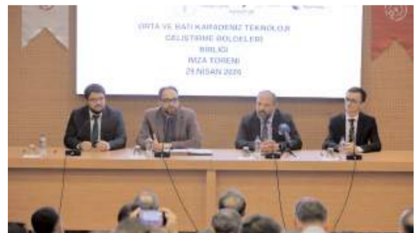
Orta ve Batı Karadeniz Teknoloji Geliştirme Bölgeleri Birliğinde, Çankırı, Kastamonu, Karabük, Bartın, Zonguldak, Sinop, Samsun, Tokat ve Çorum'daki teknokentler yer alıyor.