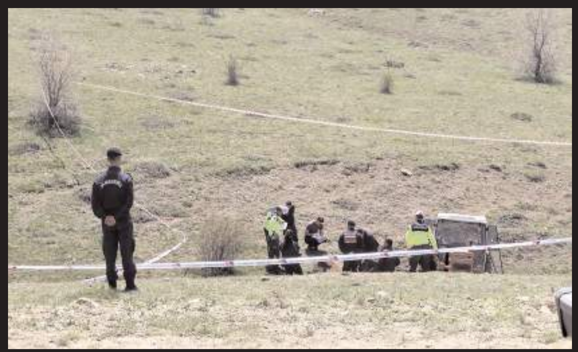
Kaza, Alaca ilçesi Gazipaşa köyü Öküzdere mevkiinde meydana geldi.

İMARA SIFIR SATILIK TARLA 23.510 m2 (30 metre yola cephele) Çöplü Mahallesi 1 Ada 34 Parsel 0507 466 72 61