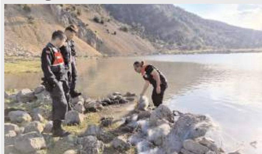
Kargı İlçe Tarım ve Orman Müdürlüğü ekiplerinin denetimleri devam ediyor.

Çorum'un Kargı ilçesinde kaçak avcılıkla mücadele kapsamında gerçekleştirilen denetimlerde yaklaşık 500 metre uzunluğunda balık ağı ele geçirildi.