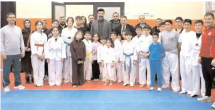
Taekwondo çalışması yapan çocuklar ve antrenörleri İl Müdürü ve diğer misafirler ile