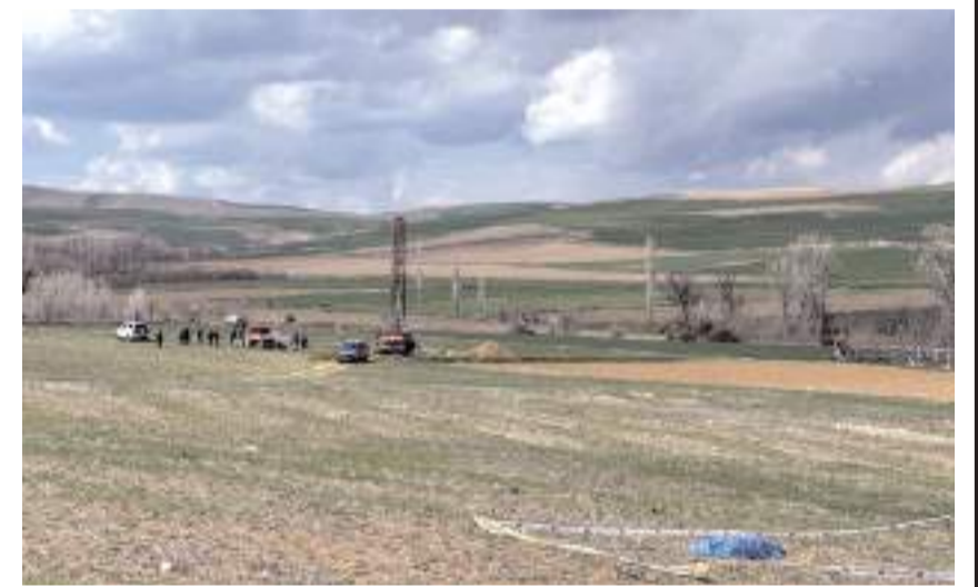
Baba ile oğlu olay yerinde hayatını kaybetti.