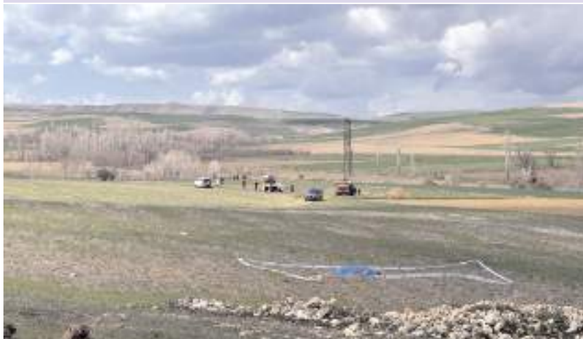
Olay Köseeyüp köyü Aşılık mevkinde meydana geldi.

■ Çorum'un Mecitözü ilçesinde baba ve oğlu, tartışmaları komşuları tarafından silahla vurularak öldürüldü.