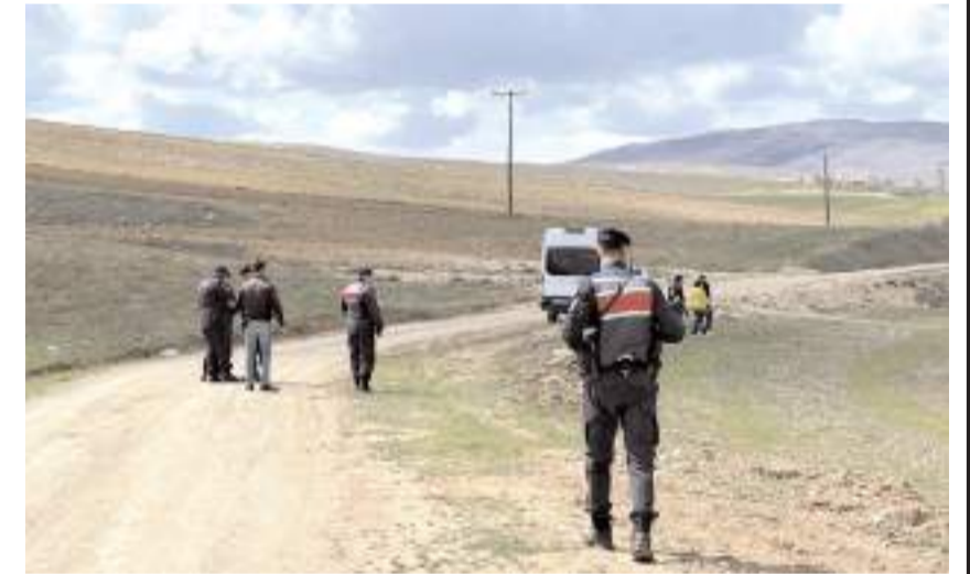
Jandarma ekipleri, olay yerinde ve ailenin köydeki evinin çevresinde güvenlik önlemi aldı.