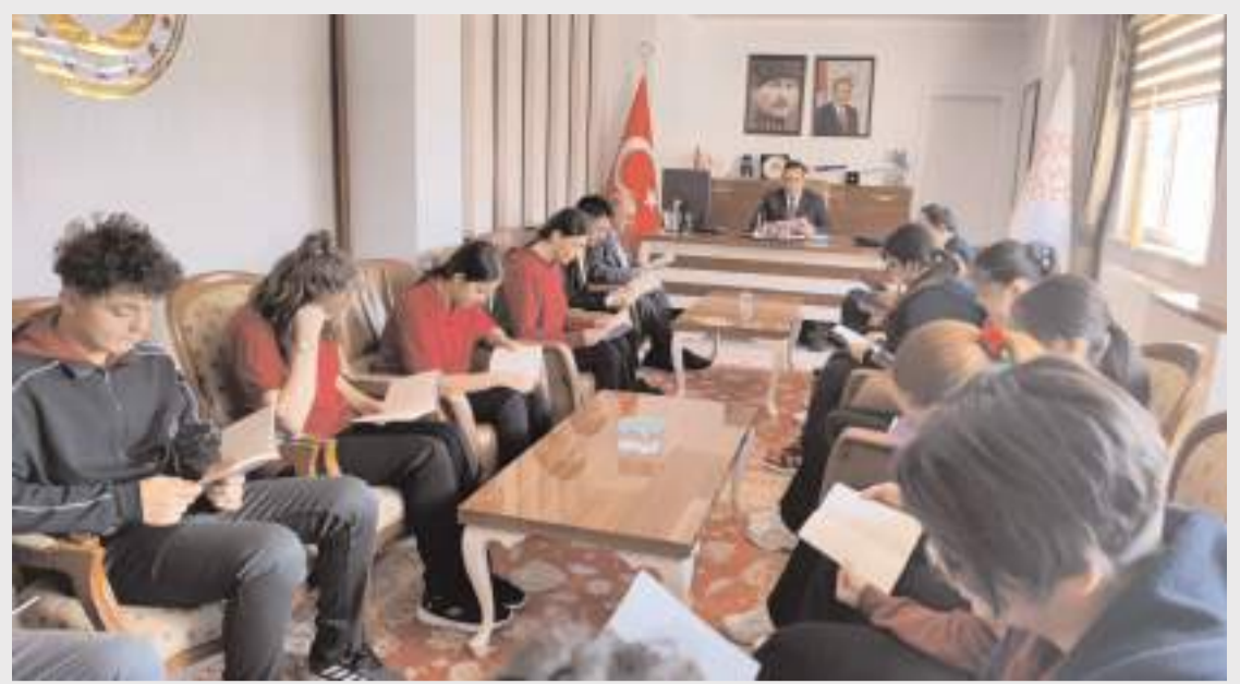
Oğuzlar Çok Programlı Anadolu Lisesi 9. sınıf öğrencileri Oğuzlar Kaymakamı Serkan Tokur'u ziyaret etti.