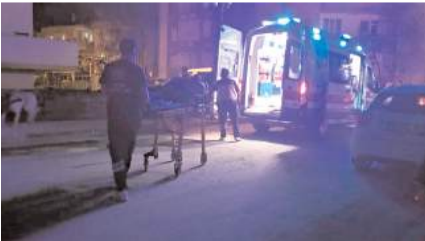
Yaralı hastanede tedavi altına alındı.