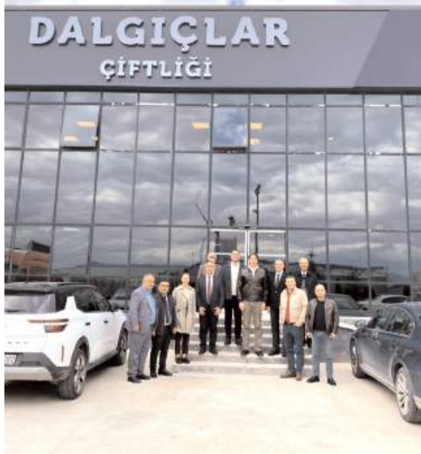
Ziyaretin anısına toplu fotoğraf çekildi.

Cumhuriyet Halk Partisi (CHP) Tarım ve Orman Politikaları Kurulu Başkanı Sencer Solakoğlu, Dalgıçlar Çiftliği'ni ziyaret etti.