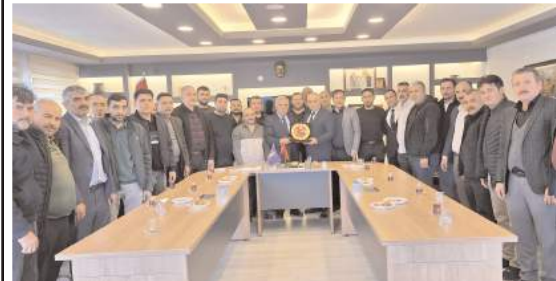
Ziyaretin anısına toplu hatıra fotoğrafı çekildi.