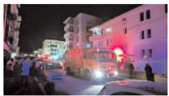
Olay Gülabibey Mahallesi Bağolar 36. Sokak'ta 3 katlı binada meydana geldi.