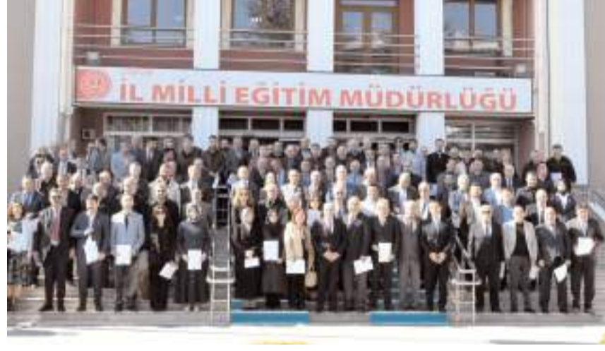
İl Millî Eğitim Müdürlüğünde yapılan törenin ardından toplu hatıra fotoğrafı çekildi.