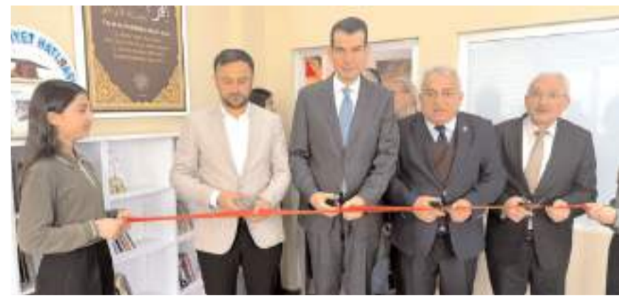
Kütüphane Sedat Baran Ortaokulu'nda açıldı.