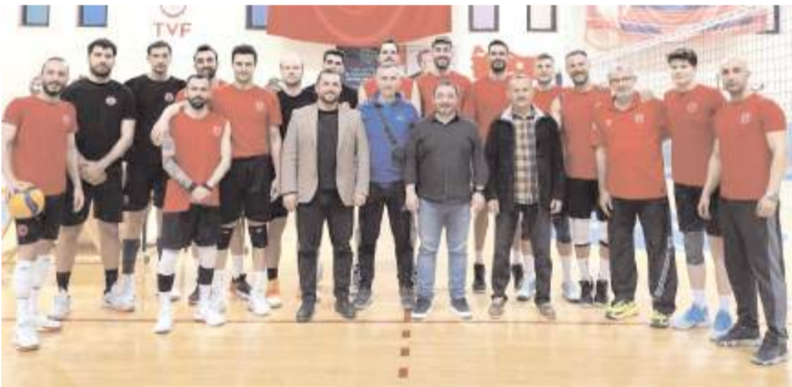
Voleybol İl Temsilcisi ve İl Hakem Kurulu üyeleri Sungurlu Belediyespor antrenmanı ziyaretinde toplu halde

1. Amatör Küme'de pazar günü Devane sahasında oynanacak Ulukayakspor- Mimar Sinan maçı Gelişim maçının Çorum'a alınması nedeni ile İtfaiye sahasına alındı. İki takım pazar günü saat 14'de İtfaiye sahasında karşılaşacak.