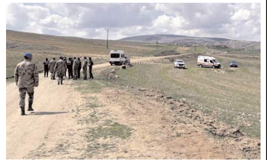
İhbar üzerine bölgeye jandarma ve sağlık ekipleri sevk edildi.

Şüphelinin yakalanması için çalışmalar sürüyor.(AA)