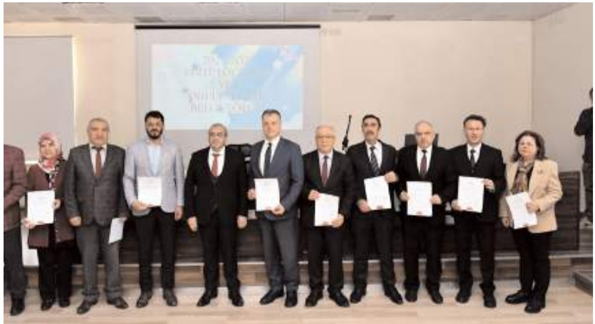
Okulum Temiz belgeleri bu belgeyi almayı hakkazanan okulların yöneticilerine verildi.

Bakanlığın öz kaynakları ve okul yöneticileri ile personelin özveriyle çalışmaları sayesinde eğitim kurumlarının