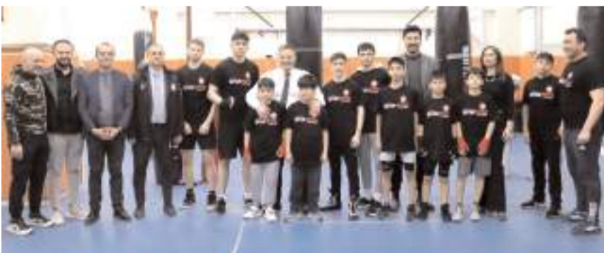
İl Müdürü ve beraberindekiler Kick Boks antrenmanında sporcularla sohbet etti