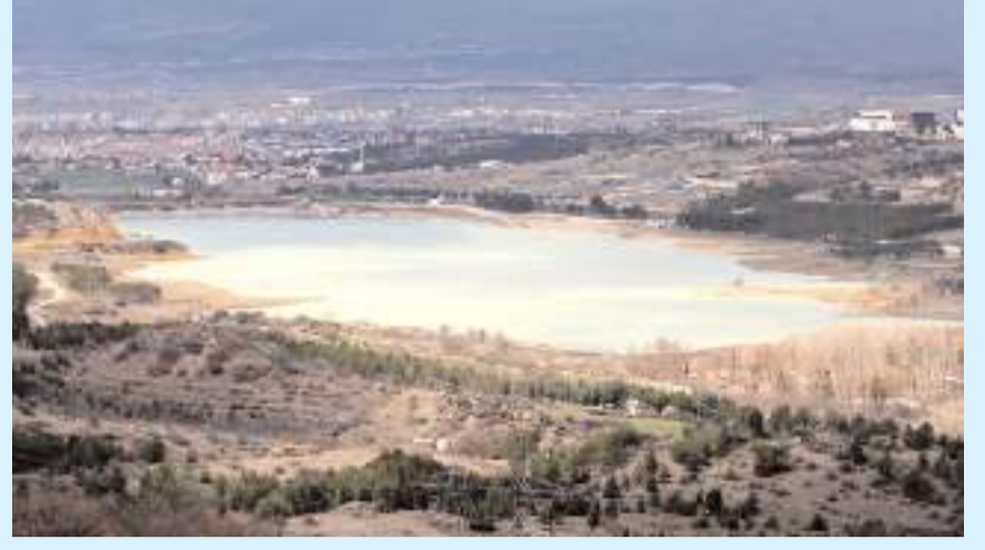
Çorum Barajı'nda şu için 3 milyon 100 bin metreküp su bulunuyor.