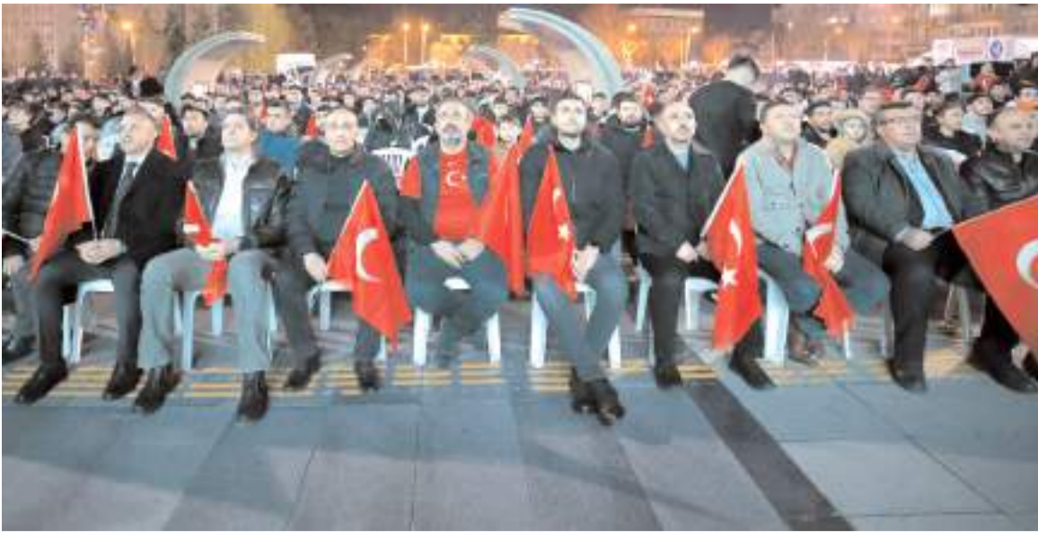
Kadeş Meydanında protokol üyeleri ve vatandaşlar milli coşkuya birlikte ortak oldular maç sonu brlikte sevindi