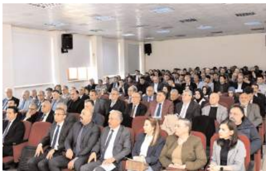
Tören İl Millî Eğitim Müdürlüğü toplantı salonunda yapıldı.

"Okulum Temiz" belgesinin yalnızca belirli kriterlerin yerine getirilmesini değil, aynı zamanda okullarda oluşturulan hijyen kültürünün sürdürülebilirliğini de temsil ettiği ifade edildi.