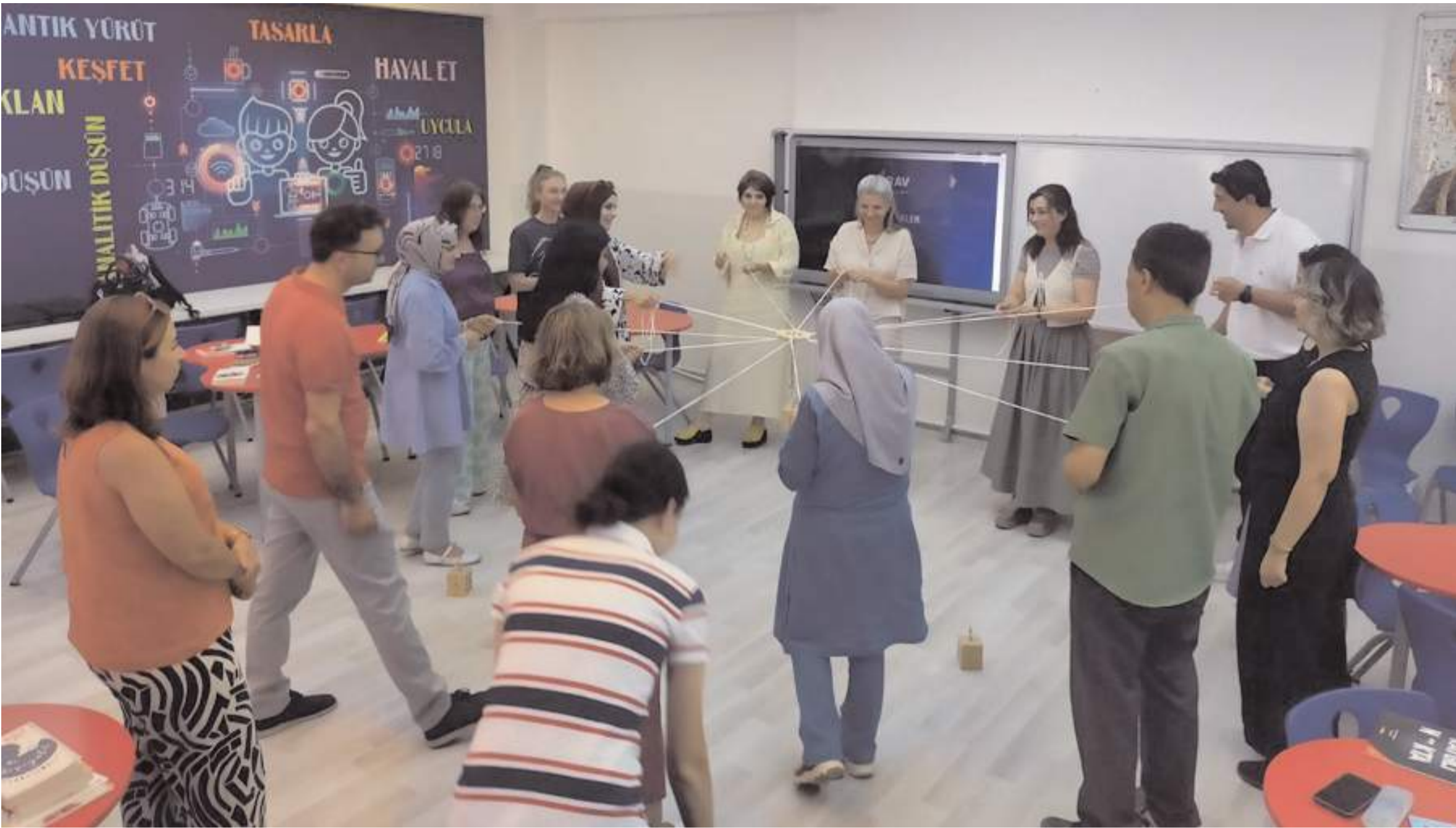
12. Eğitim Şenliği, 11-12 Nisan'da 6 ilde yapılacak.