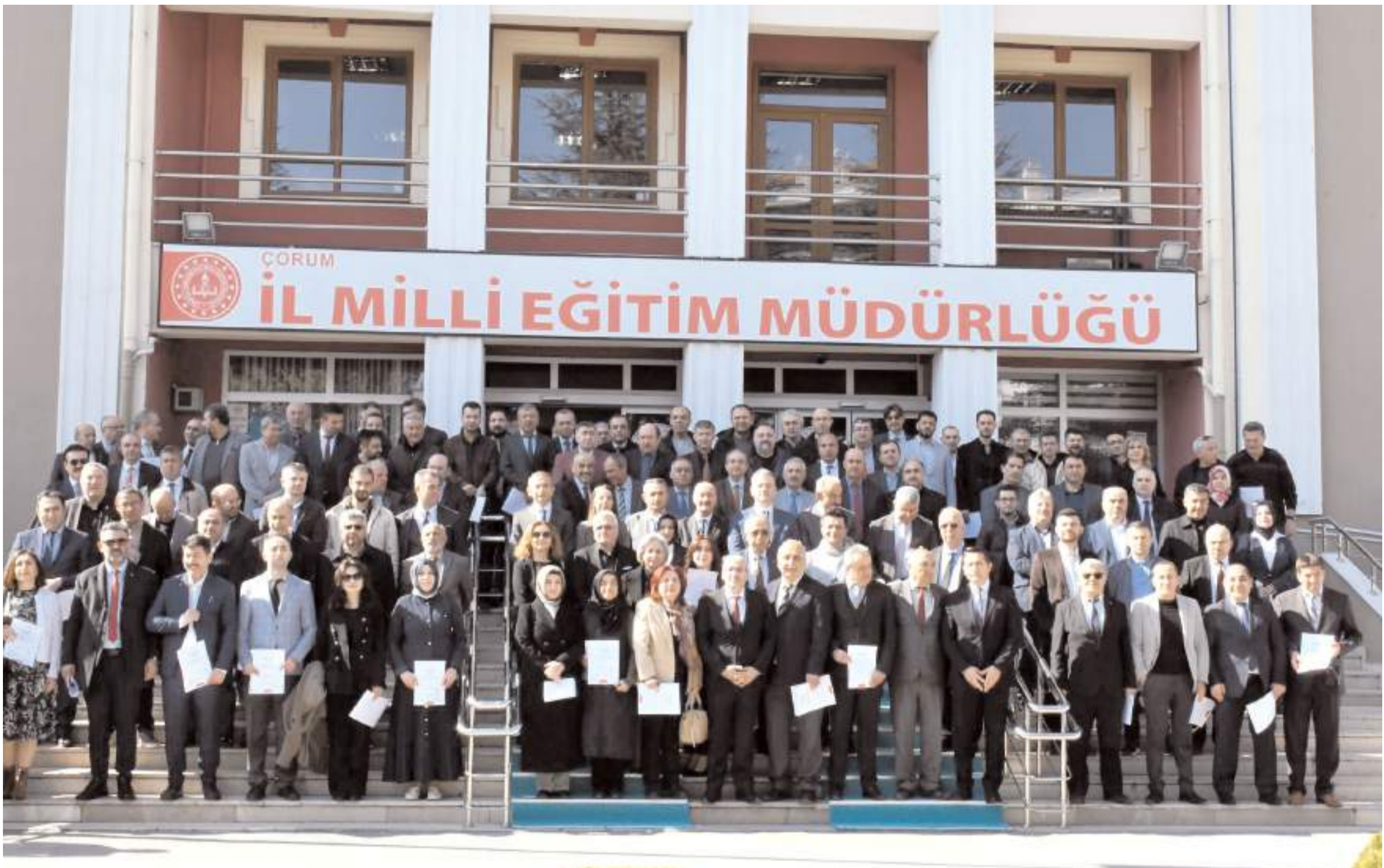
İl Millî Eğitim Müdürlüğünde yapılan törenin ardından toplu hatıra fotoğrafı çekildi.