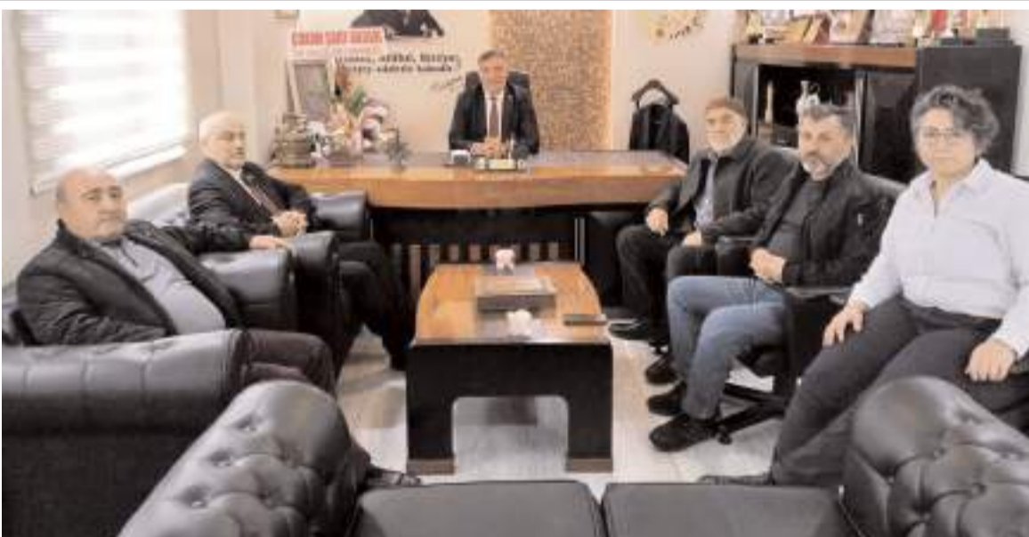
Çorum Şehit Aileleri ve Gaziler Derneği yönetimi Baro Başkanı Turan Kalıpcı'ya teşekkür etti.

manlığı, doğru bilgilendirme ve sağlık hizmetlerine erişimin kolaylaştırılması noktasında aktif rol üstlenirken, otizmli bireylerin yaşam kalitesini artırmaya yönelik farkındalık çalışmalarına katkı sunmaya devam ediyoruz. Bu vesileyle tüm toplumumuza, farklılıkları bir eksiklik olarak değil, insan çeşitliliğinin bir parçası olarak görmeye, empati kurmaya ve kapsayıcı bir yaşam kültürü oluşturmaya davet ediyoruz. Unutulmamalıdır ki, farkındalık, kabul ile anlam kazanır. Kabul ise birlikte yaşamayı mümkün kılar." (Haber Merkezi)