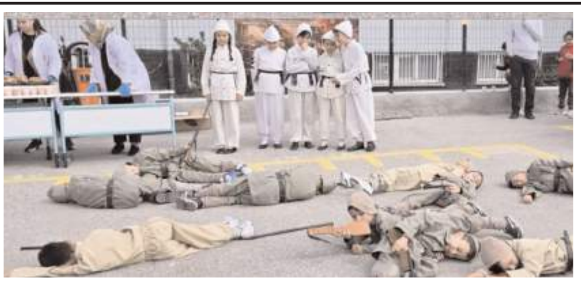
Öğrenciler asker kıyafeti giyerek o günleri canlandırdılar.

CHP heyeti, Dalgıçlar Çiftliği yetkililerini tebrik ederek, başarılarının devamını diledi. (Haber Merkezi)