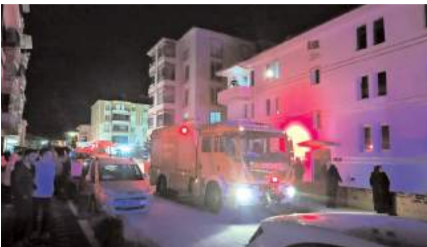
Olay Gülábibey Mahallesi Bağcılar 36. Sokak'ta 3 katlı binada meydana geldi.

İtfaiye ekiplerince soğutma çalışması yapılan dairede maddi hasar oluştu.(AA)