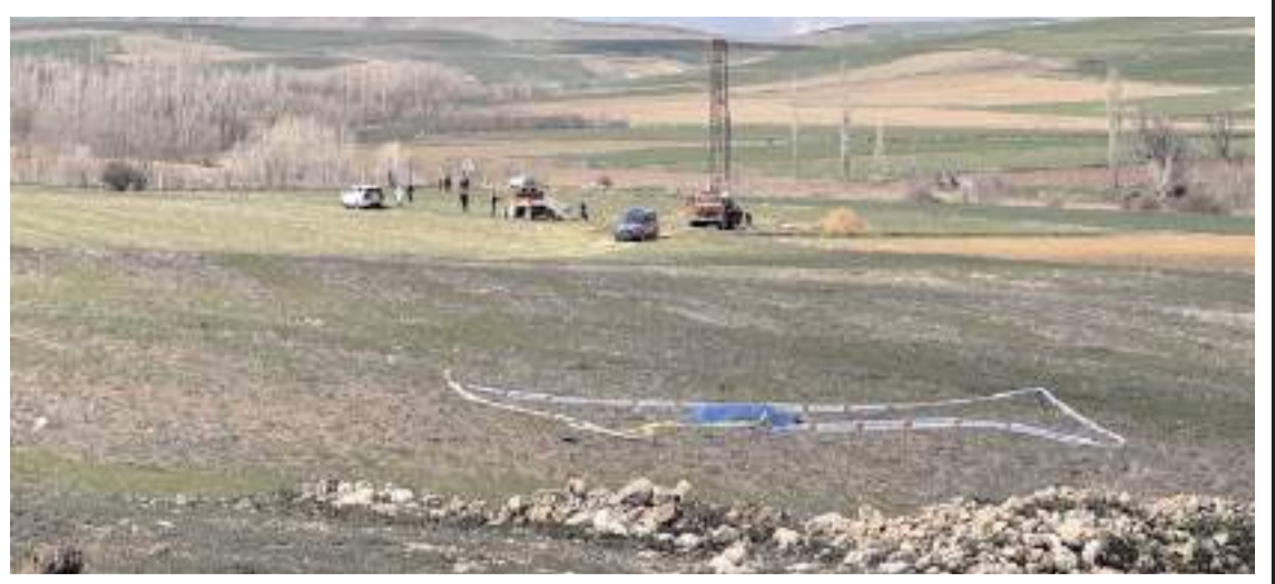
Olay Köseyüp köyü Aşılık mevkinde meydana geldi.

Beker, "Yapılan bu uygulama şehit yakınları ve gazilerimiz tarafından memnuniyetle karşılanmıştır. Sayın başkanımıza ve baro üyelerine çok teşekkür ediyorum." dedi.