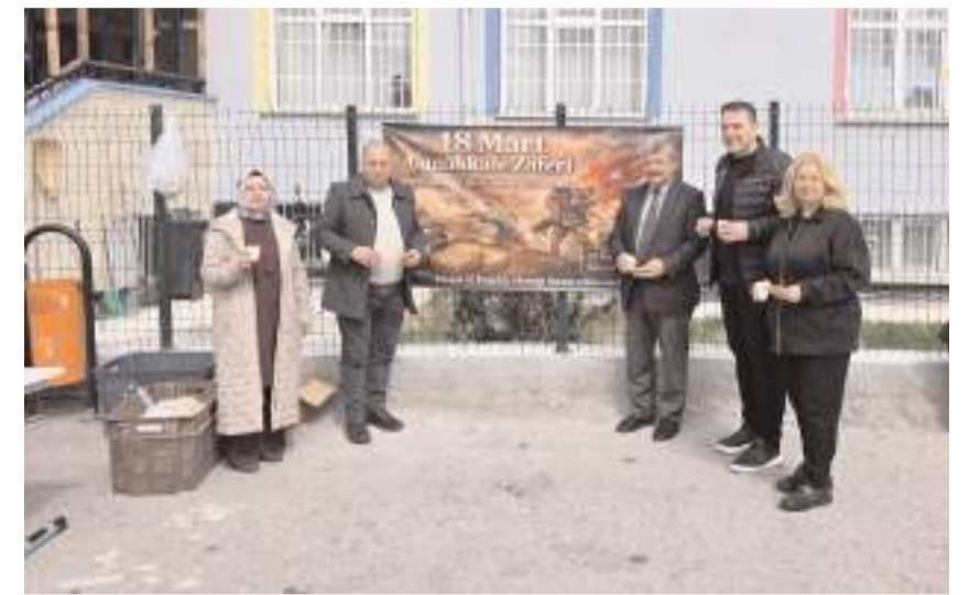
Etkinlikte, Çanakkale Savaşı sırasında cephedeki askerlerin menüsü olan hoşaf ve buğday ekmeği ikram edildi.