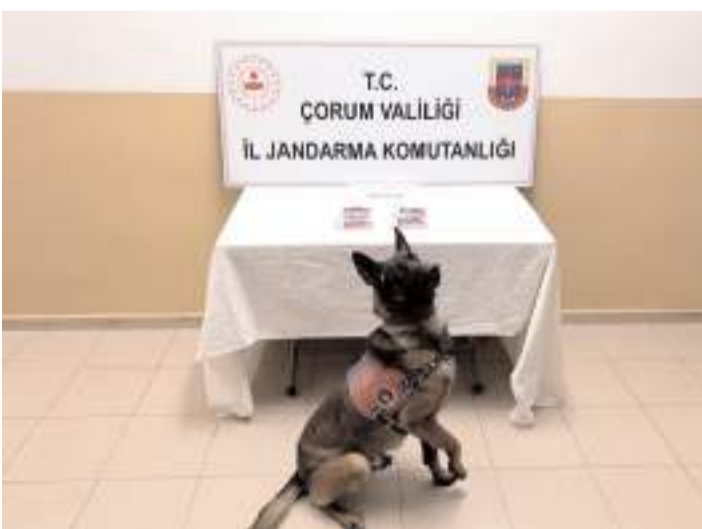
Araçta ve şüphelilerin üzerinde yapılan aramada 224 sentetik ecza ele geçirildi.

Çorum'un Alaca ilçesindeki uyuşturucu operasyonunda 3 şüpheli gözaltına alındı.