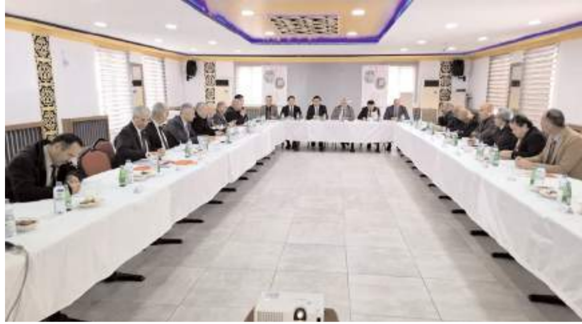
Toplantıda eğitim faaliyetlerinin mevcut durumu, devam eden projeler, kurumsal gelişim süreçleri ve eğitim-öğretime ilişkin değerlendirmeler yapıldı.