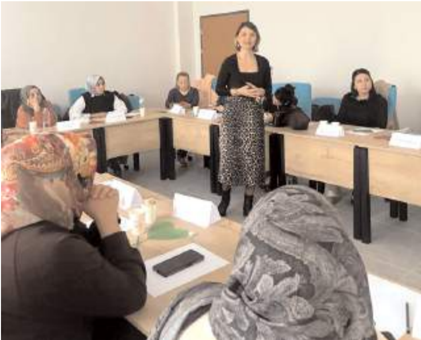
Eğitim süresince, anne sütünün fizyolojisi ve laktasyon süreci, anne sütünün bebek ve anne sağlığı üzerindeki etkileri anlatıldı.

Müdürlüğün bu tür eğitimlerle sağlık çalışanlarının bilgi ve becerilerini artırmayı, annelere sunulan danışmanlık hizmetlerini güçlendirmeyi ve toplum genelinde emzirme oranlarını yükseltmeyi hedeflediği bildirildi.