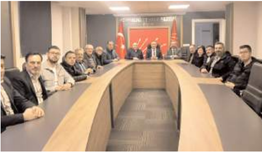
Ziyarete parti yöneticileri ile partililer hazır bulundu.