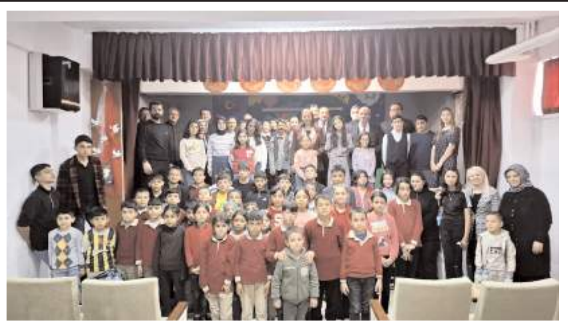
Programın anısına toplu fotoğrafı çekildi.