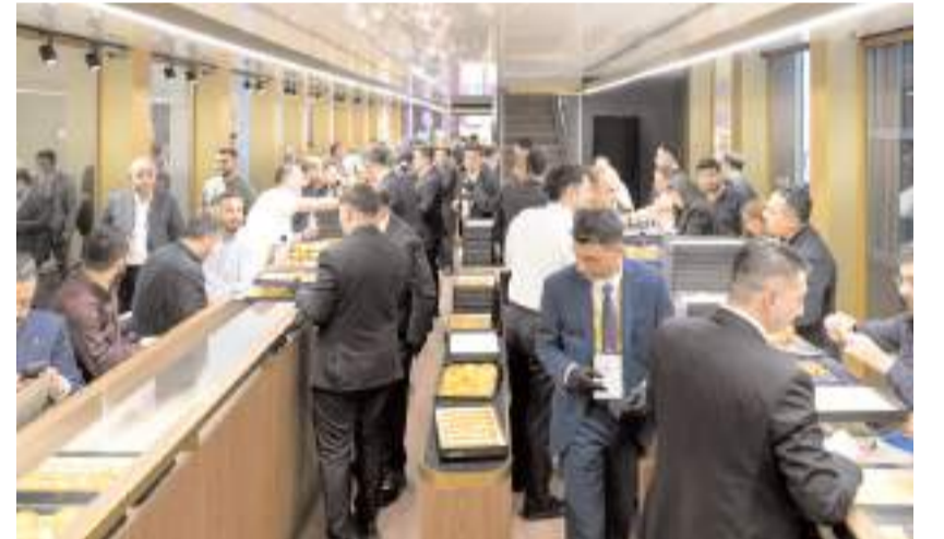
59’uncusu düzenlenen fuara 15 farklı ülkeden 1300’ün üzerinde firma ve marka katıldı.