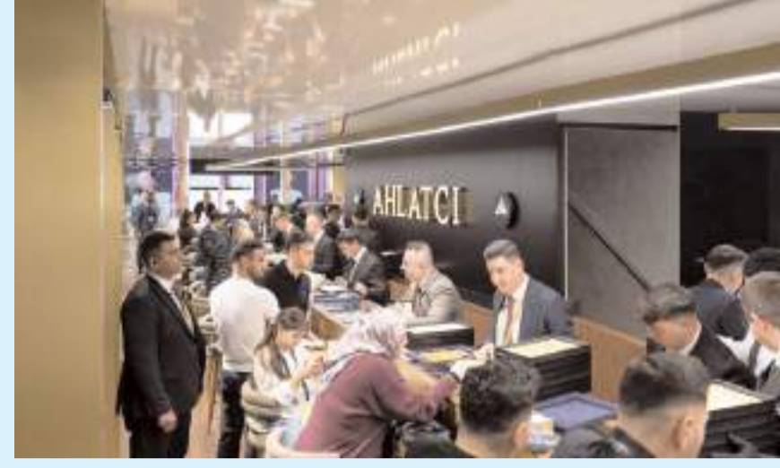
59'uncusu düzenlenen fuara 15 farklı ülkeden 1300'ün üzerinde firma ve marka katıldı.

■ Dünyanın en büyük beş mücevher fuarından biri olan IJS Istanbul Jewelry Show, İstanbul'da ziyaretçilerine kapılarını açtı. Ahlatcı Kuyumculuk'un da katıldığı fuarda altından imal edilen Saat Kulesi maketinin tanıtımı da yapıldı.