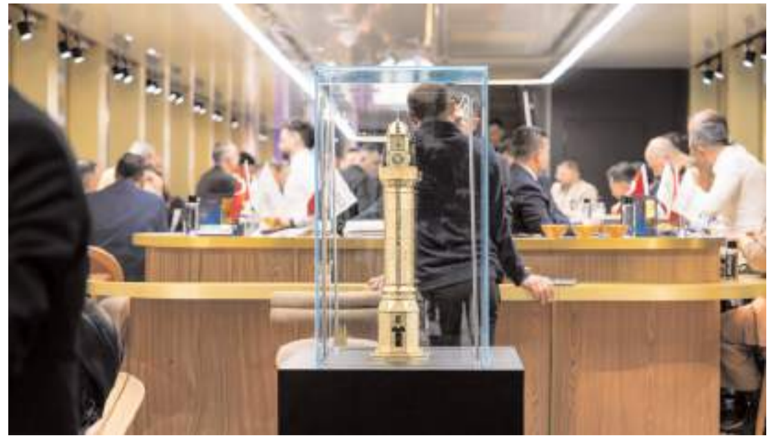
Fuarda altından imal edilen Saat Kulesi maketide sergileniyor.