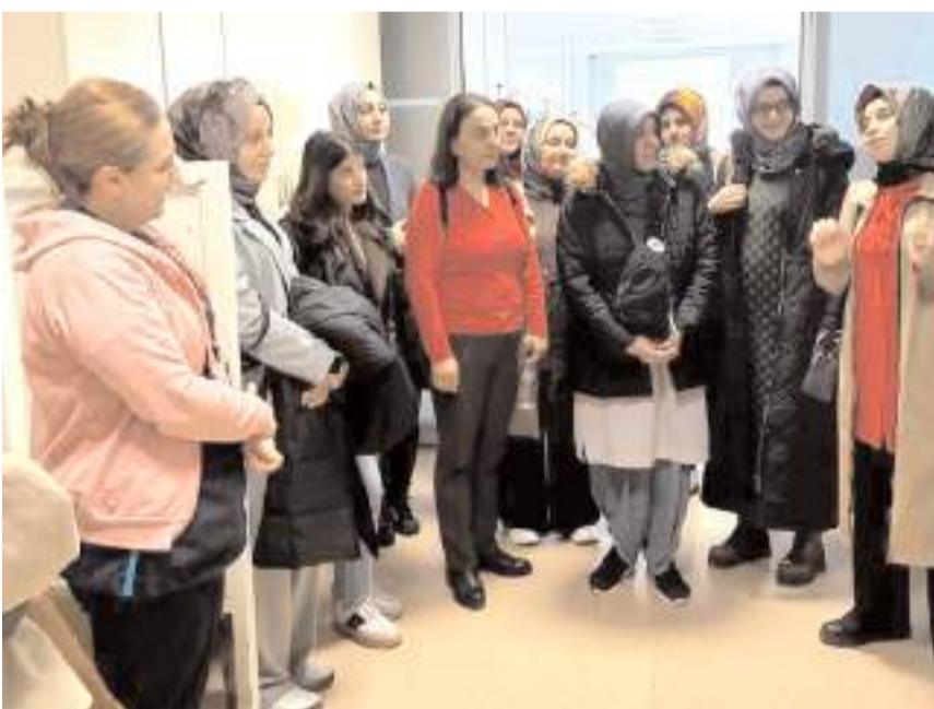
Teorik eğitimlerin yanı sıra interaktif oturumlar, vaka analizleri ve deneyim paylaşımlarına da yer verildi.