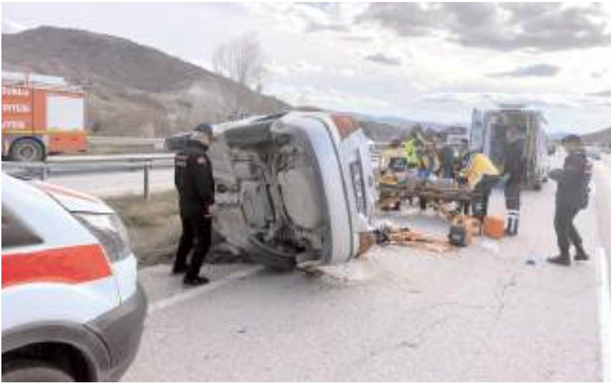
Kaza, Çorum-Ankara kara yolu Arifegazili köyü yakınlarında meydana geldi.

Çorum'un Sungurlu ilçesinde devrilen otomobildeki 3 kişi yaralandı.