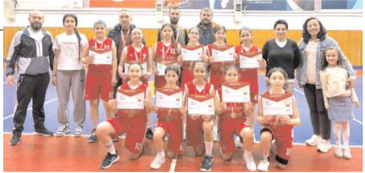
Mustafa Kemal Ortaokulu kız takımı final maçını kazanarak yarı final grubuna yükselmeyi başardı