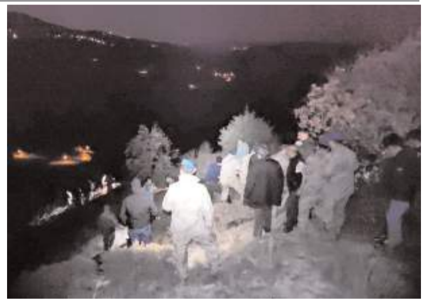
Ekipler, çelik halatlar yardımıyla kayalıklardan aşağı sarkarak yaralıya ulaştı.

İlk muayenede sol bacağının kırıldığı ve vücudunun çeşitli yerlerinden yaralandığı belirlenen Gökğöz, hastanede tedavi altına alındı.