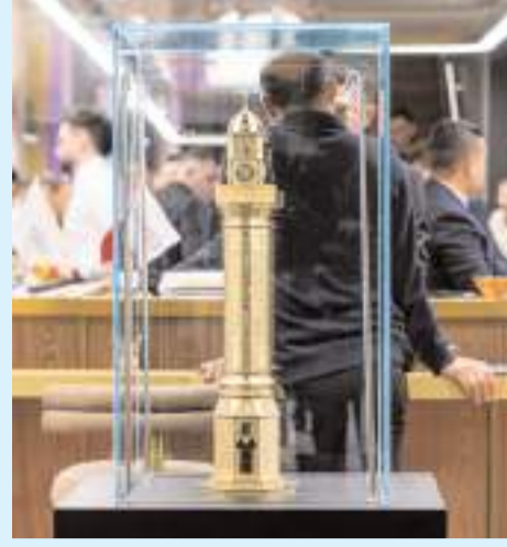
Fuarda altından imal edilen Saat Kulesi maketide sergileniyor.