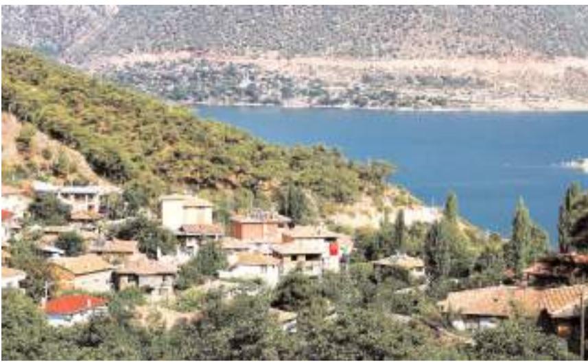
Program bu hafta Cumartesi günü saat 12.30'da TRT Türk ekranlarında yayınlanacak.