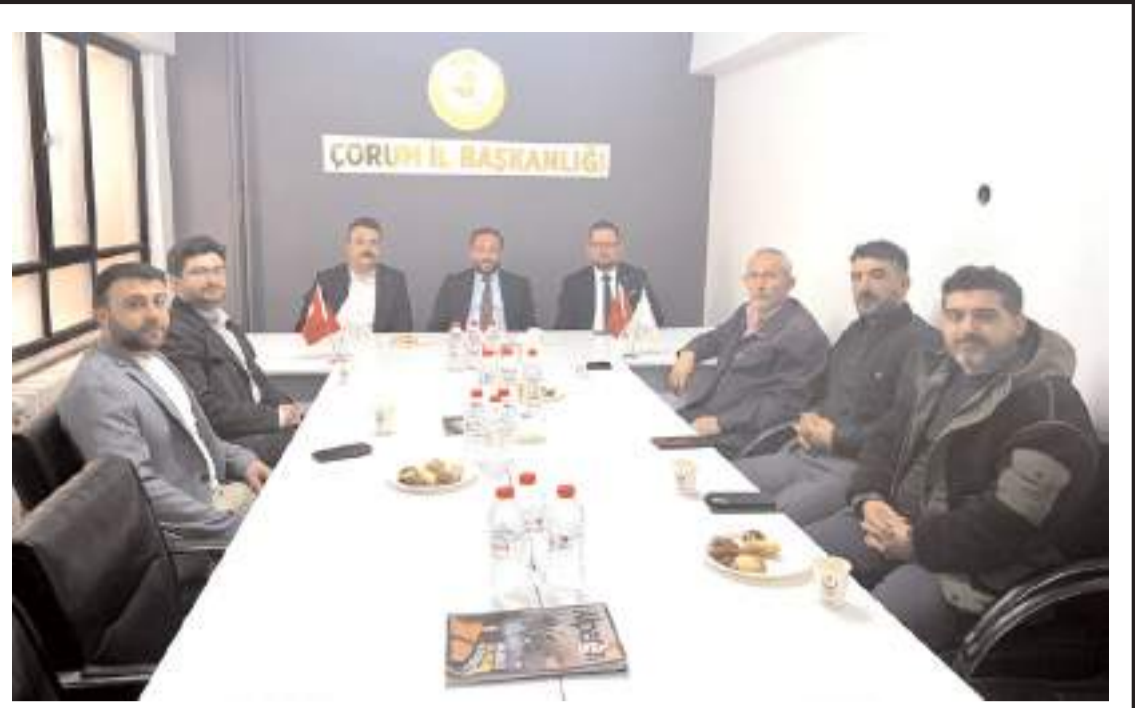
Ziyarete gündeme ilişkin değerlendirme yapıldı.