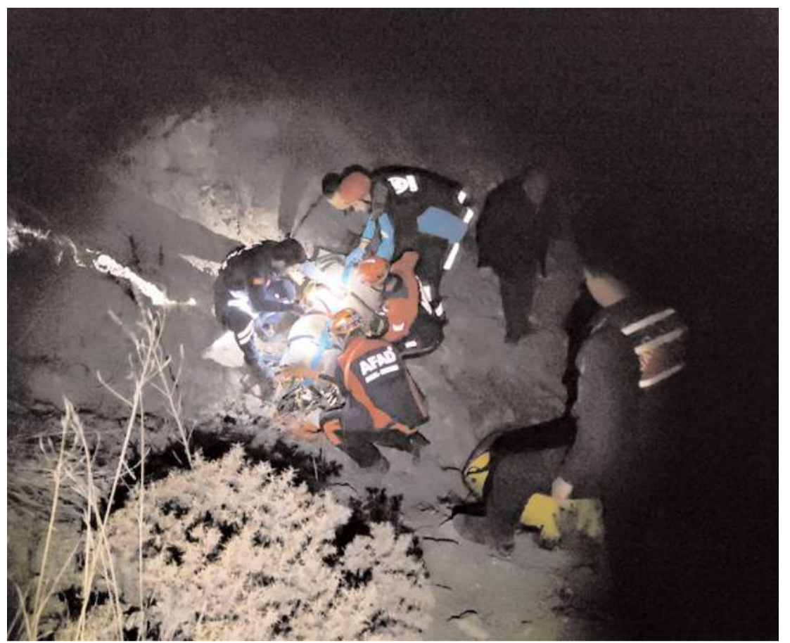
Olay Çalyayla köyü Arpalık kayalıkları mevkinde meydana geldi.

Kazada sürücü ile araçtaki A.T. ve V.T, sağlık ekiplerince ambulanslarla Sungurlu Devlet Hastanesine kaldırıldı.(AA)