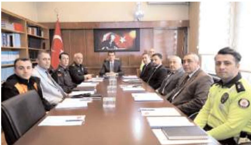
Toplantı Kaymakam Mutlu Köksal'ın başkanlığında yapıldı.

Çorum'un Sungurlu ilçesinde trafik sorunlarının çözülmesi amacıyla, Kaymakam Mutlu Köksal başkanlığında İlçe Trafik Komisyonu Toplantısı gerçekleştirildi.