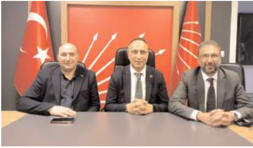
Ziyarete parti çalışmaları istişare edildi.