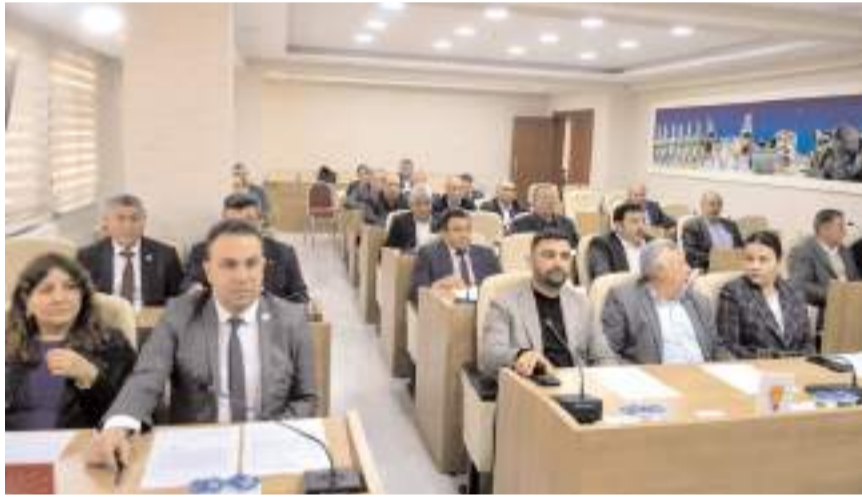
Mecliste gündem maddeleri görüşülerek karara bağlandı.