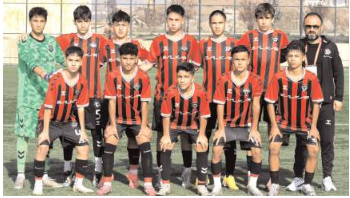
Çorum FK U 14 takımı bugün Amasya'da Tokat Belediye Plevnespor ile ikinci tur için mücadele edecek

Bunun üzerine Dodurga Belediye Beyliğispor takımı bu maçta 3-0 hükmen galip sayıldı.