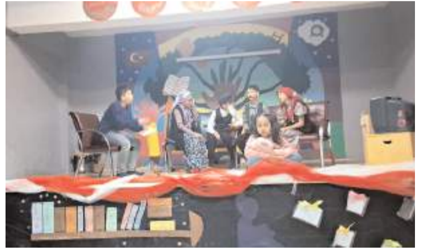
Program Kınık Ortaokulunda yapıldı.

Etkinliğin, öğrencilerin sergilediği özgüvenli performanslar protokol üyeleri tarafından takdirle karşılanırken, program boyunca oluşan ilgi ve