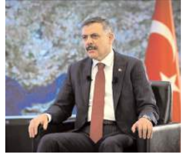
İçişleri Bakanı Mustafa Çiftçi