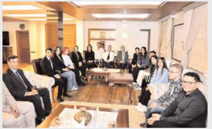
Öğrenciler, Vali Ali Çalgan'a verdiği bilgi ve tavsiyeler için teşekkür etti.

Türkiye Cumhuriyeti'nin köklü devlet yapısına dikkat çeken Vali Çalgan, başarının anahtarının azim ve gayret olduğunu