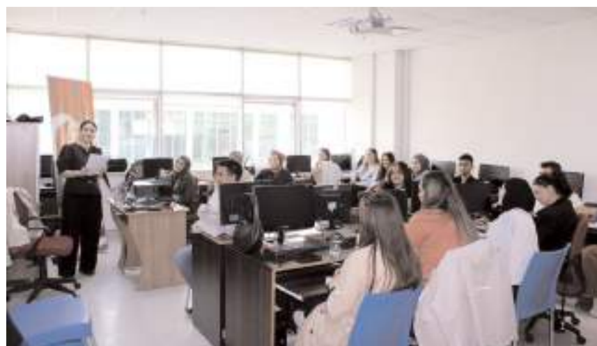
Eğitimde kariyer planlama ve iş bulma becerileri konuları anlatıldı.