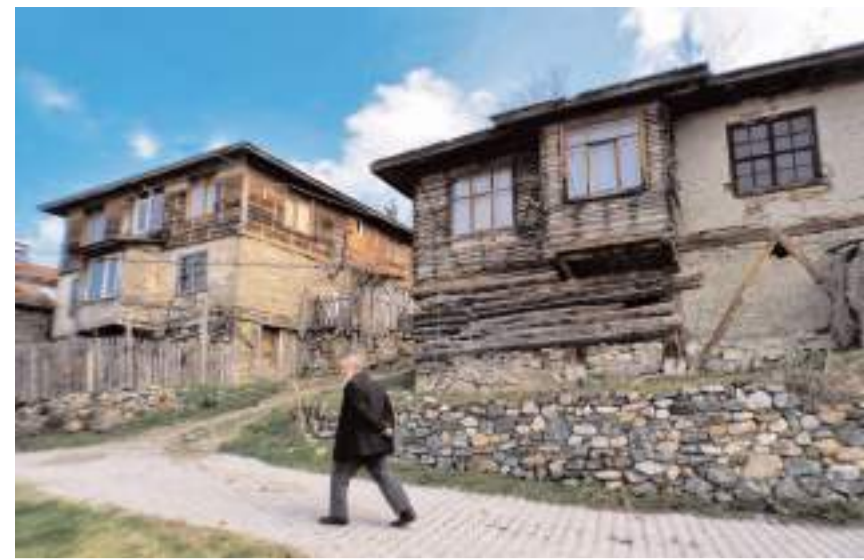
Köy halkının günlük yaşamı ve üretim faaliyetleri izleyicilerle buluşacak.

"Köy Havası" programı bu hafta Cumartesi günü saat 12.30'da TRT Türk ekranlarında yayınlanacak. (Haber Merkezi)