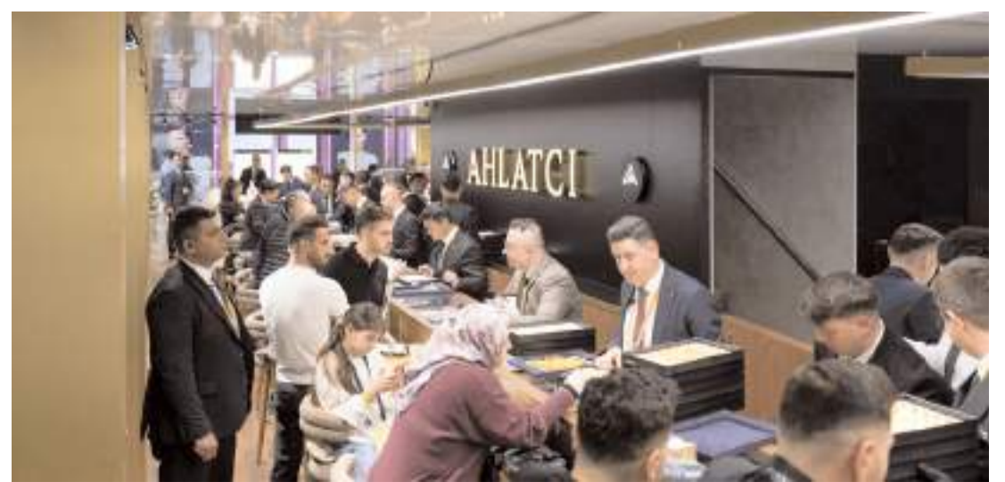
Ahlatcı Kuyumculuk’un standı fuarda büyük ilgi gördü.