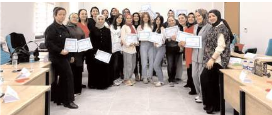
Eğitimin sonunda katılımcılara katılım belgesi verildi.