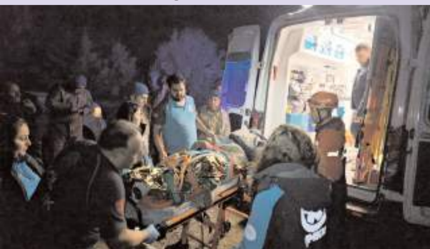
Olay Çalyayla köyü Arpalık kayalıkları mevkinde meydana geldi.