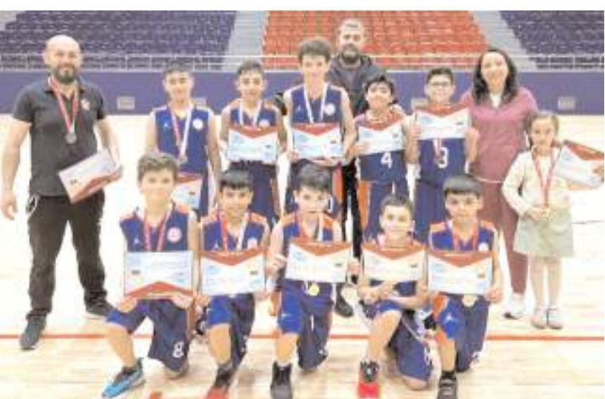
Yıldırım Beyazıt İmam Hatip Ortaokulu erkek basketbol takımı grup birinciliğini kazandı

İki takımımız Sivas'ta yapılacak yarı final grubunda mücadele edecek.