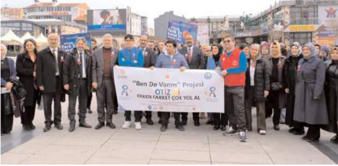
Kadeş Barış Meydanında toplanan vatandaşlar ve protokol üyeleri Hanönü Meydanı'na yürüdü.