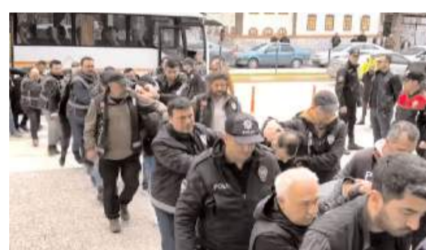
Gözaltına alınan 23 şüpheli adliyeye sevk edildi.