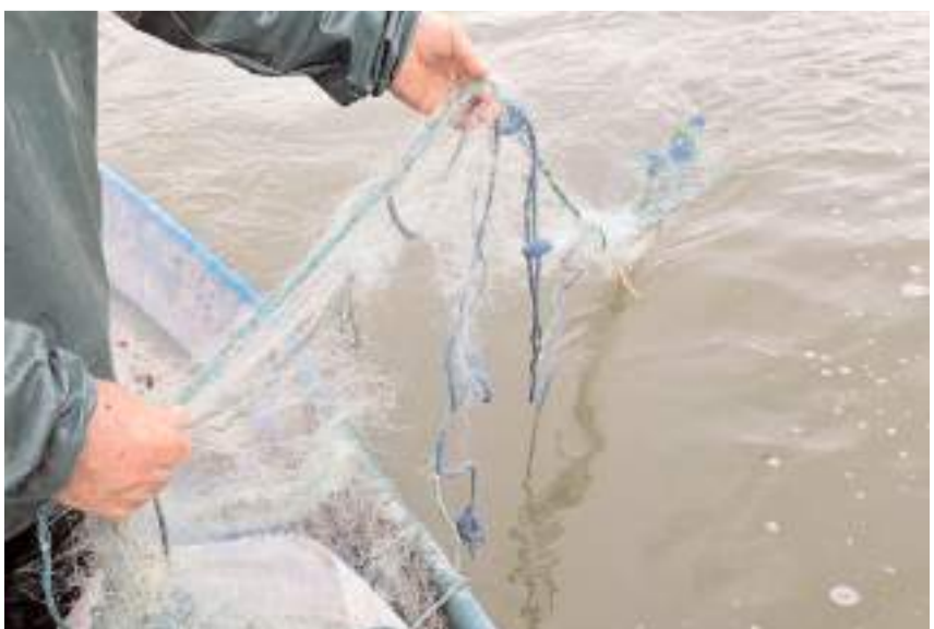
Denetimlerde 800 metre uzunluğunda kaçak balık ağı tespit edildi.