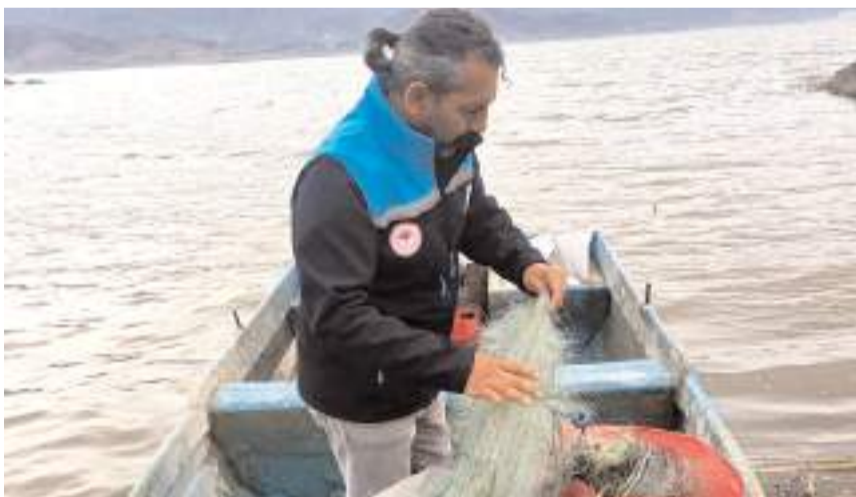
Boyabat Baraj Gölü'nde kapsamlı bir denetim gerçekleştirildi.

Denetimlerin aralıksız ve kararlılıkla sürdürüleceği belirtilirken, vatandaşlardan da yasa dışı avcılık faaliyetlerine karşı duyarlı olmalarını istendi.