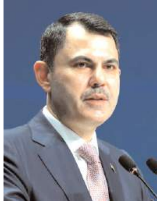
Çevre Şehircilik ve İklim Değişikliği Bakanı Murat Kurum

Daha önce 11 Nisan'da çekileceği duyurulan Çorum TOKİ kura tarihi değişti.