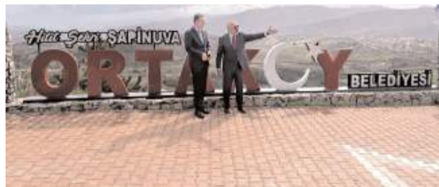
Ziyaretin ardından ilçenin tarihi ve turistik yerleri gezildi.