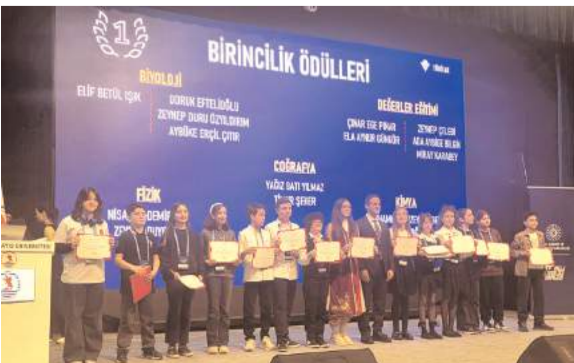
TÜBİTAK Ortaokul Öğrencileri Araştırma Projeleri Yarışmasının bölge finali Samsun'da yapıldı.