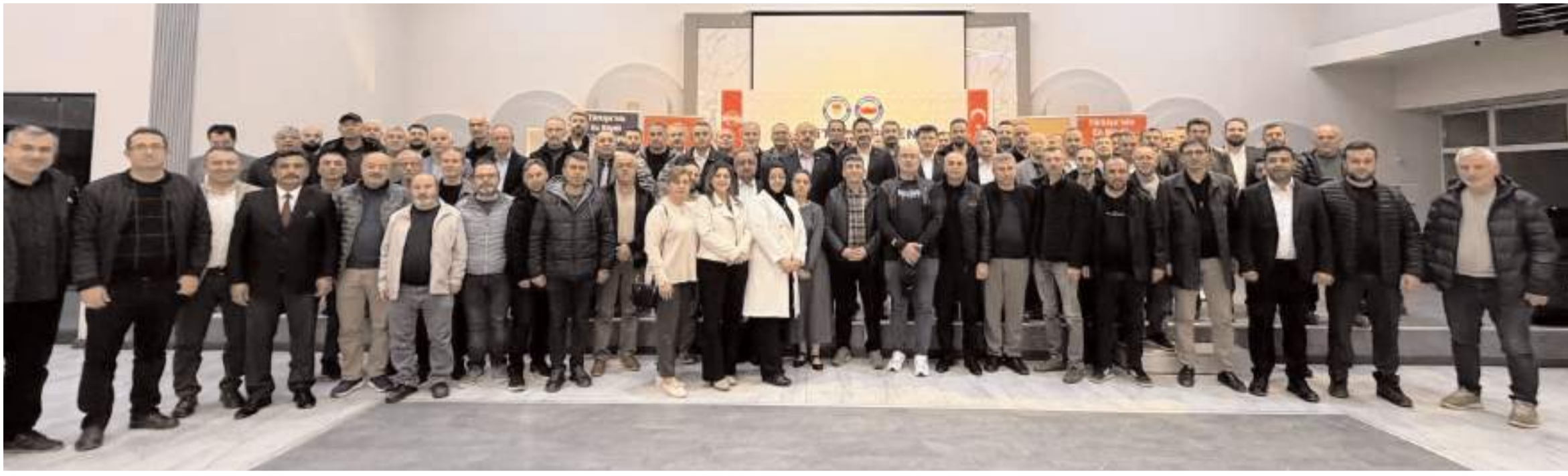
Eğitim-Bir-Sen Çorum 1 Nolu Şubesi İl Divan Kurulunun sonunda toplu hatıra fotoğrafı çekildi.