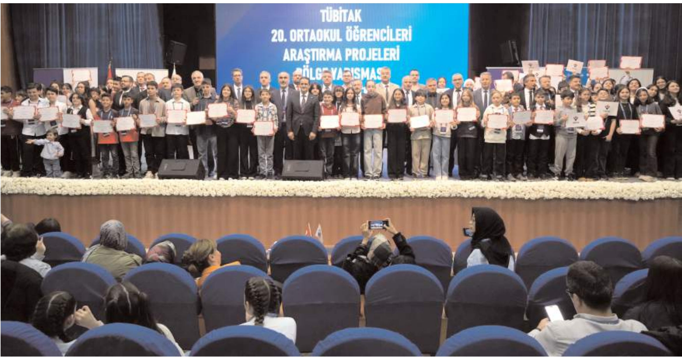
20. Ortaokul Öğrencileri Araştırma Projeleri Yarışması Bölge Finali Samsun'da, Ondokuz Mayıs Üniversitesi(OMÜ) ev sahipliğinde yapıldı.