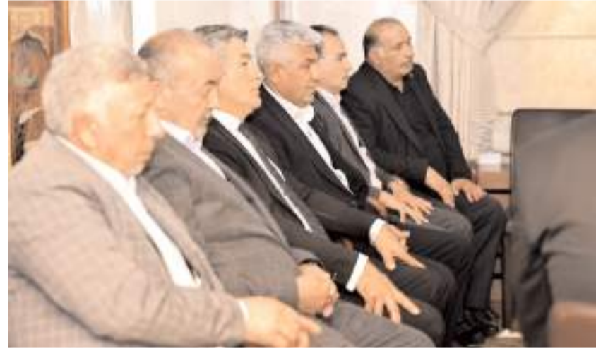
Ziyarete meclis üyeleri de katıldı.