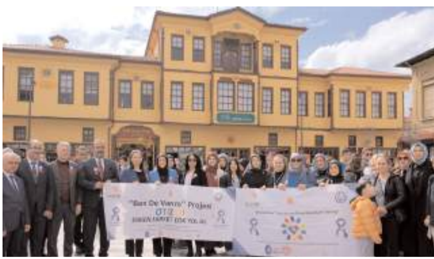
"Dünya Otizm Farkındalık Günü" yürüyüşüne katılım yüksek oldu.

Çorum'da "Dünya Otizm Farkındalık Günü" dolayısıyla yürüyüş gerçekleştirildi.