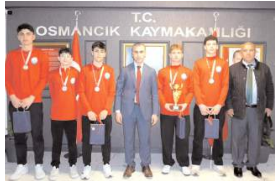
Türkiye ikincisi Osmancık Cumhuriyet Anadolu Lisesi'ni Kaymakamı ziyaret etti