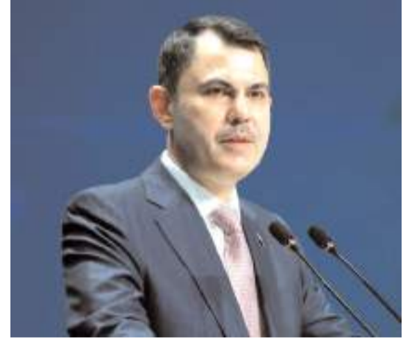
Çevre Şehircilik ve İklim Değişikliği Bakanı Murat Kurum