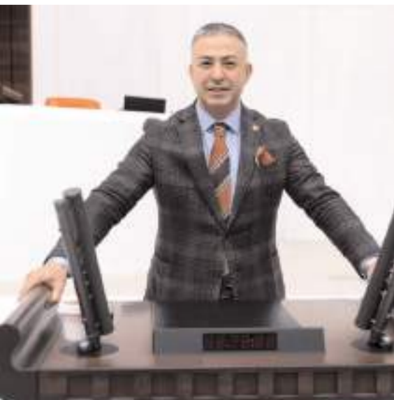
Milletvekili Mehmet Tahtasız

"Çorum ilimizin Meram Hastanesi olan, 27 şehirde 55 taşınmaz yani çoğu sağlık alanı, okul yeri, kız yurdu, spor alanları olan yerleri satıyoruz. Yetmedi mi yirmi üç yıldır sattıklarınız? Dün yapılan ihaleyle Çorum merkez Çağşak, Evcienikışla, Evcioortakışla, Evcikuzkışla, Mislerovacı ve Hankozlusı köylerinin yer aldığı bölgede maden arama faaliyetlerine başladınız. Çorum'un içme ve tarımsal su ihtiyacını karşılayan havzalar yine zenginlere peşkeş çekiliyor. Bakın, yandaş şirketlerinizin para kazanması için bir köyün yok olmasına göz yumuyorsunuz. Tüm itirazlarımıza rağmen Sungurlu Karakaya köyünün dibinde taş ocağına izin verdiniz. Neden izin verdiniz?" (Haber Merkezi)