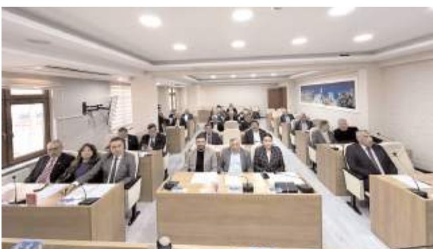
Toplantıda İl Encümeni seçimi yapıldı.