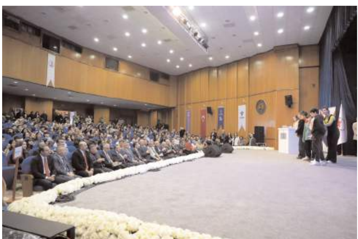
Yarışmada derece elde eden öğrencilere ödülleri verildi.