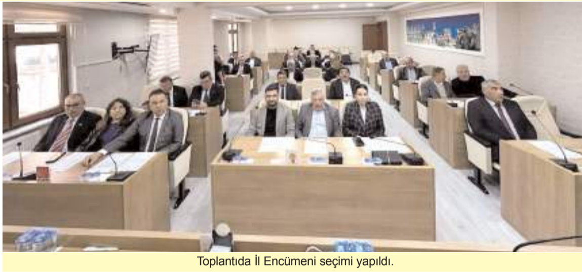
Toplantıda İl Encümeni seçimi yapıldı.