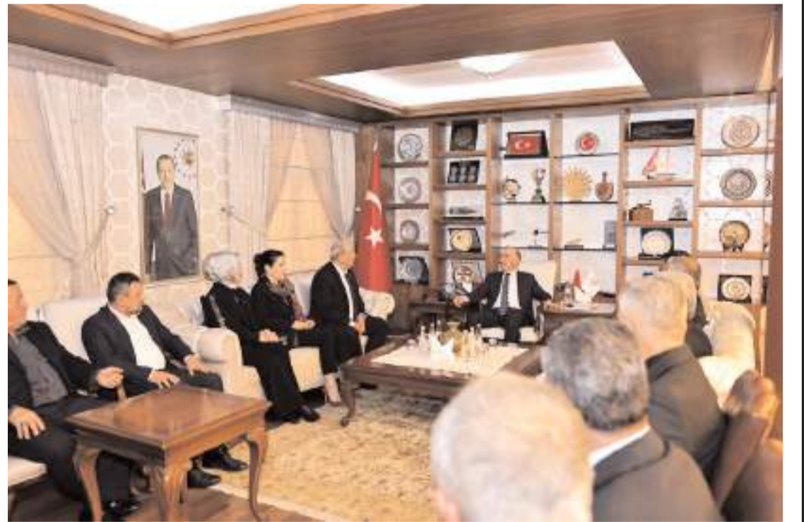
Ziyarete meclis çalışmaları değerlendirildi.