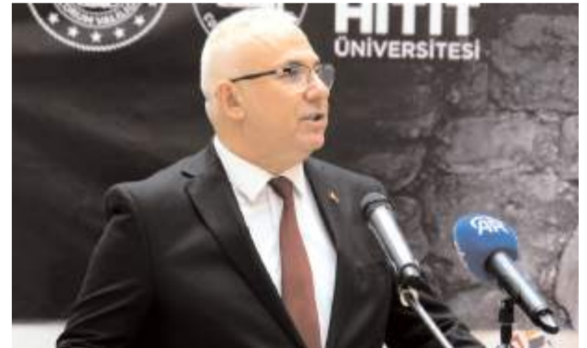
Prof. Dr. Zekeriya Işık

Bu özelliğiyle Çorum'un birçok kültüre ev sahipliği yaptığını, Türkiye'nin de tarihin en eski medeniyetlerine beşiklik etmekte olduğunu belirten Işık, "Devletimiz ilgili kurum ve kuruluşlarını harekete geçirecek bu zengin tarihi ve kültürel mirasın gün yüzüne çıkartılması, restorasyonu ve korunması için büyük bir çaba ve gayret göstermektedir. Ülke sınırında müzelerimizin gelişmişlik ve zenginlik seviyesi, yıldan yıla artarak devam eden ziyaretçi sayılarıyla şükür ki göz doldurmaktadır." dedi.