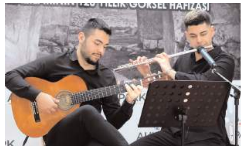
Sergide müzik dinletisi yapıldı.

Kültür ve Turizm Bakanlığı verilerine göre Türkiye'nin yıllık 800 arkeolojik kazı çalışması ile dünyada ilk sırada yer aldığını dile getiren Işık, "Bu çalışmaların bir parçası olarak Boğazkale-Hattuşa, Ortaköy-Şapınova ve Alacahöyük'te sürdürülen uzun soluklu arkeolojik kazı çalışmaları, insanlık tarihi adına çok önemli keşiflere sahne olagelmıştır. Bu durum tüm dünyada akademik ve kültürel çevrelerde ilgi ile takip edil-