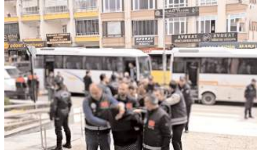
Operasyon Çorum merkezli olmak üzere 5 ilde yapıldı.

Olayla ilgili soruşturma sürerken, ayrıntıların ilerleyen saatlerde netlik kazanması bekleniyor.