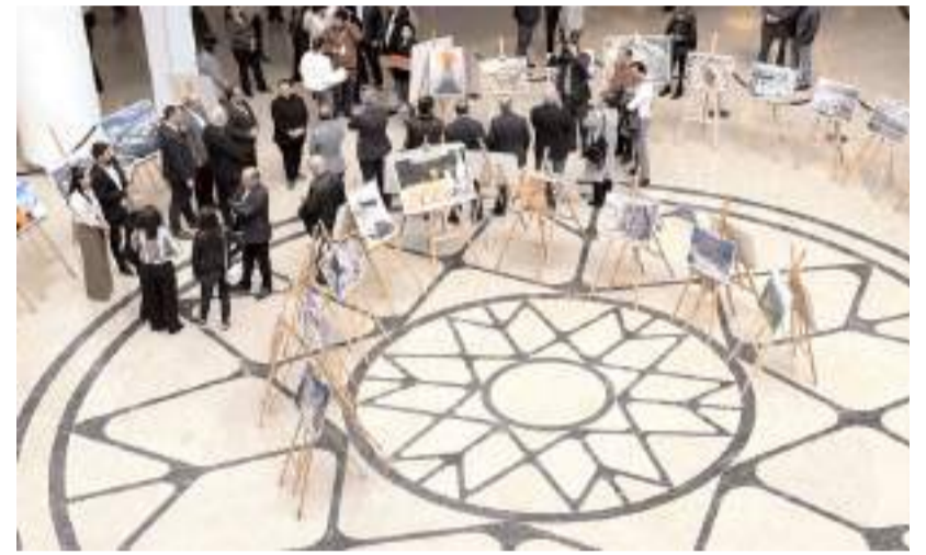
Sergi AHL Park AVM'de açıldı.

Hititlere başkentlik yapan Çorum'un Boğazkale ilçesindeki Hattuşa Antik Kenti'nin UNESCO Dünya Mirası Listesi'ne alınışının 40. yılı dolayısıyla "Hattuşa Kazılarının 120 Yıllık Görsel Hafızası: 1906-2026" konulu fotoğraf sergisi açıldı.