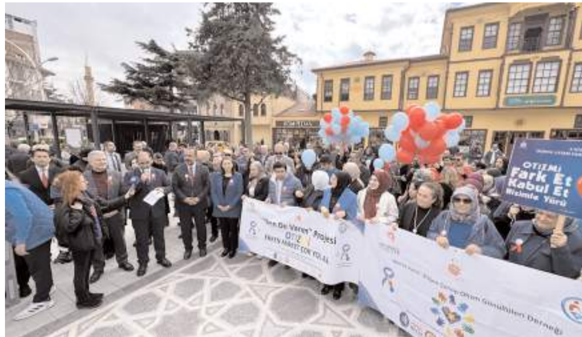
"Dünya Otizm Farkındalık Günü" yürüyüşüne katılım yüksek oldu.