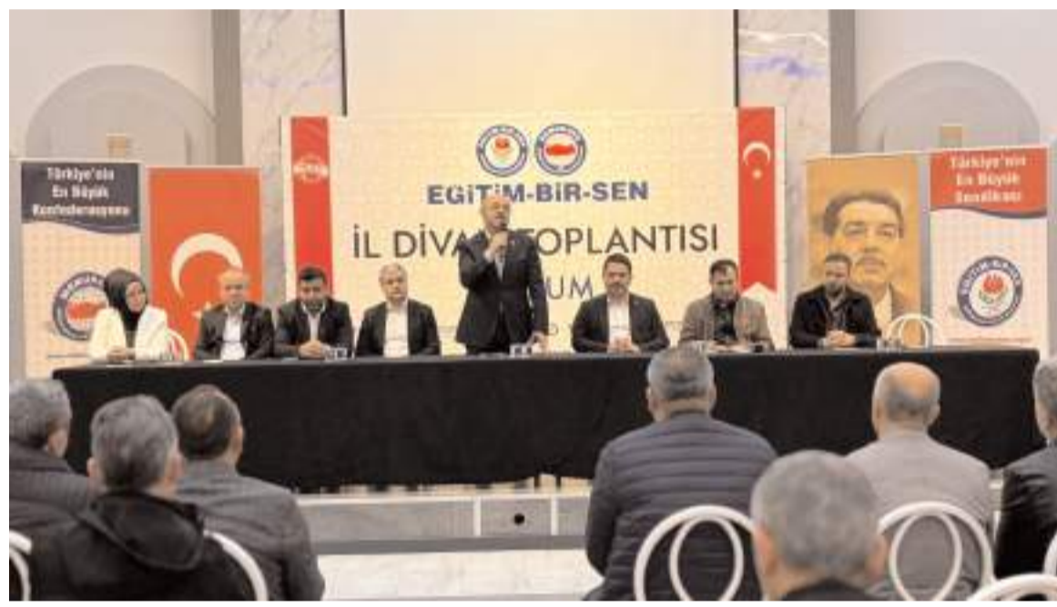
Eğitim-Bir-Sen Genel Sekreteri Talat Yavuz konuşma yaptı.

Toplantının son bölümünde teşkilat mensuplarının sorularını yanıtlayan Genel Sekreter Talat Yavuz, sendikal mücadelenin çözüm odaklı bir anlayışla süreceğini yineledi. (Haber Merkezi)