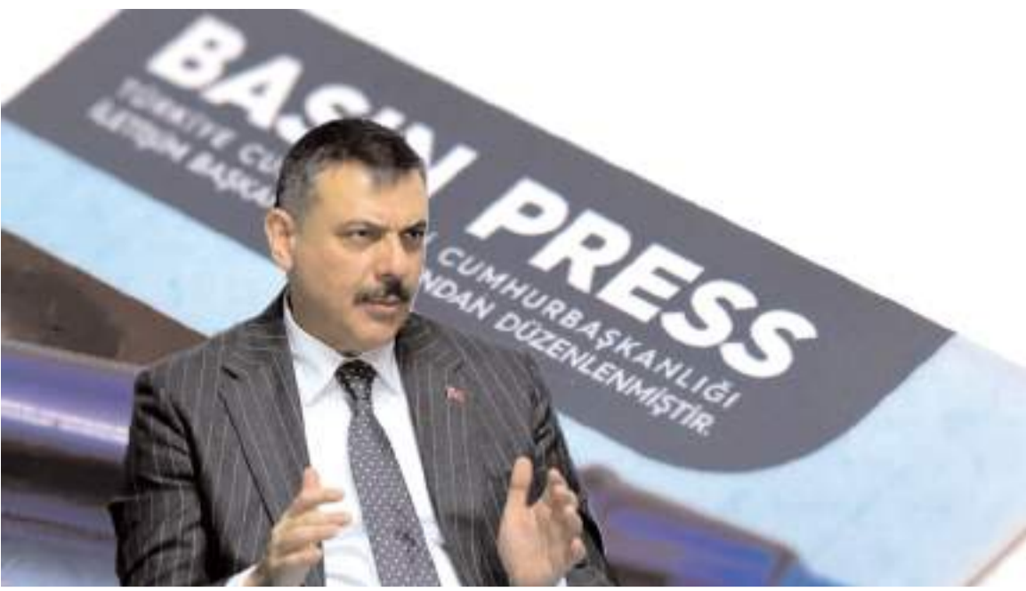
İçişleri Bakanı Mustafa Çiftçi