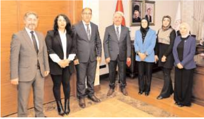
Sivil toplum kuruluşu temsilcileri ve ilgili kurum yetkilileri Vali Ali Çalgan'ı ziyaret etti.