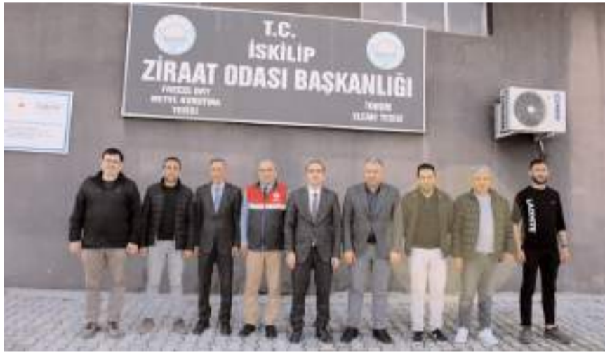
Ziyaretin ardından hatıra fotoğrafı çekildi.