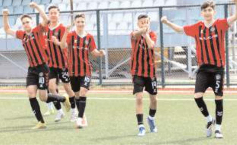
Çorum FK U 14 takımı futbolcuların gol sevincini böyle yaşadılar

Çorum FK U 14 takımı play-off ikinci turunda 14 Nisan'da yeri daha sonra açıklanacak maçta Çaykur Rizespor ile karşılaşacak. Rizespor takımı dün Giresun'da oynadığı ilk tur maçında Erbaaspor'u 4-0 yendi. Çorum FK ile Çaykur Rizespor maçının galibi aynı tarihte oynanacak Samsunspor ile Trabzonspor maçının galibi ile karşılaşacak. Bu maçı kazanan takım Antalya'da yapılacak Türkiye finallerinde mücadele etmeye hak kazanacak.