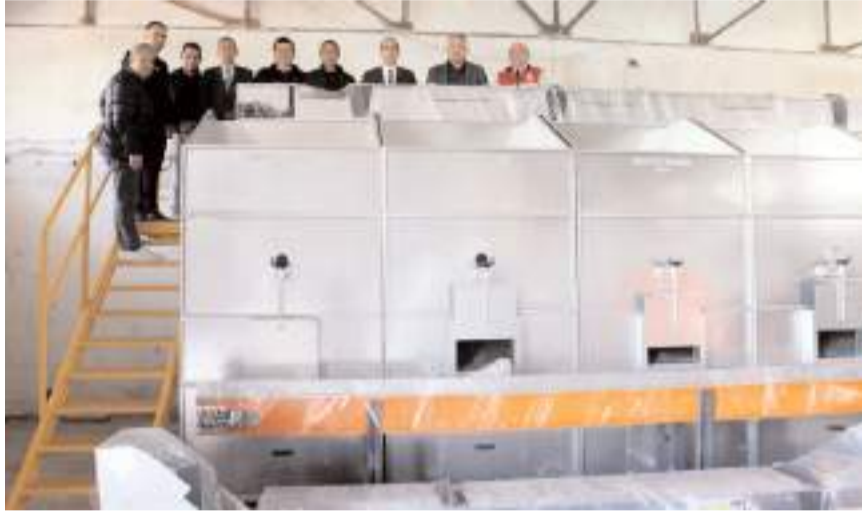
Tesiste Yatay Ceviz Soyma Makinesi, Bekletme Kasası, 5 adet (1'er tonluk) Kurutma Makinesi, Boş-Çürük Ayırma Makinesi ve Boylama Makinesi bulunuyor.