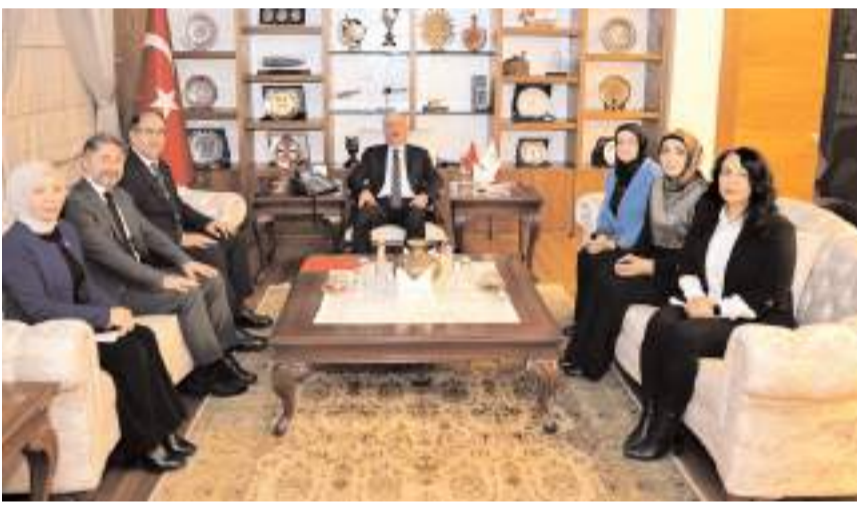
Ziyarete Otizm ile ilgili yapılan çalışmalar değerlendirildi.

Çorum Valisi Ali Çalgan, Dünya Otizm Farkındalık Günü dolayısıyla sivil toplum kuruluşu temsilcileri ve ilgili kurum yetkililerini kabul etti.