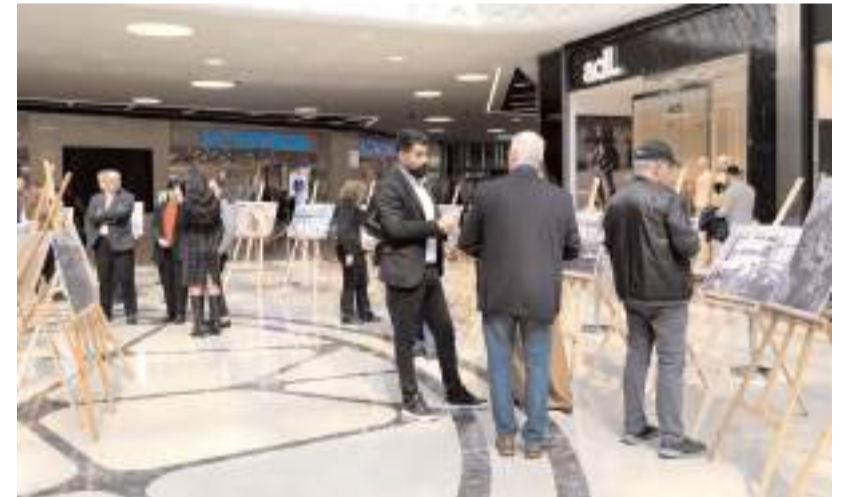
Sergide Hattuşa Antik Kentinde çekilen fotoğraflar yer alıyor.