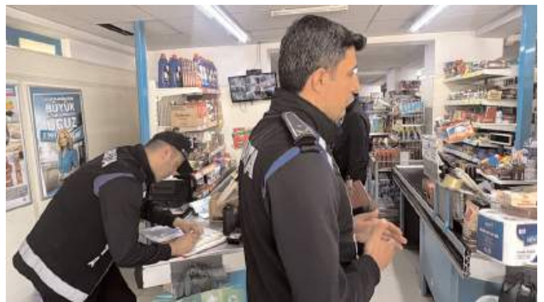
Marketlerde ürünlerin reyon ve kasa fiyatları kontrol edildi.

Konuya ilişkin değerlendirmede bulunan Samsun Bölge Müdürü Sedat Adıgüzel, "YEDAŞ çatısı altında edindiğimiz saha tecrübesini, bu büyük yatırım döneminde daha güçlü bir hizmet anlayışıyla sahaya yansıtacağız. Samsun'un enerji altyapısını daha modern, dayanıklı ve dijital bir yapıya kavuşturmak için çalışmalarımızı kararlılıkla sürdüreceğiz" ifadelerini kullandı. (İHA)