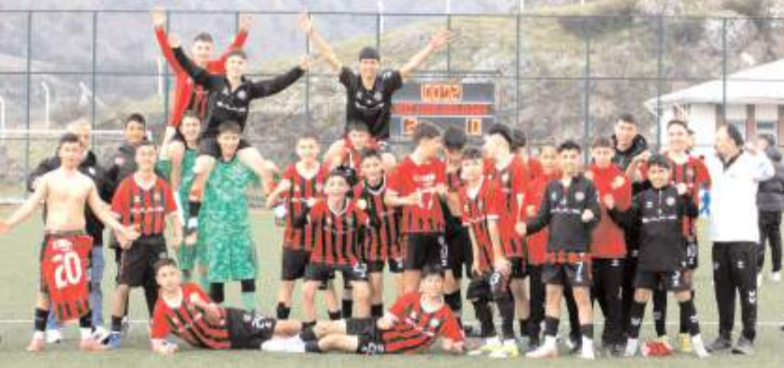
Mimar Sinanspor U 14 takımı play-off ilk tur maçının kazanmanın sevincini böyle yaşadı