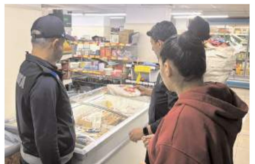
Ekipler, ürünlerin son kullanma tarihlerini kontrol etti.

Zabıta ekipleri, vatandaşları alışveriş sırasında ürünlerin son tüketim tarihlerini kontrol etmeleri ve fiyat farklılıklarına karşı dikkatli olmaları konusunda uyardı. (AA)