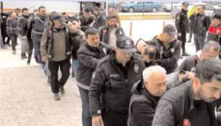
Gözetim altına alınan 23 şüpheli adliyeye sevk edildi.