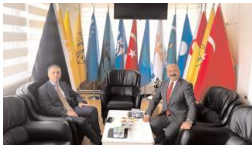
Ziyarete Ortaköy ilçesinde adalet alanında yapılacak çalışmalar istişare edildi.