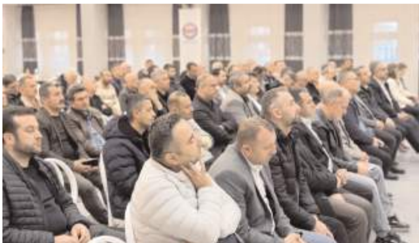
Toplantıda sendika çalışanları istişare edildi.