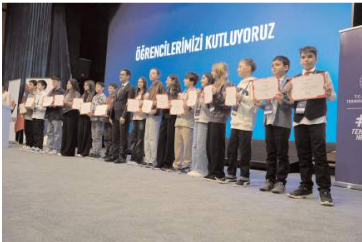
Projeye 10 alanda 3 bin 280 projenin başvurdu ve 100 proje sergilenmeye hak kazandı.

"Proje başvurusunun 3 bin 280'i bölgemizden gerçekleşmiş ve bu sayı ile Samsun Bölgesi birinci sırada yer