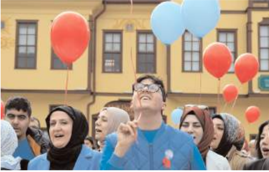
Otizmliler gökyüzüne balon bıraktı.