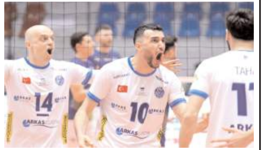
Arkasspor yarı final ilk maçında 3-1 galip gelecek final için avantaj yakaladı

Bu maçtan tur atlayan takım 8 Nisan çarşamba günü saat 17'de Ankara'da Sungurlu Belediyespor ile Efeler Liginde yükselmek için mücadele edecek. Türk voleybolunun ekol takımlarından olan, Avrupa'da kupa kazanan ilk erkek takımı Arkas Spor geçen sezon Efeler Ligi'nden çekilip yoluna 1'inci ligde devam etme kararı almıştı. Sungurlu Belediyespor ise Çorum tarihinde Efeler liginde yükselen ilk takım olmak istiyor.