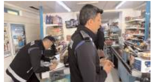
Marketlerde ürünlerin reyon ve kasa fiyatları kontrol edildi.