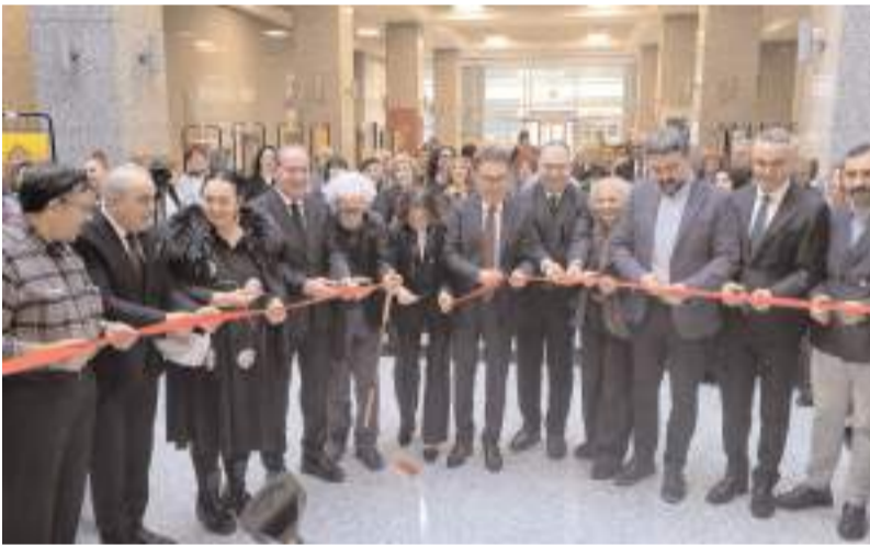
Sergi ABB Konferans Salonu'nda açıldı.