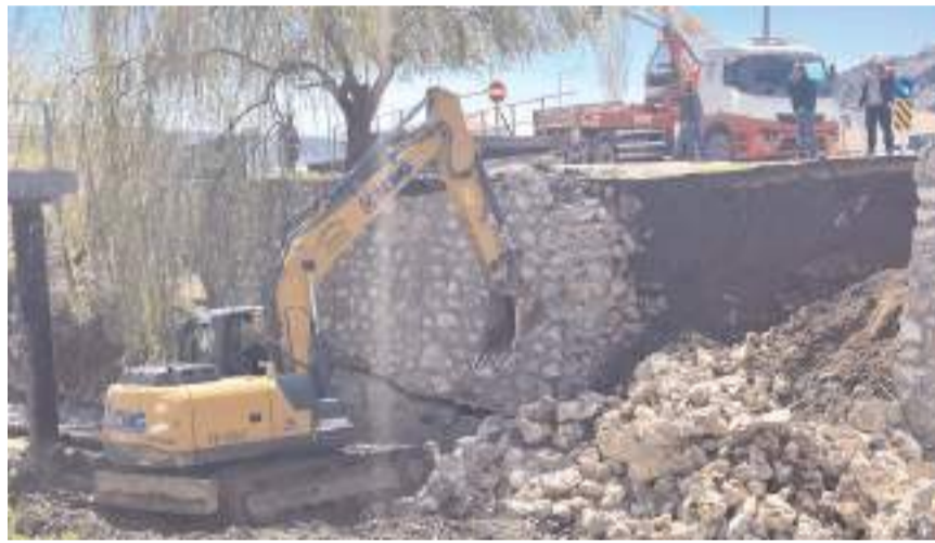
Hasar gören yerde çalışmalar başladı.

Yürütülen çalışmaların tamamlanmasının ardından yaya köprüsünün yeniden yerine konularak vatandaşların kullanımına açılacağı bildirildi.