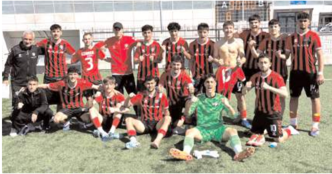
Çorum FK U 19 takımı sezonun son maçını farklı kazanarak ligi moralli bitirdi