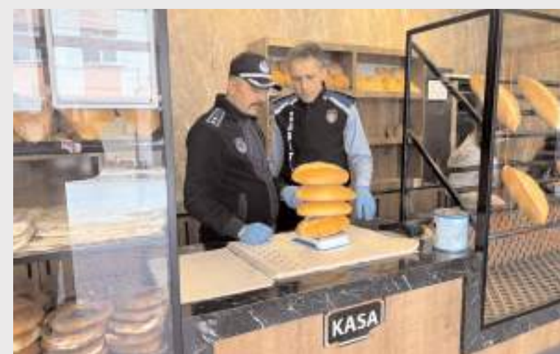
Fırınlarda hijyen koşulları kontrol edildi.

Sungurlu Belediyesi Zabıta Müdürlüğü ekipleri pastane ve fırın denetimlerine devam ediyor.