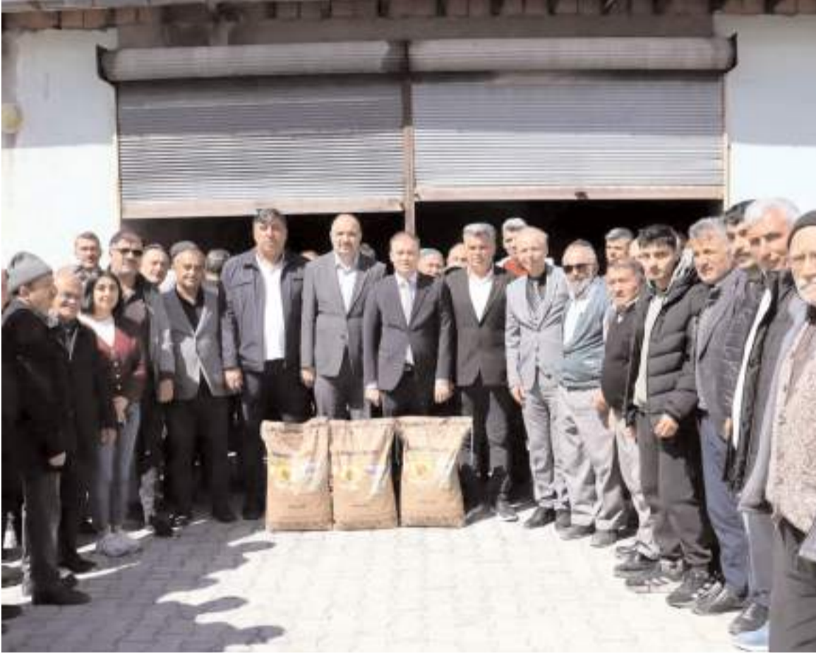
244 çiftçiye yüzde 50 hibe destekli 409 torba ayçiçeği tohumu dağıtıldı.