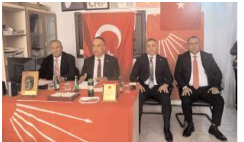
Ortaköy'de Danışma Kurulu toplantısı yapıldı.