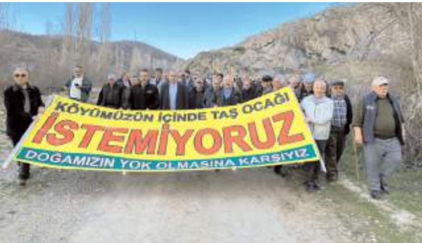
Köy halkı yaptığı eylemle taş ocağına tepki gösterdi.

Projeyle birlikte yılda 3 milyon 500 bin ton taş çıkarılmasının planlandığını belirten Demirkaya, bunun yaklaşık 140 bin kamyon seferi anlamına geldiğine dikkat çekerek, yoğun trafik yükünün hem köy yolunu hem de D-190 devlet karayolunu olumsuz etkile-