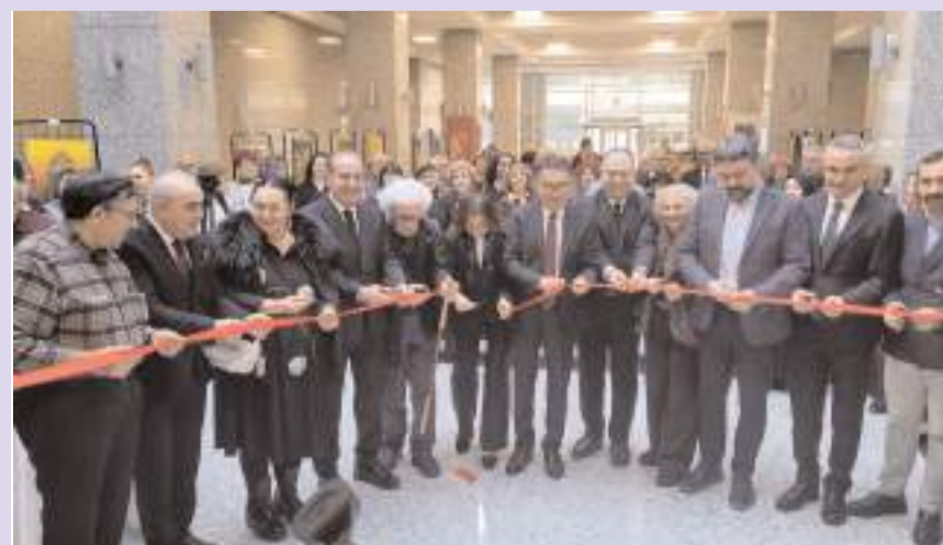
Sergi ABB Konferans Salonu'nda açıldı.