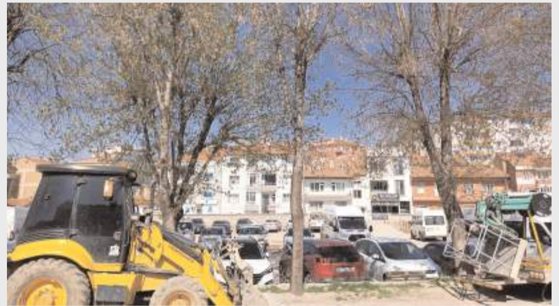
Arazilerin satış ihalesi 20 Nisan Pazartesi günü yapılacak.

Arsaların satış ihalesi 20 Nisan Pazartesi günü saat 14.00 ila 14.30'da Çorum Belediyesi Konferans Salonunda gerçekleştirilecek.