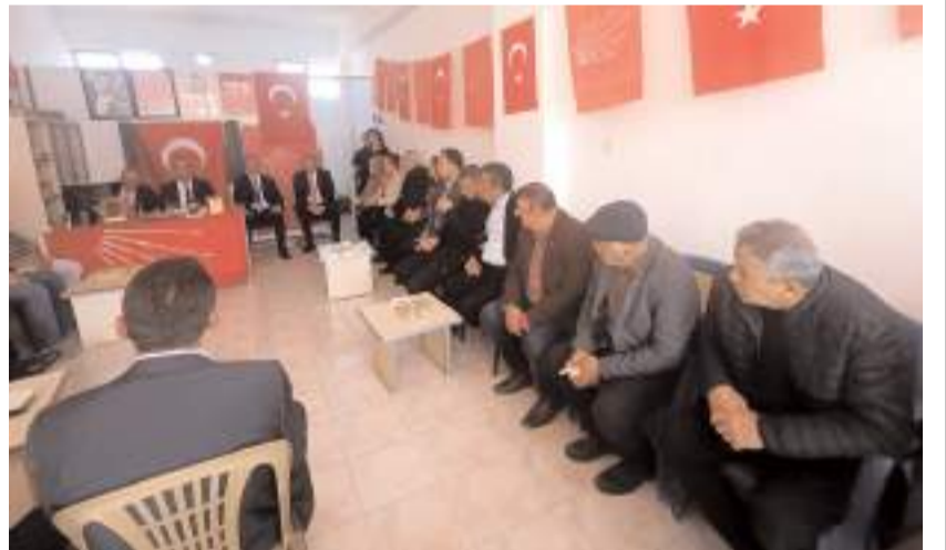
Toplantıda parti çalışmaları istişare edildi.