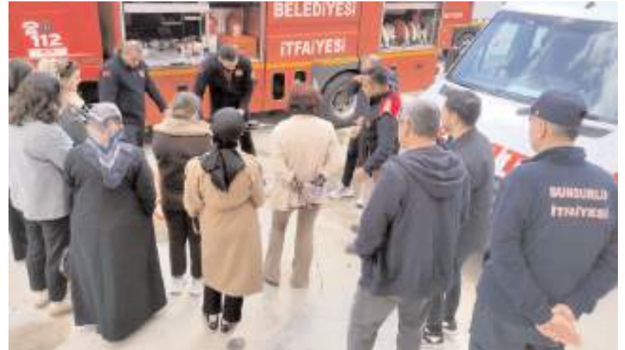
Personelere yangına müdahale ekipmanları tanıtıldı.