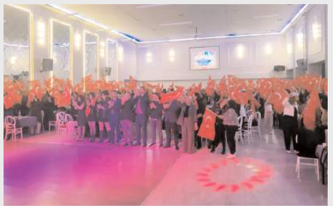
Programa katılım yüksek oldu.

Öte yandan kayıp ihbarı yapılan 4 kişi bulunarak ailelerine teslim edildi.(AA)