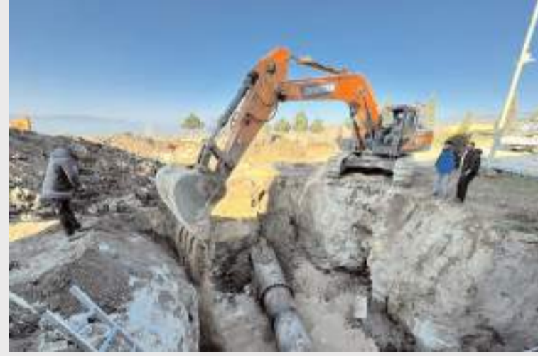
İçme Suyu Arıtma Tesisi ile 2. isale hattının bağlantısı yapıldı.