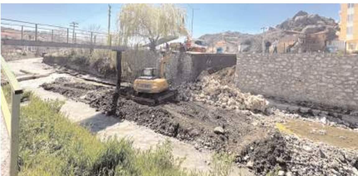
Onarım çalışması nedeniyle köprü kullanıma kapatıldı.