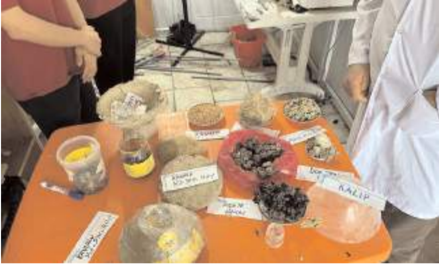
Saklama kapları çeltik kabuğu, kendir ve kil gibi doğal malzemelerle yapıldı.