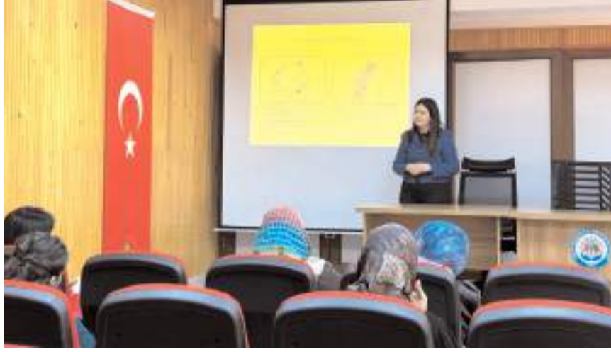
Program Rehberlik ve Araştırma Merkezi'nde gerçekleştirildi.

Eğitim süresince ailelerin aktif katılımı dikkat çekerken, katılımcılar merak ettikleri soruları doğrudan uzmanlara yöneltme fırsatı buldu.