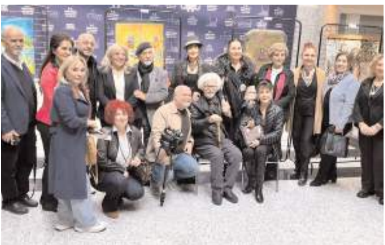
Sanatçılar hatıra fotoğrafı çekindiler.