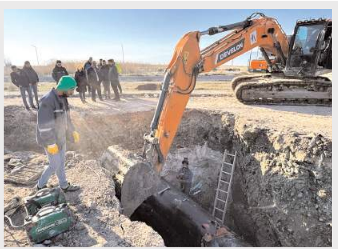
OSB İçme Suyu Arıtma Tesisinde çalışmalar sabah erken saatlerde başladı.