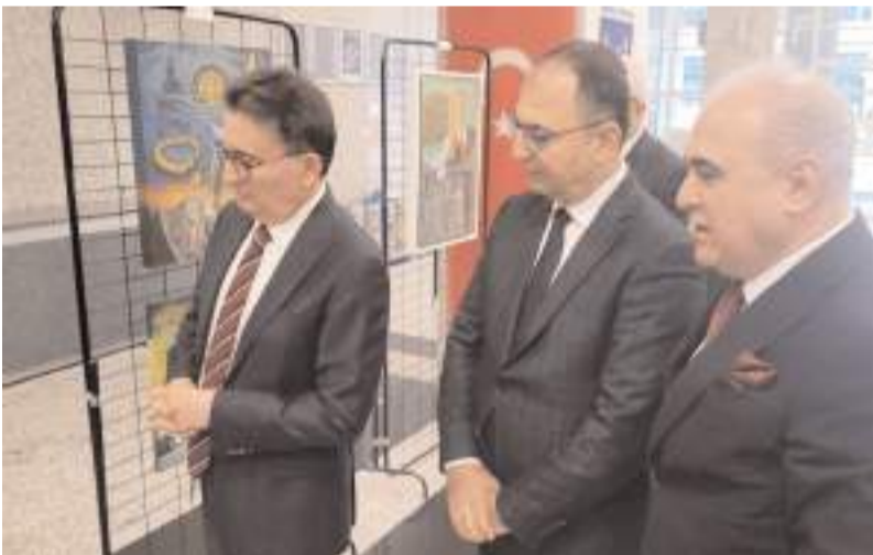
Davetliler sergiyi gezerek eserleri incelediler.