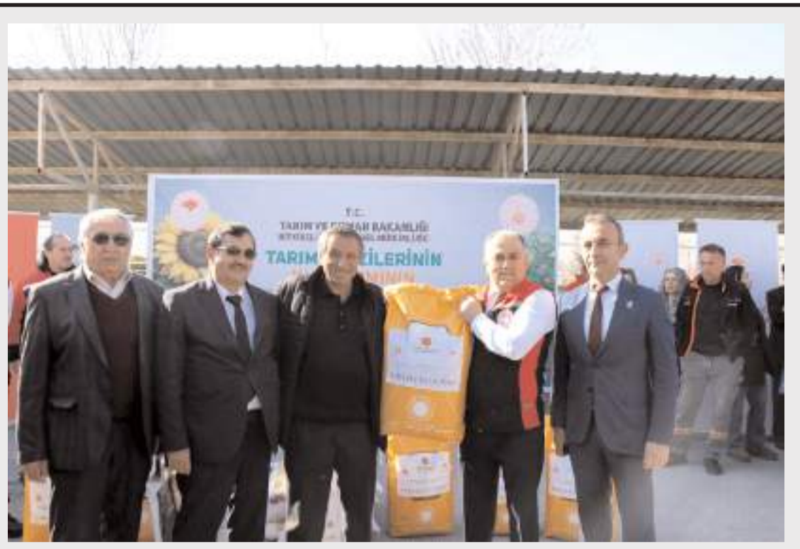
Tohumların teslimi için Tarım ve Orman İl Müdürlüğünde tören yapıldı.