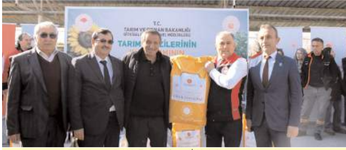
Tohumların teslimi için Tarım ve Orman İl Müdürlüğünde tören yapıldı.

■ Tarım ve Orman Bakanlığı tarafından yürütülen Tarım Arazilerinin Kullanımının Etkinleştirilmesi (TAKE) Projesi kapsamında, İl Müdürlüğü koordinasyonunda üreticilere hibe destekli tohum dağıtıldı. Proje çerçevesinde il genelinde 1006 üreticiye toplam 113 bin 750 kilogram nohut tohumu ile 1134 üreticiye 1648 ünite yerli ve milli yağlık ayçiçeği tohumu %50 hibeli olarak dağıtıldı. * HABERİ5'DE