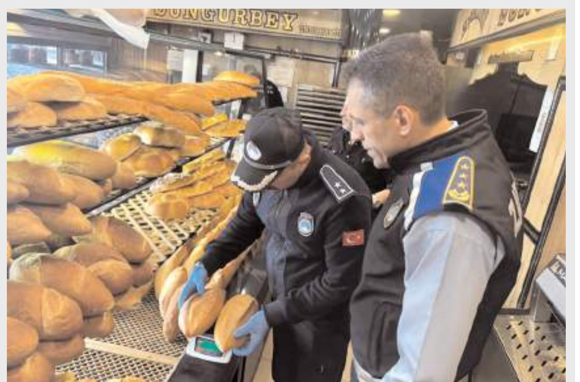
Zabıta ekipleri ekmeklerin gramajlarını kontrol etti.

Ayrıca kurallara uymayan veya dikkat etmeyen iş yerlerine uyarılar yapıldı. (Haber Merkezi)