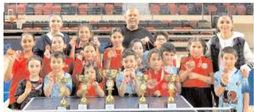
Arenaspor ve Gençlikspor takımları kazandıkları kupalarla birlikte toplu halde