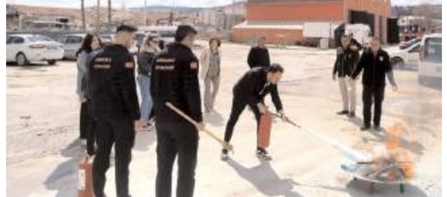
Sungurlu Sosyal Hizmet Merkezi Müdürlüğü personellerine yangına müdahale şekilleri gösterildi.

eğitim faaliyetlerinin aralıksız sürdüreceğini belirtildi.(İHA)