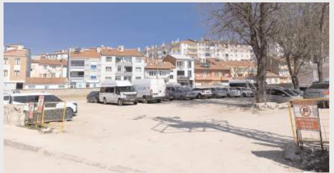
Satışa çıkarılan araziler Recep Tayyip Erdoğan Caddesinde bulunuyor.