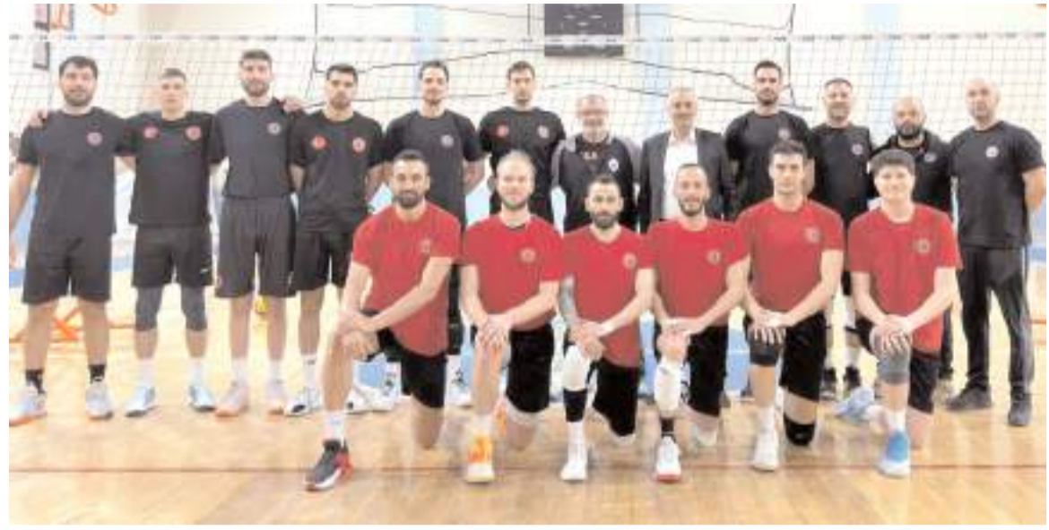
Sungurlu Belediyespor Efeler ligi için bugün Ankara'da oynayacağı final maçının hazırlıklarını tamamladı

Arkasspor maçında takip ettik ve geçen hazırlığımızı yaptık. Bugün yaptığımız antrenmanla hazırlıklarımızı tamamladık. Sporcularım da bizlerde parkede gereken mücadeleyi vereceğiz. Ben tüm hemşehrilerimizi bugün salona gelerek takımlarına destek vermelerini istiyorum. Onların desteği hedefe ulaşmamız için son derece önemli. Bizlere