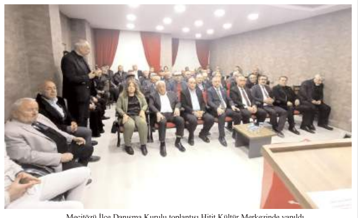
Mecitözü İlçe Danışma Kurulu toplantısı Hitit Kültür Merkezinde yapıldı.