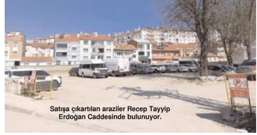
Satışa çıkartılan araziler Recep Tayyip Erdoğan Caddesinde bulunuyor.