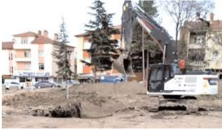
Okul inşaatının temel kazısı başladı.

■ Bir süre önce yıkılan ve Çorum'un en eski okullarından biri olan Tanyeri İlkokulunun yeniden inşaatı için çalışmalar başladı.