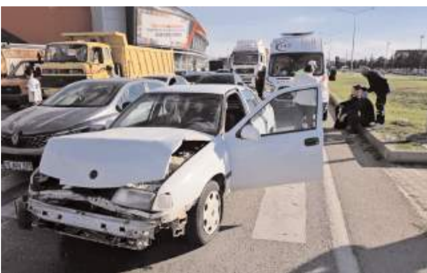
Kazada araçlarda maddi hasar meydana geldi.

Yaralıları, sağlık ekiplerince olay yerinde yapılan ilk müdahalenin ardından Hitit Üniversitesi Erol Olçok Eğitim ve Araştırma Hastanesi'ne kaldırıldı.