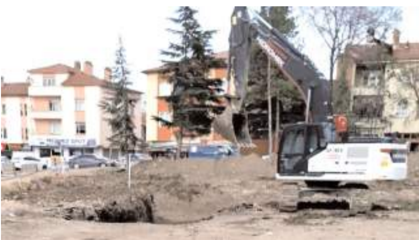
Okul inşaatının temel kazısı başladı.

FATİH BATTAR ki okullarından biri inşaatı başladı. Çorum'un en es- olan Tanyeri İlkokulu 2023 yılında yı-