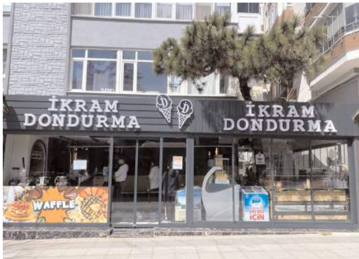
İkram Dondurma Pir Baba Çamlığı karşısında faaliyet gösteriyor.