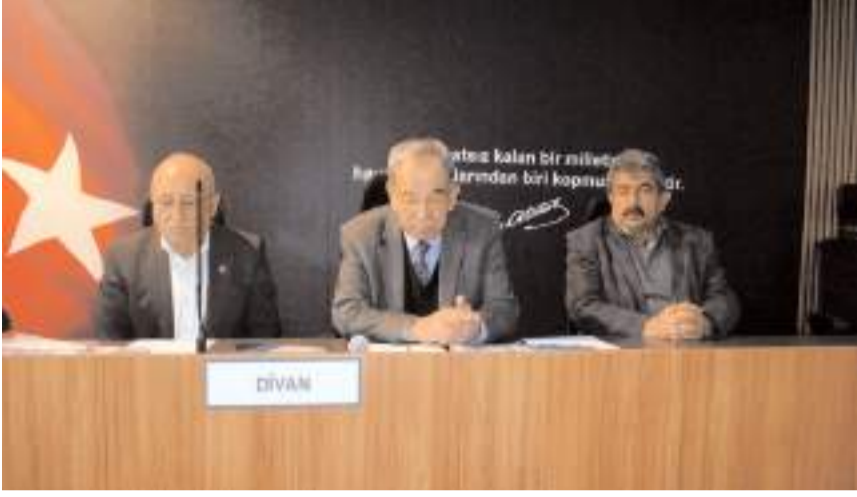
Mali Genel Kurulda ilk olarak divan heyeti belirlendi.