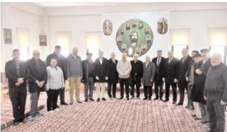
Açılışın ardından davetliler cem evini gezdi.