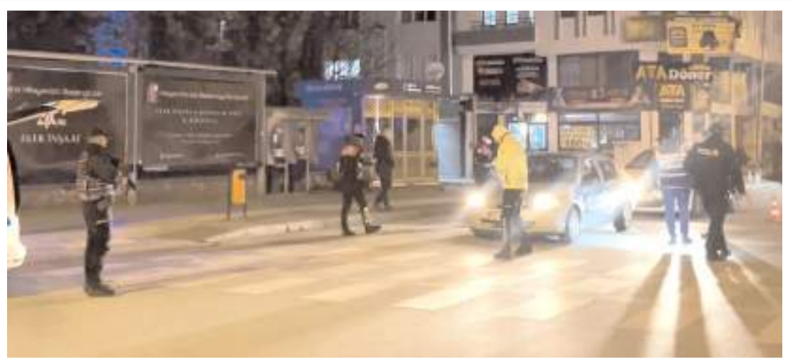
Polis ekipleri şehir merkezinin farklı yerlerinde kontrol noktaları oluşturdu.