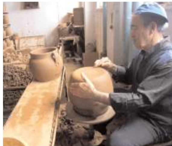
Çorum'un ulusal envanterdeki kayıtlı unsur sayısı 17'den 32'ye yükseldi.

Çorum'un sahip olduğu bu zengin kültürel birikimin, şehrin turizm potansiyeline ve kültürel kimliğine büyük katkı sağlaması bekleniyor. Bu son gelişmeyle birlikte Çorum'un ulusal envanterdeki temsil gücü artarken, tescillenen bu unsurların UNESCO yolculuğu için de önemli bir veri tabanı oluşturulmuş oldu. (Haber Merkezi)