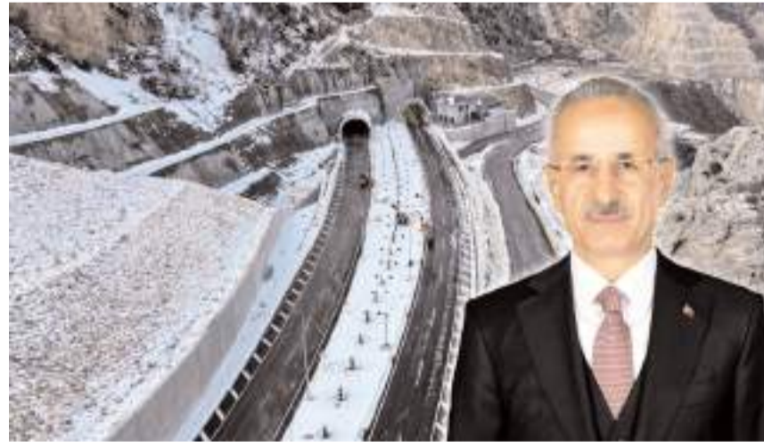
Açılış törenine Ulaştırma ve Altyapı Bakanı Abdulkadir Uraloğlu da katılacak.

Çorum'da yapımı uzun yıllardır devam eden ve bölgenin ulaşım güvenliğini artırması beklenen Kırkdilim Tünelleri, 16 Nisan Perşembe günü Ulaştırma ve Altyapı Bakanı Abdulkadir Uraloğlu'nun katılımı ile hizmete açılacak. * HABERİ'7'DE