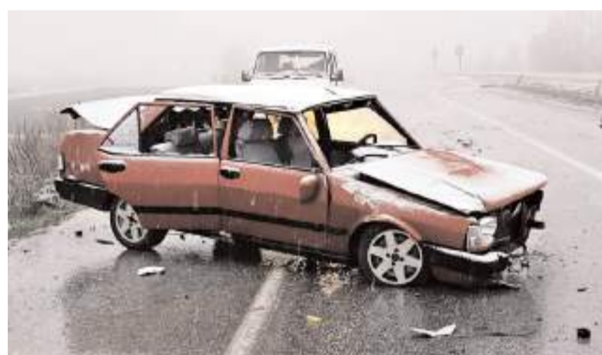
Kaza, Çorum-Alaca karayolunda meydana geldi.

biyle direksiyon hakimiyetini kaybetmesi neticesinde yön tabelasına çarptı. Kazada sürücü yaralandı.