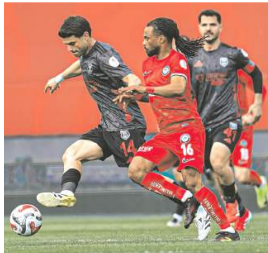
Fredy Pendikspor maçında da hücumda beklenen katkıyı ve desteği veremedi

düzgün bir vuruşla skoru 1-1 yapan golü attı.