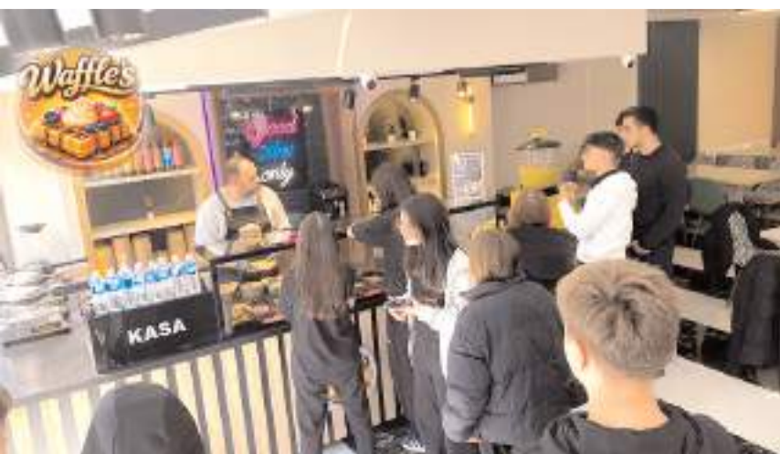
İşletme Saat 11.00'den 00.00'a kadar açık.