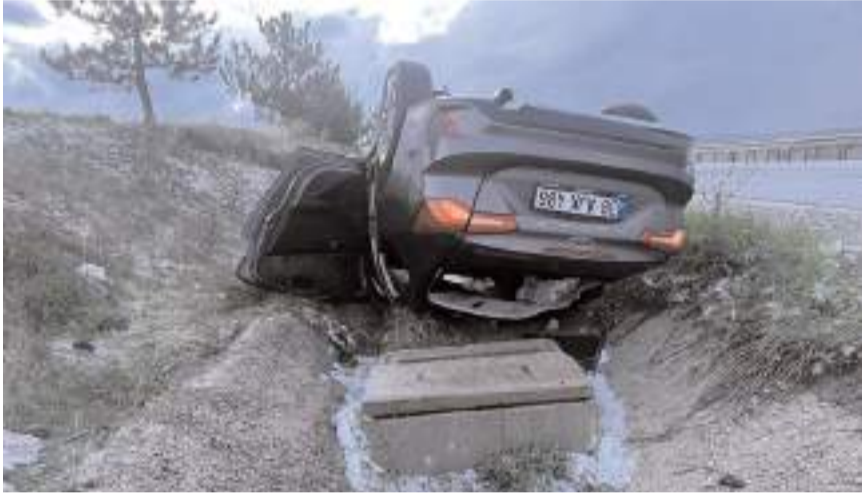
Her iki kazada da araçlar hurdaya döndü.

Çorum'un Alaca ilçesinde peş peşe meydana gelen iki trafik kazasında 1 kişi hayatını kaybetti, 3 kişi yaralandı.