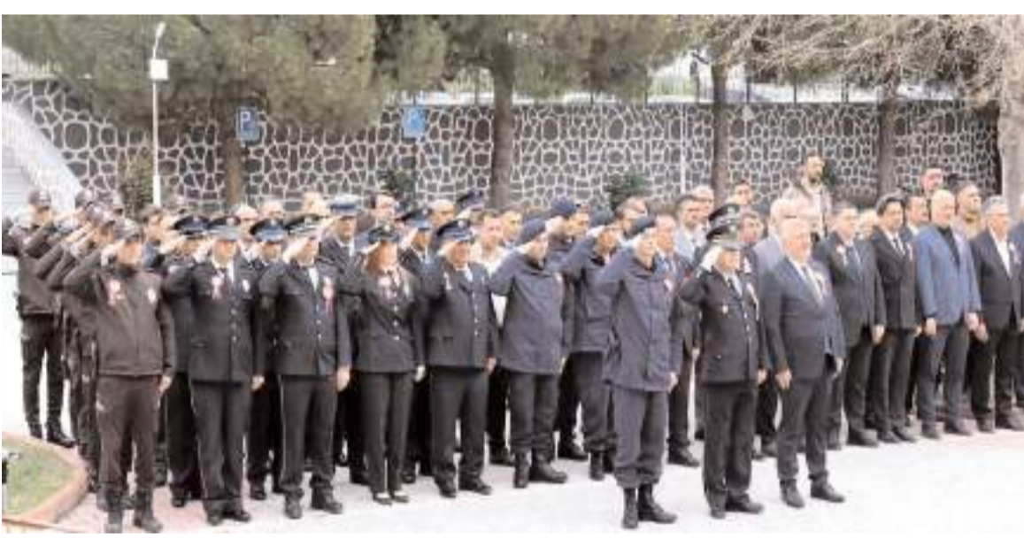
Tören Hükümet Konağı bahçesinde gerçekleştirildi.