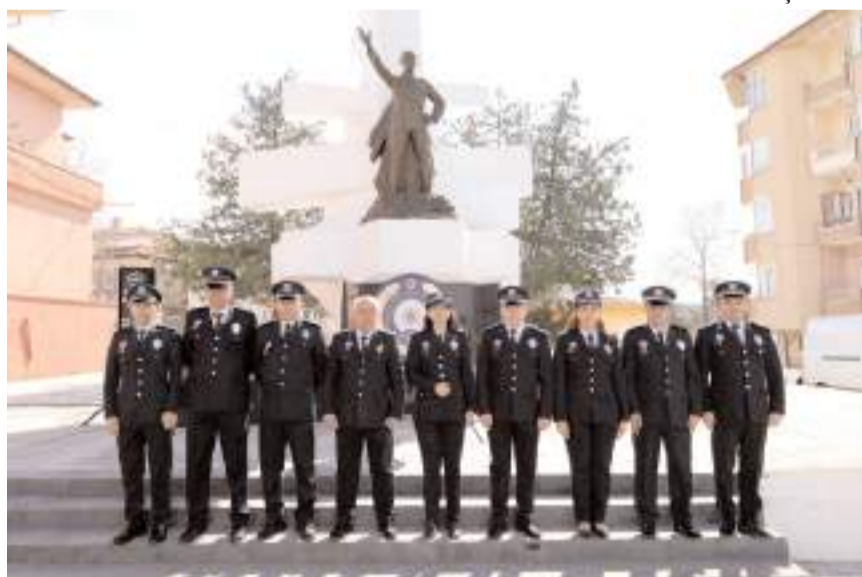
Programın ardından hatıra fotoğrafı çekildi.

Etkinliklere ilçe protokolü, emniyet mensupları ve sivil toplum kuruluşlarının temsilcileri katıldı. Program kapsamında şehit polisler dualarla anılırken, görev başındaki polisler de unutulmadı. Etkinliklerin hafta boyunca devam edeceği öğrenildi. (İHA)