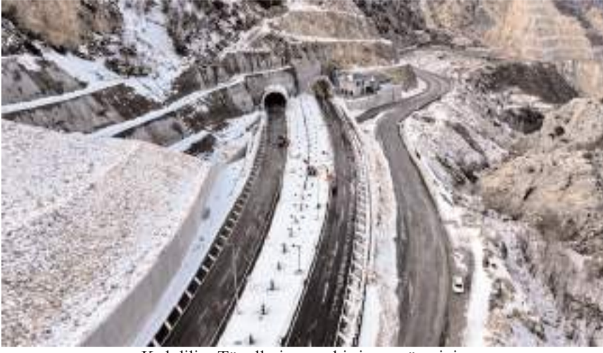
Kırkdilim Tünelleri, uzun bir inşaa sürecinin ardından bu hafta faaliyete başlayacak.