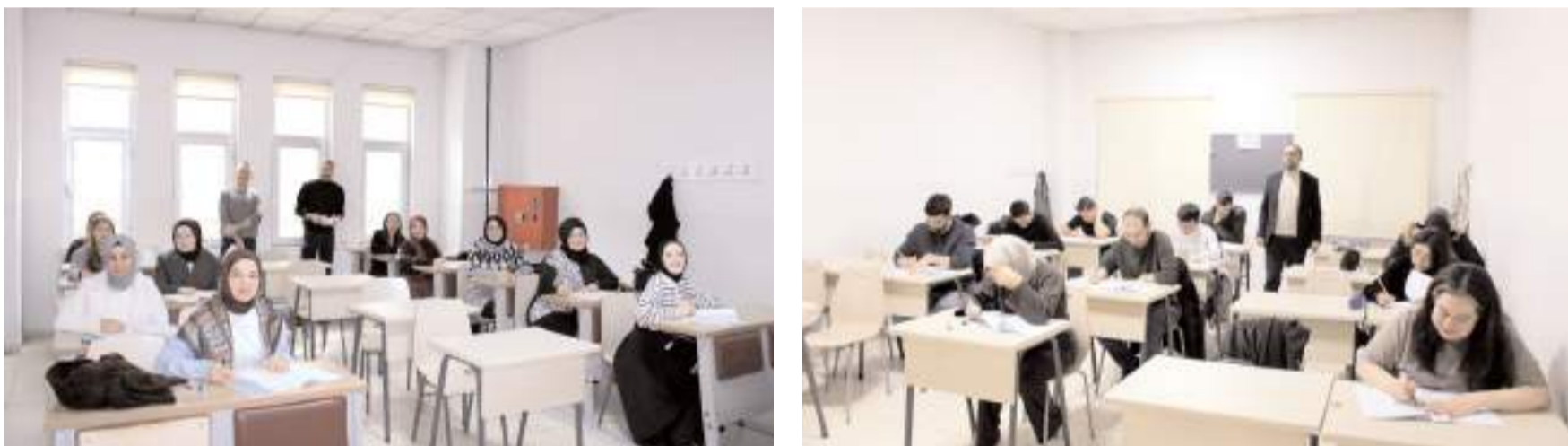
FARMAHANE Projesinde eğitimlerin tamamlanmasının ardından sınav yapıldı.

Gelecek iki yazıda örnek olarak İbnü'l-Humâm ve İbn Abdisselâm'ı tanıttığım ve biri Şâfiî, diğeri Hanefî olan bu iki büyük âlimin, benim katıldığım ifadelerini, kendi kitaplarından aktaracağım.