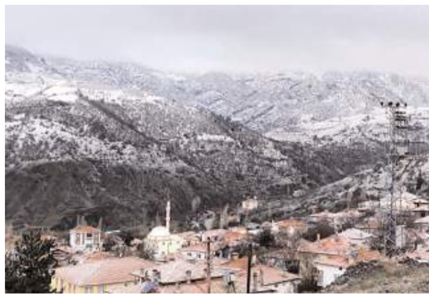
Oğuzlar ve Laçın'ın yüksek yerlerinde kar etkili oldu.