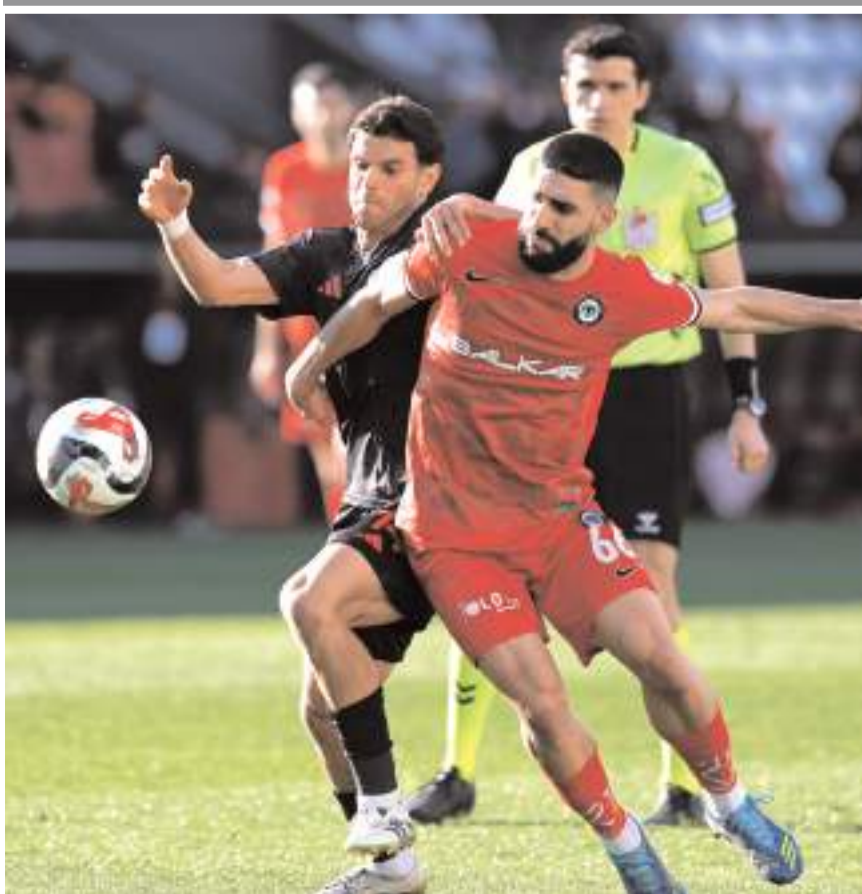
Fredy Pendikspor maçında da hücumda beklenen katkıyı ve desteği veremedi