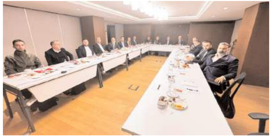
Ülkenin önde gelen 9 altın rafinerisinin girişimiyle Altın Rafinerileri Derneği kuruldu.