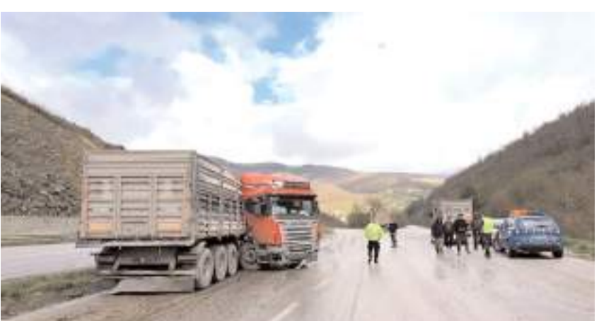
Kaza, Ankara-Samsun karayolu Kavak ilçesi Çakallı mevkisinde meydana geldi.

cünün hayatı tehlikesinin bulunmadığı öğrenildi. Kazayla ilgili inceleme başlatıldı.(İHA)