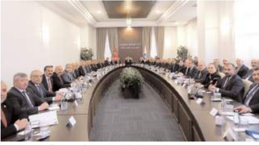
Toplantıya Bakanlık yetkilileri ile belediye başkanları ve Cumhur İttifakının temsilcileri katıldı.