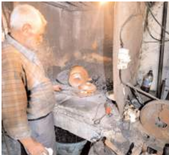
Somut Olmayan Kültürel Miras Türkiye Ulusal Envanterine" Çorum'dan 15 unsur daha kaydedildi.