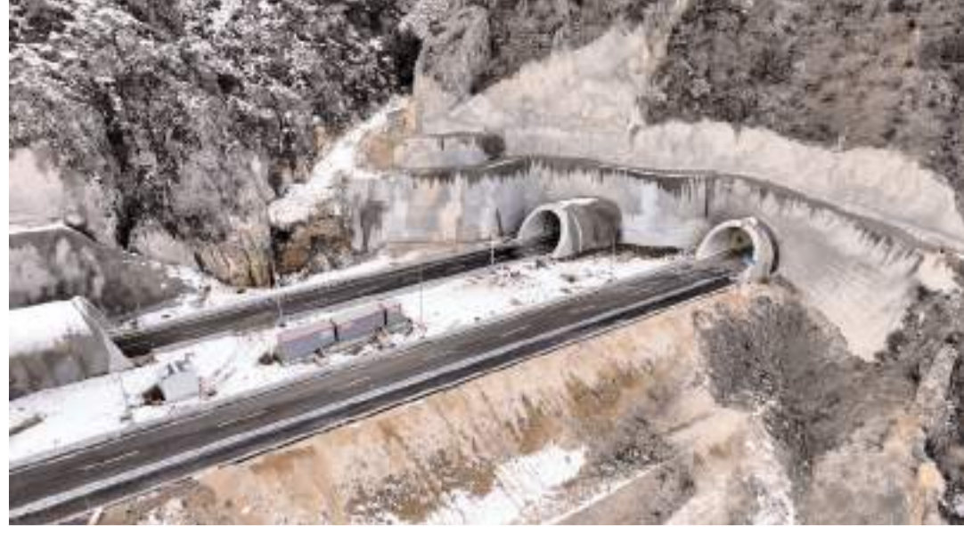
Kırkdilim Tünelleri, toplam 4 bin 99 metre uzunluğunda 3 çift tüp tünelden oluşuyor.