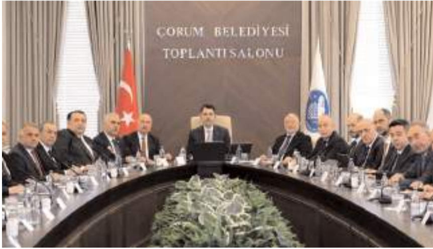
Toplantı Çevre, Şehircilik ve İklim Değişikliği Bakanı Murat Kurum'un başkanlığında yapıldı.