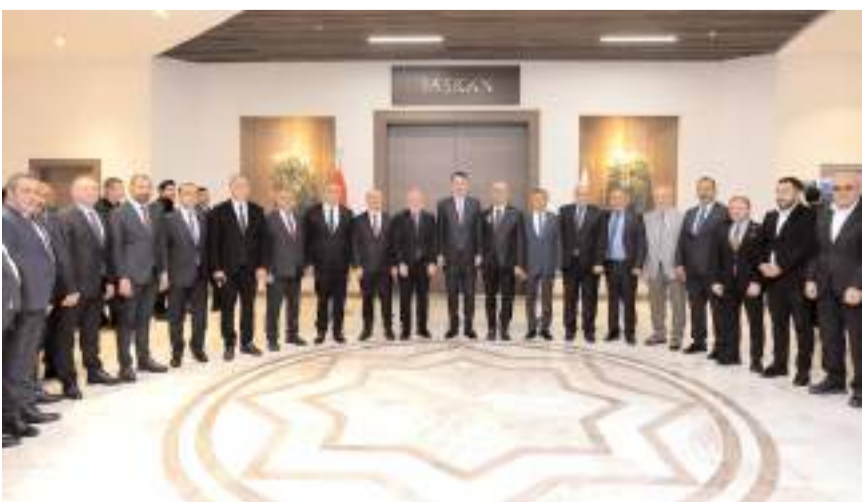
Ziyaretin ardından hatıra fotoğrafı çekinildi.