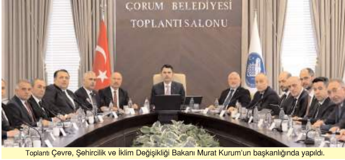
Toplantı Çevre, Şehircilik ve İklim Değişikliği Bakanı Murat Kurum'un başkanlığında yapıldı.