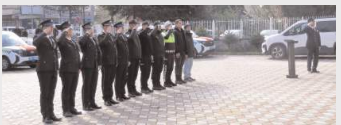
Tören Hükümet Konağı bahçesinde yapıldı.

Törenin ardından Bayat Ömer Halisdemir Merkez Camisi'nde düzenlenen mevlit programında şehitler için dua edildi. (AA)