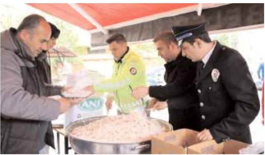
Mevlid-i Şerifin ardından vatandaşlara pilav, ayran ve lokum ikram edildi.