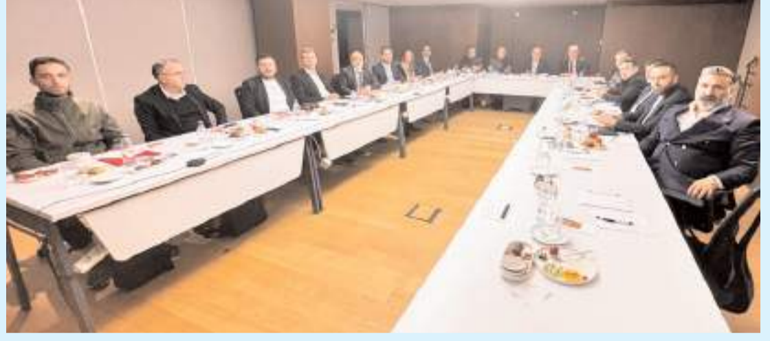
Ülkenin önde gelen 9 altın rafinerisinin girişimiyle Altın Rafinerileri Derneği kuruldu.