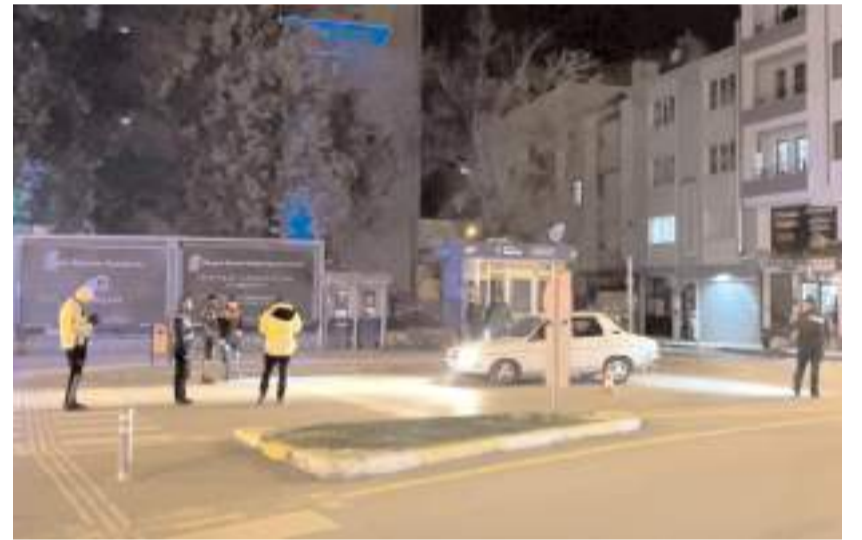
Uygulamalarda çok sayıda aracın sorgulaması gerçekleştirildi.