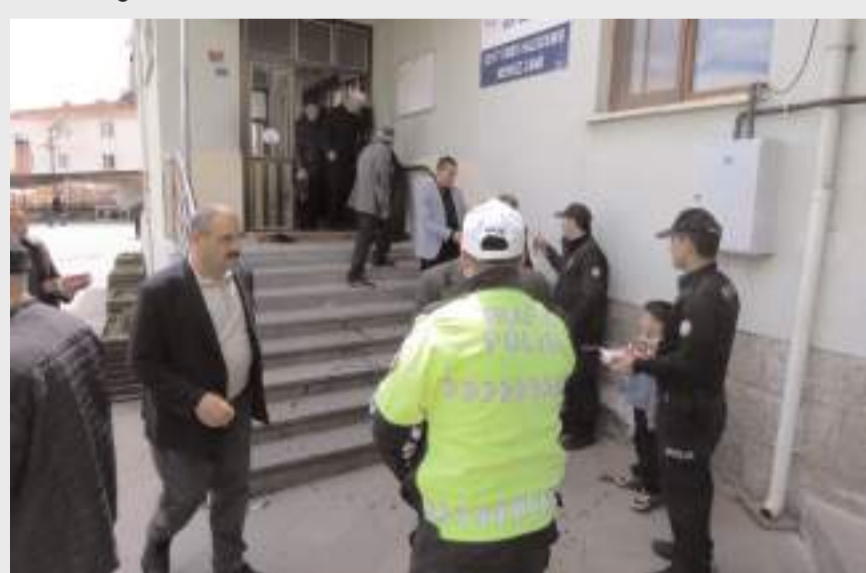
Bayat Ömer Halisdemir Merkez Camisi'nde Mevlid-i Şerif okutuldu.

Türk Polis Teşkilatının 181. kuruluş yılı dolayısıyla Bayat'ta program düzenlendi.