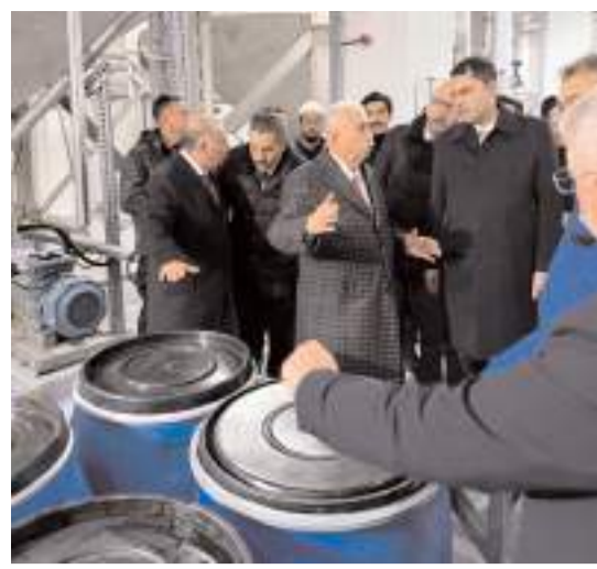
Bakan Murat Kurum, Sungurlu'da faaliyet gösteren GoldForce Barut Fabrikasını gezdi.