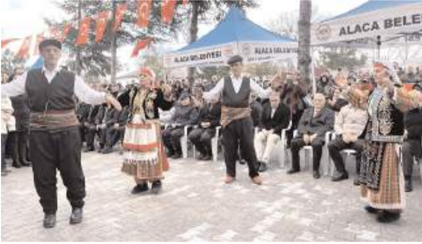
Açılış töreninde semah gösterisi yapıldı.