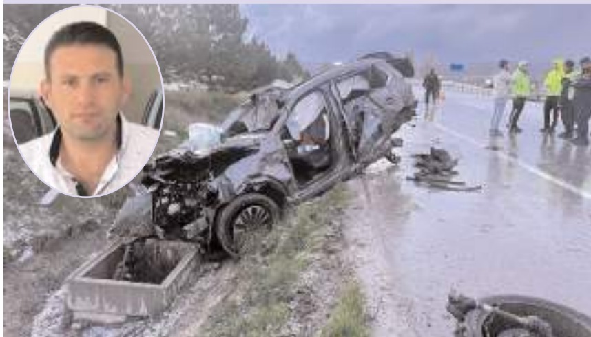
Her iki kazada Çorum-Yozgat kara yolu İbrahim köyü yakınlarında meydana geldi.