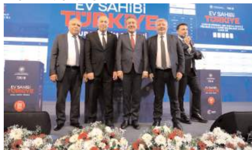
MHP'li belediye başkanları TOKİ kura çekimi törenine katıldı.