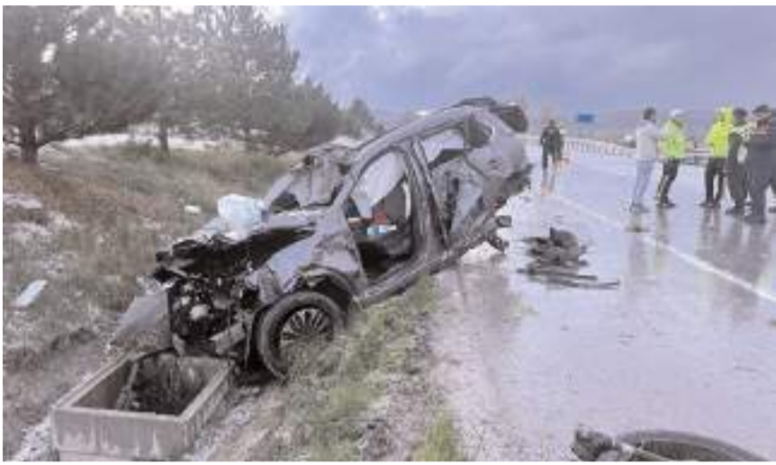
Her iki kazada Çorum-Yozgat kara yolu İbrahim köyü yakınlarında meydana geldi.