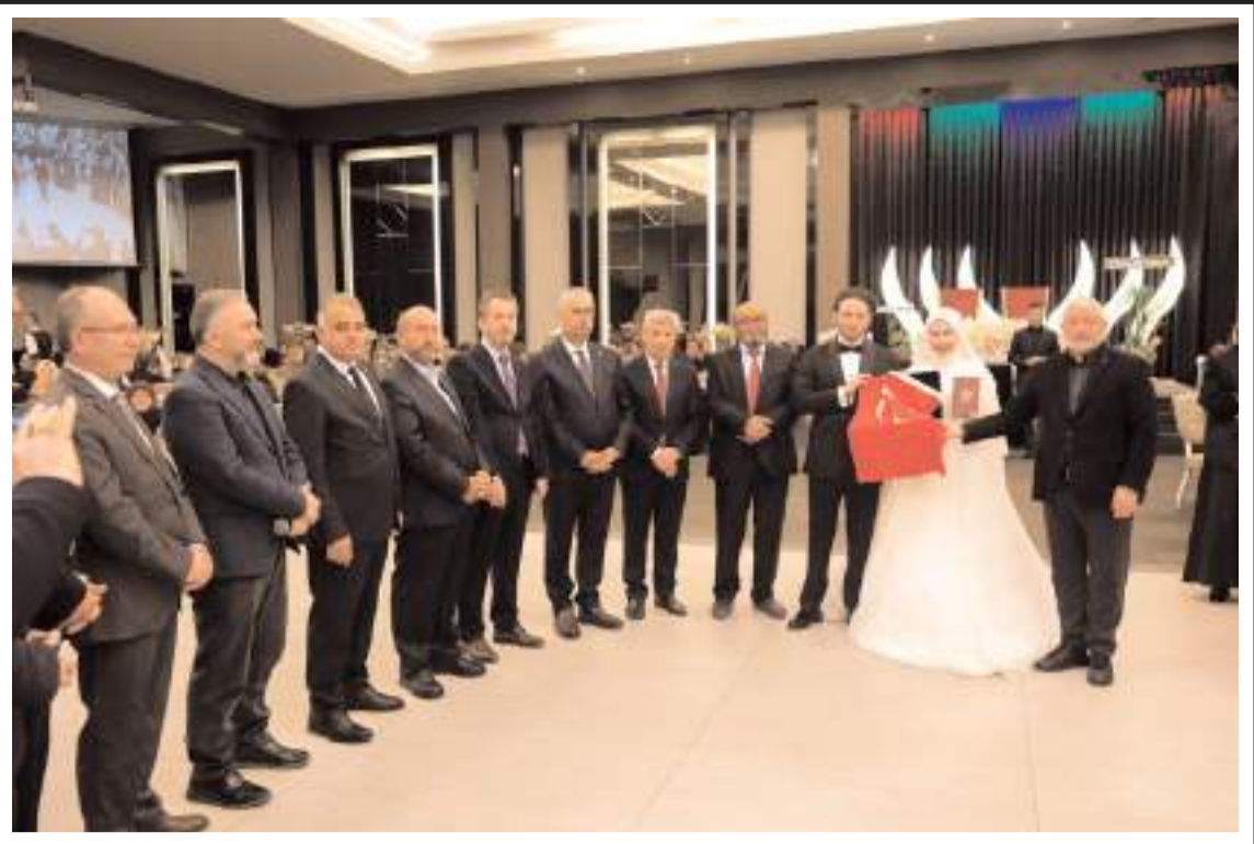
Başkan Aşgın, genç çifte Türk bayrağı hediye etti.