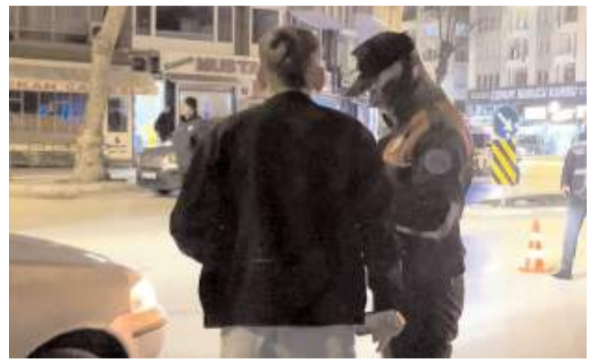
Polis ekipleri kimlik kontrolü yaptılar.

Suçun önlenmesi, trafik kurallarına uyumun sağlanması ve haklarında yakalama kararı bulunan şahısların yakalanması için ekiplerin denetimlerinin devam edeceği belirtildi.(İHA)