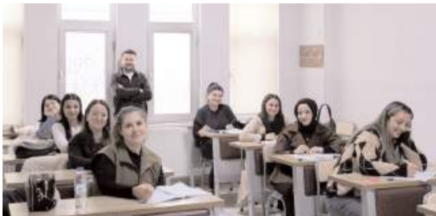
Sınavda başarılı olanlara sertifika verilecek.

Proje kapsamında başvuruda bulunan adaylar 8 haftalık yoğun eğitim programı ve stajlarını tamamladı. Sınavlarını tamamlayan kursiyerlerden değerlendirmeler neticesinde başarılı olan adaylar gelecek hafta sertifikalarını Eczacı