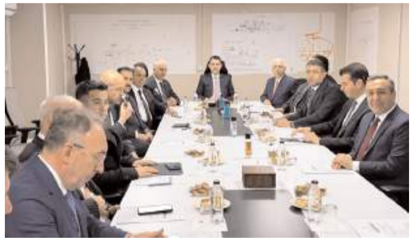
Bakan Kurum, GoldForce Fabrikasında toplantı yaptı.