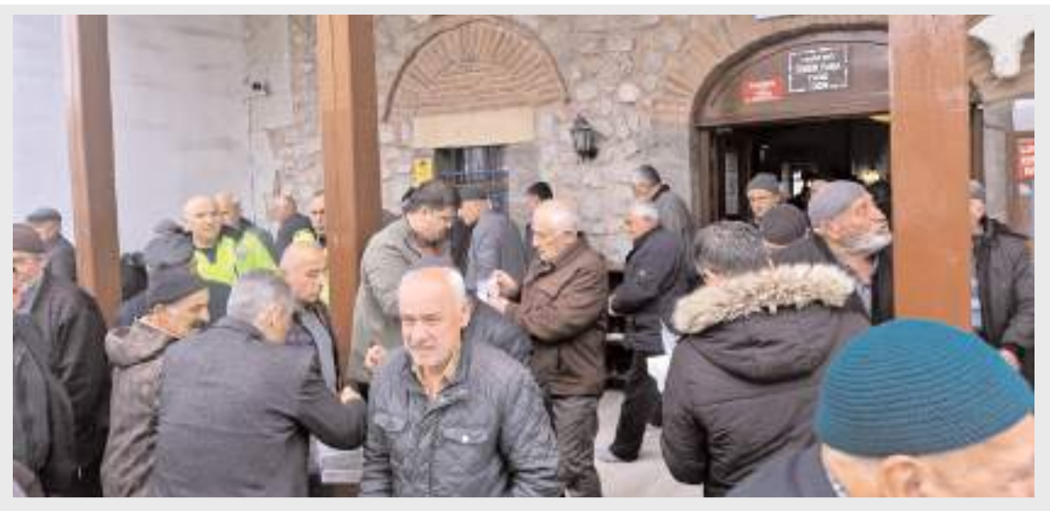
Alaca Ömer Paşa Camiinde öğle namazı öncesinde Mevlid-i Şerif okutuldu.