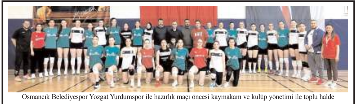
Osmançık Belediyespor Yozgat Yurdumspor ile hazırlık maçı öncesi kaymakam ve kulüp yönetimi ile toplu halde