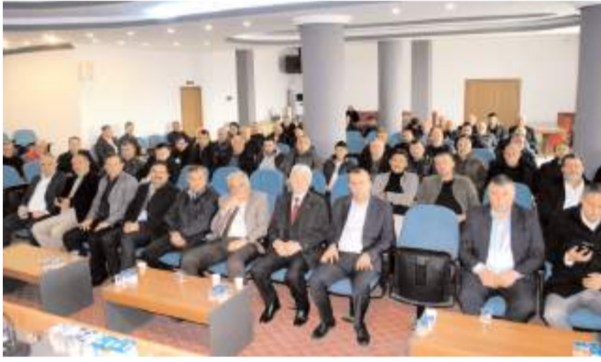
Genel kurula kooperatif üyelerinin katılımı yüksek oldu.