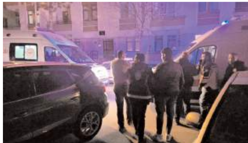
Yaralılara ilk müdahale 112 acil sağlık ekipleri tarafından olay yerinde yapıldı.

Çorum'da bir apartmanda komşular arasında "gürültü" nedeniyle çıkan kavgada 2 kişi bıçakla, 1 kişi ise darp sonucu yaralandı.