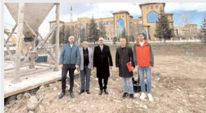
Milletvekili Av. Yusuf Ahlatcı, eğitim yatırımlarını inceledi.

Ahlatcı, yatırımlara destek veren Cumhurbaşkanı Recep Tayyip Erdoğan başta olmak üzere ilgili kurum ve yetkililere teşekkür etti. (Haber Merkezi)