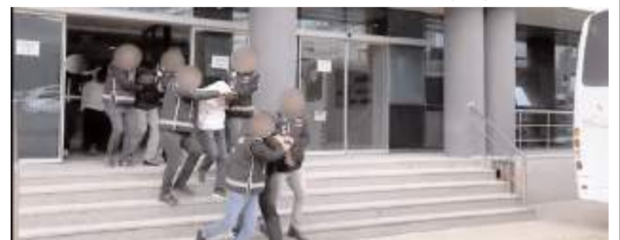
Operasyonlarda yakalanan 13 şüpheliden 11'i tutuklandı.

Yetkililer, suç ve suçlularla mücadelenin kararlılıkla sürdürüleceğini belirterek, olayla ilgili soruşturmanın devam ettiği öğrenildi. (İHA)