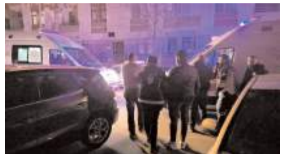
Yaralılara ilk müdahale 112 acil sağlık ekipleri tarafından olay yerinde yapıldı.

Çorum Belediyesi tarafından "Geçmişin İzinde, Geleceğin Peşinde" sloganıyla düzenlenen "Çorum Mutfağına Saygı" ödüllü yemek yarışması için başvuru süreci başladı. * HABERİ6'DA