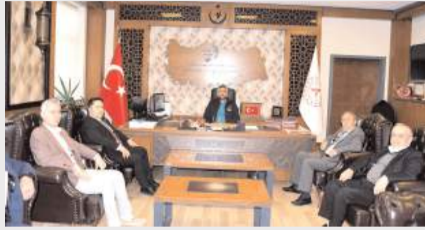
Ziyarette hastanenin mevcut durumu, yaşanan sorunlar ve talepler konuşuldu.