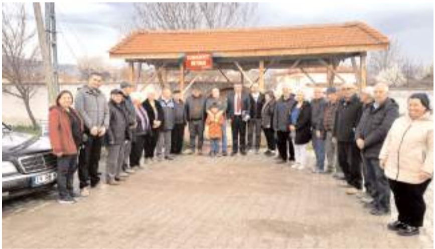
Ziyaretin anısına toplu fotoğraf çekildi.