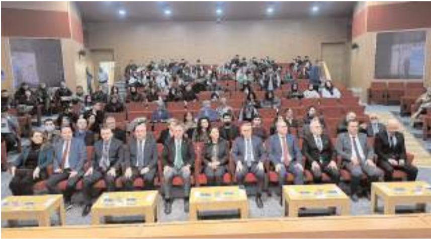
Panel Meslek Yüksekokulu Ethem Erkoç Konferans Salonunda yapıldı.