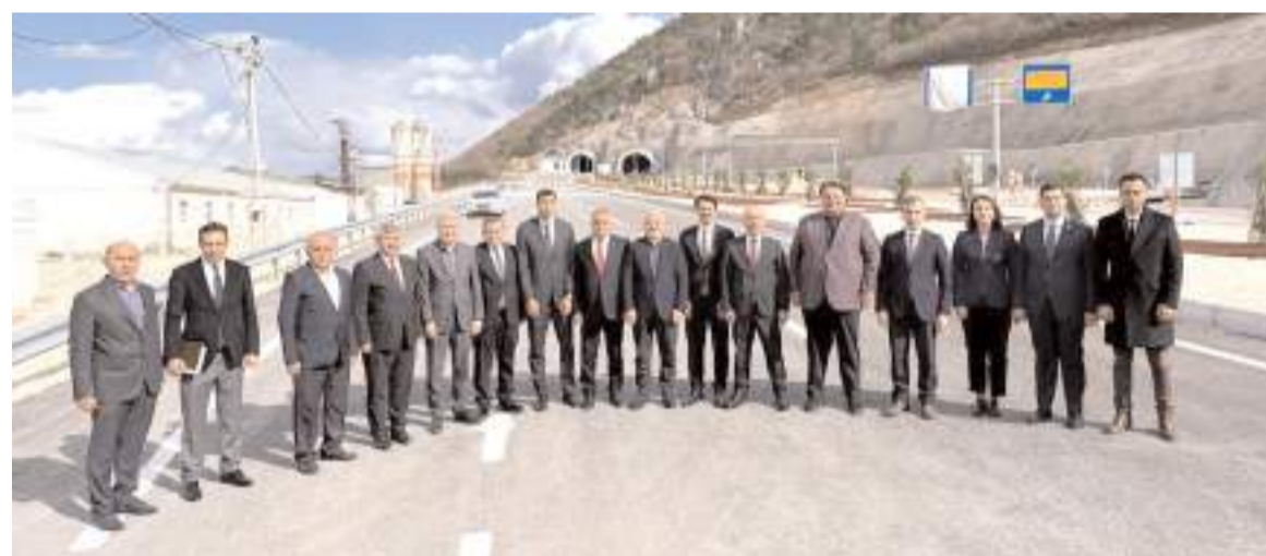
Protokol üyeleri Kırkdilim Tünellerinde çalışmaların son durumunu incelediler.