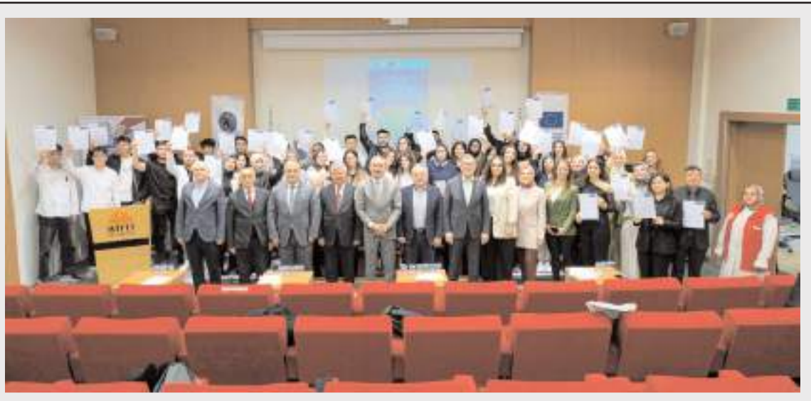
Toplantının ardından hatıra fotoğrafı çekildi.