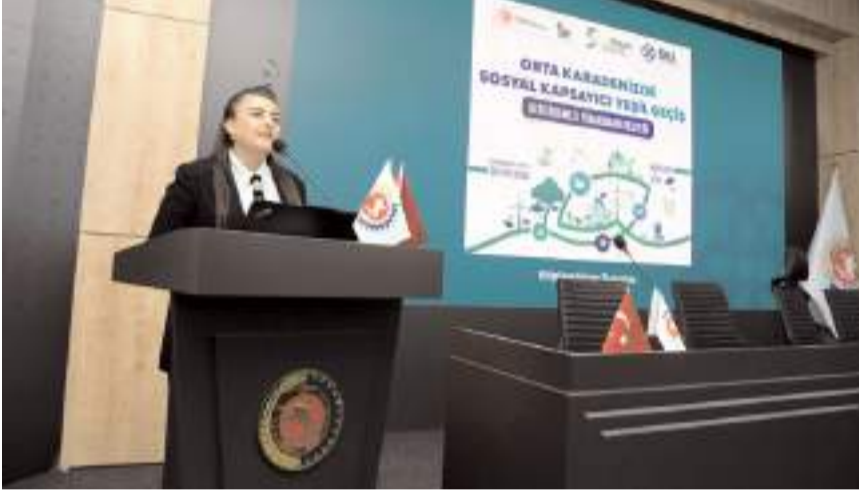
Programın tanıtımı için 31 Mart-2 Nisan 2026 tarihleri arasında programlar yapıldı.

Başvurular Kalkınma Ajansları Yönetim Sistemi (KAYS) üzerinden yapılacak olup son başvuru tarihi 8 Mayıs 2026 olarak açıklandı.(İHA)