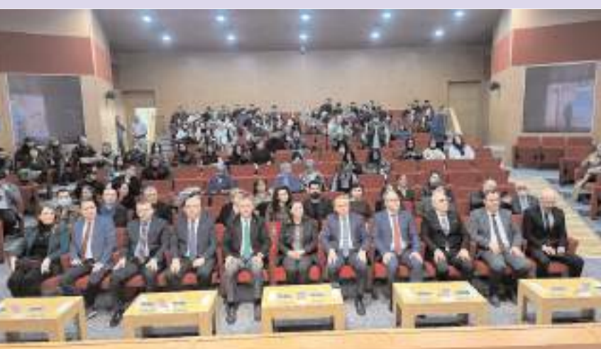
Panel Meslek Yüksekokulu Ethem Erkoç Konferans Salonunda yapıldı.

Çorum'da 14 Nisan Dünya Hitit günü etkinlikleri kapsamında Çorum Valiliği, Çorum Belediyesi, Hitit Üniversitesi ve Vakıf 19 işbirliğiyle "Hititlerde Tıp ve Hukuk" paneli gerçekleştirildi. * HABERİ7'DE