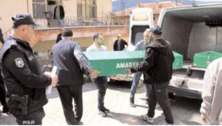
Olay Amasya'da meydana geldi.