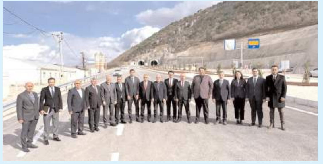
Protokol üyeleri Kırkdilim Tünellerinde çalışmaların son durumunu incelediler.