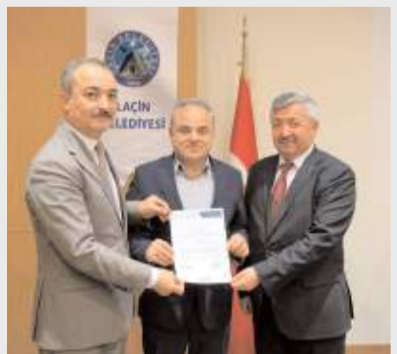
Toplantıya katılanlara teşekkür belgesi verildi.

Toplantıda, gençlerin geliştirdiği politika önerilerinin daha geniş kitlelere ulaştırılması ve sürdürülebilir çevre politikalarına katkı sunması hedeflendi. (Haber Merkezi)