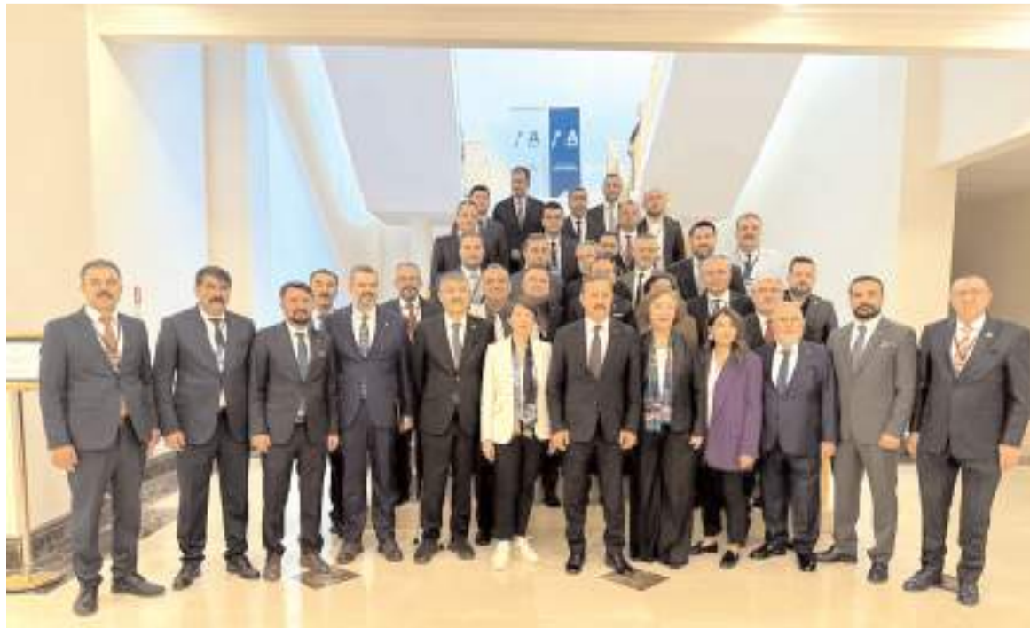
Toplantının ardından hatıra fotoğrafı çekildi.