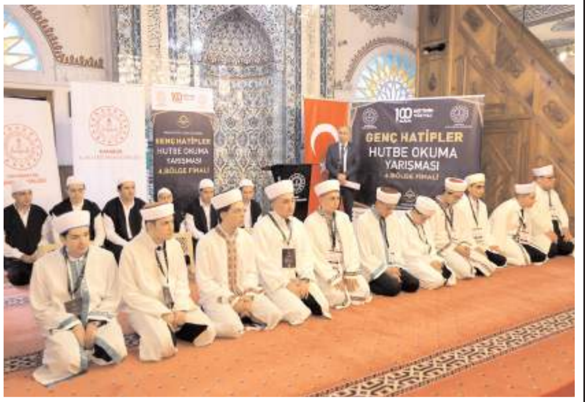
Yarışmaya Karabük, Zonguldak, Samsun, Sinop, Amasya, Tokat, Çorum, Bartın, Kastamonu, Ordu, Bolu ve Çankırı'dan öğrenciler katıldı.