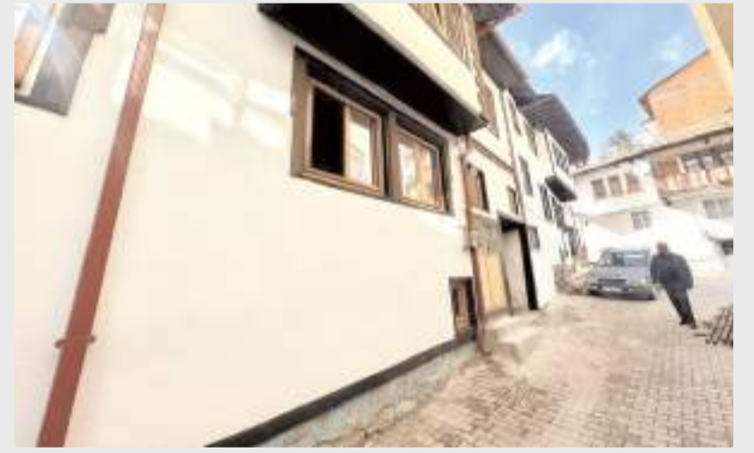
Çalışmalarda tarihi doku yeniden ayağa kaldırılıyor.

bulması bizler için büyük bir gurur kaynağıdır. Şehrimizin estetiğine ve kimliğine değer katan bu çalışmalarını kararlılıkla sürdürüyoruz. Memleketimizi hak ettiği görünüme kavuştur-