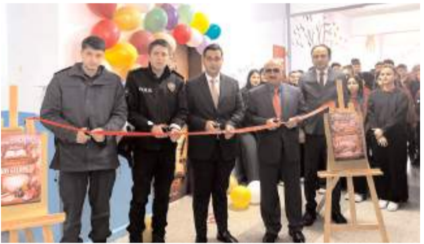
Açılış kurdelesini protokol üyeleri kesildi.