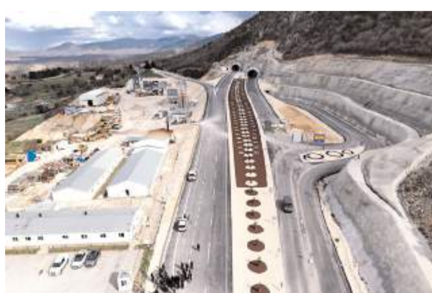
Kırkdilim Tünelleri 16 Nisan Perşembe günü açılacak.