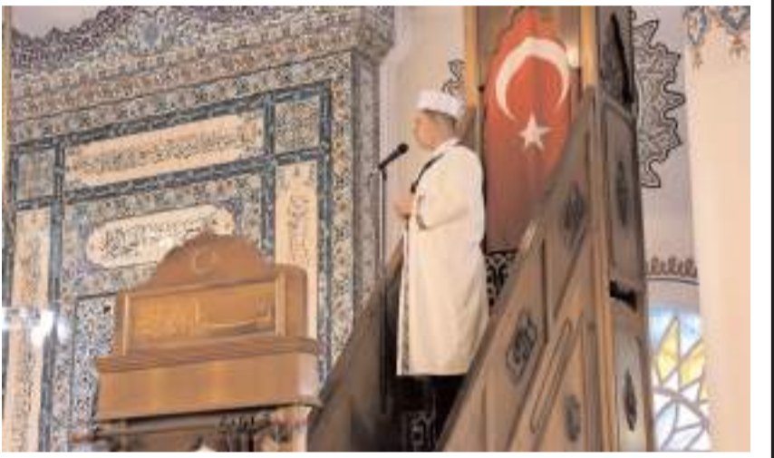
Yarışma Çamlık Camisi'nde yapıldı.