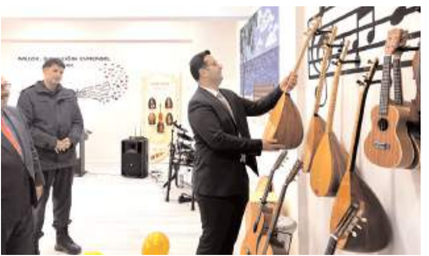
Kaymakam Serkan Tokur, atölyede inceleme yaptı.