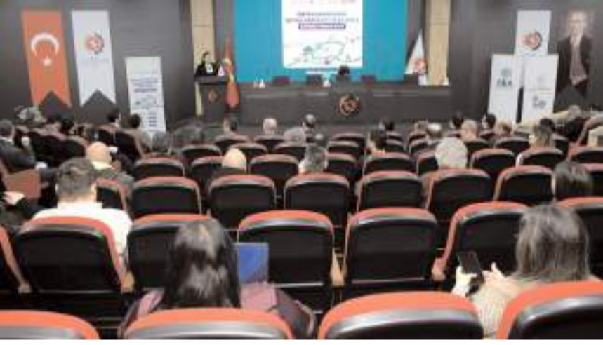
Dört ilde düzenlenen bilgilendirme toplantılarında yaklaşık 300 KOBİ'ye ulaşıldı.