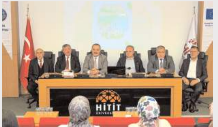
Proje kapsamında düzenlenen toplantıda elde edilen çıktılar, karar alıcılarla paylaşıldı.

Farklı şehirlerden bir araya gelen gençler, proje sürecinde; biyolojik çeşitlilik konusunda gözlemler ve çalışmalar yaparak yerel, ulusal ve uluslararası politikaları inceleme fırsatı buldu. Çalışmaların sonunda ise kendi alanlarına yönelik çözüm odaklı politika önerileri oluşturdu.