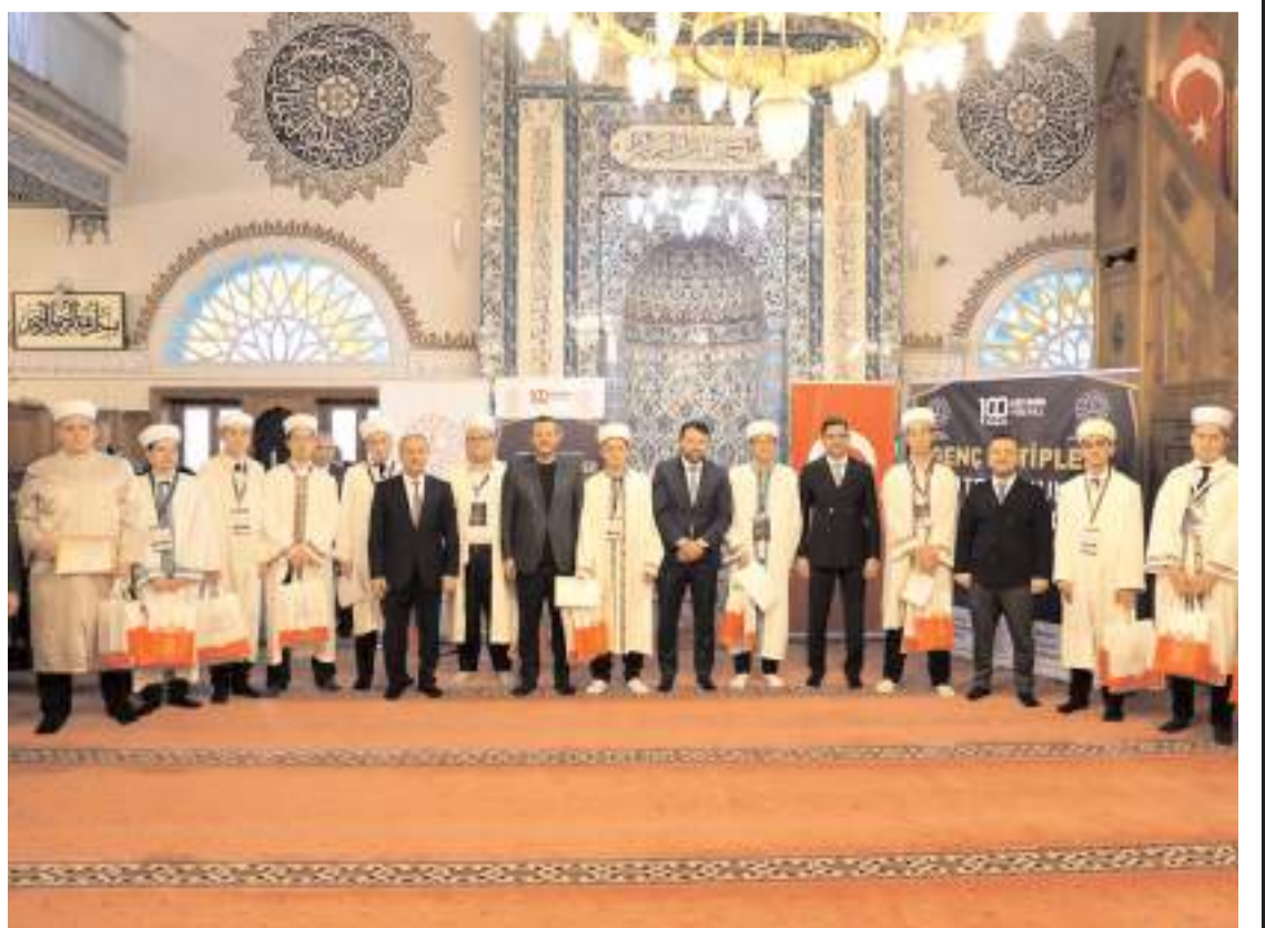
Yarışma sonunda dereceye giren öğrencilere ödülleri il protokolü tarafından verildi.