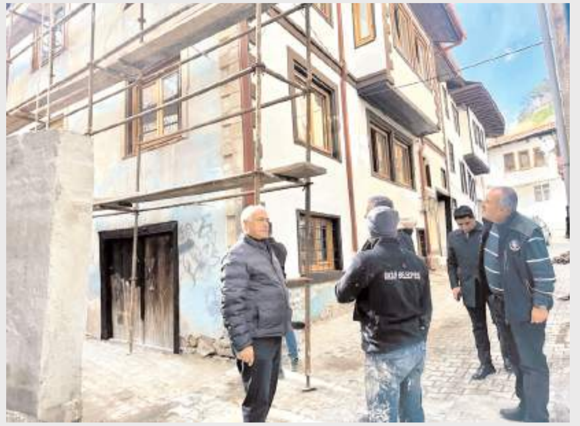
Belediye Başkanı İsmail Çizikci, çalışmalarını yerinde inceledi.

Uygulamada sıklıkla oda sayısının fazla olduğu ve bu odaların kullanılmadığı gözlemlendiğinden bu odaların "aile hekimliği birimi" olarak sisteme katkı sunmasının sağlanması amaçlandı. (A.A)