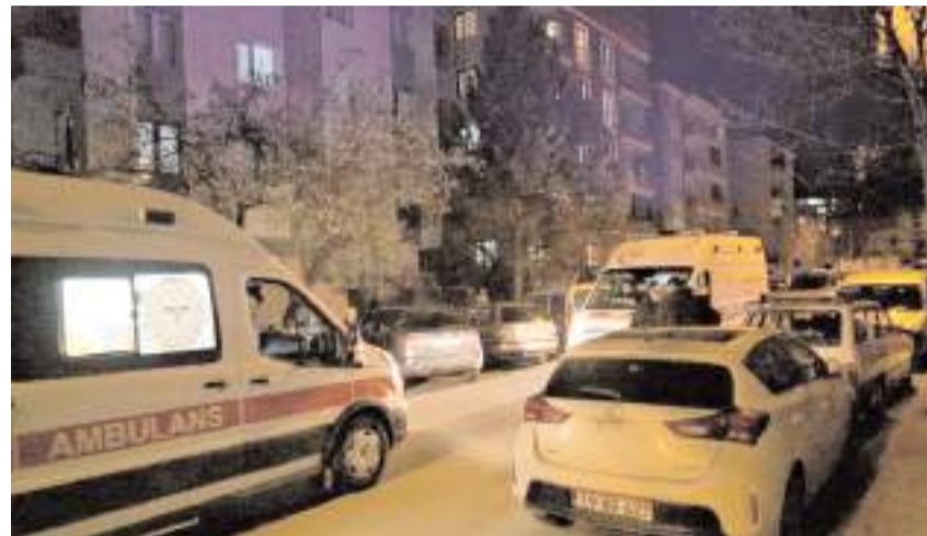
Olay Karakeçili Mahallesi Bayındır 2. Sokak'ta meydana geldi.