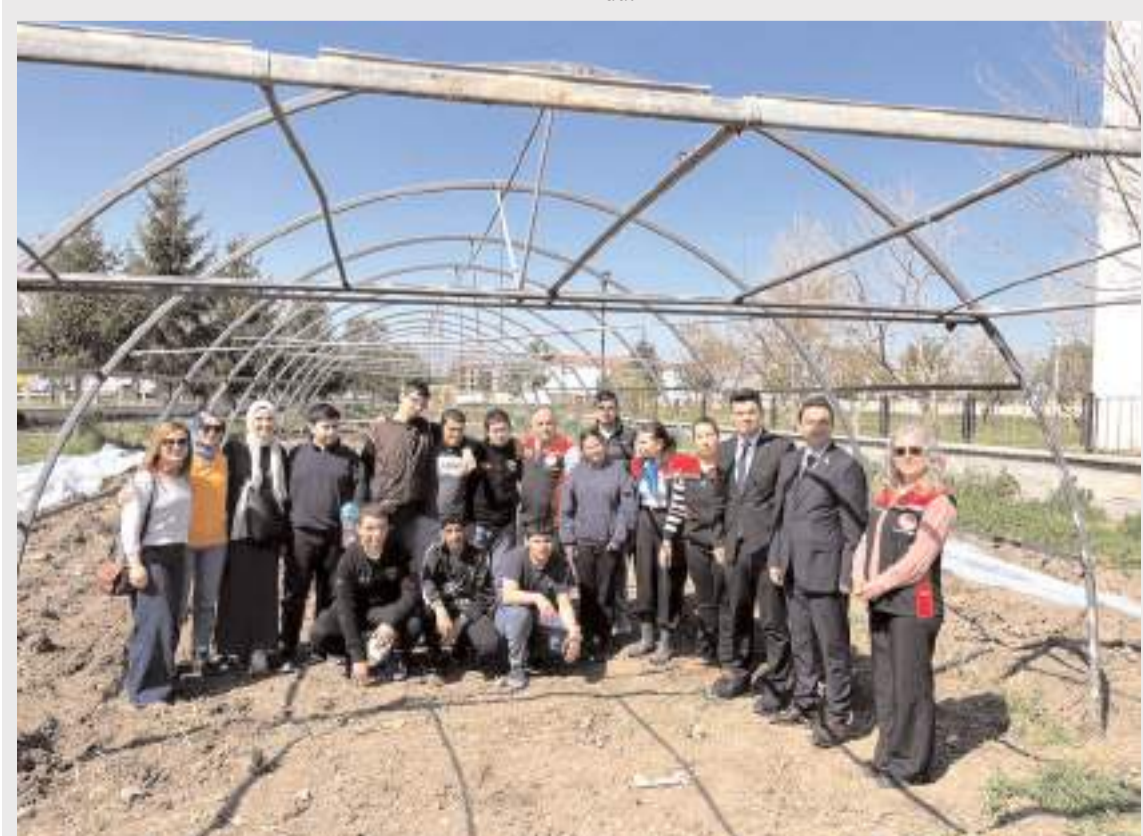
Öğrenciler, tarımsal üretim sürecine doğrudan katılım sağladılar.

Gerçekleştirilen bu ilk dersle birlikte öğrenciler, tarımsal üretim sürecine doğrudan katılım sağlayarak hem öğrenme hem de deneyim kazanma imkânı buldu.