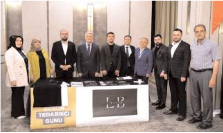
Organizasyonda yeni iş birliklerinin temelleri atıldı.

Program sayesinde firmalar yeni tedarik kanallarına ulaşma imkânı bulurken, sürdürülebilir ticari ilişkilerin geliştirilmesi adına önemli bir adım atılmış oldu.