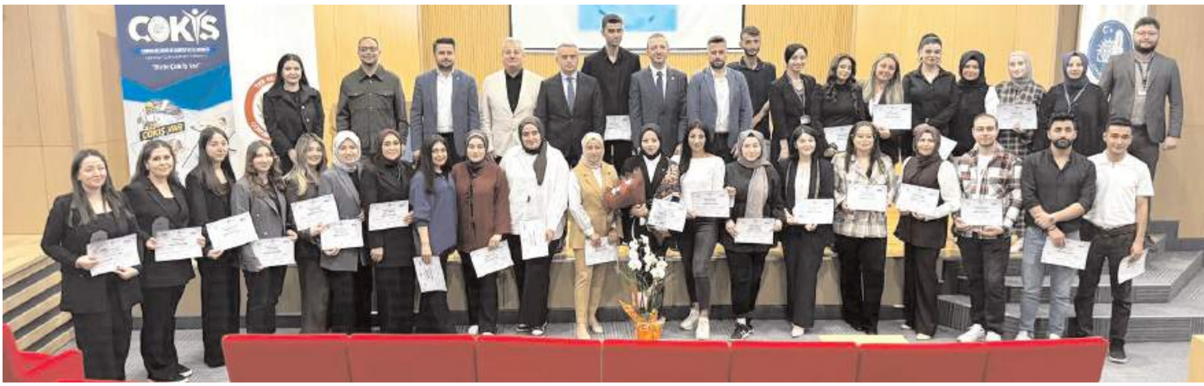
Çorum Belediyesi ile Çorum Eczacı Odası iş birliğinde hayata geçirilen "Farmahane Eczane Teknisyeni Yetiştirme Kursu"nun sertifikaları düzenlenen törenle verildi.