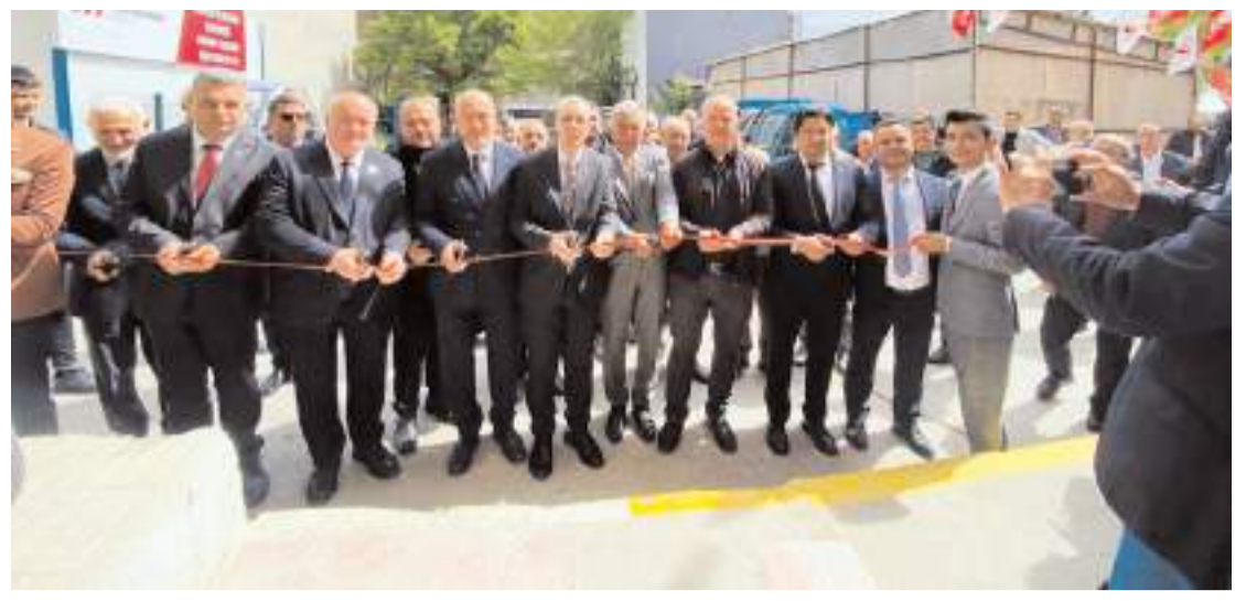
Yapılan duanın ardından açılış kurdelesi kesildi.