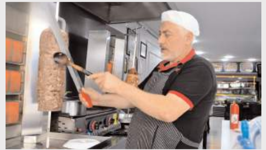
Gurme Kebab, Çorum'da ve Türkiye'de bulunmayan Samuray soslu özel lezzetini müşterilerinin hizmetine sundu.

Gülábibey Mahallesi Uğur Mumcu Caddesi numara 8 (Ahlatçı Kuyumculuk yanı) adresinde Çorum halkının hizmetine giren Gurme Kebab, Çorum'da ve Türkiye'de bulunmayan Samuray soslu özel lezzetini müşterilerinin hizmetine sundu.