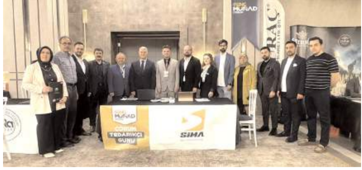
Firmaların stantlarını protokol üyeleri de ziyaret etti.