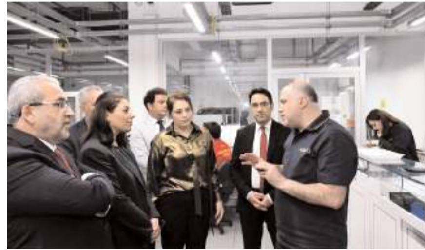
Ziyarette heyete merkez hakkında bilgi verildi.