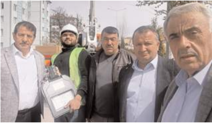
YEDAŞ aydınlatma lambalarını led sistemlerle değiştiriyor.