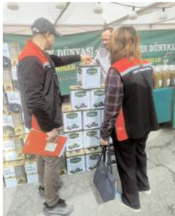
Tarım ve Orman İl Müdürlüğü kontrol görevlileri gıda satışı yapılan alanlarda kapsamlı denetimler yaptı.

Tüketicilerin şüpheli gördükleri durumları Alo 174 Gıda Hattı üzerinden bildirmeleri rica edildi.