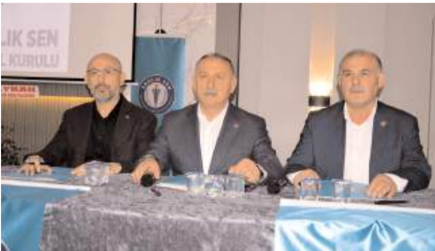
Genel kurulda ilk olarak divan heyeti belirlendi.