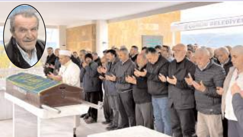
Merhumun cenazesi Akşemsettin Camiinde kılınan cenaze namazının ardından Ulu Mezarlıkta toprağa verildi.