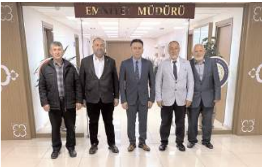
Ziyaretin anısına hatıra fotoğrafı çekildi.

Ziyaret kapsamında, ülke genelinde kamuoyunu yakından ilgilendiren güncel gelişmeler de ele alındı. Bu çerçevede, Çorum ili özelinde asayiş ve güvenlik konularına ilişkin karşılıklı görüş alışverişinde bulunuldu.