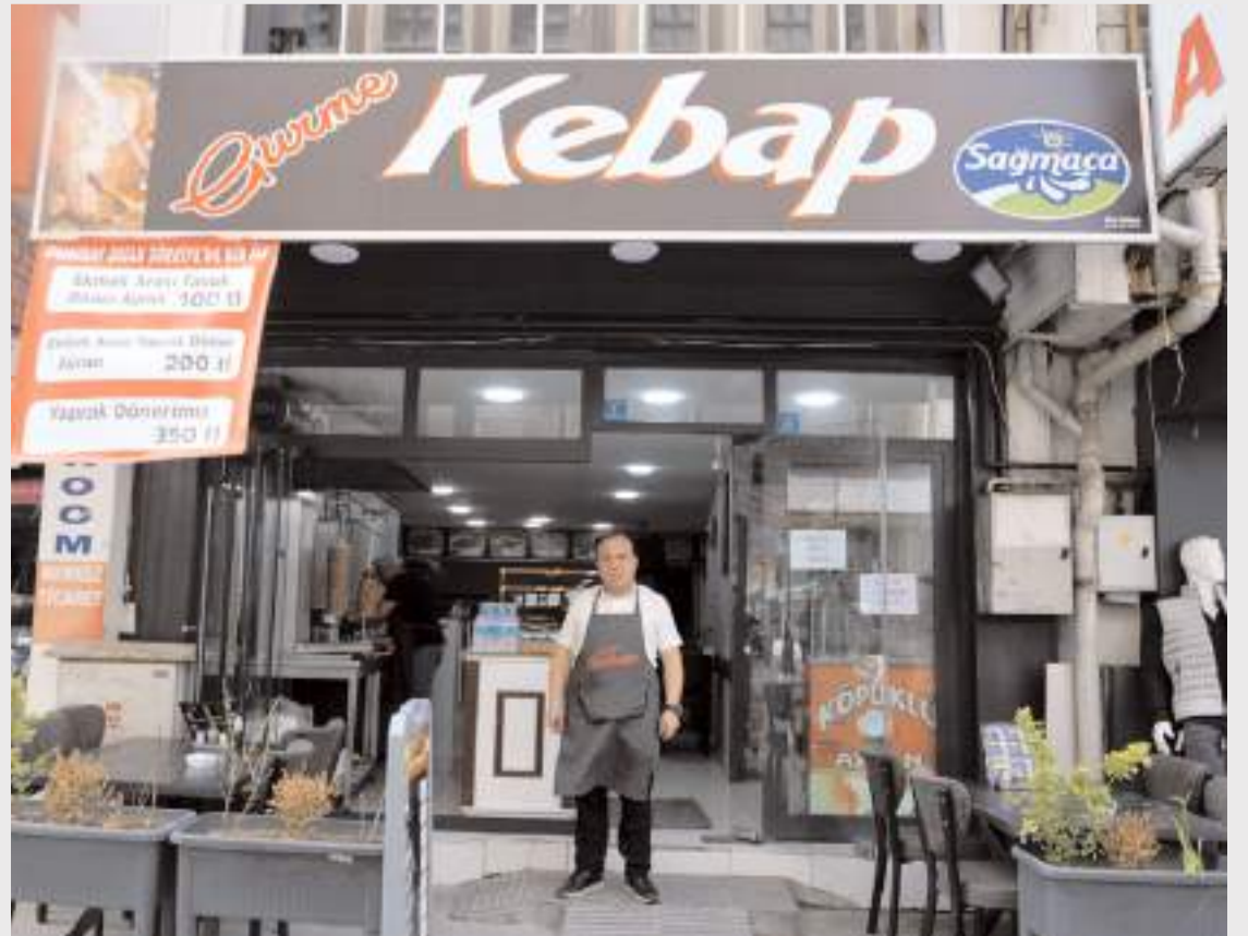
Gurme Kebab Gülabibey Mahallesi Uğur Mumcu Caddesi numara 8'de bulunuyor.

Kilo işi et, tavuk ve köfte satışlarının da olduğunu dile getiren Balcı; "Ev ve işyerlerine paket servisimiz mevcuttur. Ayrıca toplu organizasyon yemekleri de veriyoruz. Düğün, nişan, kına, sünnet, asker eğlencesi gibi organizasyonlar için toplu yemek hizmetleri ile müşterilerimizin hizmetindeyiz." şeklinde konuştu.