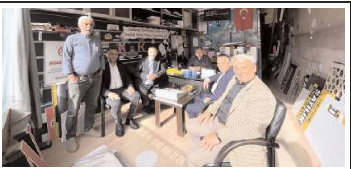
Gelecek Partisi heyeti, esnaf odası başkanlarına hayırlı olsun ziyaretinde bulundu.

nında açacağımız imza standına desteklerinizi bekliyoruz. Birlikte, dayanışmayla başaracağız" dedi. (Haber Merkezi)