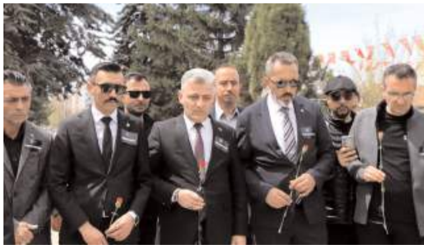
Türkiye Kamu-Sen Çorum İl Temsilciliği Atatürk Anıtında basın açıklaması yaptı.

Türkiye Kamu-Sen Çorum İl Temsilciliği Şanlıurfa ve Kahramanmaraş'ta okullarda düzenlenen saldırılara tepki gösterdi.