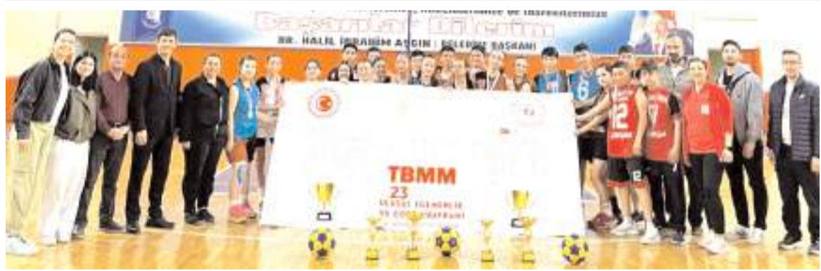
Korfbol'da dereceye giren okullar ödül töreni sonrasında protokol üyeleri ile birlikte toplu halde