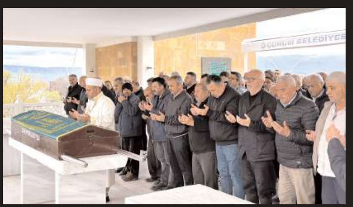
Merhumun cenazesi Akşemsettin Camiinde kılınan cenaze namazının ardından Ulu Mezarlıkta toprağa verildi.