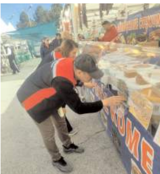
Denetimlerde, satışa sunulan gıda ürünlerinin hijyen koşulları kontrol edildi.