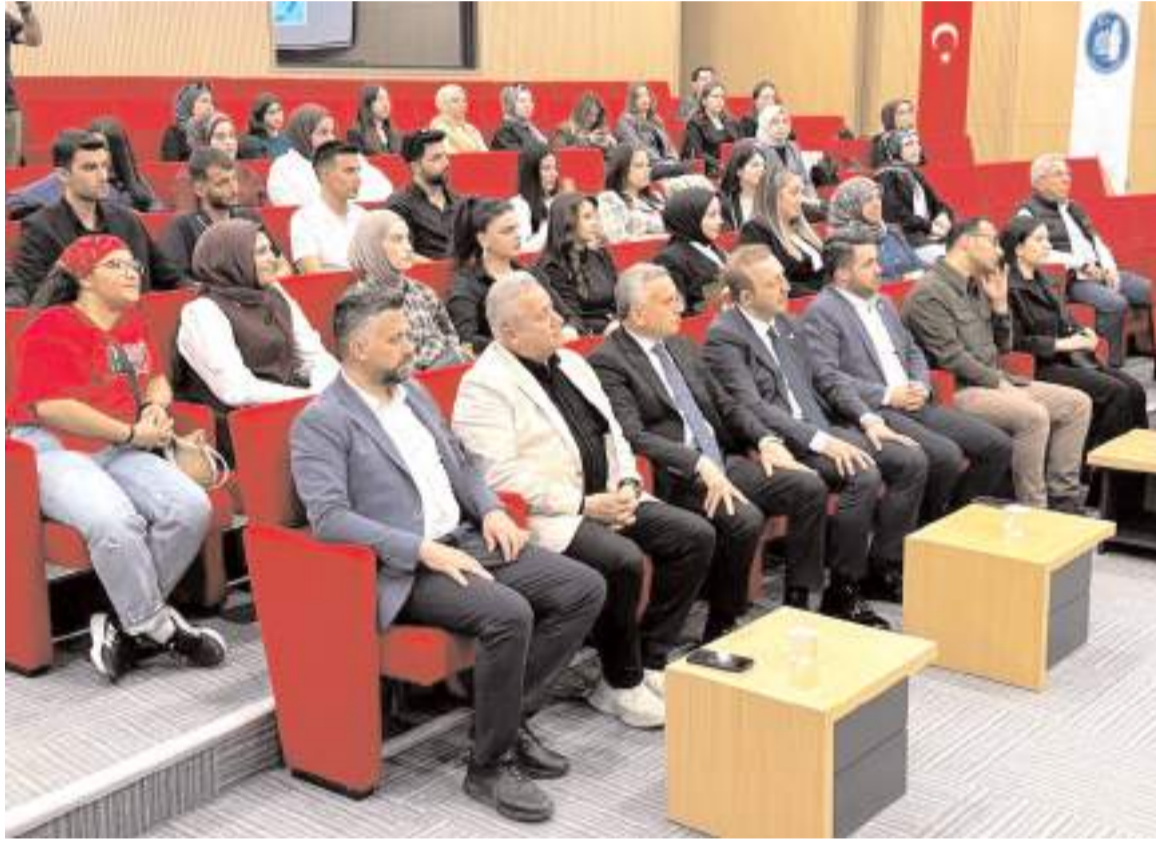
Tören Çorum Belediyesi Konferans Salonunda yapıldı.

Çorum Belediyesi ile Çorum Eczacı Odası iş birliğinde düzenlenen "Farmahane Eczane Teknisyeni Yetiştirme Kursu"nu tamamlayan kursiyerlere sertifikaları teslim edildi.