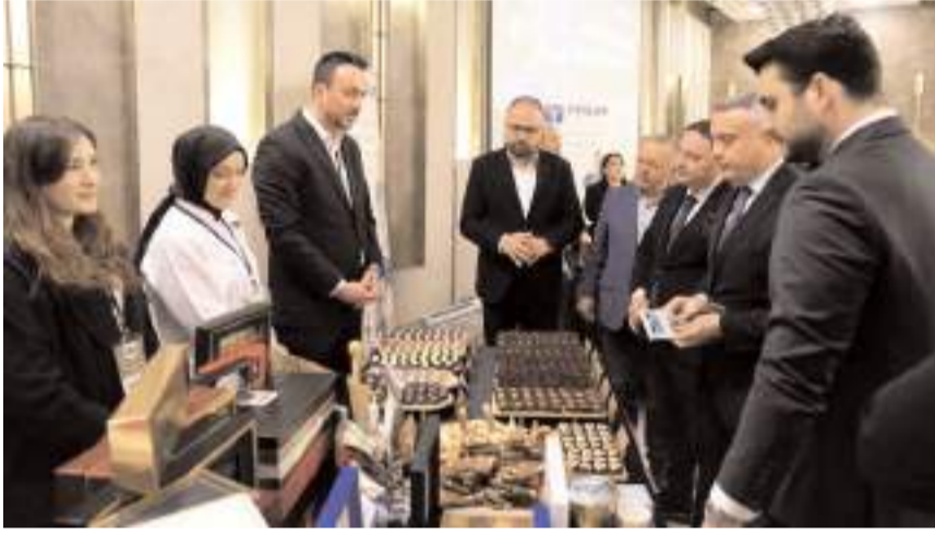
Organizasyonda 140'ı aşkın B2B görüşme gerçekleştirildi.