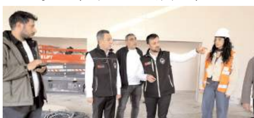
Başkan Muhsin Dere, çalışmalarının son durumu hakkında bilgi aldı.