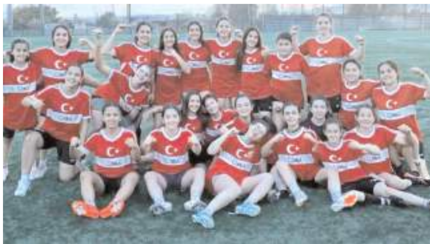
Buharapor kadın futbol takımı bu sezon 3. lige katılmayacak

Atlı'nın itiraz ettiği maddelerin bazıları şöyle: Başvuru ve katılım için 17.500 lira ücret 50 bir lira teminat. Maça çıkmama 50-75 bin tekrarı 75-100 bir ve ligden ihraç katılıp oynamama 50 bin ceza ve iki sezon men.. Ev sahibi takım güvenlik, sağlık, saha ve doktor zorunlu, tüm oyunculara sigorta, iki soyunma odası hakem odası ve uygunsuz sahaya 50 bin lira ceza. Yedek kulübesinde 10 oyuncu gerekiyor, Formalarda iki farklı renk zorunlu reklam sınırlı. Lig maçlarında kulüplere destek yok play-off maçları için 13,500 lira konaklama.