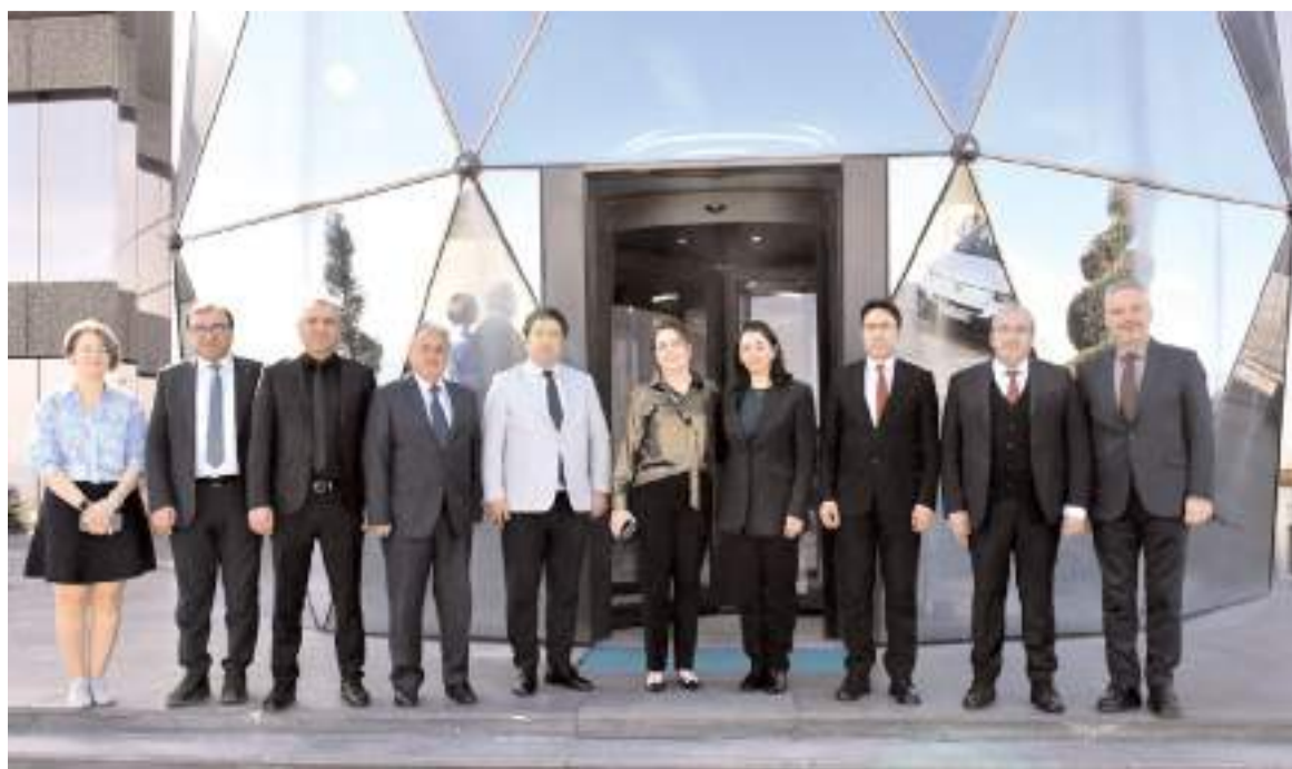
Ziyaretin ardından hatıra fotoğrafı çekildi.