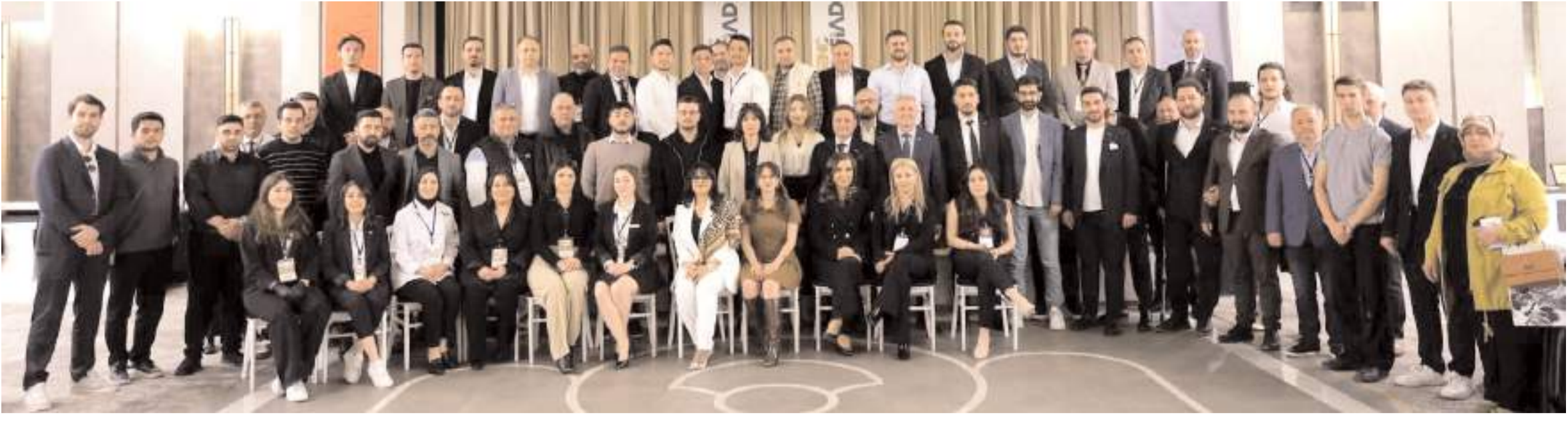
Genç MÜSİAD Çorum Şubesi tarafından Anitta Otel'de gerçekleştirilen Tedarikçi Gününe ilgi yüksek oldu.