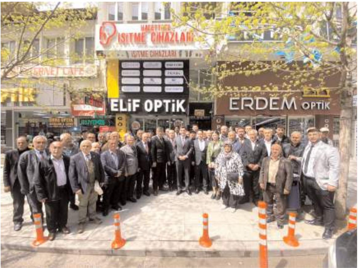
Toplantının ardından hatıra fotoğrafı çekildi.