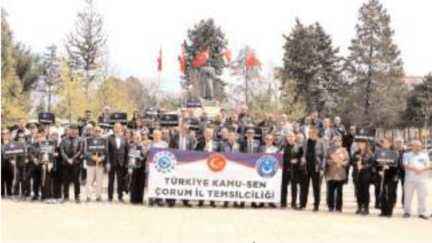
Türkiye Kamu-Sen Çorum İl Temsilciliği Atatürk Anıtında basın açıklaması yaptı.

Eğitimciler Atatürk Anıtında yapılan programın ardından Akşemseddin Caminde kılınan gıyabi cenaze namazına katıldılar. (Haber Merkezi)