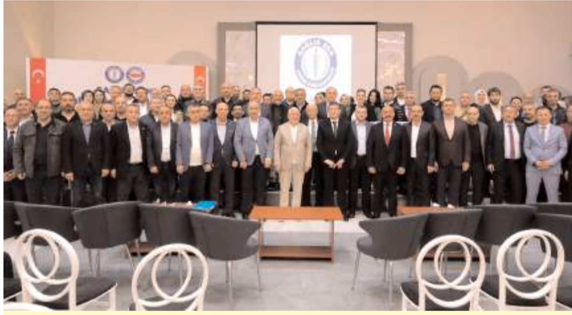
Sağlık-Sen Çorum Şubesinin 7. Olağan Genel Kurulu geçtiğimiz cumartesi günü büyük bir katılımı yapıldı.