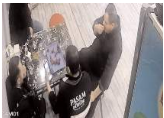
Boğulma tehlikesi yaşayan döner ustasını kurye hemlich manevrasıyla kurtardı.