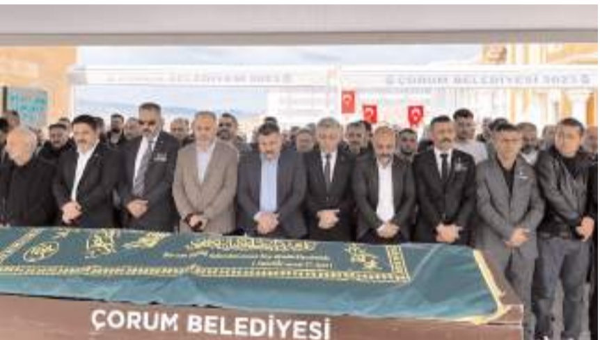
Eğitimciler Atatürk Anıtında yapılan programın ardından Akşemseddin Caminde kılınan gıyabi cenaze namazına katıldılar.