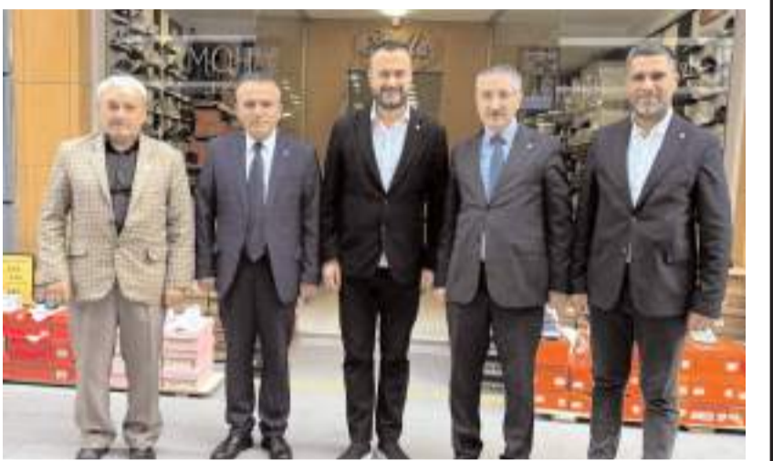
Gelecek Partisi heyeti, esnaf odası başkanlarına başarı dileklerini ilettiler.

Sivil toplum kuruluşlarının ardından siyasi temaslara devam eden heyet, Anahtar Parti'ye nezaket ziyaretinde bulundu.