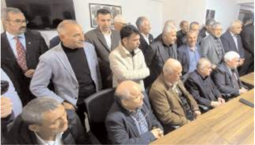
Toplantıya çok sayıda partili katıldı.