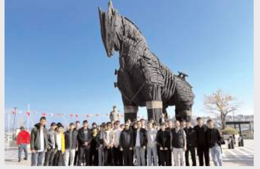
Öğrenciler Çanakkale'nin tarihi ve turistik yerlerini gezdiler.