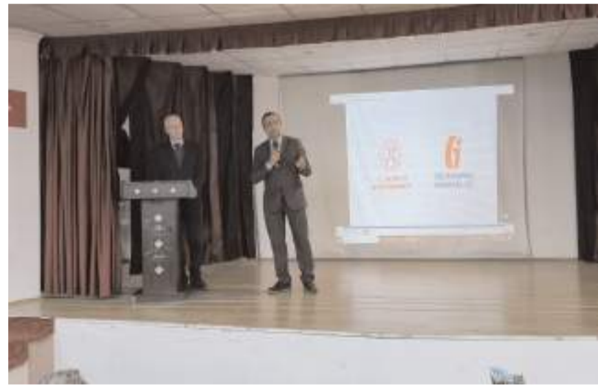
Etkinlikte öğrencilere verginin tanımı ve önemini anlatan sunum gerçekleştirildi.

Etkinlikte ayrıca Gelir İdaresi Başkanlığına hazırlanan videolar izleten uzmanlar, ardından öğrencilerin sorularını yanıtladı.(AA)