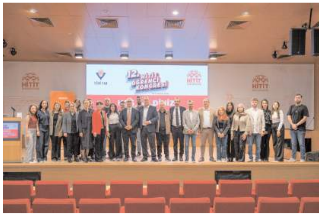
Kongrenin ardından hatıra fotoğrafı çekildi.