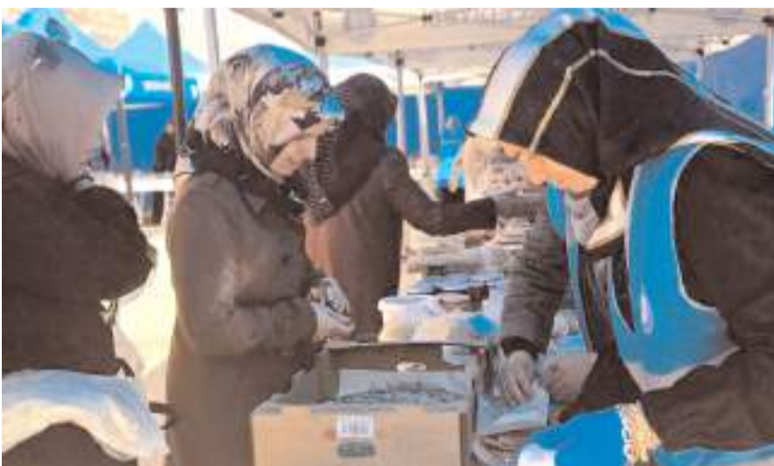
Hayır çarşısı evlenmek isteyen ancak maddi güçlük yaşayan gençlere destek olmak amacıyla açıldı.

Türkiye Diyanet Vakfı'nın (TDV) evlenecek gençlere destek amacıyla başlattığı "İki İnsan Bir Hayat" projesi kapsamında İl Müftülüğü tarafından hayır çarşısı kuruldu.