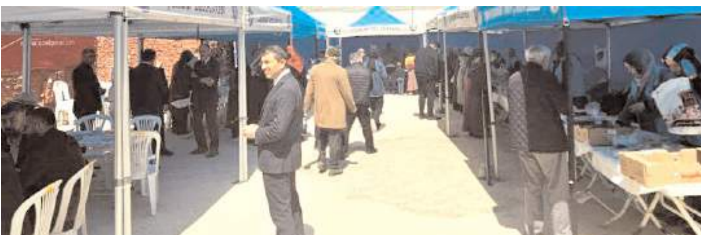
Hayır çarşısı Azap Ahmet Camii yanında bulunuyor.