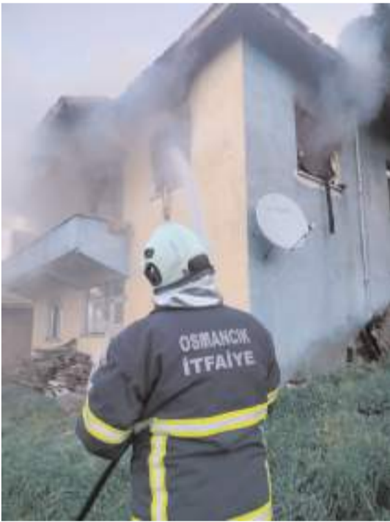
Olay Gecek köyünde meydana geldi.

da yaralanma olmazken, yangınla ilgili inceleme başlatıldı.(İHA)