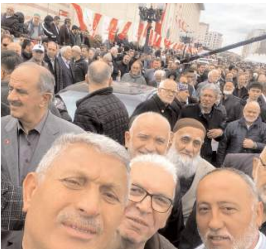
Toplantıya Çorum'dan da katılım oldu.