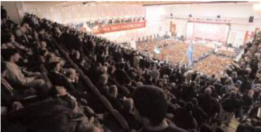
Türkiye Divanı, 81 il ve ilçelerden gelen binlerce teşkilat mensubunun katılımıyla gerçekleştirildi.