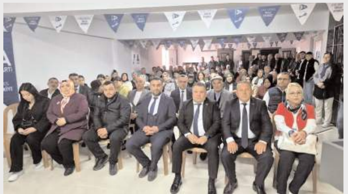
Kongreye katılım yüksek oldu.