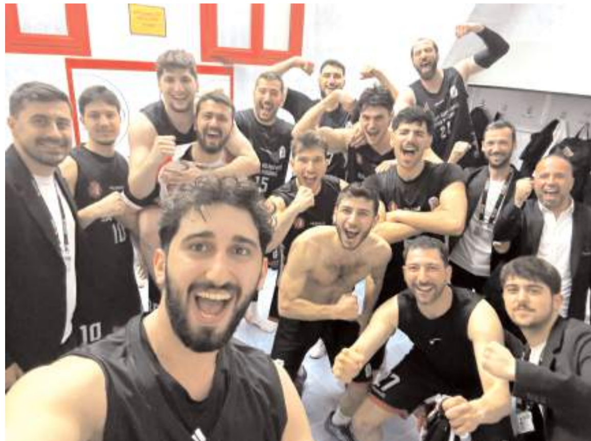
Çorum Belediyespor basketbol takımı Çukurova Üniversitesi deplasmanında galibiyet sevincini böyle yaşadığı

Çorum Belediyespor- Selçuklu Belediyespor. Başkent Seğmenler- Isparta Gençlikspor. Mersin Barosu - Çukurova Üniversitesi.