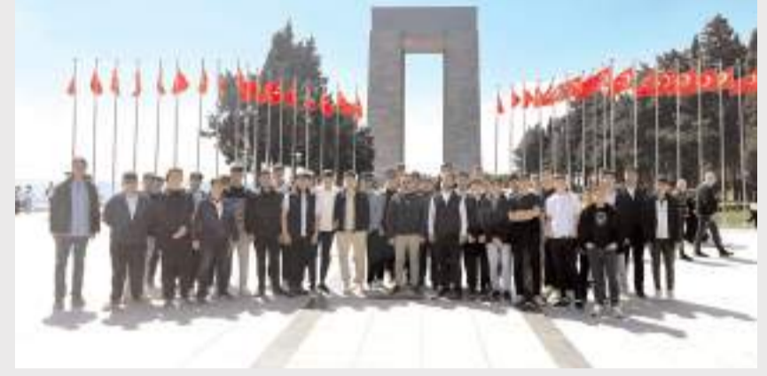
Öğrenciler gezinin anısına bol bol hatıra fotoğrafı çekindiler.