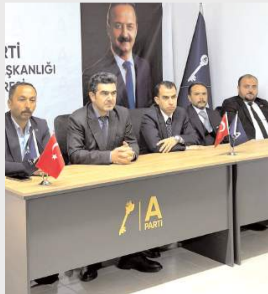
Kongrede ilk olarak divan heyeti belirlendi.