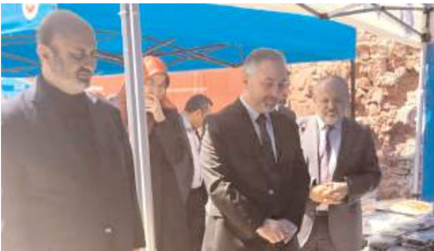
Hayır çarşısı İl Müftülüğü ve Türkiye Diyanet Vakfı tarafından açıldı.