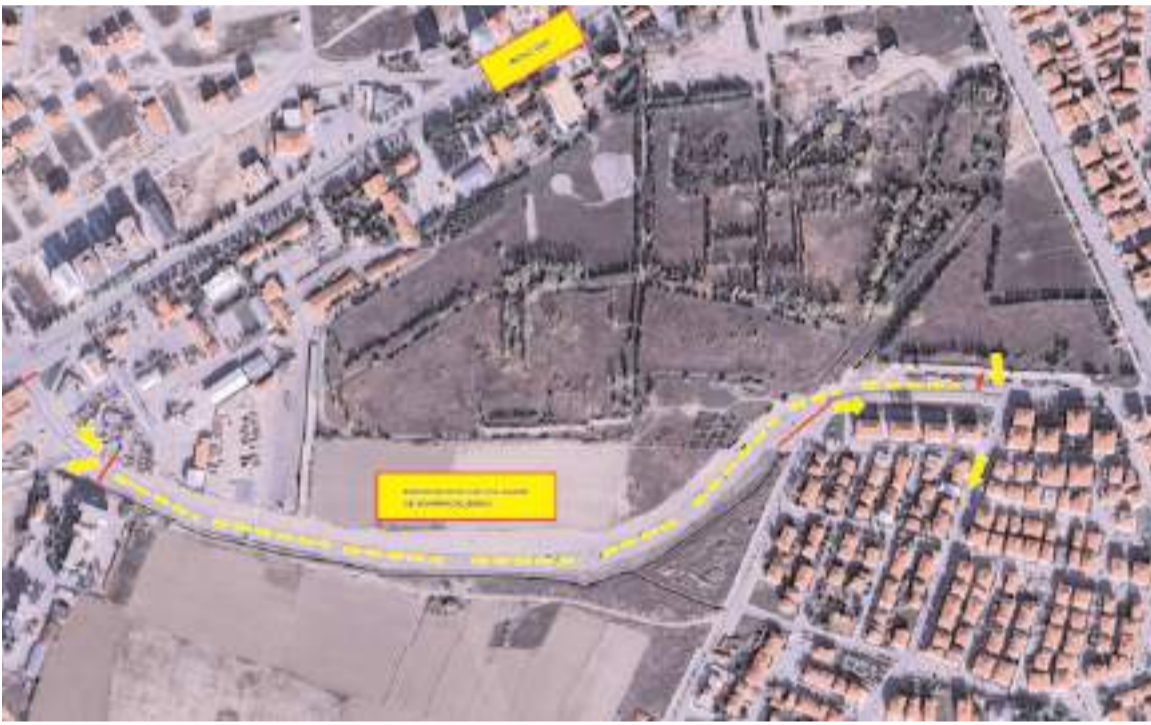
Caddede çalışmalar 21 Nisan 2026 tarihinden itibaren başlayacak.

Çocuk nüfusunun toplam nüfus içindeki oranı Samsun'da %21,7, Tokat'ta %21,2, Amasya'da ise %19,9 olarak gerçekleşti.