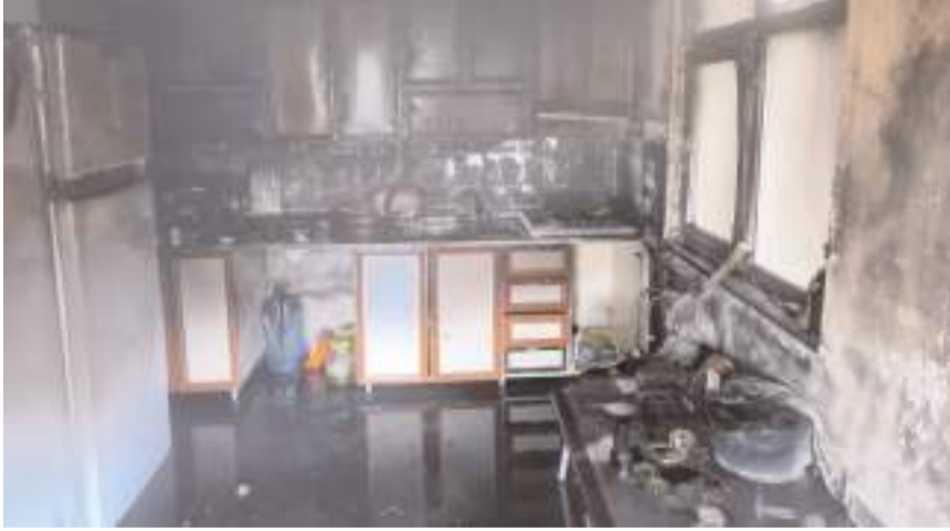
Yangında evde maddi hasar meydana geldi.

Osmaniye Belediyesi itfaiye ekiplerince söndürülen yangın nedeniyle evde maddi hasar oluştu.(AA)