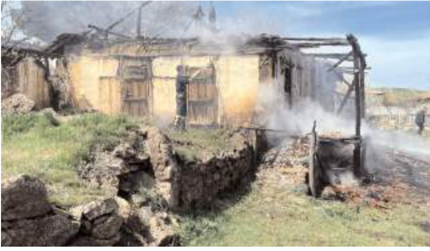
Olay Boğazkale ilçesine bağlı Evcü köyünde meydana geldi.