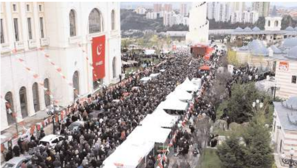
Arıkan, salona giremeyen partililere dışarıda kurulan platformdan seslendi.

Saadet Partisi'nin önceki gün Ankara'da gerçekleştirdiği Türkiye Divanı, 81 il ve ilçelerden gelen binlerce teşkilat mensubunun katılımıyla gerçekleştirildi.