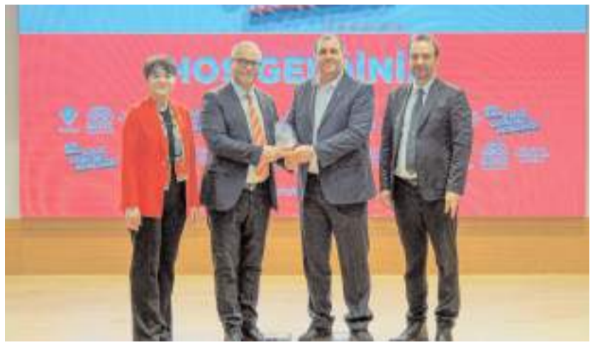
Kongrede emeği geçenlere teşekkür plaketi verildi.