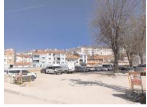
Çorum Belediyesi Recep Tayyip Erdoğan Caddesindeki iki adet arsasını kapalı teklif artırma usulü ile sattı.