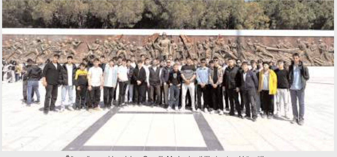
Öğrenciler geziden dolayı Gençlik Merkezi yetkililerine teşekkür ettiler.