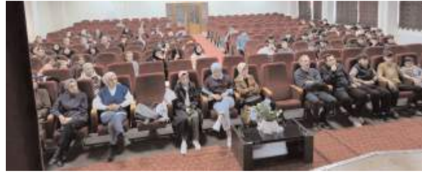
Gelir İdaresi Başkanlığına hazırlanan videolar izleten uzmanlar, ardından öğrencilerin sorularını yanıtladı.