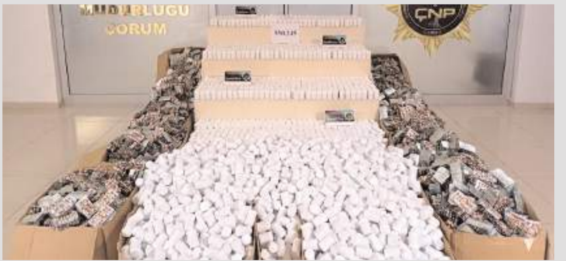
Operasyonda 550 bin 245 sentetik ecza ele geçirildi.