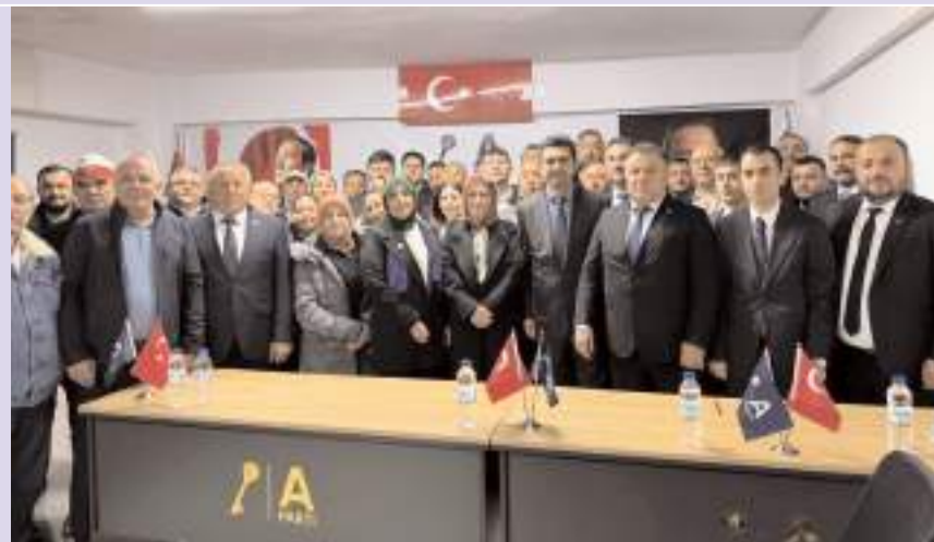
Kongrenin ardından hatıra fotoğrafı çekildi.