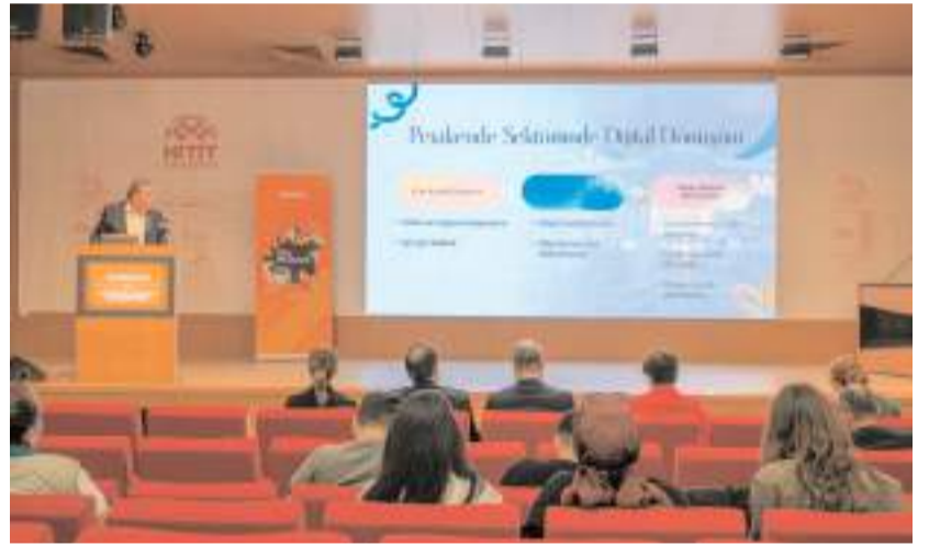
Kongre Meslek Yüksekokulları Kampüsü Ethem Erkoç Konferans Salonunda yapıldı.

Dijital dönüşümü sadece iş süreçlerinin bilgisayara aktarılması değil aynı zamanda bilginin üretiminden