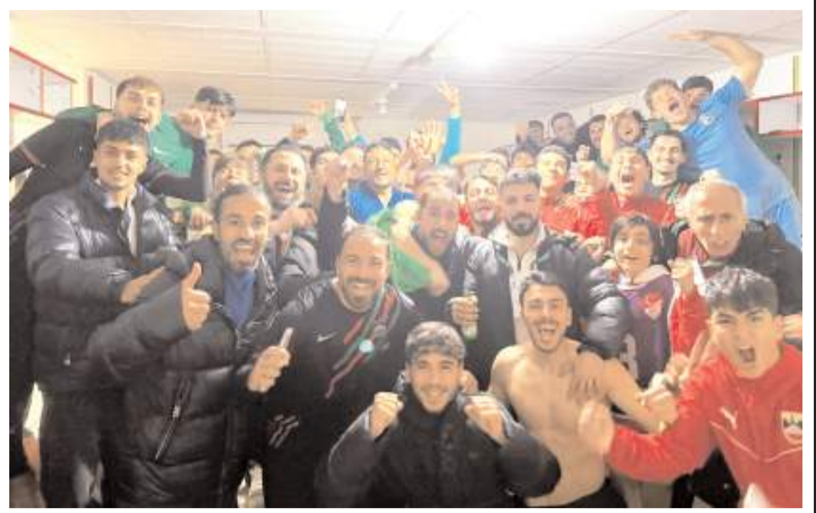
Diyarbakirspor evinde 2-2 berabere kalarak ligde kalma sevincini soyunma odasında böyle yaşadı