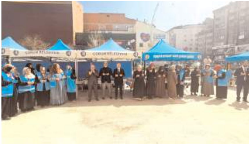
Yapılan duanın ardından hayır çarşısı açıldı.

Türkiye Diyanet Vakfı'nın (TDV) evlenecek gençlere destek amacıyla başlattığı "İki İnsan Bir Hayat" projesi kapsamında İl Müftülüğü tarafından hayır çarşısı kuruldu.