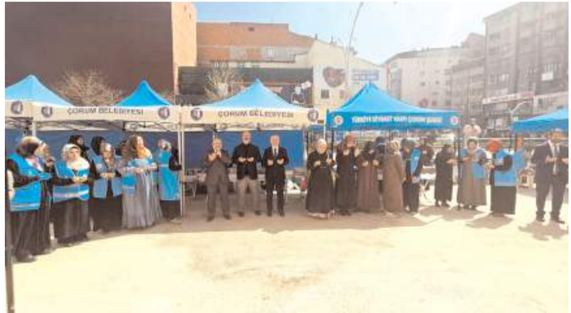
Yapılan duanın ardından hayır çarşısı açıldı.

Proje çerçevesinde İl Müftülüğü, Azap Ahmet Camii yanında bir hayır çarşısı kurarak vatandaşların yardımlarını düzenlediği kermes aracılığıyla