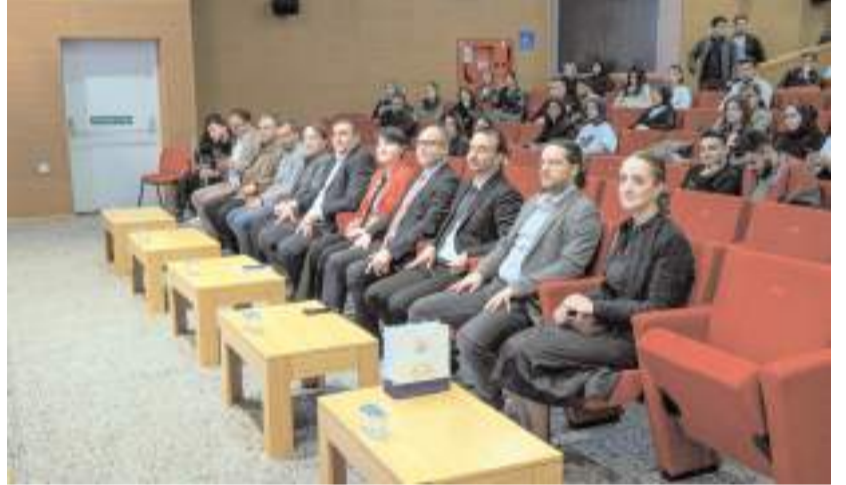
53 farklı üniversiteden 315 genç yazarın katıldığı Hitit Öğrenci Kongresinde 215 bildiri sunuldu.