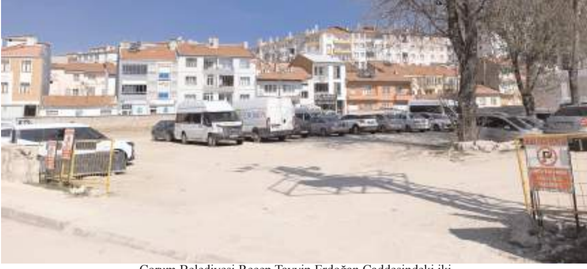
Çorum Belediyesi Recep Tayyip Erdoğan Caddesindeki iki adet arsasını kapalı teklif artırma usulü ile toplam 280 milyon liraya sattı.

4915 Ada 4 Nolu parseli 130 milyon lira bedelle Karabeyoğlu İnşaat, 4915 Ada 5 Nolu parseli ise 150 milyon lira bedelle Turkuaz Evler aldı.