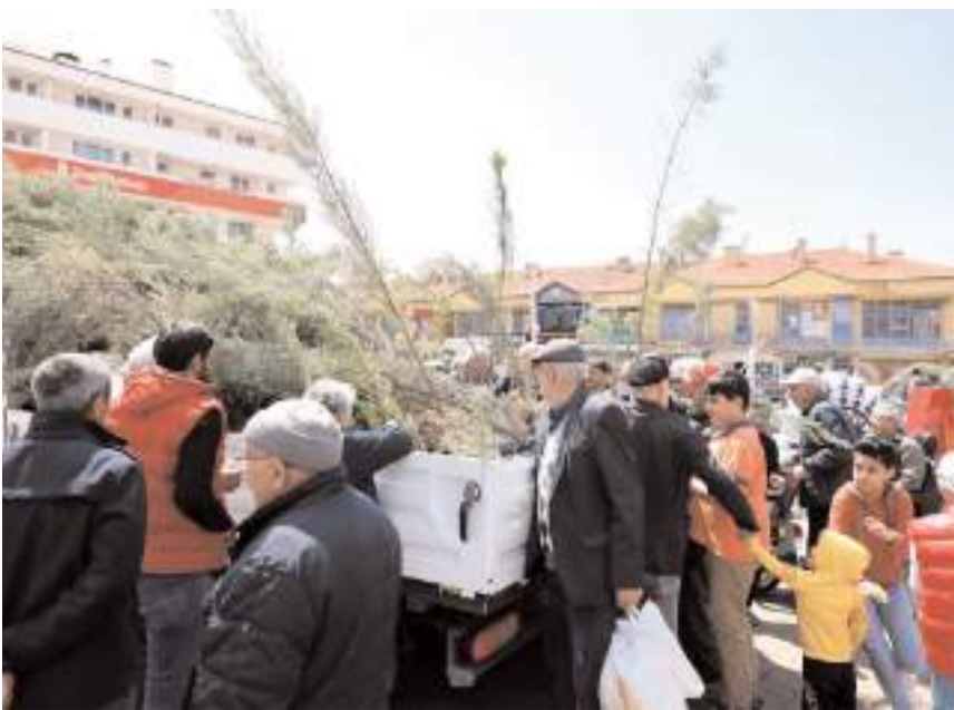
Vatandaşların fidan dağıtımına ilgisi yüksek oldu.

Alaca Belediyesi tarafından vatandaşlara 2 bin çam fidanı ücretsiz olarak dağıtıldı. Alaca Belediyesi'nin çevre bilincini artırmaya yönelik çalışmaların devam edeceği ifade edildi.(İHA)