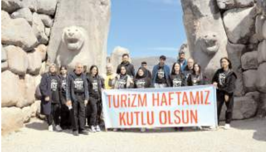
Etkinlikler kapsamında öğrenciler ören yerlerini uzmanlar eşliğinde gezdi.