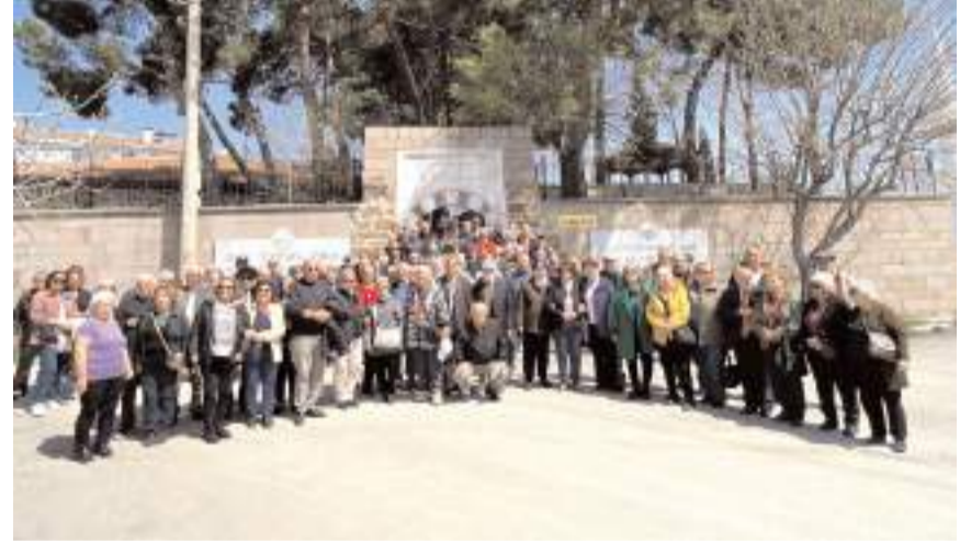
Emekli öğretmenler Osmancık'ı gezdi.