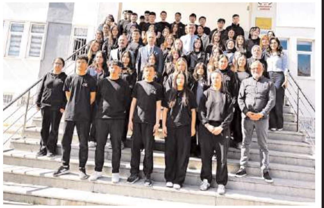
Programın ardından hatıra fotoğrafı çekildi.

Çorum Cumhuriyet Başsavcısı Ahmet Bektaş, Cumhuriyet Anadolu Lisesi öğrencilerini ziyaret etti.