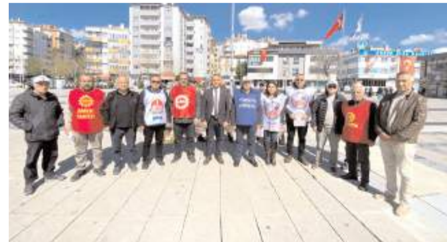
Tertip Komitesi, Kadeş Barış Meydanı'nda basın açıklaması yaptı.

riş Meydanı'nda basın açıklaması yapıldıktan sonra Gazi Caddesi ve Saat Kulesi civarında bildiri dağıtımı yapıldı.