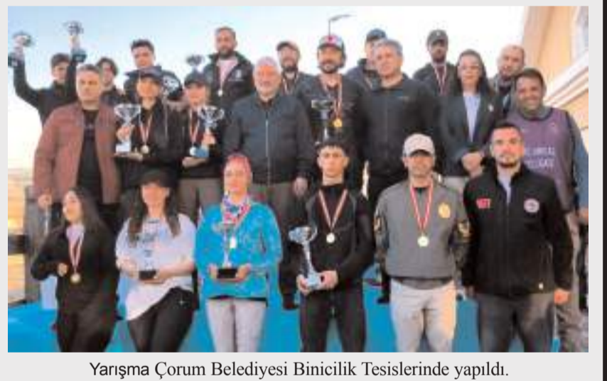
Yarışma Çorum Belediyesi Binicilik Tesislerinde yapıldı.