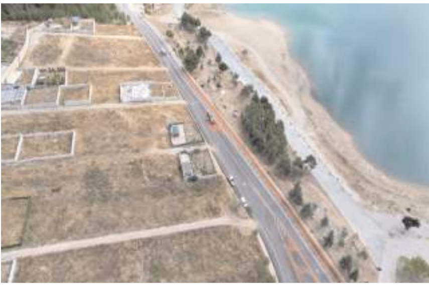
Çorum Belediyesi baraj çevresinde yollarda düzenleme yapıyor.

Çorum Belediyesi, Çorum Barajı'na Binevler istikametinden giden vatandaşlara uyarıda bulundu.