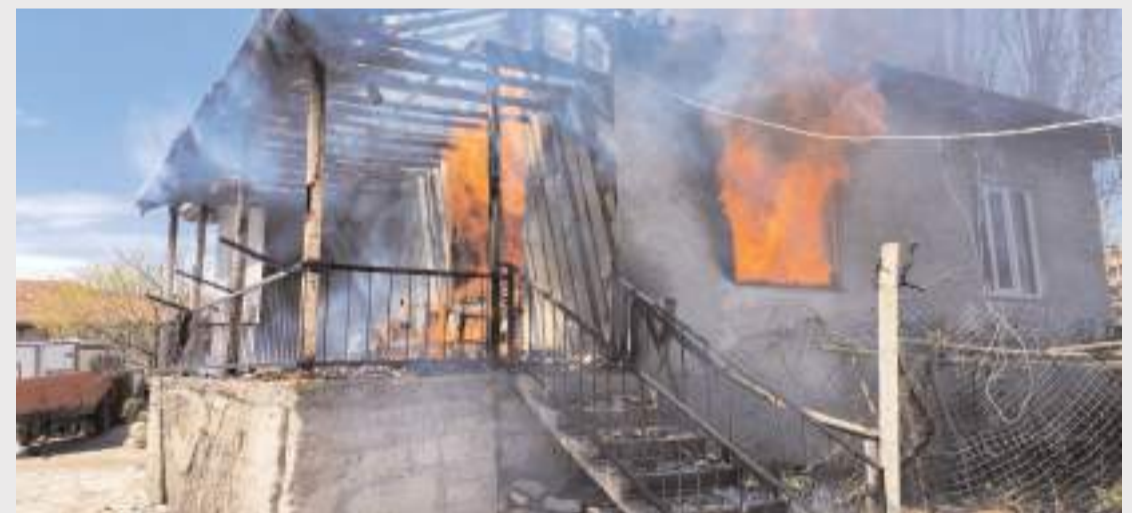
Olay Arifegazili köyünde meydana geldi.