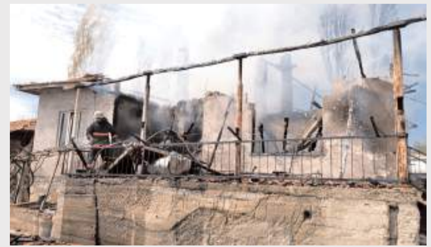
İtfaiye ekipleri yanan ev ve çevresinde soğutma çalışması yaptı.

İtfaiye ekipleri yangın ev ve çevresinde soğutma çalışması yaptı.