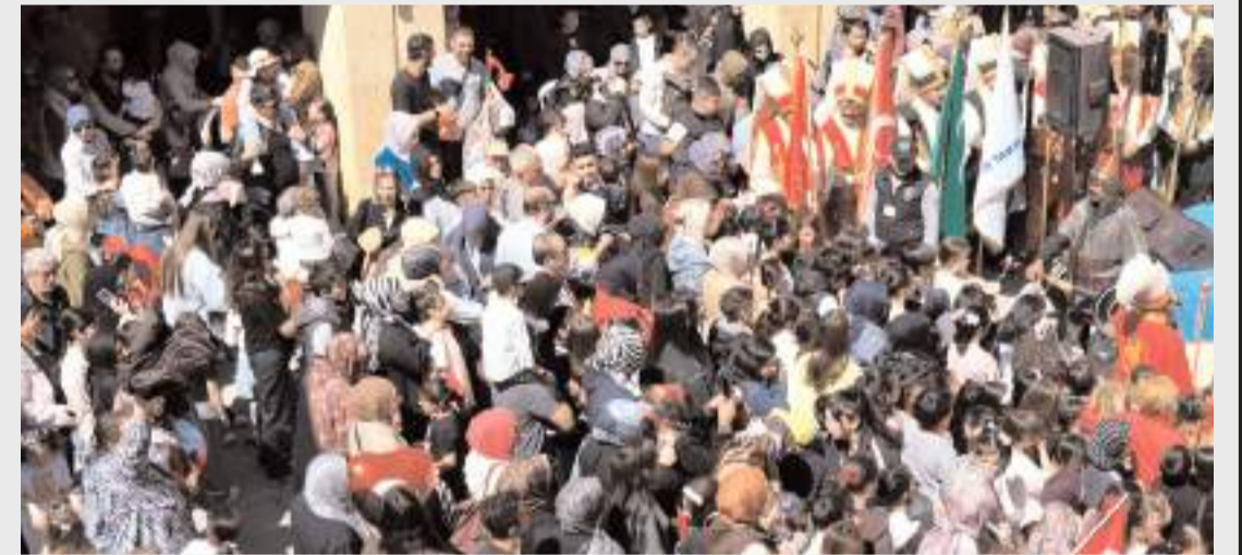
Şenliğe ilgi yüksek oldu.