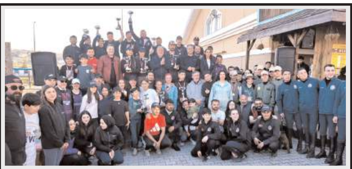
Yarışmada derece elde edenlere ödülleri verildi.