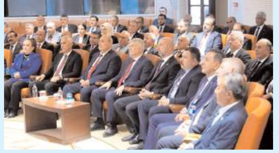
Ziyarette Çorum'un projeleri de istişare edildi.