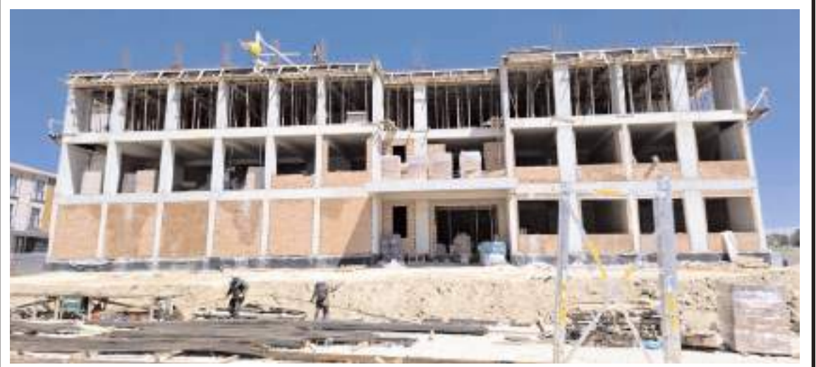
İl merkezinde eğitim yatırımları hızla devam ediyor.

Sağlık hizmetinin sürdürülebilirliği, ancak güvenli çalışma koşullarının sağlanmasıyla mümkündür. Toplumun tüm kesimlerini sağlıkta şiddete karşı duyarlı olmaya ve ortak bir sorumluluk bilinciyle hareket etmeye davet ediyoruz. Sağlık çalışanlarına yönelik her türlü şiddeti kınıyor, hayatını kaybeden sağlık emekçilerini saygı ve rahmetle anıyoruz" dedi. (Haber Merkezi)