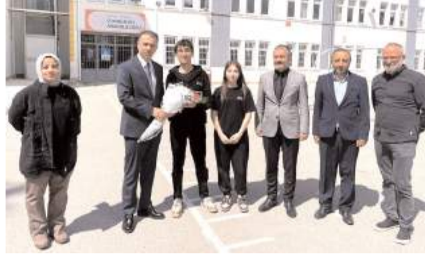
Öğrenciler Başsavcı Ahmet Bektaş'a çiçek hediye etti.