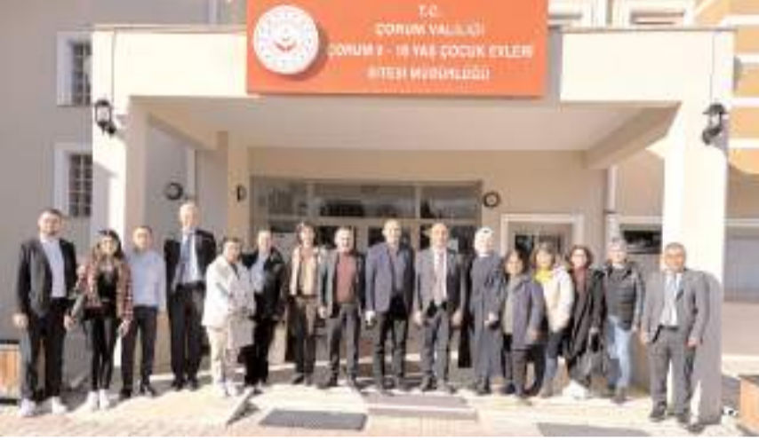
CHP heyeti çocukların 23 Nisan Ulusal Egemenlik ve Çocuk Bayramı'nı kutladı.