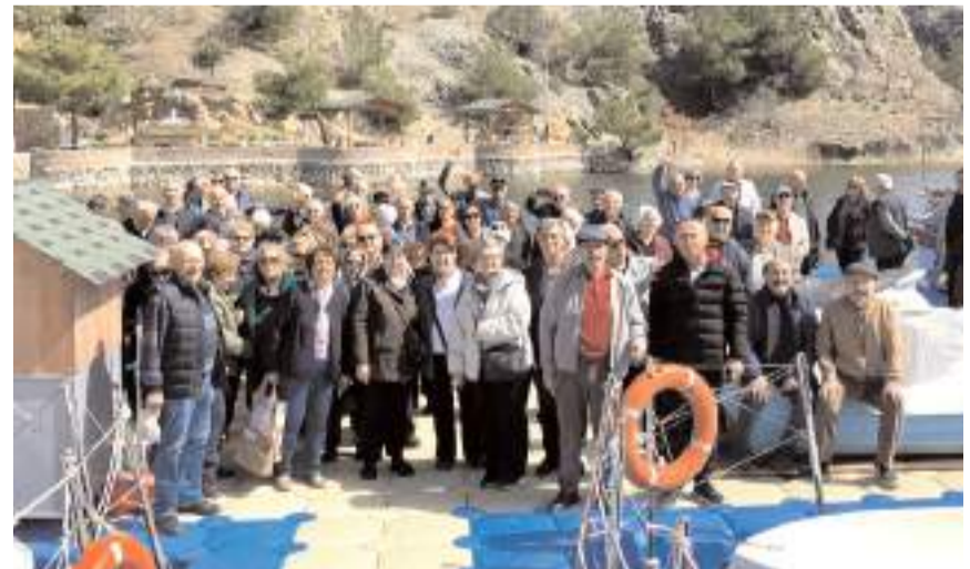
Emekli öğretmenler Oğuzlar Altınkoz Tesisleri'nde mola verdi.