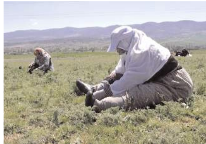
Madımak otunu toplamak için vatandaşlar yoğun mesai harcıyor.

Nisan ve mayıs aylarında sezonu olur" dedi.(İHA)