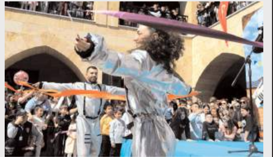
Şenlikte ilgi çekici gösteriler yapıldı.