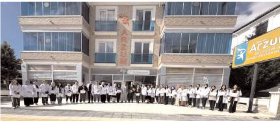
Günün anısına toplu hatıra fotoğrafı çekildi.