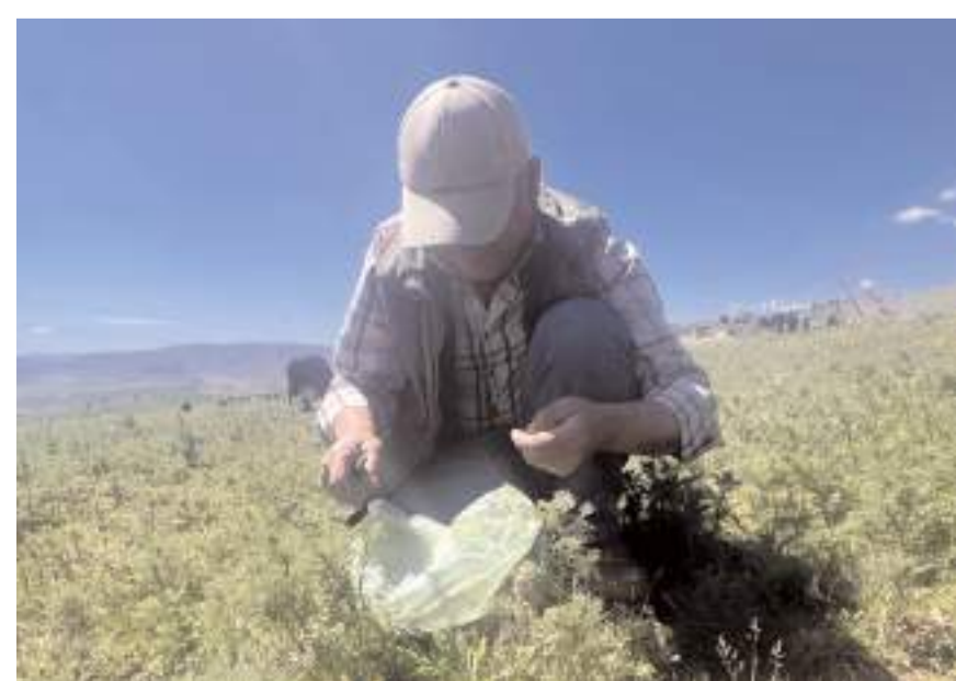
Madımak otunun kan şekerinin dengelenmesini sağladığı ve vücudun bağışıklık sistemini güçlendirdiği belirtiliyor.