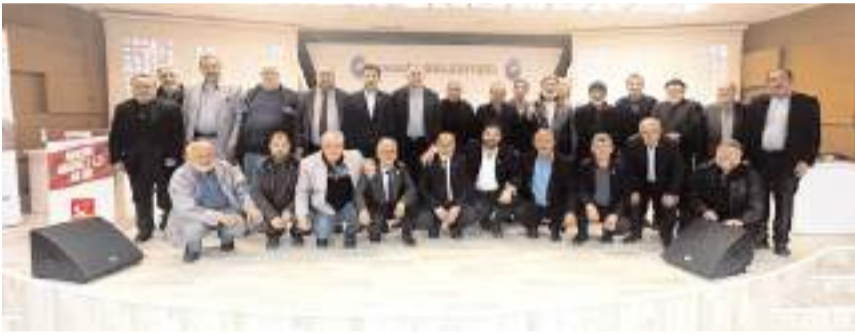
Toplantıda parti çalışmaları istişare edildi.