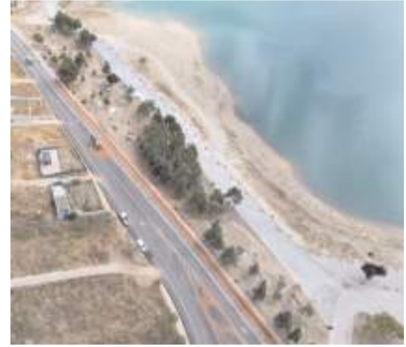
Çorum Belediyesi baraj çevresinde yollarda düzenleme yapıyor.