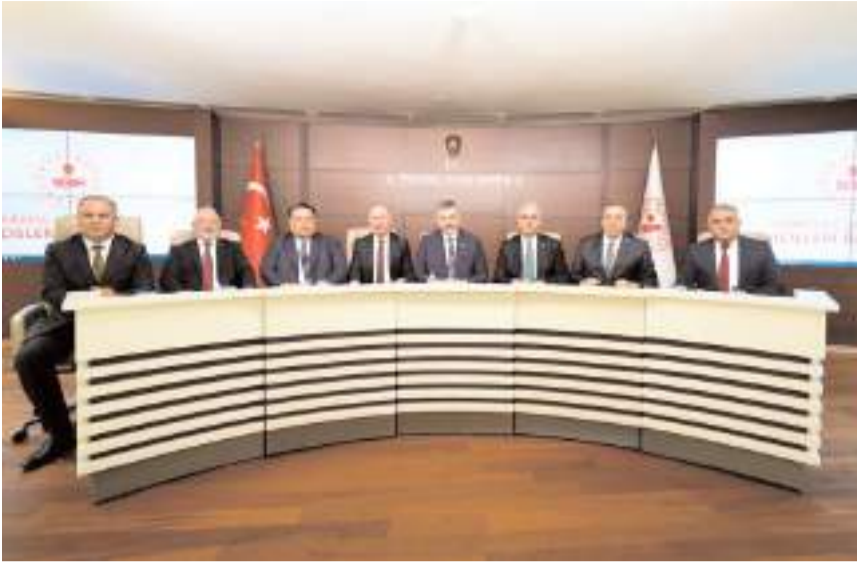
Çorum heyeti İçişleri Bakanı Mustafa Çiftçi'ye hayırlı olsun ziyaretinde bulundu.