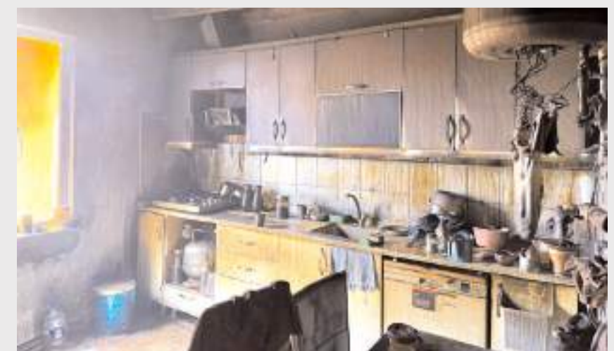
Yangında ev kullanılmaz hale geldi.