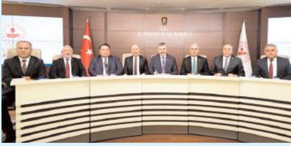
Çorum heyeti İçişleri Bakanı Mustafa Çiftçi'ye hayırlı olsun ziyaretinde bulundu.

Çorum Valisi Ali Çalgan ve beraberindeki kalabalık bir heyet İçişleri Bakanı Mustafa Çiftçi'ye hayırlı olsun ziyaretinde bulundu. Çorum'da devam eden yatırımlar ve gelecek hedeflerinin masaya yatırıldığı ziyarette Bakan Çiftçi, "Her zaman Çorum'un yanındayım" mesajını verdi.