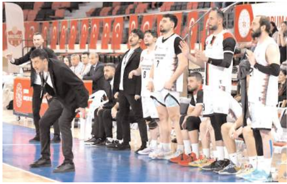
Çorum Belediyespor'un Selçuklu Belediyespor maçında son bölümden kenar yönetim ve teknik heyetin heyecanı

Çorum'da oynanacak U 17 Gelişim Liginde Natura Dünyası Gençlerbirliği ile Özelsan Sivasspor arasındaki maç 2 Mayıs cumartesi gününe alındı.