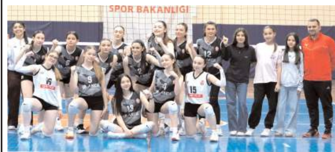
Osmancık Belediyespor genç kız voleybol takımı yarı final grubunda Tokat'ta final bileti için mücadele edecek

Genç Kadınlarda Osmancık Belediyespor 18-23 Mayıs tarihleri arasında Tokat'ta yapılacak olan yarı final grubunda mücadele edecek. Grupta Osmancık Belediyespor ile birlikte Ordu 52 Çamlıkspor, Aksaray Kuzeyboru Maxpipe ve Kayseri Voleybol takımları bulunuyor. Dört takımın tek devreli lig sistemine göre oynayacağı maçlar sonunda birinci olan takım Türkiye finallerinde mücadele etmeye hak kazanacak.