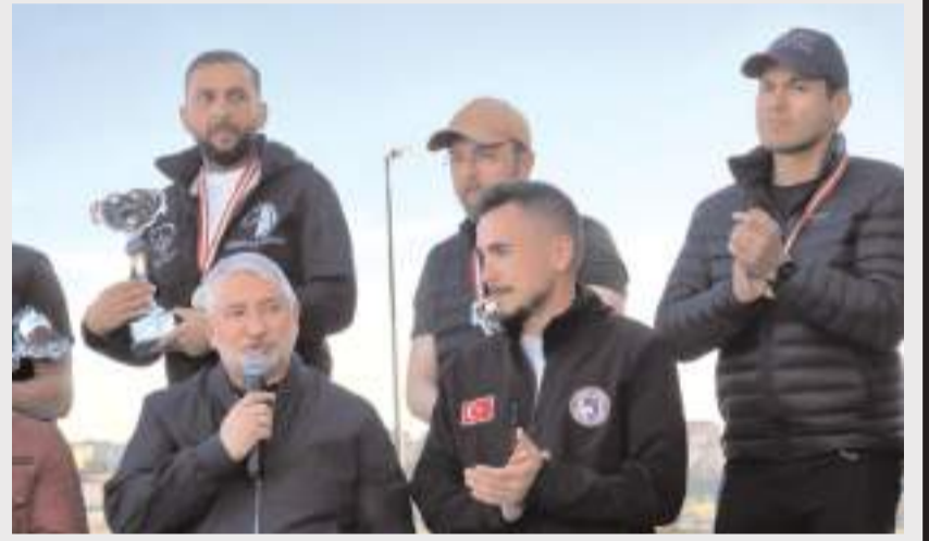
Başkan Aşgın, sporcuları tebrik etti.