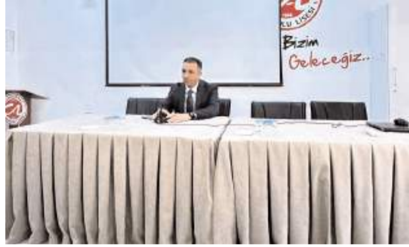
Cumhuriyet Başsavcısı Ahmet Bektaş, adalet sistemi, meslek hayatı ve tecrübeleri hakkında bilgiler verdi.