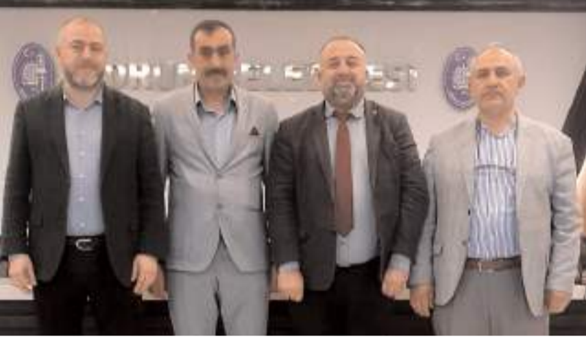
Toplantı Turgut Özal İş Merkezi Belediye Konferans Salonunda yapıldı.