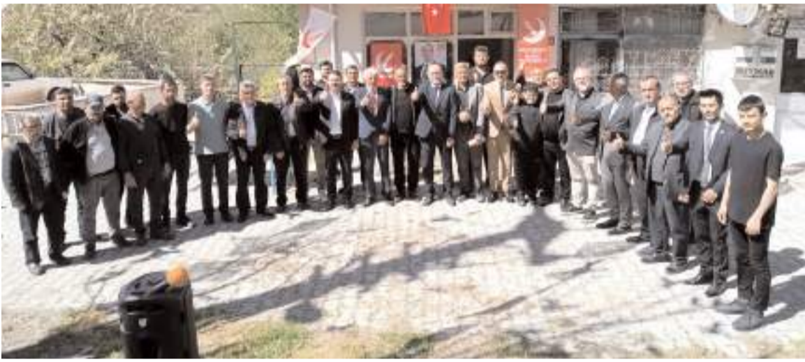
Açılışın ardından toplu hatıra fotoğrafı çekildi.