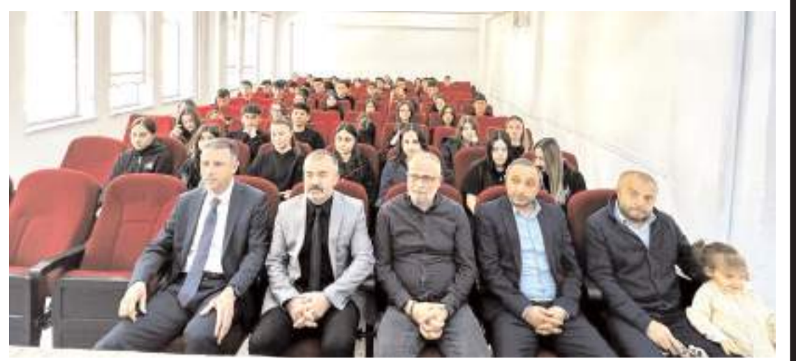
Cumhuriyet Başsavcısı Ahmet Bektaş, Cumhuriyet Anadolu Lisesinin konuğu oldu.