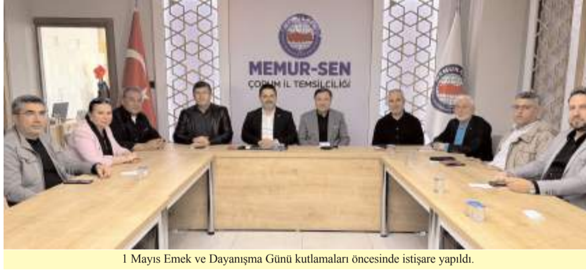
1 Mayıs Emek ve Dayanışma Günü kutlamaları öncesinde istişare yapıldı.