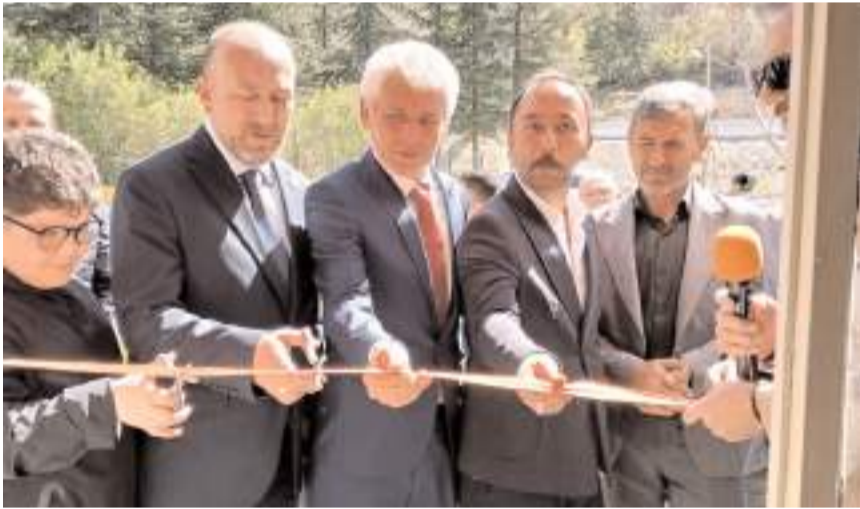
Yapılan duanın ardından açılış kurdelesi kesildi.