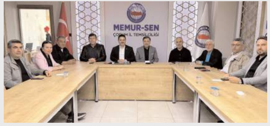
1 Mayıs Emek ve Dayanışma Günü kutlamaları öncesinde istişare yapıldı.