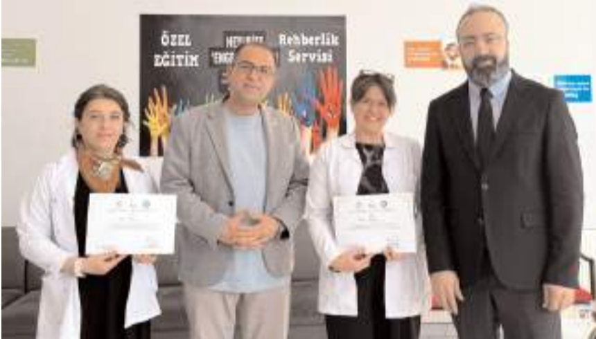
Seminerin sonunda katılımcılara sertifika verildi.