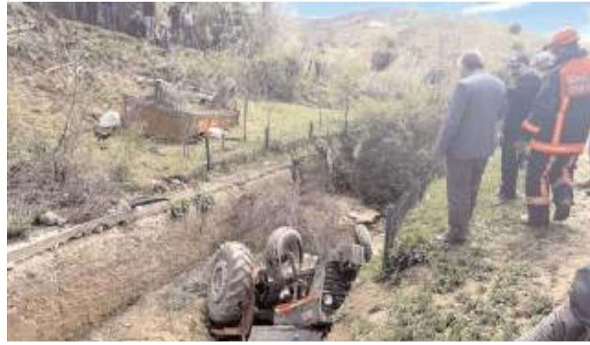
Kaza Sungurlu'ya bağlı Beşköy köyünde meydana geldi.