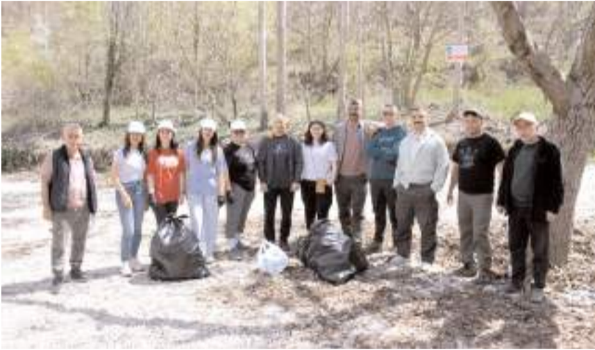
Kutlama programı kapsamında doğa yürüyüşü yapıldı.