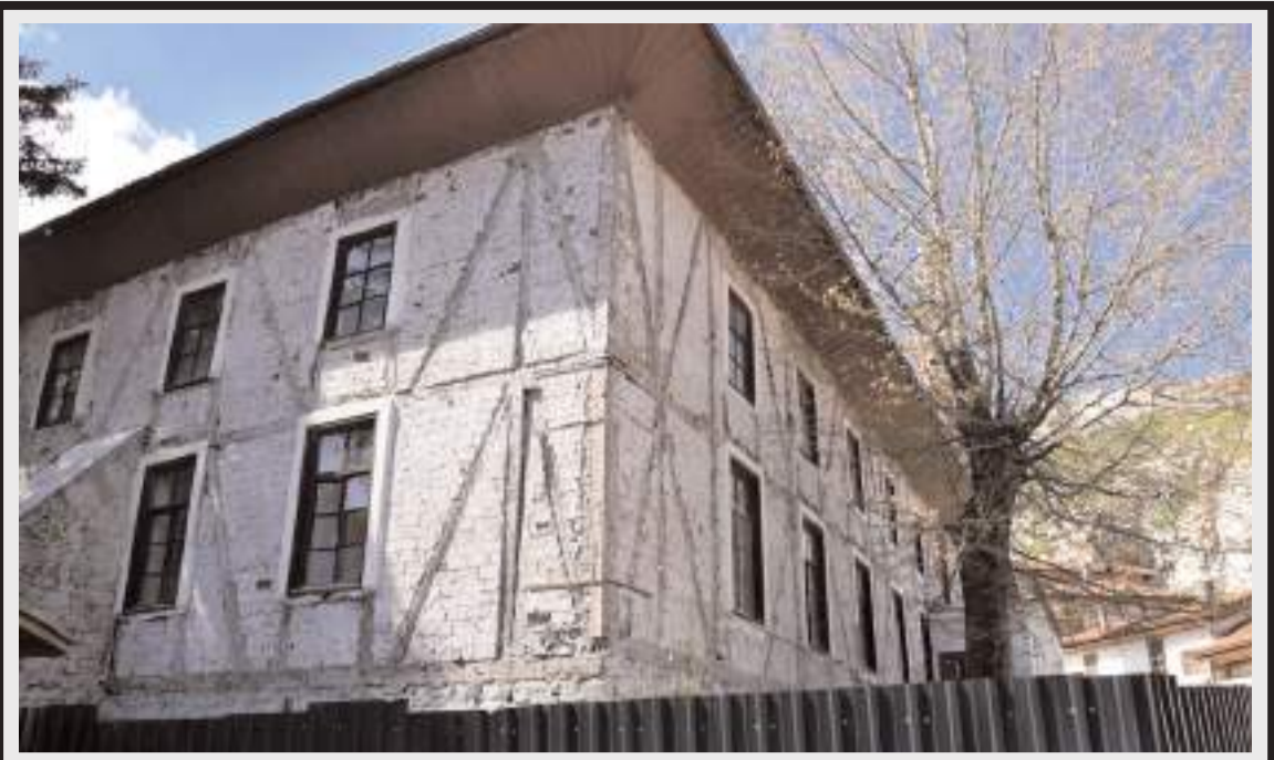
Ulu Camide restorasyon çalışmaları devam ediyor.