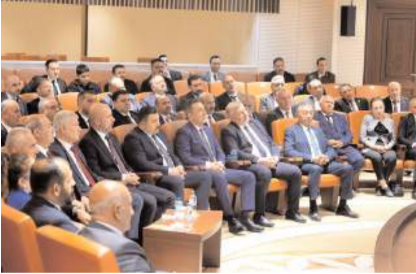
Ziyarete Çorum'un projeleri de istişare edildi.