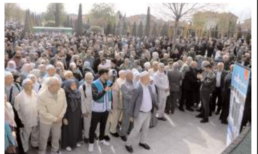
Hacı adaylarını akrabaları ve sevenleri yalnız bırakmadı.