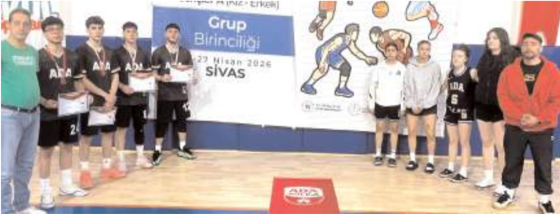
Ada Koleji kız ve erkek takımları final biletini aldıkları grup maçları sonunda ödülleri ile birlikte toplu halde

Sivas'ta yapılan Liseli Gençler 3x3 Basketbol bölge birinciliğinde Ada Koleji kız ve erkek takımları 11-15 Mayıs tarihlerinde Diyarbakır'da yapılacak Türkiye finallerinde mücadele etmeye hak kazandılar.