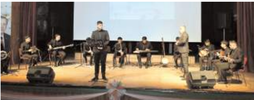
Programda müzik dinletisi gerçekleştirildi.