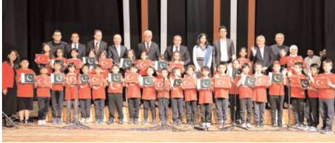
Devlet Tiyatro Salonunda yapılan programın sonunda günün anısına toplu fotoğraf çekinildi.

Pakistan'ın Ankara Büyükelçiliği tarafından Çorum'da düzenlenen "Chughtai Sanat Ödülleri 2026" ödül töreninde konuşan Büyükelçi Yusuf Cüneyd, "Türkiye ile Pakistan, tarihi bağlarını stratejik bir ortaklığa dönüştürme konusunda ortak bir vizyon paylaşmaktadır. Bu dostluğu gelecek nesillere aktarmak en büyük hedefimizdir" dedi. * HABERİ2'DE