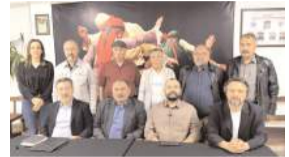
Basın toplantısında kongre hakkında bilgiler verildi.

Sağlık Bakanlığı tarafından Erol Olçok Eğitim ve Araştırma Hastanesi'ne, sağlık hizmetlerinin kalitesini artırmaya yönelik üç ayrı tıbbi cihaz tahsis edildi. * HABERİ6'DA