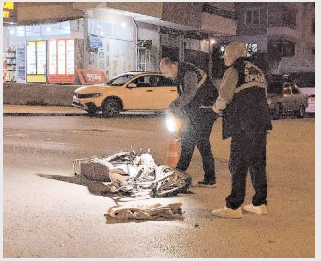
Kaza Gülabibey Mahallesi Bağcılar 1. Caddede meydana geldi.