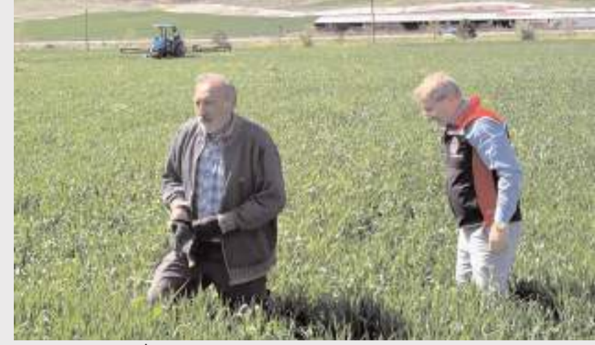
Sungurlu İlçe Tarım ve Orman Müdürlüğü teknik personeli, bölgedeki hububat alanlarında kapsamlı bir tarama gerçekleştirdi.