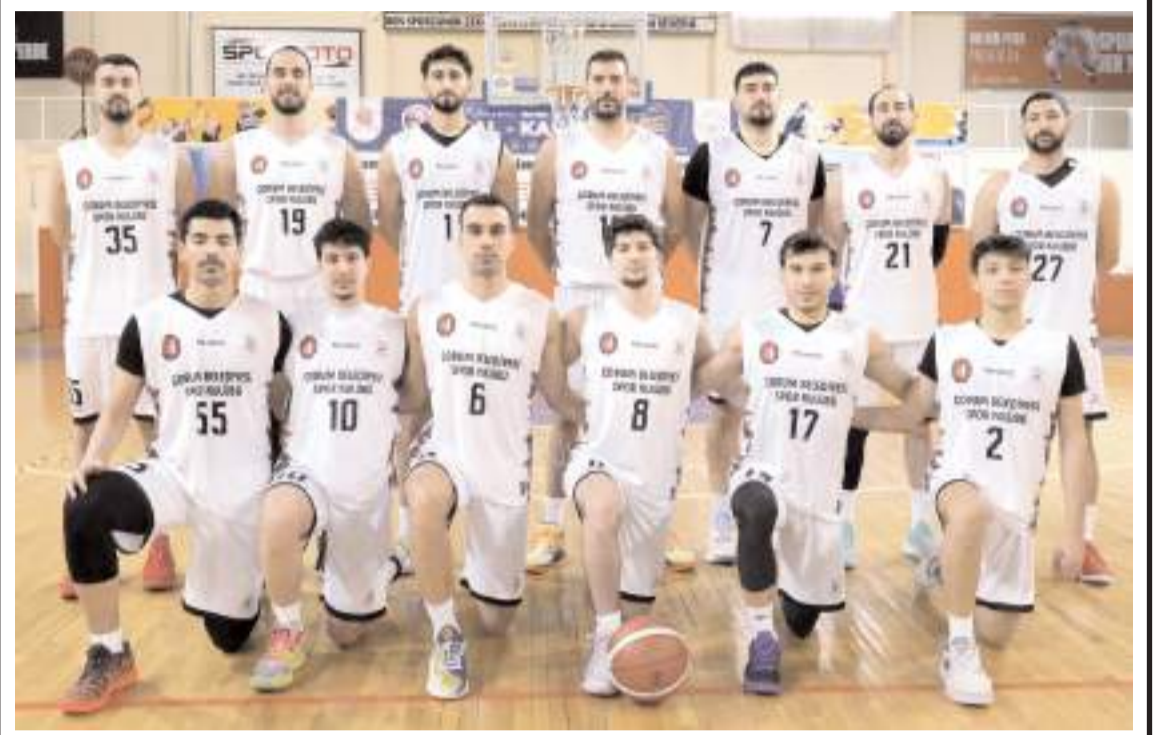
Çorum Belediyesi Basketbol takımı finallerden 2. lige ü için mücadele edeceği rakipleri belli oldu