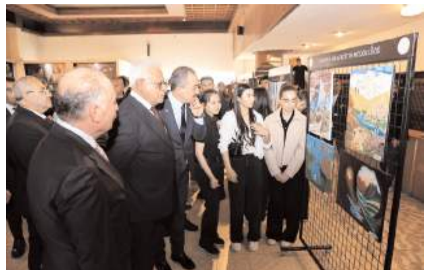
Katılımcılar sergiyi gezerek öğrencilerden eserler hakkında bilgi aldı

Olçok Anadolu İmam Hatip Lisesi Müzik Bölümü öğrencileri de müzik dinletisi gerçekleştirdi.