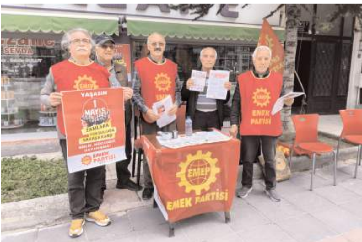
Emek Partisi (EMEP) Çorum İl Örgütü, 1 Mayıs için stant açtı.