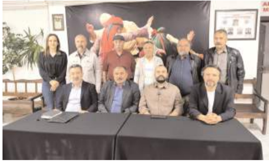
Basın toplantısında kongre hakkında bilgiler verildi.

Kongre, Hacı Bektaş Veli Anadolu Kültür Vakfı Çorum Şubesi ile Çorum Alevi Kültür Merkezi Derneği tarafından, Çorum Alevi Kültür Şenliği kapsamında gerçekleştirilecek. Etkinlik, yalnızca akademik bir platform olmanın ötesinde, saha ile doğrudan temas kurulabilecek bir buluşma zemini