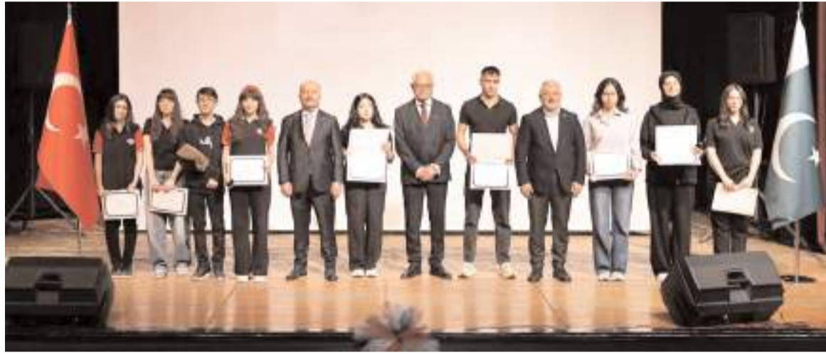
Yarısmada dereceye giren öğrencilere ödülleri protokol üyeleri tarafından verildi.

Pakistan’ın Ankara Büyükelçisi Yusuf Cüneyd ise Türkiye ile Pakistan arasındaki ilişkilerin “İki devlet, tek millet” anlayışıyla güçlendiğini ifade ederek, “Bugün ikili ilişkilerimizin her geçen gün daha da güçlendiğini görmek büyük bir memnuniyet kaynağıdır. Pakistan ve Türkiye, tarihi bağlarını dinamik ve stratejik bir ortaklığa dönüştürme konusunda ortak bir vizyonu paylaşmaktadır. Türkiye ile Pakistan, tarihi bağlarını stratejik bir ortaklığa dönüştürme konusunda ortak bir vizyon paylaşmaktadır. Bu dostluğu gelecek nesillere aktarmak en büyük hedefimizdir.” diye konuştu.