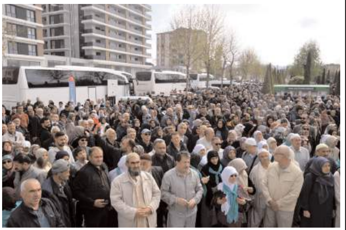
Aybike Turizm organizasyonu ile kutsal topraklara giden hac kafelesi için uğurlama töreni düzenlendi.

"15 Temmuz Manşetleri Gazetecilik Atölyesi"nin ilk programı 29 Nisan 2026 Çarşamba günü Akdeniz Üniversitesi İletişim Fakültesi Konferans Salonunda gerçekleştirilecek. Atölye çalışması; Ankara Üniversitesi, Atatürk Üniversitesi, Ege Üniversitesi, Gaziantep Üniversitesi, İstanbul Üniversitesi ve Ondokuz Mayıs Üniversitesi İletişim Fakülte-lerinde düzenlenecek etkinliklerle devam edecek. (Haber Merkezi)