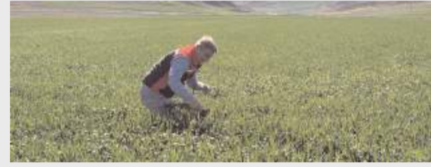
Tarlaların hastalık riskine karşı düzenli aralıklarla kontrol edilmesi istendi.

Çorum'un Sungurlu ilçesinde, hububat ekili tarım arazilerinde ürün rekoltesini ve kalitesini düşürebilecek fungal (mantari) hastalıklara karşı saha denetimleri aralıksız devam ediyor.