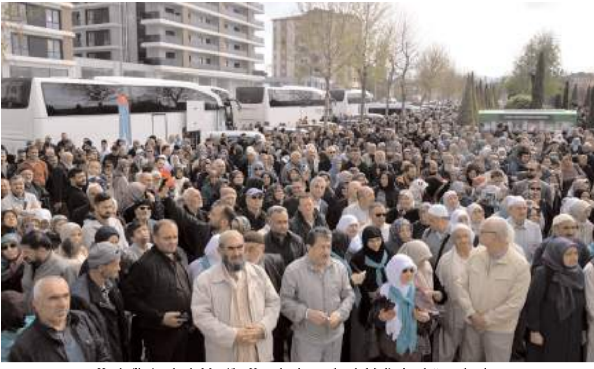
Hacı kafillesi otobüsle Merzifon Havaalanı'na oradan da Medine'ye doğru yola çıktı.