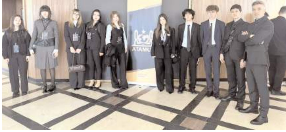
Mehmetçik Anadolu Lisesi 9 öğrenciyle programa katıldı.