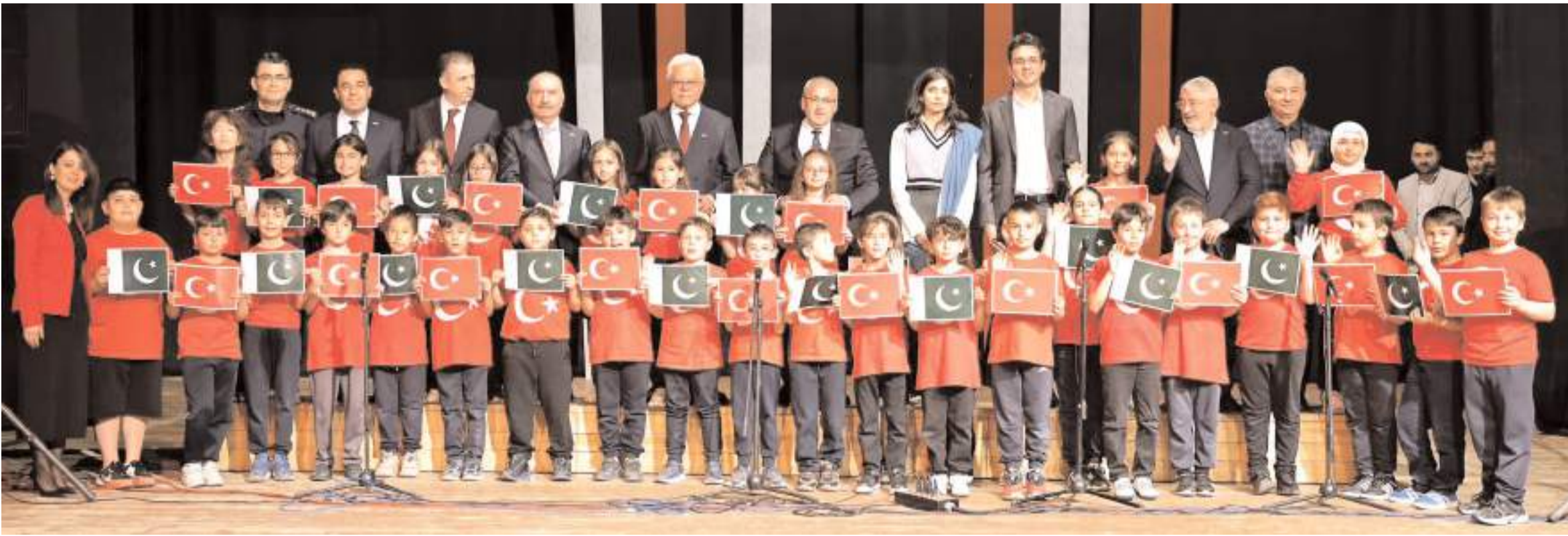
Devlet Tiyatro Salonunda yapılan programın sonunda günün anısına toplu fotoğraf çekildi.