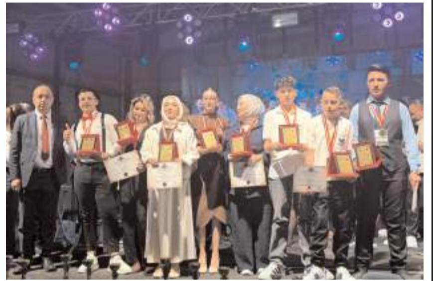
Yarışma TSO Fuar Alanında yapıldı.

İlk kez gerçekleştirilen organizasyon, hem görseelliği hem de yüksek rekabetiyle büyük beğeni topladı.