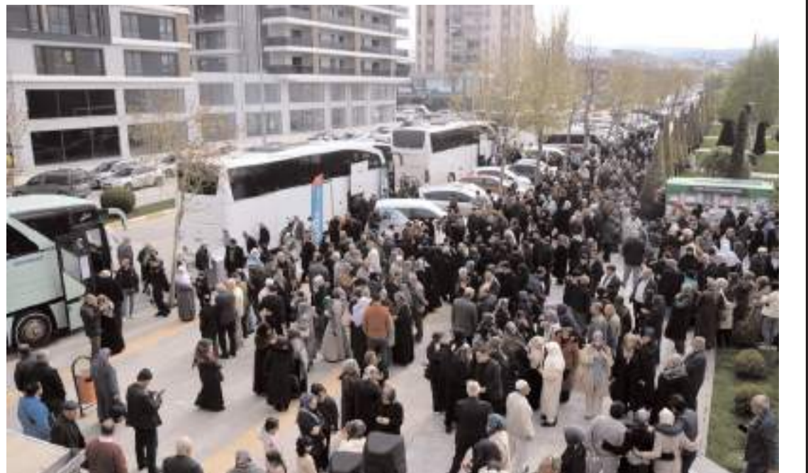
Hac kafelesi otobüsle Merzifon Havaalanı'na oradan da Medine'ye doğru yola çıktı.