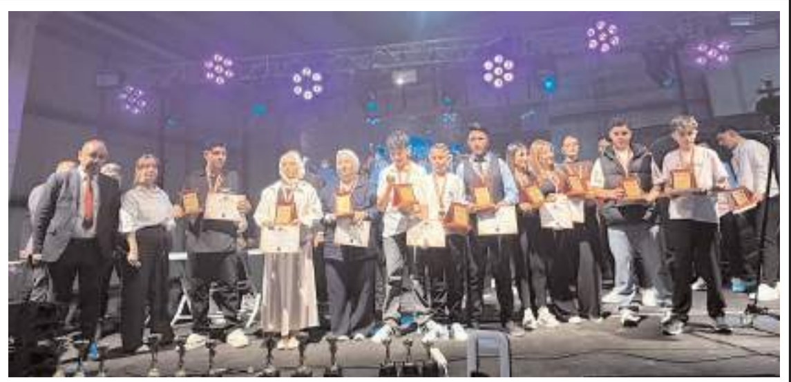
Yarışmaya 14-16 ve 17-21 yaş aralığında toplam 29 yarışmacı katıldı.