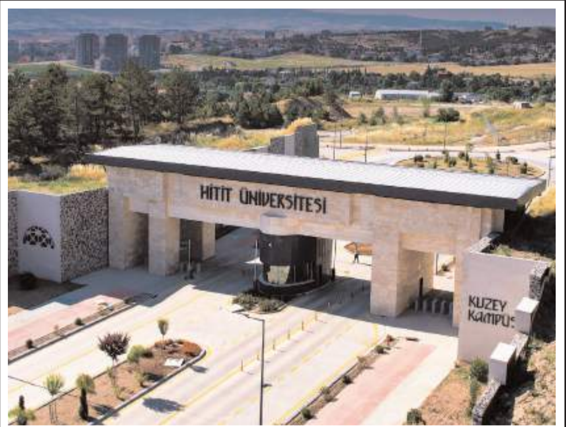
Hitit Üniversitesi, 36 ülke/bölgeden üniversitenin değerlendirildiği sıralamada 801+ bandında yer aldı.