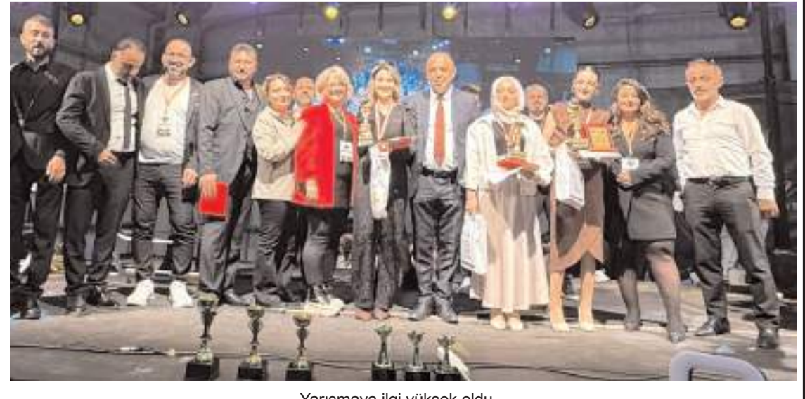
Yarışmaya ilgi yüksek oldu.