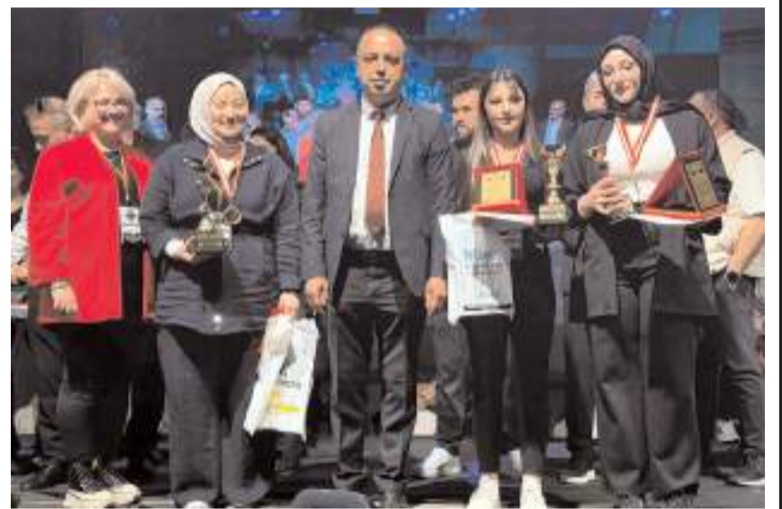
Yarışmada derece elde edenlere ödülleri verildi.