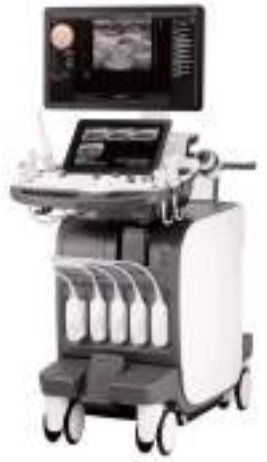
Ultrasonografi (USG) cihazı

tarafından Erol Olçok Eğitim ve Araştırma Hastanesi'ne, sağlık hizmetlerinin kalitesini artırmaya yönelik üç ayrı tıbbi cihaz tahsis edildi.