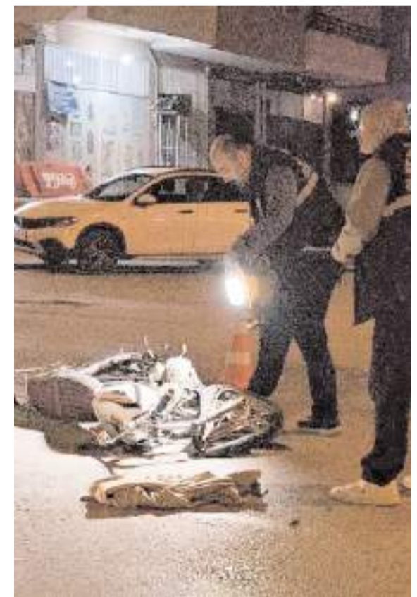
Kaza Güllübay Mahallesi Bağcılar 1. Cadde'de meydana geldi.

Türkiye'de bir ilk olacak "I. Uluslararası Alevilik Çalışmaları Kongresi", 5-7 Haziran'da Çorum'da düzenlenecek. * HABERİ9'DA