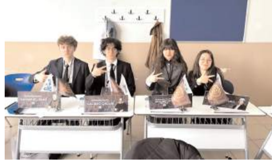
Yarışmada 4 öğrenci ödüle layık görüldü.