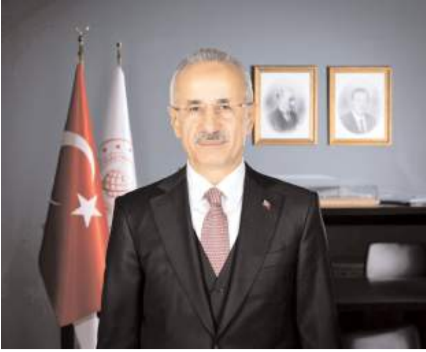
Ulaştırma ve Altyapı Bakanı Abdulkadir Uraloğlu

Ulaştırma ve Altyapı Bakanı Abdulkadir Uraloğlu, Çorum-Laçın Yolu ile Kırkdilim Tünellerinin açılışını yapmak üzere bugün Çorum'a gelecek.