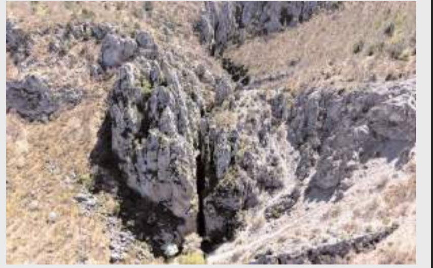
Şelale kayaların arasına gizlenmiş.

Şelaleyi gören herkesin çok beğendiğini ifade eden köy muhtarı Cesur Kaya, "Köyümüzün yaklaşık 200 metre üstünde şelalemiz var. Bunun 100 metre yanına, köyümüzün Avrupa'daki yardımlaşma derneği ve köy halkı olarak bir mesire alanı yaptık. İnsanların güzel vakit geçirebileceği bir alan ve şelaleye yürünecek patika yol kazandırdık. İnşallah insanlar burayı güzel şekilde kullanırlar, ter-