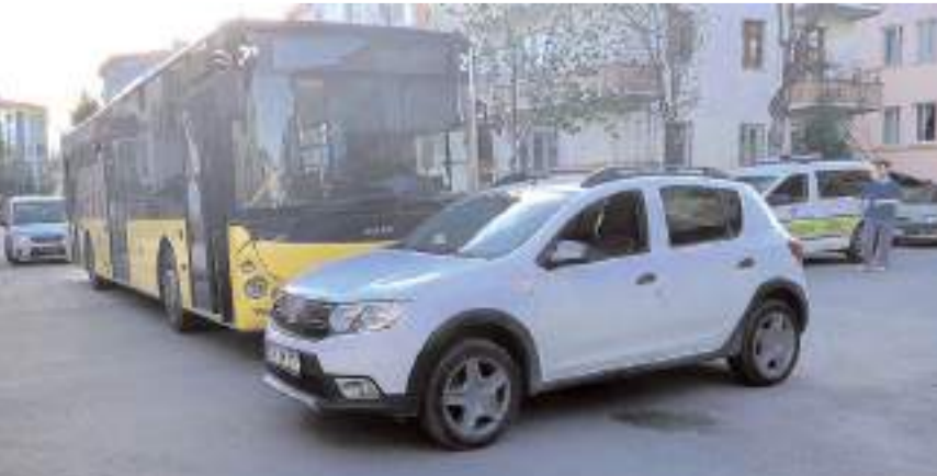
Kaza, Ulukavak Mahallesi Tek Ceviz 17. Sokak ile Tek Ceviz 4. Sokak kesişiminde meydana geldi.

Eğitim ve Araştırma Hastanesine kaldırıldı. Kazayla ilgili inceleme başlatıldı.