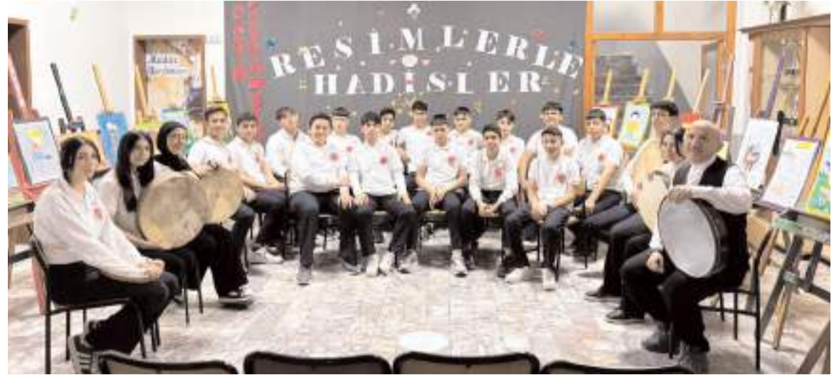
Öğrenciler ilahiler seslendirdiler.

Kuşkonmazın yanı sıra çilek ve marul da yetiştirilen seradan hasat edilen ürünler okulun yemek bölümünün mutfağında değerlendiriliyor.(AA)