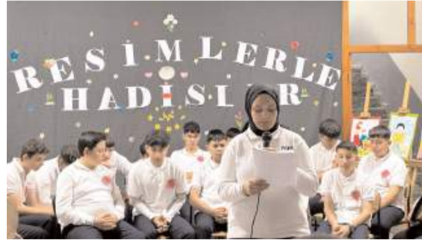
Günün anlamına dair konuşmalar yapıldı.

Beş yaşından bu yana Kur'an kurslarına gittiğini dile getiren Ünverdi, "Neredeyse Kur'an'ın yansına kadar geldim ve Peygamber Efendimizi hayatımın çoğunda örnek alıyorum." ifadelerini kullandı.(AA)