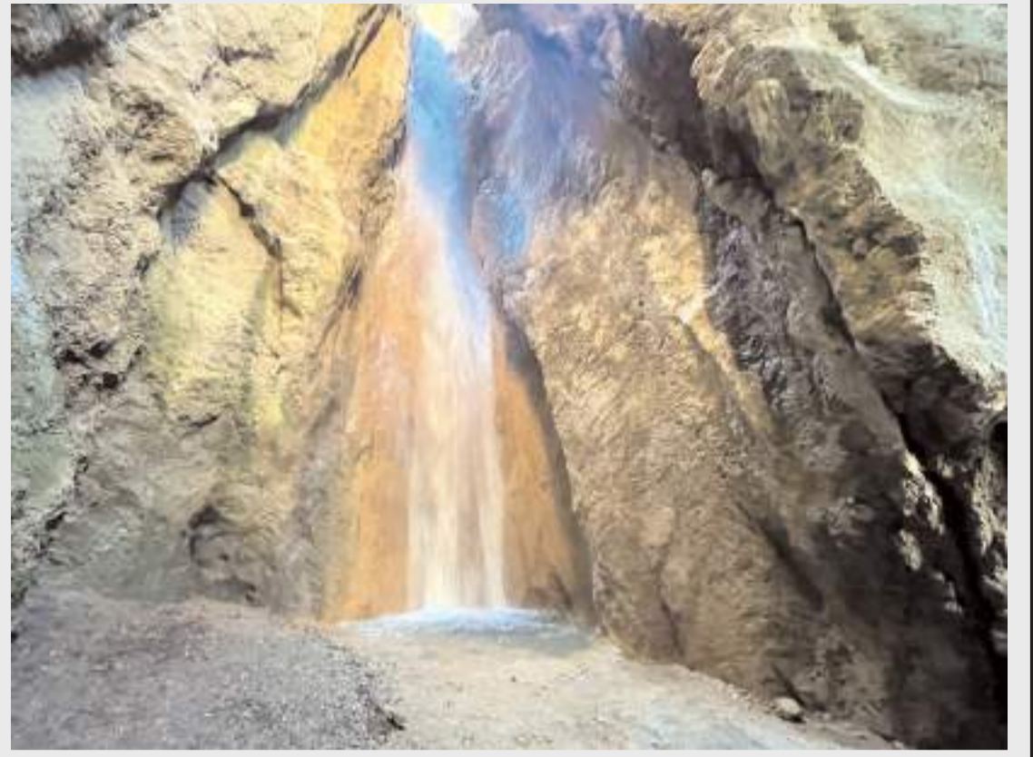
Susuz Şelale, Kent merkezine 30 kilometre uzaklıktaki Kadıderesi köyünde bulunuyor.

İlaçların doğru dozda, uygun zamanda ve hekim/eczacı önerisi doğrultusunda kullanılmasının önemine değinen Aksoy, özellikle aile içinde çocuklara yönelik ilaç kullanımında daha dikkatli olunması gerektiğini vurgulayarak "Evde ilaçların çocukların ulaşamayacağı yerlerde muhafaza edilmesi gerekiyor. Çocuklarda ilaç kullanımı mutlaka doktor önerisiyle olmalı. Başkasına ait ilaçların çocuklara verilmemesi ve tedavi sürecinin uzman tavsiyesi olmadan yarıda bırakılmaması büyük önem taşıyor" dedi. (İHA)