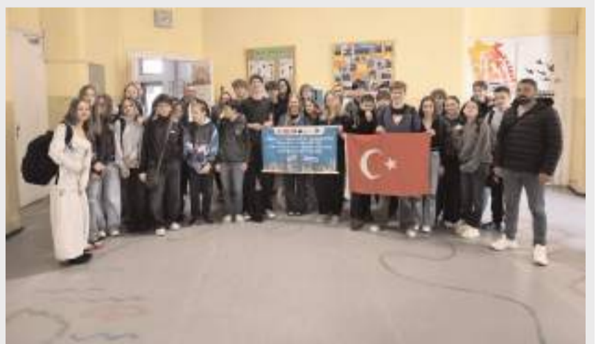
Öğretmenler okulları ziyaret ederek eğitim öğretim faaliyetlerini izlediler.

bi kurumda ders gözlemleri yaparak farklı öğretim yöntem ve tekniklerini yerinde inceleme fırsatı bulduk. Bu süreçte özellikle öğrenci kadrolu eğitim uygulamaları, sınıf içi etkileşim ve ders yönetimi konularına odaklandık" dediler. (Haber Merkezi)