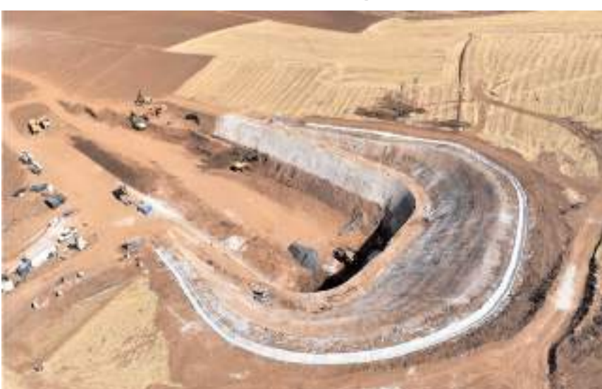
Projede kazı çalışmalarının yüzde 87'si tamamlandı.

Ayrıca Alacahöyük bir Siding istasyonu olacağını sözlerine ekledi.