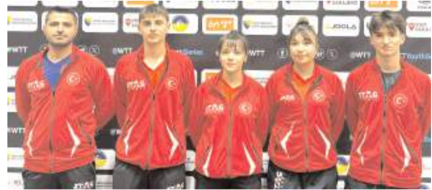
Saraybosna'da yapılan turnuvada mücadele eden milli takımı toplu halde

5-6 Mayıs tarihleri arasında Çorum'da yapılacak olan grup maçlarında ise Samsun Kadıköyspor, Amasya Merzifon Belediyespor, Kastamonu İnanolu 9 Haziran Spor ve Sivasspor mücadele edecek. Tek maç elemantasyon sistemine göre oynanacak maçlar sonunda gruplarında birinci olan dört takım yarın final grubuna yükselicek.