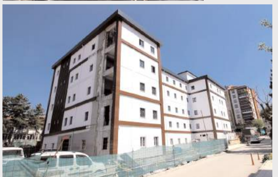
Projeyle vatandaşların koruyucu, tedavi edici ve rehabilite edici sağlık hizmetlerine tek merkezden, konforlu ve erişilebilir koşullarda ulaşabilmesi amaçlanıyor.