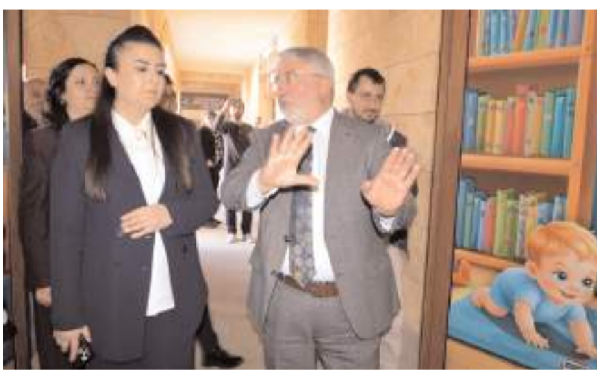
Başkan Aşgın, merkez hakkında davetlilere bilgi verdi.