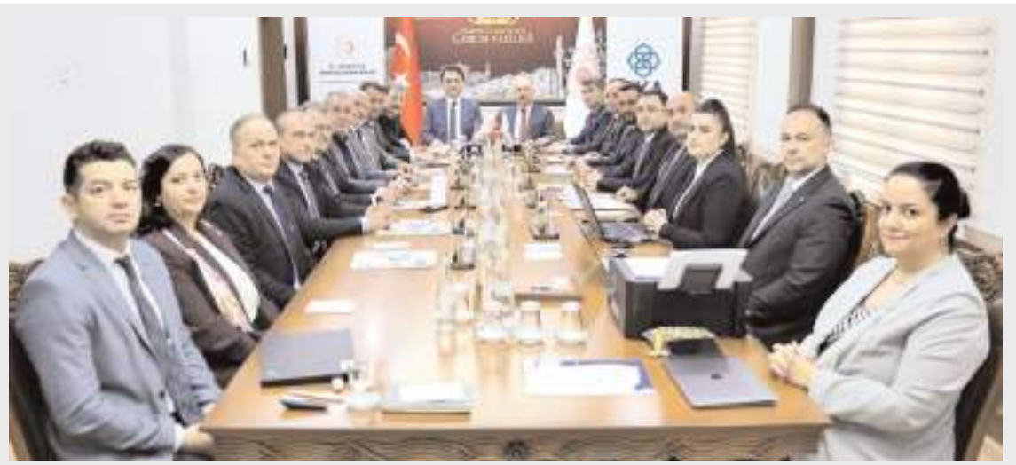
Toplantı OKA Yönetim Kurulu Başkanı Tokat Valisi Abdullah Köklü'nün başkanlığında yapıldı.