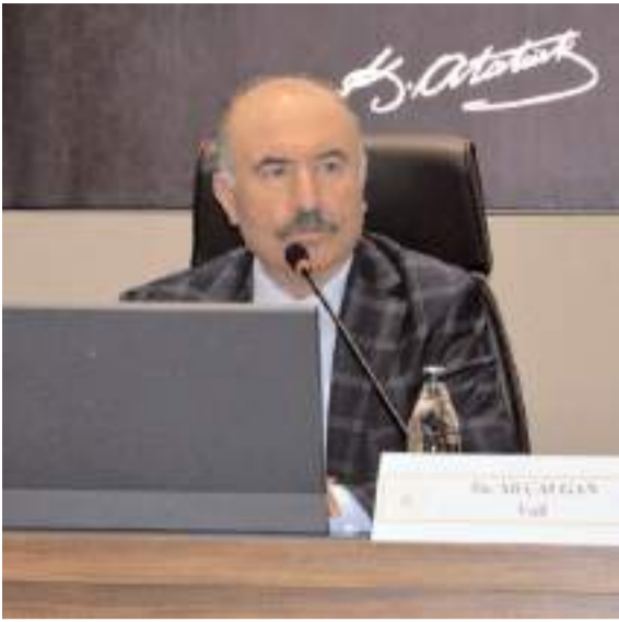
Toplantı Vali Ali Çalgan'ın başkanlığında yapıldı.