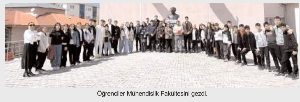
Öğrenciler Mühendislik Fakültesini gezdi.