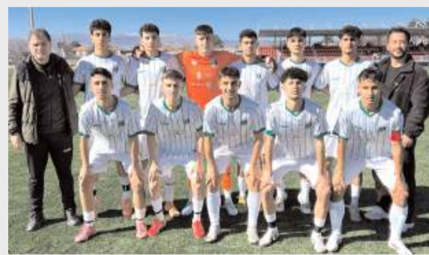
Mimar Sinanspor U 18 takımının Kastamonu grubundaki rakipleri belli oldu