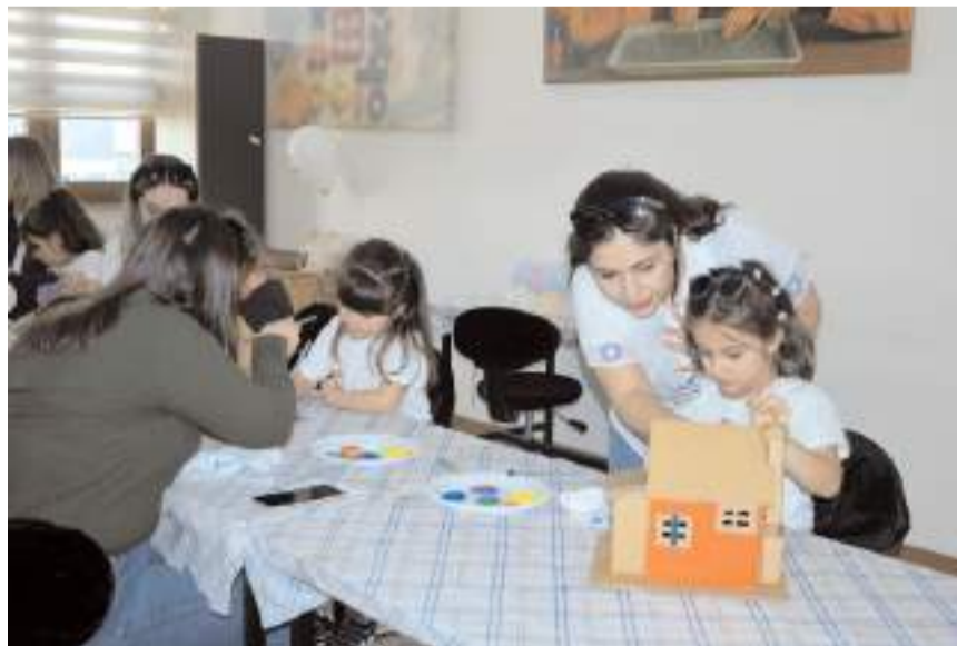
Aile Yaşam Merkezinde 8 farklı atölye yer alıyor.