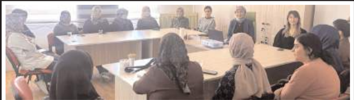
Etkinlikte, kadınlara bilinçli ilaç tüketimiyle ilgili bilgiler verildi.

TL'nin üzerinde yatırım yapıldığını ifade etti. Bölgede aktif olarak çalışan tek atık su arıtma tesisi olma özelliğini taşıyan tesisin devreye alınmasıyla birlikte ilçede çevre kirliliğinin azaltılması ve su kaynaklarının daha verimli kullanılması adına önemli bir adım atıldığını vurguladı. (İHA)