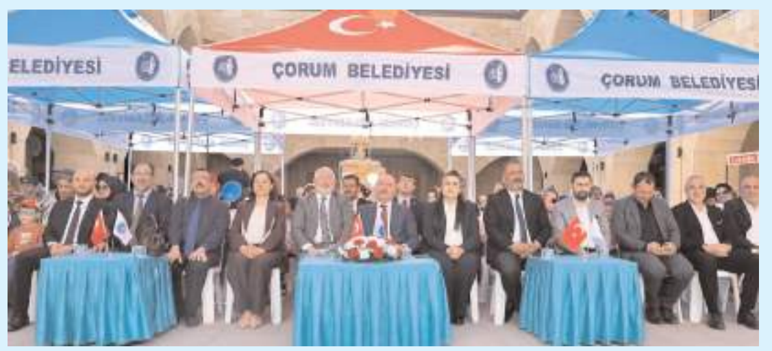
Aile Yaşam Merkezi, Bedesten'de hayata geçirildi.

Valilik programının ardından sırasıyla Çorum Belediyesi, AK Parti Çorum İl Başkanlığı ve MHP Çorum İl Başkanlığını ziyaret edecek olan Bakan Uraloğlu, daha sonra Çorum-Laçın Yolu ve Kırkdilim Tünellerinin açılış törenine katılacak.