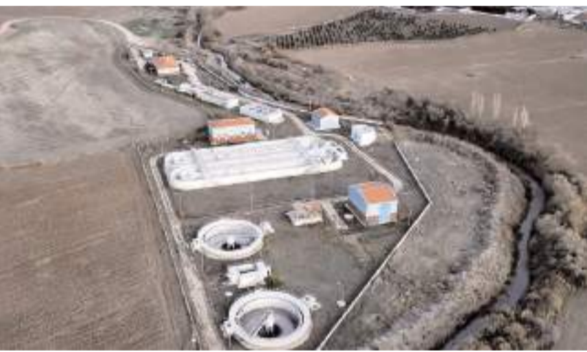
Uzun süredir atıl durumda bulunan Atık Su Arıtma Tesisi, yapılan kapsamlı çalışmaların ardından yeniden hizmet vermeye başladı.

Yenilenen tesiste incelemelerde bulunan Sungurlu Belediye Başkanı Muhsin Dere, yaptığı yazılı açıklamada, çevre sağlığı ve su kaynaklarının korunmasının her geçen gün daha kritik hale geldiği-