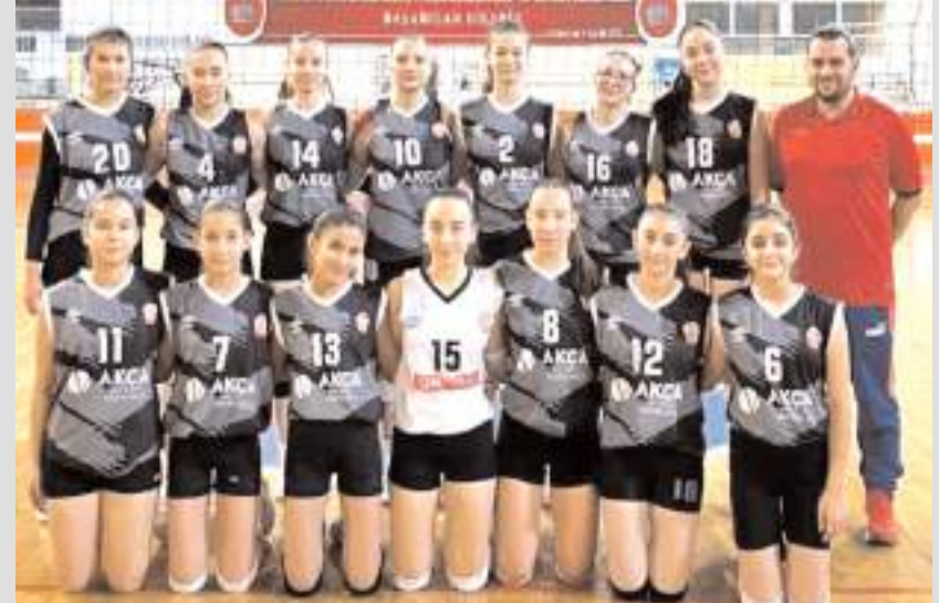
Osmaniye Belediyesi yıldız kız voleybol takımı Çorum'da yarın final vizesi arayacak