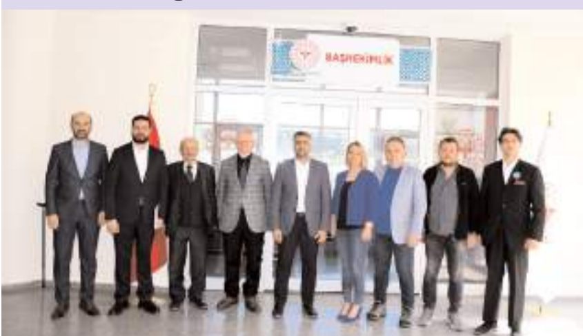
Ziyaretin anısına toplu fotoğraf çekildi.