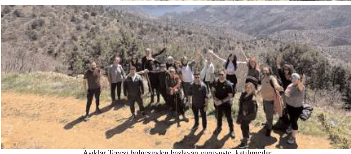
Aşıklar Tepesi bölgesinden başlayan yürüyüşte, katılımcılar, Kızıltepe güzergahını takip ederek Obruk köyünde parkuru tamamladı.