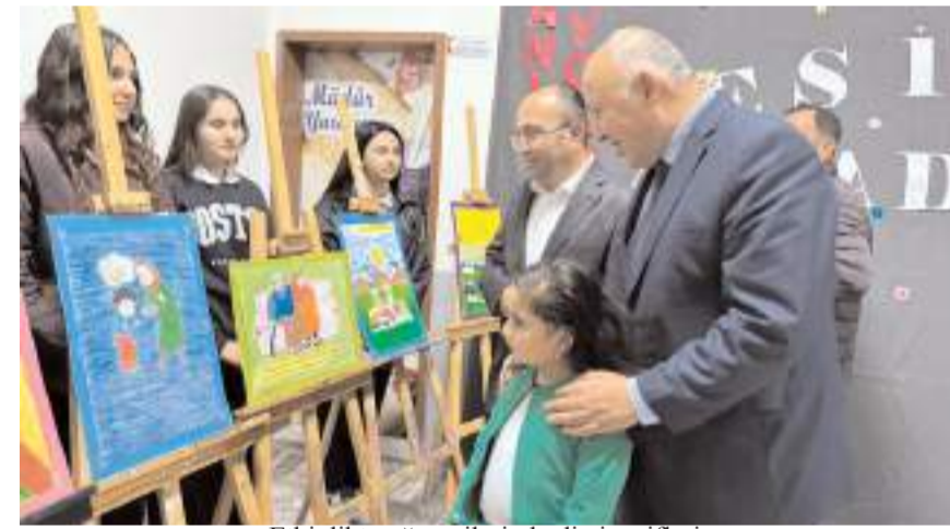
Etkinlikte öğrencilerin hadis-i şerifleri resimlerle anlatan çalışmalarını sergilendi.