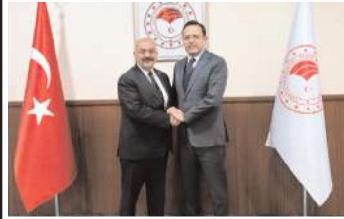
Başkan İsbir, Bakan Yardımcısı Ebubekir Gizligider'e ilçesinin sorun ve taleplerini dile getirdi.

Ortaköy Belediye Başkanı Taner İsbir, Tarım ve Orman Bakanlığı Bakan Yardımcısı Ebubekir Gizligider'i makamında ziyaret etti.