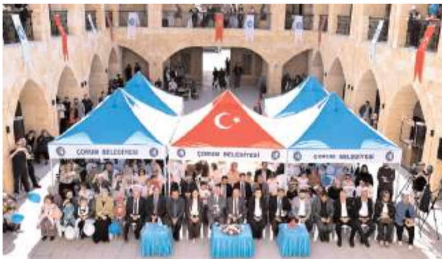
Aile Yaşam Merkezi, Bedesten'de hayata geçirildi.