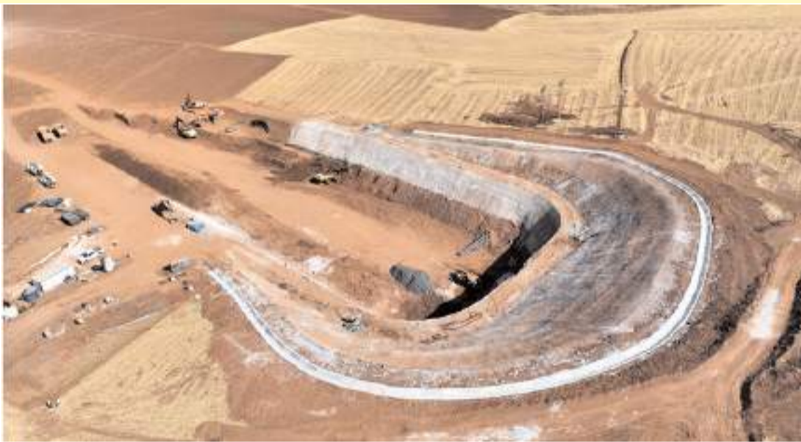
Projede kazı çalışmalarının yüzde 87'si tamamlandı.

İl Koordinasyon Kurulu toplantısında Delice-Çorum hızlı tren projesinde gelinen son durum ile ilgili bilgi veren Kocaman, projede yüzde 25 ilerleme kaydedildiğini söyledi. * HABERİ2'DE