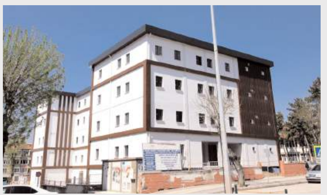
Yavruturna Sağlıklı Hayat Merkezinde çalışmalar devam ediyor.