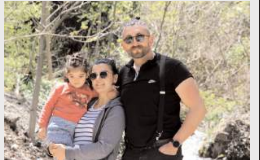
Vatandaşlar şelaleyi çok beğendiklerini ifade ediyorlar.