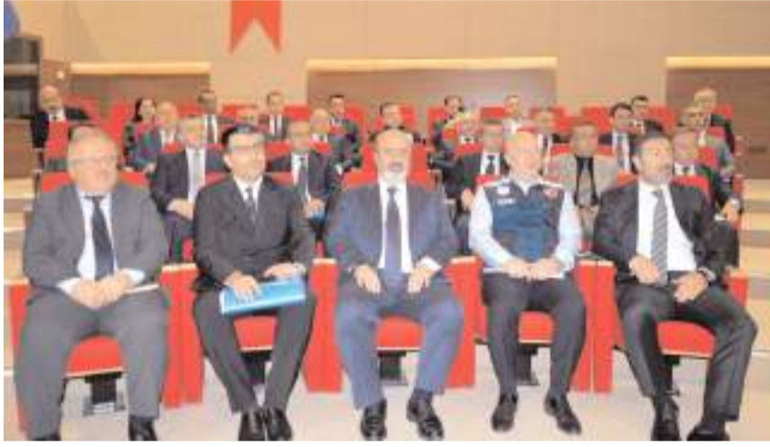
Toplantıya mülki idari amirler, belediye başkanları, resmi kurum ve kuruluşlarının temsilcileri katıldı.

Toplantıda diğer kamu kuruluşlarının yöneticileri, Çorum'da yürütülen çalışmalarla ilgili sunum yaptı.