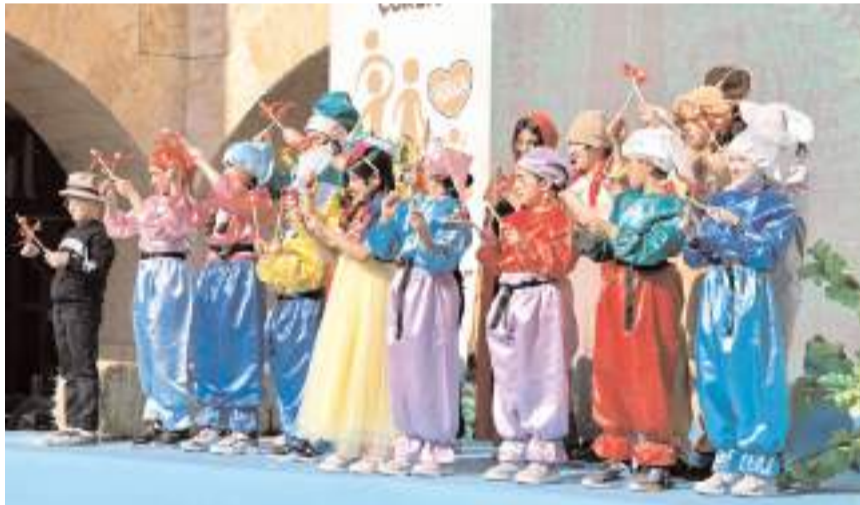
Programda minikler gösteri yaptı.