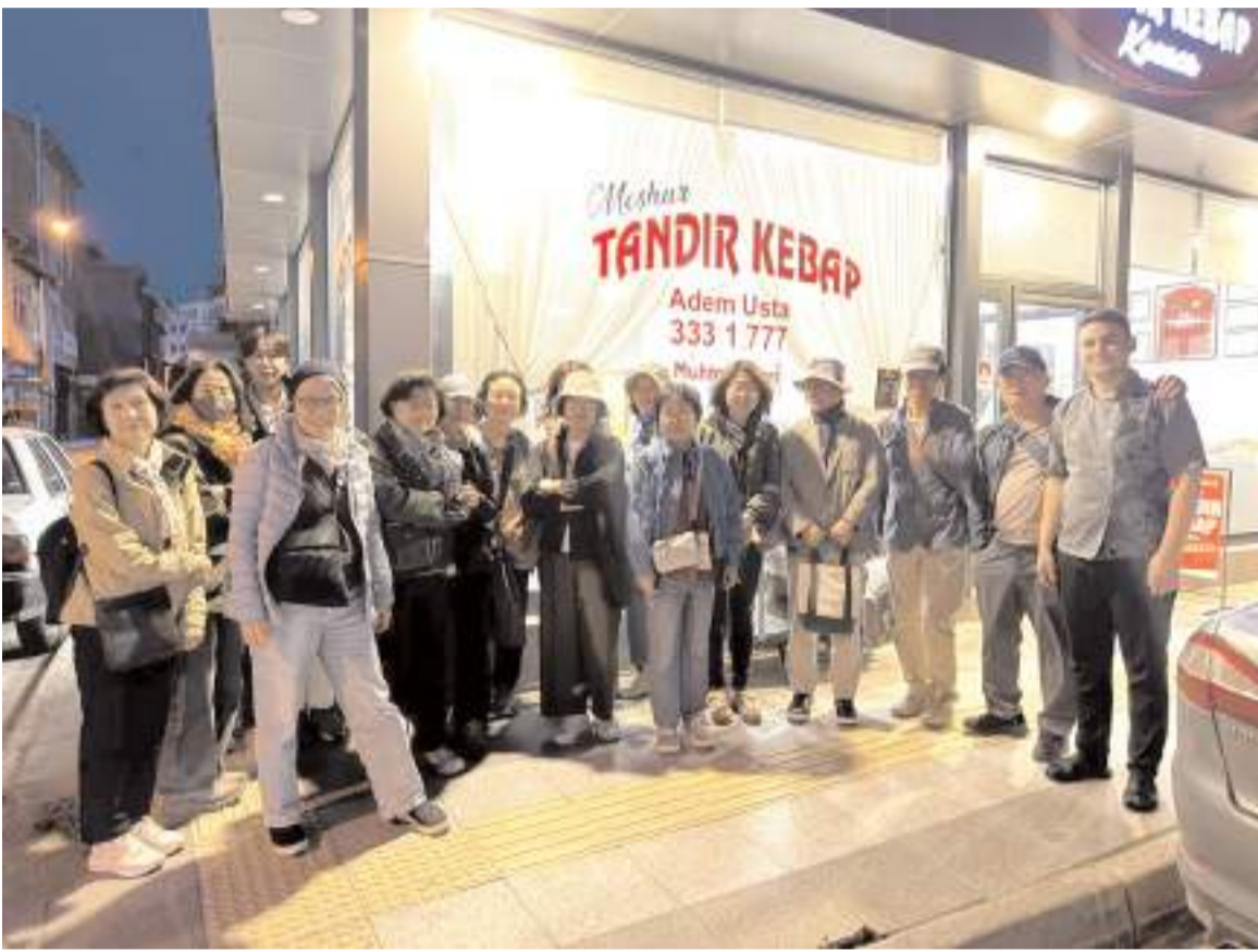
Karaca Tandır'a uğrayan turistler, Çorum'un meşhur tandır kebabını tattı.

Her iki ismin ataması Yüksek Öğretim Kurulu (YÖK) tarafından onandı. (Haber Merkezi)