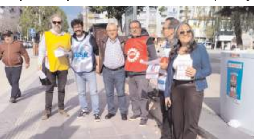
1 Mayıs Tertip Komitesi, broşür dağıttı.