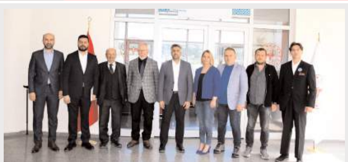
Ziyaretin anısına toplu fotoğraf çekildi.