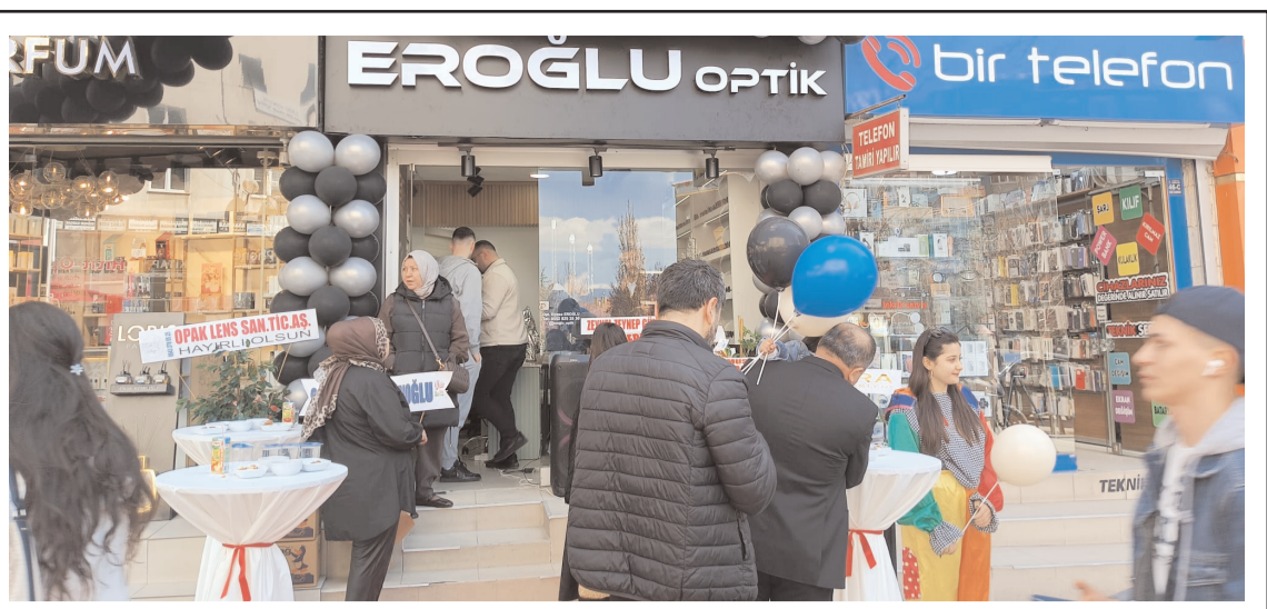
İşletme Gazi Caddesi Yeni Yol Mahallesi eski Kültür Sitesi karşısında bulunuyor.