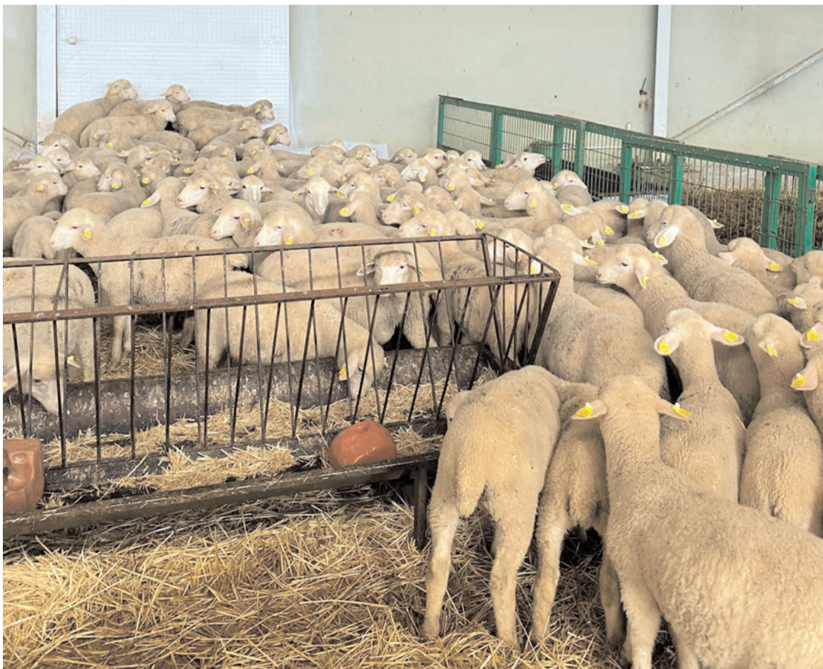
Küpelenme işlemleriyle hayvanlar kayıt altına alınıyor.