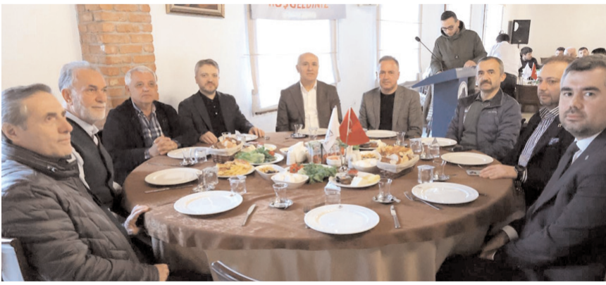
Program Mamak Belediye Başkanı Veli Gündüz Şahin'in ev sahipliğinde yapıldı.

ÇEKVA Ankara Şubesi Başkanı Bahattin Işık, yaptığı konuşmada programa ev sahipliği yapan Mamak Belediye Başkanı Veli Gündüz Şahin ve tüm davetlilere teşekkür etti. (Haber Merkezi)