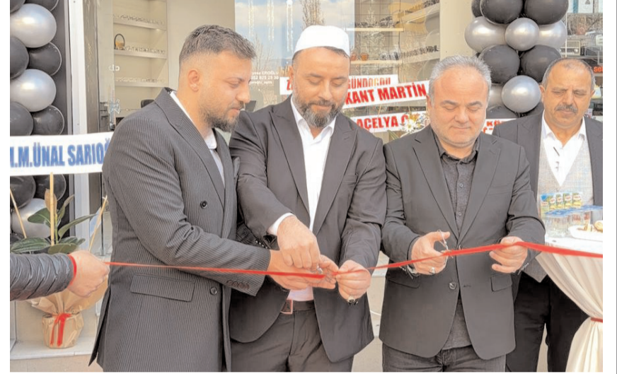
Açılış kurdelesinin kesilmesinin ardından davetliler işletmeyi gezdi.

Erkek ve kadınlara özel şık tasarımlar, orijinal markalar ve sürpriz kampanyalar Çorum halkını bekliyor.