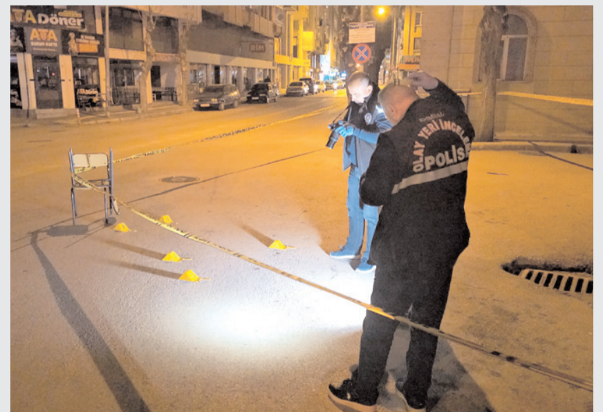
Olay Yazıçarşı Kavşağında medyana geldi.

Görüntüde I.Ö'nün hafif ticari aracın sürücü kapısının bulunduğu bölümüne yaklaştığı, bir süre sonra sekerek aracın diğer tarafına ve arka bölümüne ilerlediği görülüyor. I.Ö'nün araç hareket ettiği sırada arka plakasını sökmesi de görüntüde yer aldı.(AA)