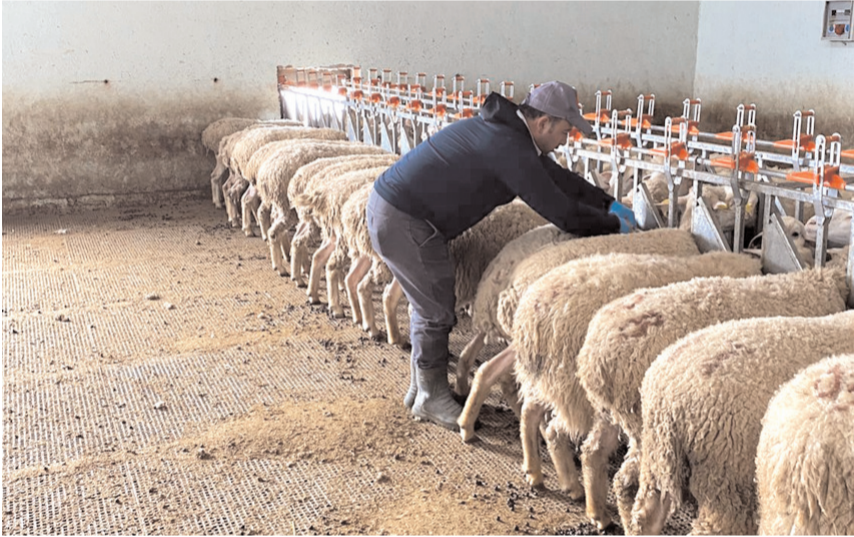
Alaca'da küçükbaş hayvanlara yönelik aşılama ve küpelenme çalışmaları devam ediyor.

Veteriner hekimlerin sahadaki özveri çalışmalarıyla yetiştiricilerin de destek verdiği vurgulanırken, İlçe Tarım ve Orman Müdürlüğü'nün üreticilerin yanında olmaya ve hayvancılığı geliştirmeye yönelik çalışmalarını sürdüreceği bildirildi.