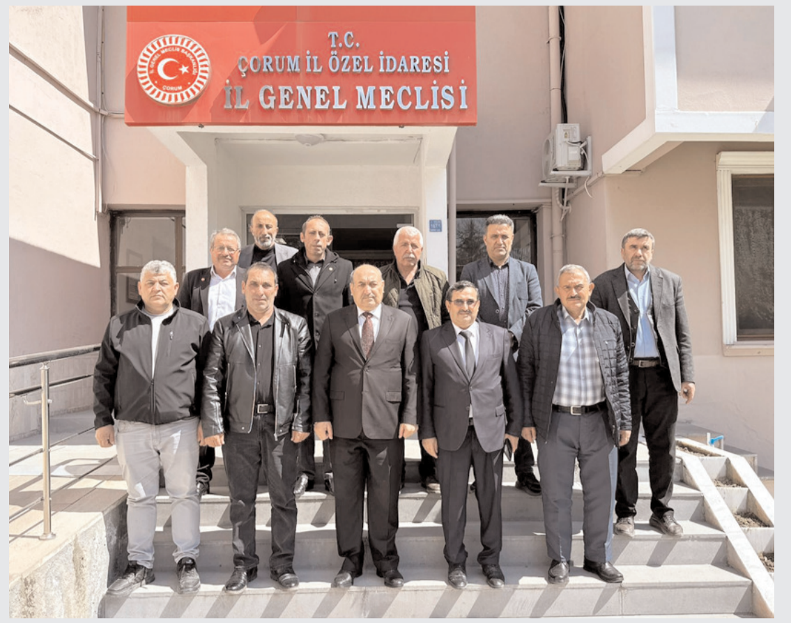
Ziyaretin sonunda toplu hatıra fotoğrafı çekildi.