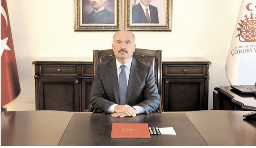
Çorum Valisi Ali Çalgan

"Bugün de teknolojik gelişmeleri yakından takip ederek çalışmalarına uygun şekilde kendini sürekli yenileyip geliştirmekte, ilkel, tarafsız ve sorumlu habercilik anlayışıyla Türk ve dünya basını için güvenilir bir kaynak olmayı sürdürmektedir. Bu vesileyle Anadolu Ajansının kuruluşunda emeği geçenleri rahmet ve minnetle yad ediyor, tüm yönetici ve çalışanlarını tebrik ediyor, başarılarının artarak devam etmesini temenni ediyorum."(AA)