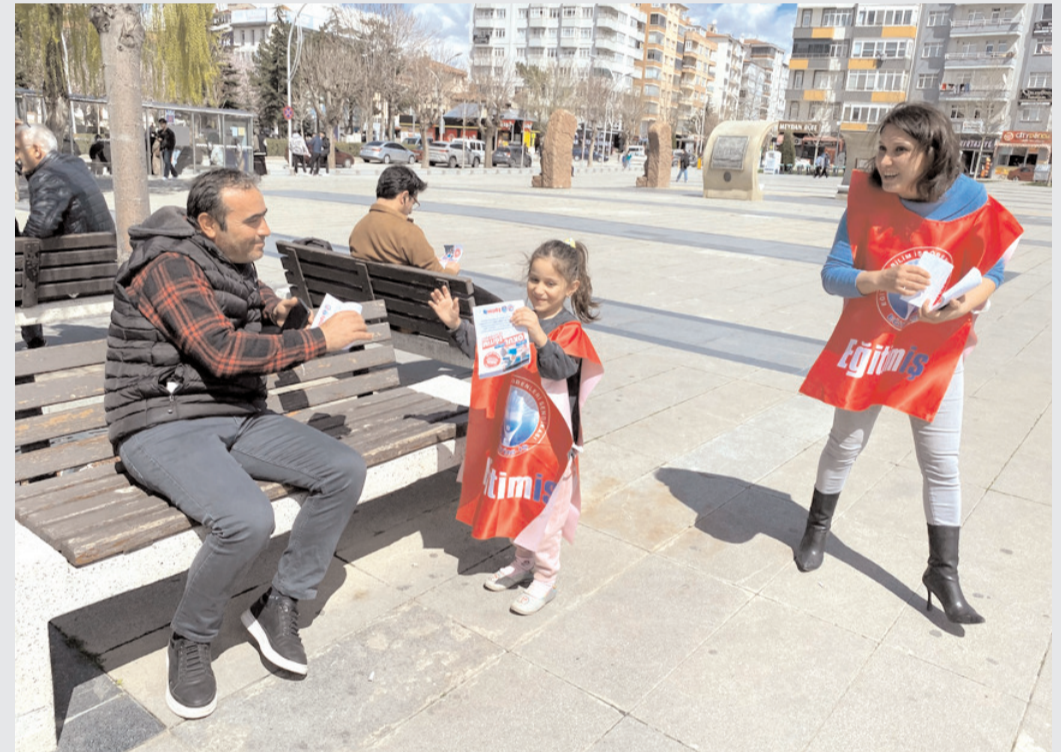
Eğitim- İş Çorum Şubesi broşür dağıttı.

Eğitim-İş Yönetim Kurulu, güvensiz okul ortamlarına, yetersiz koşullara ve ihmallere sessiz kalmayacaklarını belirterek, "Güvenli okul, sağlıklı eğitim herkesin hakkıdır. Güvenli ve sağlıklı bir eğitim ortamı, tüm öğrencilerin ve eğitim emekçilerinin en temel hakkıdır. Bu doğrultuda taleplerimizin yetkililer tarafından karşılık bulmasını bekliyoruz" dedi. (Haber Merkezi)