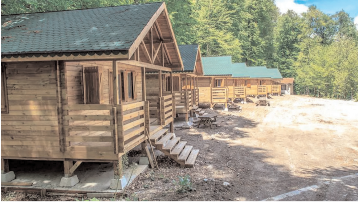
Bungalov ve bağ evi için artık kurul izni gerekecek.

Tarım arazilerinde izin verilecek yapılar yeniden düzenlendi.