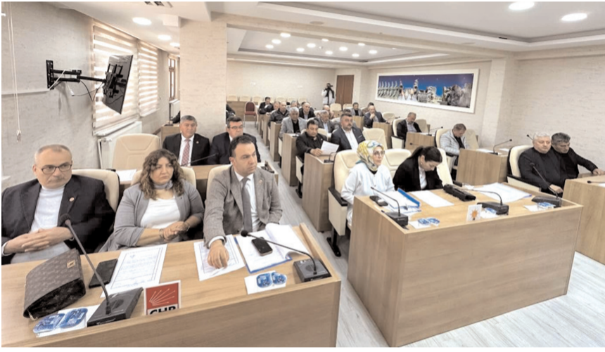
Meclis toplantısında gündem maddeleri görüşülerek karara bağlandı.