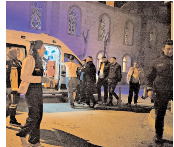
Yaralıya ilk müdahaleyi 112 acil sağlık ekipleri olay yerinde yaptı.