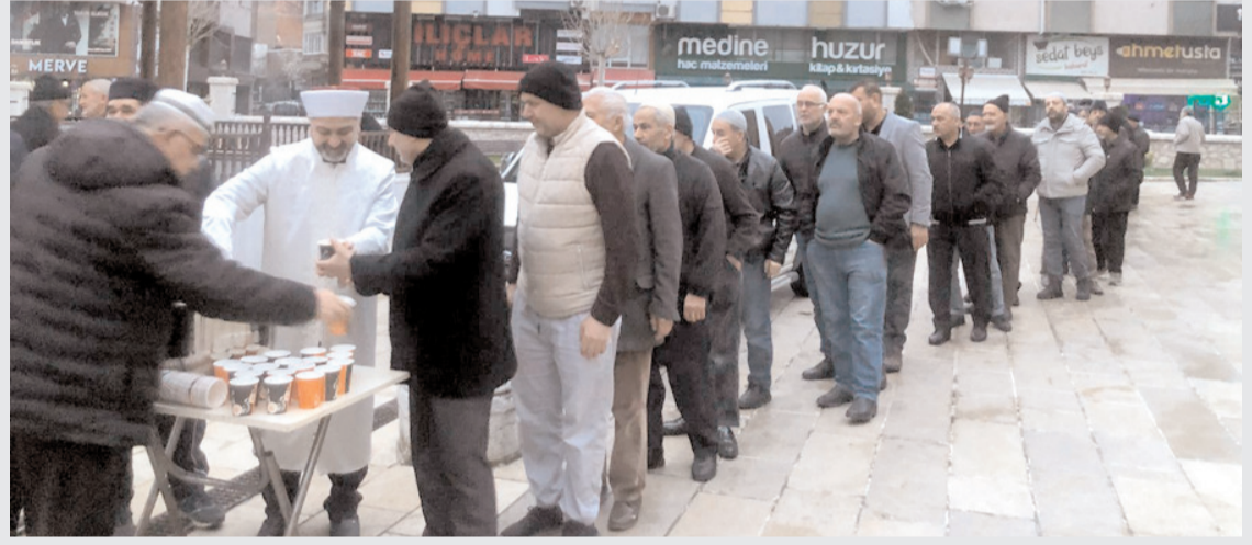
Namazın ardından cemaate çorba hediye edildi.