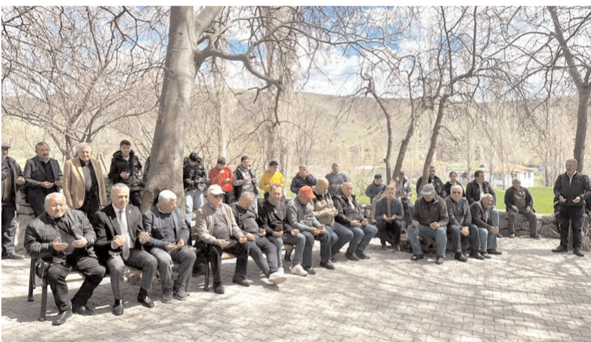
Yağmur duası ve şükür kurban etkinliğine katılım yüksek oldu.