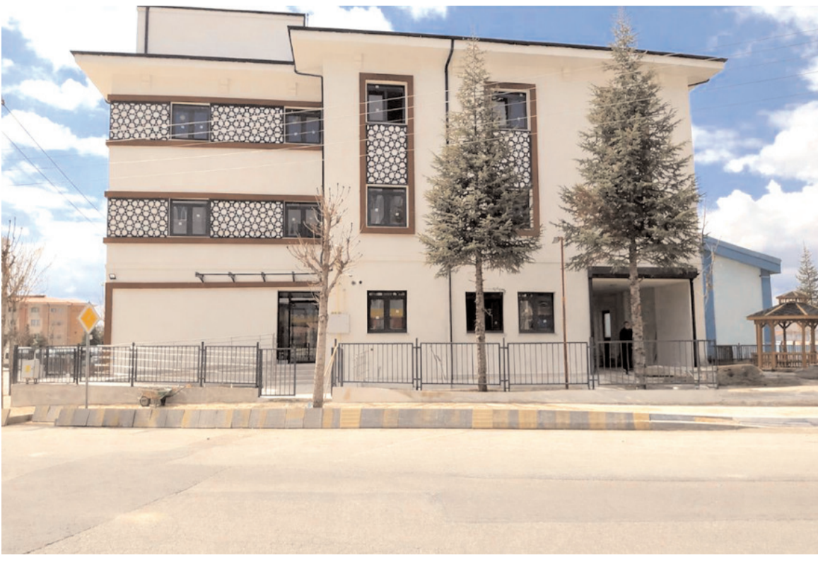
Söğütöevler Aile Sağlığı Merkezi ve 112 Acil Sağlık Hizmetleri İstasyonu