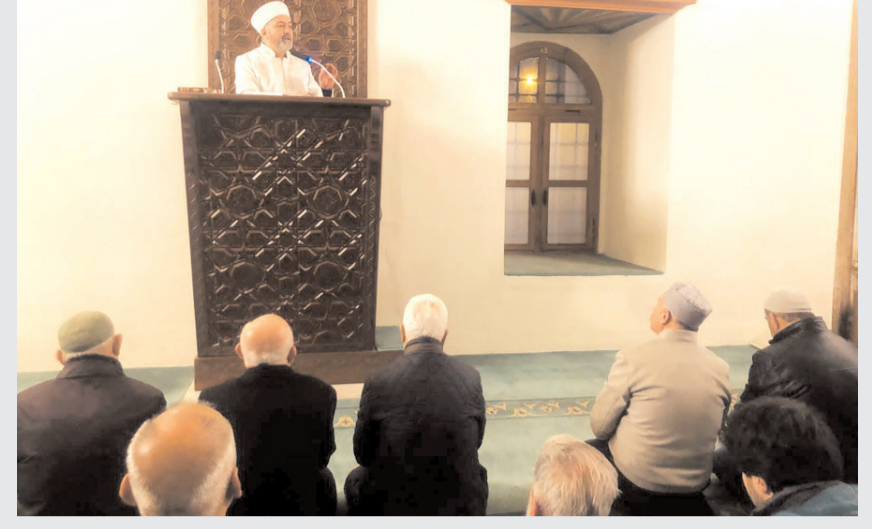
Bu hafta dersi Çorum İl Müftüsü Şahin Yıldırım gerçekleştirdi.