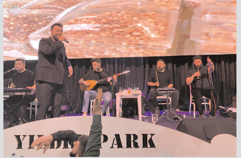
Gecede sanatçılar sahne aldı.