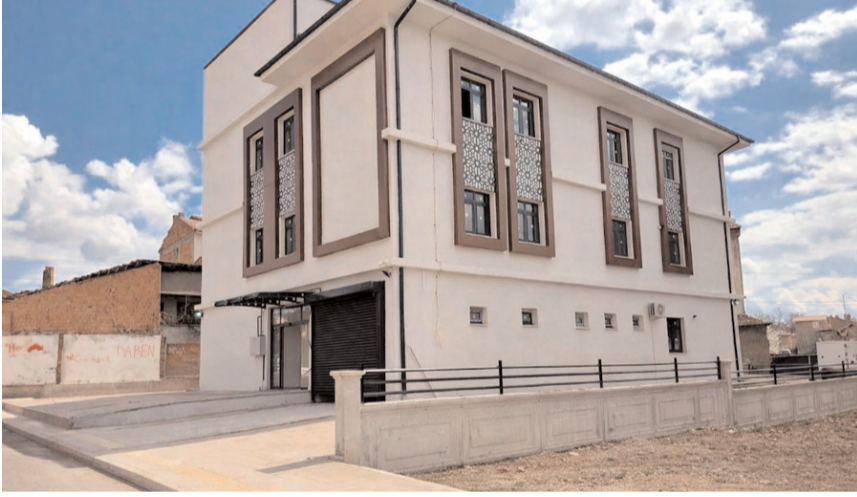
Kunduzhan Aile Sağlığı Merkezi ve 112 Acil Sağlık Hizmetleri İstasyonu