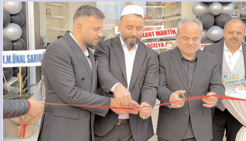
Açılış kurdelesinin kesilmesinin ardından davetliler işletmeyi gezdi.