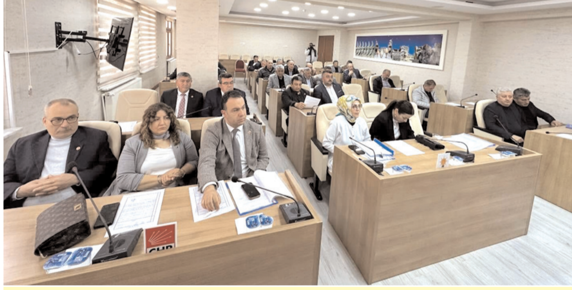
Meclis toplantısında gündem maddeleri görüşülerek karara bağlandı.