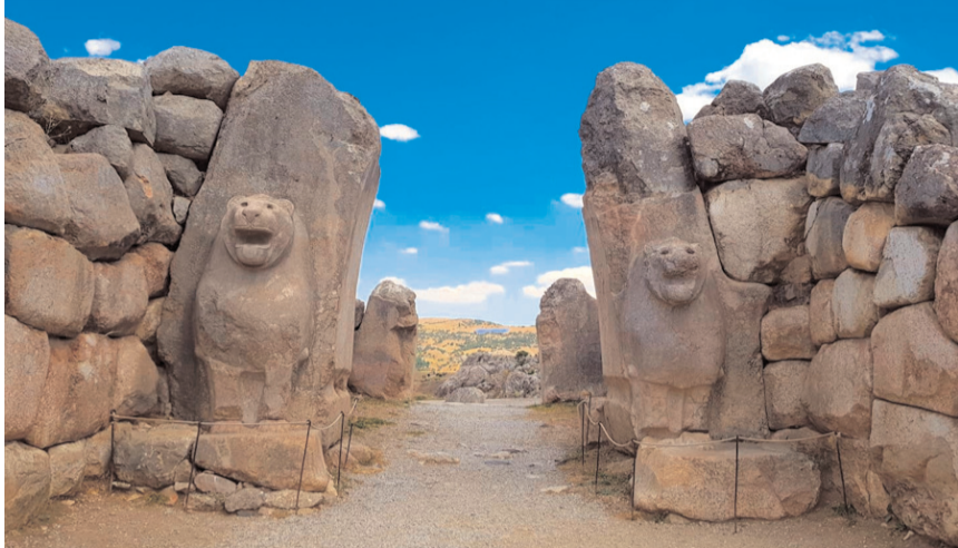
Dünya Hitit Günü 40. Yıl kutlama etkinlikleri Çorum'da gerçekleştirilecek.