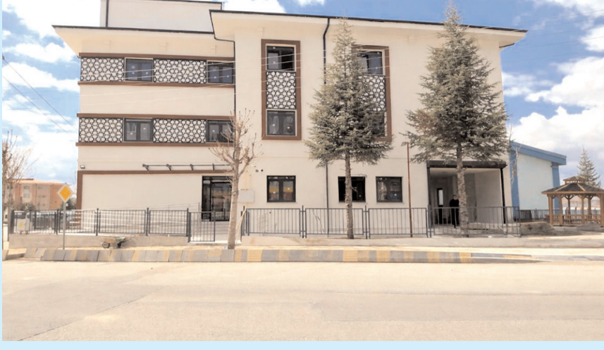
Söğütöveler Aile Sağlığı Merkezi ve 112 Acil Sağlık Hizmetleri İstasyonu