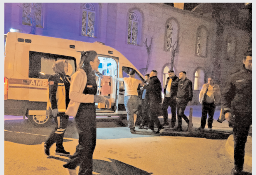
Yaralıya ilk müdahaleyi 112 acil sağlık ekipleri olay yerinde yaptı.