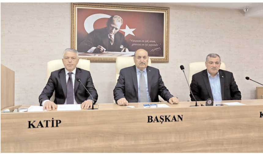
Toplantı Meclis Başkanı Duran Bıyık'ın başkanlığında yapıldı.