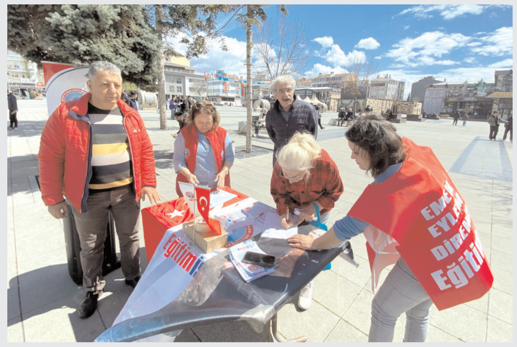
Eğitim-İş Çorum Şubesi Kadeş Barış Meydanı'nda stant açtı.