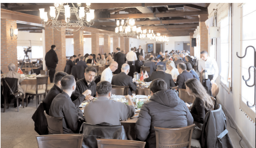
Programa çok sayıda davetli katıldı.