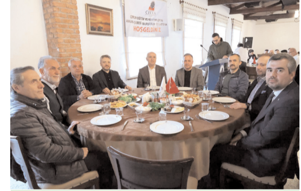
Program Mamak Belediye Başkanı Veli Gündüz Şahin'in ev sahipliğinde yapıldı.