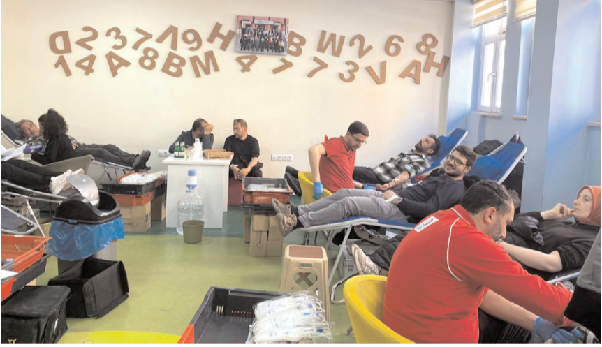
Kan bağışı kampanyası okul içinde yapıldı.

Etkinlikte, bağışlanan her bir ünite kanın 3 kişinin hayatına dokunabileceği vurgulanarak, kan bağışının toplumsal önemi bir kez daha hatırlatıldı. Okul idaresi ve Kan Merkezi yetkilileri, kampanyaya destek veren tüm bağışçılara teşekkür ederek, bu tür sosyal sorumluluk projelerinin yaygınlaşmasının toplum bilinci açısından büyük önem taşıdığını ifade etti. (Haber Merkezi)