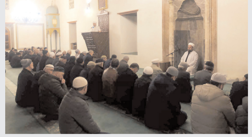
Program Ulu Camide sabah namazından önce yapıldı.