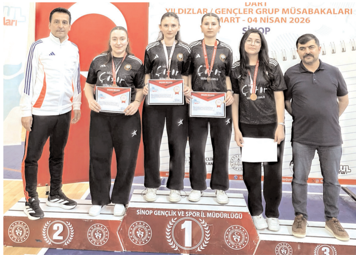
Sinop'da bölge birincisi olan İskilip Akşemseddin Anadolu Lisesi Dart takımı ödül töreni sonrasında kürsüde