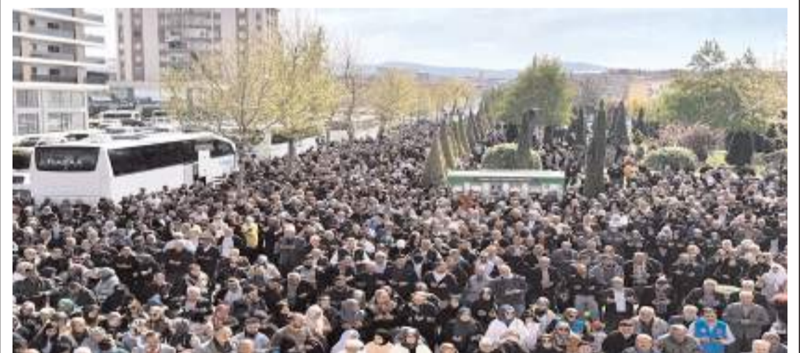
Uğurlama programına katılım yüksek oldu.