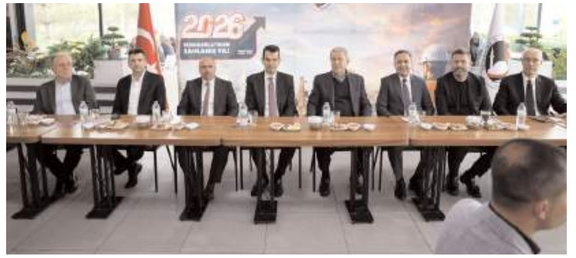
Hulusi Akar ve beraberindeki heyet Sungurlu’da vatandaşlarla buluştu.