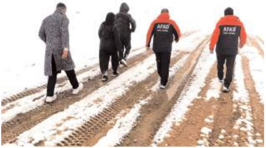
AFAD ekipleri bölgede mahsur kalan 3 kişiyi kurtardı.