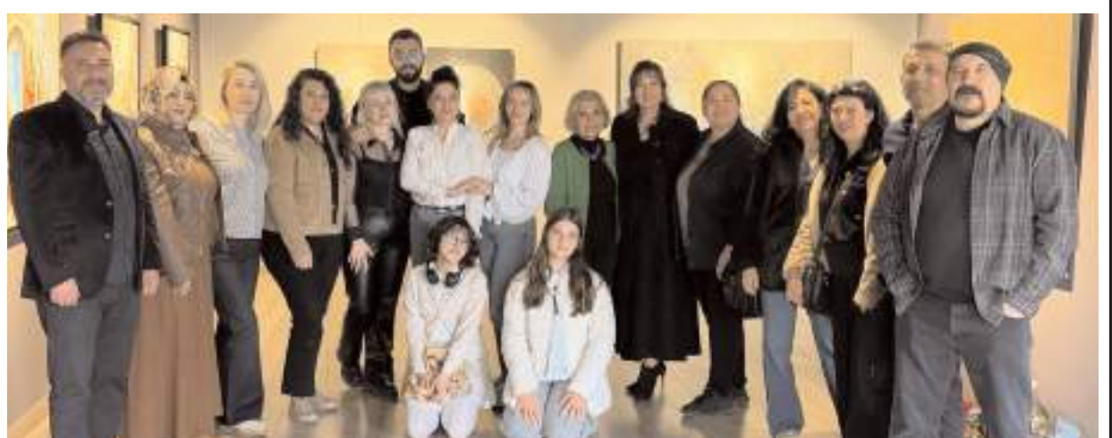
Çorum Eğitim ve Sanat Derneği (ÇÖSED) üyeleride açılışa katıldı.

Çorum'un kültür ve sanat yaşamına 50 yıldır yön veren, yetiştirdiği öğrenciler ve ürettiği eserlerle tanınan eğitimci-ressam Nilgün Ayşecik Çevik, sanat yolculuğunun 50. yılını Başkent'te taçlandırdı. Sanatçının büyük bir heyecanla beklenen 26. kişisel sergisi, Ankara Sevgi Sanat Galerisi'nde düzenlenen görkemli bir açılışla sanatseverlerle buluştu.