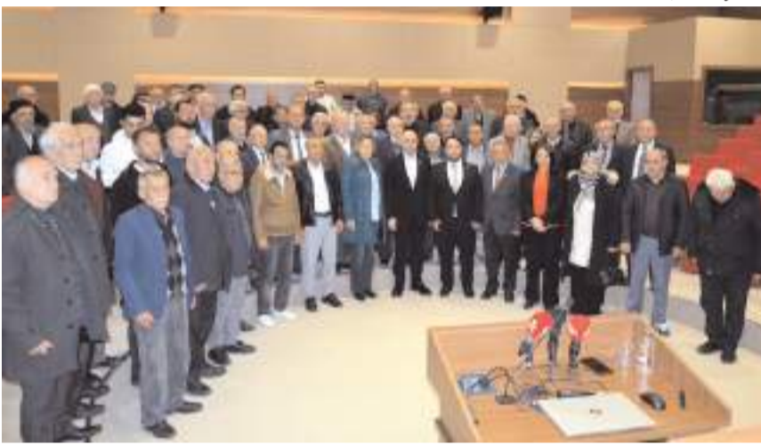
Programın ardından hatıra fotoğrafı çekildi.