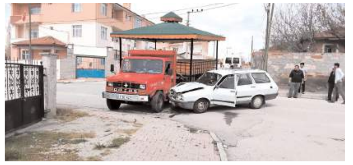
Kaza Alaca Cumhuriyet Caddesi'nde meydana geldi.

Okumuş, "Görevini yaparken, hakikati savunurken hayatını kaybeden tüm gazetecileri rahmet ve minnetle anıyoruz. Şunu herkes bilmelidir ki; kalemler kırılrsa da, sesler kısılmaya çalışılsa da gerçekler asla susturulamaz" diyerek sözlerini tamamladı. (Haber Merkezi)