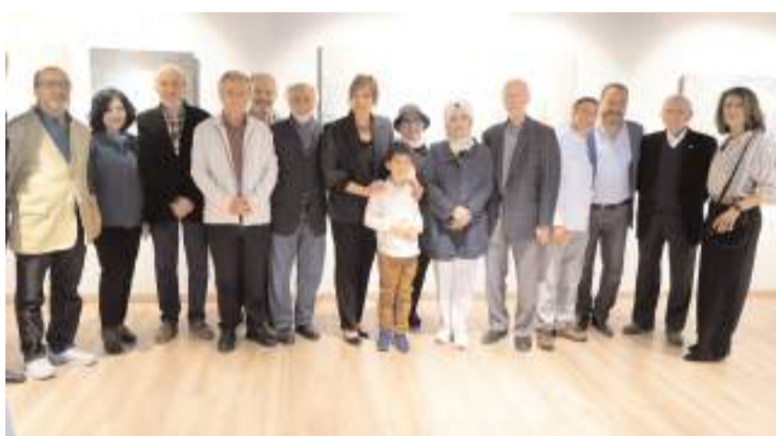
Serginin açılışına çok sayıda davetli katıldı.