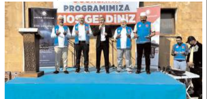
Yapılan duanın ardından Hacı adayları kutsal topraklara yolcu edildi.

duanın ardından Hacı adayları aileleriyle vedalaşarak kutsal topraklara doğru yola çıktılar. (Haber Merkezi)