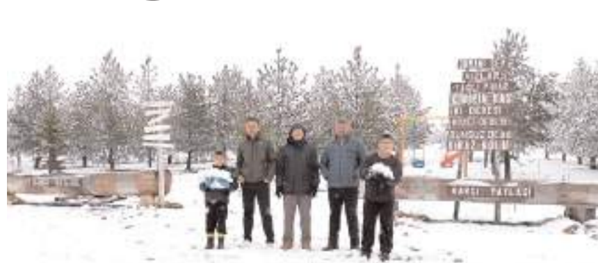
Mayıs ayında yağan kar şaşkınlığa neden oldu.

Çorum'da önceki gün akşam saatleri itibarıyla etkili olan kar yağışı yüksek rakımlı bölgeleri beyaza büründü.