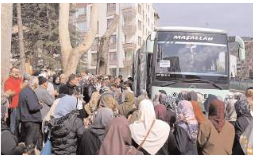
Hacı adaylarını yakınları yalnız bırakmadı.

Hacı adayları, yakınlarının dualar ve göz yaşlarını eşliğinde yola çıktı.