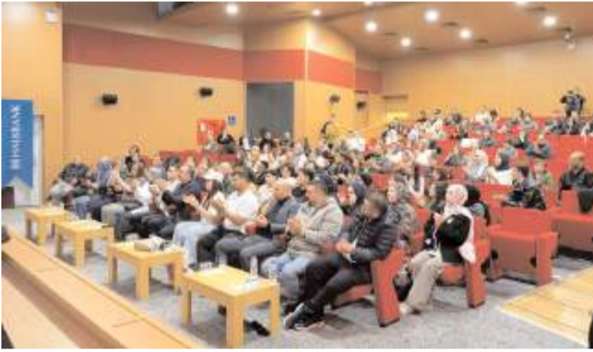
Oyun Ethem Erkoç Konferans Salonunda sahnelendi.

Yenilmez, tiyatro oyununa sponsorluğundan dolayı Halkbank ve yöneticilerine de teşekkür etti.