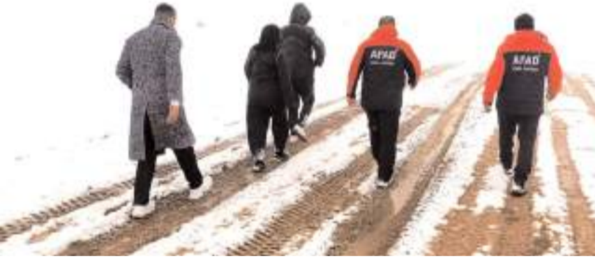
AFAD ekipleri bölgede mahsur kalan 3 kişiyi kurtardı.

■ Çorum'da Köseadağ mevkiinde mahsur kalan 3 vatandaş, ekiplerin yoğun çalışması sonucu kurtarıldı.