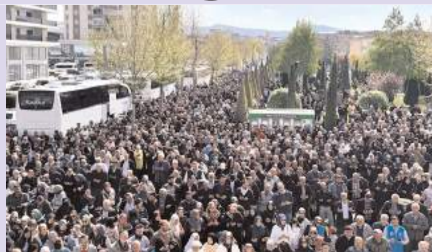
Uğurlama programına katılım yüksek oldu.