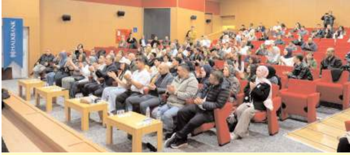
Oyun Ethem Erkoç Konferans Salonunda sahnelendi.