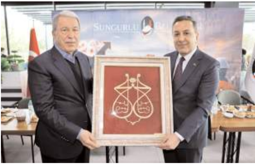
Sungurlu Belediye Başkanı Muhsin Dere, Hulusi Akar’a hediye takdim etti.