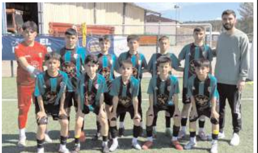
Mimar Sinanspor son maçını kazanarak grubunu lider olarak tamamladı

Bu grupta ise Mimar Sinanspor yedi galibiyet ve bir mağlubiyet alarak 21 puanla lider olarak sezonu tamamlarken Osmançık Kandiberspor 19 puanla ikinci sırada yer aldı.