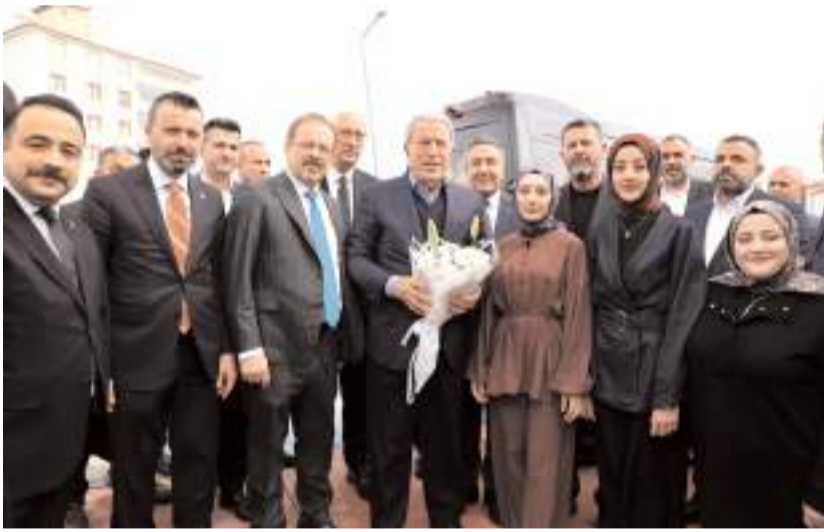
Hulusi Akar, Sungurlu’da çiçekle karşılandı.