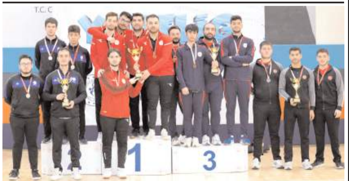
Zonguldak'ta yapılan Ünilig Masa Tenisi grubunda Çorum erkek takımı üçüncü olarak final bileti aldı

Dünü dinlenerek geçiren takımlar bugün saat 10'da Çorum ile Düzce ilk finalisti belirlemek için karşılaşacak. Bu maçın ardından ise saat 12'de Samsun ile Kastamonu takımları ikinci finalisti belirleyecek. Bu maçları kazanan iki takım yarın finalde Türkiye Finallerinde mücadele etmek için karşılaşacaklar.