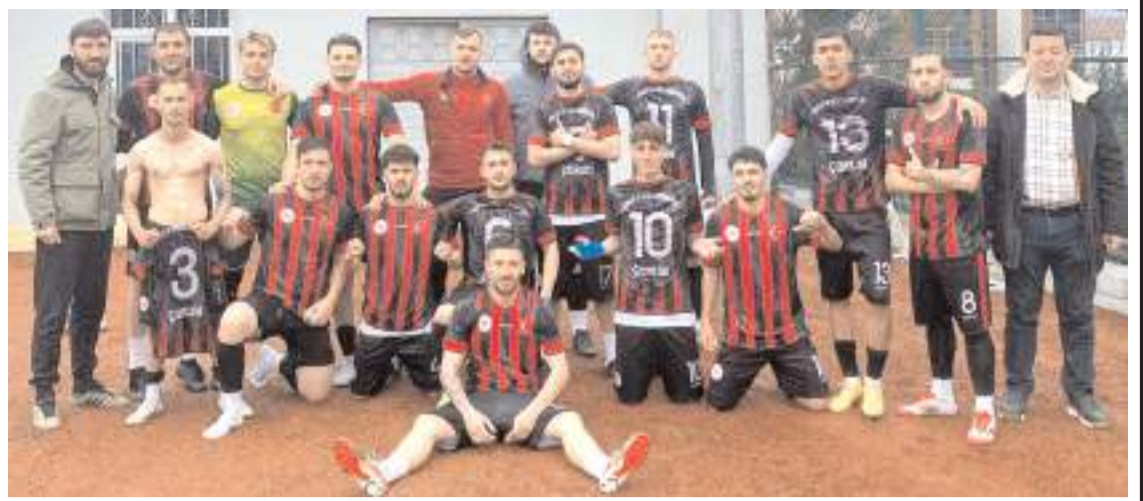
Çorum Yurt Lig futbol takımı gruptan birinci olarak çıkarak yarı finale yükseleyi başardı