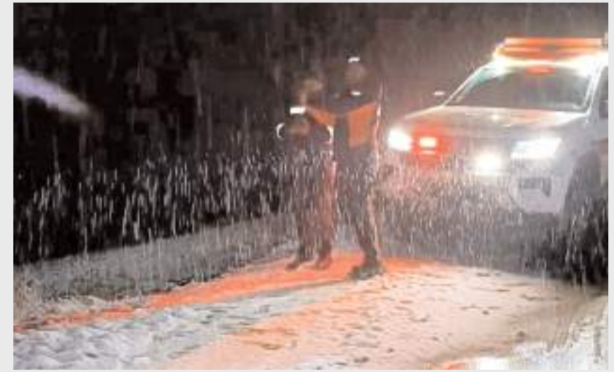
Olay Laçın'de meydana geldi.