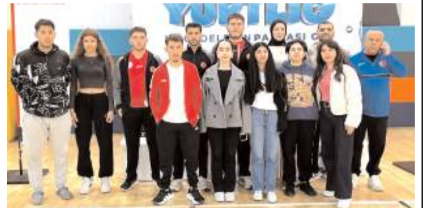
Zonguldak'ta mücadele eden Çorum Ünilig masa tenisi takımları toplu halde takım katıldı.

Zonguldak'ta düzenlenen Masa Tenisi Yurt Lig Karadeniz Bölgesi Grup Yarışmaları tamamlandı. Çorum erkek takımı üçüncü olarak Türkiye finallerine gitmeye hak kazandı. Kredi ve Yurtlar Genel Müdürlüğü'nün 2025-2026 sezonu faaliyet programı kapsamında Gençlik ve Spor İl Müdürlüğü Spor Kompleksinde düzenlenen organizasyona Samsun, Giresun, Düzce, Çorum, Bartın, Sinop, Karabük, Amasya ve Bolu'dan 36 erkek ve 40 kız sporcudan oluşan 16