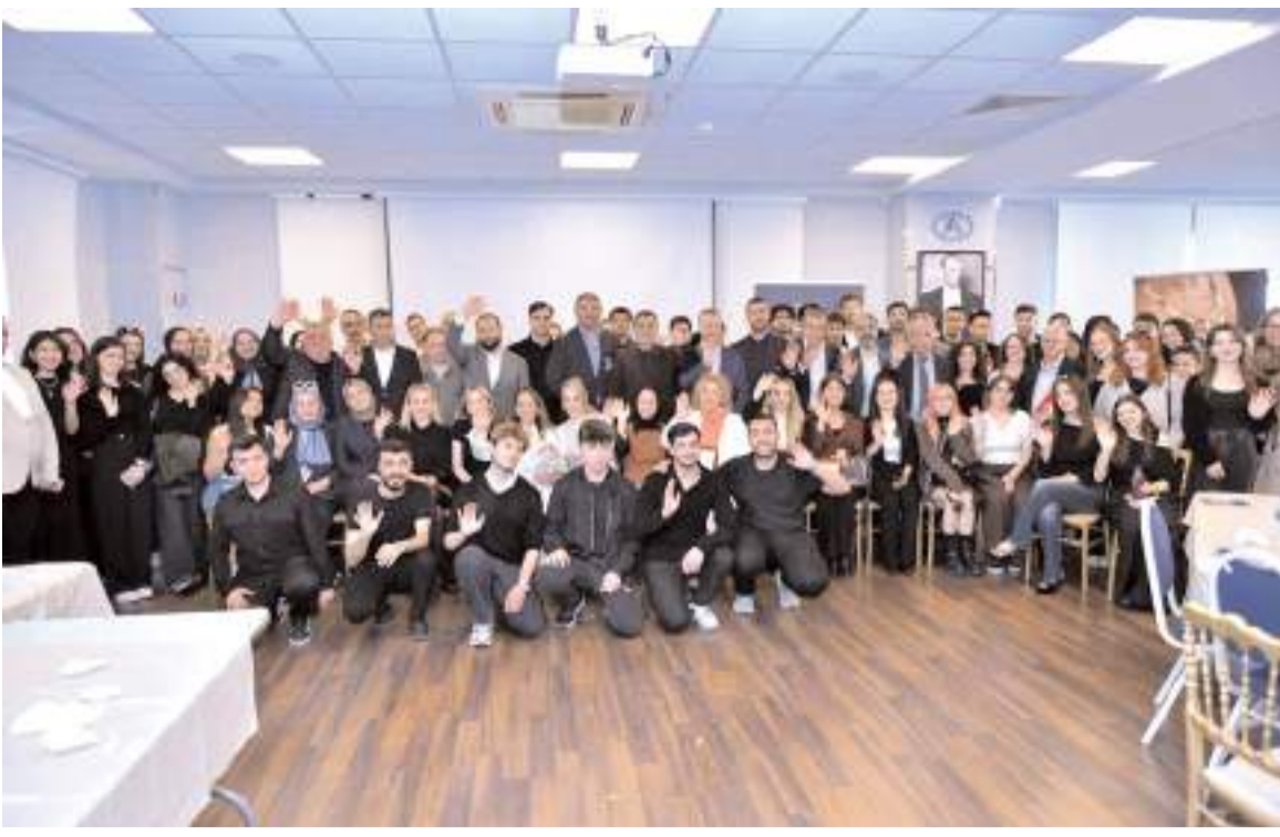
Programın anısına toplu hatıra fotoğrafı çekildi.