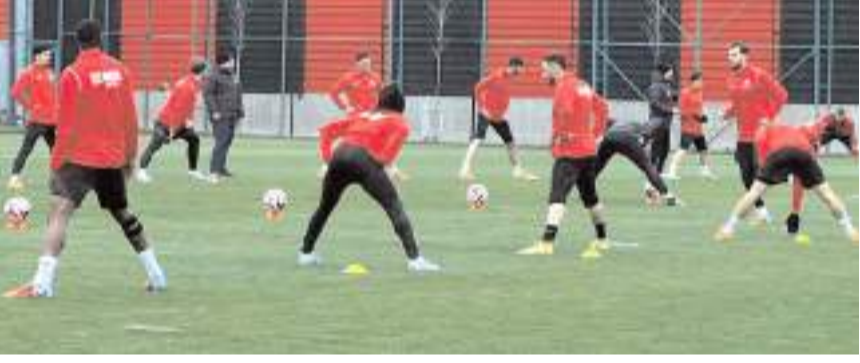
Kırmızı Siyahlı takım Keçiöregücü ile oynayacağı play-off hazırlıklarına başladı

bugün yapacağı antrenmanla Keçiöregücü hazırlıklarını sürdürecektir.