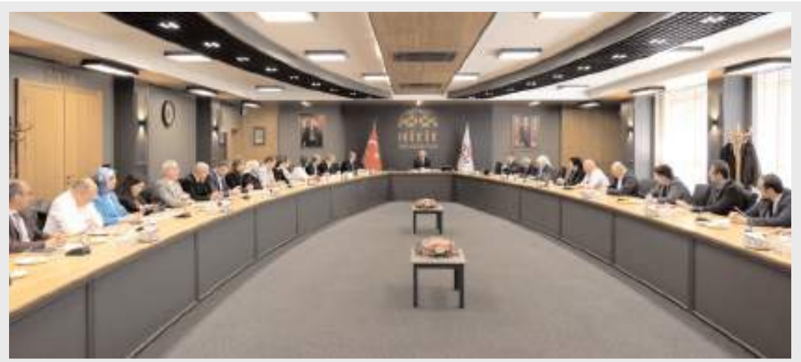
2025 yılında gerçekleştirilen toplam 1054 ünite kan bağışısıyla Çorum'da kurumsal gümüş madalyayı alan ilk kurum Hitit Üniversitesi oldu.