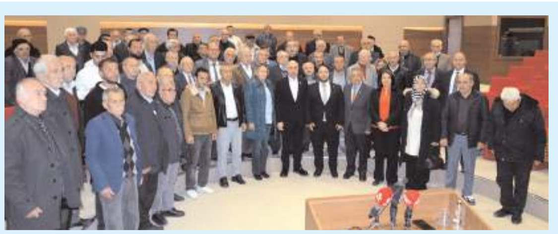
Programın ardından hatıra fotoğrafı çekildi.