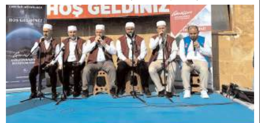
Okunan Kur'an-ı Kerim, tekbirler, salavatlar, telbiyeler ve ilahilerle duygu dolu anlar yaşadı.