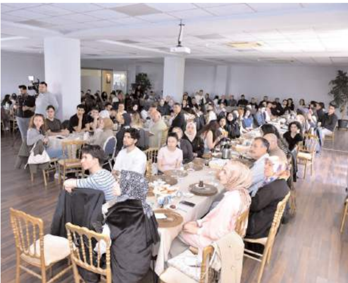
Kahvaltı programına bursiyer öğrenciler ile çok sayıda davetli katıldı.