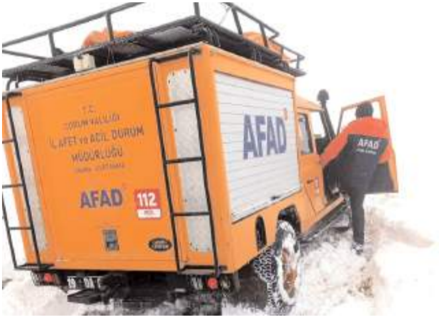
AFAD ekipleri olumsuz hava koşulları nedeniyle bölgeye ulaşmakta güçlük çekti.

Yapılan çalışmalar sonucunda mahsur kalan vatandaşlara ulaşılarak buldukları yerden güvenli şekilde kurtarıldı.