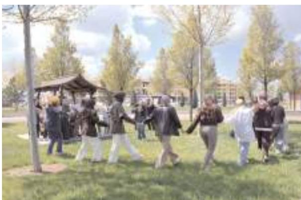
Kutlamaya katılanlar bol bol halay çektiler.

Sınır değerinin altında teklif sunan isteklilerin teklifleri açıklama istenilmeksizin reddedilecektir.