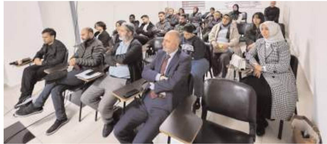
Söyleşi Çorum Kültür Merkezi'nde düzenlendi.