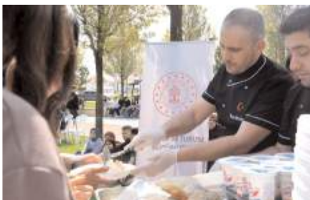
Vatandaşlara ikramda bulunuldu.