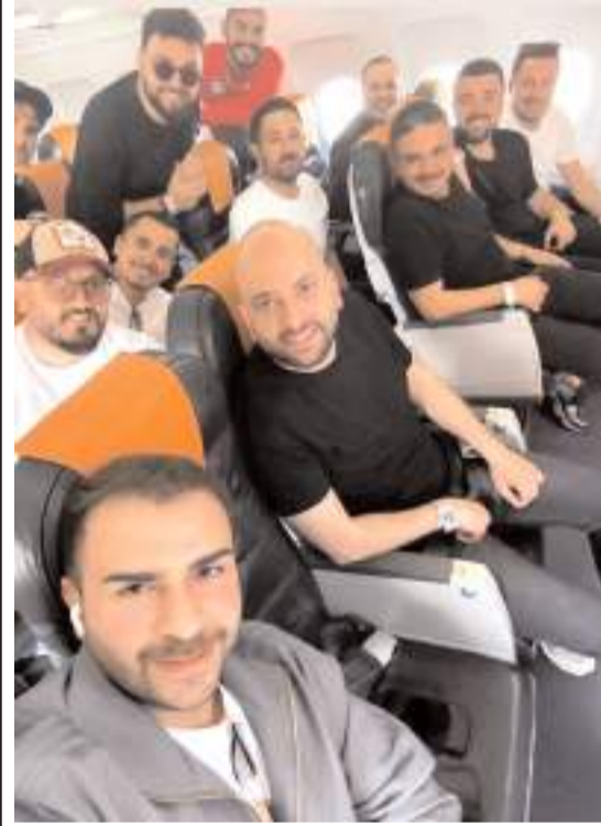
Yönetimde dün takımla birlikte Bodrum'a uçtu

Bu akşam saat 20'de başlayacak maçın ardından ise kırmızı siyahlı takım Bodrum havalanına geçerek burda kalkacak özel uçak ile Merzifon Havalanına inecek ve Çorum'a dönerek rövanş maçının hazırlıklarına başlayacak.