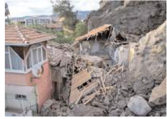
Olay Hıdırlık Mahallesi'nde meydana geldi.