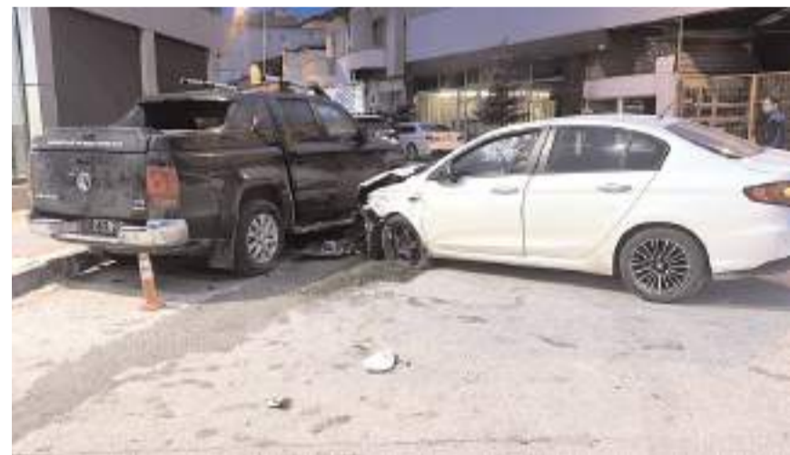
Kazada araçlarda maddi hasar meydana geldi.

Çorum'un Alaca ilçesinde otomobilin ara sokaktan çıkan araçla çarpıştıktan sonra park halindeki bir araca çarpıştığı kazada 1 kişi yaralandı.