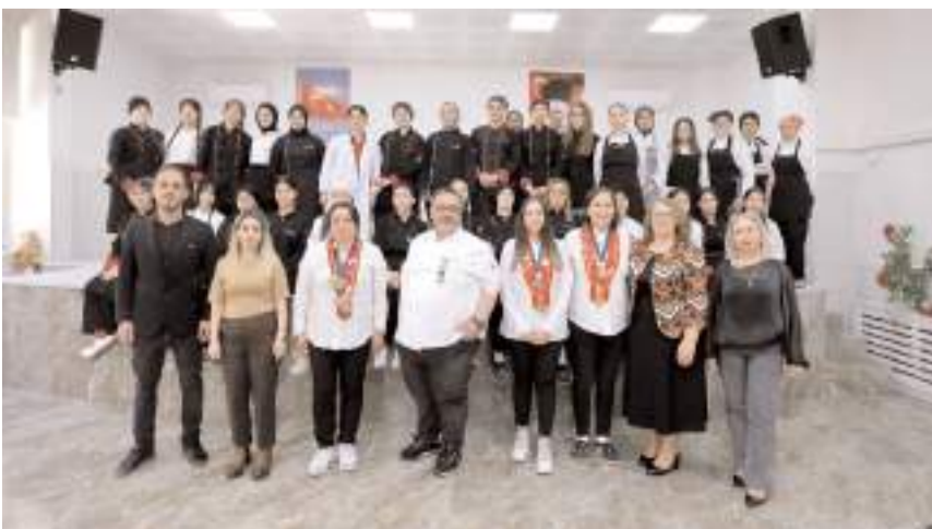
Programın sonunda hatıra fotoğrafı çekildi.