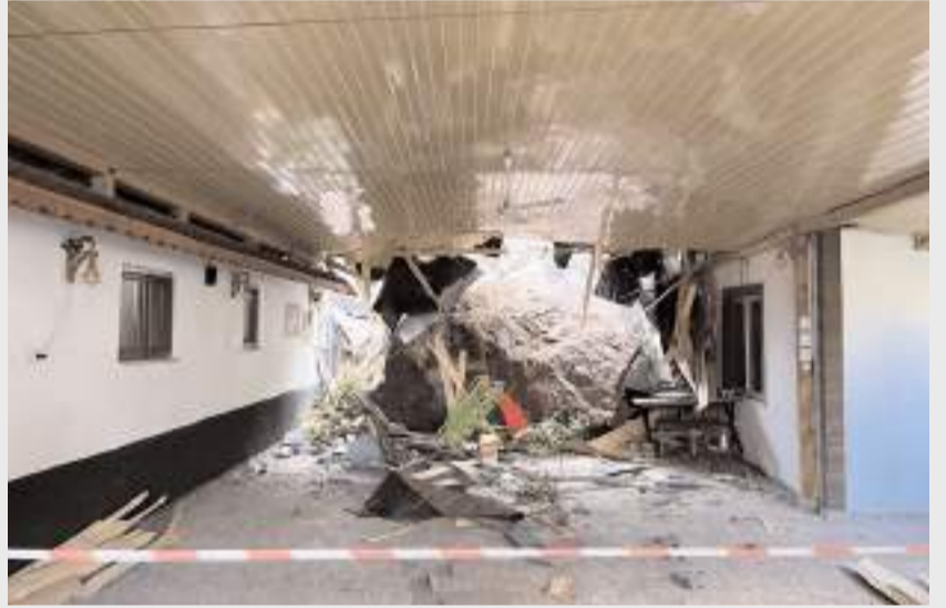
Olayda ev ve işyerinde maddi hasara neden oldu.

Öte yandan, güvenlik amacıyla kayalığın çevresinde bulunan bazı ev ve iş yerlerinin tahliye edildiği öğrenildi.(AA)