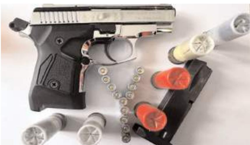
Aramalarda 1 adet kurusıkı tabanca, 1 adet av tüfeği, 13 adet tabanca fişegi ele geçirildi.

Çorum'da polis ekipleri tarafından gerçekleştirilen çalışmalar neticesinde hakkında yakalama kararı bulunan 7 kişi yakalandı.