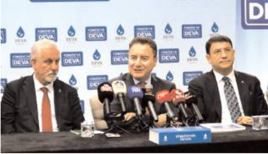
DEVA Partisi Genel Başkanı Ali Babacan, basın toplantısı düzenledi.