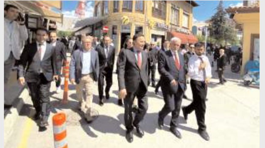
Çorum'a gelen Ali Babacan, esnafı ziyaret etti.