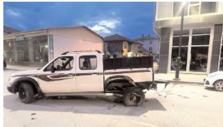
Kaza Ankara Caddesi'nde meydana geldi.