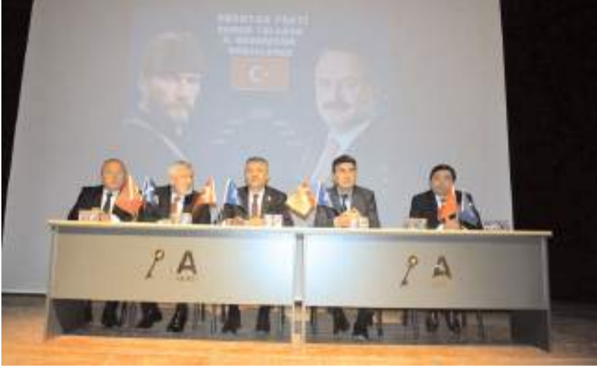
Genel kurulda ilk olarak divan heyeti belirlendi.