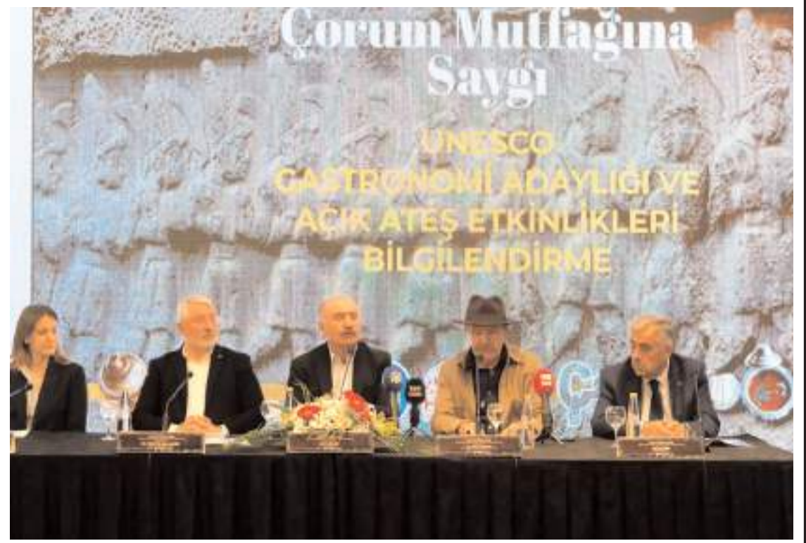
Toplantıda proje kapsamında yapılan çalışmalar kamuoyuna anlatıldı.