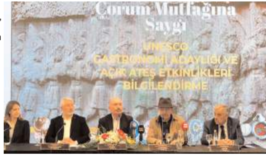
Toplantıda proje kapsamında yapılan çalışmalar kamuoyuna anlatıldı.

■ Çorum'un, Türkiye'de Hatay, Gaziantep ve Afyonkarahisar'ın ardından UNESCO Yaratıcı Şehirler Ağı'na gastronomi alanında girmesi için hazırlanan "Gastro Çorum Projesi"nin hazırlıkları sürüyor. * HABERİ4'TE