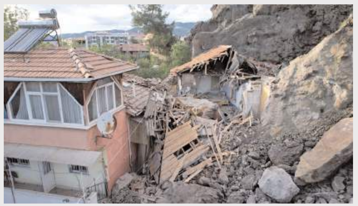
Olay Hıdırlık Mahallesi'nde meydana geldi.