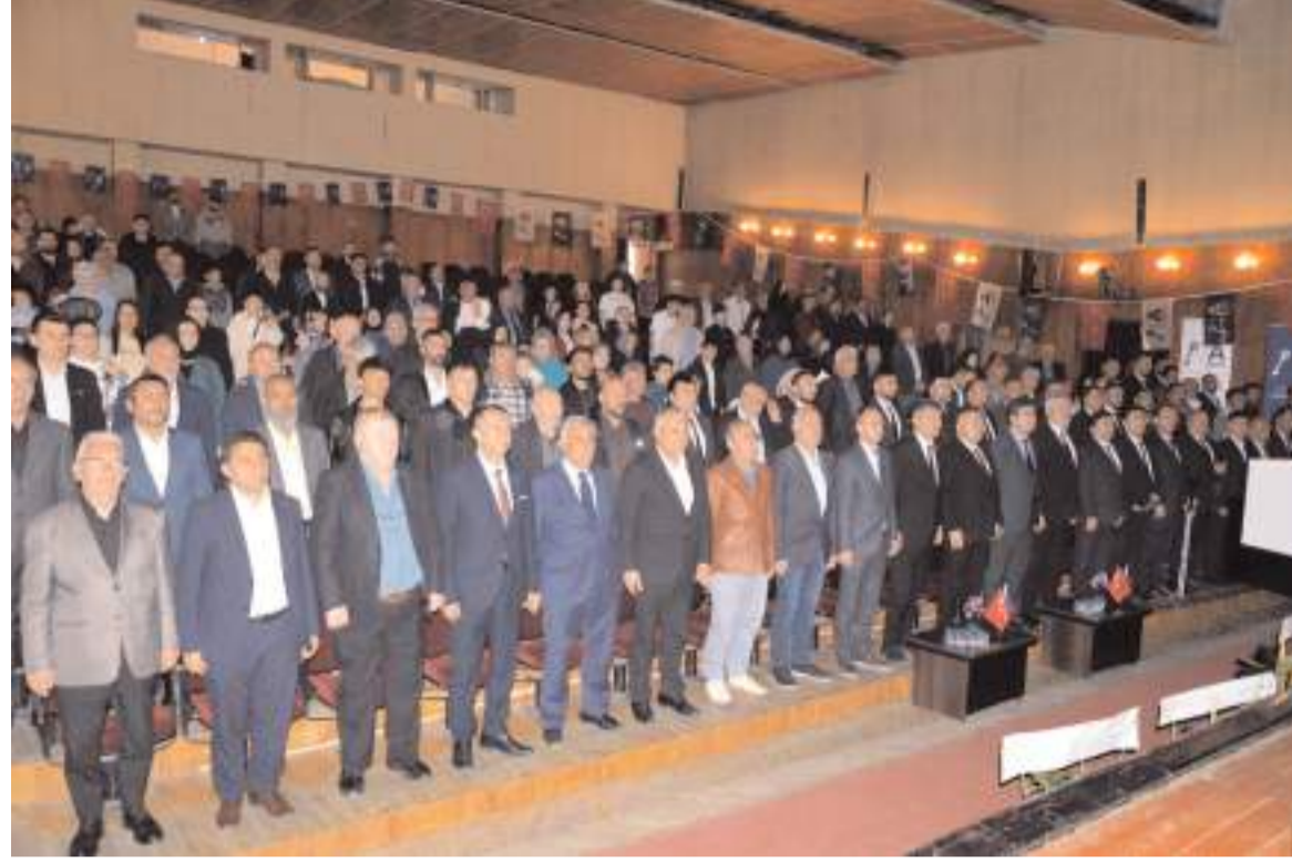
Genel kurulu Devlet Tiyatro Salonunda yapıldı.

"Bizim partimizin adı adı gibi misyonumuz da çözüm anahtarı olmak." diyen Müstet; "Anahtar Parti'nin sözü, "şeffaflık, liyakat, derdiniz vatan, derdiniz millet" diyorum Bizim ajandamızda sadece ve sadece Türkiye'nin yükselişi var. Kişisel kariyer planları ve grupların çıkarı için değil, 85 milyon vatandaşın refahı için geliyoruz. Derdimiz