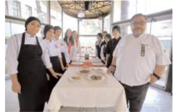
Bahçelievler Kız Mesleki ve Teknik Anadolu Lisesi ve Anadolu Profesyonel Şefler Birliğince "Gelenekten Geleceğe Ecdat Mutfağı" programı kapsamında etkinlik yapıldı.