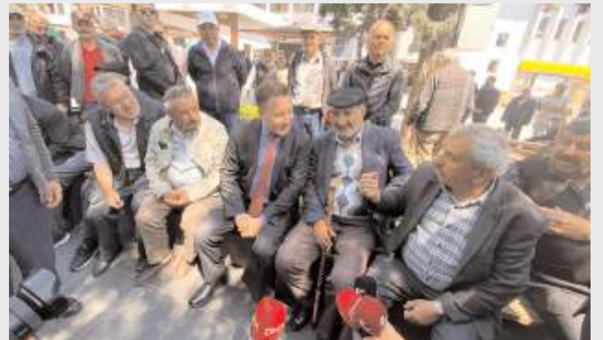
Ali Babacan, vatandaşlarla sohbet etti.