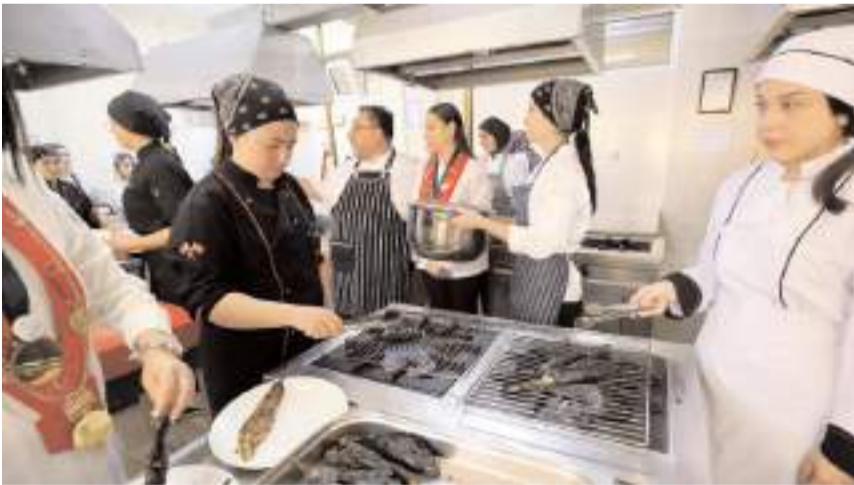
Etkinlikte öğrenciler, şeflerin yönlendirmesiyle çiğnerli iç pilav, hünkar beğendi, süt helvası ve çeşmi nigar çorbası hazırladı.