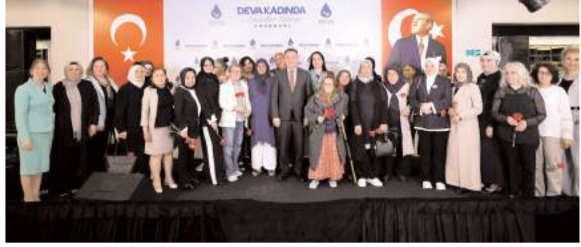
Ali Babacan, Anneler Günü programı kapsamında, kentteki şehit ve gazi aileleriyle bir araya geldi.

Konuşmasında hobi bahçeleri konusuna da değinen Babacan, şunları söyledi; "Bunların hepsi büyük yanlış ve bunların başta sağlam bir yasal zemine taşınması lazım. Bu ikinci ev yani şöyle bir nefes alması, bir beddili mekan evleri de dahil, o hobi bahçesi ihtiyacına dahil topyekun bir düzenleme yapılması lazım ve vatandaş bunu yaparken imar hak-