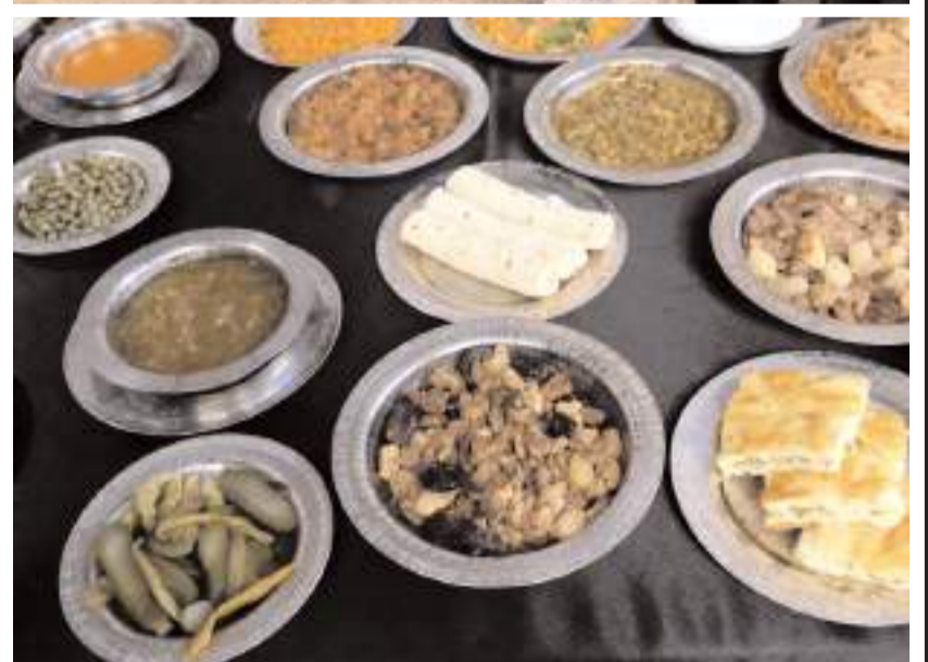
Toplantıda yöresel yemeklerde tanıtıldı.