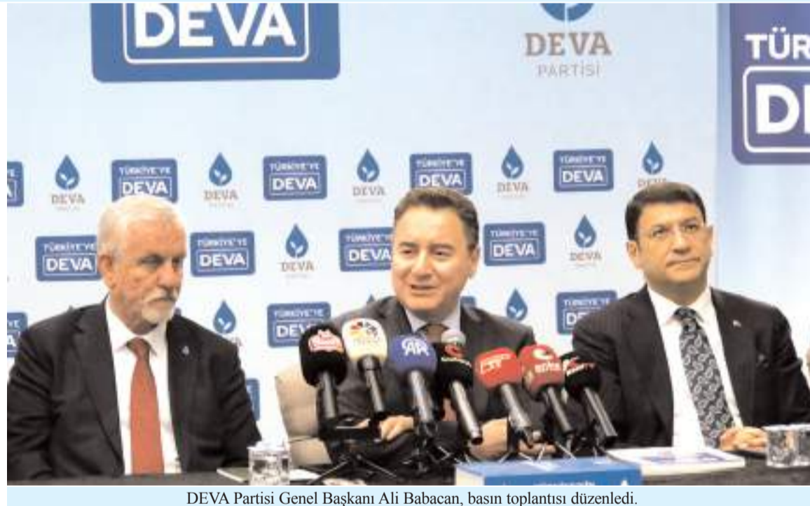
DEVA Partisi Genel Başkanı Ali Babacan, basın toplantısı düzenledi.