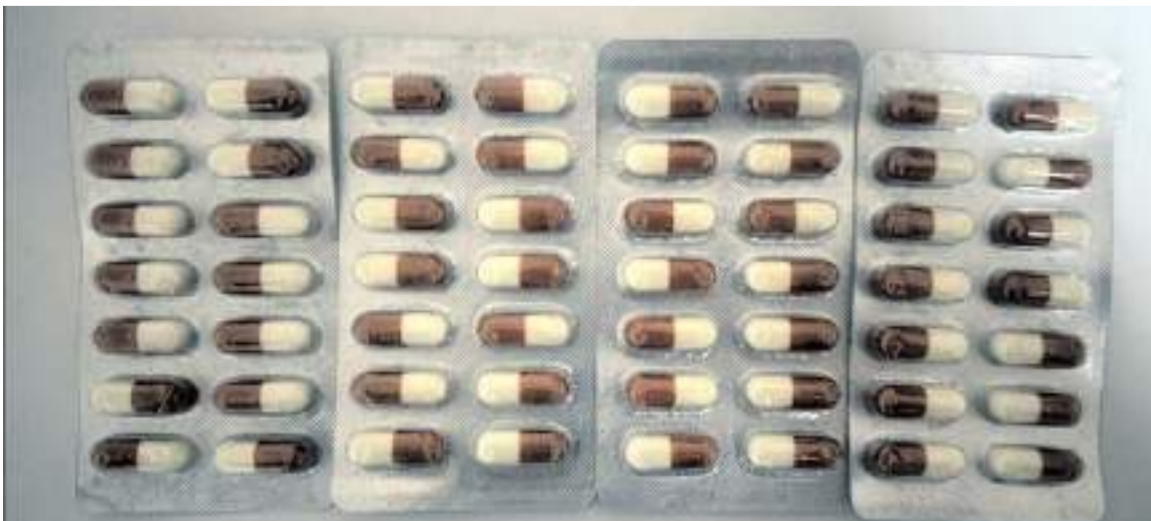
Aramalarda çok sayıda uyuşturucu madde de ele geçirildi.

Trafik denetimleri kapsamında ise 2 bin 174 araç ve sürücüsü kontrol edildi.