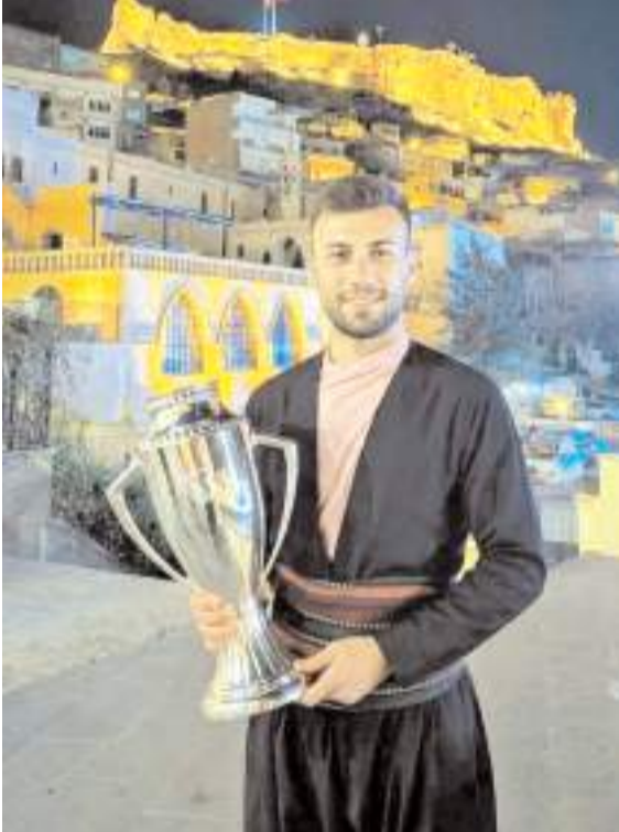
Nafican kazandığı üçüncü şampiyonluk kupası ile