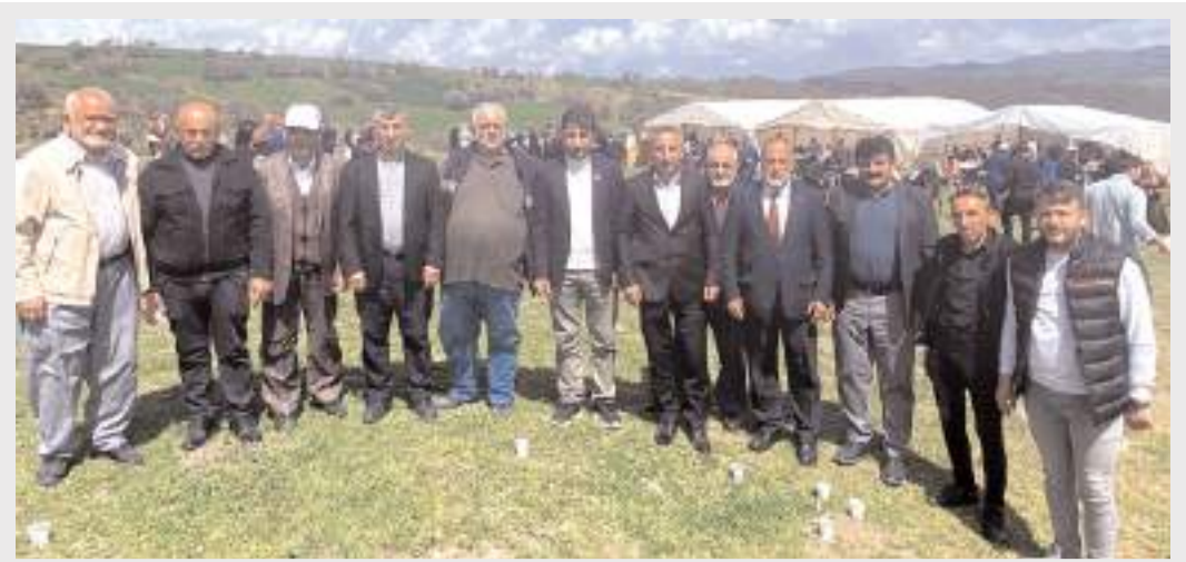
Saadet Partisi Çorum İl Teşkilatı, Feruz Köyü’nde düzenlenen yağmur duasına katıldı.