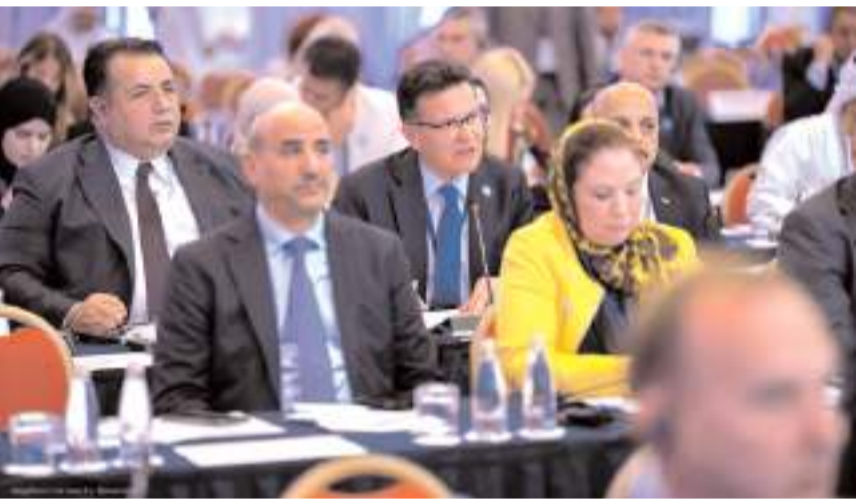
Milletvekili Av. Oğuzhan Kaya toplantıda Suriye'nin toprak bütünlüğüne ve terörle mücadelede uluslararası çifte standartlara dikkat çekti.