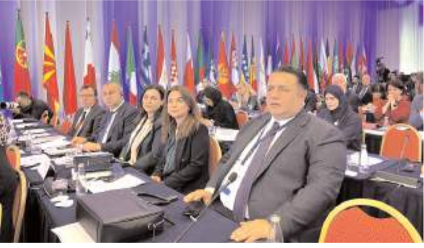
AK Parti Çorum Milletvekili Av. Oğuzhan Kaya, Parlamento Başkanları Zirvesi ve 20'nci Genel Kurul Toplantısına katıldı.

Konuşmasının son bölümünde meclis üyelerine seslenen Kaya, terör örgütleri arasında ideolojilerine göre "iyi veya kötü" ayrımı yapılmaması gerektiğini kaydetti. Hukukun üstünlüğünden ve temel insan haklarından taviz vermeden yürütülecek terörle mücadelenin, ancak ilkel, tutarlı ve samimi bir küresel dayanışma ile başarıya ulaşabileceğini vurgulayan Kaya'nın açıklamaları, Türkiye'nin bu konudaki kararlı duruşunu uluslararası kamuoyuna bir kez daha ilan etti. (Haber Merkezi)