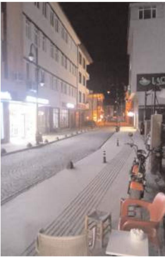
Tarihi Kültür Yolu'nda yaklaşık 1,5 aydır aydınlatma sorunu yaşıyor.