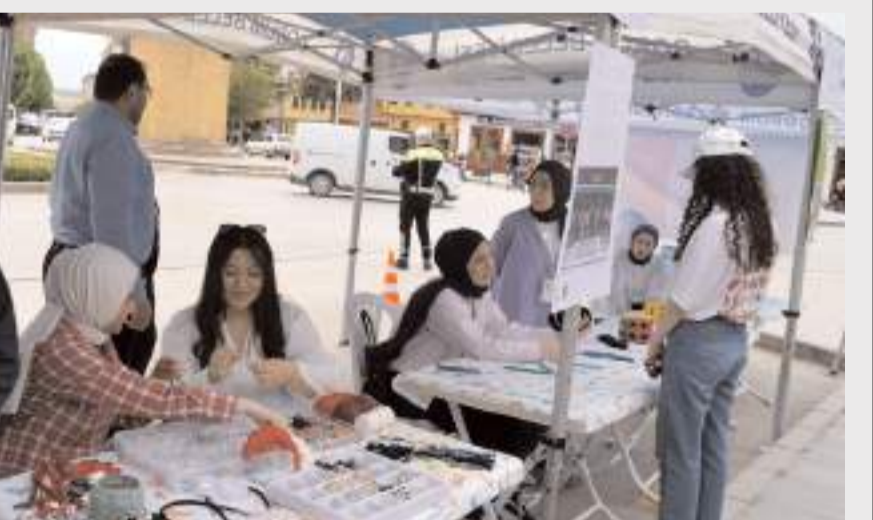
Etkinlikte farkındalık ve empati çalışmaları yapıldı.

T.C. ÇORUM TİCARET BORSASI Günlük Fiyat Bülteni (11.05.2026)