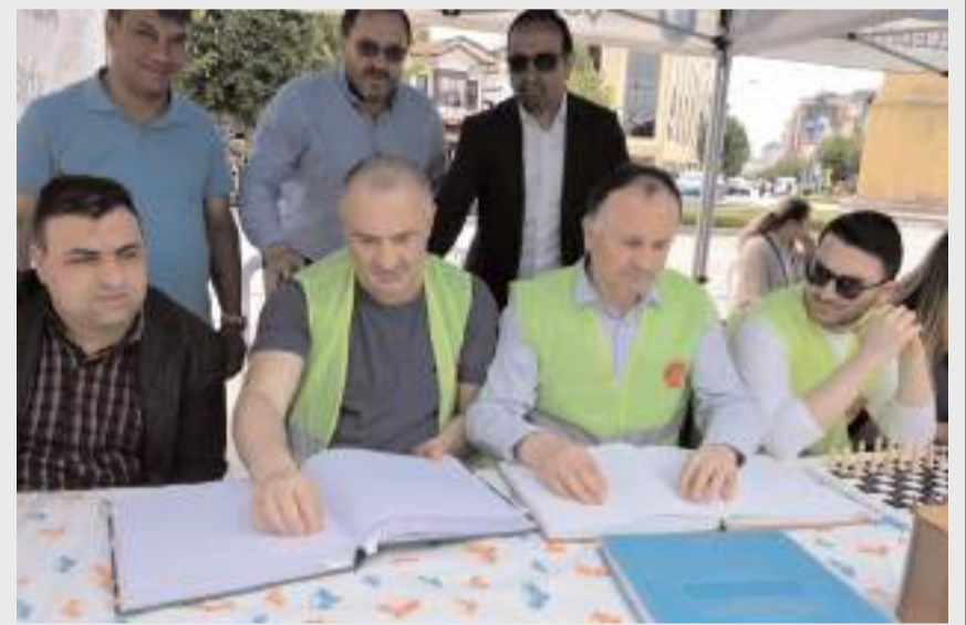
Stantta görme engellilerin nasıl okudukları ve yazdıkları gösterildi.