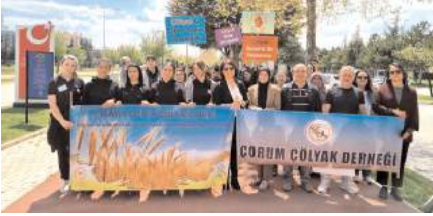
Etkinlik Şehitler Parkında yapıldı.

gösterdiği ilgiye teşekkür ediyoruz" dedi. (Haber Merkezi)