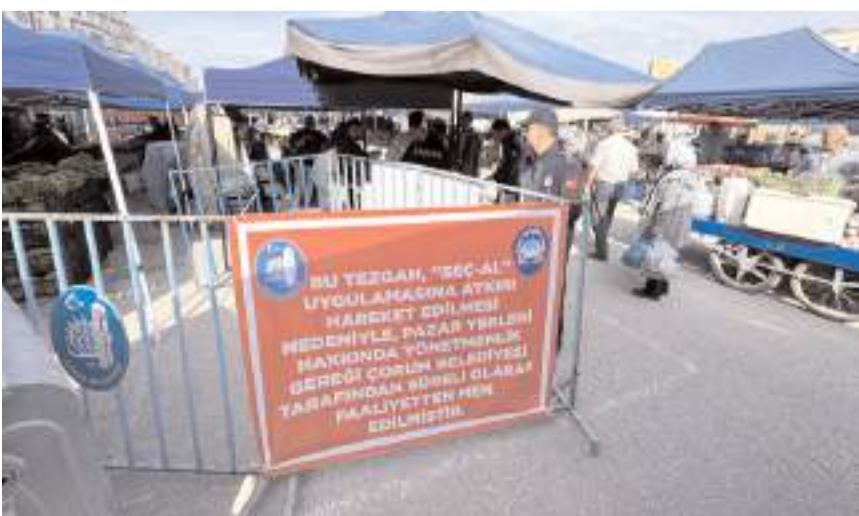
Ceza uygulanan pazarcının yerne bilgilendirici afiş asıldı.

kapsamında süreli olarak faaliyetten men cezası verildi. Tezgahın önüne ise, "bu tezgah, 'seç-al' uygulamasına aykırı hareket edilmesinden dolayı, Çorum Belediyesi tarafından süreli olarak faaliyetten men edilmiştir" yazılı afiş asıldı.