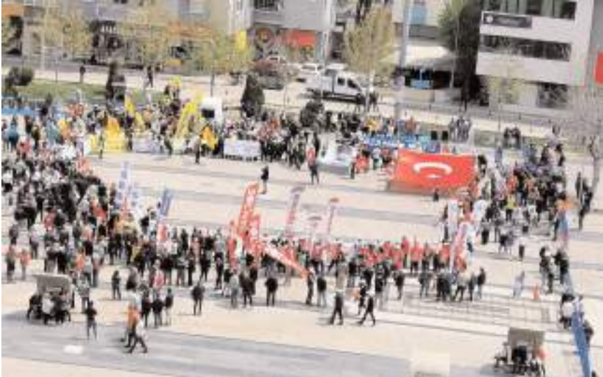
1 Mayıs Birlik, Mücadele ve Dayanışma Günü kutlaması Kadeş Barış Meydanında yapıldı.

Komite, etkinliğe katkı sunan tüm emekçilere, kurumlara, teknik ekiplere ve basın mensuplarına teşekkür etti. (Haber Merkezi)