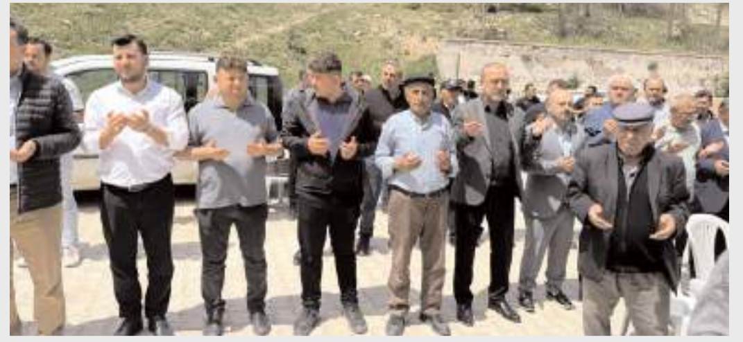
Yeniden Refah Partisi teşkilatları yağmur duası programlarına geniş katılım sağladı.