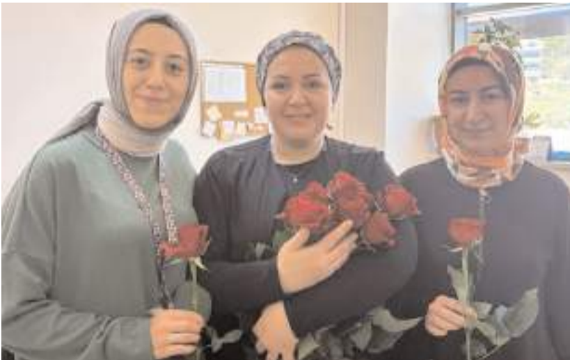
Hemşirelerin Hemşireler Günü kutlanarak çiçek gediye edildi.