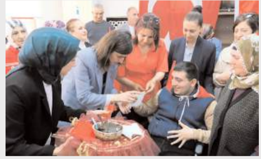
Engelliler Haftası kapsamında 14 engelli birey için temsili asker kınası programı yapıldı.

Burada kabirlere karanfil bırakan engelli bireyler, şehitlerin ruhu için dua etti. (AA)