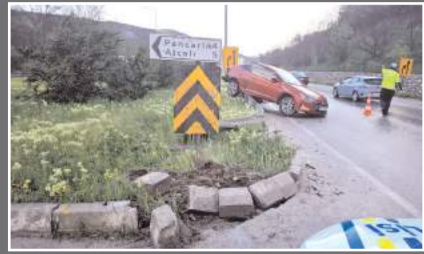
Kazada araçlarda maddi hasar oluştu.

Çorum'da, otomobil ile hafif ticari aracın çarpışması sonucu 3 kişi yaralandı.