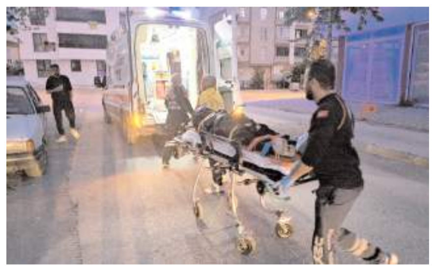
Olay Gülabibey Mahallesi'ndeki bir okulun bahçesinde meydana geldi.

Şüphelinin yakalanması için çalışma başlatıldı.(AA)