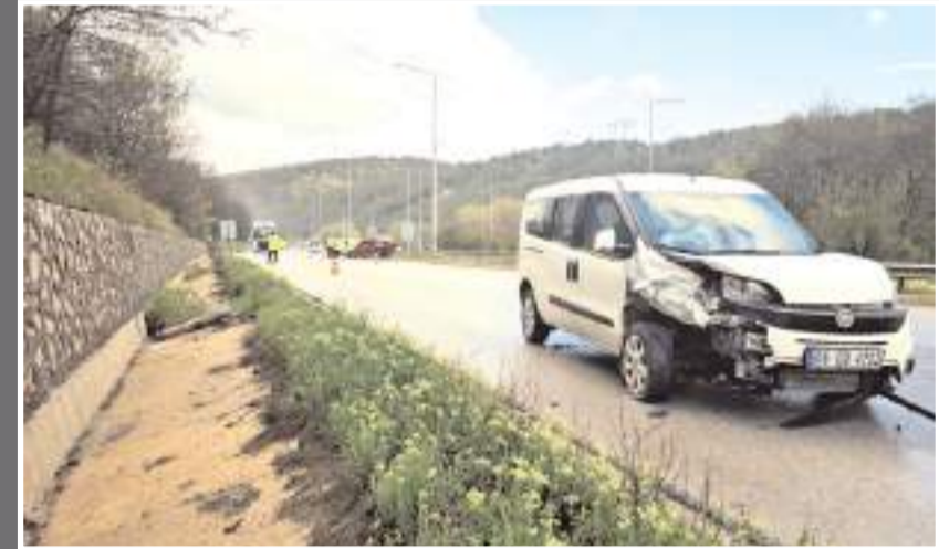
Kaza Çorum-Samsun kara yolu Atçalı köyü kavşağında meydana geldi.