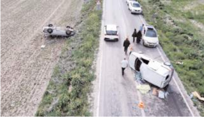
Kazalar, Alaca ilçesi Alaca-Sungurlu kara yolunda meydana geldi.

Ekipler tarafından her iki kazayla ilgili inceleme başlatıldı.