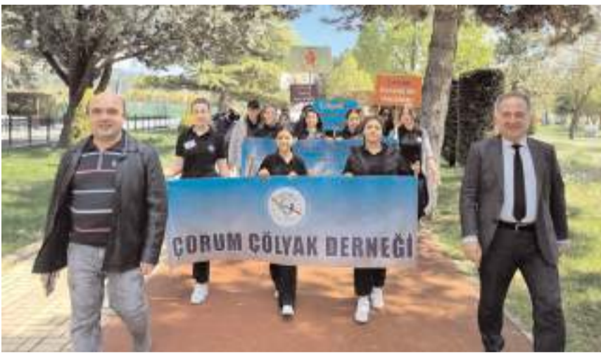
Çölyak dikkat çekmek amacıyla pankart ve dövizler taşındı.