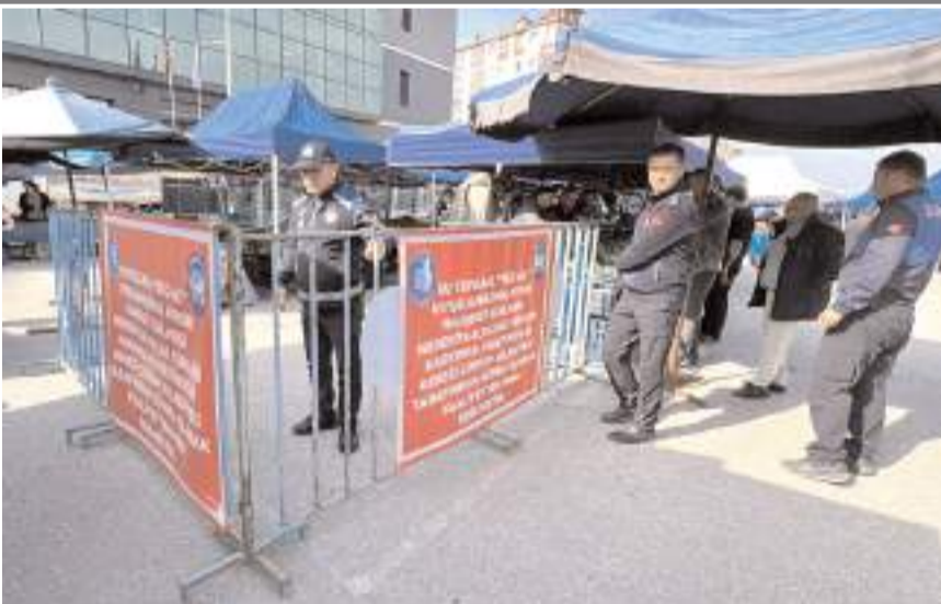
Olay Pazartesi pazarına meydana geldi.

Yapılan incelemelerde ürün seçiminde kısıtlayıcı tutum sergilediği belirlenirken, bu uygulamanın Belediye Meclisi kararıyla yürürlüğe giren "seç-al" sistemine aykırı olduğu değerlendirildi. Bunun üzerine ilgili tezgaha, Pazar Yerleri Hakkında Yönetmelik