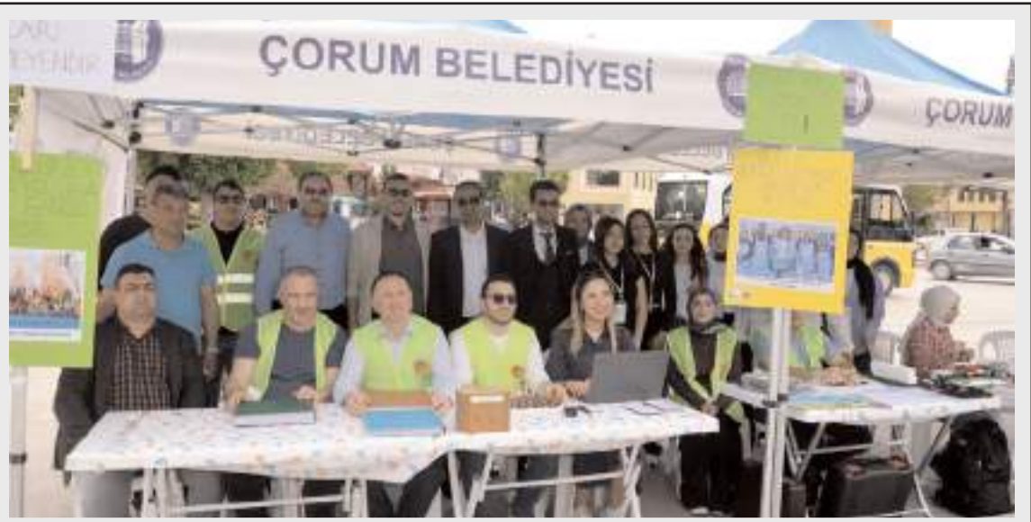
Stant Hürriyet Meydanı'nda kuruldu.