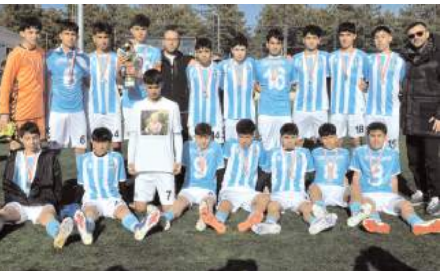
Çorum Vefaspor Ordu grubunda ilk maçında Bayburt İl Özel İdarespor ile karşılaşacak