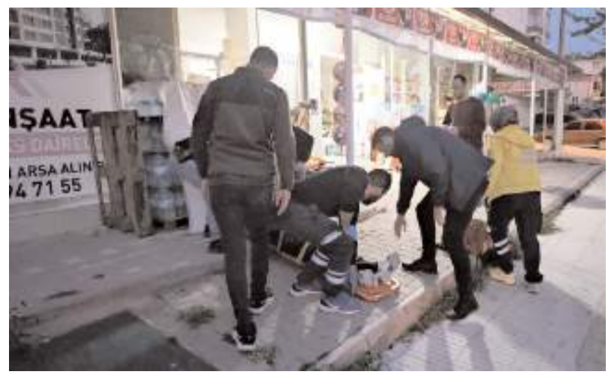
Yaralıya ilk müdahale 112 acil sağlık ekipleri tarafından olay yerinde yapıldı.