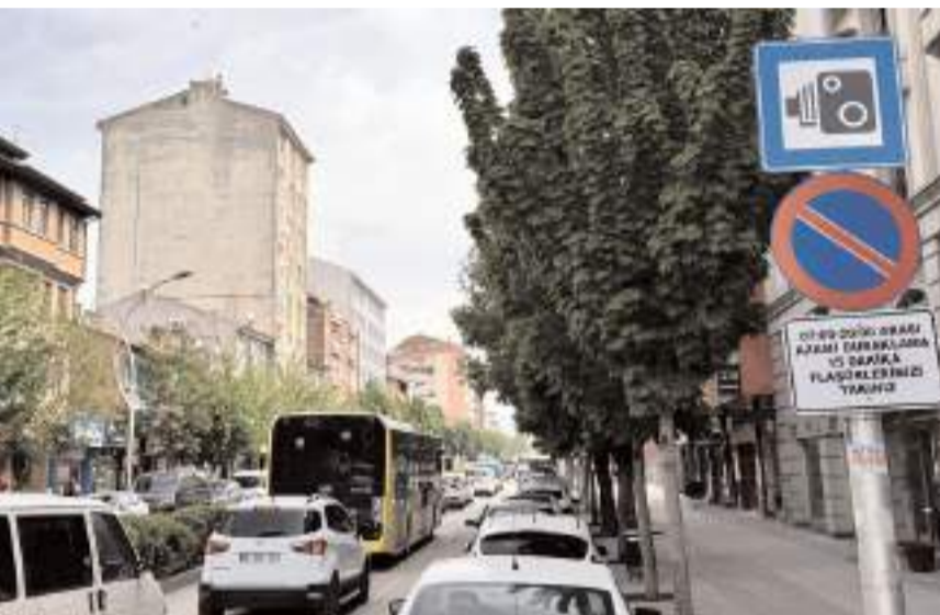
Atatürk Lisesi ile Anitta Otel arasındaki güzergâhta hafta içi ve hafta sonu 07.00-20.00 saatleri arasında ilk 15 dakika ücretsiz park yapılabilecek.