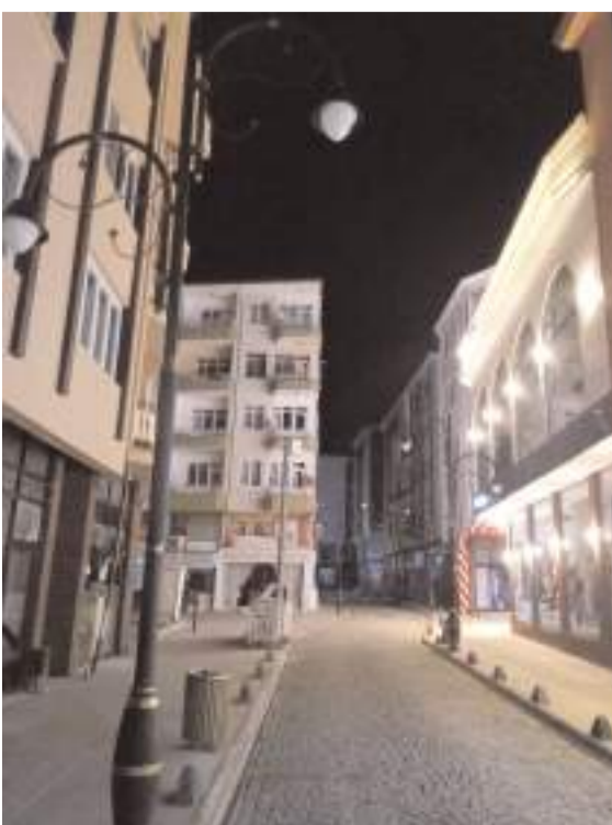
Tarihi Kültür Yolu'nda yaklaşık 1,5 aydır aydınlatma sorunu yaşanıyor.