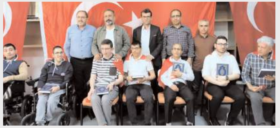
Program Çorum Belediyesi ve Altı Nokta Körler Derneği iş birliğiyle yapıldı.