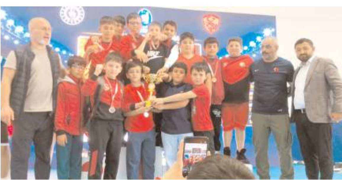
Takımlarda tek birincilik kazanan İl Özel İdarespor kupa ve madalyaları ile birlikte toplu halde