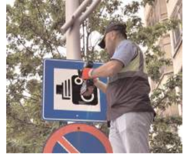
Elektronik Denetleme Sistemi (EDS) için bilgilendirici levhalar yerleştirildi.