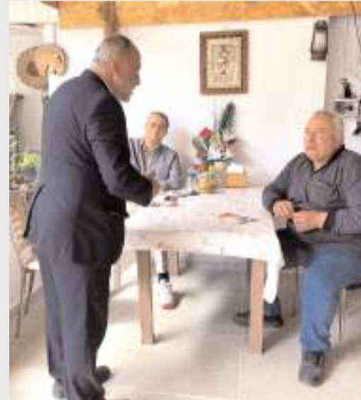
SP’liler esnafı ziyaret ederek sorun ve taleplerini dinledi.