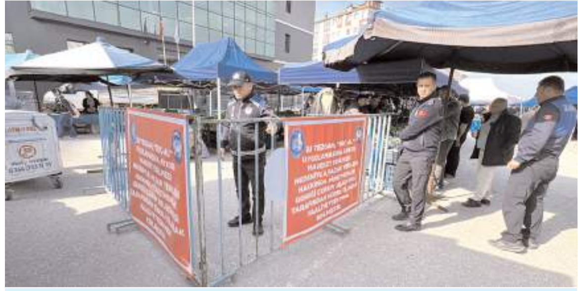
Olay Pazartesi pazarında meydana geldi.

■ Çorum'da "seç-al" uygulamasına aykırı hareket ederek vatandaşın tezgahdaki ürünleri seçmesine izin vermeyen pazarıcı esnafına tezgah kapatma cezası verildi. * HABERİ2'DE