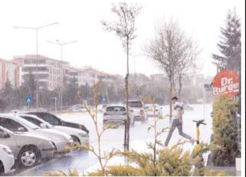
Yaklaşık 20 dakika etkili olan yağış nedeniyle bazı cadde ve sokaklarda su birikintileri oluştu.

Meteoroloji Genel Müdürlüğü verilerine göre, kentte sağanak ve gök gürültülü sağanak yağışlar aralıklarla hafta boyu devam edecek.(AA)