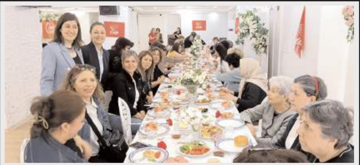
Program Ege'nin Bahçesi'nde yapıldı.