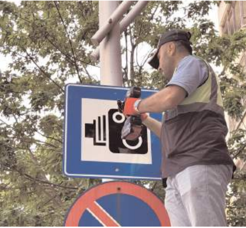
Elektronik Denetleme Sistemi (EDS) için bilgilendirici levhalar yerleştirildi.