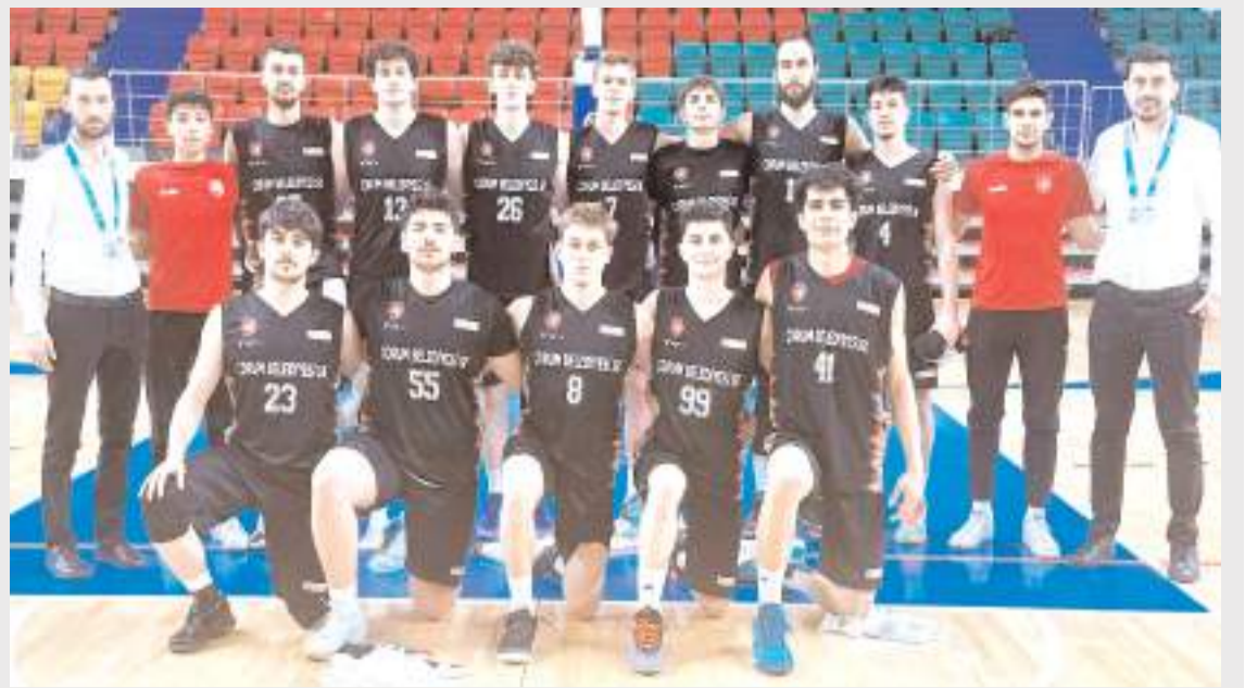
Çorum Belediyespor erkek basketbol takımı çeyrek finalde West Bursa takımı ile final etabı için karşılaşacak