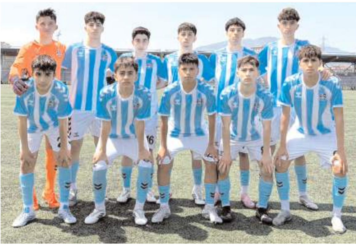
Vefaspor U 15 takımı Ordu'da dün başlayan bölge birinciliğinde ilk maçını farklı kazanarak yarı finale yükseldi