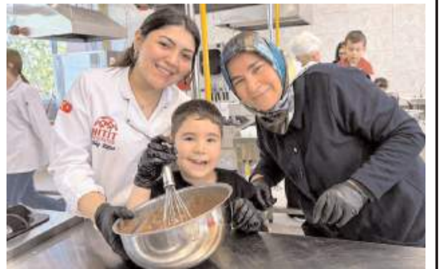
Anneanneler, babaanneler ve torunları güzel bir gün geçirdi.

Etkinlikte yıllar boyunca emekle büyüttükleri evlatlarının en kıymetli hediyesi olan torunlarıyla bir araya gelen büyükanneler, çocuklarına hazırladıkları tarifleri bu kez küçük ellerle yaparak duygu dolu anlar yaşadı. (İHA)