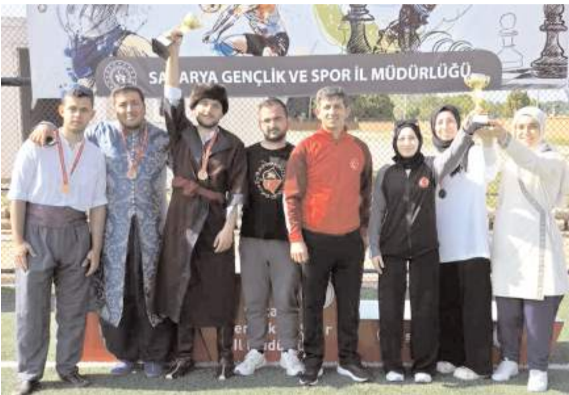
Geleneksel Türk Okçuluk'ta kürsüye çıkan Çorum kadın ve erkek takımları kupa töreni sonrası toplu halde

Vefaspor Teknik Direktörü Buğra Erdoğan ilk maçtaki performanslarından dolayı futbolcularını tebrik etti. Erdoğan asıl maçlarının bugünkü karşılaşma olduğunu geçen yıl penaltılarda elendikleri rakiplerinden rövanş almak için ellerinden gelen mücadeleyi vereceklerini söyledi.