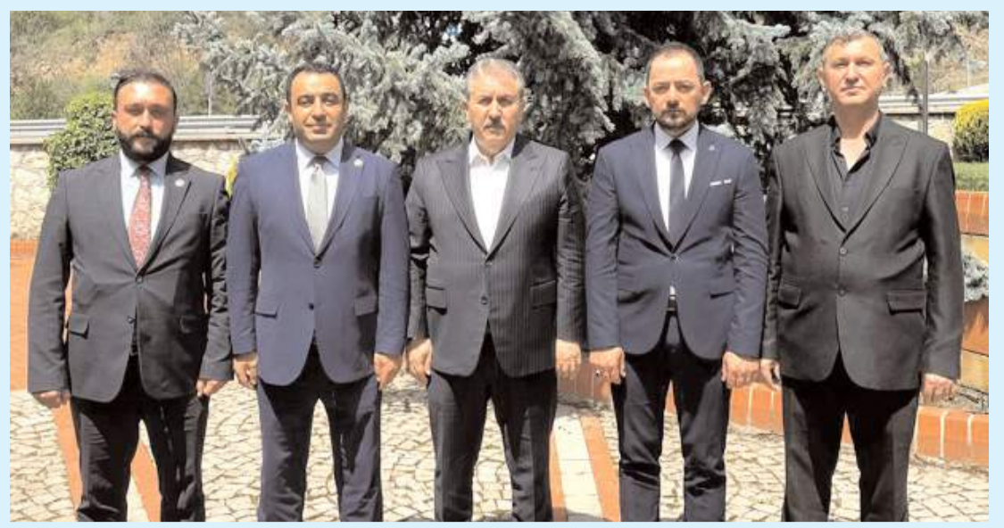
Ziyaretin anısına hatıra fotoğrafı çekildi.