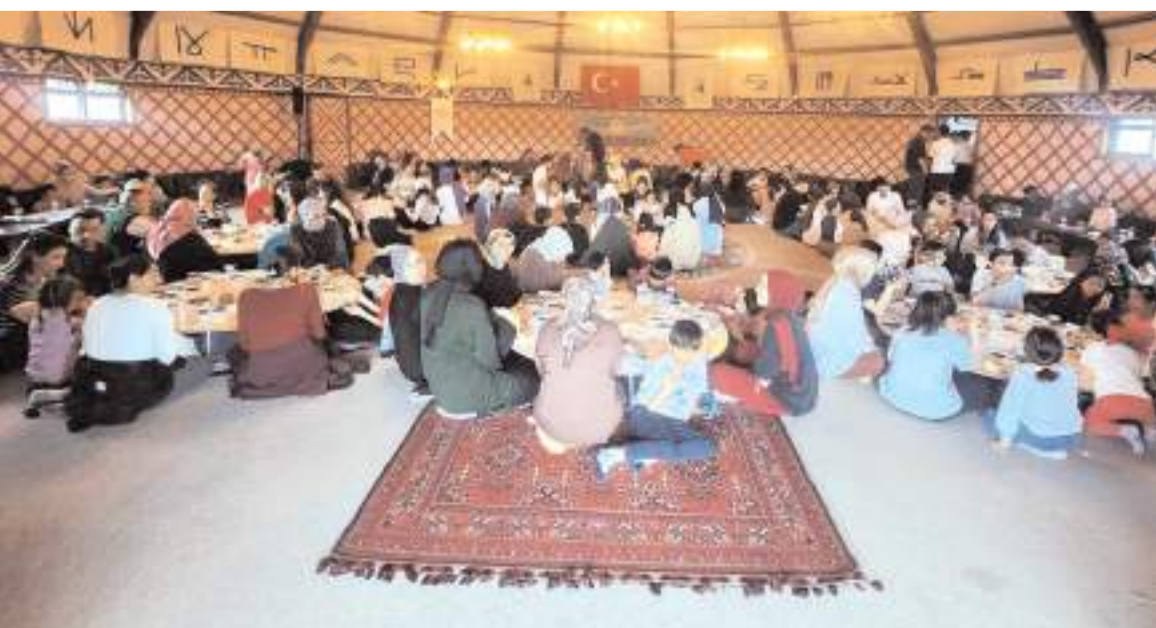
Kutlama programına katılım yüksek oldu.