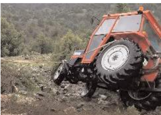
Kaza, Kargı ilçesi Akkaya köyünde meydana geldi.

Çorum'un Kargı ilçesine traktörün şarampole devrilmesi neticesinde 1 kişi yaralandı.