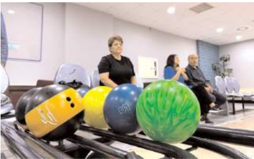
Program Buhara Kültür Merkezi Bowling Salonu'nda yapıldı.

Çorum Belediyesi tarafından Anneler Günü kapsamında düzenlenen "Anneler Günü'ne Özel Bowling Etkinliği" yoğun katılımıyla gerçekleştirildi. Buhara Kültür Merkezi Bowling Salonu'nda düzenlenen etkinlikte anneler, hem spor yapma hem de keyifli vakit geçirme fırsatı buldu. Gün boyu devam eden ve renkli görüntülere sahne olan organizasyonda katılımcılar bowling oynayarak stres atarken, aileleriyle birlikte eğlenceli anlar yaşadı. Anneler Günü'ne özel gerçekleştirilen etkinlikte samimi ve neşeli anlar yaşanırken, katılımcılar organizasyondan duydukları memnuniyeti dile getirerek Çorum Belediyesi'ne teşekkür etti. (İHA)