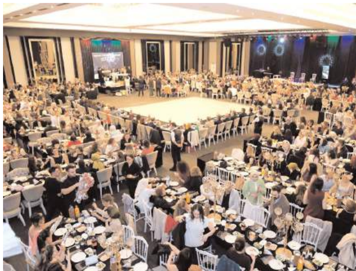
Kutlama programına katılım yüksek oldu.