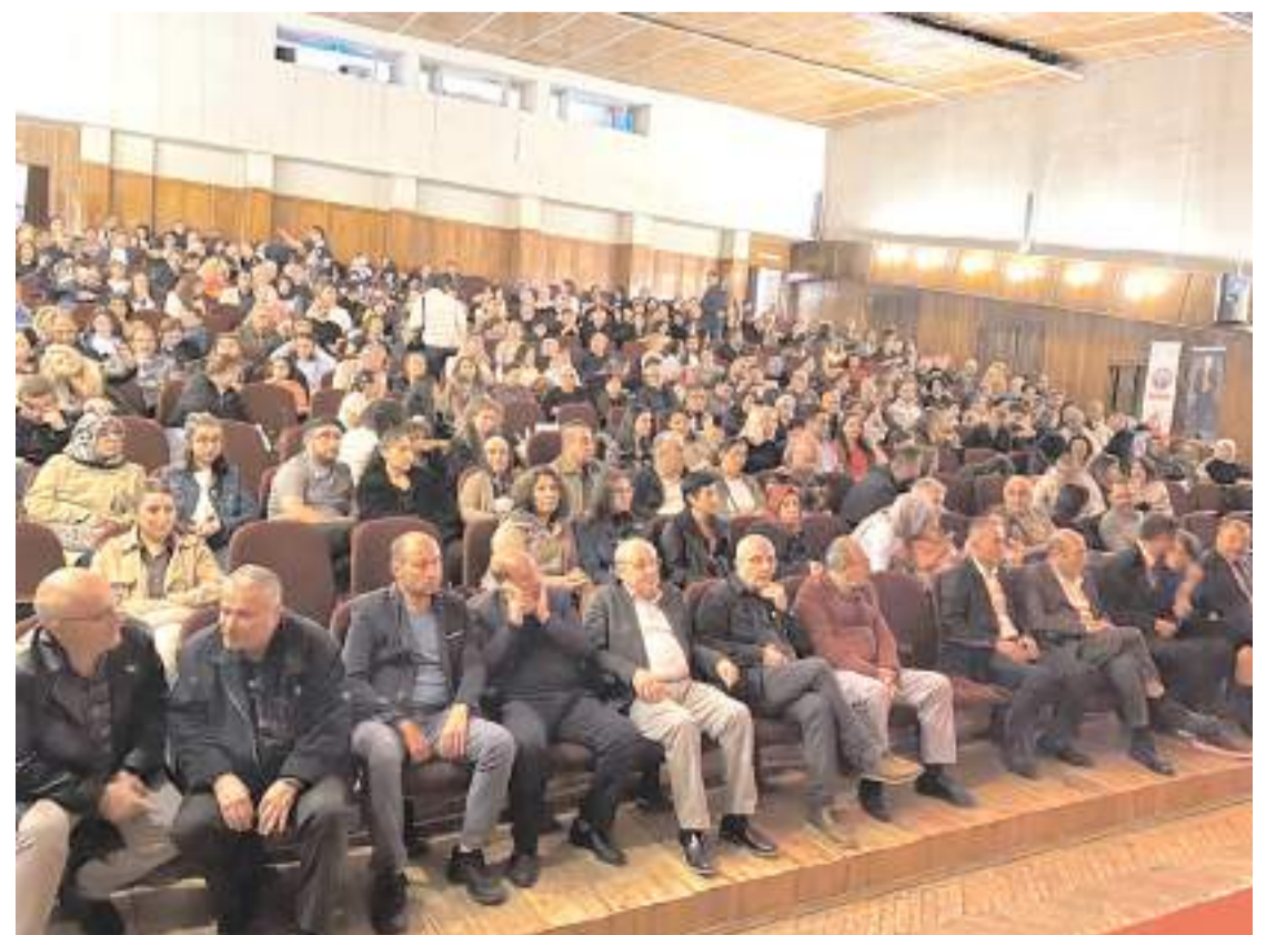
Devlet Tiyatro Salonunda yapılan programa katılım yüksek oldu.