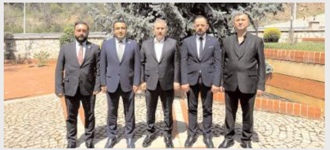
Ziyaretin anısına hatıra fotoğrafı çekildi.