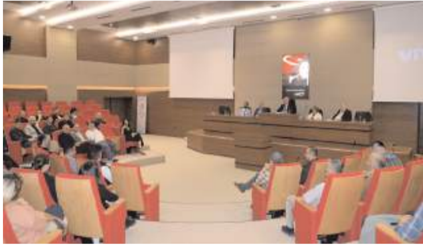
Toplantı Ticaret ve Sanayi Odası Konferans Salonu'nda yapıldı.