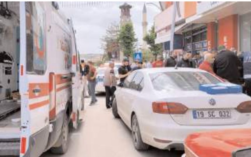
Olay, Sungurlu ilçesi Sunguroğlu Mahallesi Alparslan Türkeş Caddesi'nde meydana geldi.

Polis ekipleri, şüpheliyi yakalamak için çalışma başlattı.(İHA)