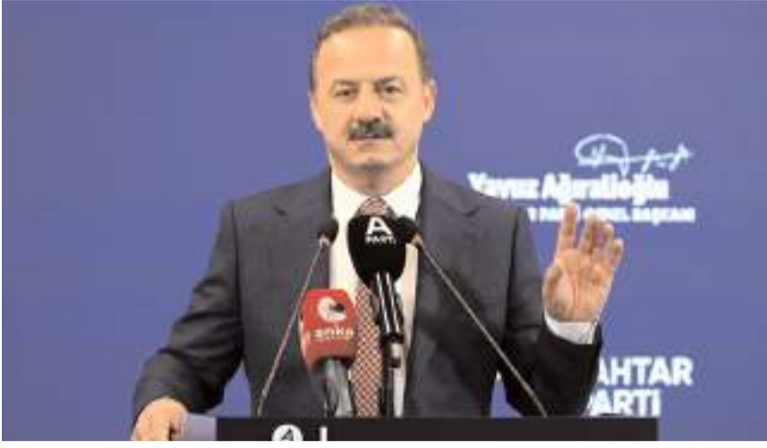
Anahtar Parti Genel Başkanı Yavuz Ağırlioğlu

Program kapsamında esnafı da ziyaret edecek olan Ağırlioğlu, 17.00'de parti binasının açılışını yapacak.