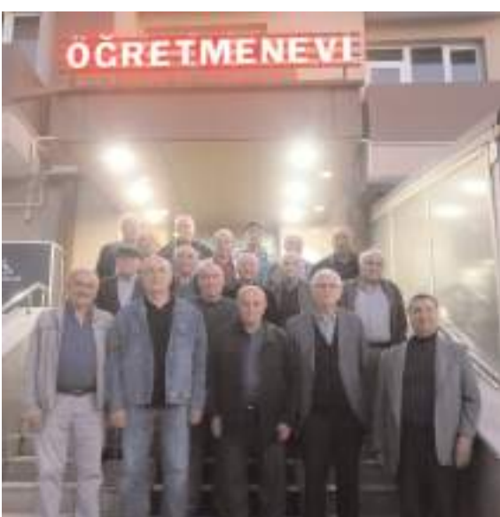
Buluşmanın anısına toplu fotoğraf çekildi.