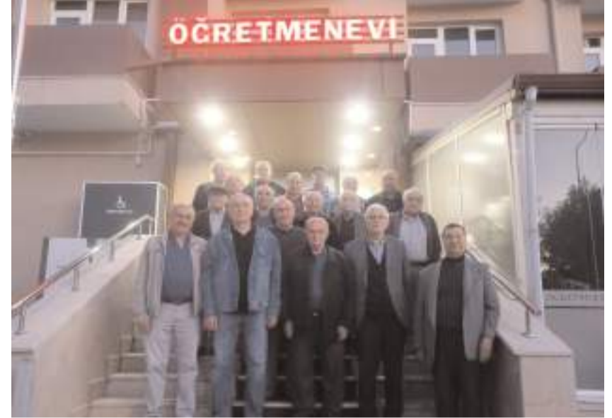
Buluşmanın anısına toplu fotoğraf çekinildi.