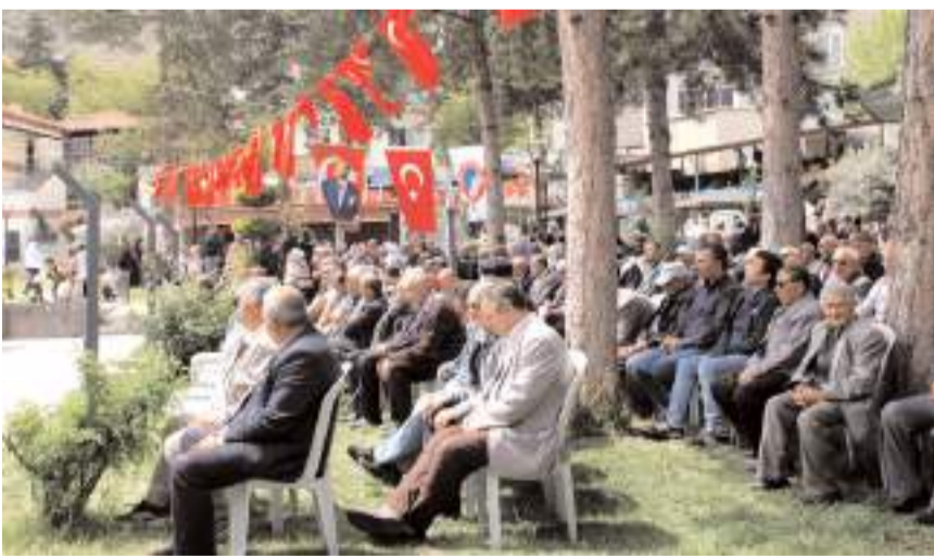
Şenliğe ilgi yüksek oldu.