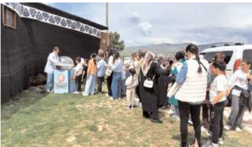
Programa katılanlara ikramlarda bulunuldu.