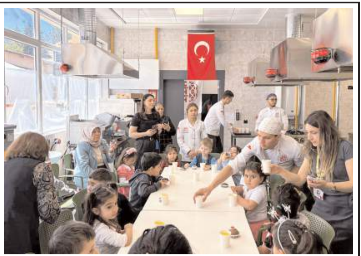
Program Hitit Üniversitesi tarafından Bilim Kafe'de düzenlendi.

Kazayla ilgili inceleme başlatıldı. (İHA)