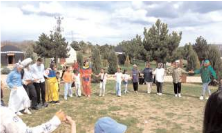
Kutlamada bol bol halay çekildi.