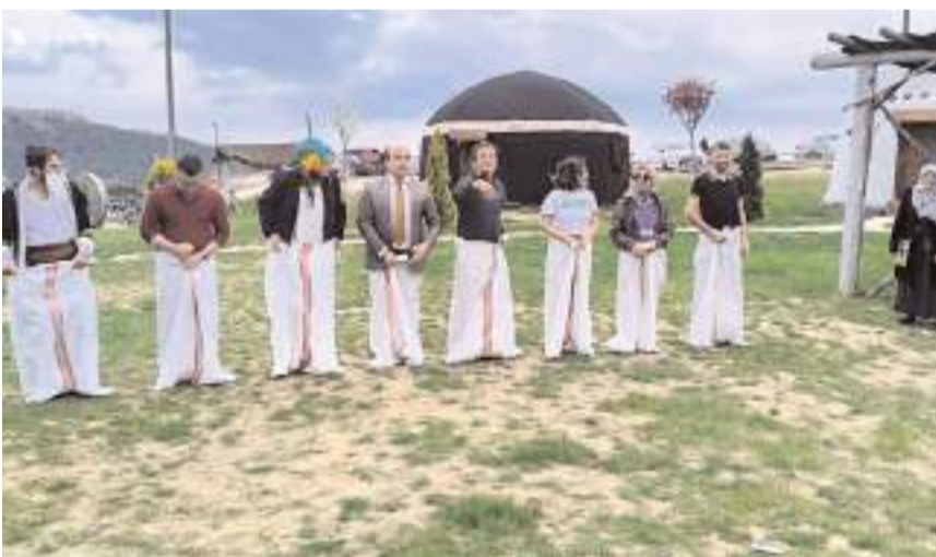
Etkinlik renkli görüntülere sahne oldu.