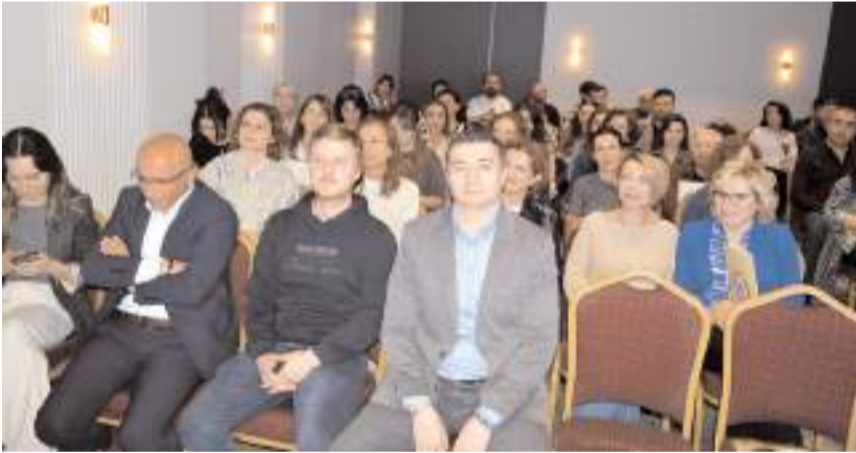
Eğitim Çorum Eczacı Odası yeni hizmet binasında yapıldı.

rülen rozase hastalığında kızarıklık, döküntü ve yanma gibi belirtiler görülür. Gül hastalığı