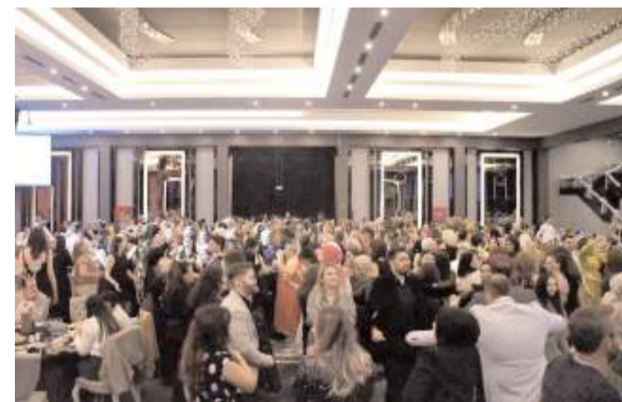
Davetliler müzik eşliğinde gönüllerince eğlendiler.