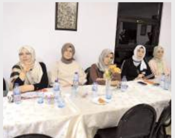
Panel vakif merkezinde yapıldı.