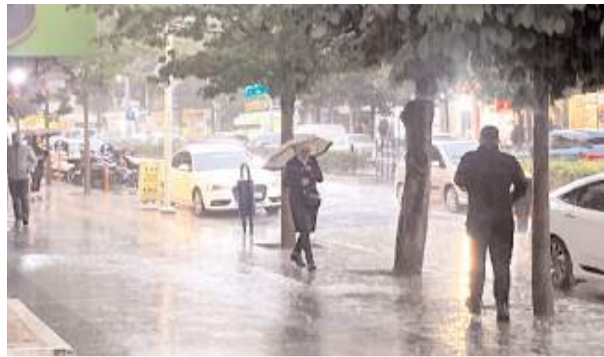
Aniden bastıran sağanak nedeniyle cadde ve sokaklarda su birikintileri oluştu.

Çorum'da etkili olan kuvvetli yağış, hayatı olumsuz etkiledi. Kent merkezinde aniden bastıran sağanak nedeniyle cadde ve sokaklarda su birikintileri oluştu. Sürücüler trafikte ilerlemekte güçlük çekerken, yayalar da şemsiyeleriyle yağmurdan korunmaya çalıştı. Bölge Tahmin ve Uyarı Merkezi'nden yapılan açıklamada, yağışın akşam saatlerine kadar etkili olmasının beklendiği bildirildi. (İHA)