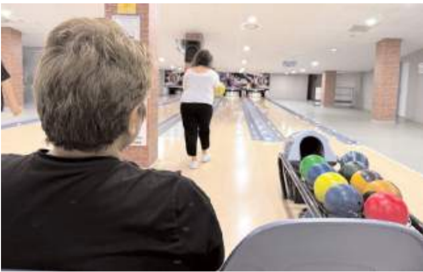
Anneler bowling oynayarak güzel bir gün geçirdiler.