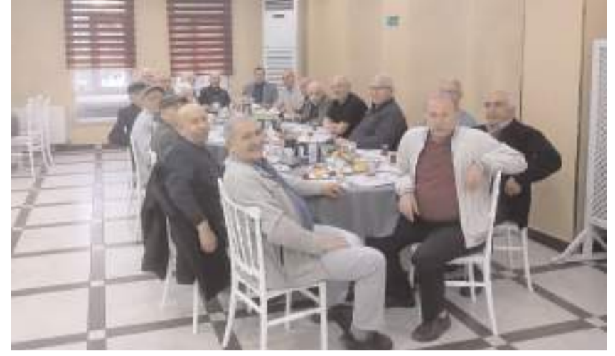
“Emekli Müdürler” grubu, her ay düzenli olarak Öğretmen Evi'nde buluşarak geçmiş yılları yâd ediyor.