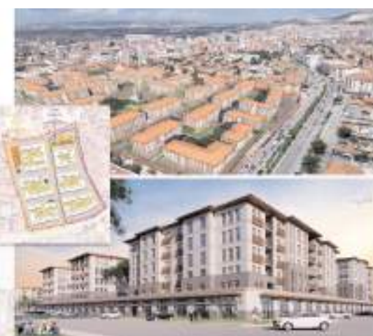
Program yarın 11.00'de Turgut Özal Konferans Salonu'nda yapılacak.