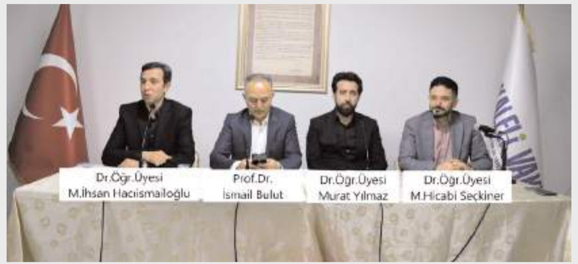
Panel konuşmacı olarak Hitit Üniversitesi İlahiyat Fakültesi akademisyenleri katıldı.