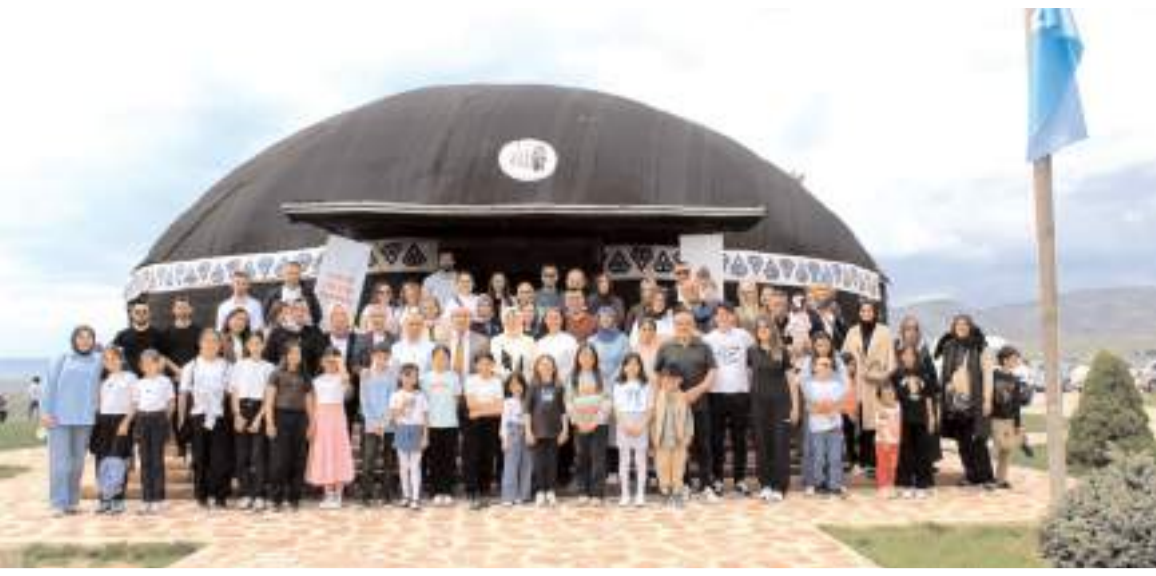
Kutlama programı Çorumlu Obasında yapıldı.