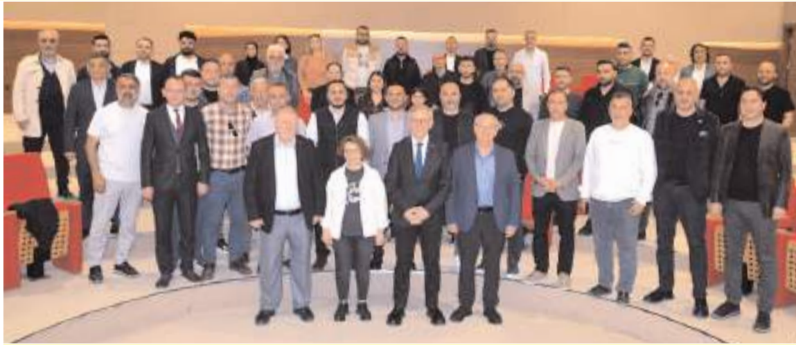
Toplantının sonunda toplu hatıra fotoğrafı çekildi.