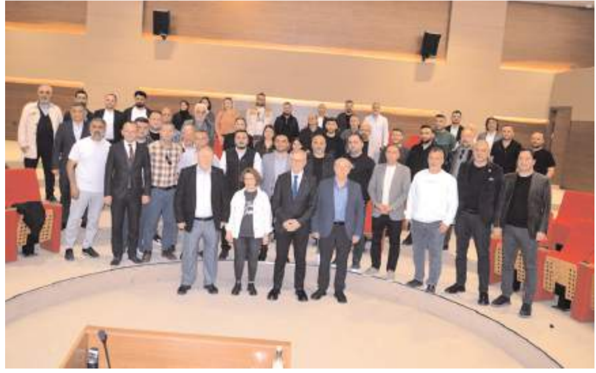
Toplantının sonunda toplu hatıra fotoğrafı çekildi.

Program, sektör temsilcilerinin görüş alışverişinde bulunmasının ardından sona erdi.