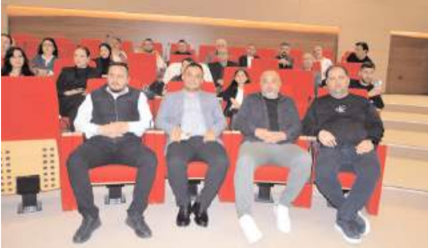
Toplantıda sektörün mevcut sorunları, çözüm önerileri ve sigortacılığın geleceği değerlendirildi.