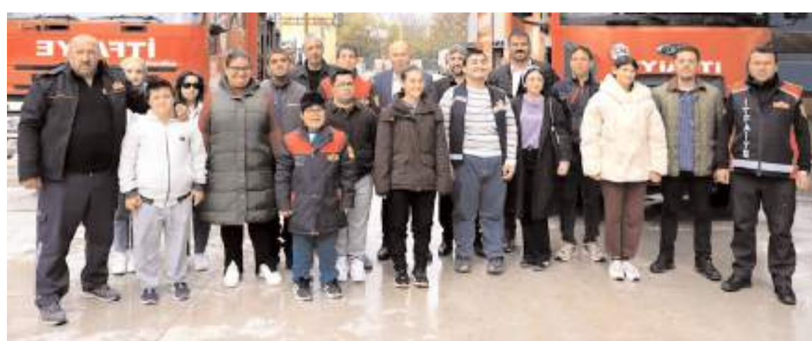
Eğitimin sonunda öğrenciler itfaiye erleriyle hatıra fotoğrafları çektiler.