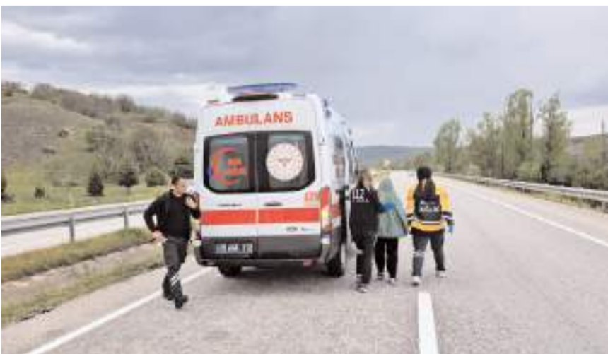
Yaralılar hastaneye kaldırıldı.

Çorum'da otomobilin devrilmesi sonucu 5 kişi yaralandı.