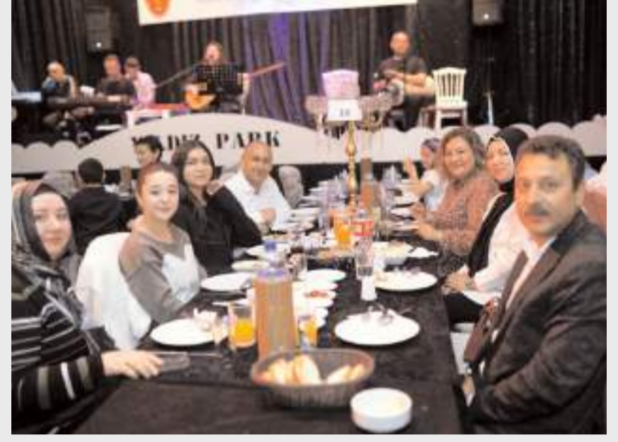
Veteriner Hekimler Gecesine çok sayıda davetli katıldı.

Gece kapsamında, mesleğe uzun yıllar emek vermiş veteriner hekimlere plaket takdim edildi. Ayrıca odanın kurucu başkanı merhum Ahmet Tüfekçi adına hazırlanan vefa plaketi de eşine verildi.