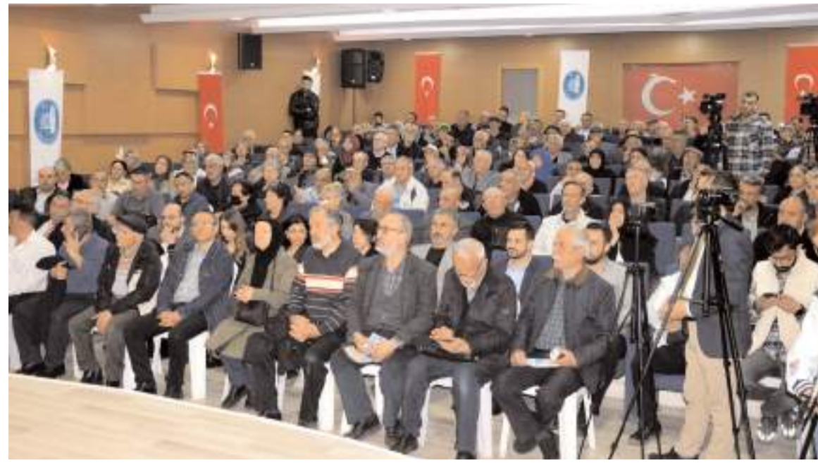
Turgut Özal İş Merkezi Konferans Salonunda yapılan toplantıya ilgi yüksek oldu.