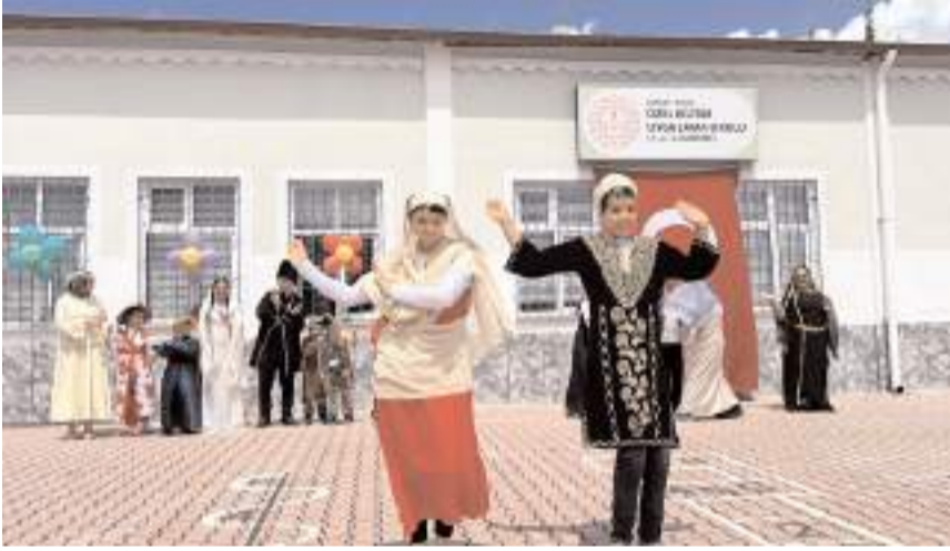
Halk oyunları gösterisi ilgi çekti.