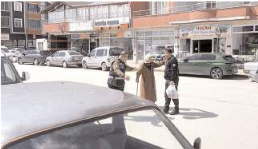
Polis memuru yürümekte zorlanan yaşlı kadının alışverişine yardım etti.

Alışverişin ardından polis memuru, yaşlı kadını ekip aracıyla Yıldızhan Mahallesi'ndeki evine bıraktı.(AA)