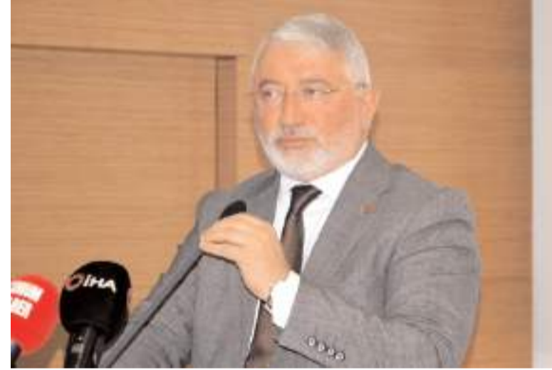
Belediye Başkanı Halil İbrahim Aşgın