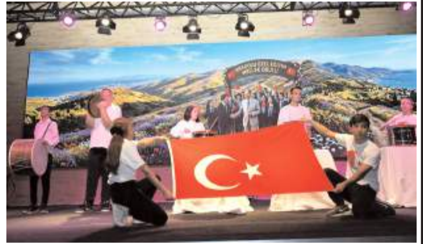
Program TSO Kültür Merkezinde yapıldı.

Kale Özel Eğitim Uygulama Okulu öğrencileri bayrak rontu ve ritim gösterileri sunarken, Zübeyde Hanım Özel Eğitim Uygulama Okulu öğrencilerinin sergilediği Kafkas halk oyunları ve vals gösterisi geceye renk kattı.