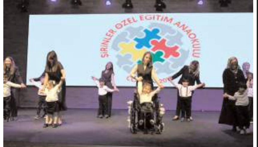
Vals gösterisi geceye renk kattı.