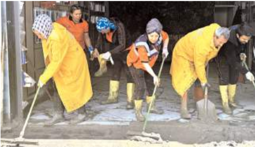
Gönüllüler temizlik çalışmalarına destek veriyor.

Herkesin işini bırakarak "Ne yapabiliriz, hangi işin başını tutabiliriz?" düşüncesine hareketlendiğini anlatan Arslan, "Havza'ya gidelim." dedik. Sabah erken buraya gelerek esnafın yardımına koştuk. İş yerlerini ve evleri su basmış. Suyun temizlenmesi için tahliye yapıyoruz. Kaba pisliği dışarı atıyoruz. İçeride yoğun