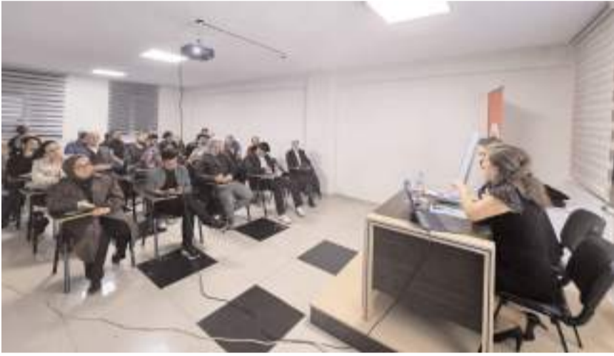
Söyleşi Çorum Kültür Merkezinde yapıldı.