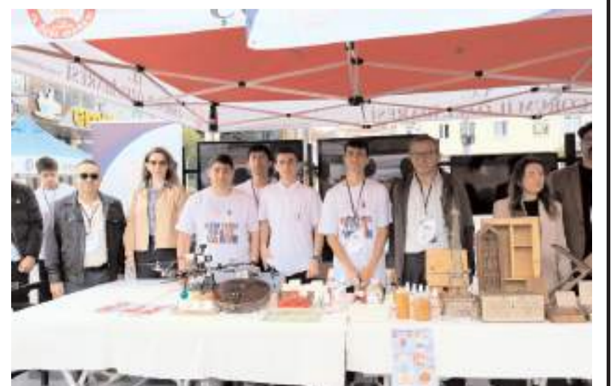
Öğrenciler projelerini sergiledi.