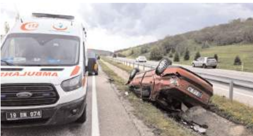
Kaza Çorum-Sungurlu kara yolunun 40. kilometresinde meydana geldi.