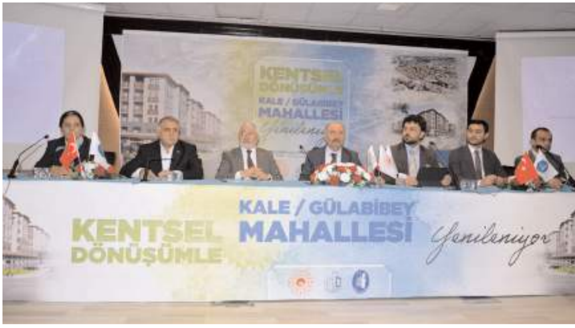
Kale ve Gülabibey Mahallesi sakinlerine birinci etap kentsel dönüşüm projesi hakkında bilgi verildi.