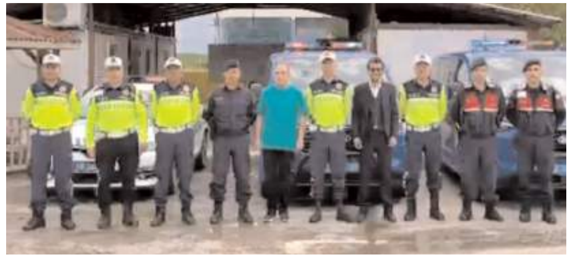
Programın anısına toplu fotoğraf çekildi.

"150 AFAD gönüllümüz, iyi günde, kötü günde bizimle birlikte olan gönüllülerimiz, gece gündüz demeden bizimle birlikte olduklarını Havza'da da bize göstermiş oldu. Türk kadınının fedakarlığını buradaki çalışmalarda da görmüş olduk. Hepsine çok teşekkür ediyoruz. Onlar varken daha güçlüyüz. Sadece Samsun'dan değil, 6 farklı ilden bize sevk edilen gönüllülerimiz sahada yoğun şekilde çalışıyor. Buraya gelmek için yolda olan gönüllülerimiz de var. İnşallah selin yaralarını birkaç gün içerisinde gönüllülerimizle, kamu çalışanlarımız, askerlerimiz, sivil toplum kuruluşu üyeleriyle sarmaya gayret edeceğiz."(AA)