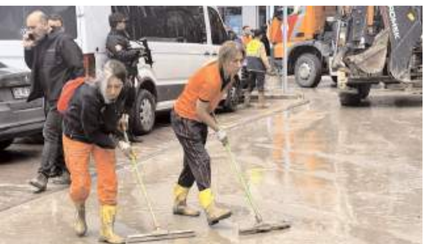
Çorum'dan giden gönüllülerde temizlik çalışmalarına katılıyor.

çamur var. Alt katlar, yani depolar su altında. Elimizden ne gelirse yapmaya gayret ediyoruz." dedi.