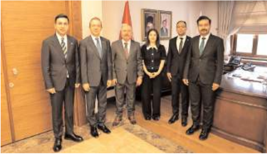
Ziyaretin anısına toplu fotoğraf çekildi.