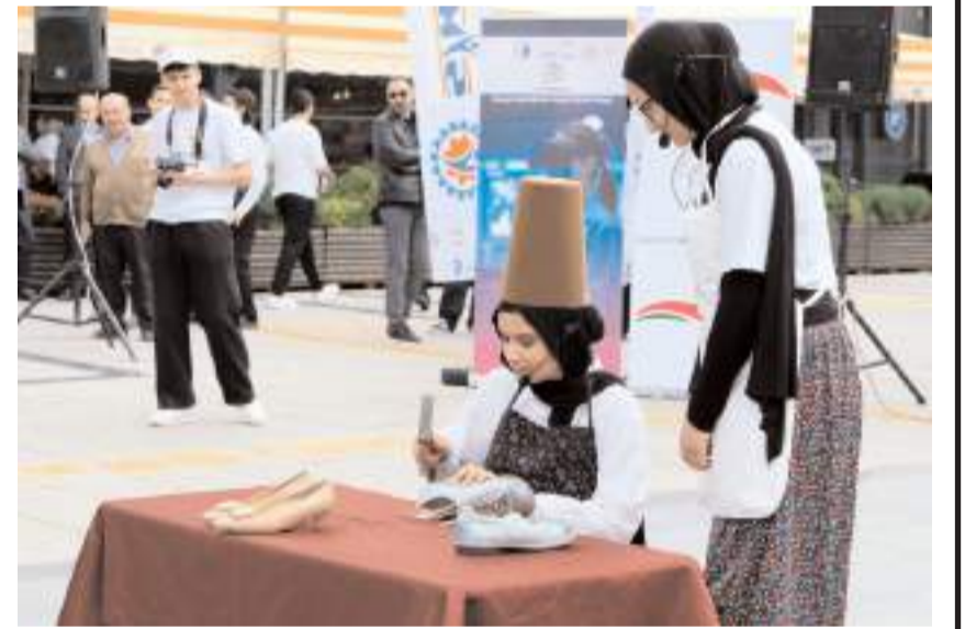
Kız Mesleki ve Teknik Anadolu Lisesi öğrencileri "Ahilik pabuç atma" dramasını sahnelledi.