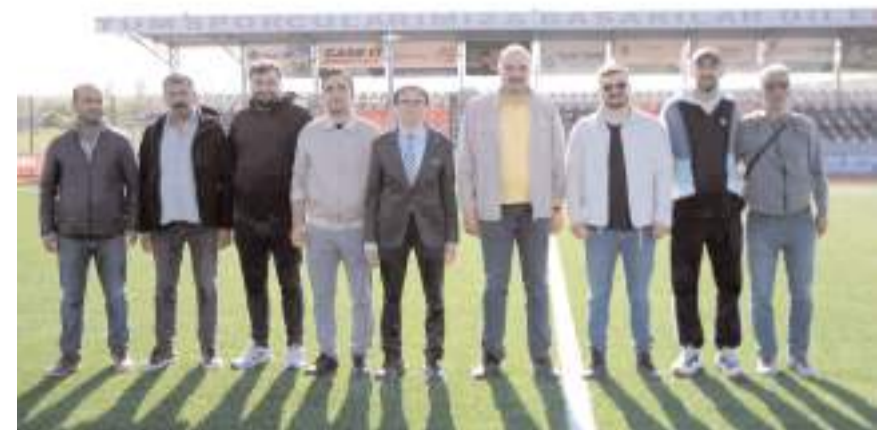
Alaca ilçe sahasında yapılan incelemeye katılırla toplu halde

Çorum Milletvekilleri Oğuzhan Kaya, Yusuf Ahlatcı ve Vahit Kayırcı'ya spor camiamıza verdikleri desteklerden dolayı teşekkür etti.