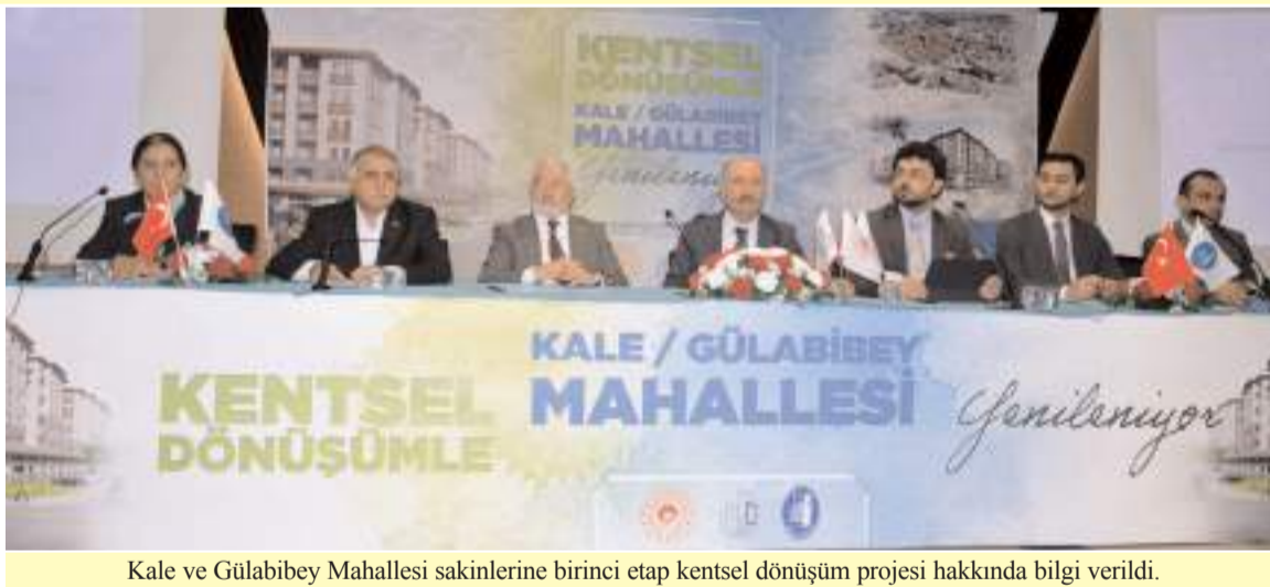
Kale ve Gülabibey Mahallesi sakinlerine birinci etap kentsel dönüşüm projesi hakkında bilgi verildi.