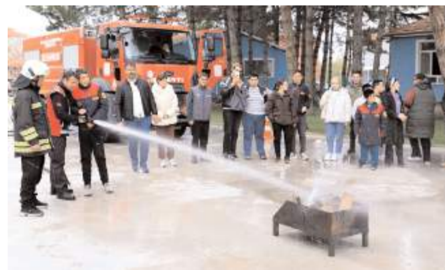
Gençler yangın söndüremeyi öğrendiler.

Etkinliğe katılan Belediye Başkanı Şerif Arslan ve Belediye Başkan Yardımcısı Oktay Yelkuvan da öğrencilerle yakından ilgilendi. İtfaiye aracına binip itfaiyecilik mesleği hakkında bilgiler alan öğrenciler doyusya öğrenme fırsatı buldu. Eğitimin sonunda öğrenciler itfaiye erleriyle hatıra fotoğrafları çektiler. (İHA)