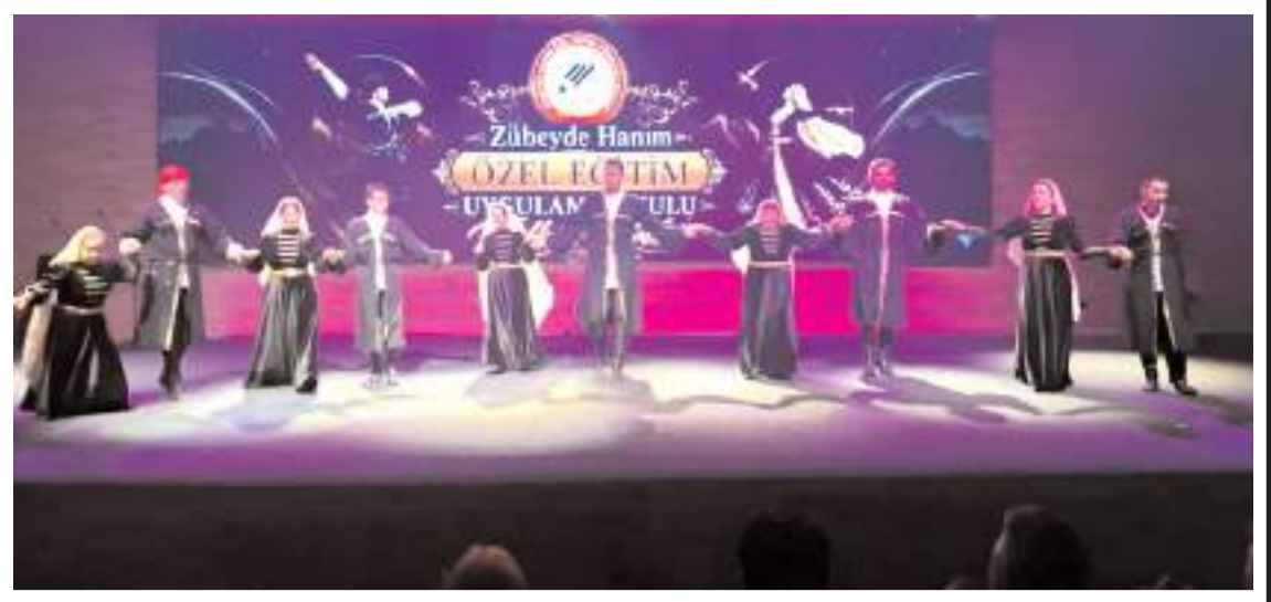
Öğrenciler halk oyunları gösterisi yaptı.

Yaralıların sağlık durumlarının iyi olduğu öğrenildi.(AA)