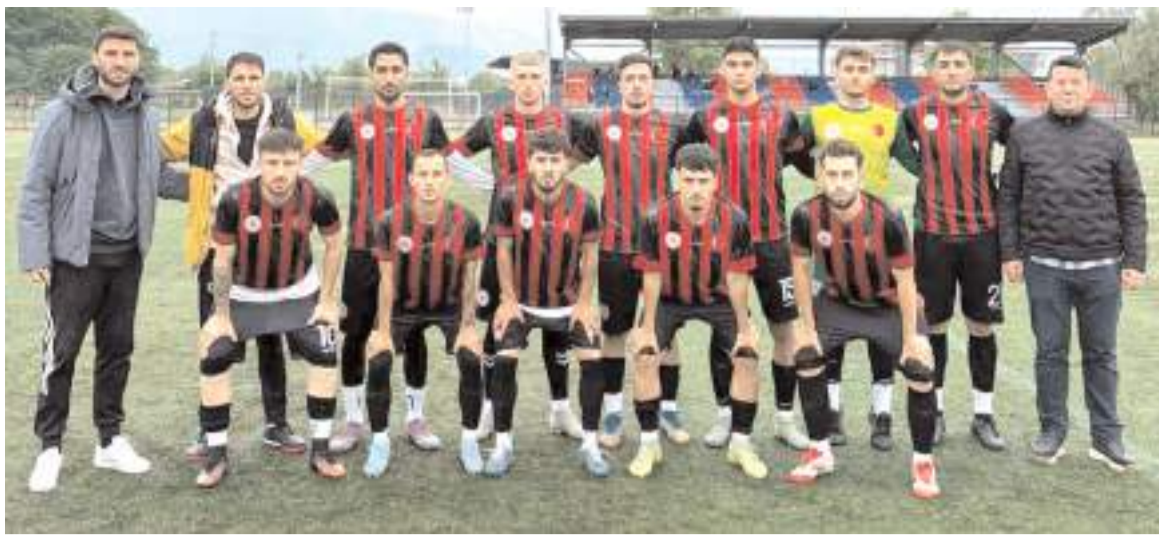
Çorum KYK futbol takımı İzmir'i 2-0 yenerek grup ikincisi olarak bugün Edirne ile final için karşılaşacak