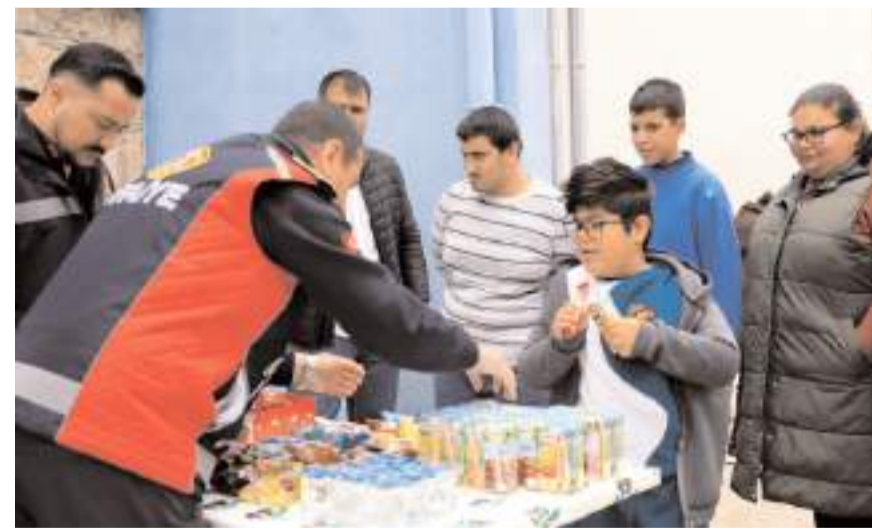
Gençlere ikramlarda bulunuldu.