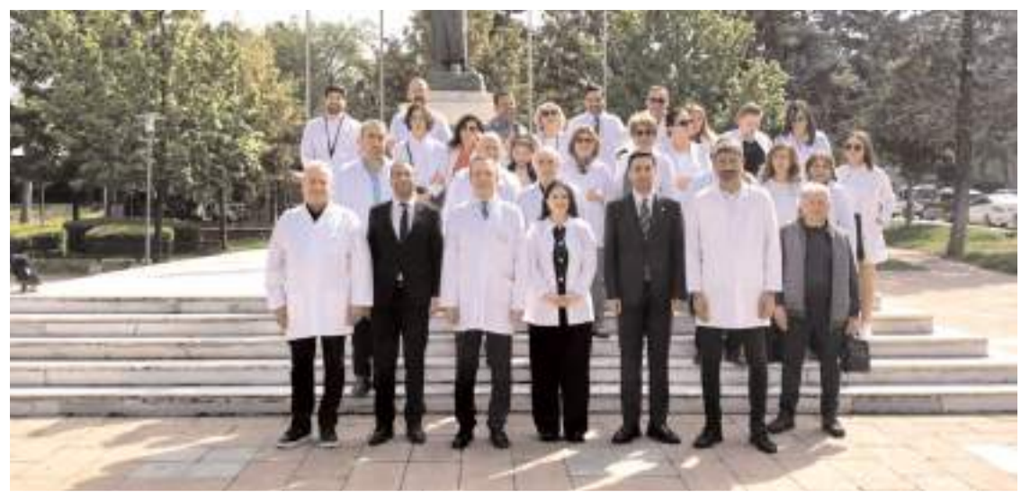
Programda hatıra fotoğrafı çekildi.

Resmi ilanlar: www.ilan.gov.tr 'de Basın no ILN02470746