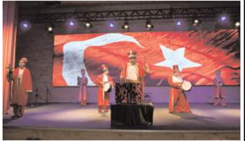
Mehter gösterisi ilgi çekti.