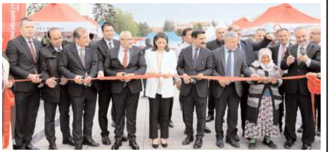
Fuar Kadeş Barış Meydanı'nda açıldı.

Açıklama kısmına vekalet sahibi adı, soyadı, telefon numarası ve yurt içi -yurt dışı - Filistin kurban vekaleti yazılmalıdır. (Haber Merkezi)