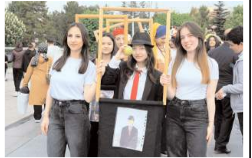
Fuara il merkezdeki 13 meslek lisesi ve mesleki eğitim merkezi katıldı.