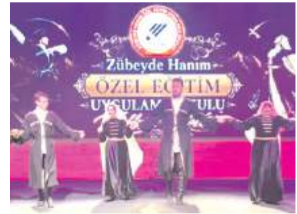
Öğrenciler halk oyunları gösterisi yaptı.