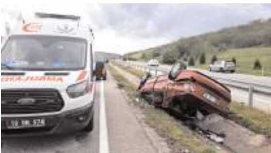
Kaza Çorum-Sungurlu kara yolunun 40. kilometresinde meydana geldi.