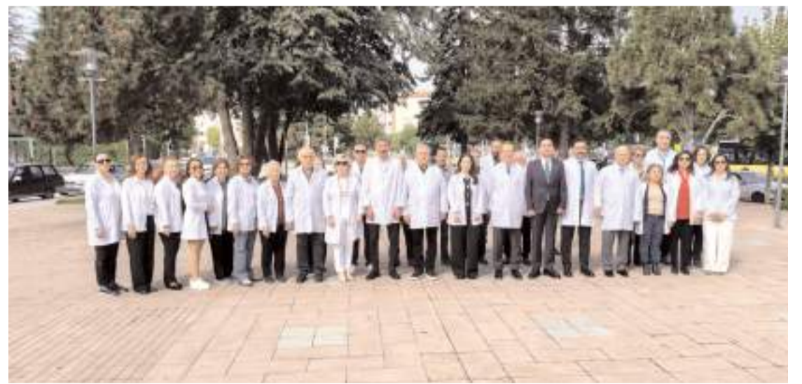
Bilimsel eczacılığın 187. yılı dolayısıyla Atatürk Anıtı'nda tören yapıldı.

Törenin ardından Eczacılar Odası'nda geleneksel pide-ayran ikramı yapıldı.