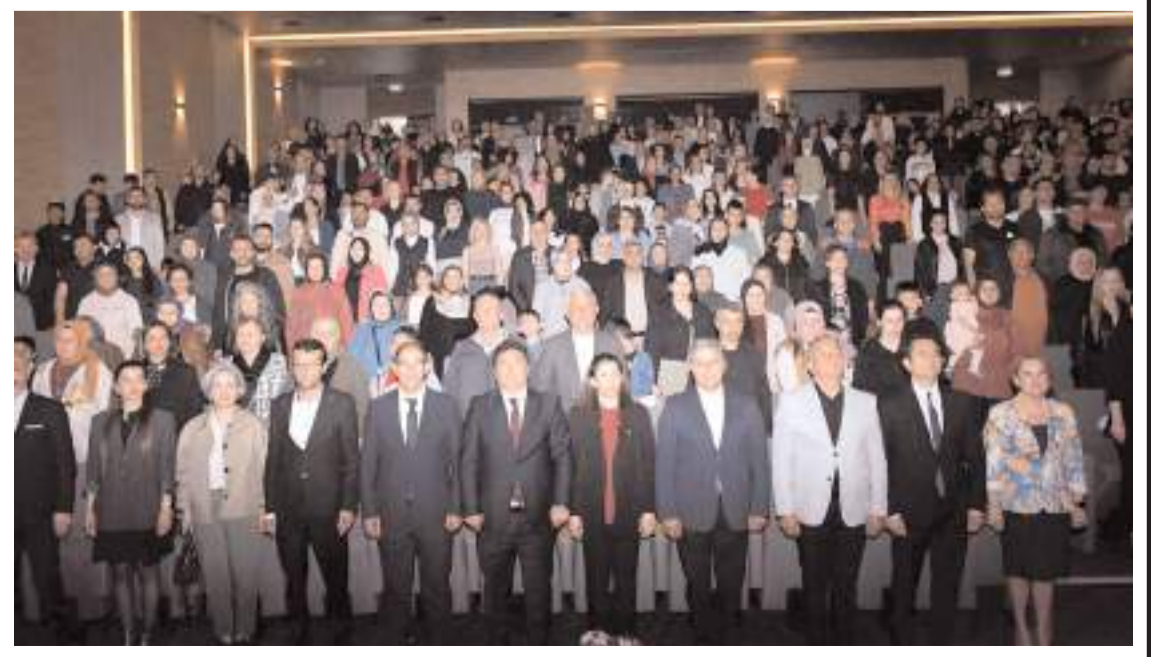
Programa ilgi yüksek oldu.

Vali Yardımcısı Yeliz Mercan, öğrencilerin ortaya koyduğu azim ve başarının büyük anlam taşıdığını belirterek emeği geçen öğrenci, öğretmen ve velilere teşekkür etti.