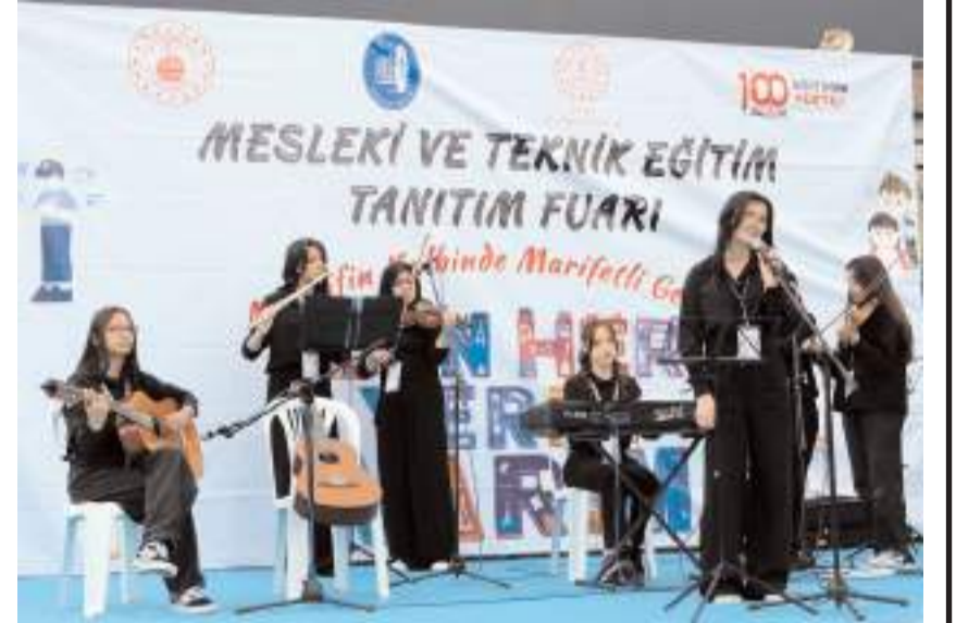
Güzel Sanatlar Lisesi öğrencileri müzik dinletisi sundu.