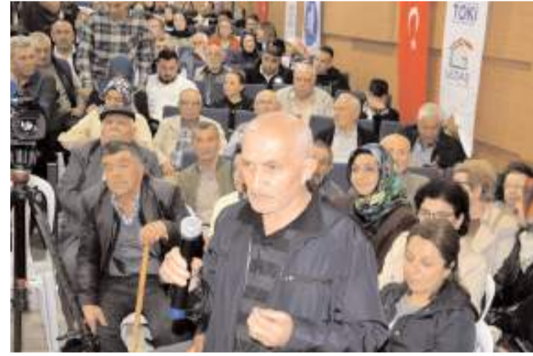
Vatandaşlar proje ile ilgili sorularını yetkililere iletiler.