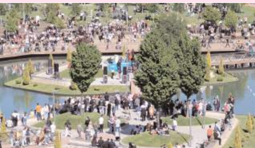
Festivale ilgi yüksek oldu.