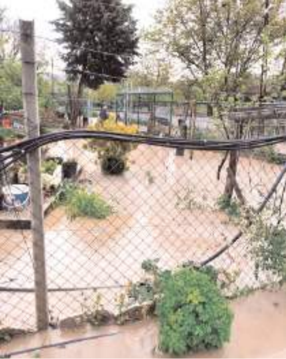
Merkeze bağlı bazı köylerde ve kırsal bölgelerde etkisini artıran yağmur nedeniyle ekili alanlar su altında kaldı.