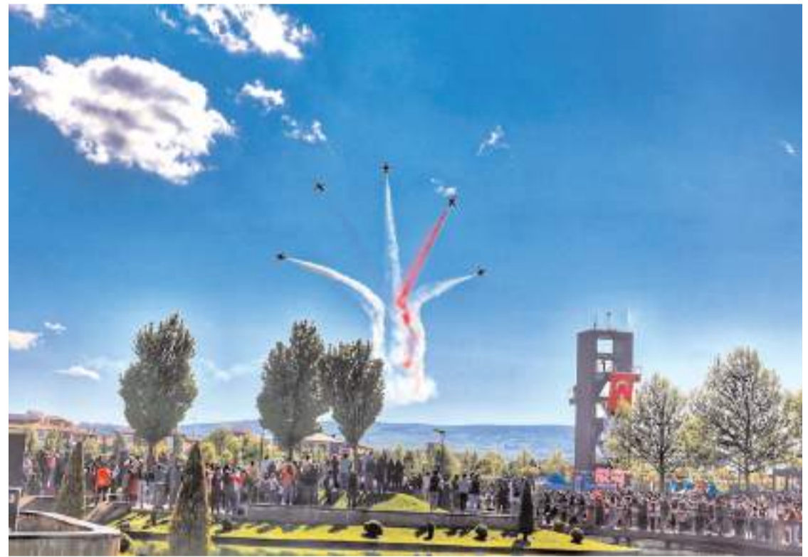
Vatandaşlar uçakların manevralarını cep telefonlarıyla görüntüledi.