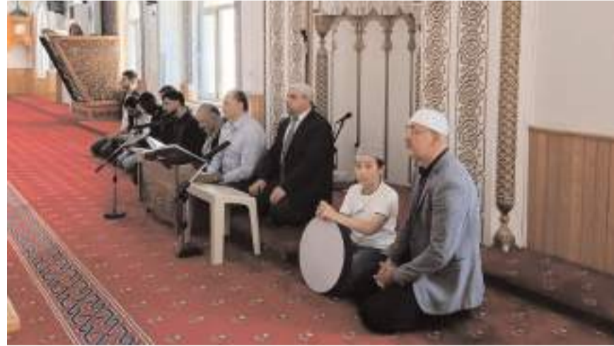
Buluşmada ilahiler seslendirildi.