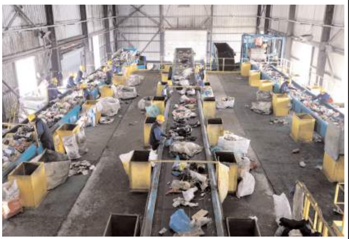
Tesise gelen atıklar ilk olarak ayrıştırılıyor.