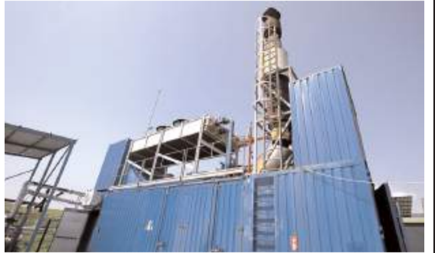
Tesis 2,8 megavat kurulu güce sahip.