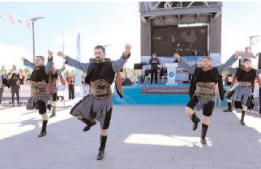
Festivalde halk oyunları gösterisi yapıldı.