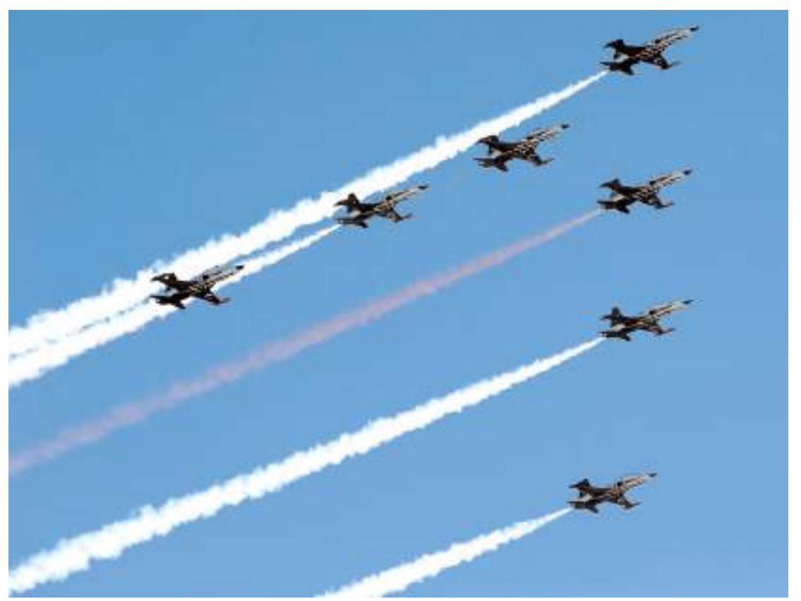
Türk Yıldızları'nın gösterisi büyük beğeni topladı.

Etkinliğe katılan vatandaşlar ayrıca, 19 Mayıs Atatürk'ü Anma, Gençlik ve Spor Bayramı kutlamaları kapsamında düzenlenen Türk Hava Kuvvetlerinin akrobasi timi Türk Yıldızları'nın gösterisini izledi.(AA)