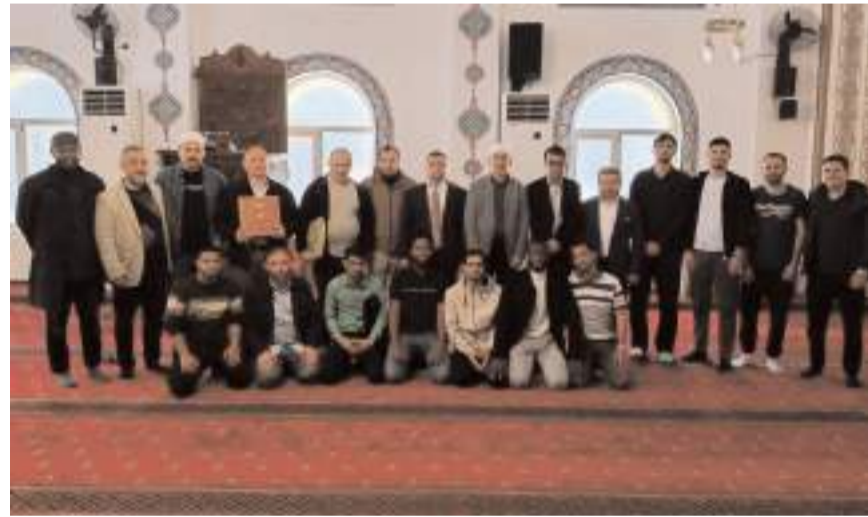
Programda Çorum'da eğitim gören farklı ülkelerden üniversite öğrencileri ile görme engelli bireyler buluştu.