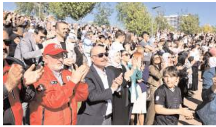
Gösteriyi protokol üyeleri de izledi.