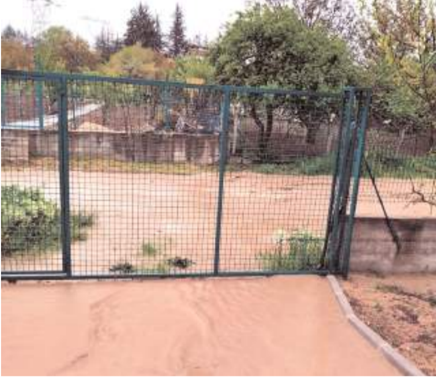
Yağışın ardından bağ ve bahçelerde su birikintileri oluştu.