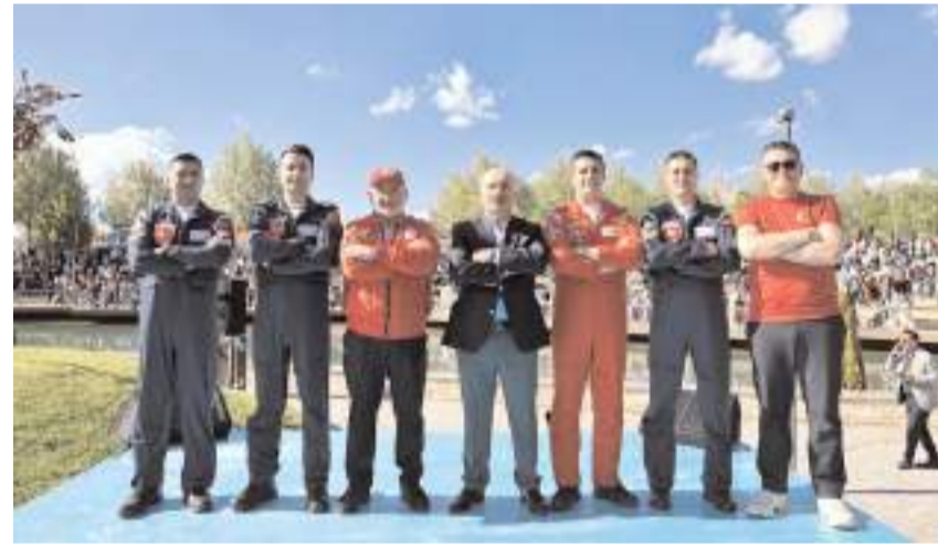
Gösteri ekibi ve protokol üyeleri hatıra fotoğrafı çekindi.