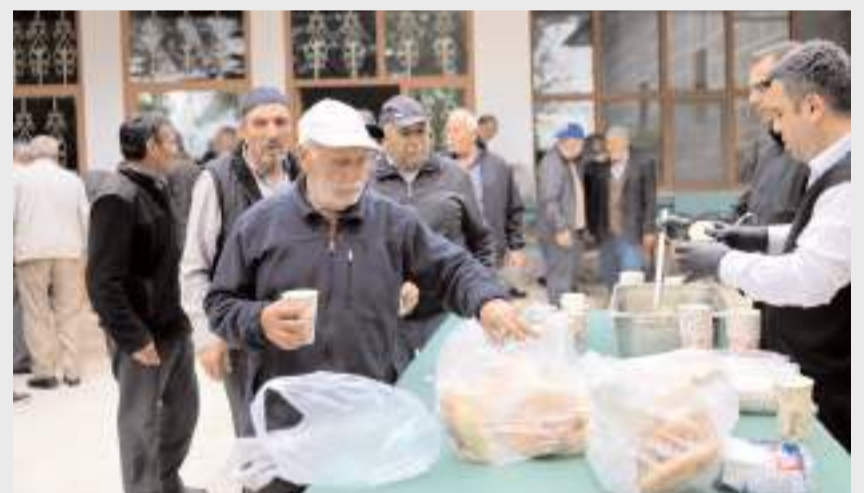
Evleri zarar gören vatandaşların beslenme ihtiyacını karşılamak amacıyla üç öğün sıcak yemek hizmeti veriliyor.