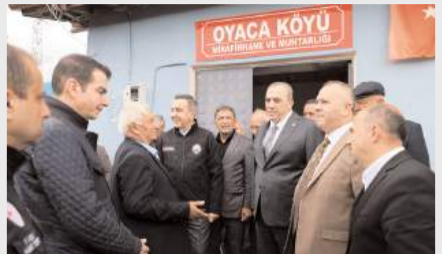
Protokol üyeleri köylerde inceleme de bulundu.

Oyaca köyünde hortumun neden olduğu yıkım ve ekiplerin çalışmaları dronla havadan görüntüledi. Görüntülerde hortumun neden olduğu yı-