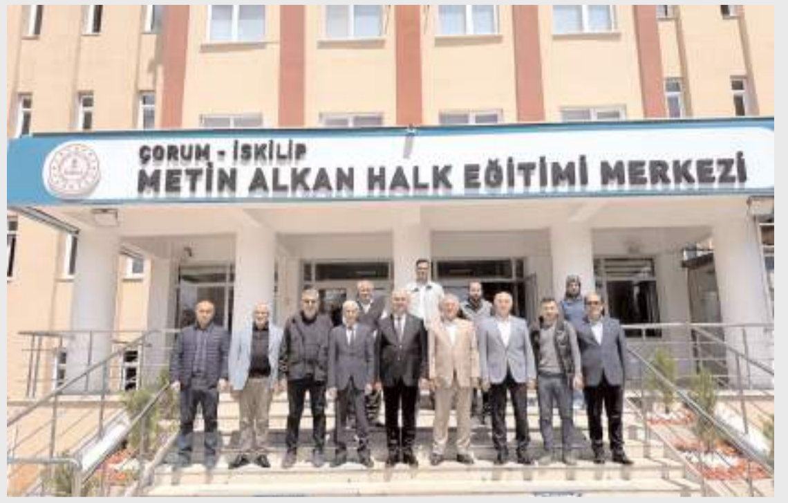
Ziyaretin anısına toplu fotoğrafı çekildi.

Şahin, "Çözüm Peygamberimizin (s.a.v.) güzel ahlakıdır, navigasyon onun yoludur. Bu yarışma vesilesiyle bu yıl Çorum'da 2 bine yakın öğrencimize kitap ulaştırdık ve sınavlarını gerçekleştirdik. İnşallah sadece bununla yetinmeyip düzenleyeceğimiz sosyal, sportif ve kültürel faaliyetlerle gençlerle buluşmalarımıza devam edeceğiz" dedi.