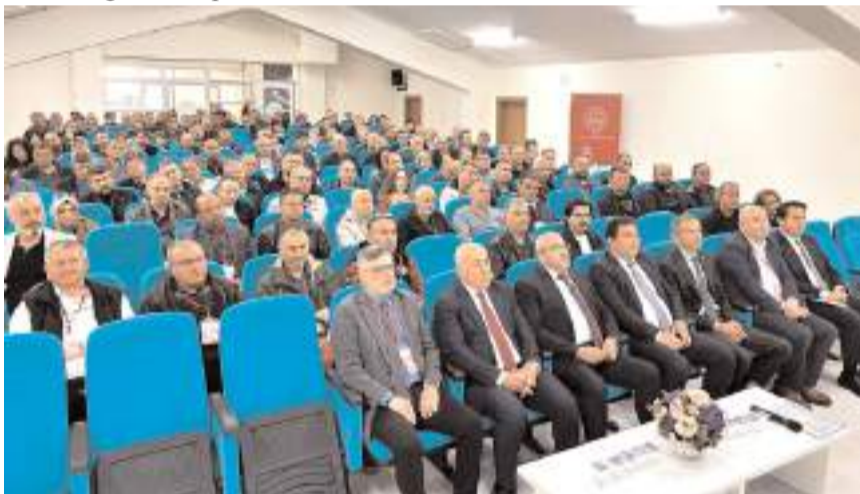
Program Çorum Belediyesi Prof. Dr. Hayrettin Karaman Anadolu İmam Hatip Lisesi'nde yapıldı.

Eğitimlerde Hitit Üniversitesi'nde görev yapan akademisyenlerin yanı sıra İl Millî Eğitim Müdürlüğü Eğitim Müfettişleri Başkanı, il milli eğitim müdür yardımcısı, şube müdürleri ve iş sağlığı ve güvenliği uzmanı da görev alıyor.