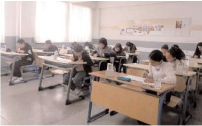
Yarışma yoğun katılımıyla gerçekleştirildi.