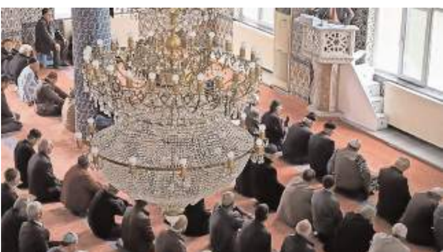
Mahir Odabaşı "Kazalar ve Korunma" konusunda cami cemaatine bilgi verdi.