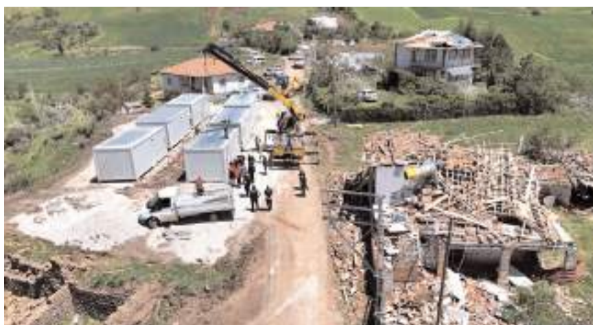
Köy sakinleri evlerde meydana gelen hasar nedeniyle barınma sorunu yaşıyordu.

si'ne bağlı ekipler, afetin meydana geldiği ilk andan itibaren sahada özveriyle görev yapmaktadır.