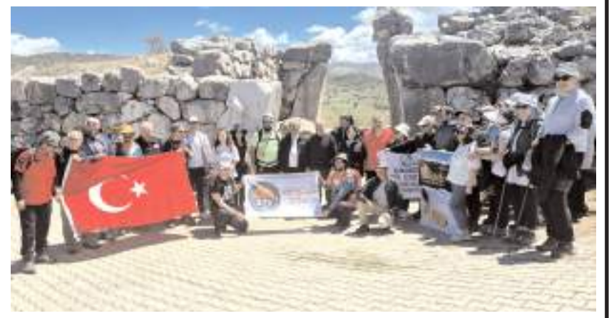
Hattuşa Antik Kentinde toplu hatıra fotoğrafı çekildi.

Yoğun yağış sonrası bazı bahçelerde toprak kaymaları meydana gelirken, sebze ve meyve üreticileri büyük zarar gördü. Yağışın ardından bağ ve bahçelerde su birikintileri oluşurken, üreticiler ürünlerinde ciddi kayıp yaşadığını belirtti.