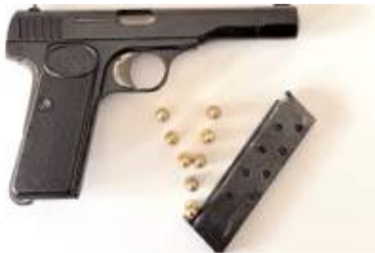
Aramalarda 5 adet silah ele geçirildi.