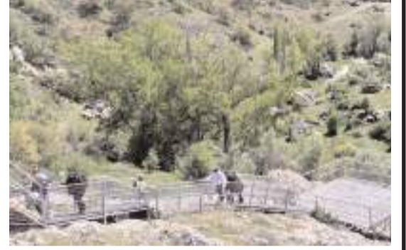
Hitit Yürüyüş Yolu'nda 4 gün sürecek.

İlkbaharın renkleriyle süslenen Budaközü Vadisi'ni yürüyüşçü