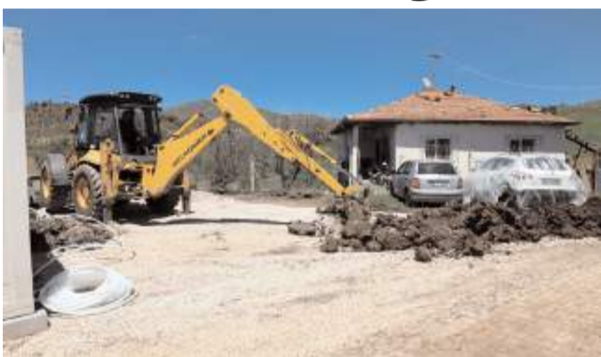
Zarar gören köylerde enkaz kaldırma ve altyapı çalışmaları sürüyor.