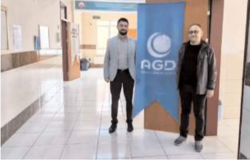
Siyer-i Nebi Yarışması Çorum merkez ve ilçelerinde yapıldı.