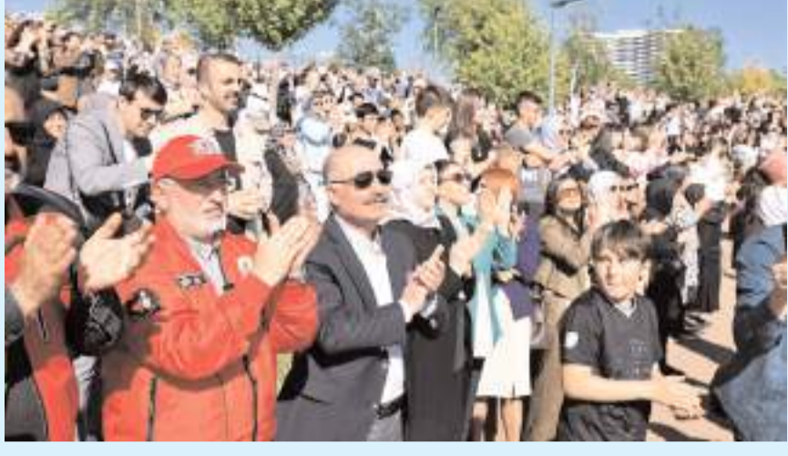
Gösteriyi protokol üyeleri de izledi.

■ Türk Hava Kuvvetlerinin akrobasi timi Türk Yıldızları, Çorum'da gösteri uçuşu gerçekleştirdi. Millet Bahçesi semalarında yapılan gösteri vatandaşlarda n ilgi gördü.