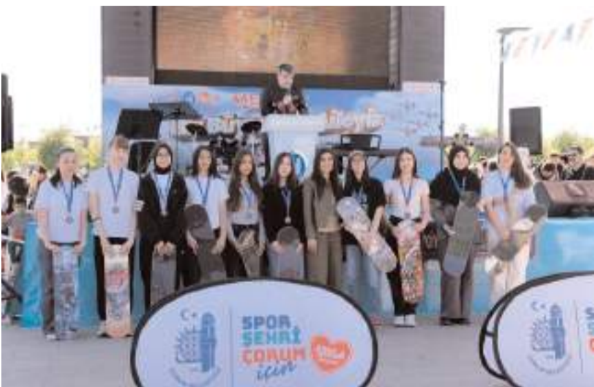
Festivalde çeşitli yarışmalar yapıldı.