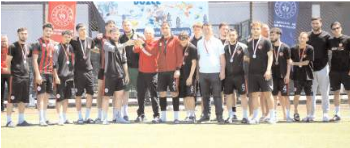
Çorum Yurt Lig futbol takımı finale yükselmesinin ardından takım olarak bu sevinci yaşadılar hedef şampiyonluk

Bu maçın rövanşı 23 Mayıs cumartesi günü saat 19'da Tofaş Spor Salonunda oynanacak. Temsilcimiz bu maçı kazanması veya 16 sayı farklı bile yenilmesi durumunda dört takımın mücadele edeceği Türkiye finallerinde oynamaya hak kazanacak.