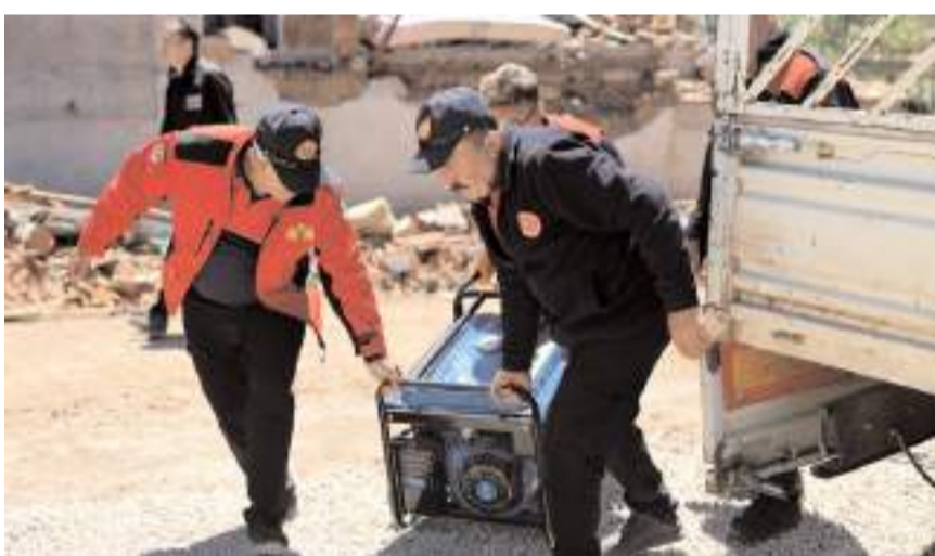
Köylerde enerji sorununun çözümü için jeneratörler getirildi.

ca afetten etkilenen vatandaşlara Sungurlu Kaymakamlığı Sosyal Yardımlaşma ve Dayanışma Vakfı ile Sungurlu Öğretmenevi Müdürlüğünce günlük üç öğün sıcak yemek hizmeti verildiği kaydedildi.