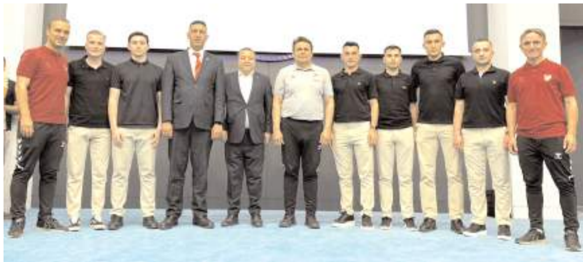
Çorum Bölgesel Hakem adayları ve gözlemcileri MHK ve Bölgesel Kurul üyeleri sınav sonrası birlikte

Çorum futbol hakemliği yıllar sonra ilk kez geçen sezon Klasman ve klasman yardımcı hakemi bölgesel ve bölgesel yardımcı hakemi olmadan tamamlandı.