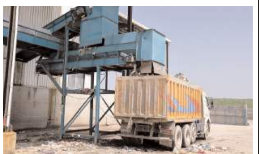
Kalan çürüme özelliğine sahip organik ürünler Biyokütle Enerji Santrali'ne taşınıyor.

nin yıllık elektrik ihtiyacına denk gelmektedir." dedi.