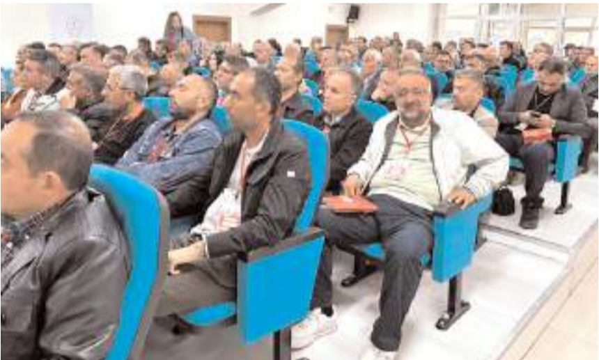
Program Çorum Belediyesi Prof. Dr. Hayrettin Karaman Anadolu İmam Hatip Lisesi'nde yapıldı.