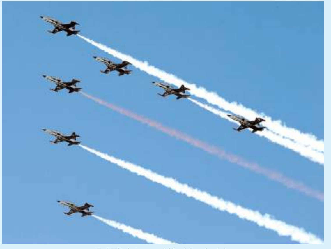
Türk Yıldızları'nın gösterisi büyük beğeni topladı.