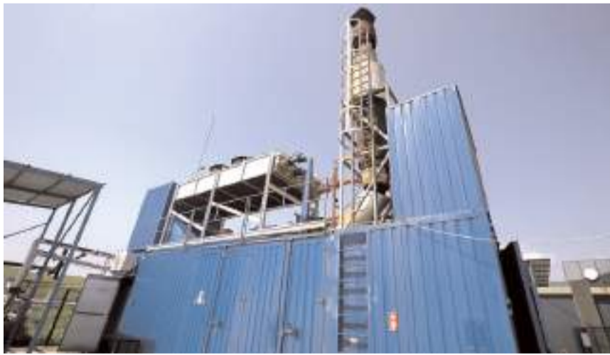
Tesis 2,8 megavat kurulu güce sahip.

■ Çorum'da toplanan çöplerden ayrıştırılan 400 ton organik atık, Biyokütle Enerji Santrali'nde elektrik enerjisine dönüştürülerek 5 yılda 5 milyon 250 bin kilovat elektrik üretimi gerçekleştirildi.