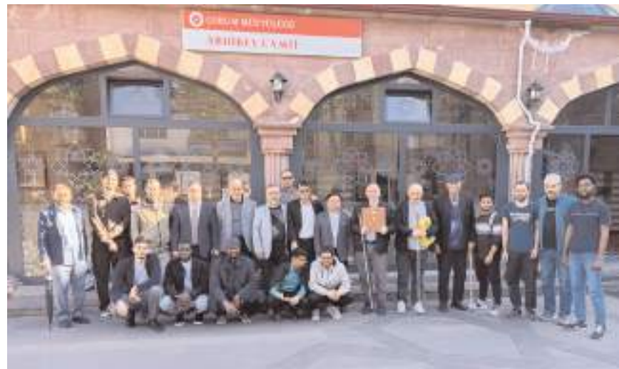
Programın sonunda hatıra fotoğrafı çekildi.