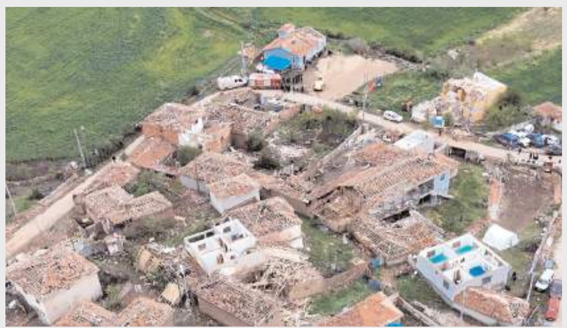
Hortum, Oyaca ve Kavşut köylerinde büyük hasara neden oldu.