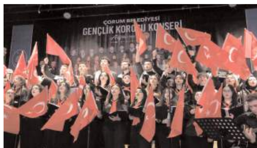
Konser Çorum TSO Konferans Salonu'nda yapılacak.

Gençlik Konseri'ne tüm Çorum halkı davet edildi.(İHA)