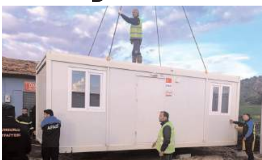
Oyaca ve Kavşut köylerinde meydana gelen hortumun ardından konteynerler kuruluyor.

Öte yandan zarar gören köy yollarında ulaşımın yeniden sağlanması, çamur birikintilerinin temizlenmesi ve yolların açık hale getirilmesi amacıyla Sungurlu Belediyesi'ne ve Sungurlu İlçe Özel İdare-