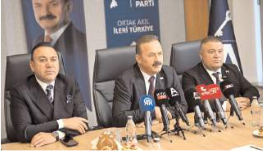
Anahtar Parti Genel Başkanı Yavuz Ağralıoğlu, ülke gündemini değerlendirdi.

zi ayağa kaldıracacağız. Memleketi, milleti ayağa kaldırmak için partiden daha fazla mesuliyet taşıyacağız. Particilikten daha ciddi bir siyasi sorumluluğu Türk milleti için imkana çevireceğiz. Bu iddiayla kurulduk. 1,5 yılı geçti kuruluşumuz. Çorum’a daha önce birkaç sefer daha geldik” ifadelerini kullandı.