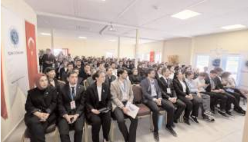
Çalıştaya katılım yüksek oldu.