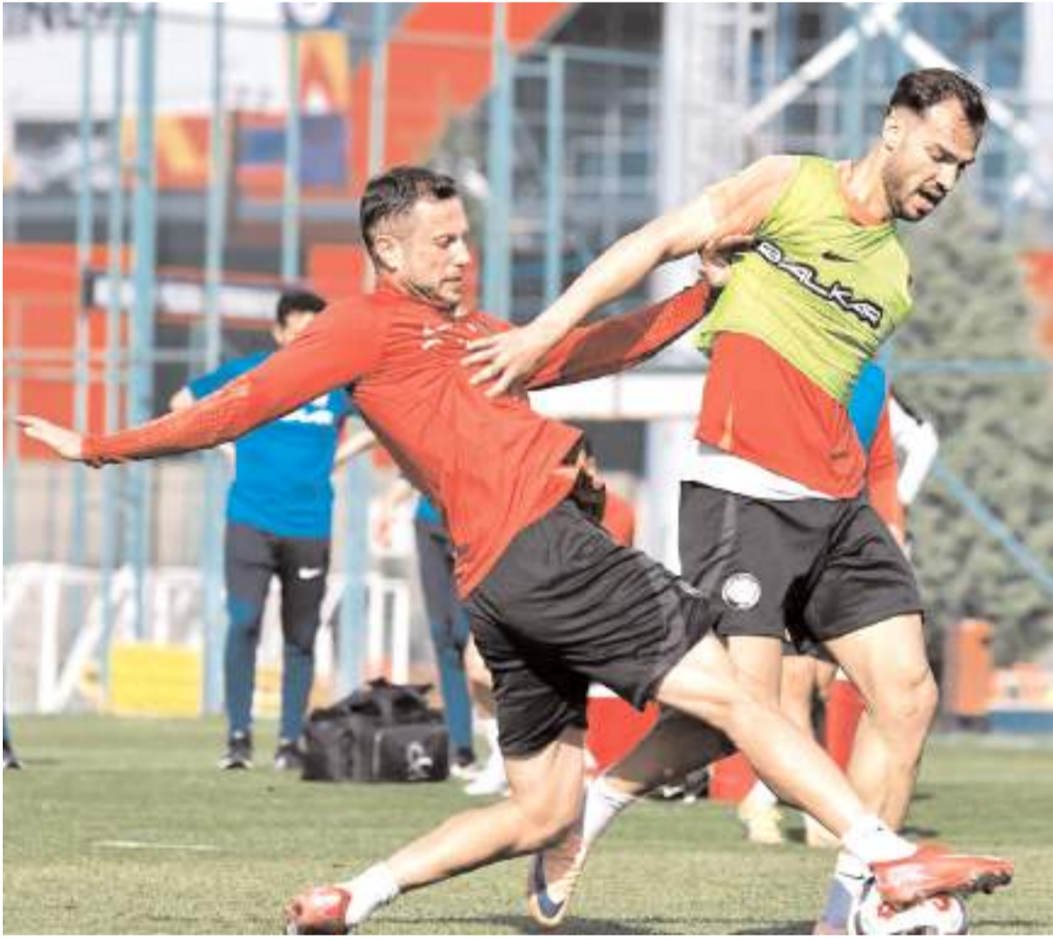
Arca Çorum FK Erokspor maçının hazırlıklarını dün yaptığı taktik çalışma ile sürdürdü