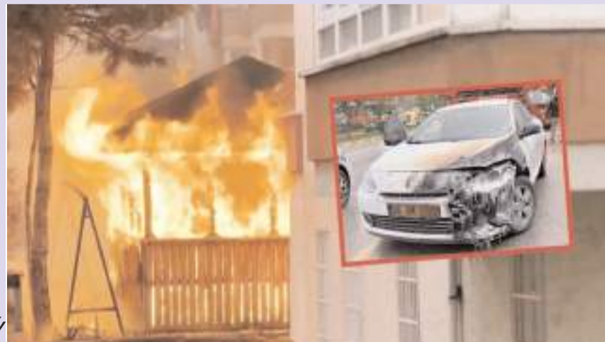
Olay Dr. İlhan Gürel Caddesi'nde bulunan bir apartmanın bahçesinde meydana geldi.

■ Çorum'da bir apartmanın bahçesinde bulunan kameriyede çıkan yangında minibüs ile otomobil zarar gördü. * HABERİ'10'DA