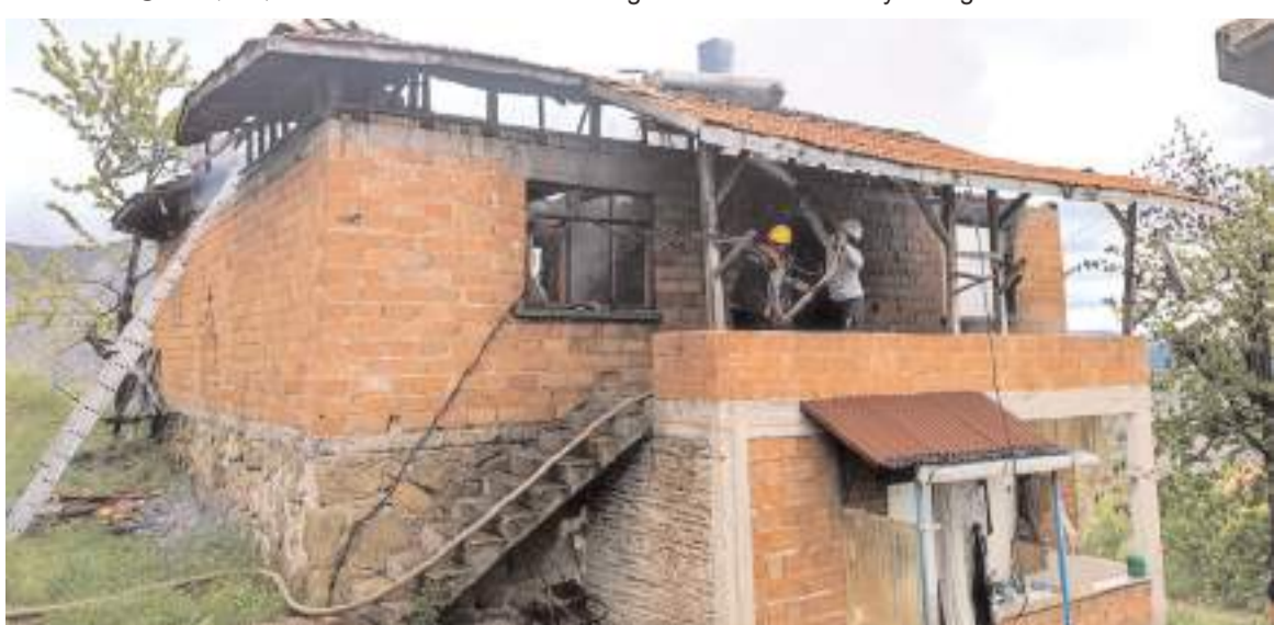
Yangın çevrede bulunan yapılara sıçramadan söndürüldü.