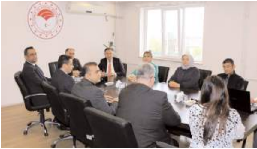
Toplantıda 2027-2029 yıllarını kapsayan Bitkisel Üretim Planlaması için yapılacak çalışmalar ele alındı.