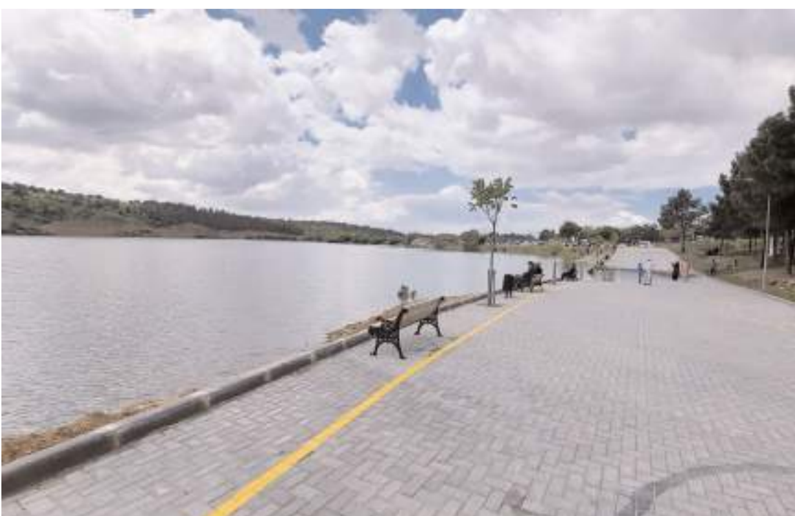
Su seviyesi yükselmeye rağmen vatandaşlar tatil fırsatı bilerek piknik yaptılar.

Hava koşullarına bağlı olarak barajdaki su seviyesinin önümüzdeki günlerde artış göstermesi bekleniyor.