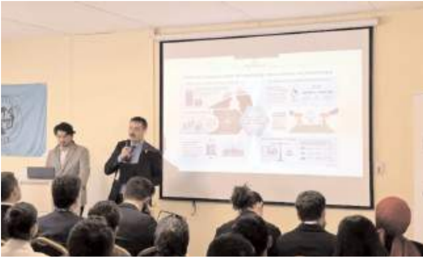
Gençlik çalıştayına Türkiye'nin dört bir yerinden gençler katıldı.