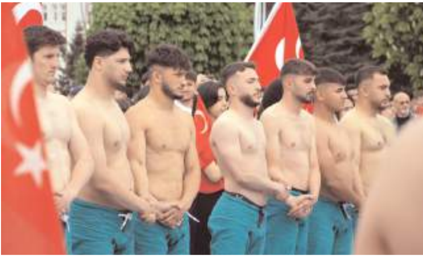
Programda sportif gösteriler yapıldı.