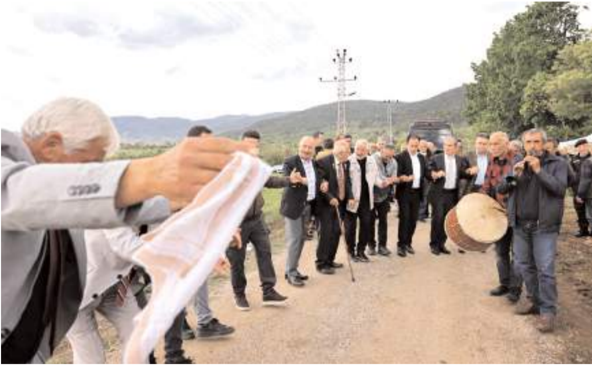
Protokol üyeleri köy halkı ile halay çekti.