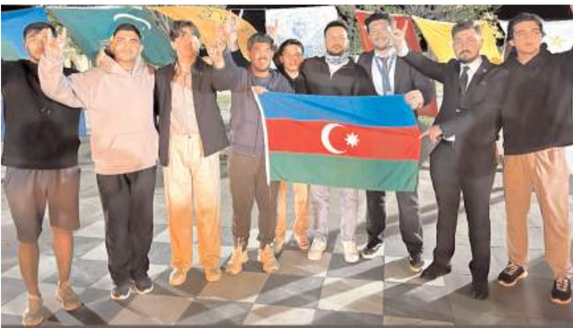
Çalıştaya Çorum Türk Ocaklarını temsilen gençlerde katıldı.

Türk Ocakları Genel Merkezi tarafından düzenlenen gençlik çalıştayına Çorum'dan da katılım oldu.