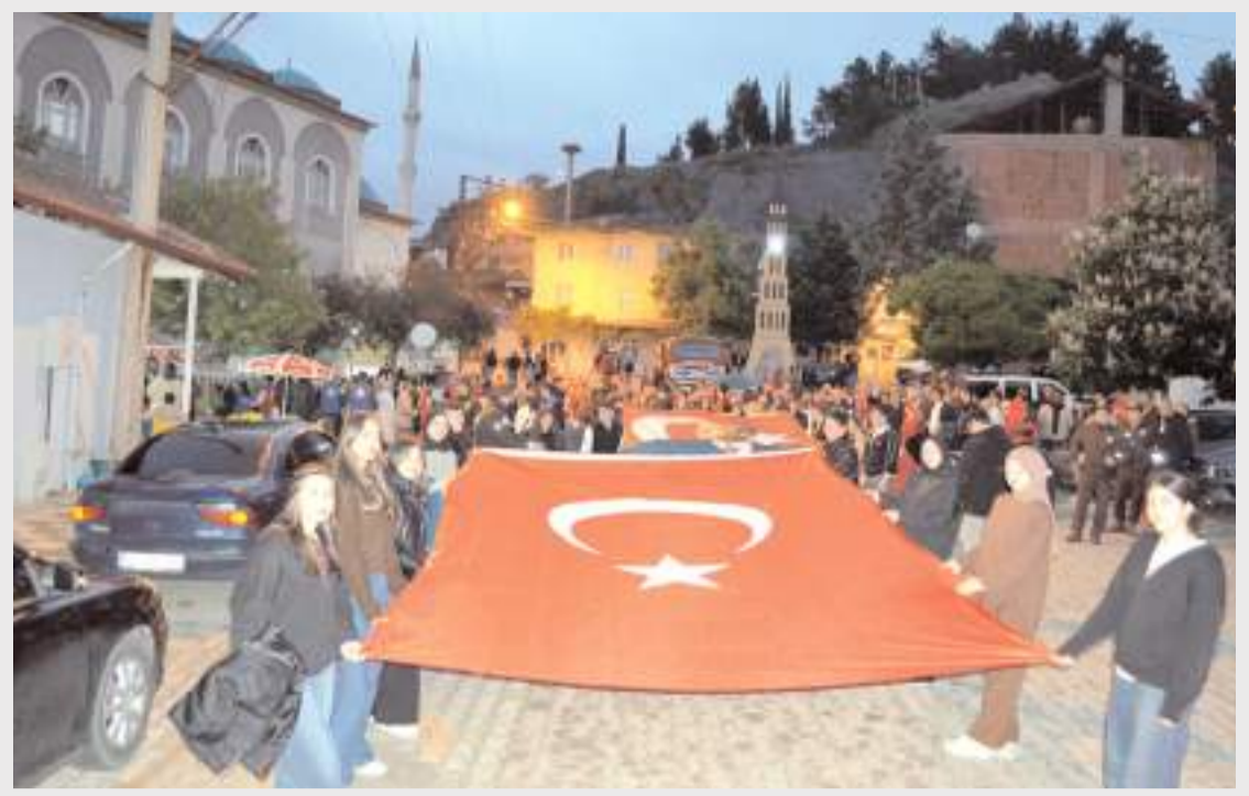
19 Mayıs Atatürk'ü Anma, Gençlik ve Spor Bayramı etkinlikleri kapsamında Dodurga ilçesinde fener alayı gerçekleştirildi.