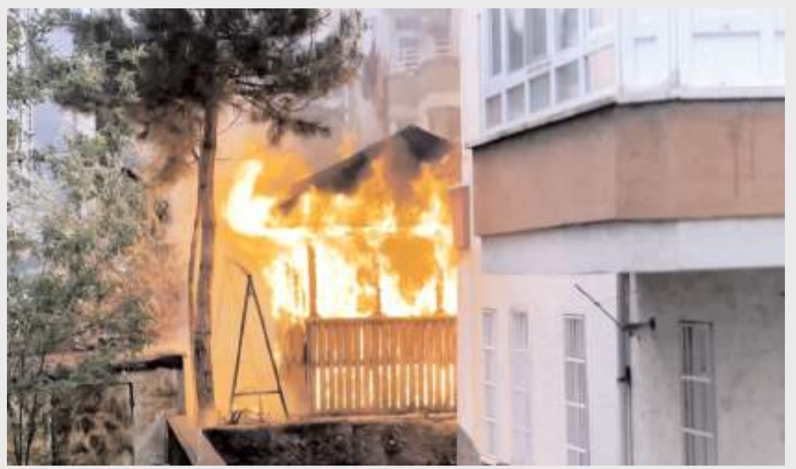
Olay Dr. İlhan Gürel Caddesi'nde bulunan bir apartmanın bahçesinde meydana geldi.