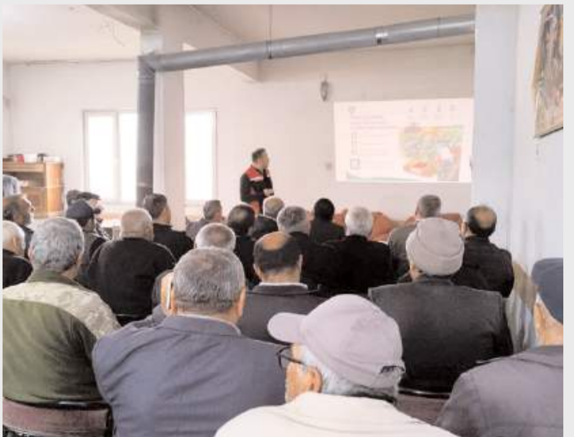
Toplantıda çeltik yetiştiriciliği konularında bilgilendirme yapıldı.

mevzuata uygun üretim süreçlerini desteklemek ve hayvancılıkta verimliliği artırarak buzağı kayıplarını azaltmak amaçlanıyor.