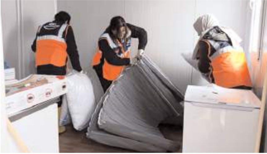
Hazırlanan yaşam alanları afetzedeye vatandaşların kullanımına sunuldu.

Çorum'un Sungurlu ilçesine bağlı Oyaca ve Kavşut köylerinde etkili olan fırtınanın ardından afetzedeye vatandaşlar için yaşam konteynerleri kuruldu.