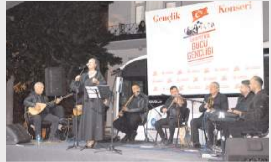
Çorum Belediyesi Türk Halk Müziği Korosu burada konser verdi.