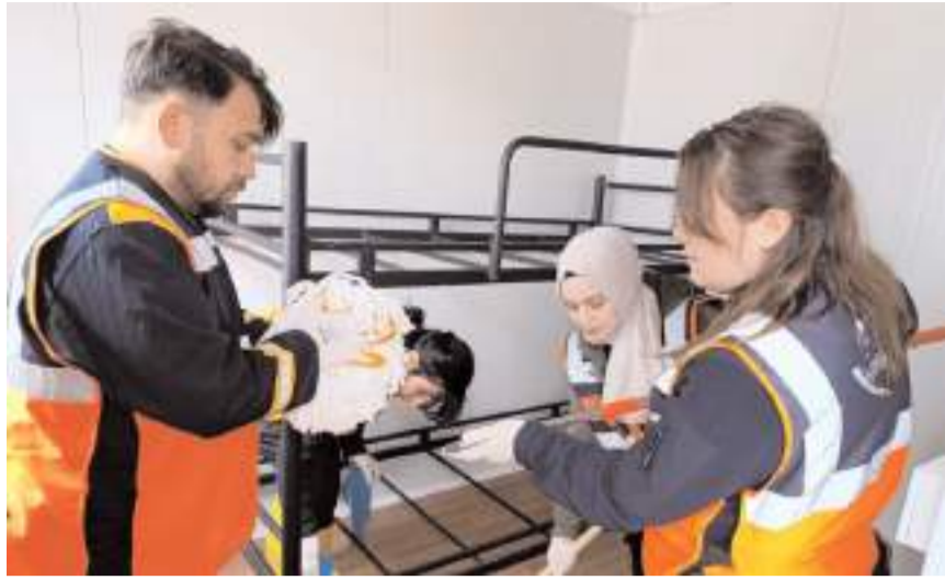
AFAD ekipleri ve gönüllüler tarafından konteynerlerin kurulmaları tamamlandı.