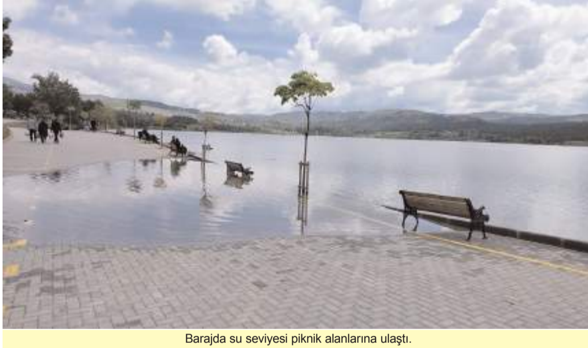
Barajda su seviyesi piknik alanlarına ulaştı.

■ Son günlerde etkili olan sağanak yağışların ardından Çorum Barajı'nda su seviyesi yükseldi. Doluluk oranının yüzde 100'e yaklaşmasıyla birlikte su baraj kenarındaki piknik alanlarına kadar geldi. * HABERİ'3'TE