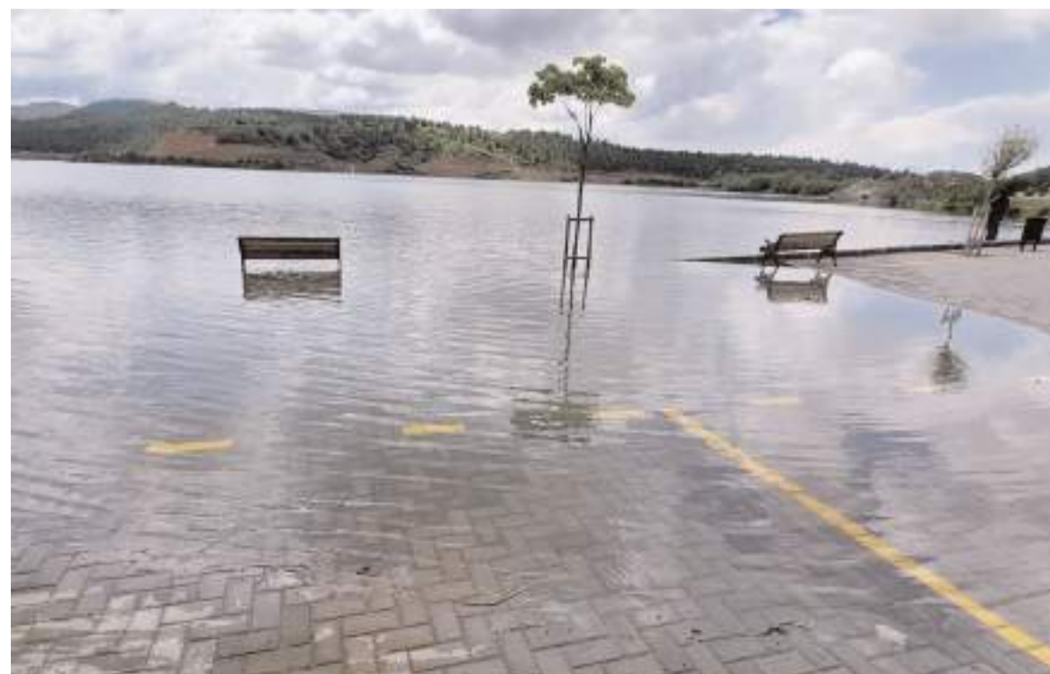
Bazı ağaçlar ve oturma grupları su içinde kaldı.