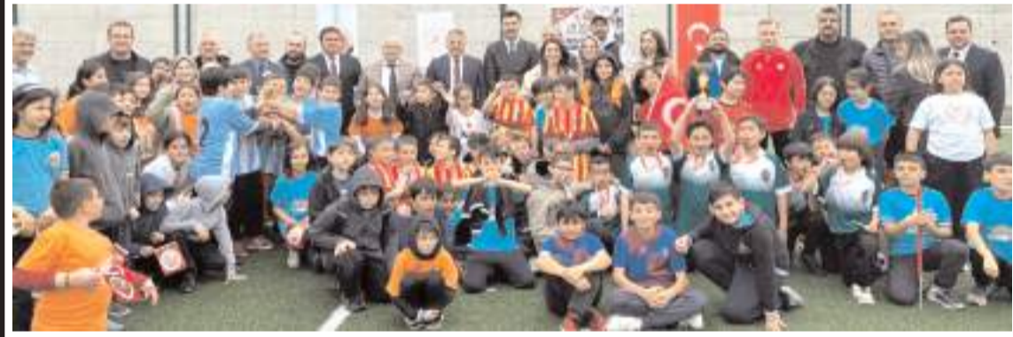
Kocatepe İlkokulunda düzenlenen final maçının ardından dereceye giren sporcular ve davetliler toplu halde

Müsabaka sonrasında İl Müdürü, öğrencilerin ve velilerin 19 Mayıs Atatürk'ü Anma, Gençlik ve Spor Bayramı'nı kutladı. Ardından İl Millî Eğitim Müdürü ile birlikte başarılı olan öğrencilere kupa ve madalyaları verildi.