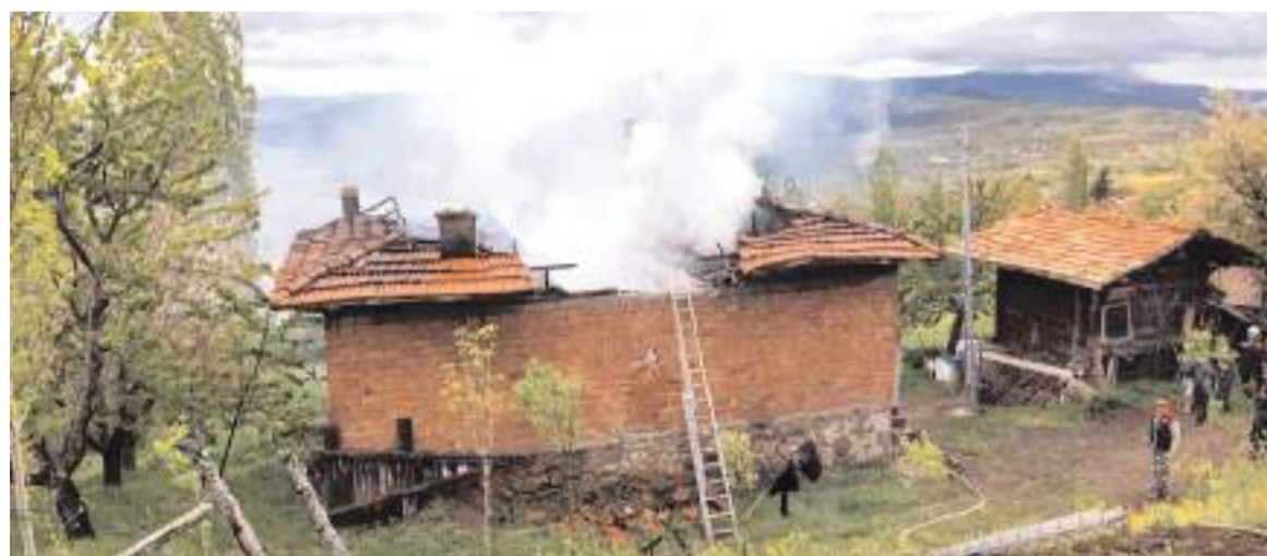
Olay Dikenli köyünde meydana geldi.

lanan olmazken, iki araçta maddi hasar meydana geldi. Kameriye ise kullanılamaz hale geldi.(AA)