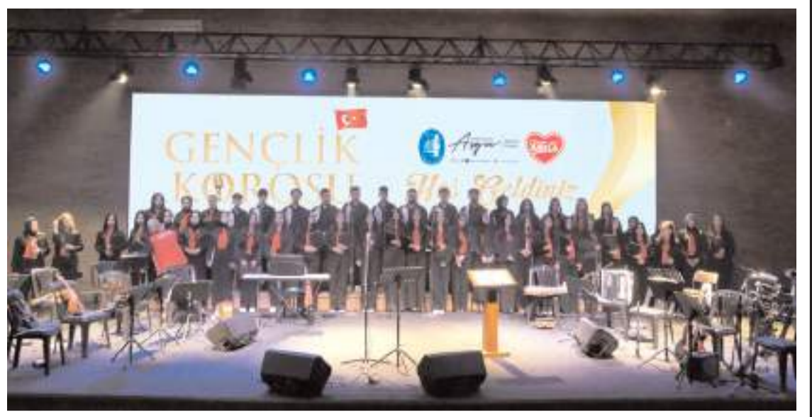
Konser Ticaret ve Sanayi Odası Konferans Salonunda yapıldı.