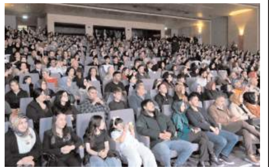
Konsere ilgi yüksek oldu.