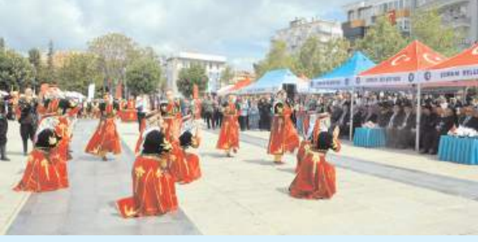
Kutlama programında halk oyunları gösterisi yapıldı.

■ 19 Mayıs Atatürk'ü Anma, Gençlik ve Spor Bayramı'nın 107. yılı nedeniyle Kadeş Barış Meydanı'nda düzenlenen gençlik şenliğinde coşku dolu anlar yaşandı. * HABERİ'4'TE