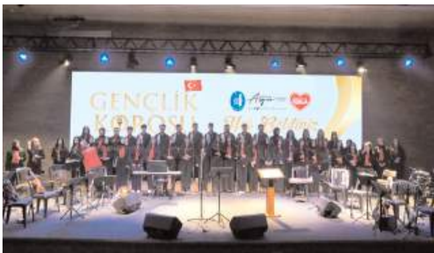
Konser Ticaret ve Sanayi Odası Konferans Salonunda yapıldı.

■ Çorum'da 19 Mayıs Atatürk'ü Anma, Gençlik ve Spor Bayramı kutlamaları kapsamında "Gençlik Korosu Konseri" düzenlendi. * HABERİ'5'TE