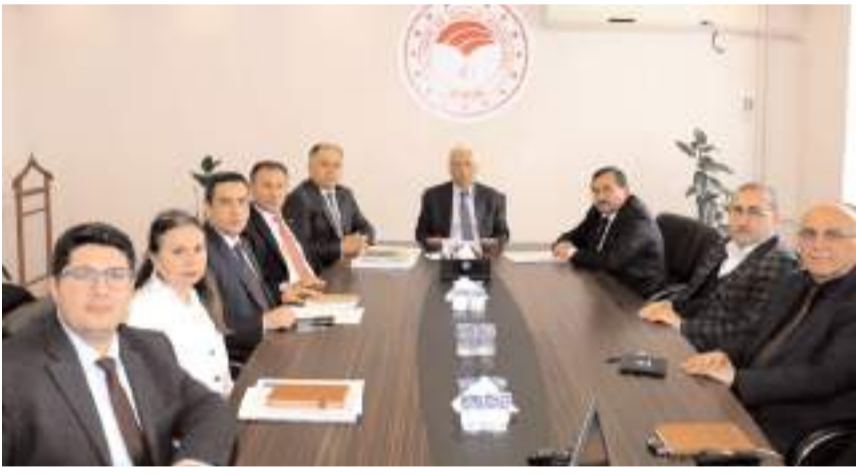
Toplantı Vali Yardımcısı Erdoğan Kanyılmaz'ın başkanlığında yapıldı.