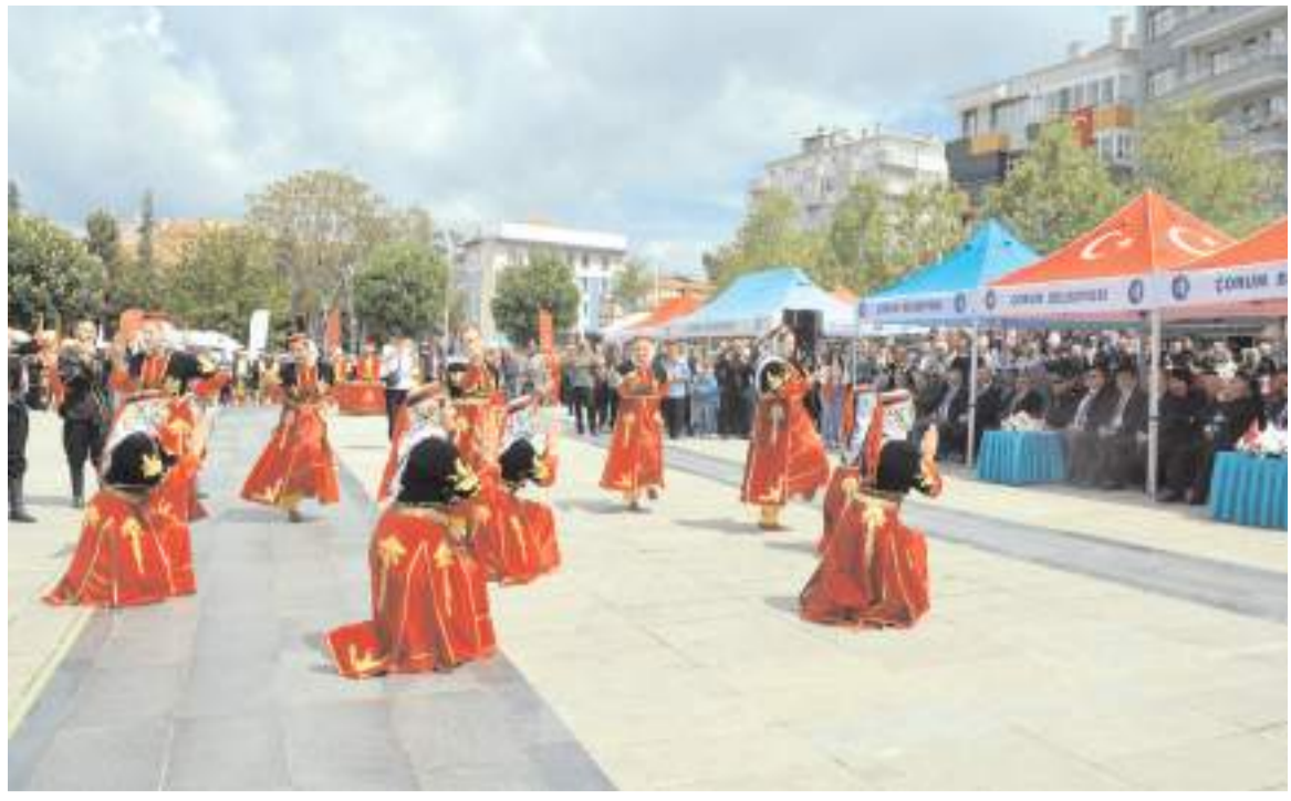
Kutlama programında halk oyunları gösterisi yapıldı.