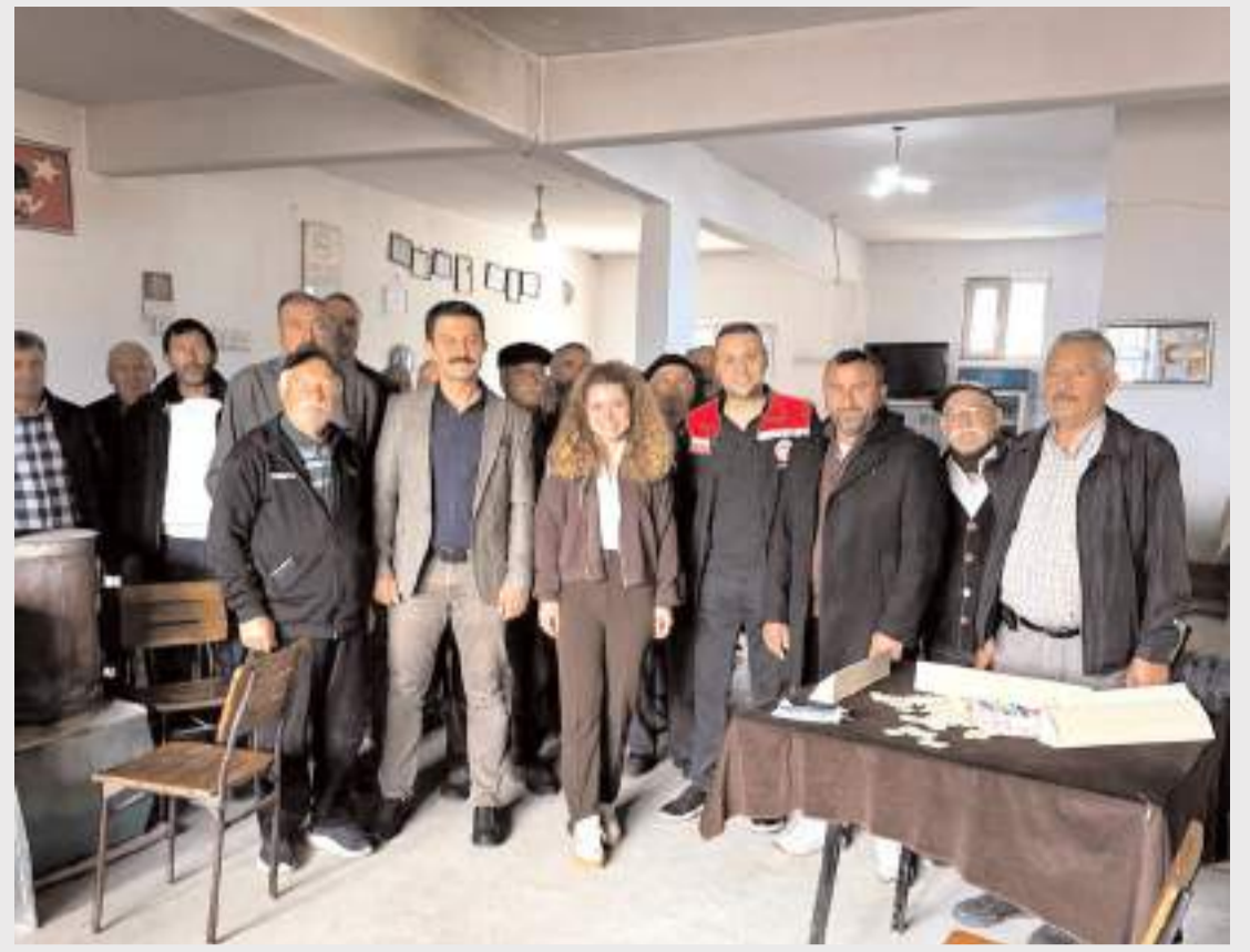
Toplantılarda B-Reçete uygulamaları, bitki koruma ürünlerinin bilinçli ve kontrollü kullanımı hakkında bilgiler verildi.

DEVREN SATILIK MEDİKAL 20 yıllık medikal şirketi satılıktır 0 532 524 45 90