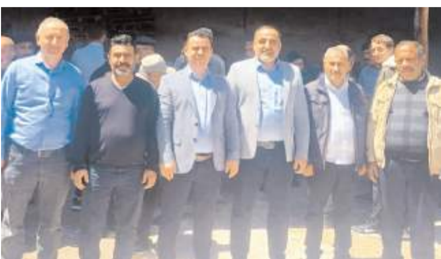
Yeniden Refah Partisi Çorum teşkilatı köy halkına kolaylıklar diledi.