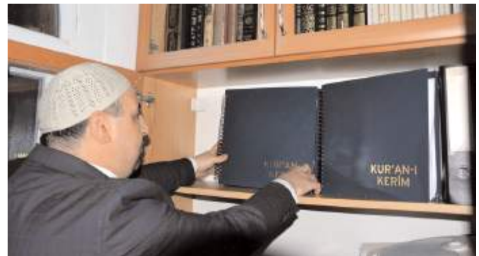
Çocukluk yıllarında gittiği camideki müezzinden etkilenen Duman, o günlerde kurduğu hayali yıllar sonra gerçeğe dönüştürdü.