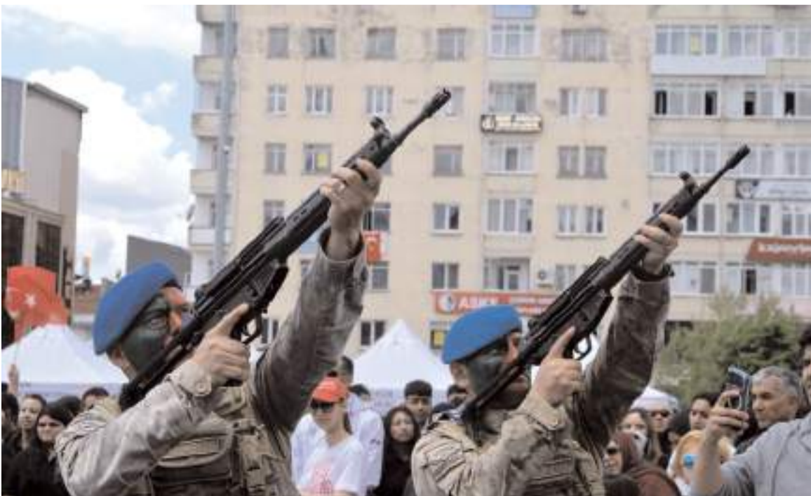
Komandoların gösterisi bol bol alkış aldı.

Tören Dünya ve Avrupa Gençler Şampiyonasında dereceye giren sporculara protokol üyeleri tarafından ödülleri takdim edilmesi ile sona erdi.