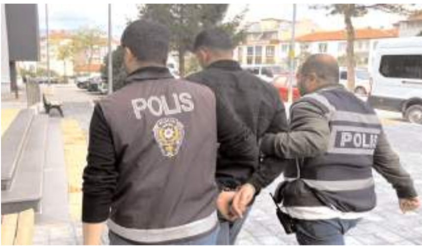
Emniyetteki işlemlerinin ardından Sungurlu Adliyesi'ne sevk edilen şüpheli tutuklandı.