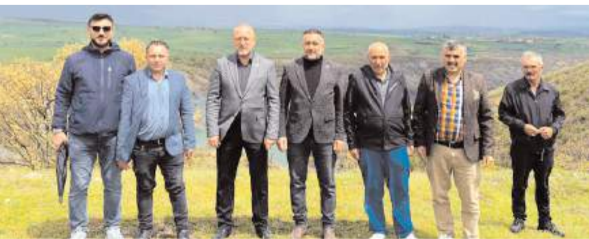
Yeniden Refah Partisi Çorum teşkilatı, köy halkının sorun ve taleplerini dinledi.

nin güvenlik kamerasınca kaydedildi.(AA)