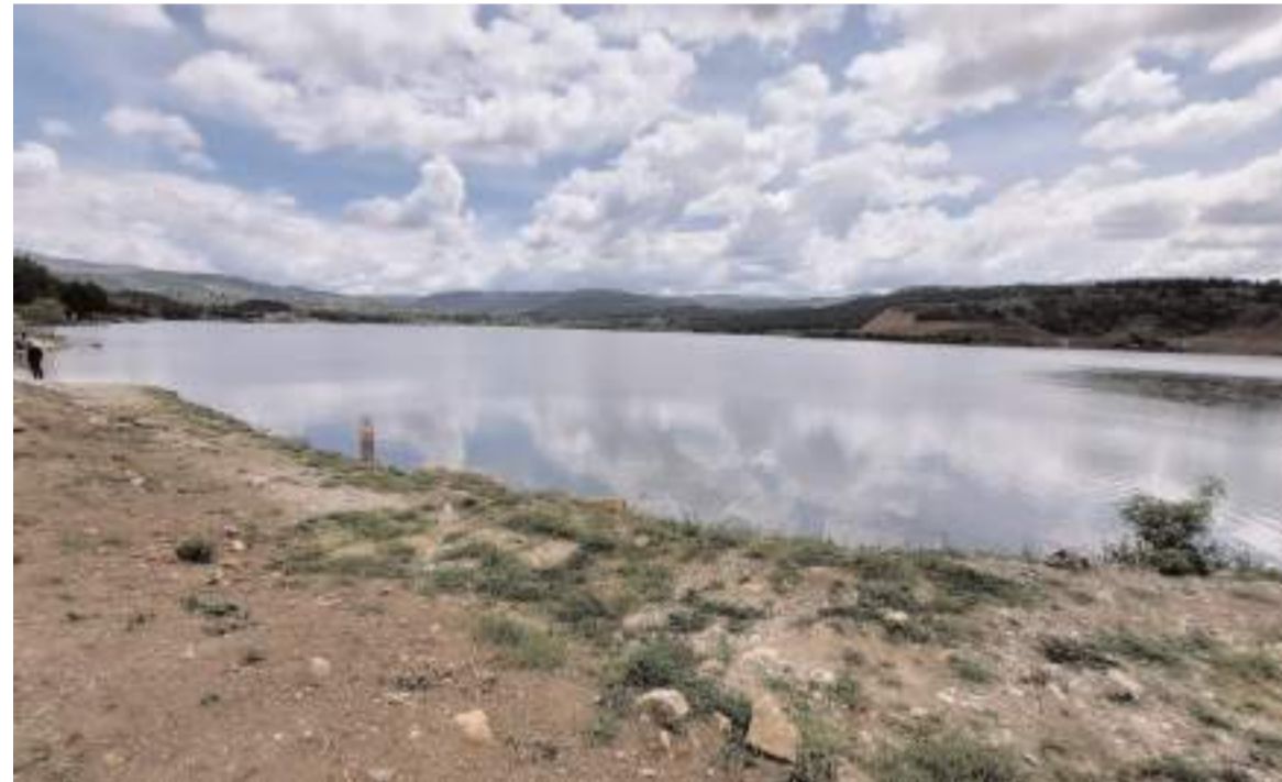
Havaların yağışlı geçmesi nedeniyle barajda su seviyesi hızla artıyor.