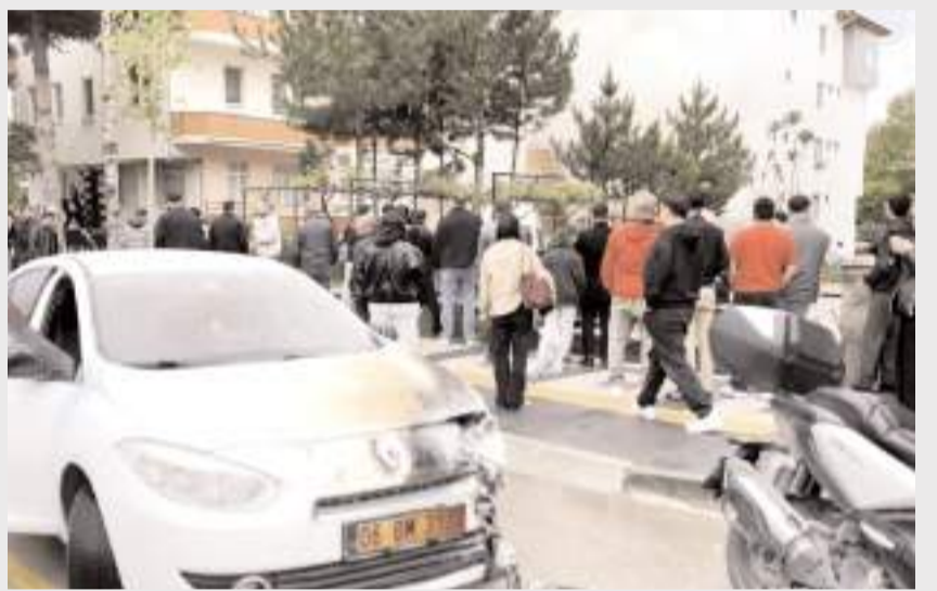
Olayda bir otomobil ile miniüste hasar meydana geldi.

İhbar üzerine olay yerine polis, itfaiye ve sağlık ekip-