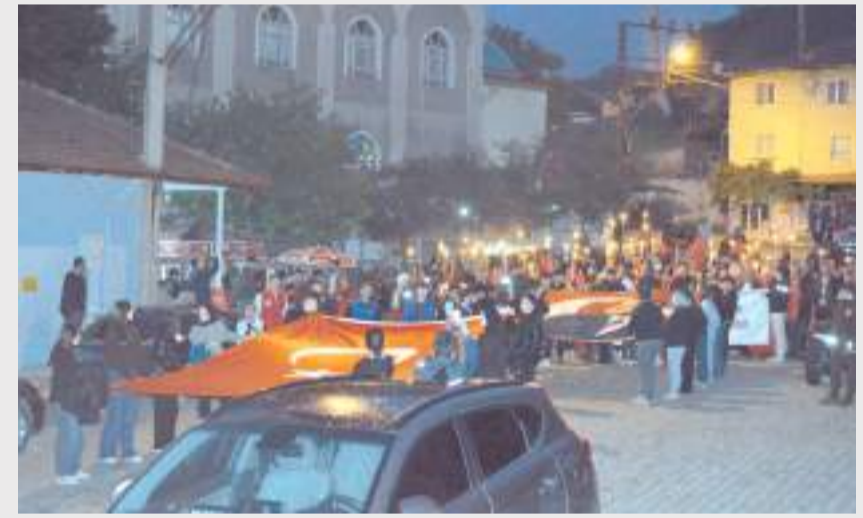
Yürüyüşe katılım yüksek oldu.