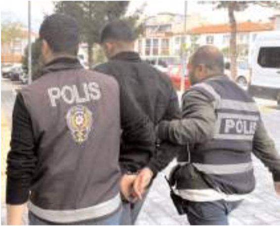
Emniyetteki işlemlerin ardından Sungurlu Adliyesi'ne sevk edilen şüpheli tutuklandı.