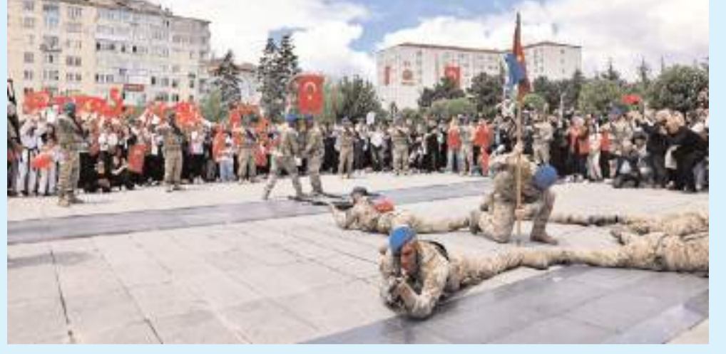
Komandoların gösterisi bol bol alkış aldı.

■ 19 Mayıs Atatürk'ü Anma, Gençlik ve Spor Bayramı'nın 107. yılı nedeniyle Kadeş Barış Meydanı'nda düzenlenen gençlik şenliğinde coşku dolu anlar yaşandı. * HABERİ'4'TE