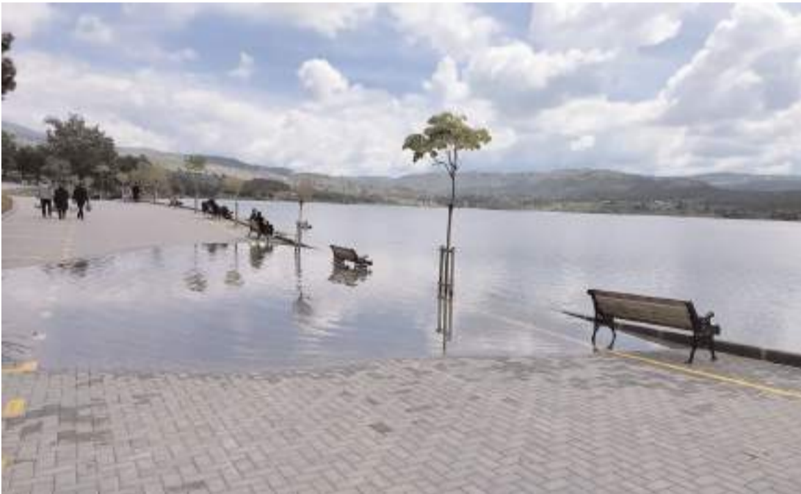
Barajda su seviyesi piknik alanlarına ulaştı.