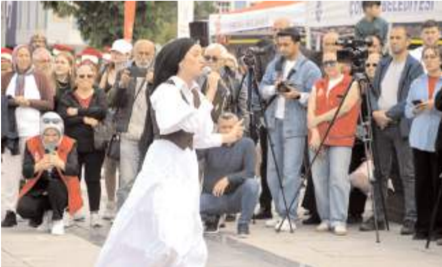
'Milli Mücadele' adlı Oratoryo gösterisi sahnelendi.