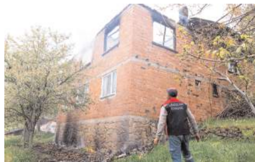
Yangında maddi hasar meydana geldi.

Oğuzlar Belediyesi itfaiye ekiplerince söndürülen yangında ev kullanılamaz hale geldi.(AA)