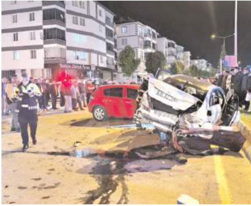
Kazada her iki araçta da maddi hasar meydana geldi.

Çorum'da iki otomobilin çarpıştığı trafik kazasında 3 kişi yaralandı.