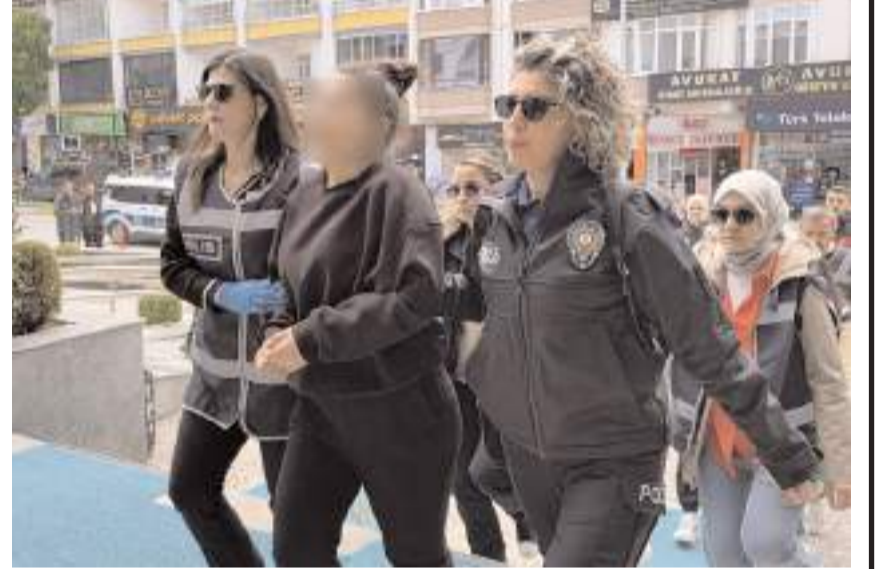
Gözaltına alınan şüpheliler adliyeye çıkartıldı.