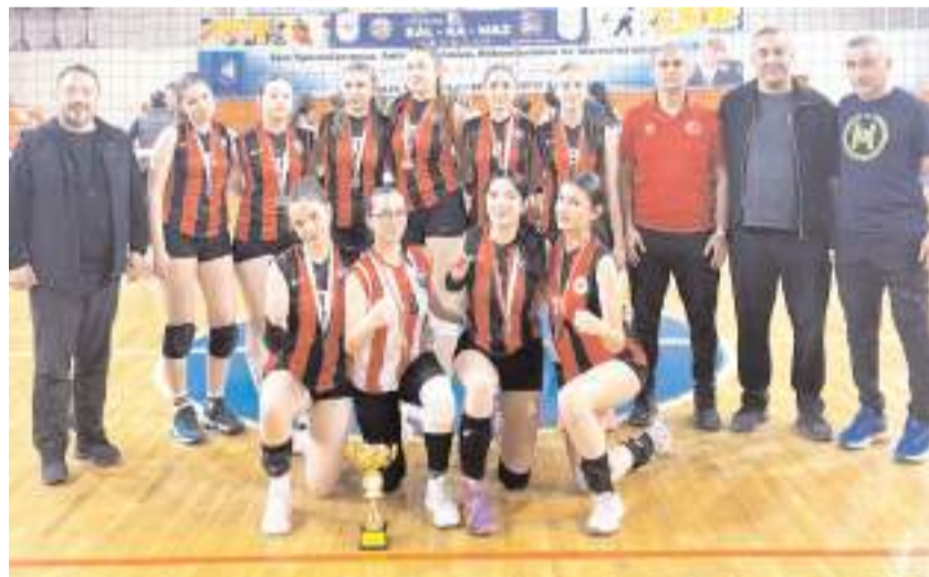
İkinci olan Çorum Voleybol 1 takımı kupa töreninin ardından toplu halde görülüyor