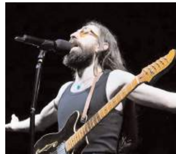
Şarkıcı Emre Fel konserde birbirinden güzel eserleri seslendirdi.