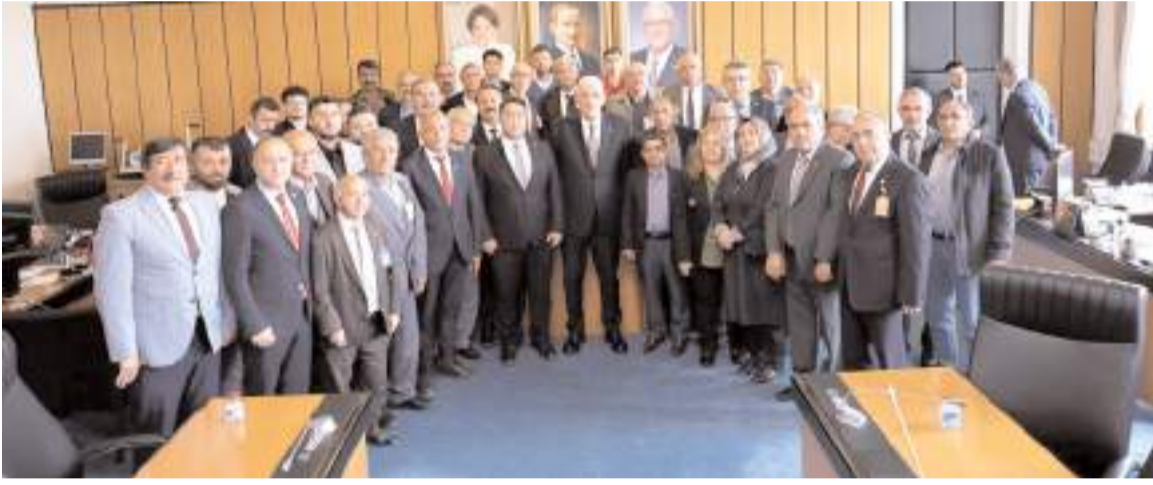
Toplantının ardından toplu hatıra fotoğrafı çekildi.