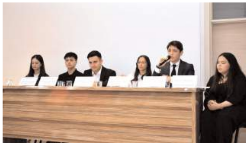
Panel Özejder Sosyal Bilimler Lisesi Konferans Salonunda yapıldı.

Sunumlarında, Oğuz Kağan Destanı ile Ergenekon Destanı gibi kültürel miras ele alındı. (AA)