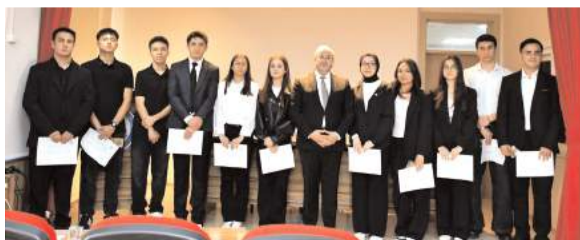
Panel konuşmacı olarak Özejder Sosyal Bilimler Lisesi ve fen lisesi öğrencileri katıldı.