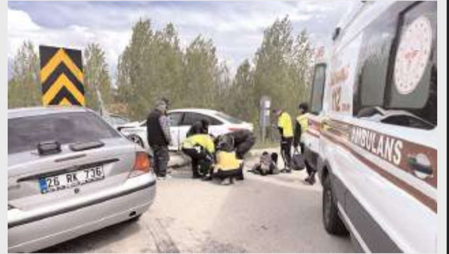
Yaralılara ilk müdahaleyi olay yerinde 112 acil sağlık ekipleri yaptı.

Yaralılar, sağlık ekiplerince yapılan müdahalenin ardından ambulansla Alaca Devlet Hastanesi'ne kaldırıldı.(AA)