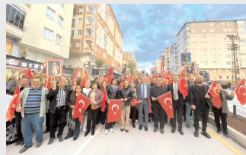
Bahabey Caddesi İpek Taksi kavşağından başlayan yürüyüş, Atatürk Anıtı'na kadar devam etti.