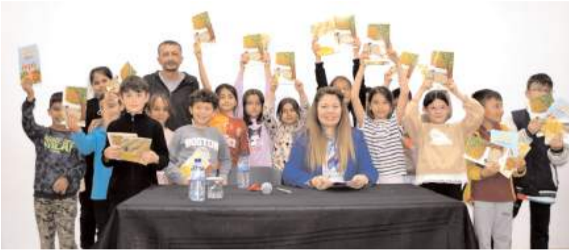
Yazar ile öğrenciler hatıra fotoğrafı çekindi.