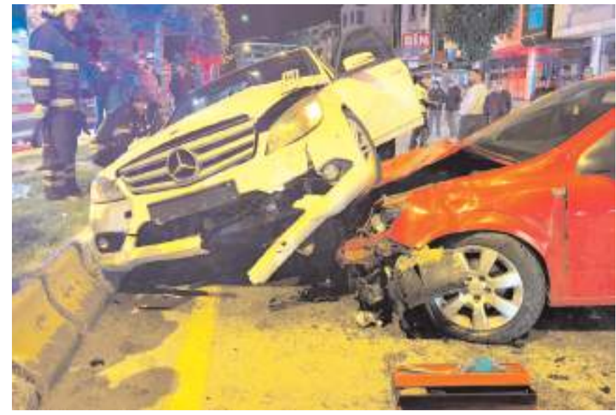
Kaza Dr. Sadık Ahmet Caddesi'nde meydana geldi.

Kaza nedeniyle bir süre tek yönlü trafiğe kapanan yol, araçların çekici yardımıyla kaldırılmasının ardından yeniden ulaşıma açıldı.(AA)