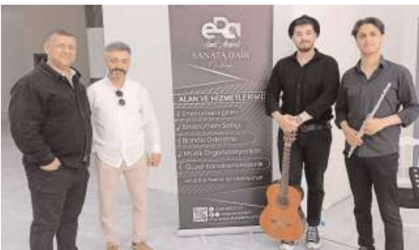
Era Sanat Akademi Trio Ekibi, etkinlikte müzik dinletisi gerçekleştirdi.