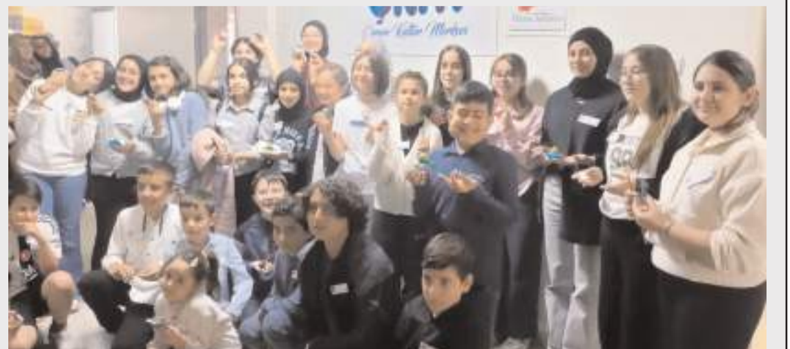
Programın sonunda öğrenciler hatıra fotoğrafı çekindiler.