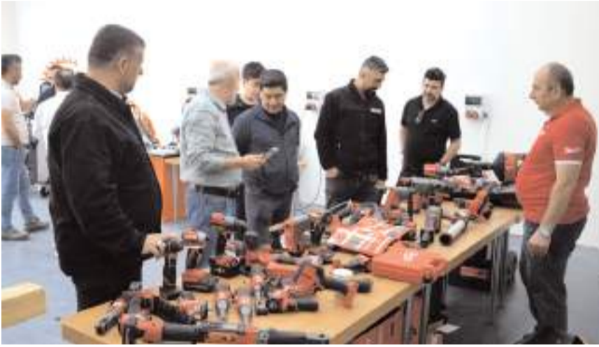
Merkezde özellikle 18-36 yaş aralığındaki gençlere eğitim verilecek.