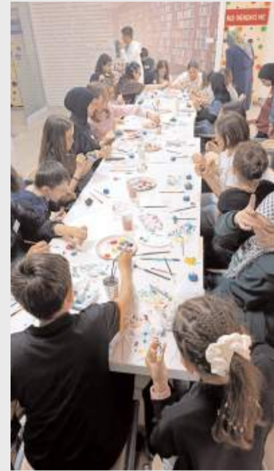
Öğrenciler dijital ortamda modelledikleri ürünleri 3D yazıcıda çıkartarak boyadılar.