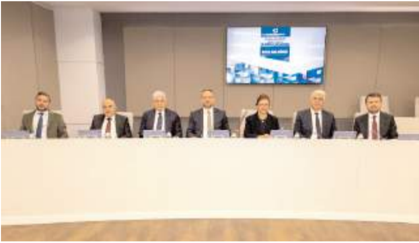
Basın İlan Kurumu 33. Dönem 7. Genel Kurul Toplantısı başladı.

Genel Müdür Çay, bu kapsamdaki bir diğer önemli çalışmanın da "genç iletişimcilerin mesleki gelişimlerine katkı sunma ve sektöre daha donanımlı bireyler kazandırma" hedefi doğrultusunda iletişim fakültesi öğrencilerine yönelik başlatılan staj programı olduğunu hatırlatarak, "Türkiye'nin dört bir yanından 150'ye yakın öğrencimizin başvurusunu aldık. Genel Müdürlük ve 16 Bölge Müdürlüğümüzün dâhil edildiği programla genç meslektaşlarımızı medya mevzuatını, resmi ilan sisteminin işleyişini ve kamusal yayıncılık bilincini yerinde tecrübe edebilecekleri bir zemin hazırladık" ifadelerini kullandı.