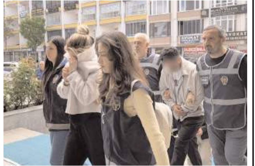
Gözaltına alınan 10 şüpheliden 3 tutuklandı.