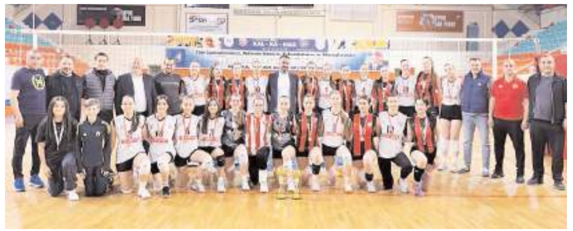
Gençlik Kupası voleybol turnuvasında dereceye giren takımlar ödül töreni sonrasında toplu halde görülüyor