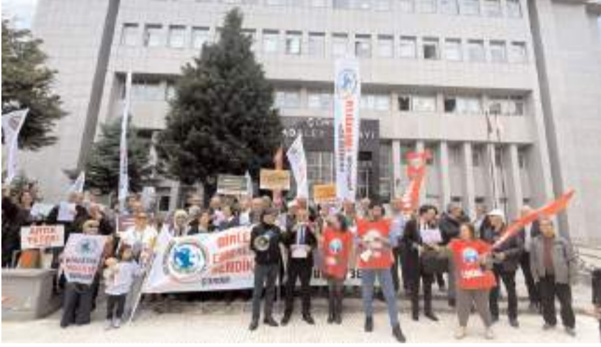
Basın açıklaması Adliye önünde yapıldı.