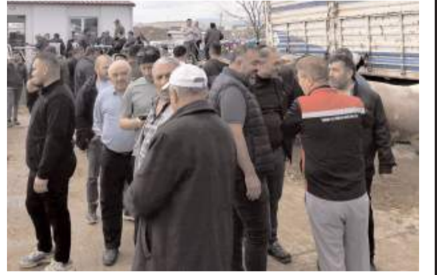
Teknik personeller tarafından ilçe hayvan pazarında denetim ve incelemelerde bulunuldu.