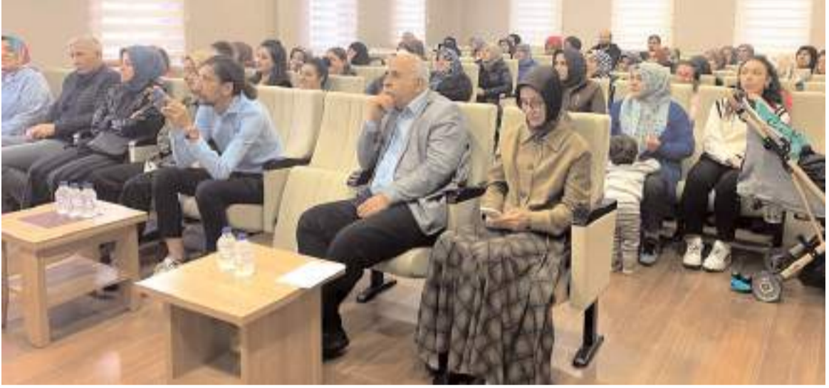
Konferansa ilgi yüksek oldu.