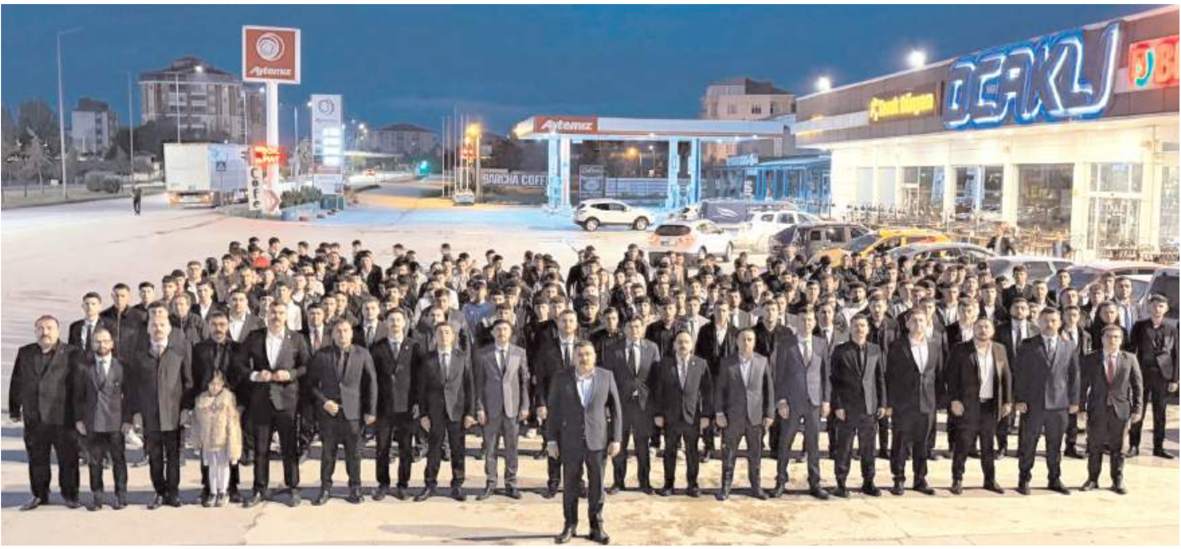
"İstiklalın Işığında Türk Gençliği Büyük Kurultayı"na Ülkü Ocakları yüksek katılım sağladı.