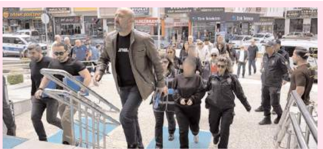
Operasyonda 10 şüpheli gözaltına alındı.

Basın İlan Kurumu 33. Dönem 7. Genel Kurul Toplantısının açılışında konuşan Basın İlan Kurumu Genel Müdürü Abdulkadir Çay, "Türk basınının sesine kulak veren ve yapıcı çözümler üretmeye odaklanan kurumsal duruşumuzu, yaptığımız buluşmalarda bir kez daha vurgulamış olduk" dedi. * HABERİ8'DE