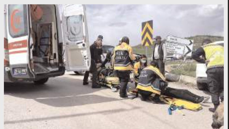
Yaralılar hastanede tedavi altına alındı.