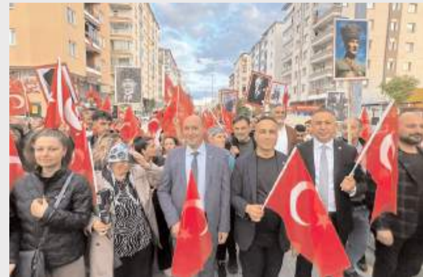
Yürüyüş CHP İl ve Merkez İlçe Gençlik Kolları tarafından organize edildi.