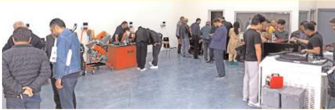
Çorum Organize Sürekli Eğitim Merkezi kapılarını açtı.