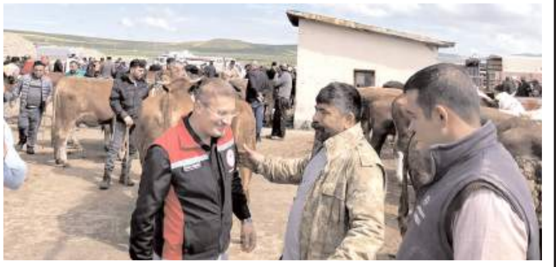
Ekipler Sungurlu Hayvan Pazarında denetim yaptı.