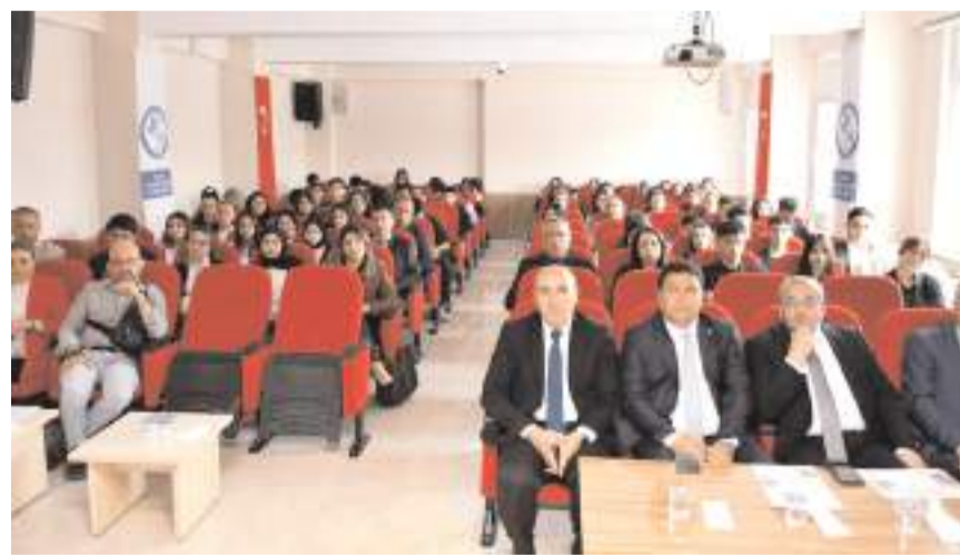
Paneli öğrenciler ilgiyle dinledi.