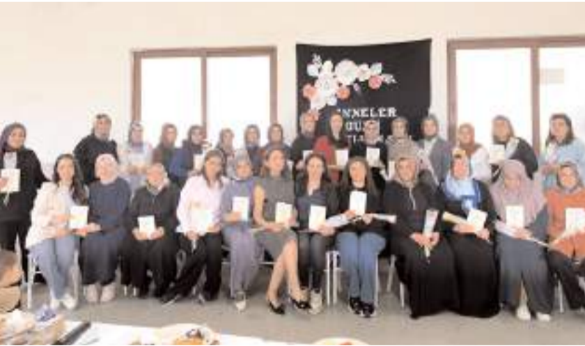
Anneler kitap okuma ve değerlendirme etkinliğinde bir araya geldi.