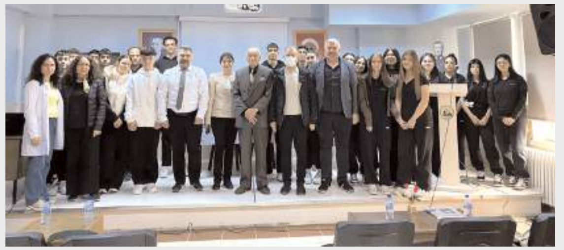
Program Bilge Kağan Mesleki ve Teknik Anadolu Lisesi'nde yapıldı.