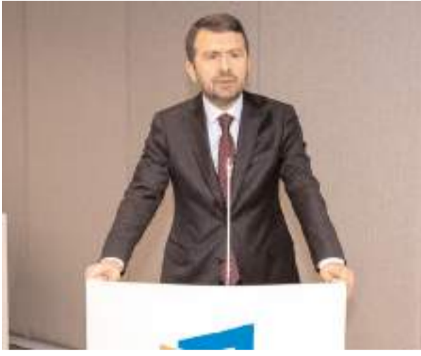
Basın İlan Kurumu Genel Müdürü Abdulkadir Çay

Eskişehir, Tekirdağ ve Konya'da düzenlenen bölgesel basın buluşmalarında 10 farklı şehirden 98 gazete ve internet haber sitesinin temsilcisiyle bire bir görüşme fırsatı bulduğunu aktaran Genel Müdür Çay, "Bu istişare toplantıları sayesinde yerel basının çözüm