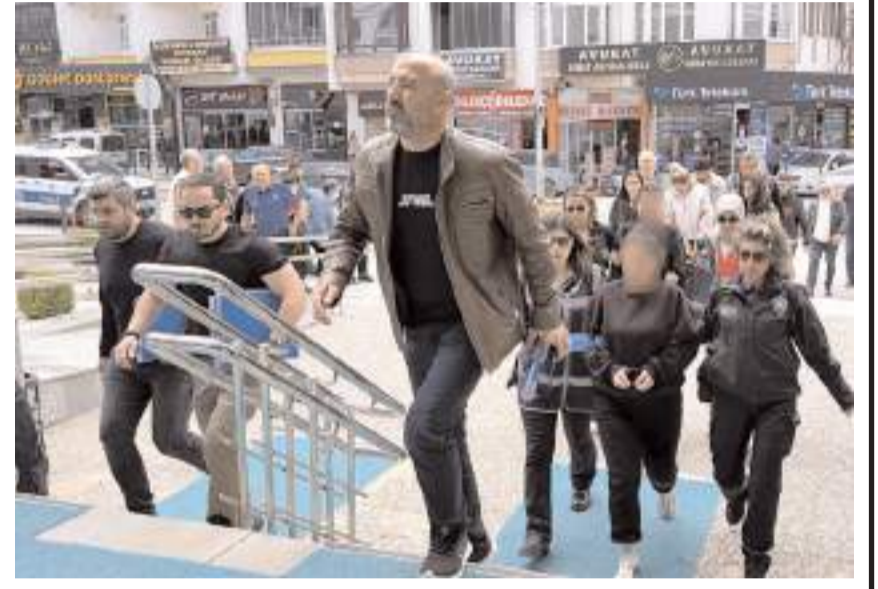
Operasyonda 10 şüpheli gözaltına alındı.