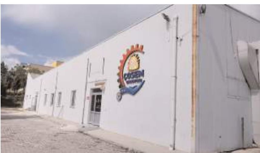
Merkez, uzun yıllar atıl durumda bulunan bir binada kuruldu.