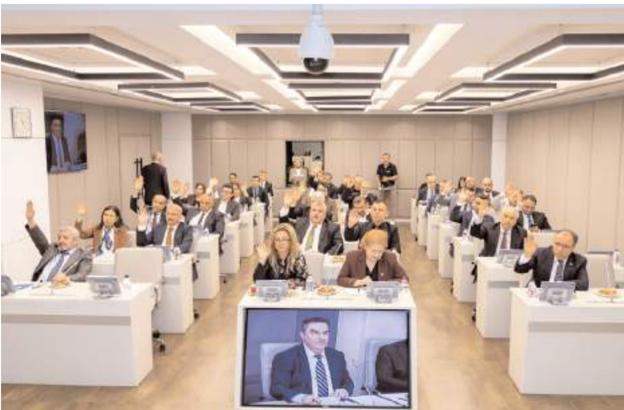
Toplantının bugün gerçekleştirilecek son oturumunda, komisyonların görüşleri doğrultusunda sunulan teklifler karara bağlanacak.

Genel Müdür Çay'ın konuşmasının ardından Başkanlık Divanı seçimi yapılarak yoklama alındı ve Genel Kurul Gündemi belirlendi. Yönetim Kurulu Durum Raporu ve Denetçiler Raporları okunduktan sonra Yönetim Kurulu'nun tekliflerine ilişkin sunum yapıldı. Akabinde ise üyeleri belirlenen İlan İşleri, Hukuk İşleri ve Mali İşler Komisyonları çalışmalarına başladı. Basın İlan Kurumu 33. Dönem 7. Genel Kurulu'nun 22 Mayıs 2026 Cuma günü gerçekleştirilecek son oturumunda, komisyonların görüşleri doğrultusunda sunulan teklifler karara bağlanacak. (Haber Merkezi)