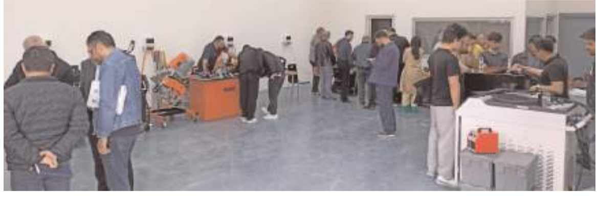
Çorum Organize Sürekli Eğitim Merkezi kapılarını açtı.

"Kaynak Teknoloji Çalıştayı Tanıtım Etkinliği" adı altında düzenlenen programda kaynak teknolojilerine yönelik tanıtımlar gerçekleştirilirken, etkinliğe 10 firma katılım sağlandı.