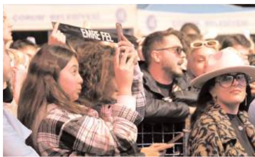
Müzikseverler, şarkılara eşlik ederek eğlenceli anlar yaşadı.