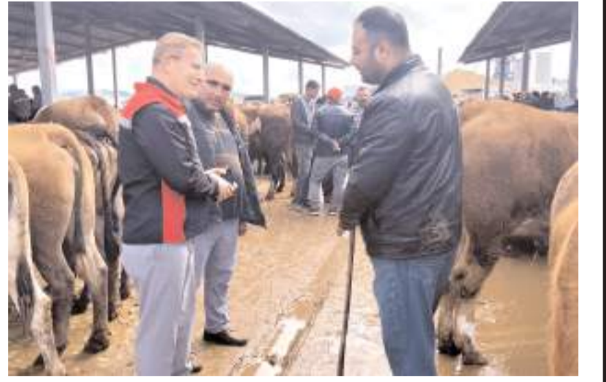
Hayvanların küpe ve kayıt durumları, veteriner sağlık raporları ile hayvan sağlığı ve refahına yönelik hususlar kontrol edildi.

Ayrıca yetiştiricilerimiz ve vatandaşlarımızın sağlıklı ve güvenilir kurbanlık hayvanlara ulaşabilmesi amacıyla yürütülen çalışmalar kapsamında bilgilendirme