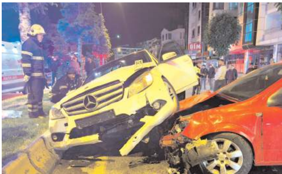
Kaza Dr. Sadık Ahmet Caddesi'nde meydana geldi.